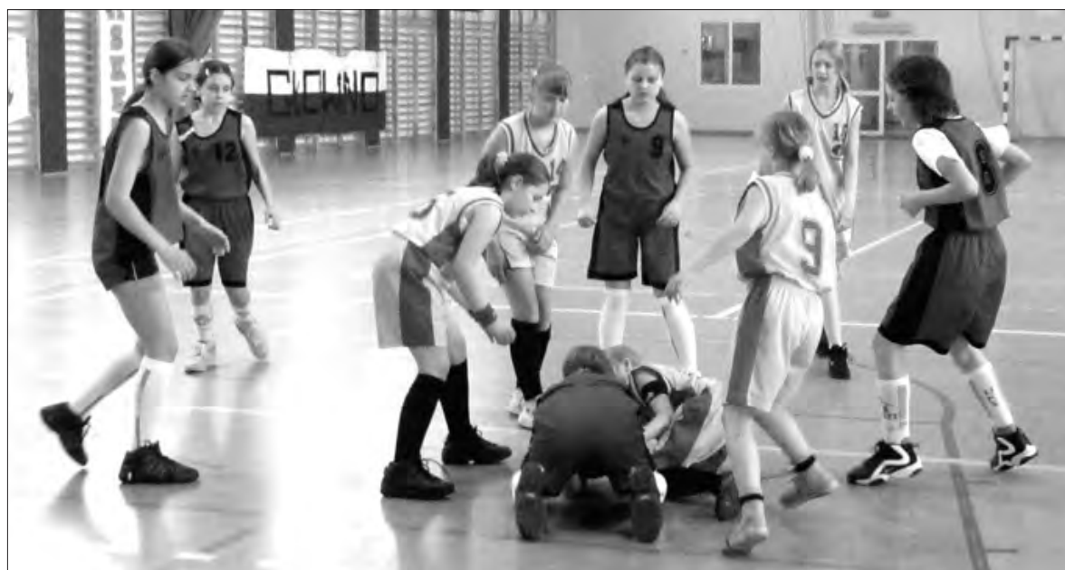
Łowiczanki ostatecznie zajęły siódme miejsce w lidze żaczek U-12.

Koszykówka - finały wojewódzkiej ligi żaczek U-12