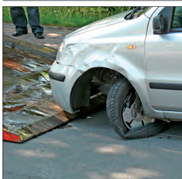
Fiat Panda bardziej ucierpiał w kolizji.