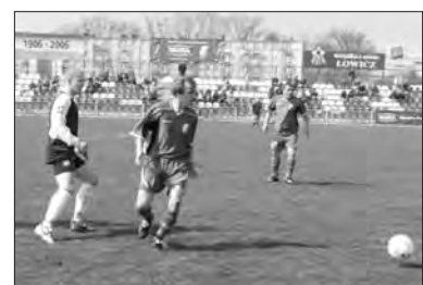
Pelikan II tym razem zdobył 1 punkt.

Zduny, 10 maja. Biednemu wiatr w oczy... Nie dość, że tuż po rozpoczę-