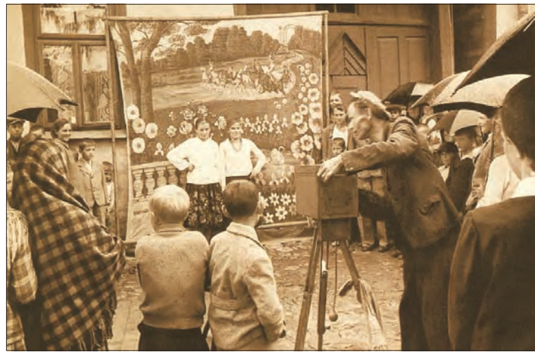
Łowicz - odpust w latach osiemdziesiątych.

Technika wykonania przedmiotów była wielokrotnie toporna, niechlujna, często były to niezgrabne kopie dzieł sztuki i motywów wywodzących się z kultury wysokiej. Odpustowe wyroby określano mianem kiczu, przyklepiono im piętnującą łątkę tandety. Właśnie dlatego zbiory muzeów w całej Polsce posiadają niewielką liczbę gipsów i bibelotów wywodzących się ze świata odpustów.