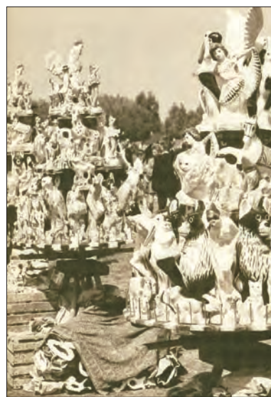
Łowickie lata sześćdziesiąte.

naicznej, umykające konwencji stylistycznej. Poetyka makatek odnosiła się do baśniowych światów, oscylowała wokół „szlachetnych” tematów. Na płótnie lub długich prostokątnych pasach papieru malowano kwiaty w bukietach, królewskie zwierzęta: jelenie i pawie, dworskie sceny, damy w łodziach zaprzęzonych w łabędzie, nocne pejzaże z tarczą księżycą.