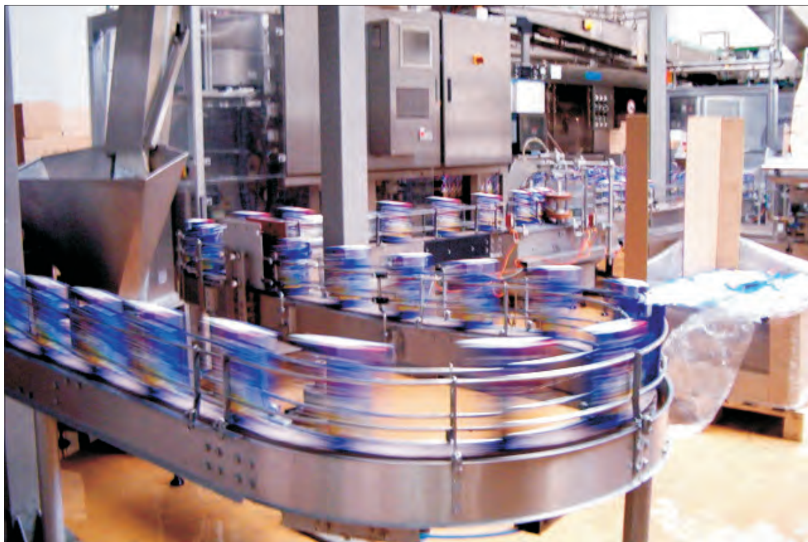
OSM Łowicz to jedyna firma z listy 500 największych w Polsce, która swą siedzibę ma w Łowiczu i tu, płaci wszystkie podatki.

Wracając do firm mleczarskich warto zauważyć, że np. w Rzeczypospolitej na miejscu 177. jest Danone, uzyskując 1 mld 564 mln zł, jednak jest to wartość sprzedaży nie tylko produktów mlecznych, ale też wody mineralnej czy wyrobów ciastkarskich.