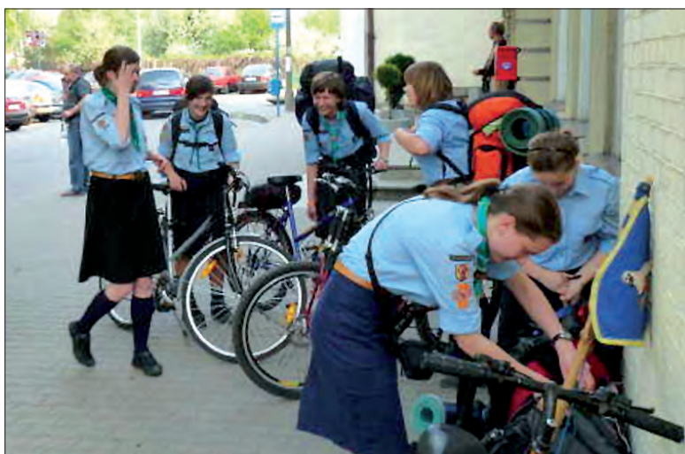
Tak „Foka” wyruszyła 30 kwietnia na wyprawę.

Po obiedzie odbyły się zajęcia rozwijające ekspresję oraz warsztaty techniczne. Budowano na nich makietę obozowiska, co pozwala rozplanować i dopracować w najdrobniejszych szczegółach późniejszą pionierkę obozową. Po mszy św. i kolacji zastępy przygotowały ognisko. Czym jest