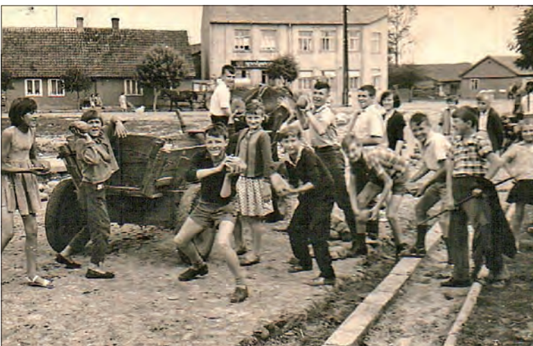
Starsi pamiętają... Czyny społeczne w PRL nie uczyły tego, czym może być dobrowolna praca na rzecz innych - bo były przymusowe. raczej stanowiły okazję do wyglupów.

Powiecie: ee... marketing personalny, facet po prostu dba o swój wizerunek i ceni sobie miano społecznika. Ja powiem: nie! Mylicie się! Przynajmniej w większości przypadków, tutaj w Stanach Zjednoczonych, taka ocena byłaby krzywdząca. On idzie tam, bo czuje taką potrzebę, jest wewnętrznie zobowiązany do zwrócenia tego co dostał w swojej, prywatnej wersji amerykańskiego snu, czuje, że to jest coś, co powinien zrobić. Znowu usłyszę od was: to ty się mylisz, to właśnie takich ludzi jest tylko garstka. A ja znowu zripostuję: nie, nie tutaj, w Stanach. Cynceron napisał: „Przyzwyczajenie jest drugą naturą”, a nasze przysłowie brzmi: „Czym skorupka za młodu nasiąknie, tym na starość trąci”. I rzeczywiście, nasz biznesmen zrobi to wszystko, bo będąc dzieckiem, został tak nauczony - w domu, w szkole, w kościele.