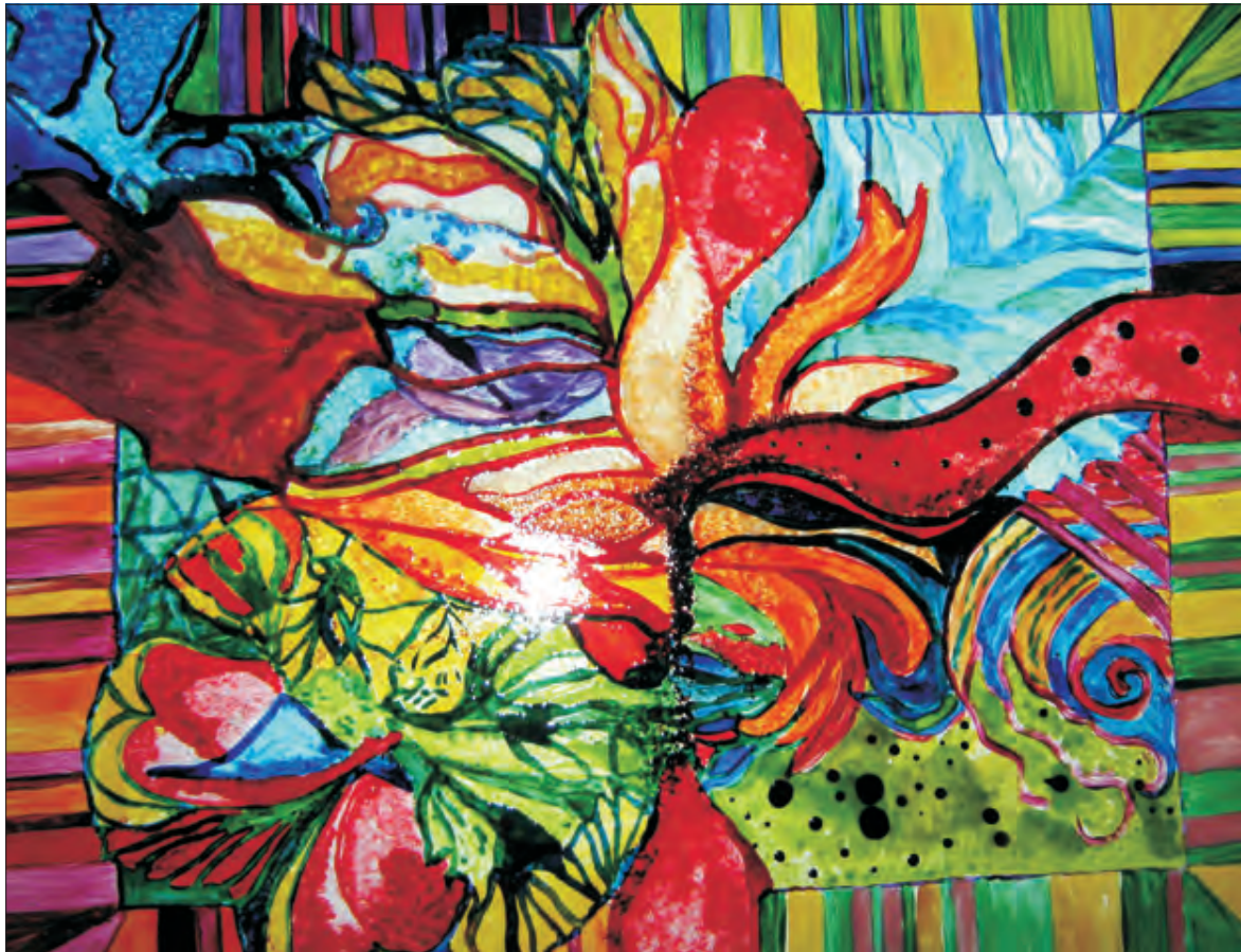
Kolorowe motywy na szkle, czyli alternatywa Doroty Kosińskiej.

Do najpopularniejszych wyrobów zamawianych u łowickich wytwórców należą chusty, paski, szale, a także dodatki, np. bransoletki na rękę czy broszki. Męskim hitem są natomiast krawaty z charakterystycznym kwiatowym wzorem.