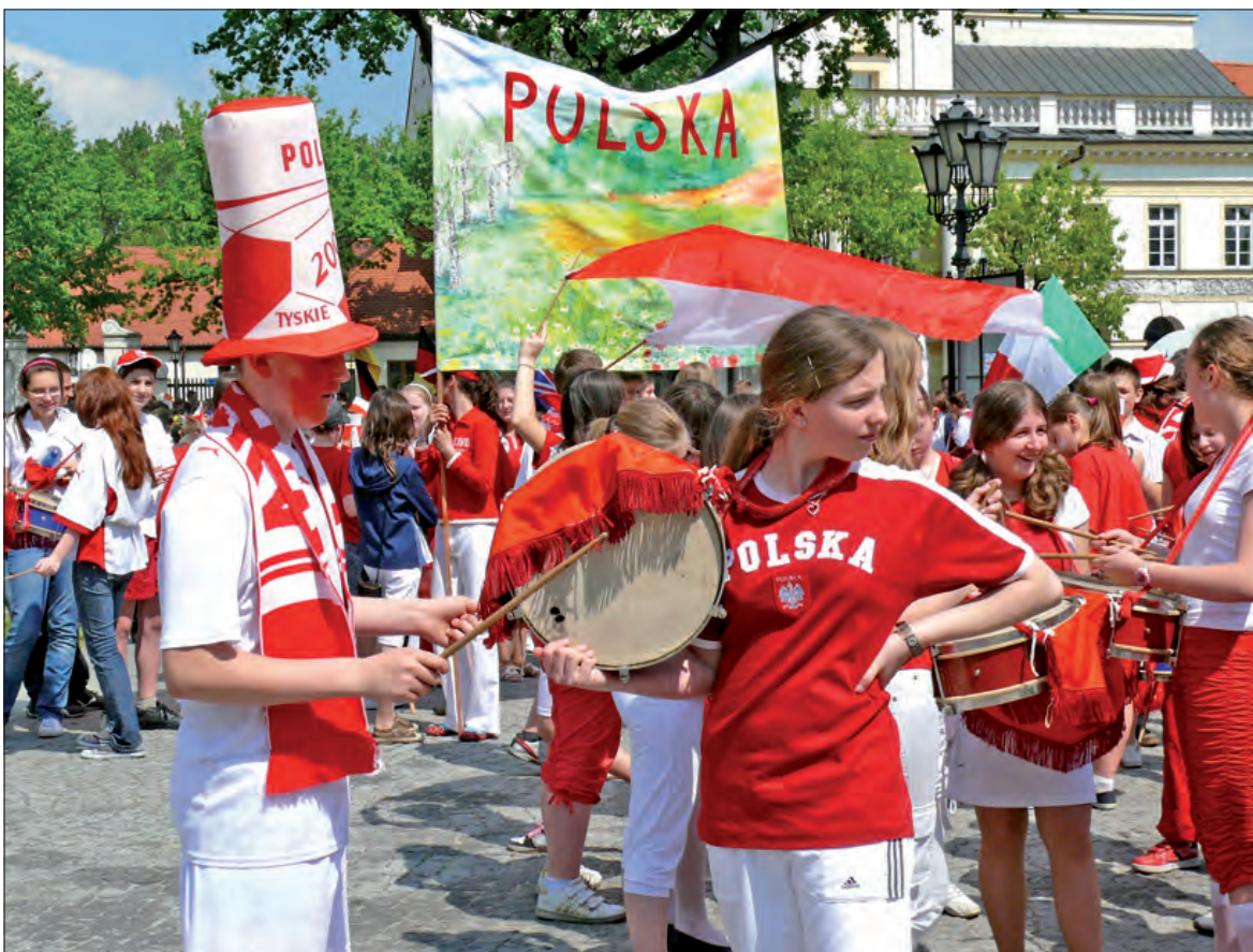
Przemarsz dzieci i młodzieży z łowickich szkół podstawowych i gimnazjów odbył się w ostatni piątek, 8 maja z okazji Dnia Europejskiego. Korowód ze Starego na Nowy Rynek poprowadzili uczniowie Szkoły Podstawowej Nr 1, którzy reprezentowali Polskę. Więcej na stronie 3.