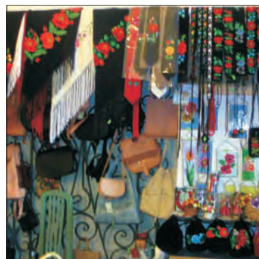
Chusty, krawaty i paski, czyli najpopularniejsze produkty z „Cepelii”.