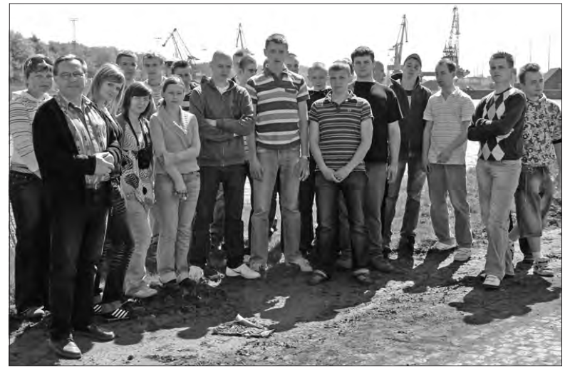
Uczniowie z Bolimowa przy porcie rzeczonym w Gliwicach.

Po interesującym wykładzie uczestnicy wycieczki pojechali do kopalni soli w Boch-