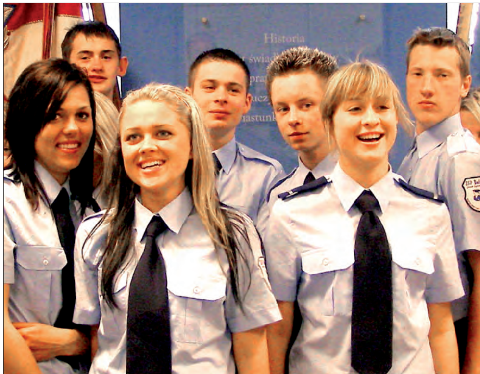
Kadeci zachwycili się warunkami nauki w szkole policyjnej.

Głównym celem wizyty w Komendzie Wojewódzkiej Policji w Łodzi było zapoznanie przyszłych pracowników policji z zakresem zadań laboratorium kryminalistycznego, a w szczególności z pracownią osmotyczną, balistyczną i zabezpieczenia śladów wypadków drogowych. Osmologia jest to jedna z najmłodszych dziedzin kryminalistyki, która wykorzystuje specjalnie wytresowane psy do identyfikacji osób na podstawie śladów zapachowych, pozostawionych na różnych podłożach i przedmiotach. Balistyka kryminalistyczna zajmuje się identyfikacją broni palnej i pocisków. Za jej pośrednictwem policjanci badają między innymi, czy postrzelenie jest bezpośrednie, czy też z rykoszetu - szuka się tu przede wszystkim dodatkowych przestrzelin, ustala pozycję strzelającego i ofiary w chwili strzału. Kadetów cze-