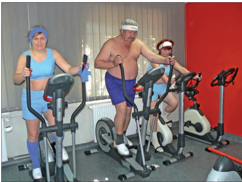
Po wyjściu z kriokomory konieczna jest rozgrzewka na siłowni. Trwa ona około 10-15 minut.

względem na działanie stymulacyjne, nie jest wskazana osobom z nadciśnieniem, nadczynnością tarczycy, chorobami nowotworowymi. Korzystanie z kriokomory składa się z dwóch etapów. Pierwszy - to przebywanie w komorze, w temperaturze -110 st. C przez 1-3 minuty. Drugi - to rozgrzewka na siłowni, która trwa około 15-20 minut.