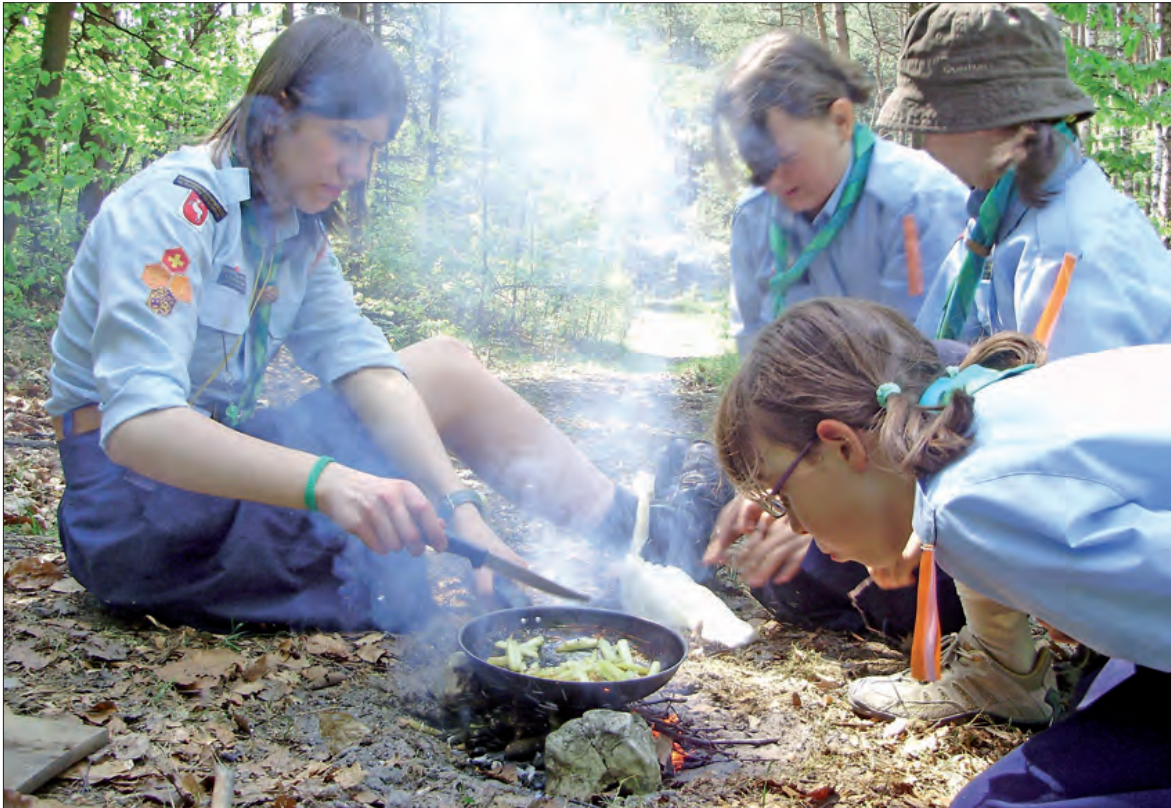
Małe ognisko wystarczy, by przygotować obiad dla zastępu.