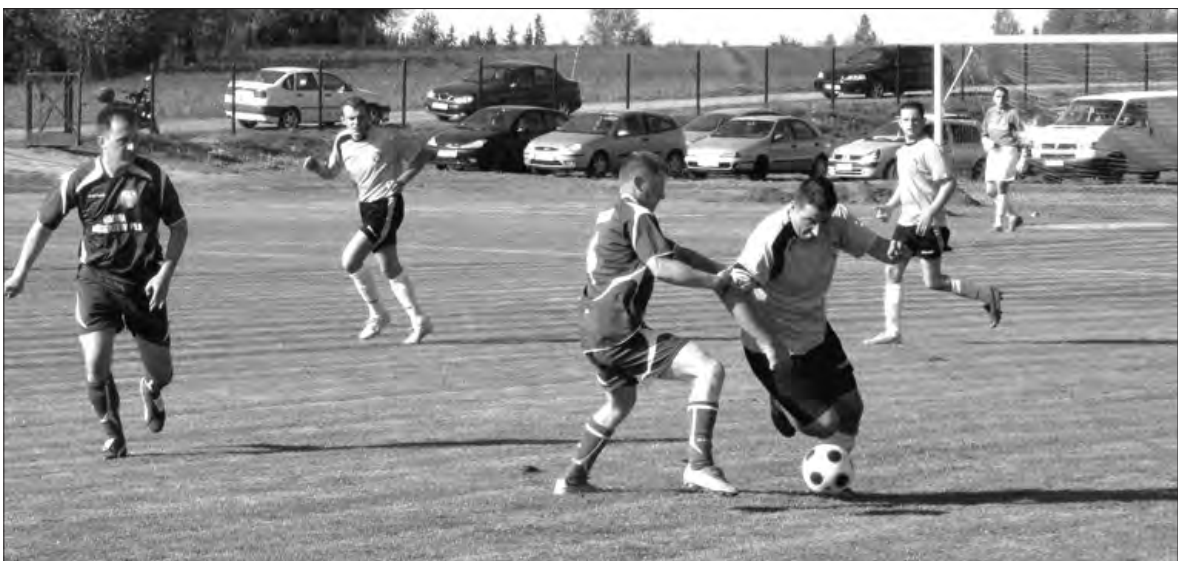
Najwyższe zwycięstwo w 19. kolejce odnieśli gracze Korony Wejście, którzy pokonali Manchatan aż 7:3

Piłka nożna - 19. kolejka skierniewickiej klasy A