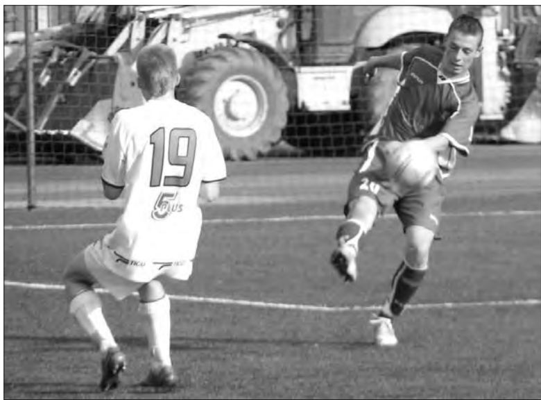
W meczu z GKS Belchatów łowiczanie stracili trzy gole...