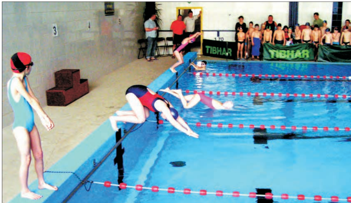
Jedna młoda zawodniczka troszkę się zagapiła...