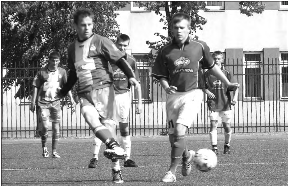
Nie był to zbyt dobry tydzień dla naszych juniorów w lidze wojewódzkiej...