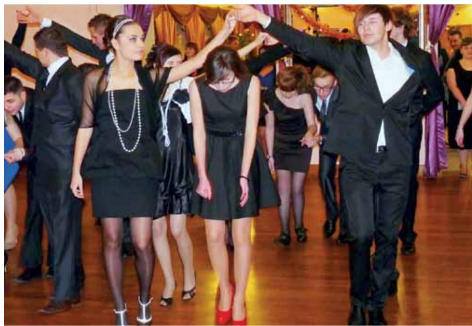
Polonez w wykonaniu uczniów z klasy III A II Liceum Ogólnokształcącego im. M. Kopernika.