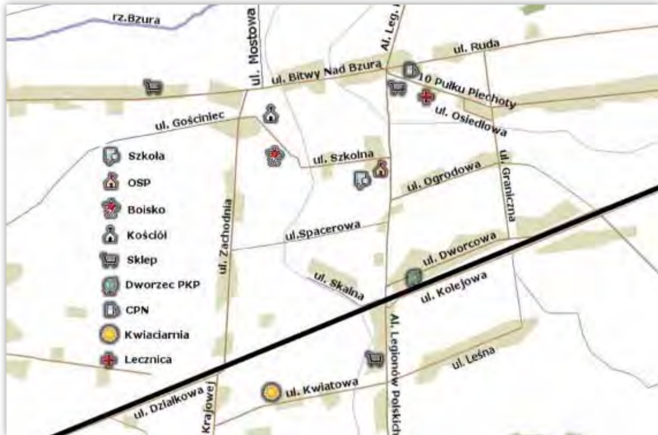
Tak już w marcu będzie wyglądał układ ulic w Bednarach.

Inicjatywę zmiany nazwy miejscowości oraz nadania nazw ulic wysunęli sami mieszkańcy Bednar w ramach zawiązanego przez nich Stowarzyszenia Rozwoju Bednar i Okolic. W obu tych sprawach przeprowadzono w miejscowości konsultacje społeczne z niemal wszystkimi mieszkańcami. O nazwach ulic decydowali mieszkańcy, którzy swoje posesje mają przy drogach, które nie miały nazw. Drog tych jest w Bednarach sporo, bo miejscowość jest mocno rozrzucona