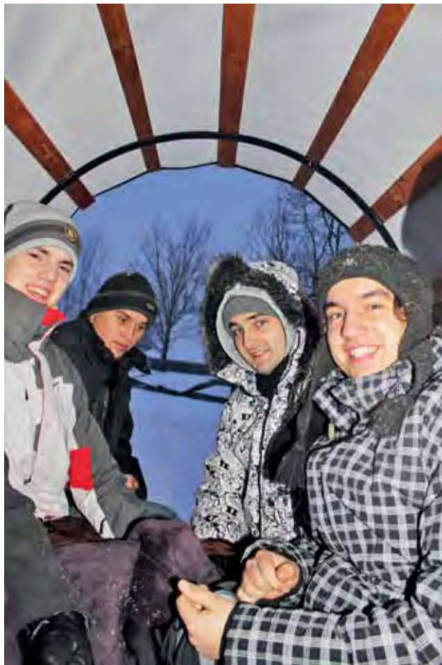
Członkowie zespołu Kalina podczas kuligu.

Nie zapomnieli także o krzewieniu kultury łowickiej. Wyjeżdżając, zabrali ze sobą stroje, a w pensjonacie, w którym przebywali, dali popisowy koncert. Zaspiewali ludowe przyspiewki i zatańczyli dla innych pensjonariuszy i zaproszonych górali z okolicznych miejscowości.