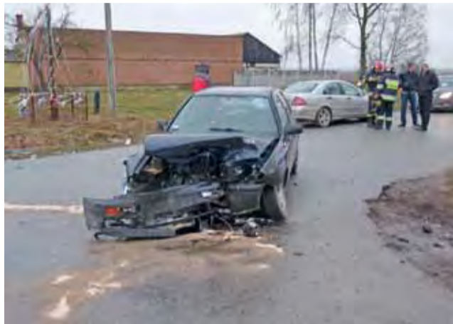
Winę ponosi kierowca widocznego tu VW Golfa. W tle samochód drugiego uczestnika kolidacji.

Kobieta jechała w kierunku Łyszkowic, a mężczyzna wyjechał z drogi od strony Bobiec-ka. Mężczyźni nie się nie stało, a kobieta trafiła do łowickiego