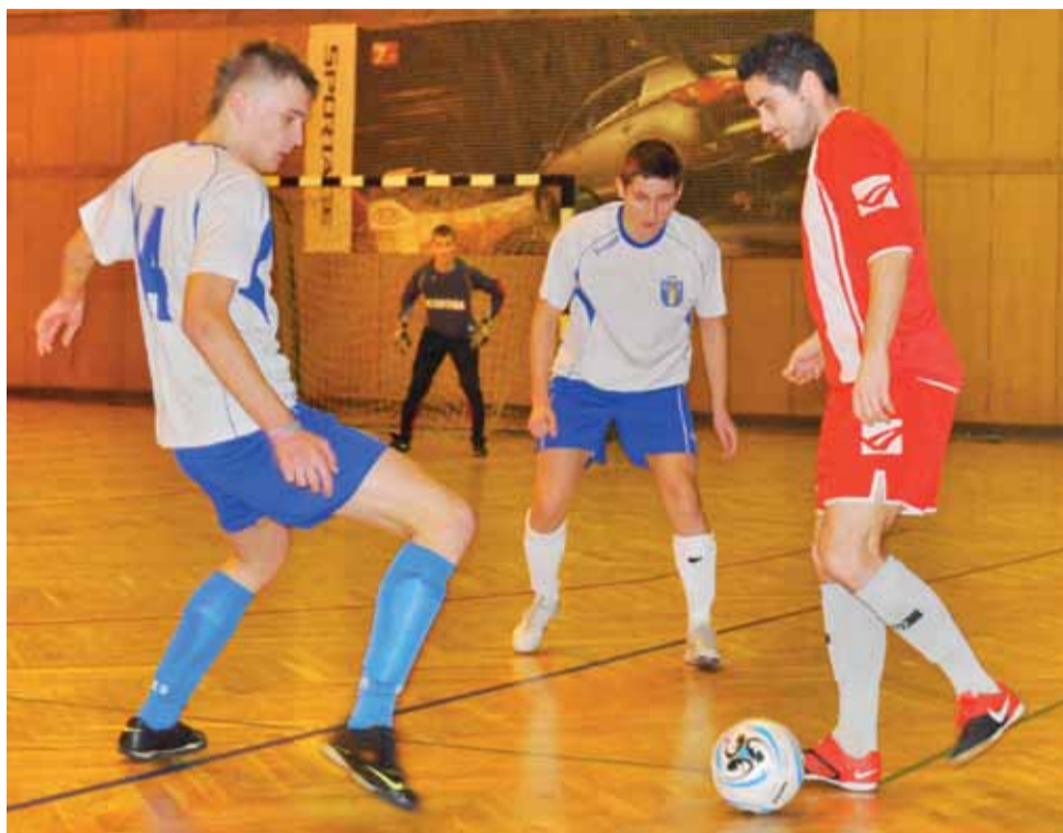
Korona Wejsce walczy do końca, ale już raczej nie zdoła uratować się przed spadkiem z I ligi.