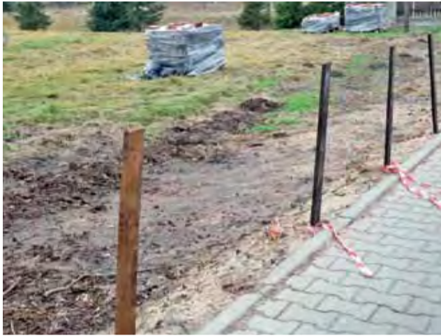
Stary parkan już nie grozi przewróceniem. Nowy ma zostać postawiony po zimie.

Będzie się składało z betonowych słupków połączonych stalowymi elementami. – Jesteśmy już wstępnie umówieni z murarzem i mamy zakupioną część stalowych elementów, ale ostatecznego kosztorysu tych prac jeszcze nie znamy – dodaje proboszcz Stokłosa. W ramach wymiany muru naprawiony zostanie także jeden słupek ogrodzenia przy kościele, który został rozebrany wraz z metalowymi elementami, gdy kilka miesięcy temu przez uderzył samochód.