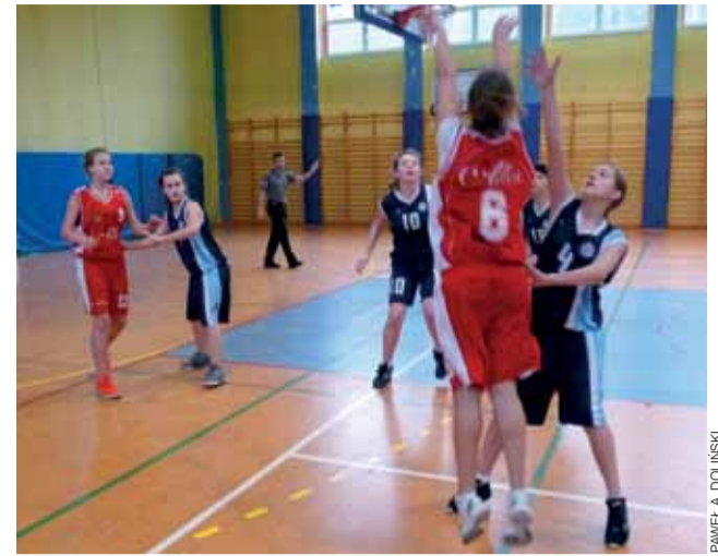
W Głownie kadetki Księżaka wygrały po raz czwarty w sezonie.