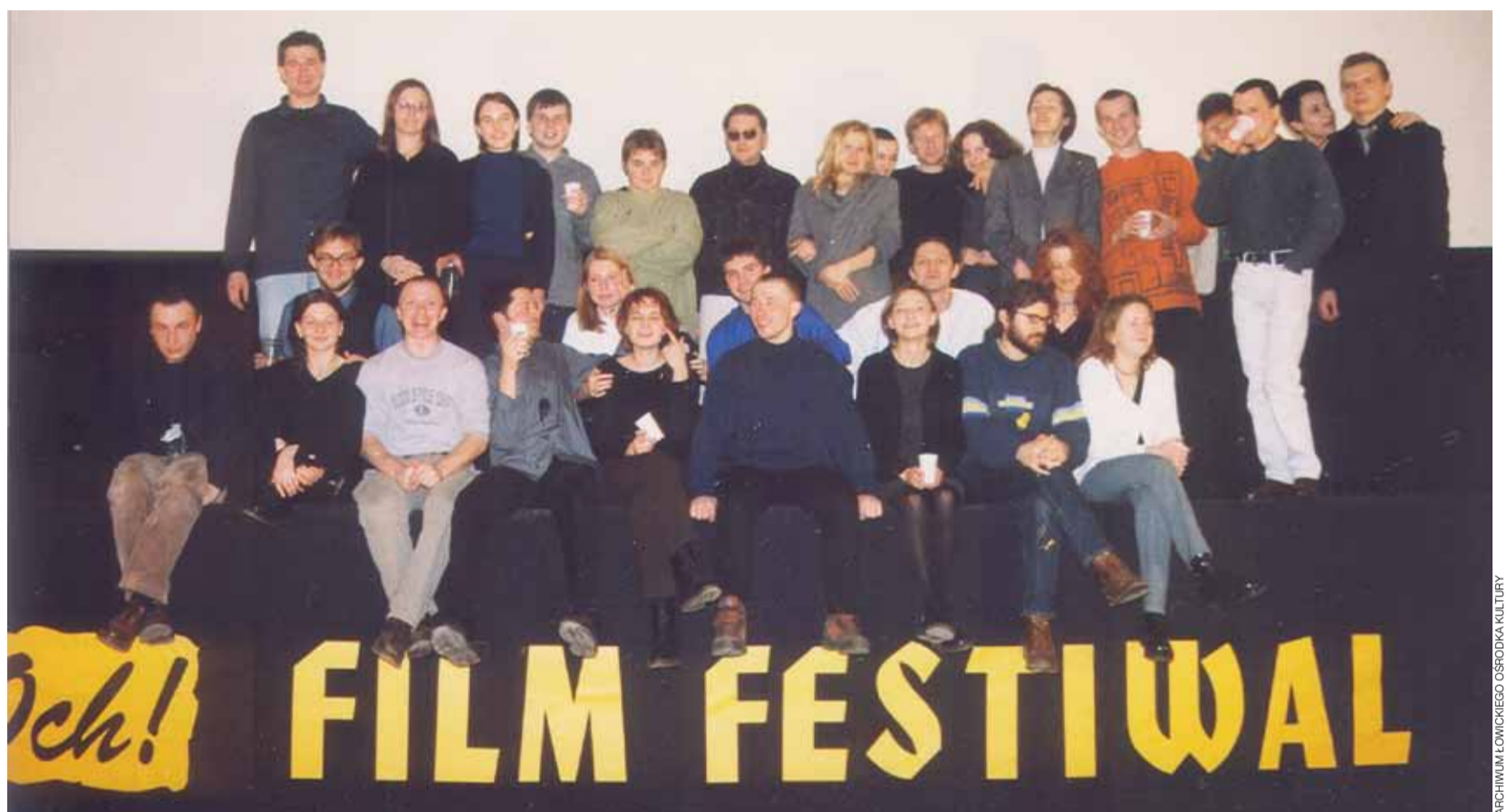
Na zakończenie Och! Film Festiwalu w 2000 r. zrobiono pamiątkowe zdjęcie. Są tu widoczni zarówno organizatorzy festiwalu, jak i uczestnicy OCH-a!