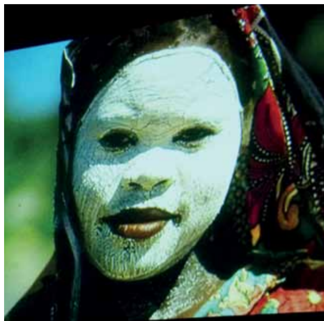
Prelekcja została wzbogacona fotografiami. Sporą część z nich stanowiły portrety.

Afrykańska kobieta może wreszcie odpocząć, gdy osiągnie wiek starości, który nie da