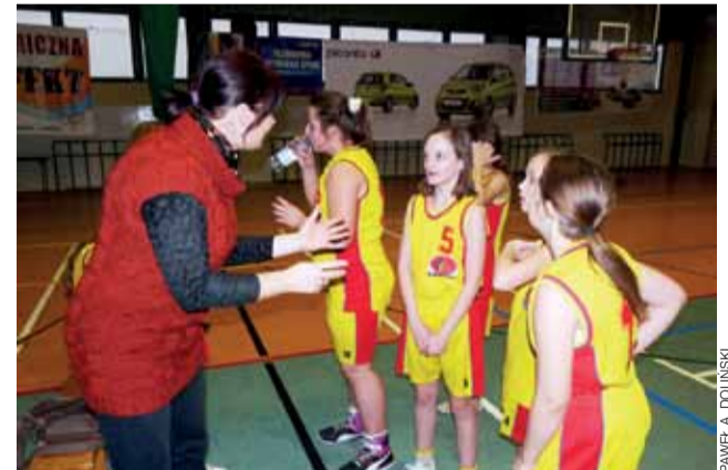
Żaczki Księżaka na razie bez zwycięstwa...