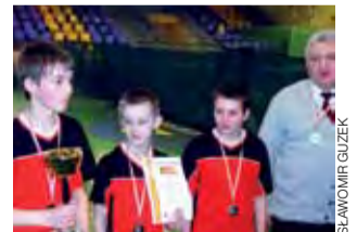
Ekipa SP Mastki zdobyła srebrny medal WIMS.

W finale gracze z gminy Chąšno zmierzili się, podobnie jak w zawodach rejonowych, z pingpongistami MULKS Dwójka z SP 2 Rawa Mazowiecka. O ile jednak w Białej Rawskiej nasi pingpongiści wygrali 3:2, o tyle teraz nasz team rawianom, pomimo prowadzenie po deblu 2:1, w stosunku 2:3. – To ogromny sukces moich uczniów – cieszył