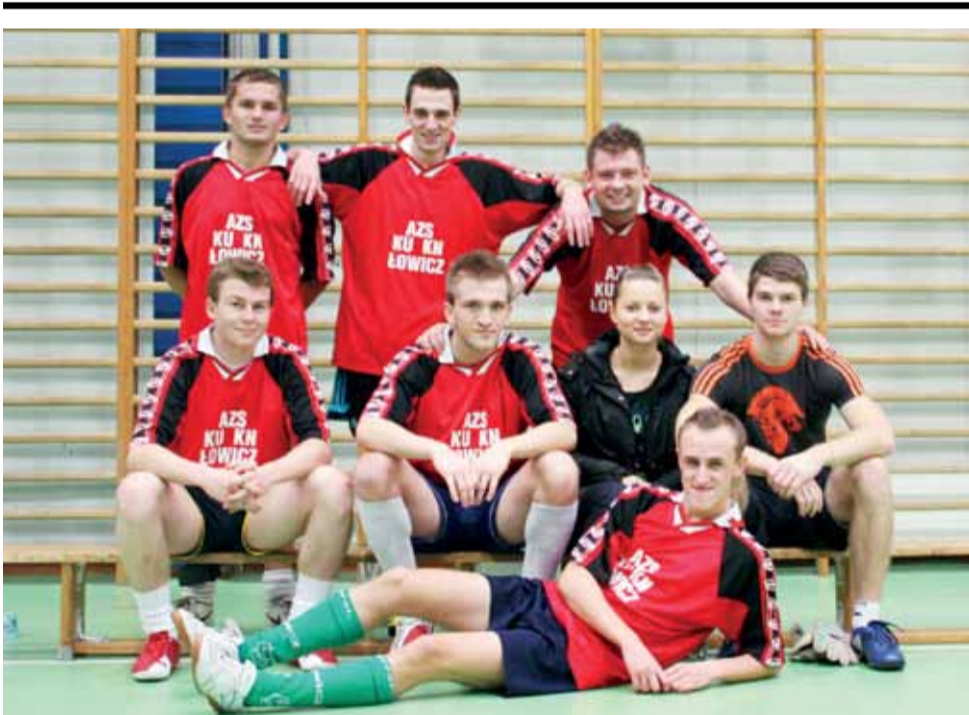
Drużyna KN Łowicz wygrała w Skierniewicach, ale w Łodzi zajęła dopiero piąte miejsce.

Futsal | Kolegium Nauczycielskie w Łowiczu