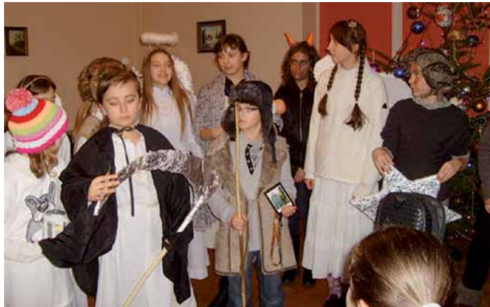
Dzieci ze szkoły pijarskiej zadbały o ciekawe stroje na kołędę.

W kołędowaniu i zbieraniu pieniędzy na misje włączyli się także uczniowie SP im. Leokadii