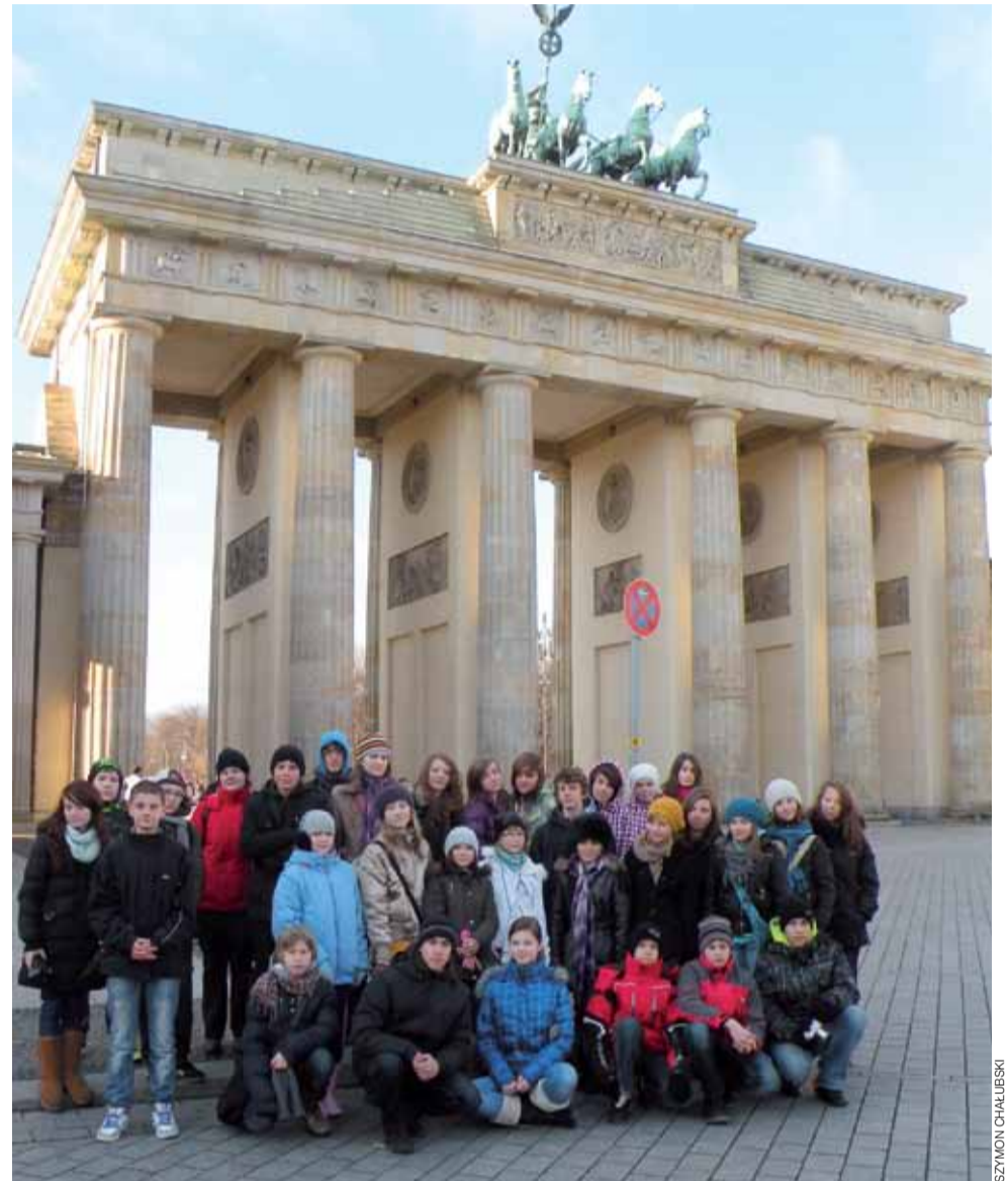
Uczniowie z "Trójki" przed Bramą Brandenburską w Berlinie.