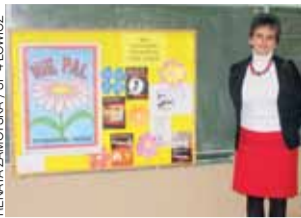
Plakaty przygotowane przez uczniów.