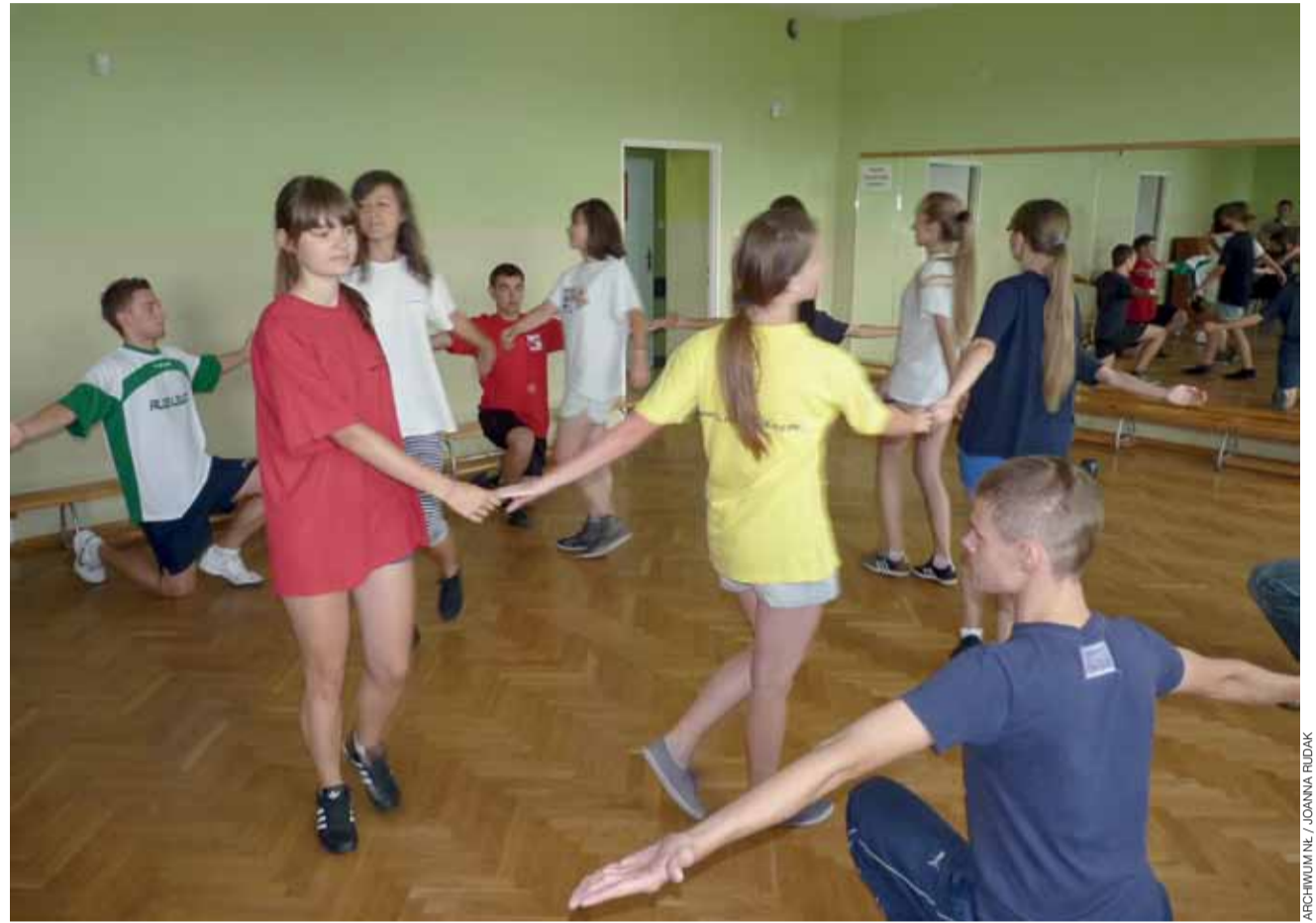
Członkowie zespołu Koderki w czasie jednej z prób, jakie odbywały się w czasie wakacji 2011 roku w Łowickim Ośrodku Kultury.