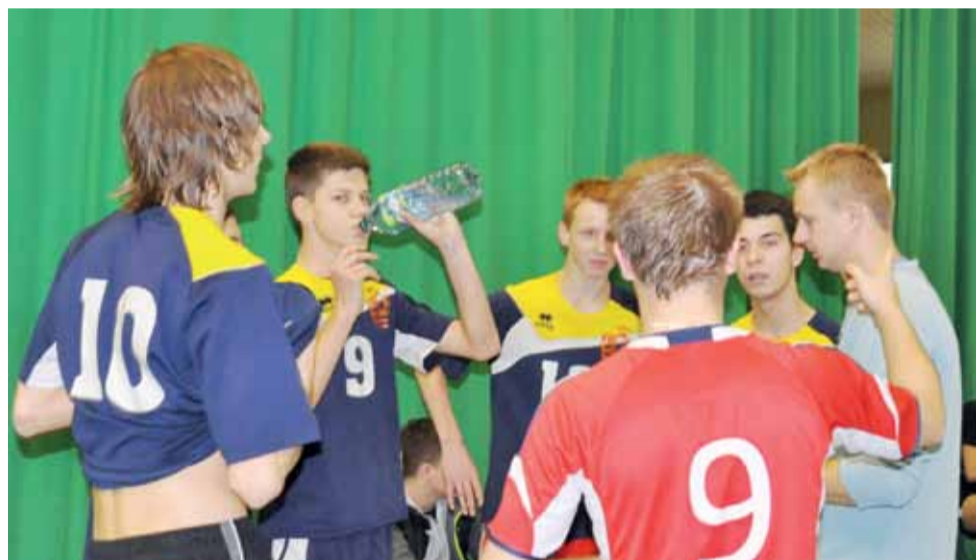
Drugi zespół Korabki walczy o awans do fazy finałowej.