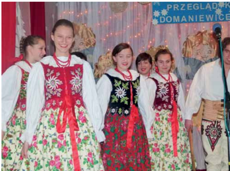
Zespół Kalina z Domaniewic tradycyjnie rozpoczął koncert finałowy przeglądu kolęd.