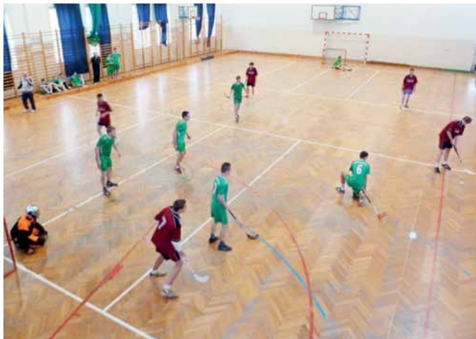
W finałowym pojedynku padła tylko jedna bramka, która dała tytuł ekipie gimnazjalistów z Bielawy.