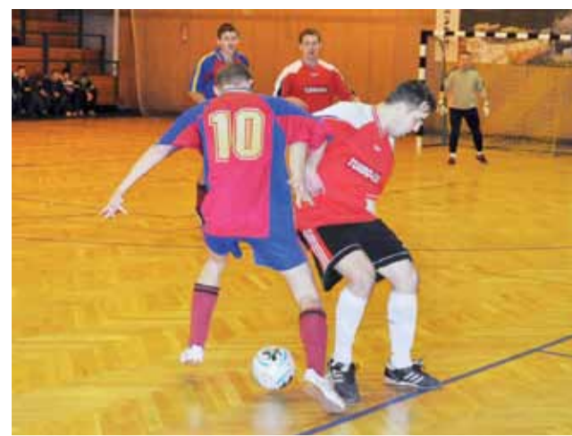
Victoria grała do końca i ostatecznie ograła Gutenów 1:0.

W sobotę 21 stycznia 2012 roku odbędą się mecze 7. kolejki II ligi ŁoLiF: godz. 15.00: Bo-Dach Grudze – Alcatraz Łowicz, godz. 15.30: Agros-Bud Łowicz – Młodzi Wilcy Łowicz, godz. 17.30: Victoria Zabostów – Banasz-Zatorze II Łowicz, godz. 18.00: Vagat-BS ZŁ Domaniewice – Zajęce Łowicz, godz. 18.30: Proceder Łowicz – PHU Gajek Bąków Górny i godz. 19.00: Husqvarna Łowicz – Gutenów Łowicz. Pauza: Laktoza Łyszkowice.