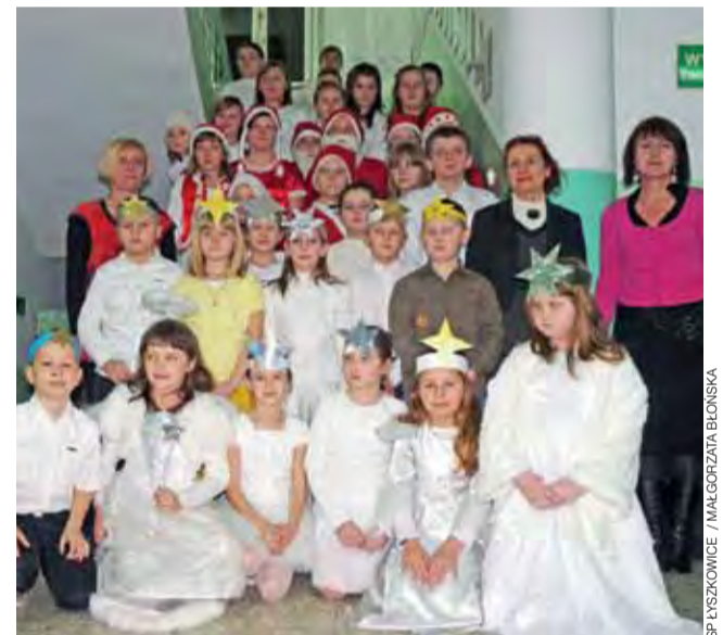
Uczniowie SP Łyszkwice wprowadzili świąteczną atmosferę podczas zebrania z rodzicami.