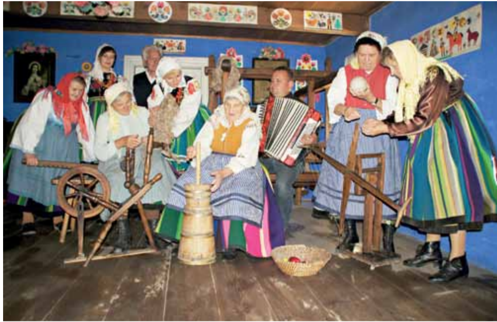
Zespół Regionalny Wsi Urzeczce, który na kalendarzu pojawił się w listopadzie, wystąpi w muzeum w Łowiczu 17 listopada o godz. 16.00. Przedstawi program o Andrzejkach i darciu pierza.

Spotkania będą się odbywały według następującego harmonogramu: 18 lutego w muzeum wystąpi zespół Ksinsoki (uroczystość Matki Bożej Gromnicznej), 24 marca w muzeum wystąpią dzieci z zespołu Jarzębina z Zielkowiec (Topienie Marzanny), 21 kwietnia w muzeum przedstawią się będzie dziecięcy zespół Koderki (Wielkanoc),