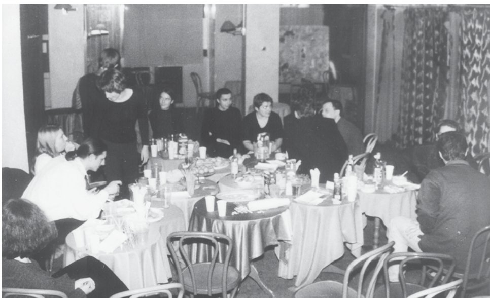
Kawiarnia Dziupla przy ul. Pijarskiej była miejscem spotkań miłośników kina, kiedy pokazy odbywały się jeszcze w kinie Bzura. Tutaj m.in. tworzono repertuar DKF.

W ciągu 15 lat istnienia DKF zmieniały się dni tygodnia, w których wyświetlano seanse. Najpierw była to niedziela, potem czwartek, a od października 2007 r. zamiast tego wprowadzono pokazy weekendowe.