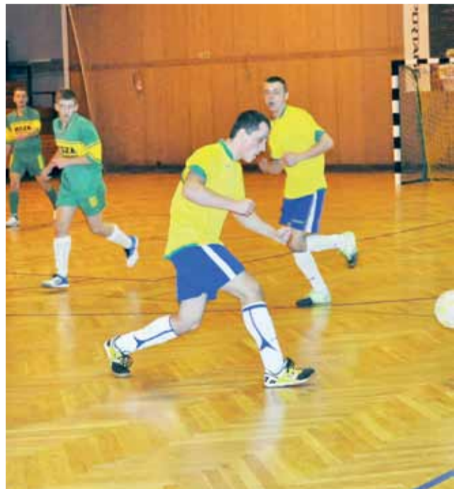
W meczu na szczycie III ligi piłkarze ekipy BTK ulegli rywalom z Merc-OSP 1:3.