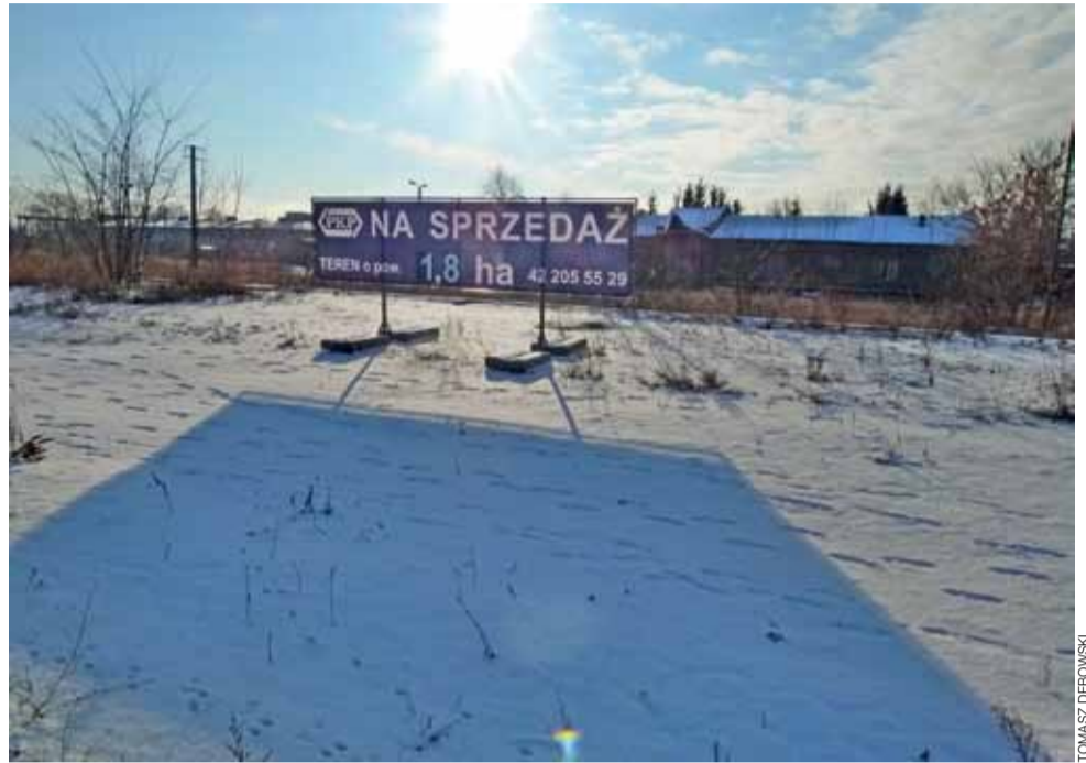
Miasto chce kupić działkę od PKP. Problem w tym, skąd wziąć na nią pieniądze.