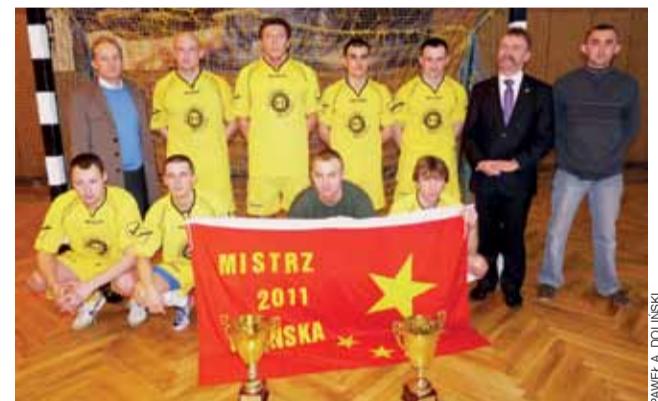
W poprzednim sezonie podwójną koronę zdobyła Chińska.

Mecze I rundy (niedziela – 5 lutego): godz. 12:00: Baunit Łowicz – KS II Ostrowiec, godz. 12:30: Bezedura Łowicz – Start Złaków Borowy, godz. 13:00: BTK Łowicz – Start-94 Złaków Borowy, godz. 13:30: Herki Nagawki – Mrówki