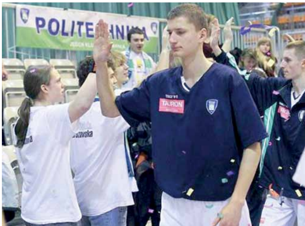
Łowiczanie debiut w rozgrywkach PLK ma już za sobą.