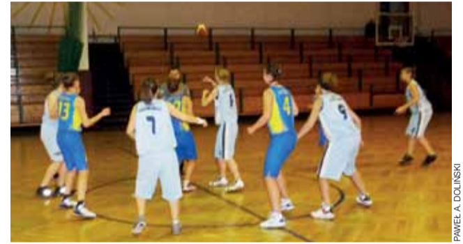
Kadetki po raz drugi w sezonie doznały wysokiej porażki z MKS Kutno.