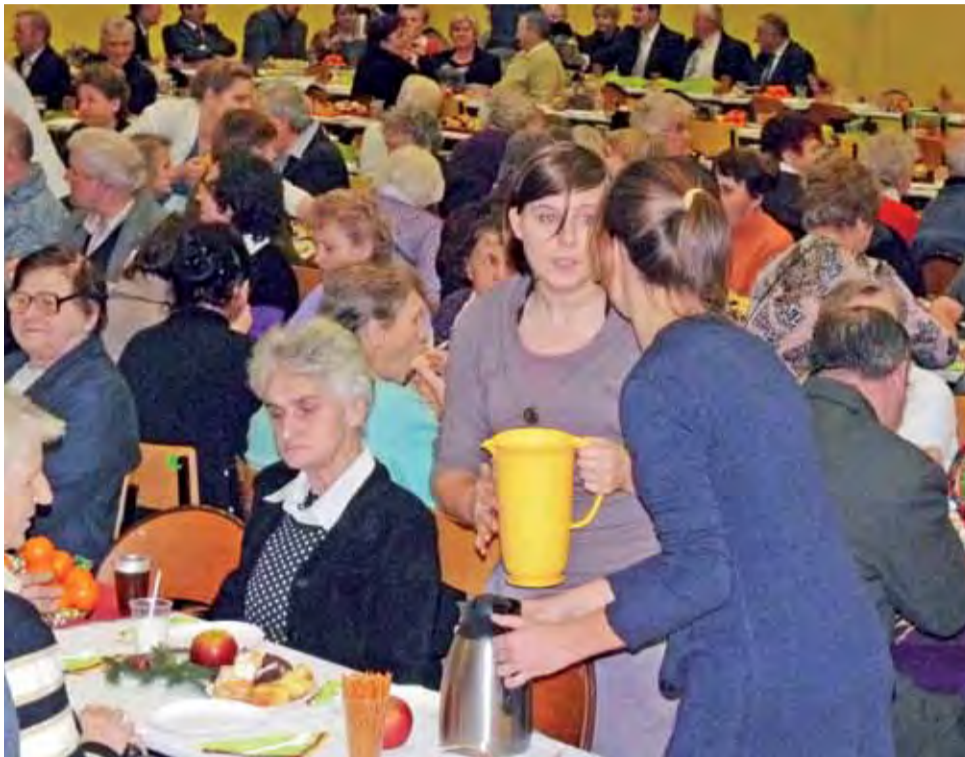
Przy stołach zasiadło ponad 200 seniorów. Kawę i herbatę rozlewały do kubków ich wnuki.