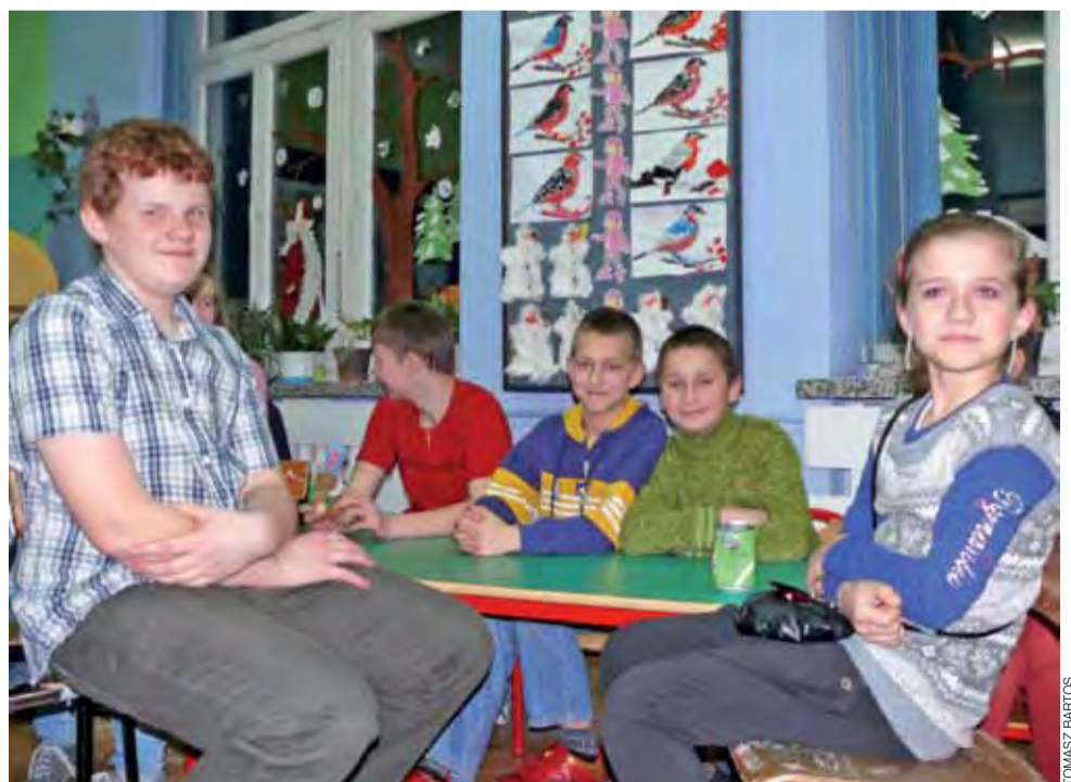
Uczniowie podstawówki i gimnazjum w Łaguzzewie w czasie biwaku integracyjnego w murach szkoły.