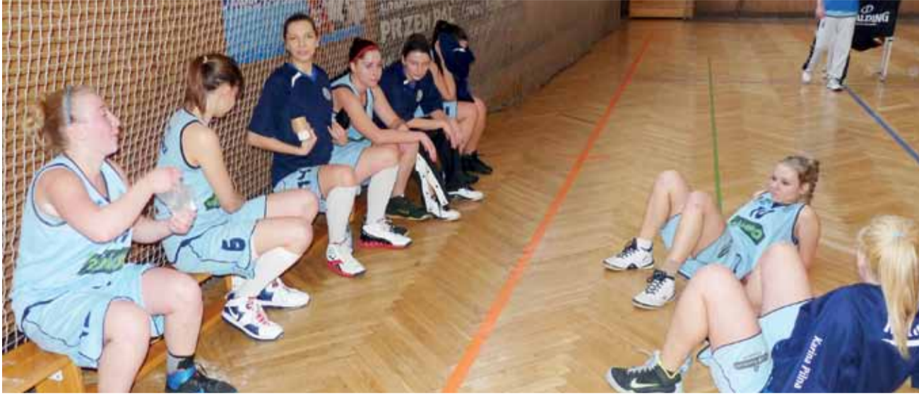
Koszykarki łowickiego Księżaka nie doczekały się na swoje rywalki z Siedlec.