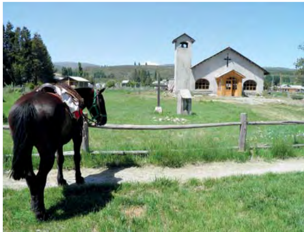
Parking przed kościołem. Nie zawsze wierny przyjeżdża samochodem.