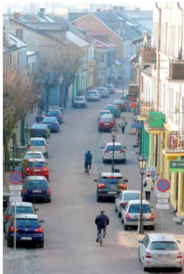
Widok na część ul. Zduńskiej, na której jest deptak. Już niebawem będzie można przejechać nią jadąc od Nowego Rynku. Obecny kierunek ruchu (możliwego na razie tylko dla wybranych) zostanie odwrócony.

Burmistrz zapowiada, że zapłacimy nie więcej niż 2 zł za godzinę postoju auta. Właściciele sklepów, ich pracownicy oraz mieszkańcy obu rynków i ulicy Zduńskiej będą także płacić. Dla nich ma być przygotowana oferta opłaty miesięcznej. Ile to wyniesie, jest jeszcze analizowane, ale burmistrz deklaruje, że nie będą to wysokie opłaty. str. 5