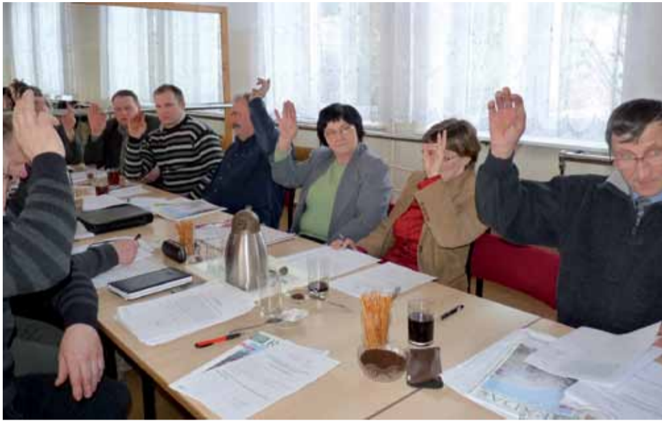
Radni gminy Domaniewice podczas głosowania.

W tym roku zostanie zbudowany parking przy budynku