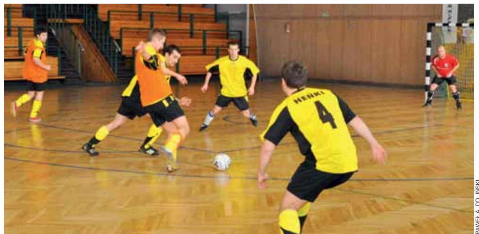
Ekipa Heńków długo nie mogła znaleźć sposobu na złakowski Start, ale ostatecznie wygrała 2:0.