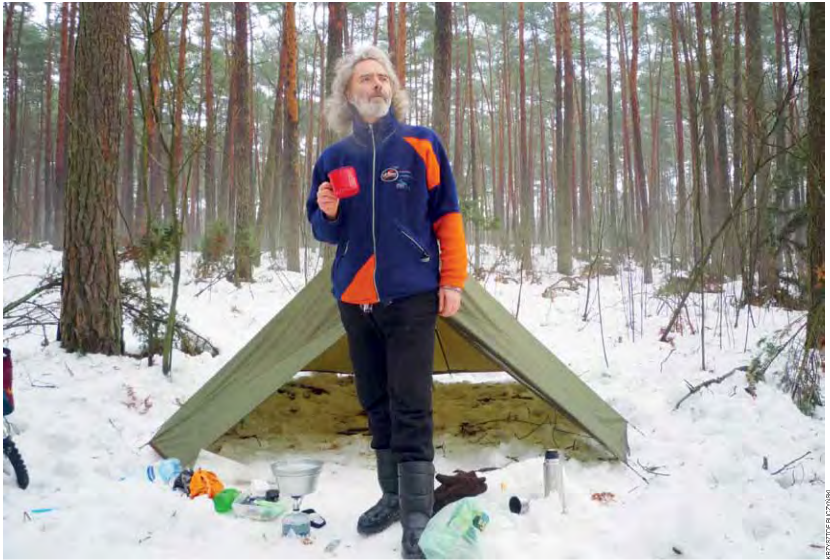
Autor tekstu podczas jednego ze swoich zimowych biwaków w lesie.

Łódzki Oddział NFZ przez całą dobę udziela aktualnych informacji o kontraktach. W razie jakichkolwiek pytań, można dzwonić w dni powszednie w godz. 8.-16. pod nr tel. 42/194-88-800 lub całodobowo na bezpłatną infolinię pod nr 800-133-773. mwk