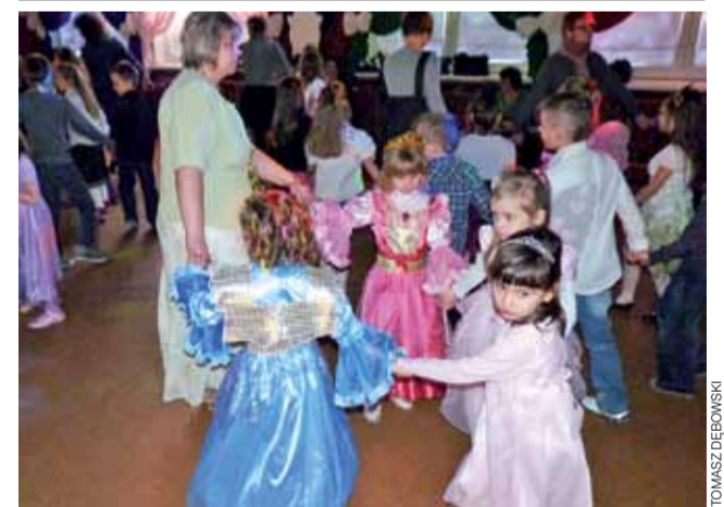
Około 160 dzieci ze Szkoły Podstawowej w Skaratkach

w gminie Domaniewice i z pobliskich miejscowości bawiło się na balu karnawałowym połączonym z choinką, który odbył się 28 stycznia w tej szkole. Dzieci odwiedziły także Mikołaj, który wręczył im paczki ze słodyczkami. td