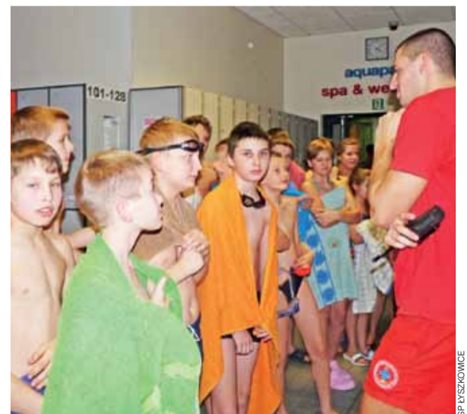
Krótkiego instruktazu przed wejściem na basen udzielił uczniom z Łyszkowic ratownik.

BIURO PROJEKTU Zakład Doskonalenia Zawodowego w Łodzi 90-563 Łódź, ul. Łąkowa 4 tel. 42-630-06-85 www.zdz.lodz.pl