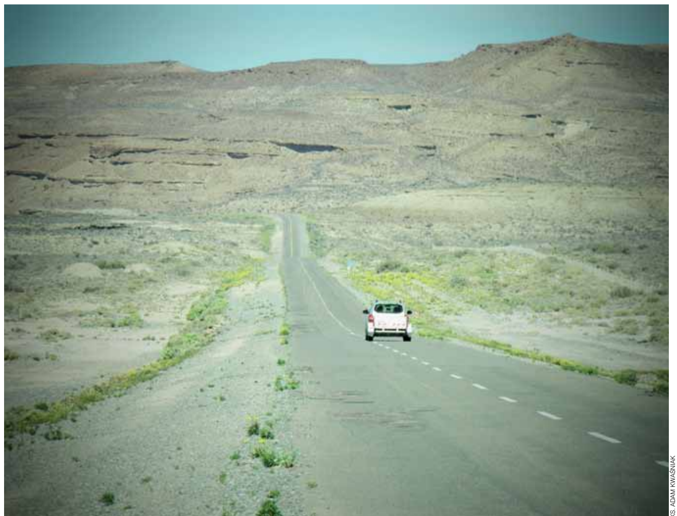
Patagońska prawie autostrada. Ta droga ciągnie się przez tysiące kilometrów.