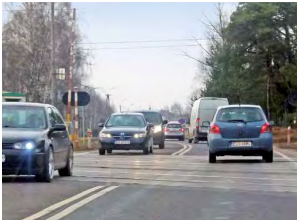
Ruch na przejeździe kolejowym w Arkadii jest duży. Kolejarze uważają, że samochody – szczególnie ciężarowe – jeżdżą zbyt szybko.

Regulamin był wcześniej konsultowany z działającymi na terenie gminy związkami zawodowymi nauczycieli: ZNP i nauczycielską Solidarnością. Radni jednogłośnie przyjęli uchwałę w tej sprawie. mak