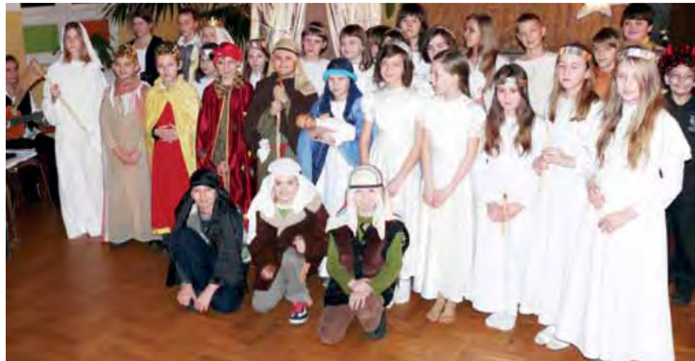
Dzieci ze Szkoły Podstawowej w Dzierzgówku w Gminnym Ośrodku Kultury w Bełchowie zaprezentowali seniorom jasełka.

przedstawiły program złożony z wierszy oraz piosenek o babcjach i dziadkach. Zaznaczyć trzeba także, iż w inscenizacjach wystąpił szkolny chór, a większości utworów towarzyszył akompaniament w wykonaniu uczniów. Dzieci grały na pianinie, skrzypcach i flecie. tb