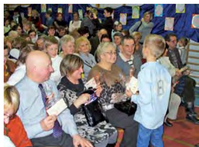
Dzieci wręczyły swoim babciom i dziadkom wykonane przez siebie laurki.

To dla nich dzieci z klas 0-III przygotowały scenkę słowno-muzyczną pod opieką swoich nauczycieli, w której mogli zaprezentować swoje umiejętności wokalne i recytatorskie. Dzieci zostały za to nagrodzone gromkimi brawami oraz uściskami i buziakami, którymi babcie i dziadkowie obficie obdarzali swoje wnuczka. Po przemówieniach, dzieci wręczyły laurki zaproszonym przez siebie gościom. To nie była jedyna niespodzianka dla seniorów. Specjalnie na tę okazję uczniowie przygotowali galerię portretów, wśród których mo-