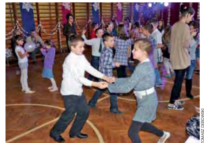
Przez kilka godzin 28 stycznia w Szkole Podstawowej w Bolimowie

trwała choinka połączona z Dniem Babci i Dziadka i zabawą karnawałową. Dzieci wraz z rodzicami tańczyły w rytm dyskotekowej muzyki, a w poszczególnych klasach można było spotkać dziadków i babci, które smakowały przygotowane na tę okazję słodyczki. td