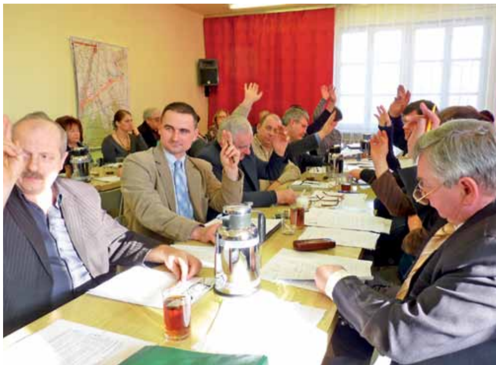
Radni gminy Bolimów nie mieli wątpliwości przy podejmowaniu uchwały budżetowej.

150 tys. zł zaplanowano na modernizację drogi dojazdowej do gruntów rolnych w Wólce Łasieckiej. Dzięki dofinansowaniu z Narodowego Programu Przebudowy Dróg Lokalnych zostanie wykonana droga gminna relacji Humin Mizerka – Ziąbki – Kurabka na odcinku Ziąbki– Kęszyce Wieś.