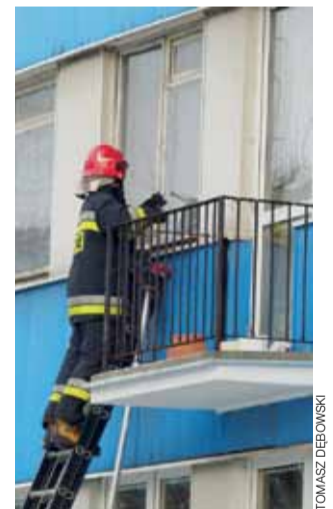
Strażacy do domu kobiety dostali się przez okno.

W mieszkaniu przebywała 84-letnia kobieta, którą zabra-