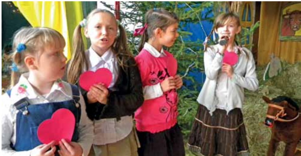
Uczniowie klasy I i III oraz wychowankowie przedszkola recytowali wiersze i śpiewali piosenki o babcjach i dziadkach z okazji ich święta.