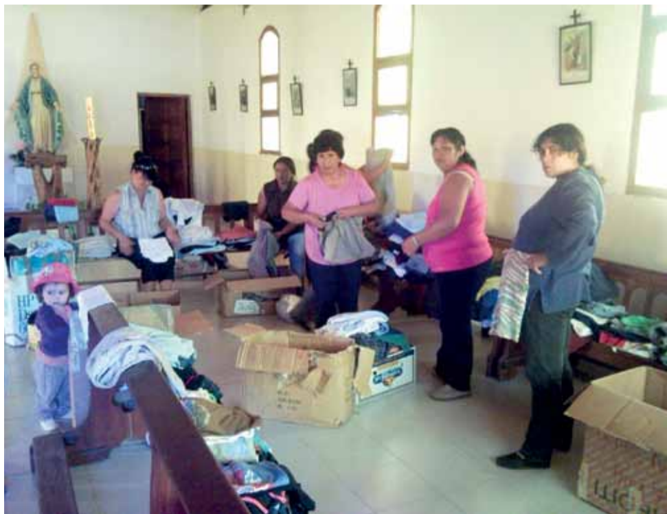
Wydawanie odzieży w kościele.

Mieszkańcy Cholila żyją po trosze ze wszystkiego. Przede wszystkim z handlu i turystyki. Spora grupa pracuje w miejscowej biurokracji: w magistracie, policji, szkołach i paru innych urzędach. Argentyna jest rajem dla biurokratów i utrzymuje całe tabuny urzędników. Dla przykładu, w Polsce, aby uzyskać zaświadczenie o niekaralności, wystarczy udać się do okienka w sądzie, pokazać dowód osobisty i zapłacić. W Argentynie