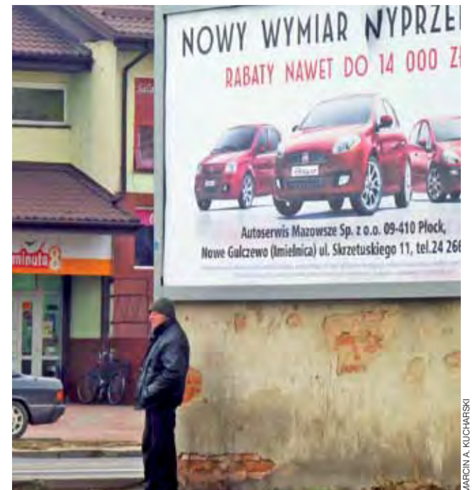
Szyld reklamowy zasłania część zniszczonej elewacji budynku przy ul. Warszawskiej w Sannikach.

W planach jest także przebudowa drogi gminnej od Jankowic do Zduny za kwotę 250 tys. zł, modernizacja dróg dojazdowych do gruntów rolnych za ok. 300 tys. zł, zakup gminnego busa za ok. 100 tys. zł, doposażenie placu zabaw przy SP w Bąkowie Górnym za 35 tys. zł i montaż kotła CO w SP w Nowych Zdunach za 100 tys. zł. td