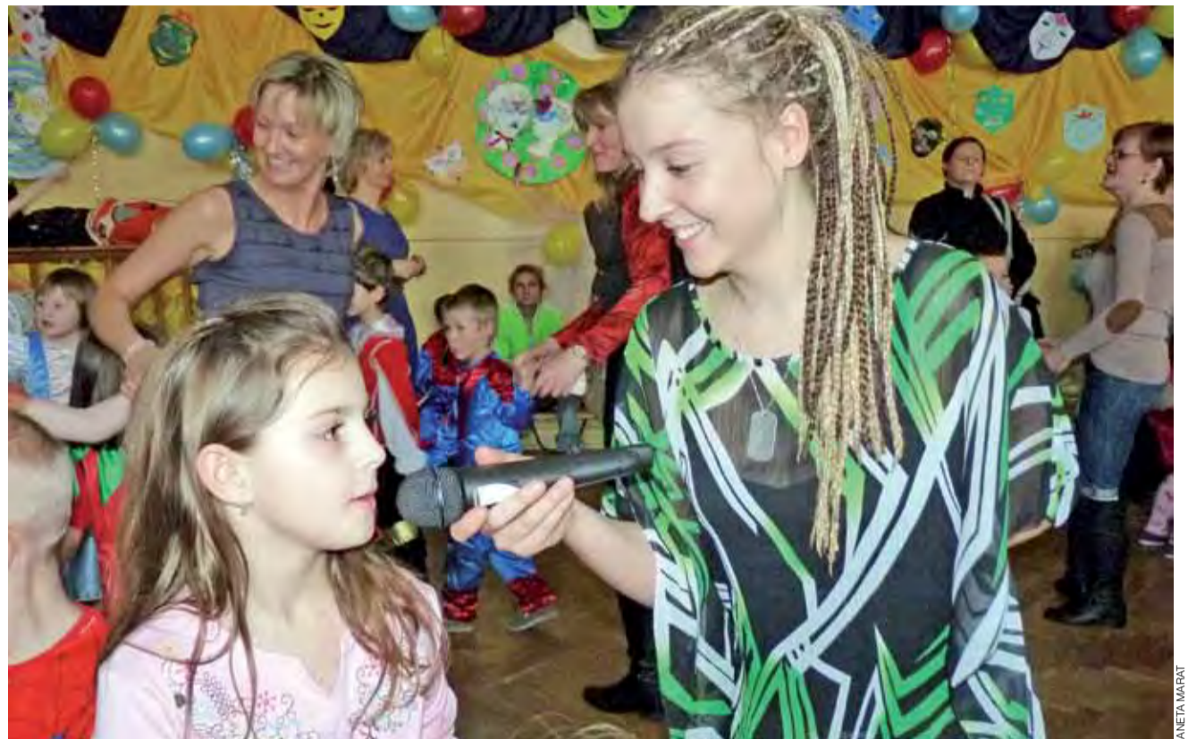
W czasie balu przygotowano dla dzieci wiele zabaw i atrakcji. Jedną z nich było wspólne śpiewanie.

Tuż przed rozpoczęciem imprezy w szkole odbyła się akcja charytatywna. Rodzice, dziadkowie i inni znajomi uczniów mogli zakupić szmaciane lalczki wykonane przez uczniów szkoły. Najdroższa lalka, łowiczanka, została sprzedana za 250 zł, najtańsza