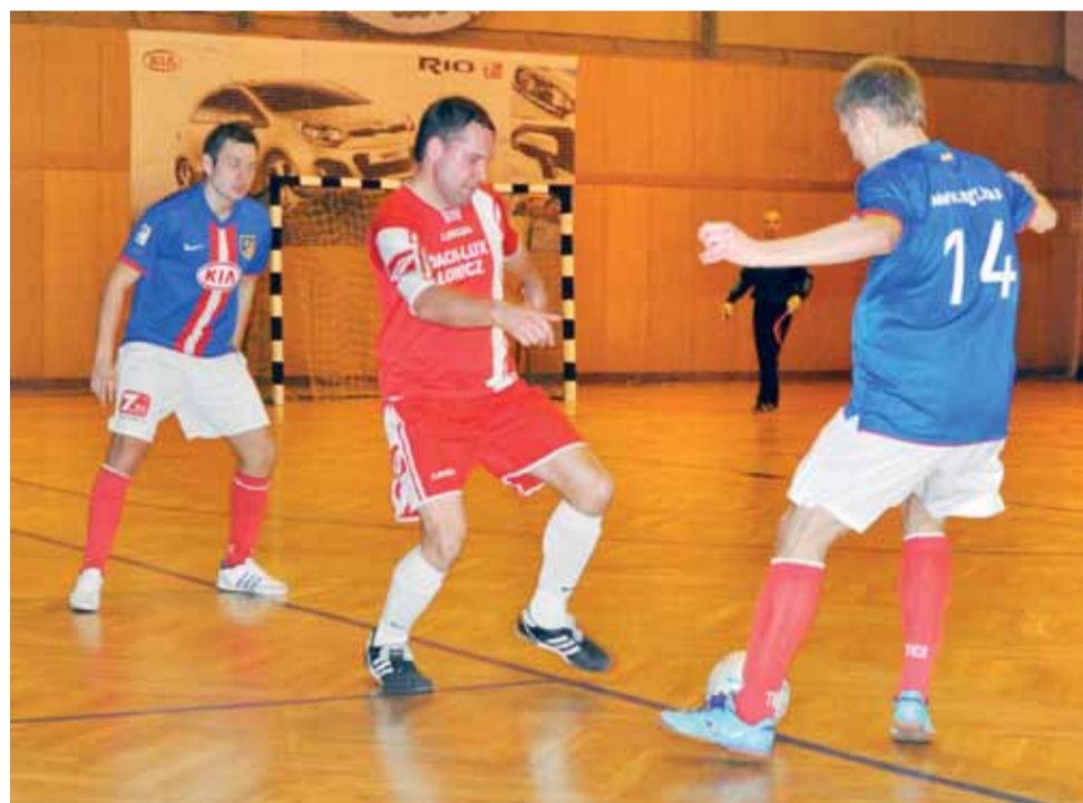
Drużyna-KIA rozgromiła Dach-Lux wygrywając aż 9:1 i ostatecznie cieszyła się z drugiego miejsca na finiszu mistrzostw Łowicza 2012.

Nowy Łowiczanie. Tygodnik Ziemi Łowickiej, członek Stowarzyszenia Gazet Lokalnych.