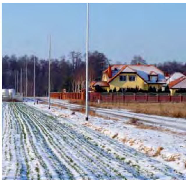
Zamontowane już słupy, zdaniem części mieszkańców, służą przede wszystkim zającom, które przebiegają tędy do pobliskiego lasu.