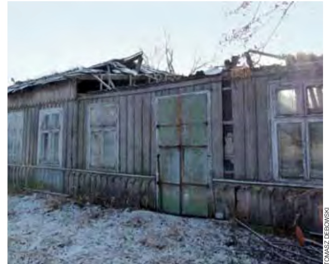
Drewniany dom z pewnością zostanie rozebrany. Nie wiadomo jednak, kto to robi i kiedy to nastąpi.

– Kończymy gromadzenie niezbędnych dokumentów, dzięki którym wystąpimy do sądu o ustalenie spadkobierców. To trochę potrwa, ale jak już sąd wskaże spadkobiercę, inspektor nadzoru budowlanego będzie mógł wydać decyzję nakazującą rozbioru – mówi wójt. td