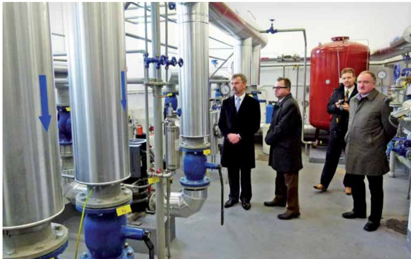
Kotłownię można było zwiedzać. Kolejna taka okazja, z której może skorzystać każdy zainteresowany, już w najbliższą sobotę.

Prace przy przebudowie trwały około pół roku, zaczęły się jeszcze w czerwcu roku minionego. Obok prac budowlanych wprowadzono tu nowe technologie: nowe piece i instalacje systemu grzewczego. W kotłowni są 2 w pełni zautomatyzowane piece na miał, który jest wsypany do dozownika, a potem pobierany do pieca. Wcześniej używano węgla, który za pomocą łopaty