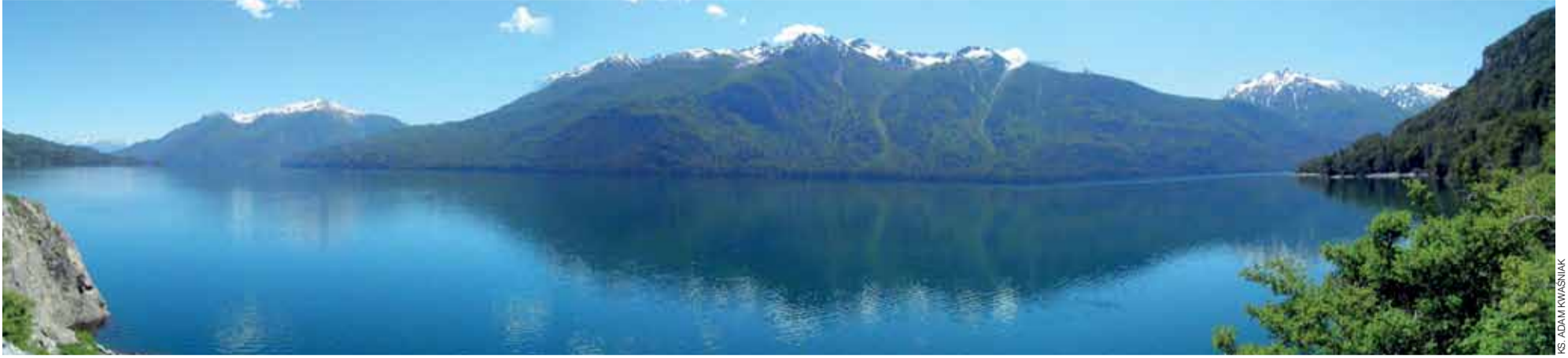
Okolice Chollila to jeden z najpiękniejszych, choć ubogich, zakątków świata.

nie należy najpierw przetłumaczyć w Buenos Aires (odległym o ponad dwa tysiące kilometrów) wszystkie możliwe dokumenty z Polski (bo międzynarodowej legalizacji w praktyce się nie uznaje), następnie udać się do rejonowej żandarmerii w San Carlos de Bariloche (400 km), by przedstawić fotokopie wszystkich dokumentów i tłumaczeń, polskie zaświadczenie o niekaralności, certyfikat o zameldowaniu, wydany przez policję w Chollila i zestaw zdjęć. Przy składaniu dokumentów pobierane są dodatkowo odciski palców. Wszystko to potem wysłać należy do Buenos Aires i grzecznie czekać, aż urząd odpowie. „W Polsce taki cyrk odprawiało się za Bie-ruta, by dostać paszport, a tutaj jest to na porządku dziennym” – komentuje łowicki misjonarz.