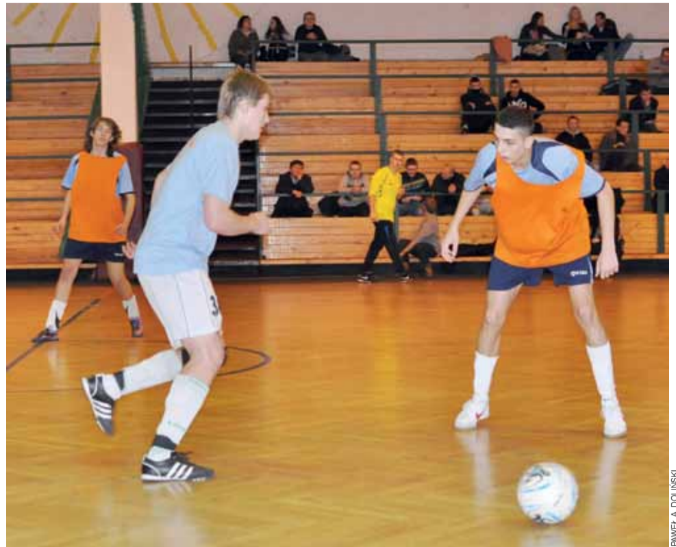
Ekipa PHU Gajek podzieliła się punktami z Agro-Budem i powoli traci dystans do liderów II ligi ŁoLiF.