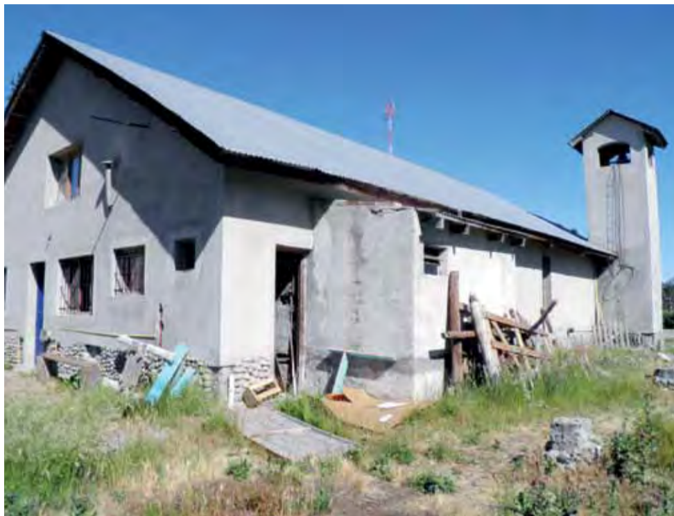
Kościół parafialny w Cholila. Widok od tyłu.