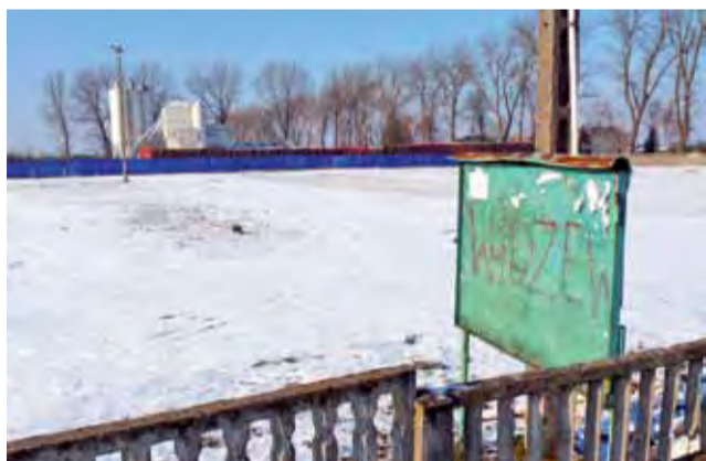
Obecnie targowisko w Łyszkowicach to tylko pusty, nieogrodzony i ogrodzony starym betonowym ogrodzeniem plac. Jeśli gmina uzyska dofinansowanie, targowisko będzie wyglądało zupełnie inaczej.

Gmina chce skorzystać z pieniędzy w ramach programu budowy i modernizacji targowisk Mój Rynek. O pomoc mogą ubiegać się gminy i związki międzygminne. Projekty mogą być realizowane w miejscowościach liczących do 50 tysięcy miesz-