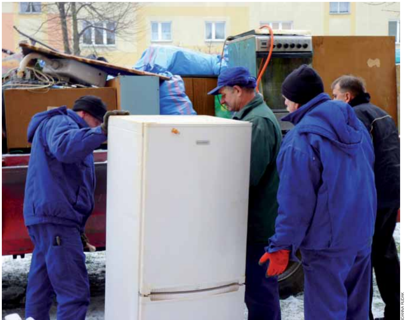
W czasie eksmisji pracownicy ŁSM są zobowiązani przenieść każdą rzecz, którą wskaże eksmitowany lokator.

Ruta dodaje, że w najbliższym czasie ŁSM chce przeprowadzić kilka podobnych eksmisji, ma już bowiem 6 prawomocnych wyroków sądu z nakazem. – Czekamy tylko teraz na decyzję miasta o przyznaniu tym lokatorom mieszkań socjalnych – dodaje. jr