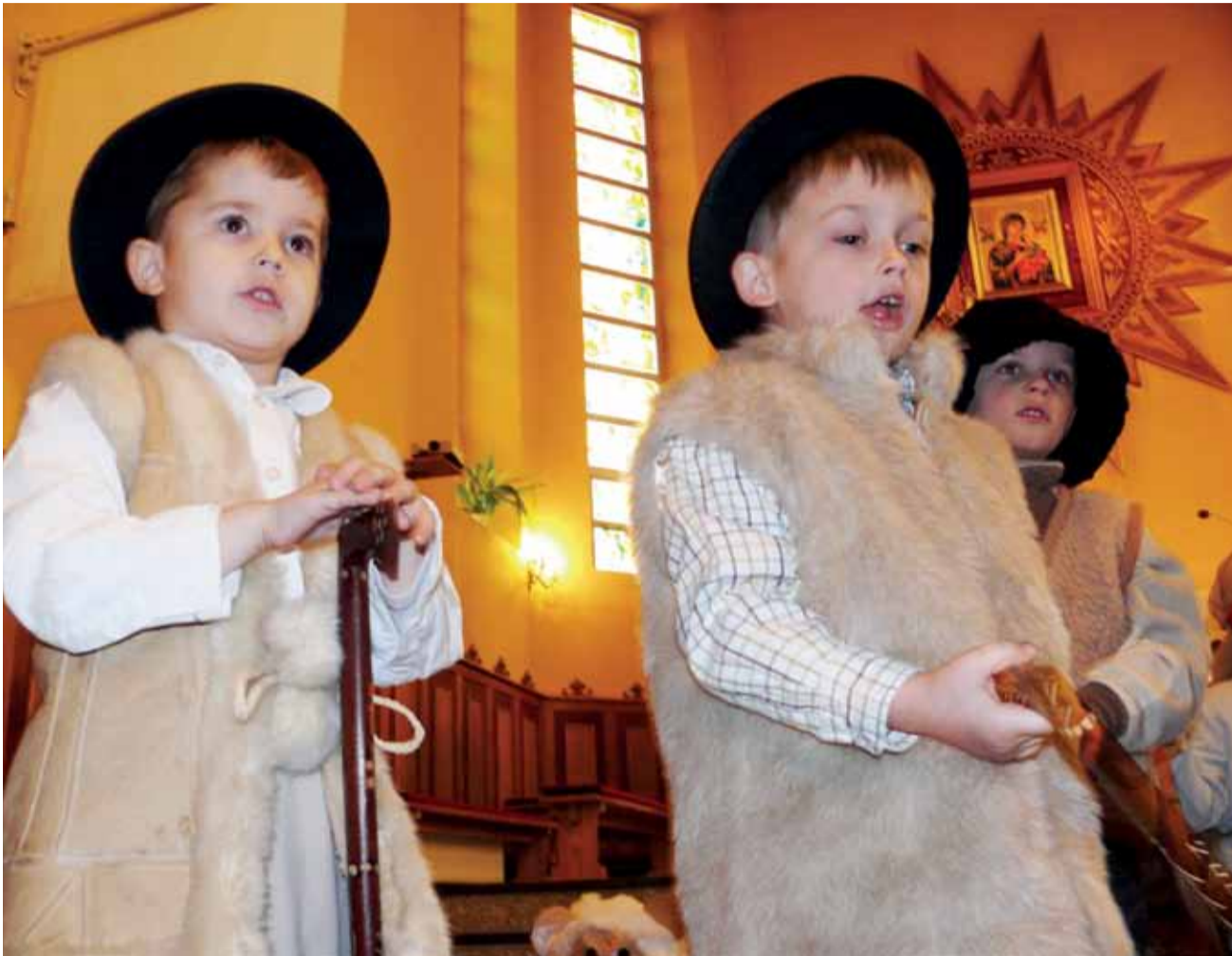
Dzieci z Przedszkola Diecezjalnego w Łowiczu występujący w roli pastuszków w przedstawieniu jasełkowym w kościele na Korabce.