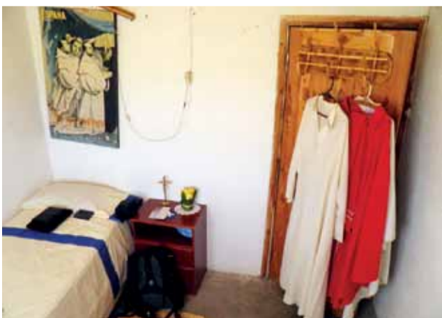
Zakrystia jest zarazem sypialnią. O prywatności nie ma mowy.

My, diecezjanie, możemy spróbować sobie to wyobrazić i wspierać misję modlitwą. ■