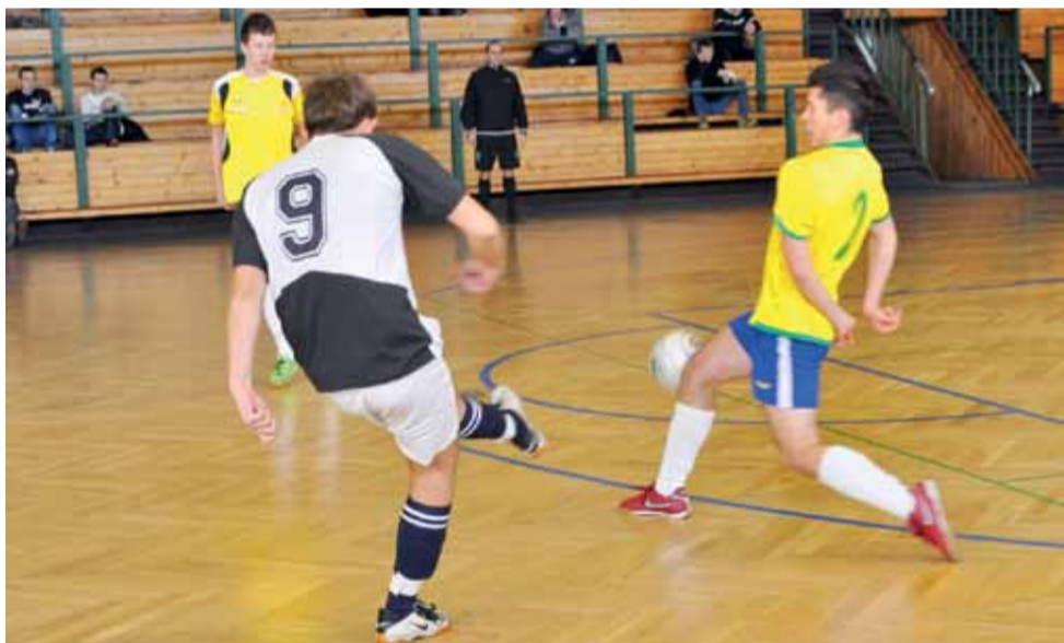
Piłkarze zespołu Szafa Gra mieli sporą przewagę w meczu z BTK Łowicz, ale jednak to rywale cieszyli się po meczu ze zdobycia kompletu punktów.