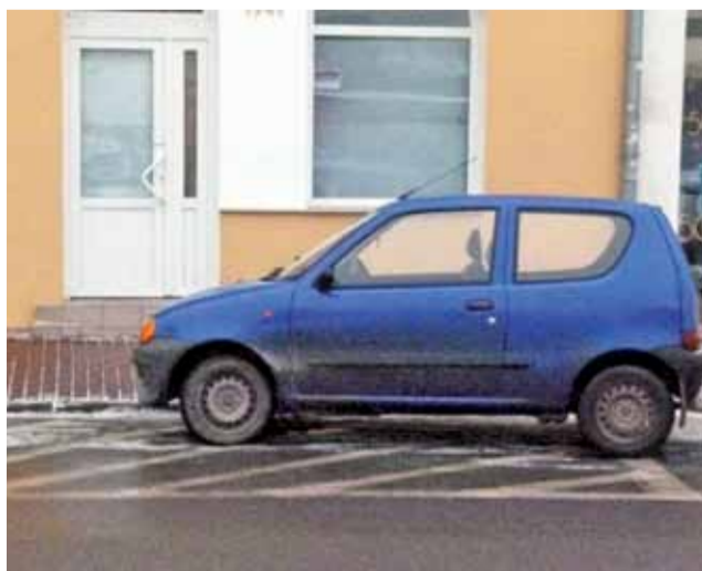
Na namalowanej na jezdni linii zakazującej postoju pojazdów na rogu przy łowickim Nowym Rynku i ul. Zduńskiej, notorycznie stoją samochody. Ich kierowcy za nic mają obowiązujący w tym miejscu zakaz postoju. td