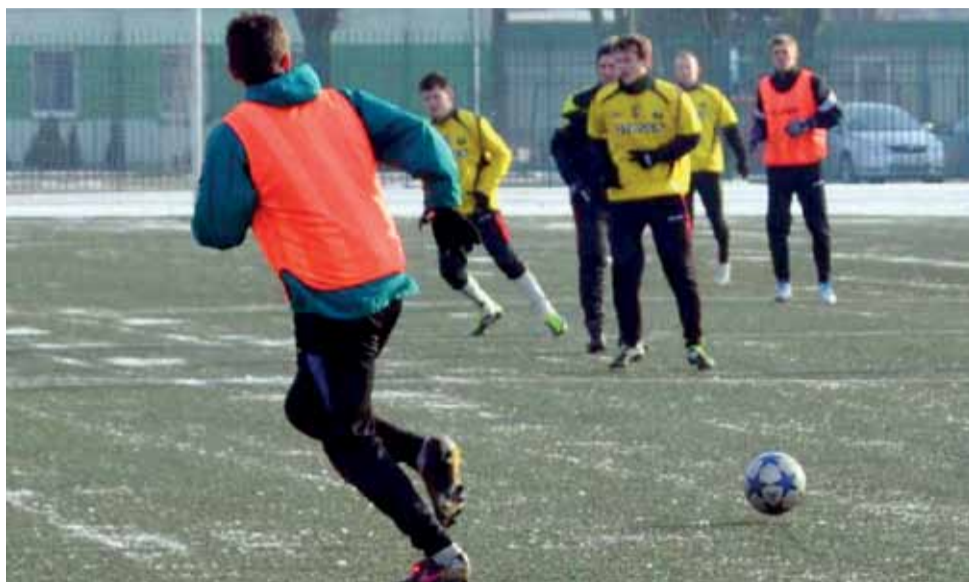
W drugim meczu piłkarze Pelikana nie dali większych szans trzecioligowym graczom Startu Otwock.