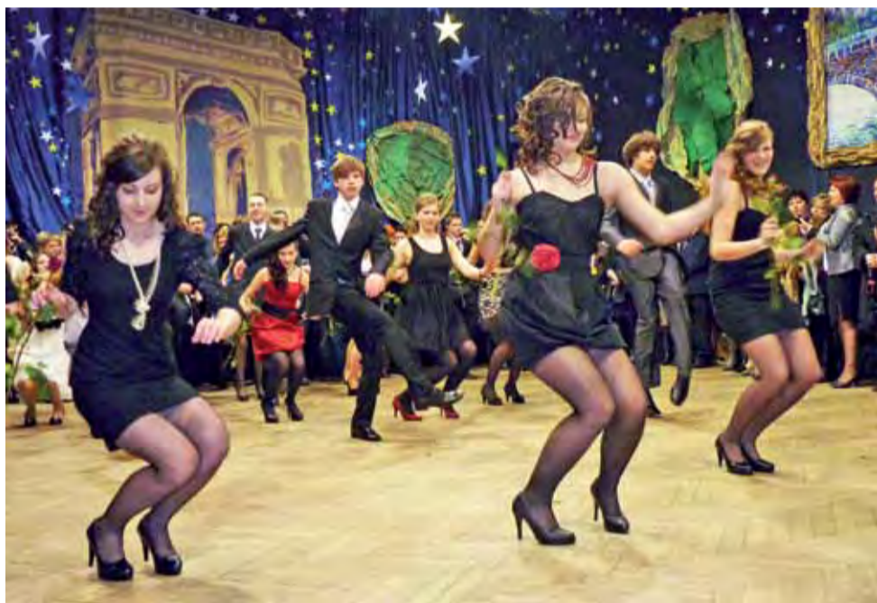
Klasa III A w taki sposób zakończyła poloneza. W rytmie rock and rolla.

ły poloneza, w którym nie zabrakło jednak innowacji. O ile klasa IIIS i IIIB zaprezentowały klasyczną wersję poloneza, o tyle uczniowie klasy IIIA zakończyli go tańcem w rytmie rock and rolla, a uczniowie z klasy IIIC urozmaicili go walcem i tańcem z balonami, które na końcu poszybowały pod sufit auli. Po prezentacji część uczniów zatańczyła pierwszy taniec ze swoimi nauczycielami i bal można było uznać za otwarty.