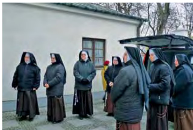
Zakon Sióstr Bernardynek jest najstarszym polskim zakonem żeńskim.

Dzisiaj i jutro wizyt duszpasterskich u parafian nie będzie: w czwartek, 2 lutego ze względu na uroczystość Matki Bożej Gromnicznej, a 3 lutego ze względu na pierwszy piątek miesiąca. W następnych dniach program wygląda następująco: sobota, 4 lutego od godz. 9 – os. Kostka 17, a od godz. 11 – os. Kostka 18; poniedziałek, 6 lutego od godz. 15 – os. Kostka 19 i 20; wtorek, 7 lutego od godz. 15 – os. Kostka 21 i 22. Będzie to ostatni dzień kolędy. opr. jr, tb