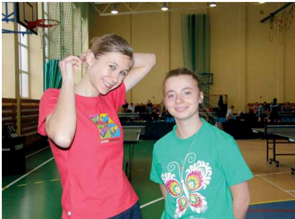
Po bardzo dobrym występie w etapie rejonowym Licealiady w tenisie stołowym liczymy na medale w finale mistrzostw województwa łódzkiego, zarówno dziewcząt z II LO, jak i chłopców I LO Łowicz.