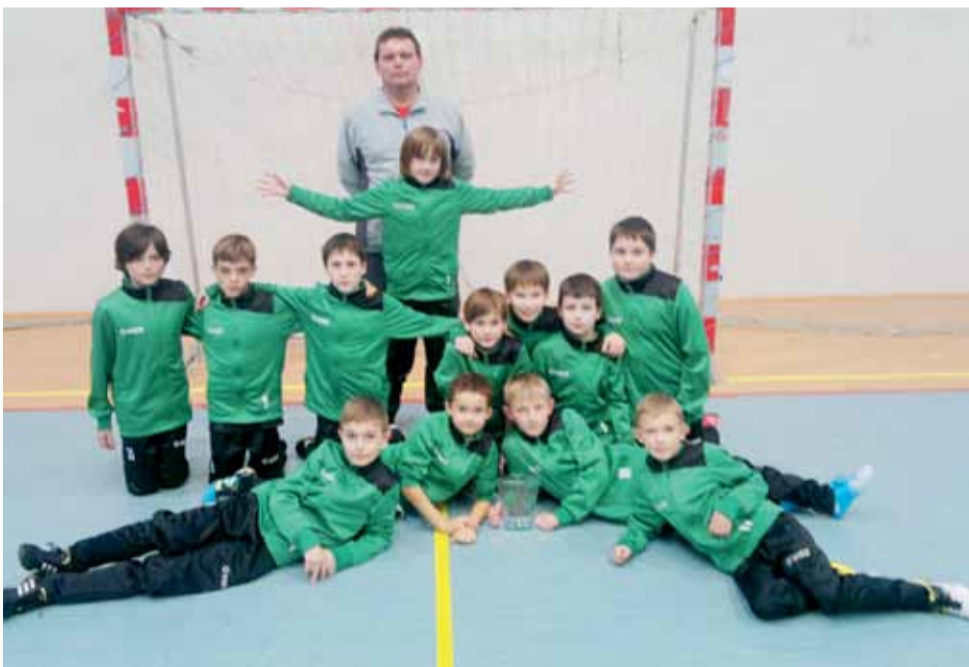
Młodzi piłkarze Pelikana-2001 z turnieju na turnieju grają coraz lepiej...