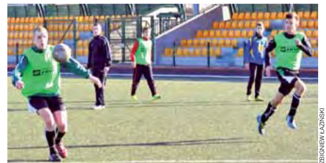
Ekipa Pelikana-95 rozgrywa kolejne mecze kontrolne...