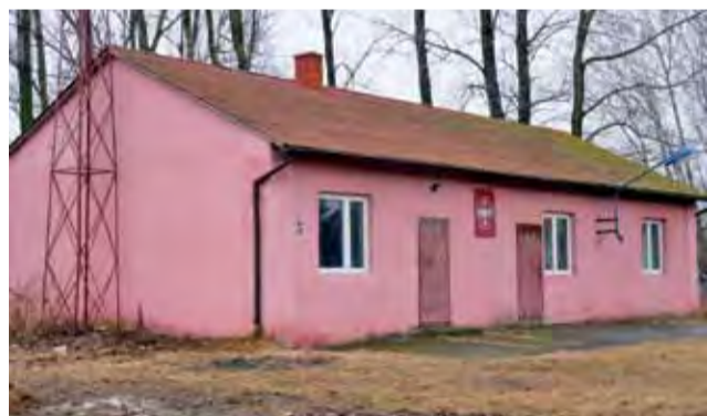
Teren pod budynkiem w Chaśno II będzie wkrótce należał do gminy.

zł rocznie. Linart wyjaśnia, że przed podjęciem decyzji gmina przeprowadziła wiele analiz finansowych, z których wynika, że trzeba szukać oszczędności. Do tej pory gmina dokładała do oświaty 1,9 mln zł rocznie – bo subwencja oświatowa z budżetu państwa od lat nie pokrywa kosztów prowadzenia szkół. am