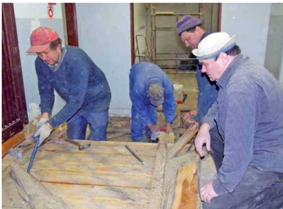
Pracownicy łowickiej firmy zrywają podłogę. Remont klatki schodowej ma zakończyć się do końca kwietnia.

Przypomnijmy, że wart ponad 8 milionów złotych, największy w historii remont łowickiej placówki ruszył na początku lipca minionego roku i zakończy się w roku przyszłym. Remont jest przeprowadzany w ramach Regionalnego Programu Operacyjnego Województwa Łódzkiego. Około 50% to pieniądze unijne, a