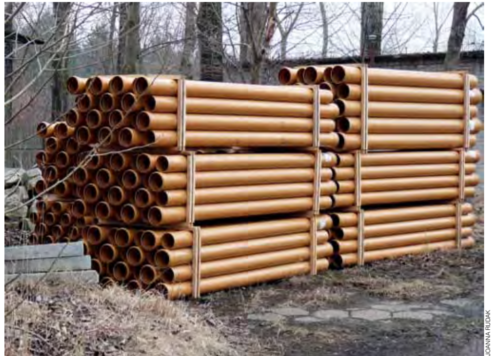
Część materiału składowana jest na terenie SKR, w pobliżu oczyszczalni ścieków.

Nie wiadomo nadal, czy gmina otrzyma dofinansowanie z Urzędu Marszałkowskiego w Łodzi na realizację tej inwestycji, choć nieoficjalnie łódzcy urzędnicy mówią, że są na to duże szanse. Gmina stara się o dofinansowanie w wysokości 85 % kosztów inwestycji. jr