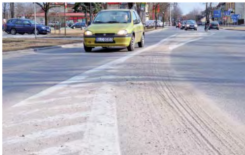
Drogowcy wysypali tej zimy na ulice Łowicza prawie trzykrotnie mniej mieszanki piaskowo-solnej niż w ubiegłym roku, nie oznacza to jednak, że piachu na ulicach nie ma. Przykładem jest Koński Targ w stronę ul. 1 Maja.

głym roku oraz dwa lata temu. Zakład Usług Komunalnych wysypał, w ramach zimowego utrzymania dróg, na ulice w Łowiczu około 1 tys. ton mieszanki piachu z solą. W ubiegłym sezonie były to około 2.772 tony mieszanki piaskowo-solnej, dwa lata wcześniej około 2 tys. ton mieszanki. Do zebrania jest mniej, bo część stanowiła sól, która rozpuściła się, a część piachu wywiały wiatr. Piach powinien zostać uprzątnięty w ciągu kilkunastu dni od momentu rozpoczęcia akcji. mak