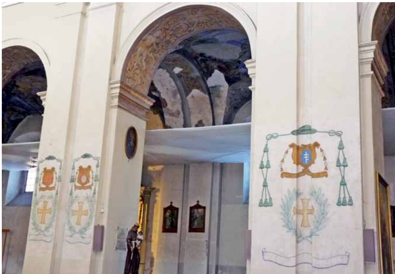
W nawach bocznych oddzielono sklepienia materiałem, by tynk nie spadał na głowy wiernych. Malowidła jednak nadal niszczeją.

Rektor nie podjął jeszcze decyzji, kto wykona prace przy elewacji. – Uważam, że najłatwiej będzie dokończyć prace pracownikom firmy Budowa, która wykonała dotychczasowy remont, ale jeszcze nie podjąłem decyzji w tej sprawie – mówi o. Galas. Chciałby on dodatkowo wykonać nowe oświetlenie świątyni. Obecnie stoją dwa duże maszty z lampami, które nocą oświetlają budynek kościoła. Według projektu, nad którym obecnie pracuje firma Budowa, oświetlenie miałyby zostać wmontowane w płyty przed kościołem. Czy to się uda, nie wiadomo, ponieważ na ten cel pijarzy