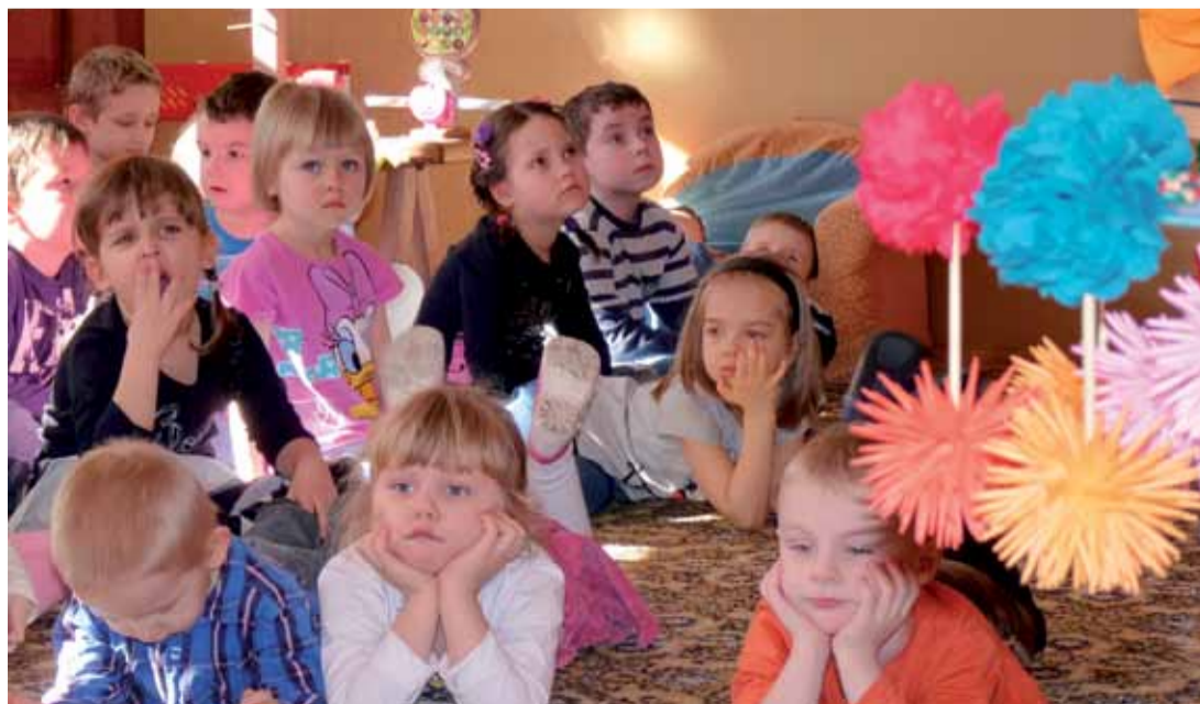
Przedszkolaki z zainteresowaniem słuchały opowieści twórców ludowych.