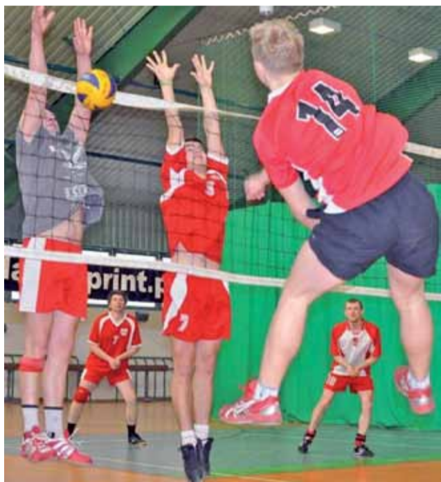
Gimnazjaliści z GM Głowno walczyli, ale Oldboy Retki wygrał 3:0.