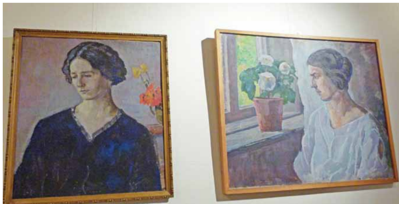
Na wystawie można oglądać kilkadziesiąt dzieł artystów związanych z naszym miastem, m.in. portrety malarzy związanych z Łowiczem, jak chociażby Kazimierza Strzemińskiego.