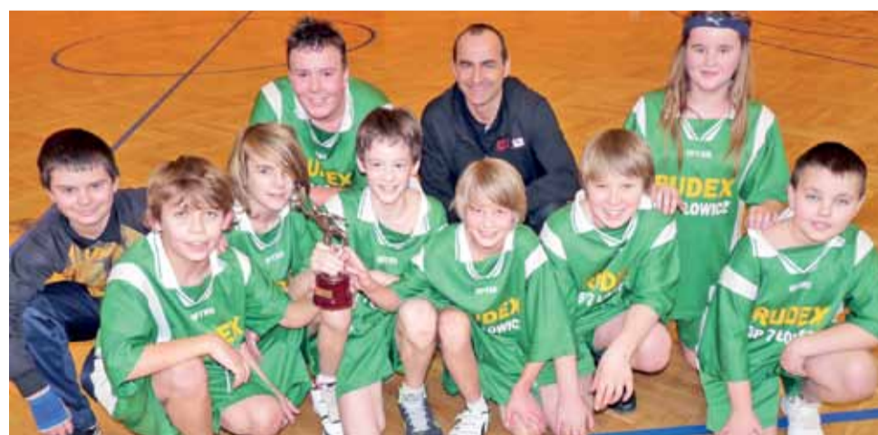
Ekipa reprezentująca SP 7 Łowicz okazała się najlepszą na Ziemi Łowickiej.