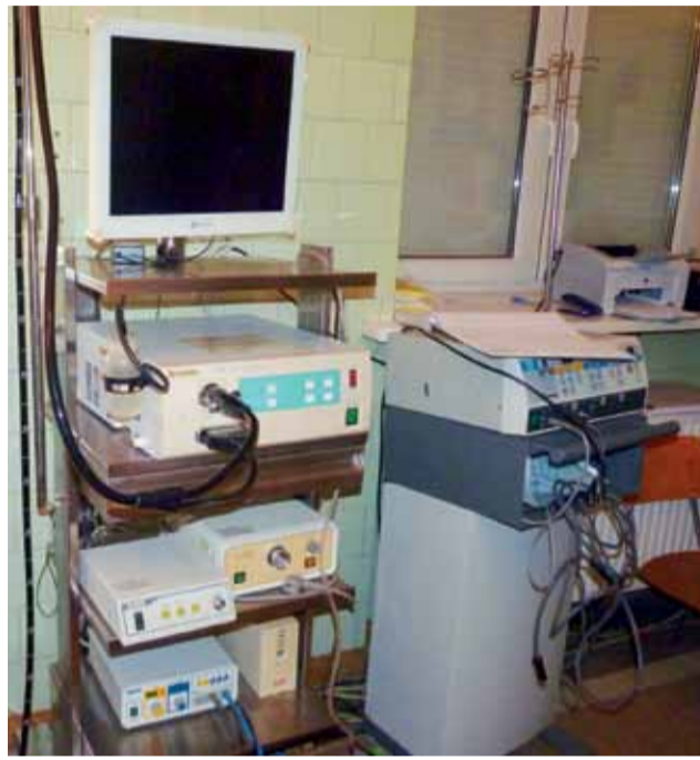
Szpital dysponuje 2 kolonoskopami, dlatego mógł stracić się o kontrakt.

Szpital łowicki posiada 2 nowoczesne aparaty do badania, a to było niezbędne przy staraniu się o kontrakt. Jeden z nich zakupiony został w 2007 roku przez samorząd miasta i przekazany