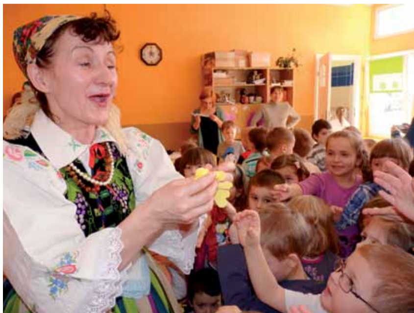
Kwiaty wykonane przez Teresę Wojdę chcieli otrzymać każde dziecko.