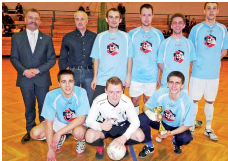
Puchar Burmistrza Łowicza wywalczyła w tym sezonie ekipa Blokiersów-Intermarche Łowicz.