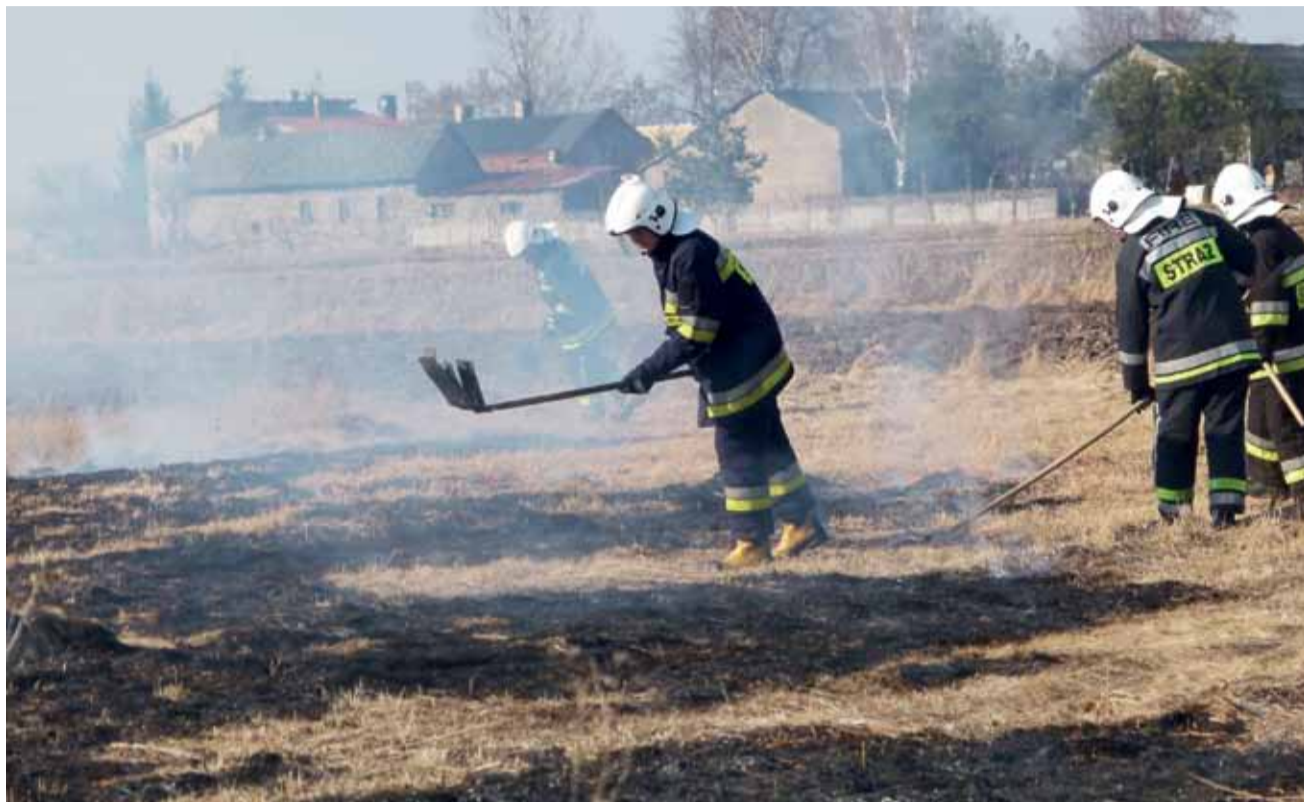
Wypalanie zaczęło się wszędzie. Tych strażaków sfotografowaliśmy przy gaszeniu pożaru w Woli Lubiankowskiej w gminie Głowno.