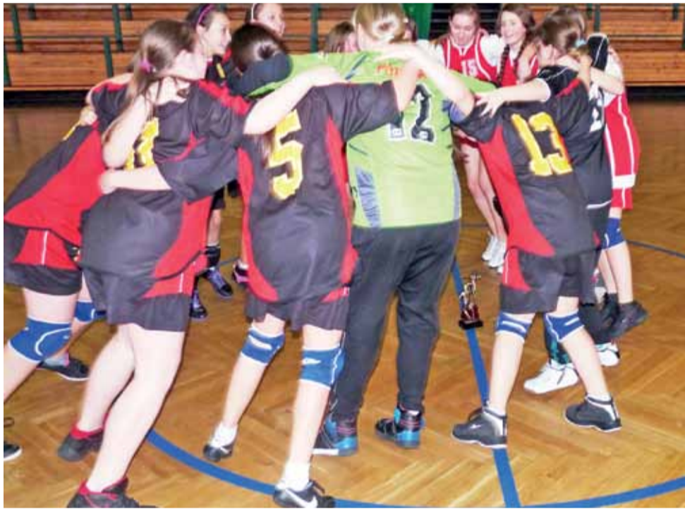
W finale dziewczęta z Czwórki minimalnie wygrały z SP 2 Łowicz, a na koniec odtańczyły wspólny taniec.