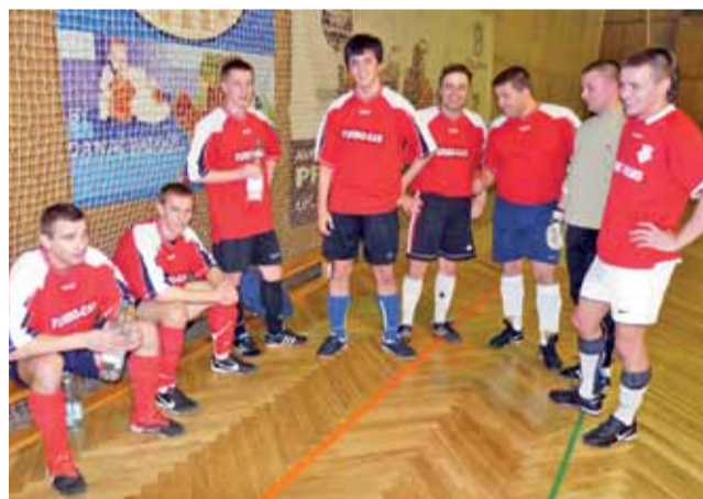
Ekipa Gutenowa straciła przed sezonem sponsora, ale nie przeszkodziło to jej awansować.