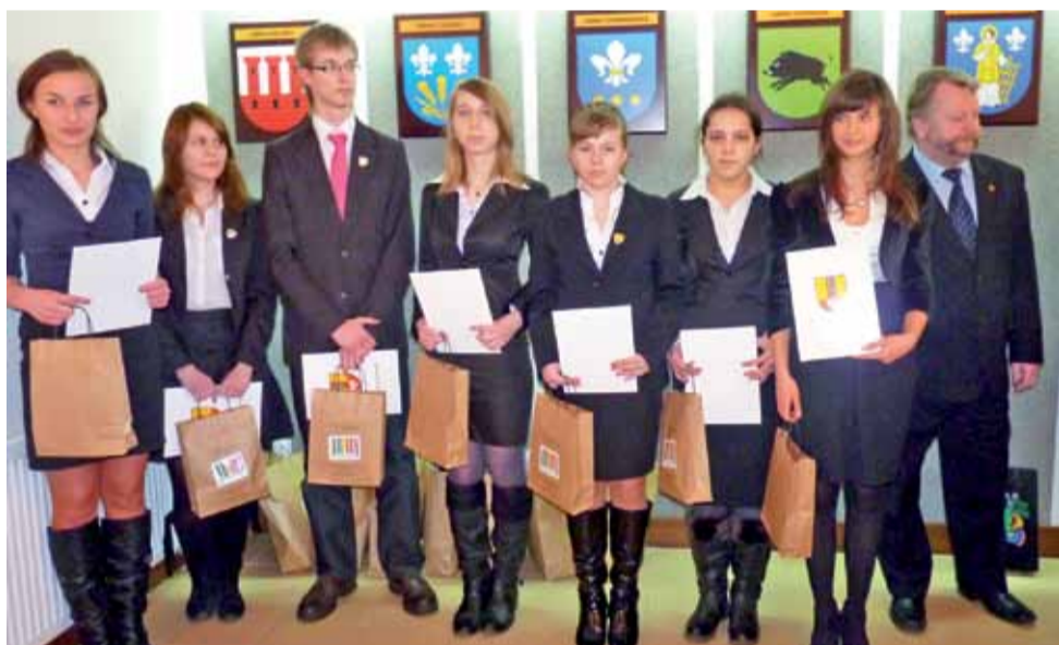
Stypendyści starosty otrzymali dyplomy, upominki, ale przede wszystkim gratulacje.

ków obsługi. Do uchwały radni otrzymali 11-stronicowe materiały, w których znalazł się wzór umowy w sprawie przekazania szkoły stowarzyszeniu oraz uzasadnienie uchwały, które przedstawia aspekt finansowy jej funkcjonowania oraz sytuację demograficzną. Wynika z niej, że w obwodzie szkoły w kolejnych latach rodziło się od 4 do 16 dzieci, a przy tak małej liczbie dzieci samorząd gminy nie podał finansowo w utrzymaniu szkoły. Obecnie koszt działania szkoły na 1 ucznia wynosi ponad 17 tys. zł, przy subwencji oświatowej w granicach 9 tys. zł. Możliwość zatrudnienia nauczycieli na podstawie Kodeksu pracy znacznie obniży te koszty. mwk