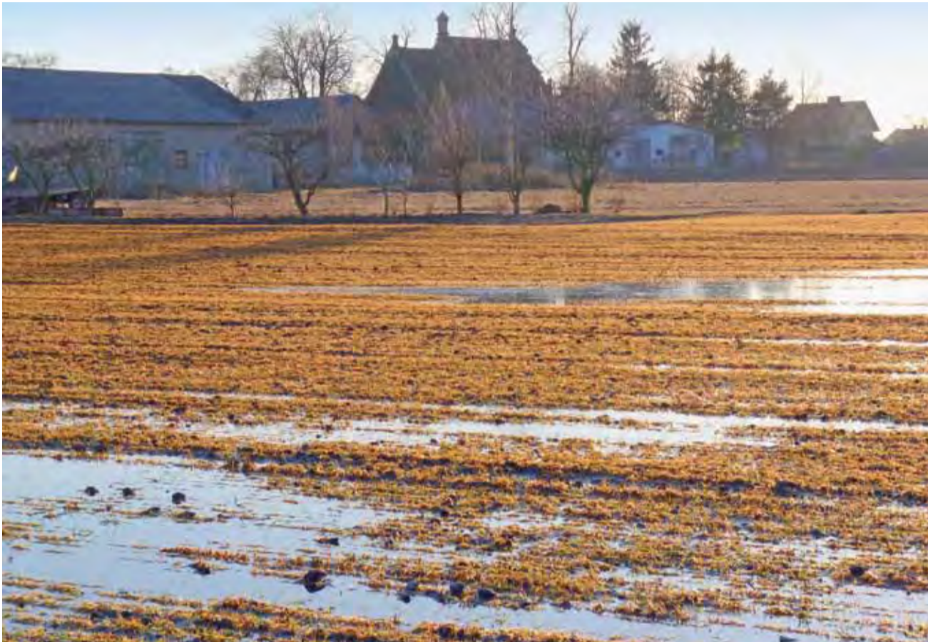
Uprawa pszenżyta w Trzemesznie w gminie Bielawy. Zboże jest mocno żółknięte.

Rolnictwo | Uprawy ozime zagrożone po mrozach