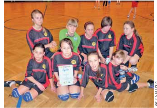
Szczypiornistki z SP 4 Łowicz kończyły w „minorowych” nastrojach.