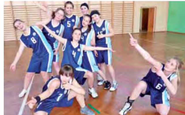
Uzasadniona radość łowiczank po zwycięstwie w Sieradzu...