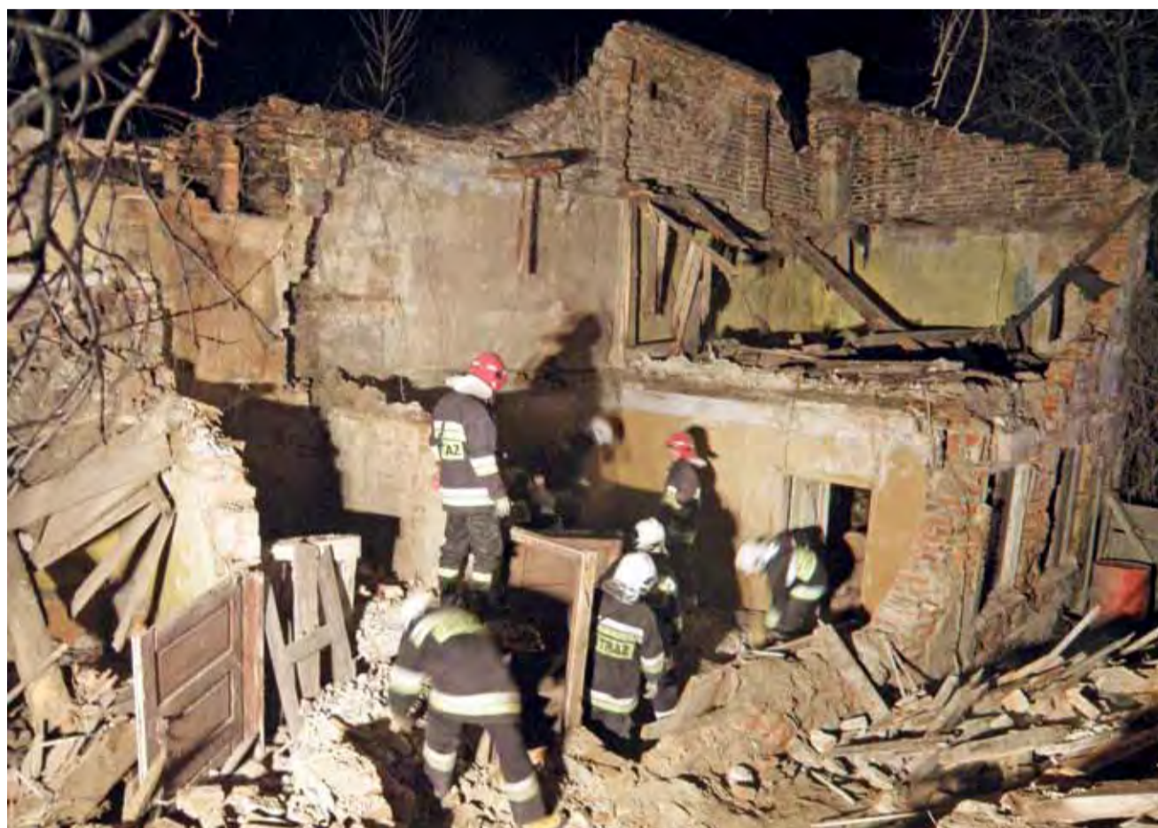
Strażacy musieli dokładnie, kilkakrotnie przeszukać gruzy, by upewnić się, że nie ma tam ludzi.

ISSN 1231-479x | INDEKS 326097 (dot. RUCH)