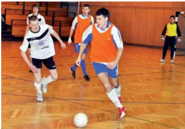
W meczu na szczycie Zatorze II walczyło do końca o zwycięstwo z młodymi Wilkami.