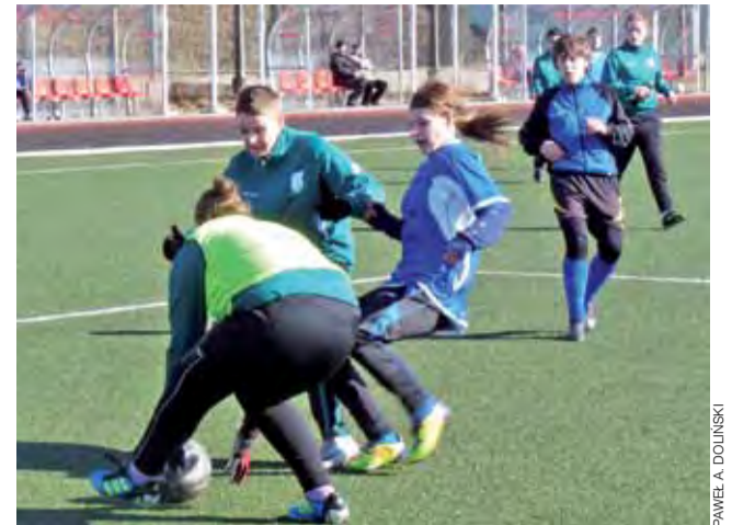
Piłkarki łowickiego Pelikana nie zdołały obronić się przed atakami rywalk z Opczna i ostatecznie mecz z Ceramiką zakończył się remisem 1:1.