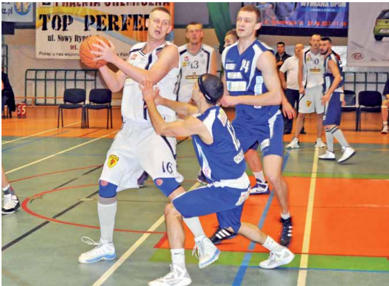
Młodzi koszykarze gorzowskiego GKK „napsuli sporo krwi” naszym graczom, ale mecz zakończył się jednak kolejnym zwycięstwem Księżaka.

Koszykówka | 22. kolejka II ligi męskiej