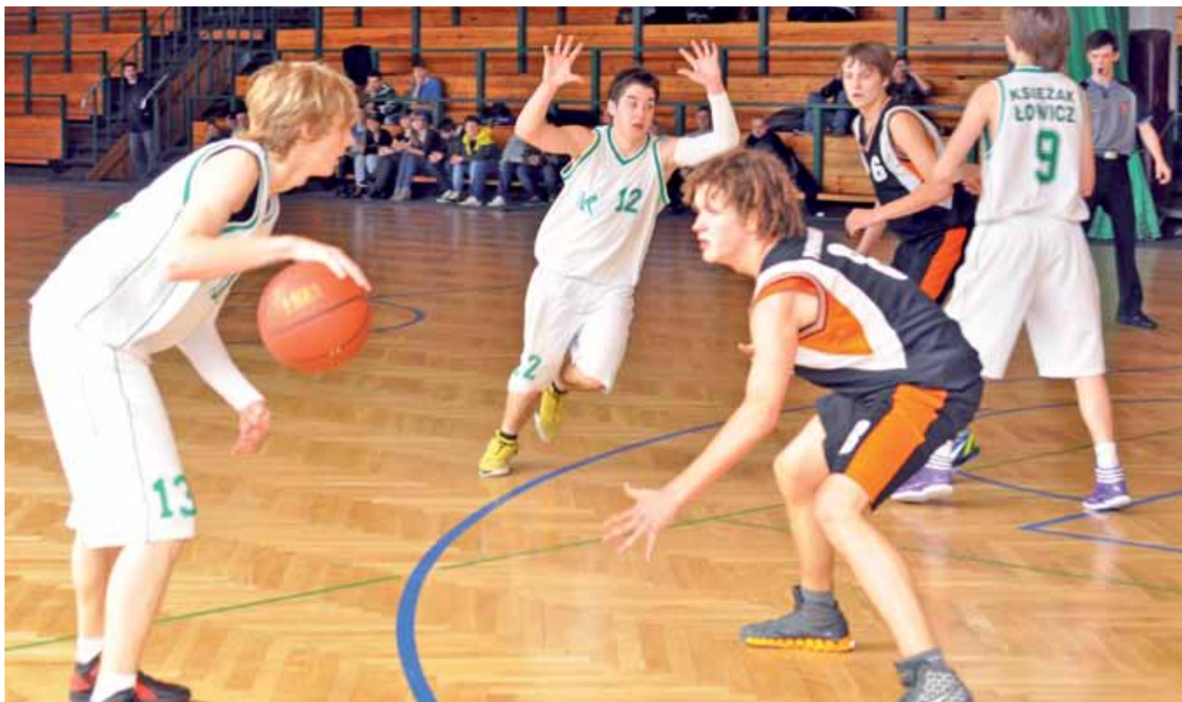
Kadeci łowickiego Księżaka odnieśli zdecydowane zwycięstwo w meczu z PKK 99 Pabianice i są teraz bardzo blisko awansu do ćwierćfinałów MP.

Koszykówka | 4. kolejka finałów wojewódzkiej ligi kadetów U-16 o miejsca 1-6