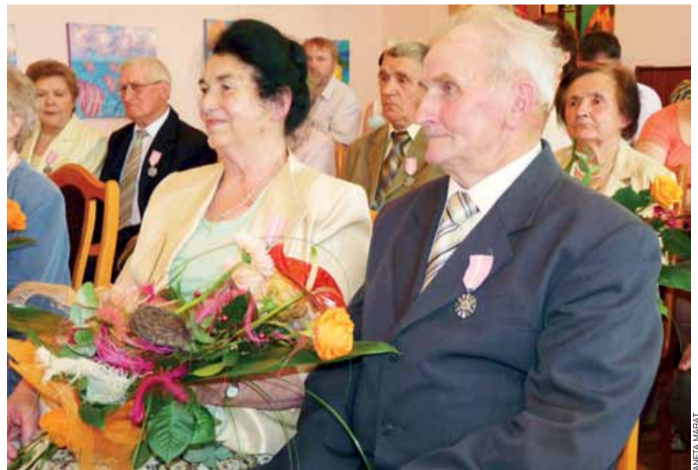
Państwo Kroć przeżyli ze sobą 50 lat. Są dumni i szczęśliwi, że udało im się doczekać takiego jubileuszu.

Po podziękowaniach wójt gminy Andrzej Werle wręczył