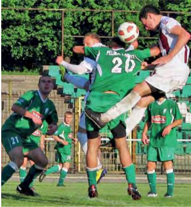
W meczu Garbarnia – Pelikan ostatecznie bez goli.