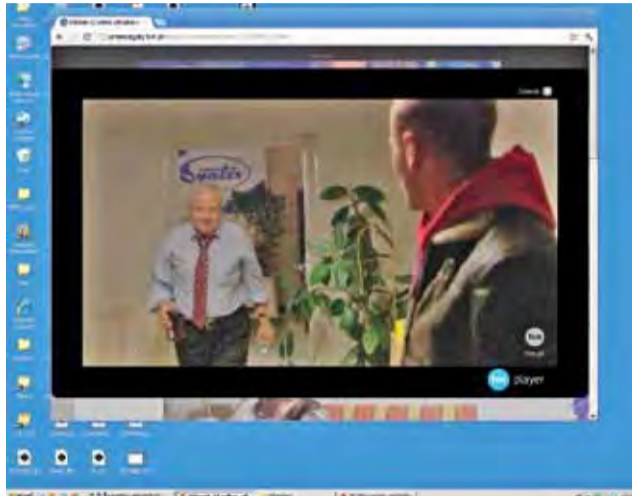
Dwunasty odcinek serialu Prawo Agaty można było obejrzeć w ostatnią niedzielę w TVN. Cały czas można jeszcze obejrzeć go w Internecie.

Skąd więc takie oburzenie części mieszkańców? Osobom, które nie oglądały serialu należy się wyjaśnienie, że została w nim pokazana historia młodej dziewczyny molestowanej