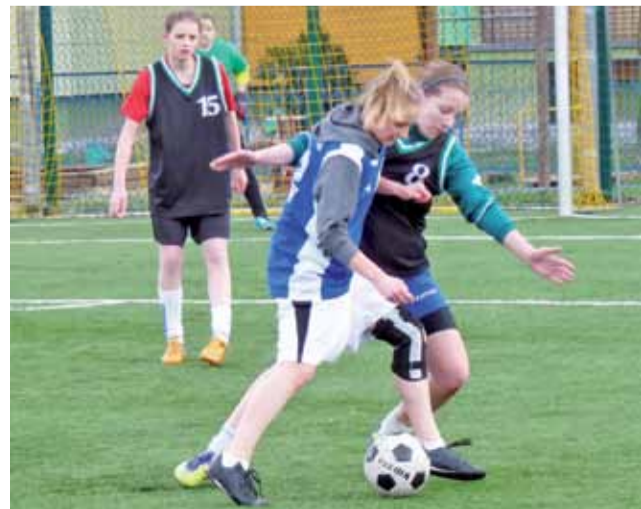
W meczach dziewcząt nie brakowało ciekawych zagrań...