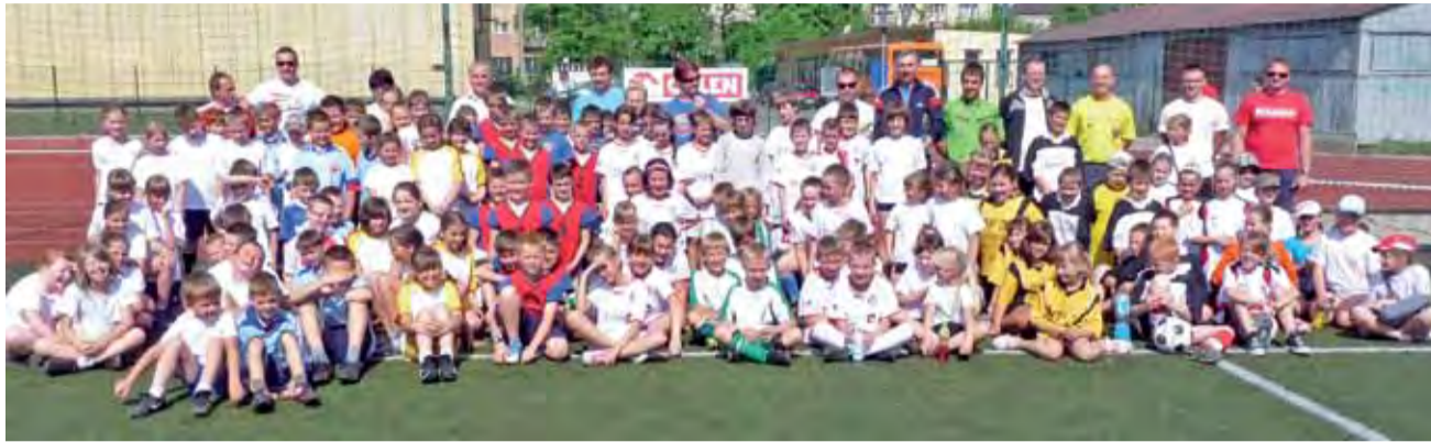
W finale powiatowym wystartowało w tym roku trzynaście zespołów złożonych z dziesięcioletnich dziewcząt i chłopców.