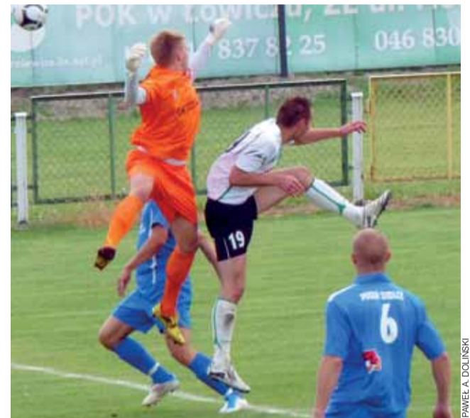
Punkt z nutką goryczy, ale Pelikan nadal nie jest pewny utrzymania się w II lidze.