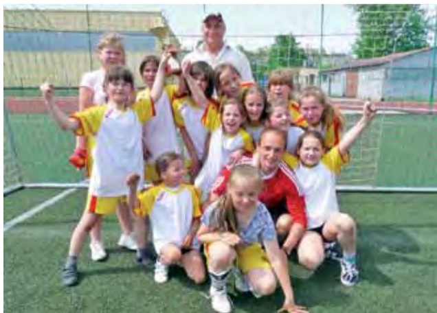
Najlepsze wśród dziewcząt okazały się uczennice SP Bielawy.