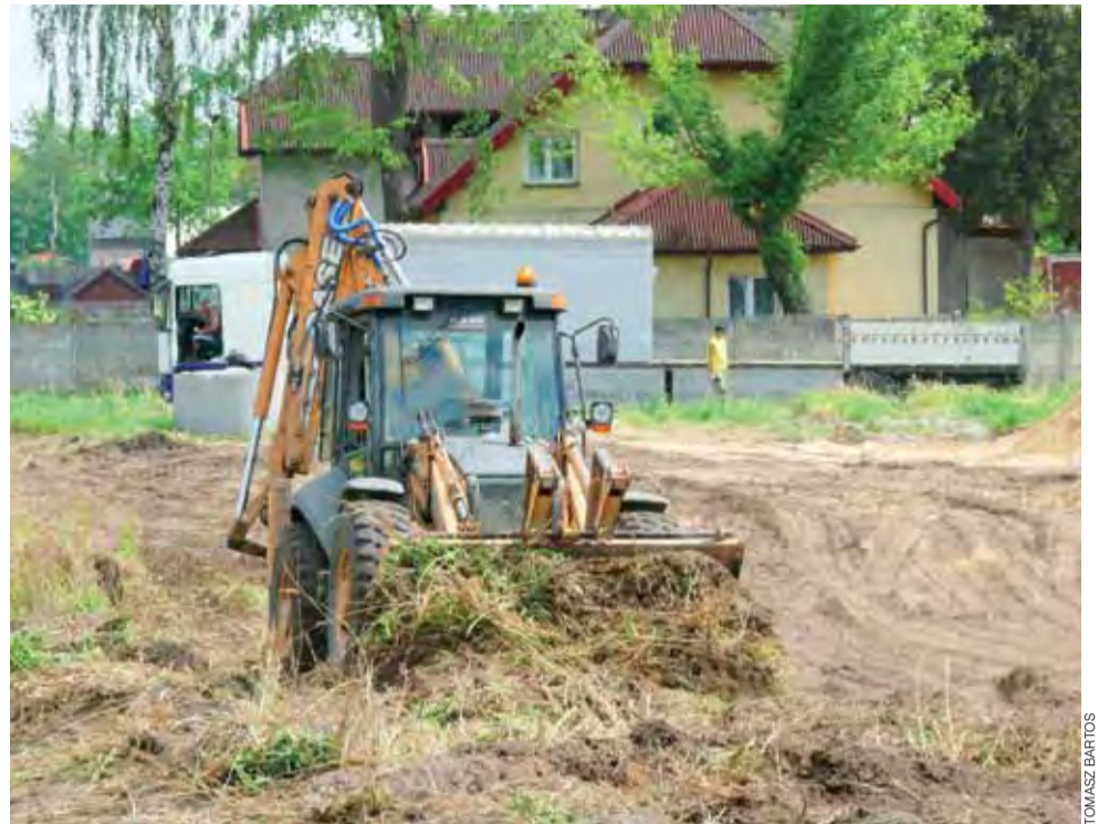
W ubiegłym tygodniu rozpoczęły się prace przy budowie marketu MarcPol na os. Górkach, jego otwarcie jest zapowiadane pod koniec roku.

Najwięcej marketów znajduje się w stolicy i wokół niej. Najbliższe Łowicza są w Błoni, Żyrardowie, Sochaczewie, Płocku i Gostyninie. tb