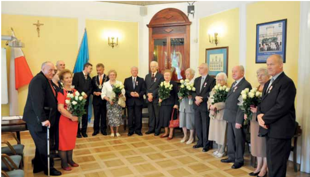
Siedem szczęśliwych par, które świętowały swój jubileusz 50-lecia w minioną sobotę.