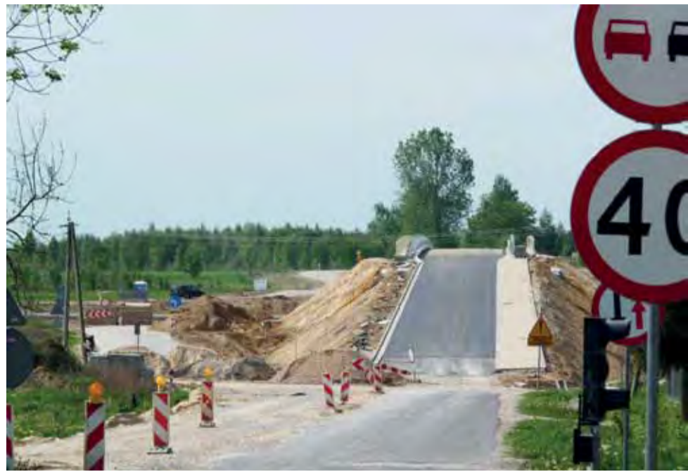
Strykowski odcinek autostrady A-2. Widok na wiadukt łączący Nowostawy Górne z Niesułkowem. Jest chodnik, tak jak chcieli mieszkańcy.

Na koniec informacja z wczoraj o kolejnym osiągnięciu rządzącej nami ekipy. W ocenie specjalistów z Unii Europejskiej Polska spadła o kolejne miejsce w ocenie systemu ochrony zdrowia i teraz jest klasyfikowana na 27. pozycji wśród 33. ocenianych państw (m.in. za Litwą i Słowacją). Kiedyś Urban twierdził, że rząd sam się wyżywi, teraz jego następcy mogą powiedzieć, że rząd, jak będzie trzeba, to się wyleczy, choćby za granicą, bo przecież zdrowko rządu dobrem narodowym. A reszta? Mniejsze obciążenie dla ZUS-u i robota dla grabarzy. ■