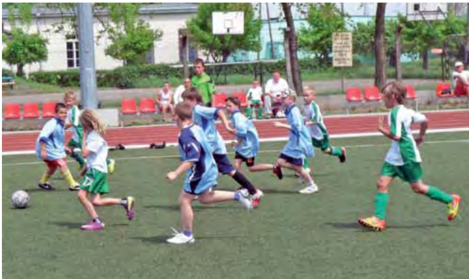
Finałowy mecz chłopców zakończył się zdecydowanym zwycięstwem graczy Pelikana.