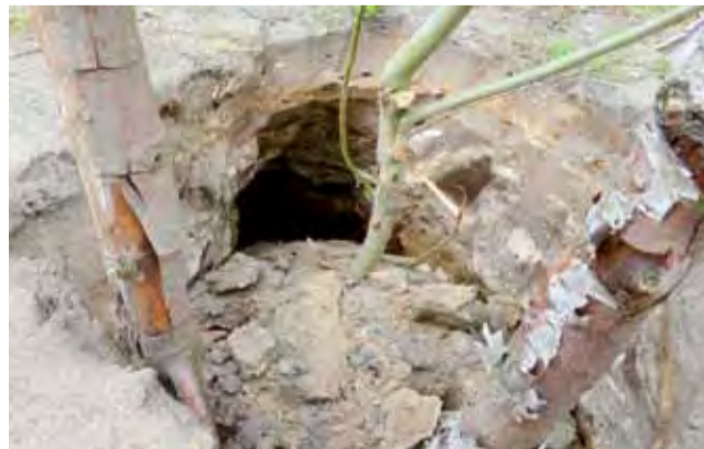
Zapadłisko w drodze, jest głębokie, dodatkowo rozchodzą się od niego tunele wprost pod drogę.