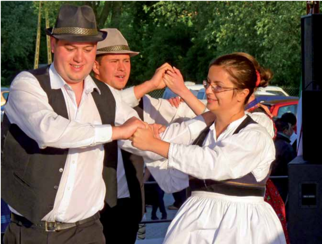
Grupa Sarkalab przyjechała z Rumunii. Zespół powstał w 1995 roku przy Liceum Ogólnokształcącym Apáczai Csere János. Zajmuje się kultywowaniem tradycji węgierskich z rejonu Siedmiogrodu.

Inne wiadomości ze świata kultury znajdziesz na str. 28-30