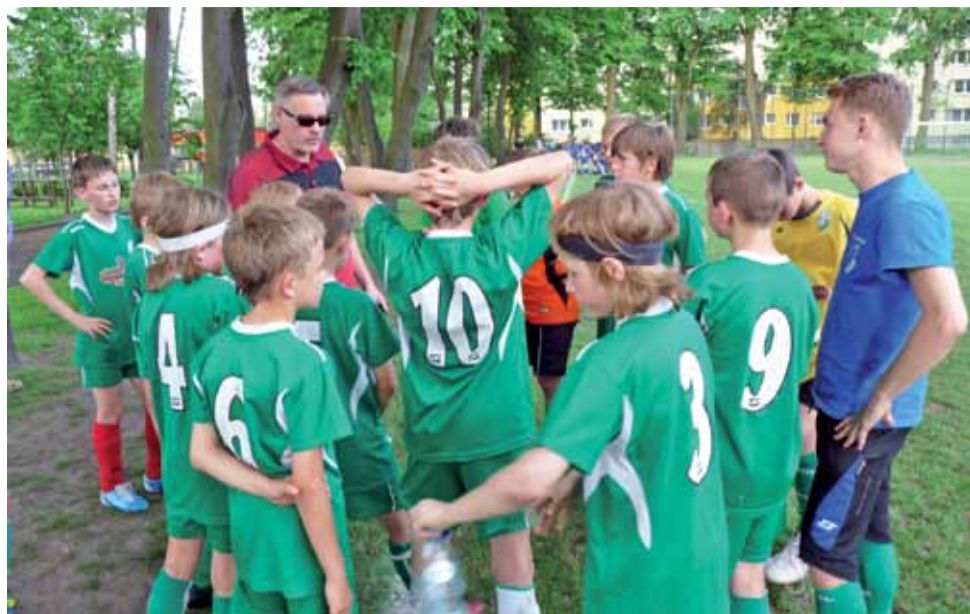
Drużyna orlików łowickiego Pelikana zapewniła już sobie tytuł mistrzów okręgu skierniewickiego.

11. kolejka ligi okręgowej Górskiego (rocznik 1999):