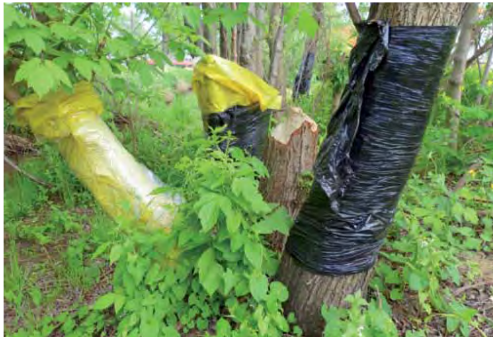
Ratując wierzyby rosnące wzdłuż brzegu Uchanki mieszkańcy owinęli pnie foliowymi workami, ale bobry stojące na tylnych łapach są w stanie ściąć drzewa ponad nimi.