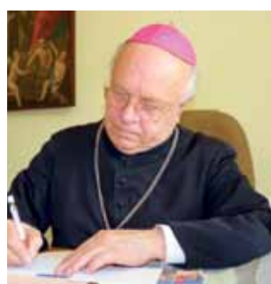
Biskup Józef Zawitkowski

W niedzielę 20 maja mija pół wieku od święceń kapłańskich biskupa Józefa Zawitkowskiego.