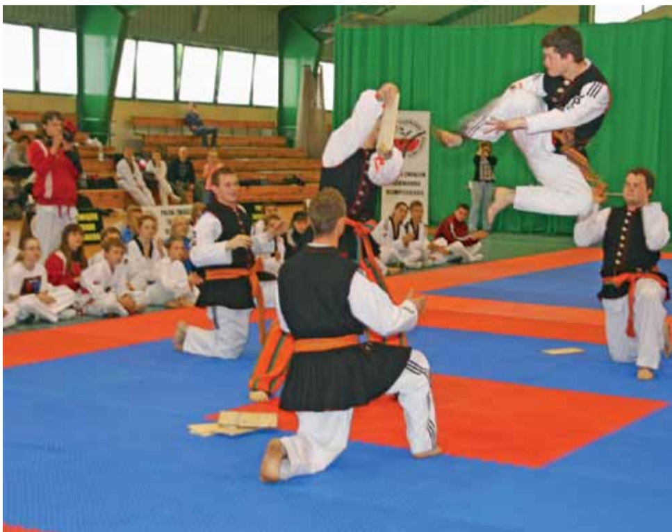
Bardzo efektowny pokaz zawodników Łowickiej Akademii Sportu w strojach ludowych...

Bardzo fajnym pomysłem organizatorów na promocję folkloru łowickiego był pokaz umiejętności zawodników Łowickiej Akademii Sportu w strojach ludowych podczas uroczystego otwarcia mistrzostw. Ciekawe były także występy zespołu Dance Step ze Stachlewa oraz