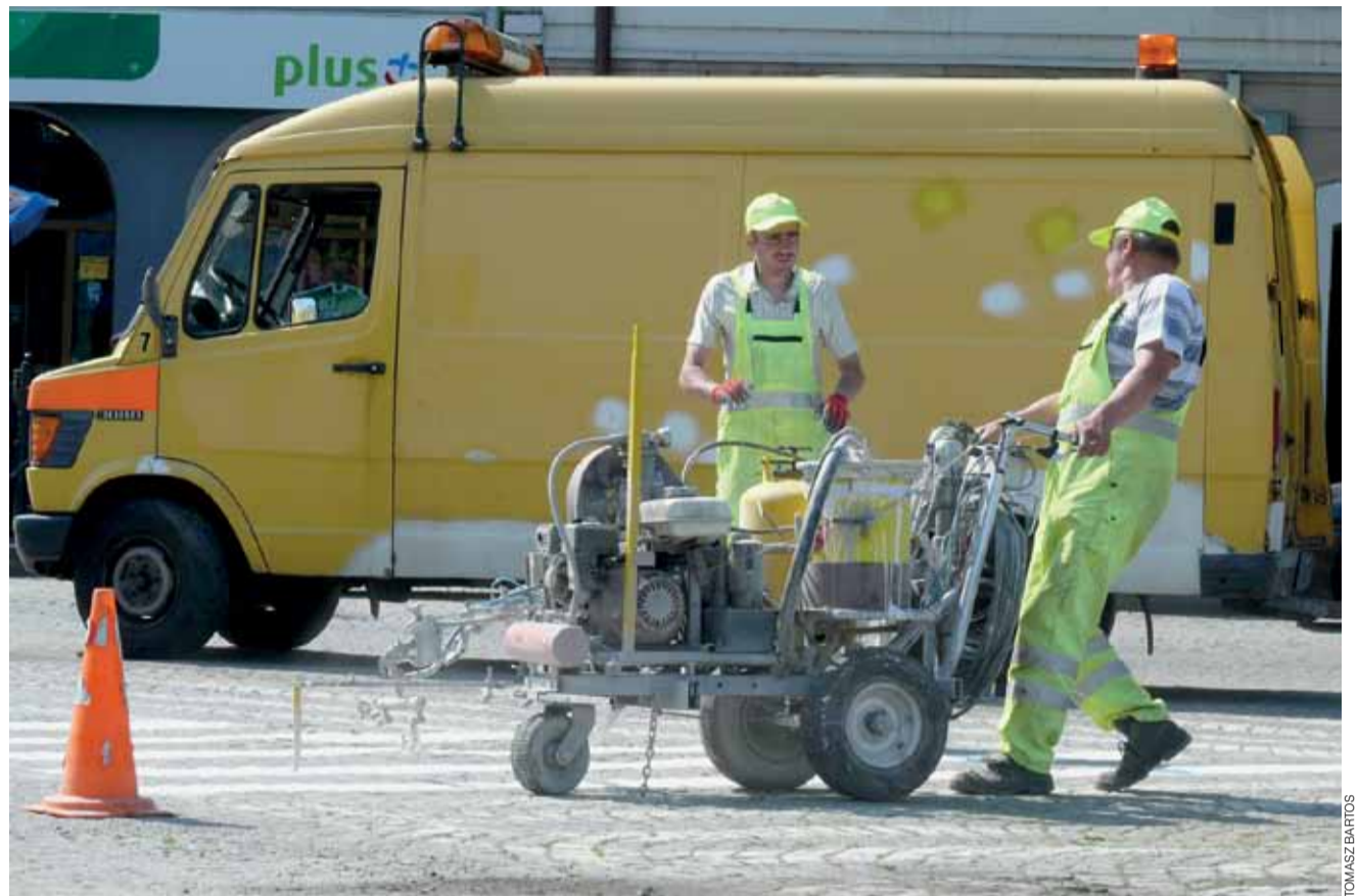
Malowanie pasów na Starym Rynku, to tylko część prac zleconych przez Zakład Usług Komunalnych zgierskiej firmie Dromal. W sumie ma ona pomalować powierzchnię równą 5,5 tys. m 2 .

■ Tego samego dnia o godz. 23.15 w Chruslinie na drodze Łowicz - Bielawy, mężczyzna kierujący Starem wjechał do przydrożnego rowu. Kierowcą był 53-letni mieszkaniec gminy Piątek. Był trzeźwy. jr