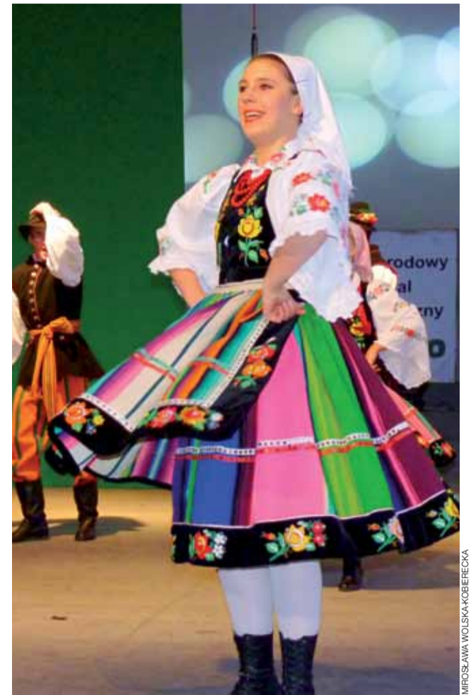
Występ najmłodszego zespołu łowickiego był dla łowiczaniek miłą niespodzianką. Wielu jego członków to doświadczeni tancerze i śpiewacy.

Łowicz | Impresje z koncertu na Błoniach