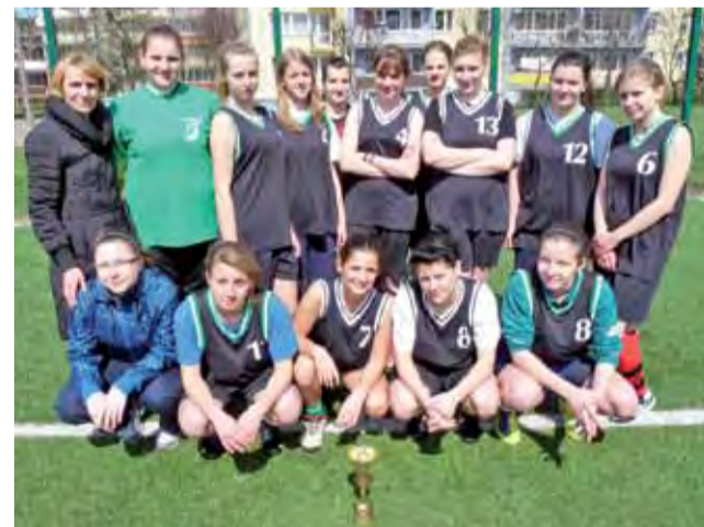
Piłkarki z Ekonomika wygrały eliminacje powiatowe w futbolu.