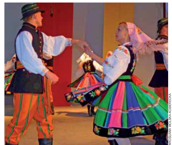
Drugie wejście zespołu Bańdurka, w strojach łowickich, odbyło się pod koniec imprezy.