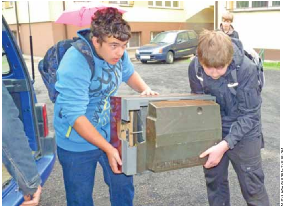
Gimnazjaliści pomagali w rozpakowaniu przywiezionego sprzętu. Było to tym bardziej wskazane, że w większości były to ciężkie telewizory.

Aura Eko zaprosiła też całą grupę na 15 czerwca do Centrum Nauki Kopernik w Warszawie, na podsumowanie konkursu. Niezależnie od tego, czy łowiczanie zajmą w konkursie czołowe miejsce, organizator akcji funduje im wejściówki do Centrum. mwk