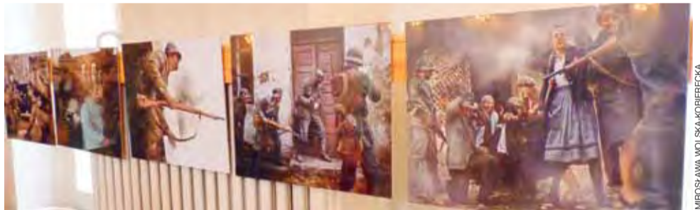
Zdjęcia inspirowane oryginałami z 1939 roku przypominają stylizacją grafikę współczesnych gier komputerowych lub hollywoodzkich produkcji.

Łowicz | Niezwykła wizyta francuskiego gościa w czasie próby zespołu