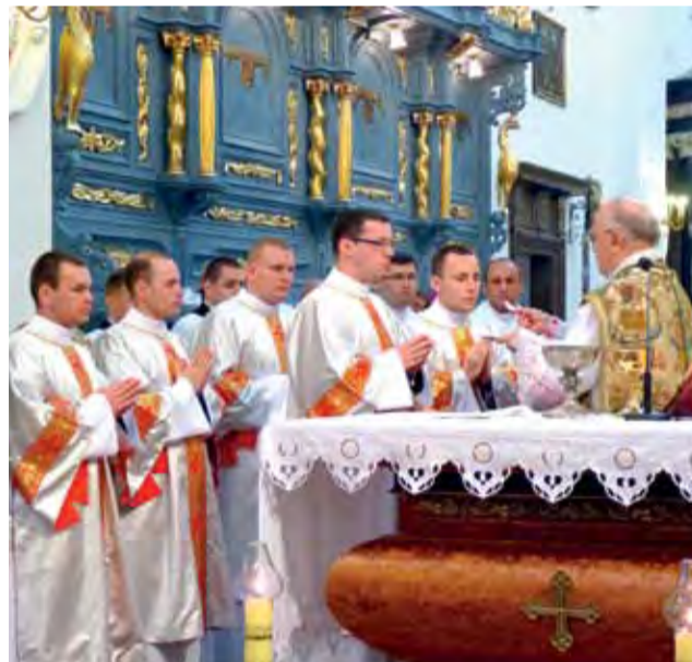
Bp. Józef Zawitkowski udziela nowo wyswięconym diakonom sakramentu Eucharystii.

5 alumnów V roku Wyższego Seminarium Duchownego w Łowiczu przyjęło 12 maja w łowickiej katedrze święcenia diakonatu z rąk bp. Józefa Zawitkowskiego.