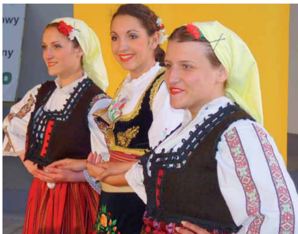
Tak wyglądały członkinie zespołu Soko z Indjija, który działa od 20 lat i w sumie liczy 200 członków.