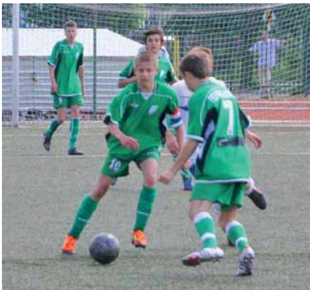
Łowiczanie z Pelikana-96 rozegrali najsłabszy mecz w sezonie.

Po zmianie stron obraz gry nie zmienił się. Gospodarze dominowali na boisku, ale Pelikan czasami zapędzał się w okolice pola karnego. Nasi piłkarze mieli kilka okazji do oddania strzału z dystansu, jednak nie decy-