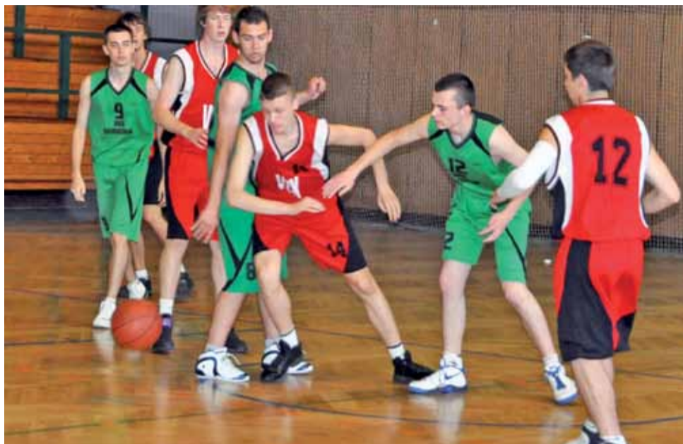
Największą szansę na zwycięstwo łowiczanie mieli w pojedynku z Ogrodnikiem Sochaczew.

Łowiczanie okazali się bardzo gościnni i przegrali swoje trzy pojedynki, zajmując ostatecznie ostatecznie miejsce w gronie czterech zespołów. W swoim pierwszym meczu Księżacy byli wyraźnie gorsi od ekipy ze Skierniewic i przegrali 36:58. Jak się później okazało eki-