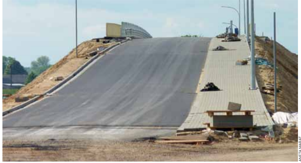
Wiadukt w Łyszkowicach na tzw. Chruślance nabiera wyglądu z każdym dniem.