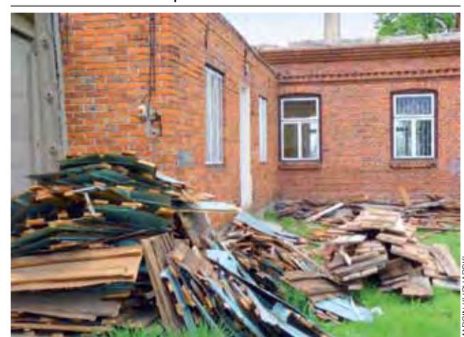
Od zdjęcia dachu z całego budynku rozpoczął się remont starej remizy Ochotniczej Straży Pożarnej w Krubinie w gminie Sanniki. Prowadzi go Przedsiębiorstwo Budowlano-Montażowe Budmont z Włocławka. Remont jest dofinansowany pieniędzmi pozyskanymi przez gminę w Urzędzie Marszałkowskim w Łodzi. Świetlica ma być oddana do użytku jeszcze przed sezonem zimowym. mak