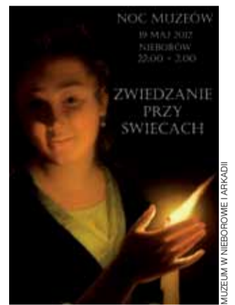
Plakat zapowiadający Noc Muzeów w pałacu w Nieborowie. td

W czasie zwiedzania damy oprowadzające zwiedzających będą czytały fragmenty historycznych zapisków dotyczących Nieborowa, odkrywając przed