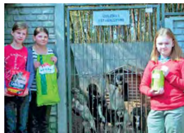
Uczennice z Kóło Wolontariatu działającego przy szkole na Bratkowicach w Łowiczu, wraz ze swoim opiekunem, zawiozły do łowickiego schroniska karmę dla psów i kotów. Mogły to zrealizować dzięki pieniądзом uzyskanym ze sprzedaży kart i dekoracji świątecznych. jr