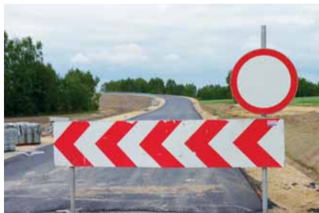
Przy wjeździe na wiadukt w Seligowie postawiono znak zakaz ruchu. Do wykonania pozostały tam chodniki.

Salon Play Kaufland, Łowicz ul. Starzyńskiego 10-12