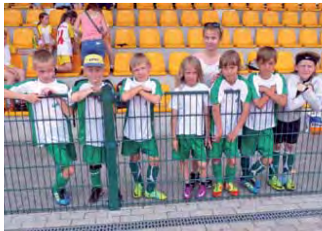
Młodzi piłkarze Pelikana wygrali wysoko wszystkie swoje mecze...