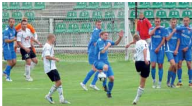
Piłkarze łowickiego Pelikana już po raz szósty z rzędu nie zdołali strzelić ani jednego gola w meczu II ligi.