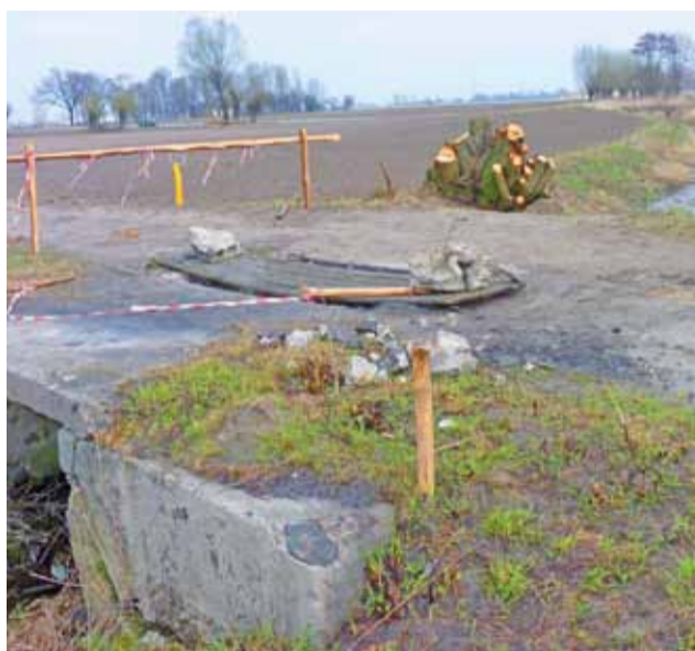
Przepust został naderwany już na początku kwietnia.