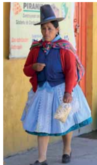
Kapelusze na głowach i tobołki na plecach – po tym można z daleka rozpoznać indiańskie kobiety z Peru.

Las Blondynas piszą z podróży | Etap VI: Wysoko w Andach