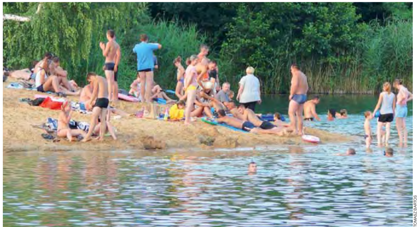
Na zbiorniku w sąsiedztwie Guźni jest tylko jedno miejsce, które przypomina plażę. Każdego dnia jest ono oblegane głównie przez młodzież, reszta kąpiących rozkłada koce wśród drzew i krzewów.

Na zalewie w Ziemiarach pod Bolimowem nawet w niedzielę,