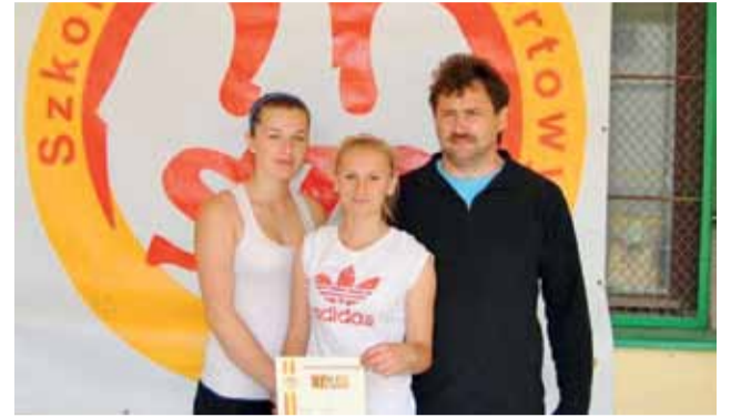
Siatkarki Asika Domaniewice zajęły 5-6. miejsce w Łodzi.