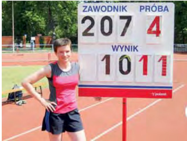
Łowiczanka wywalczyła złoto w pchnięciu kulą.