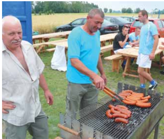
Za nami kolejny udany piłkarski turniej połączony z piknikiem

drużyn, chcieliśmy nawet tę kategorię w tym roku zlikwidować, bo w poprzedniej edycji turnieju były tylko dwie drużyny z Wejśc i Ostrowca – powiedział