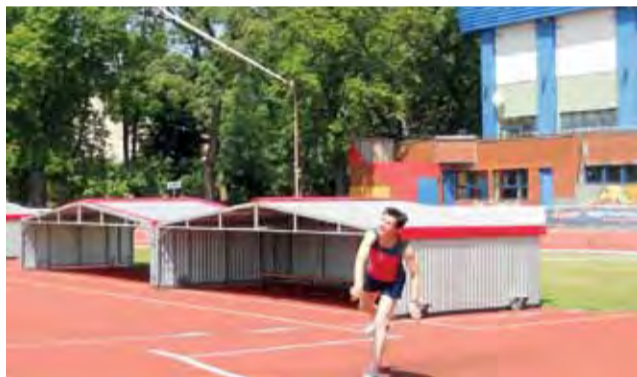
Okazała się także najlepszą w konkursie rzutu oszczepem.