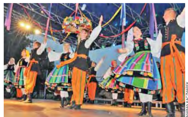
W koncercie galowym Bańdurka zachwyciła jury i publiczność.

W najbliższych planach zespół ma przygotowanie do 14. Międzynarodowego Festiwalu Folklorystycznego Świętego Istvana w Rumunii, który odbędzie się 15 sierpnia. am