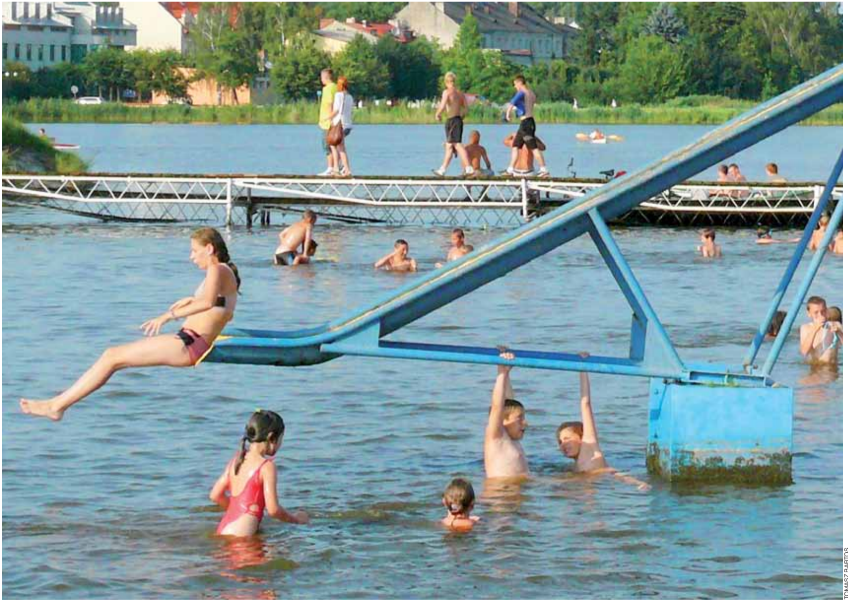
Jedyną atrakcją dla kąpiących się dzieci nad zalewem Mroźyczka w Głownie jest zjeżdżalnia. Dzieci mogą też posiedzieć na plaży, drewnianym pomoście czy betonowym falochronie.