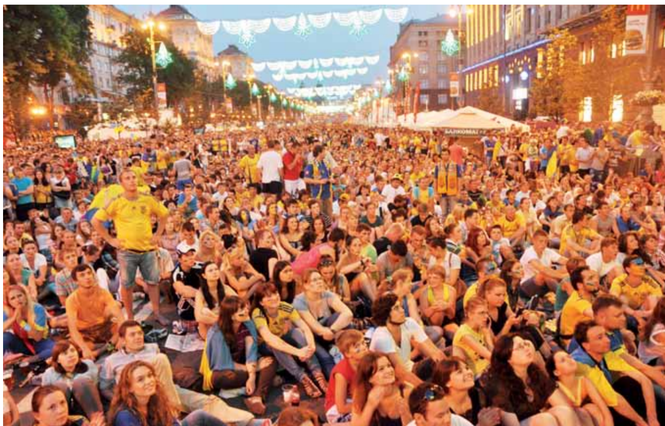
Strefa kibica na Majdanie Niezależności w Kijowie. Kibice, głównie Ukraińcy zebrali się aby obejrzeć na telebimach mecz Ukraina - Anglia.