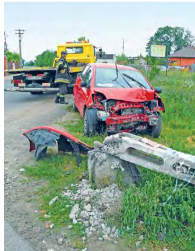
Toyota Yaris, którą prowadziła nietrzeźwa mieszkanka gminy Sanniki, uderzyła w słup, powodując jego złamanie.

Przybyły na miejsce Zespół Ratownictwa Medycznego zabrał kobietę do szpitala z podejrzeniem wstrząsu mózgu, jednak nie została hospitalizowana, opuściła go na własne życzenie. Na miejscu, oprócz policji, interweniował zastęp z Państwowej Straży Pożarnej oraz 2 zastępy z OSP z Kiernozi. tb