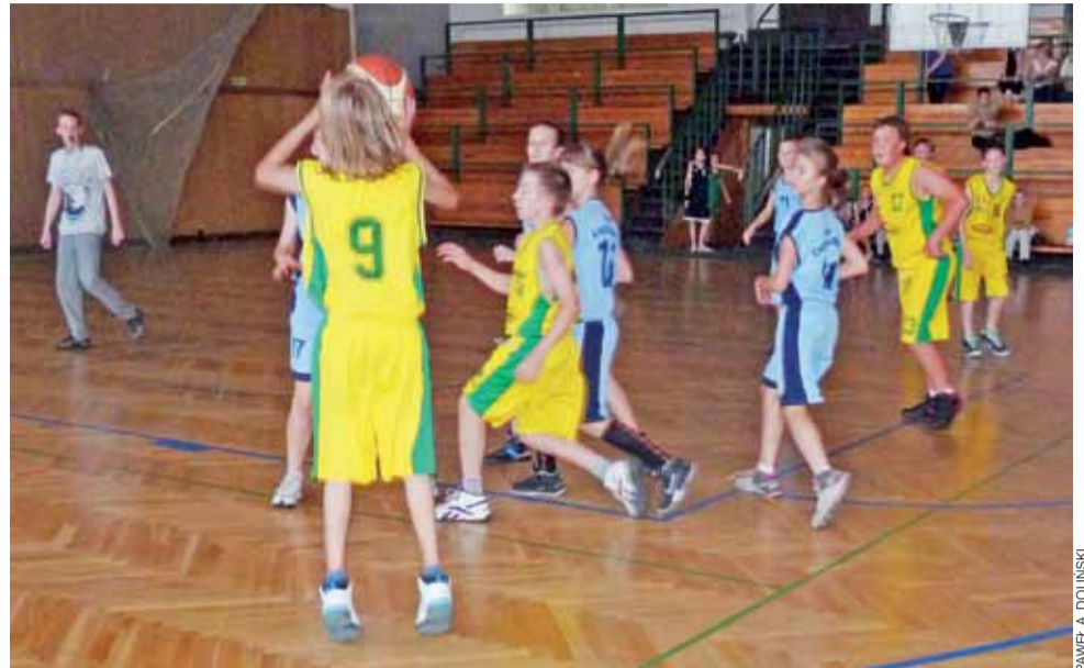
Na zakończenie sezonu rozegrany został mecz młodziczek i młodzików, a tym razem wygrali chłopcy.

Z kolei w sekcji kobiecej warto podkreślić dobre siódme miejsce naszego zespołu w rozgrywkach II ligi (trener Doliński). Rok wcześniej łowiczanki zajęły jedenastą pozycję. Ponadto szóste miejsce w lidze