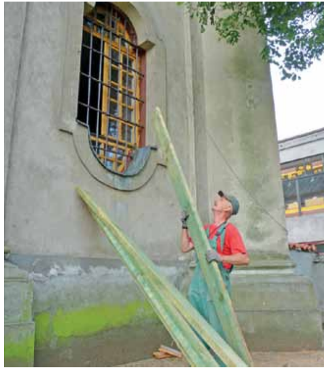
Pracownicy firmy Budowa rozpoczęli wymianę belek w zachodniej wieży z początkiem lipca.

w wysokości 400 tys. zł. Tyle samo MKiDN przyznało na zabezpieczenie fresków znajdujących się we wnętrzu świątyni. Dotacja pokryje 80% kosztów w przypadku każdego z tych dwóch przedsięwzięć. Pozostałą część, łącznie 200 tys. zł, pijarzy muszą pozyskać we własnym zakresie. Zakonnicy zebrali już połowę potrzebnych pieniędzy. Pochodzą one głównie z ofiar wiernych i z oszczędności łowickiego domu zakonnego. Trzeba jednak uzbierać jeszcze 100 tys. zł. Dlatego pijarzy liczą na ofiarność wiernych. Zakonnicy chcą, by prace zakończyły się przed jesienią. Wymagają tego warunki umów, które podpisali z przedstawicielami ministerstwa kultury. jr