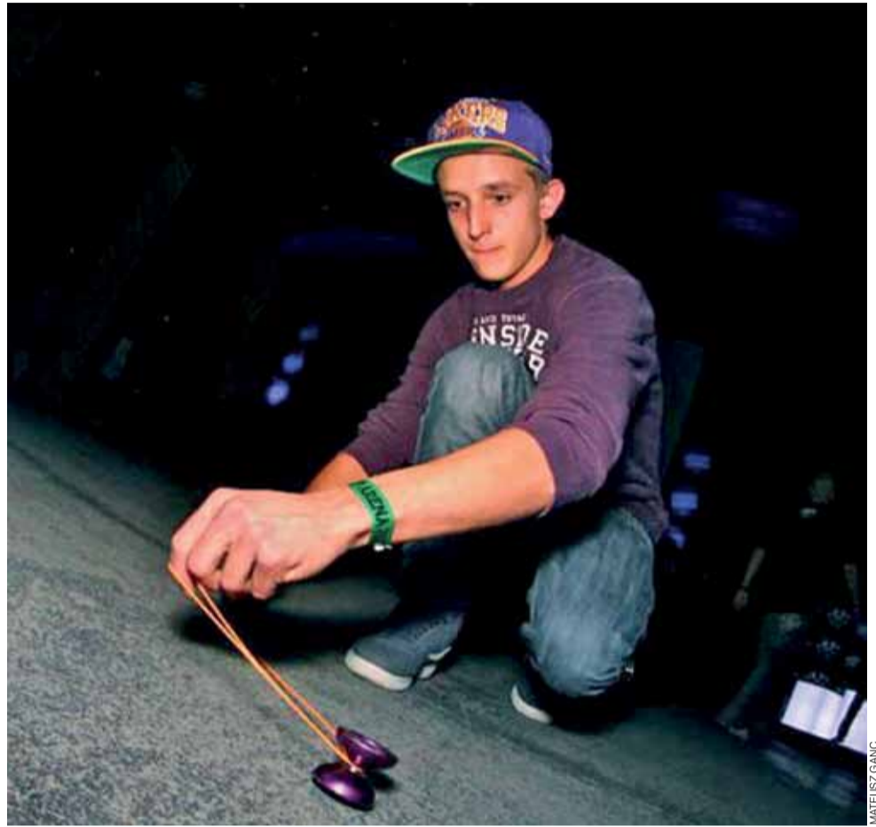
Łowicki mistrz YoYo prezentuje doskonałą technikę i efektowne triki.

■ Czy swoja przyszłość wiążesz z YoYo, czy da się z tego żyć?