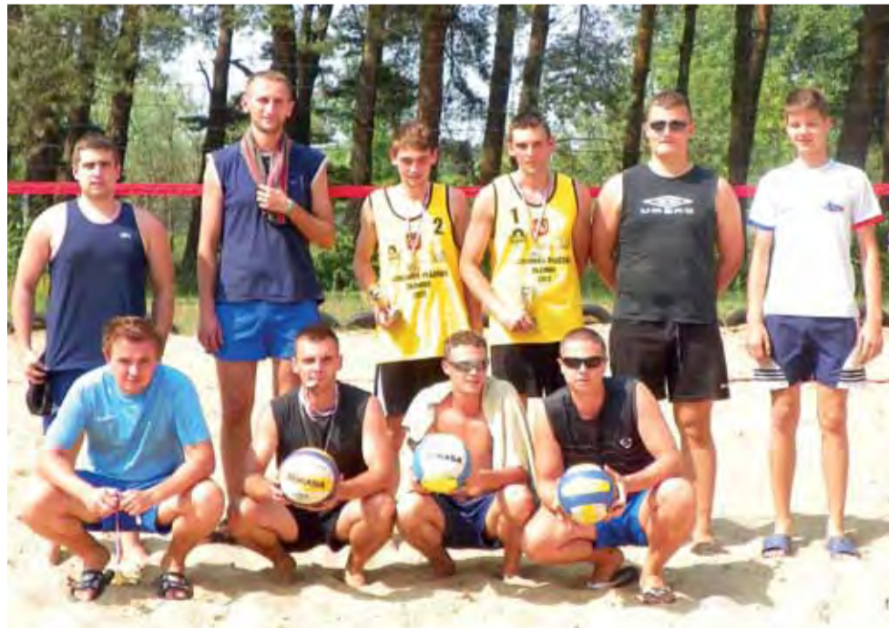
Dobre warunki, niezły poziom i doskonała pogoda – czego można chcieć więcej.