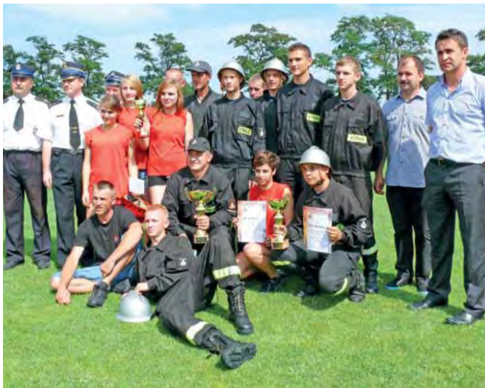
Druhny i druhowie z Karsznic, którzy w zawodach gminnych OSP wywalczyli miejsca na podium, wspólnie z władzami straży i gminy Chąsno.

Ćwiczyliśmy 1,5 tygodnia przed zawodami na naszych ławkach zarówno bojówkę, jak i sztafetę. W sobotę wieczorem, czyli przed samymi zawodami, przyjechaliśmy na boisko w Chąśnie, by jeszcze dodatkowo wszystko przećwiczyć i jak widać dało to efekt. Sam start w zawodach był ciężki, głównie ze względu na pogodę. Z sukcesu cieszymy się bardzo, bo w roku minionym nie zajęliśmy pierwszego miejsca – choć zawsze jesteśmy w czołówce.