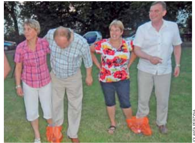
W konkursach startował także wicewojewoda (z prawej).

Na wszystkich czekała niespodzianka w przerwie w postaci pizzy przygotowanej przez pizzerię Da Grasso. W tym roku turniej odbył się bez wsparcia ratusza, pomogli sponsorzy: łowicka firma Cewokan i Bioenergy Project sp. z o.o. z Rawy Mazowieckiej, a salę gimnastyczną udostępniła nieodpłatnie dyrekcja szkoły w Niedźwiadzie. tb