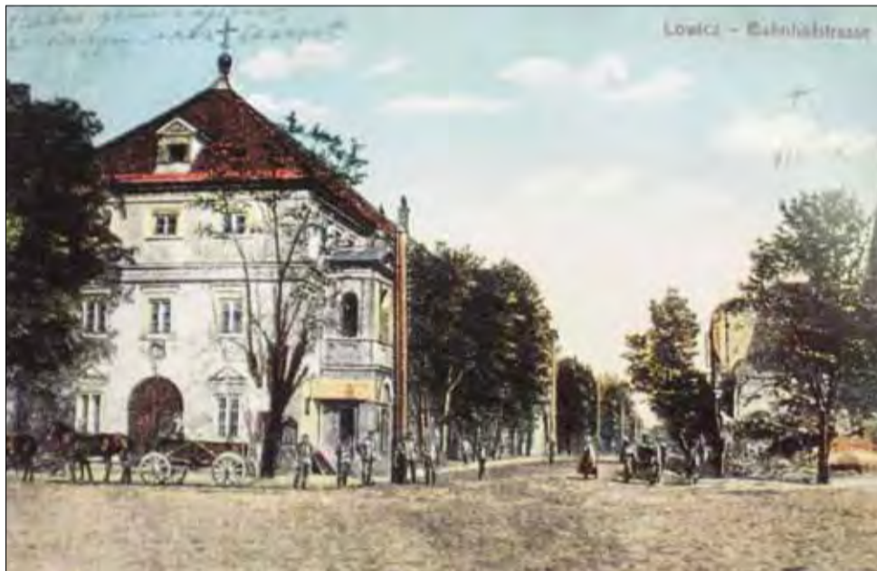
Cerkiew prawosławna w Łowiczu w gmachu pomisjonarskim (obecnie muzeum) na karcie pocztowej ok. 1915 r.