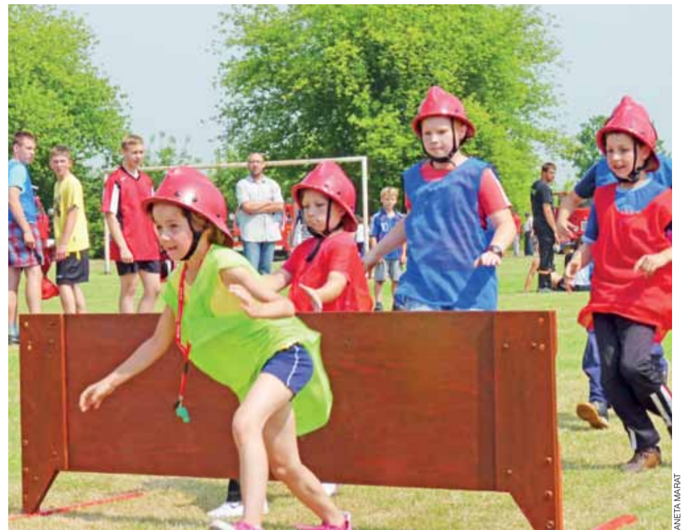
W młodzieżowych zawodach pożarniczych wystartowały dzieci i młodzież. Każdą z grup prowadził kapitan.

W zawodach w grupie A – mężczyzn – najlepiej poradzi-