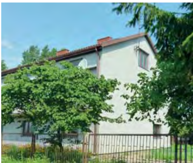
Dom mieszkalny gospodarstwa, na terenie którego doszło do tragedii.

Każde zejście do jakiegokolwiek szamba każdego rodzaju musi się odbywać po zabezpieczeniu dróg oddechowych aparatem z powietrzem lub tlenem, ponieważ człowiek może funkcjonować do czasu, gdy ma czym oddychać. Jeśli zachodzi potrzeba zejścia do takiego zbiornika, lepiej powierzyć to specjalistycznej firmie, niż próbować robić to samemu. Zejście samemu zawsze połączone jest z ryzykiem śmierci.