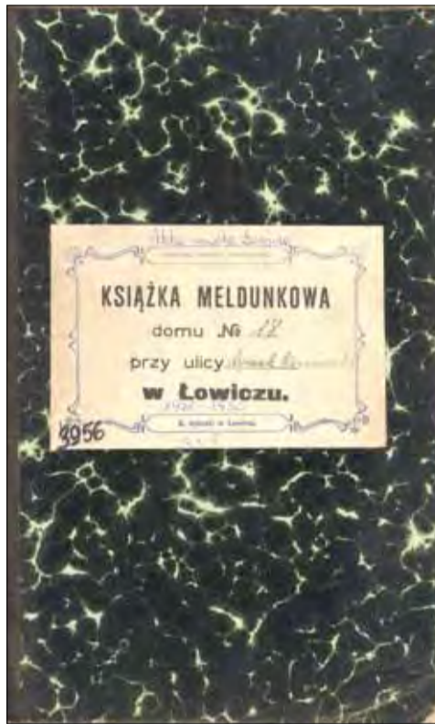
Książka meldunkowa domu przy Rynku Kościuszki 18 (obecnie Stary Rynek).

Jak działa wyszukiwarka i jakie informacje są zawarte w księgach? Wystarczy wpisać we wskazane pole wyszukiwarki nazwisko osoby, którą chcemy odnaleźć, a po potwierdzeniu wyświetli się nam sygnatura (bądź kilka czasami sygnatur) akt, gdzie ono występuje.