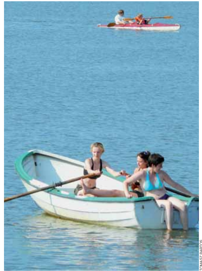
Nad zalewem Mroźyczka w Głownie, wypoczywający mają możliwość wypożyczyć kajak, rower wodny lub łódź.