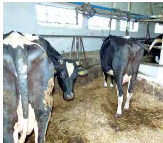
Szkoła planuje sprzedać całe stado krów w przetargu, który odbędzie się w przyszłym tygodniu.

Plany budowy są zawieszono. Hodowlę likwidujemy i czekamy na lepsze czasy.