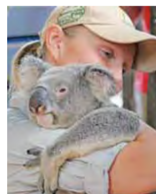
Miś koala w australijskim zoo.