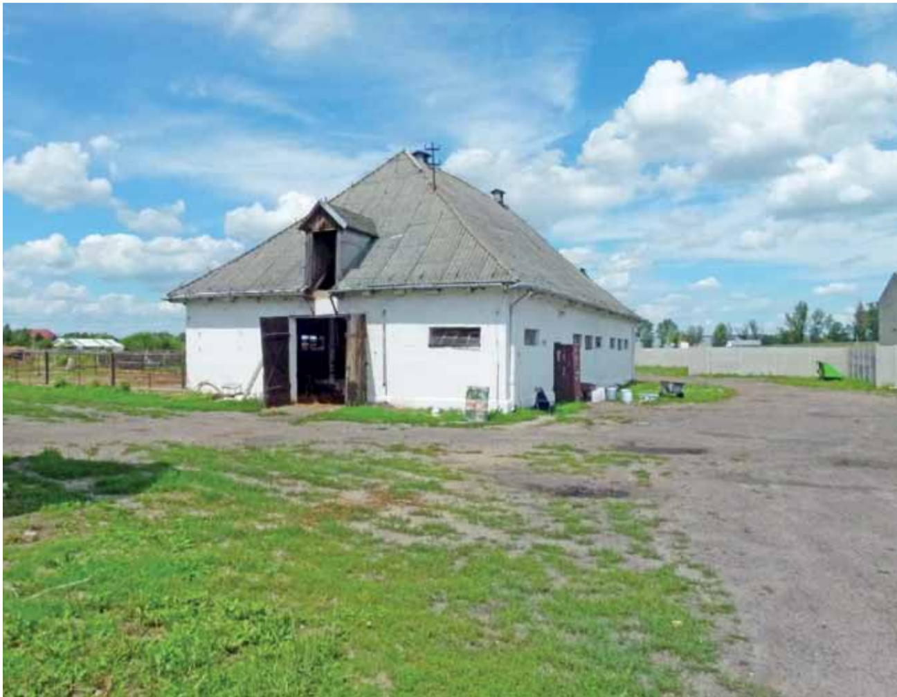
Obora jest jednym z kłopotliwych zabytków należących do szkoły na Blichu.

Pomimo likwidacji obory władze powiatu chcą utrzymać gospodarstwo pomocnicze, tyle, że zostanie ono przesta-