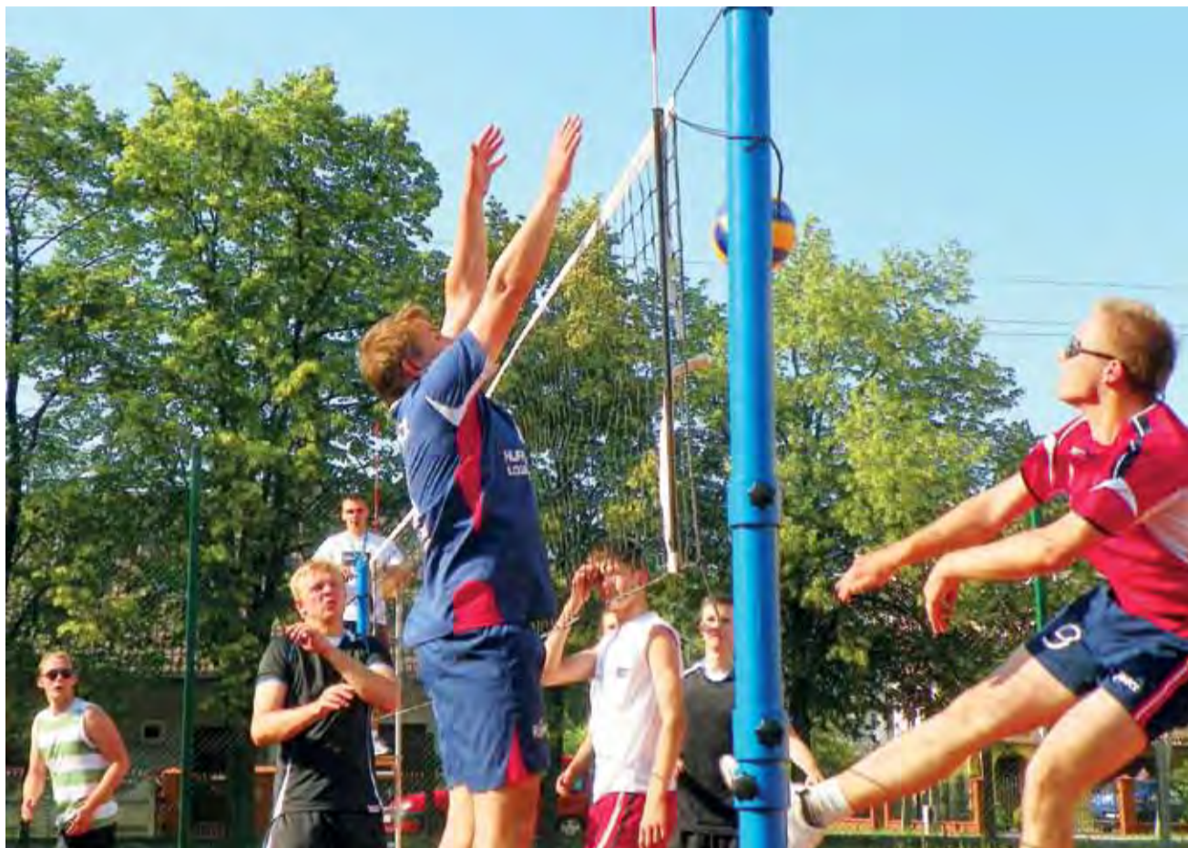
W rozgrywkach łowickich siatkarki – amatorów wciąż jeszcze nikt nie może być pewnym mistrzostwa...

■ Power Rangers Łowicz – Gutenów Team Łowicz 0:3 (18:25,