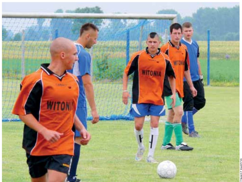
Po bezbramkowym remisie w finale lepiej rzuty karne wykonywali reprezentanci Kocierzewa.

Drugie miejsce przypadło Wejsciom, na trzecim miejscu znalazła się drużyna z Różyc, która wygrała w „małym finale” z Płaskocinem 3:1. Pozostałe drużyny w tej kategorii to: Wejście II, Kocierzew II, Łąsuszew, Boczek, Osiek, Ostrowiec, Różyc Żurawieniec, Jezioro i Lipnice.