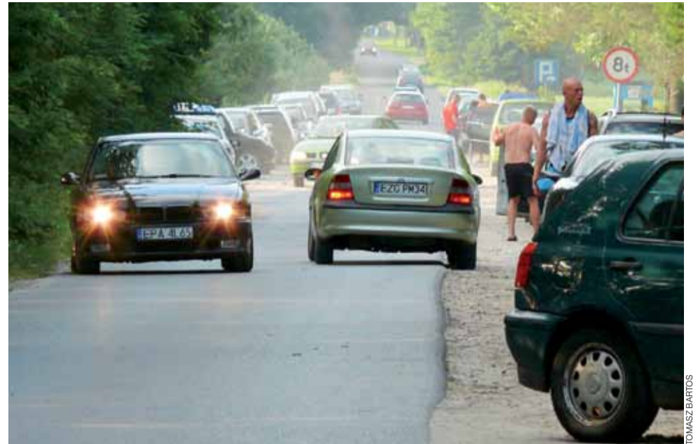
W upalne dni trudno jest znaleźć wolne miejsce na poboczu drogi w pobliżu zbiornika w okolicach Guźni i Dąbkowic. To najpopularniejsze miejsce kąpiel nie tylko dla łowiczanie – co widać po rejestracjach.

Region | Letni wypoczynek nad wodą: mamy skarby, które nie błyszczą