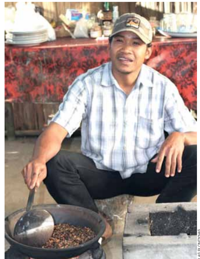
Przygotowanie kawy luwak – najdroższej na świecie.

My jednak przybyliśmy na Gili Trawangan w konkretnym celu. Chcielibyśmy zobaczyć życie podwodne. Zapierające dech w piersiach rafy koralowe oddalone były jedynie... dwa metry od brzegu! By podziwiać egzotyczne ryby, wystarczyło udać się do przydrożnego sta-