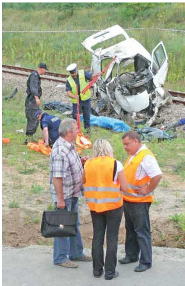
Na miejscu pracowali technicy i biegli, policjanci widoczni z tyłu rozkładają parawan, który miał zasłonić przed kamerami ciała ofiar.