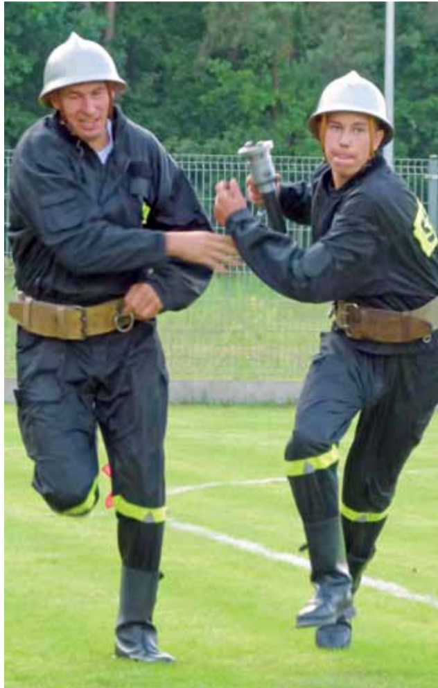
Druhowie z Ochotniczej Straży Pożarnej w Belchowie uzyskali łączny wynik 144,3. Był on o 1/10 sekundy gorszy od wyniku strażaków z Patok.

Wśród dziewcząt najlepsza okazała się drużyna OSP z Bobrownik – 144,6 pkt., drugie miejsce zajęła drużyna OSP z Nieborowa – 165,8 pkt. – Zawody należy uznać za udane.