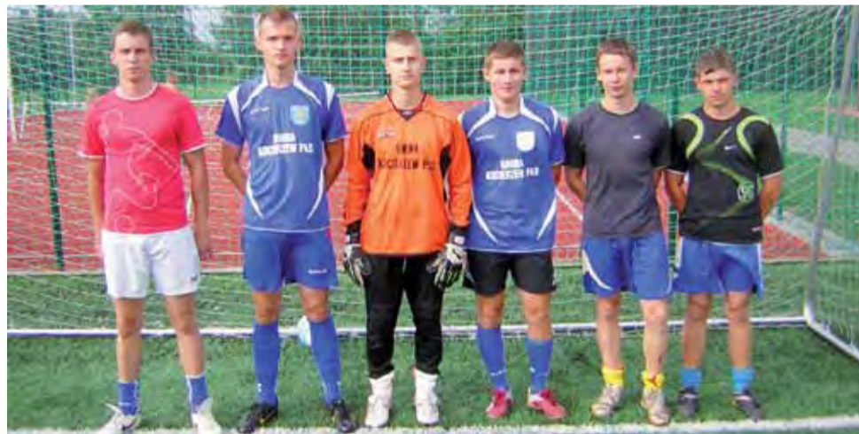
Mistrzami Zdun w 2012 roku zostali już praktycznie gracze zespołu Paździoch Team Wejsce.