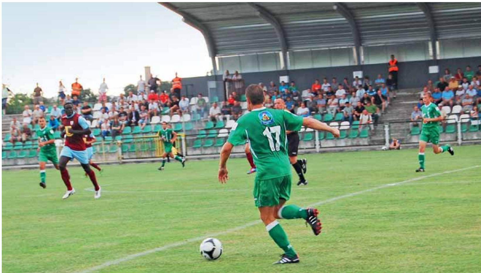
Otwarcie krytej trybuny, a potem zwycięski mecz i awans Pelikana do 1/16 finału Pucharu Polski. Czekamy teraz na przyjazd Ruchu Chorzów i ich przyjaciół z łódzkiego Widzewa.

Piłka nożna | Mecz 1/32 finału Pucharu Polski