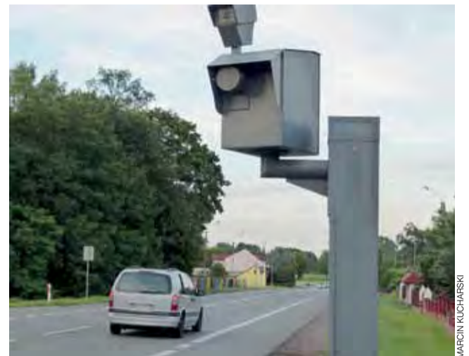
Masz też skrzynkę na fotoradar stojący przy drodze krajowej nr 14 w Jamnie nie będzie zastąpiony fotoradarem stacjonarnym.

Uruchomienie fotoradarów i całego systemu ma sprawić, że liczba ok. 4 tys. osób, które giną rocznie na polskich drogach, w bliższej przyszłości zmniejszy się o kilkadziesiąt procent – tak jak miało to miejsce w innych krajach Europy. tb