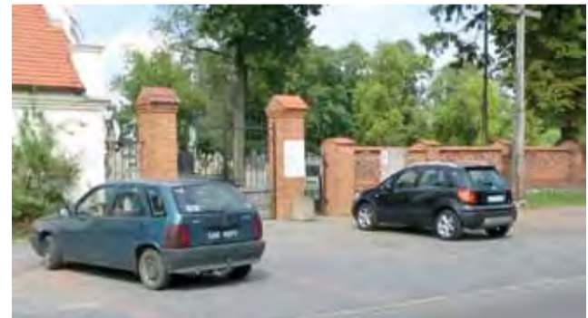
Stoiska ze zniczami zniknęły sprzed bramy cmentarza. Czy na długo?

dlował przed cmentarzem. To właśnie jego samochód stał na parkingu przy bramie od jesieni ubiegłego roku. Teraz go stamtąd zabrał. Zapewnia, że ma zarejestrowaną działalność gospodarczą i chciał mieć na ul. Blich wyznaczone miejsce pod handel. Dowiedział się, że nie jest to możliwe, zaś ustawienie stałego pawilonu podobnego do tego, który już istnieje, wiązałoby się z dużymi kosztami, a procedura – która wymagałaby m.in. zgody konserwatora zabytków – trwałaby nawet 2 lata. – Nie stoję już tam, bo nie mogę tam stać – mówi. Kilka razy dostałem mandat po 50 zł. Ostatniego z nich żona nie przyjęła, bo chciała, żeby sprawa trafiła do sądu.