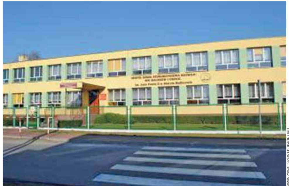
Zespół Szkół w Starym Waliszewie.