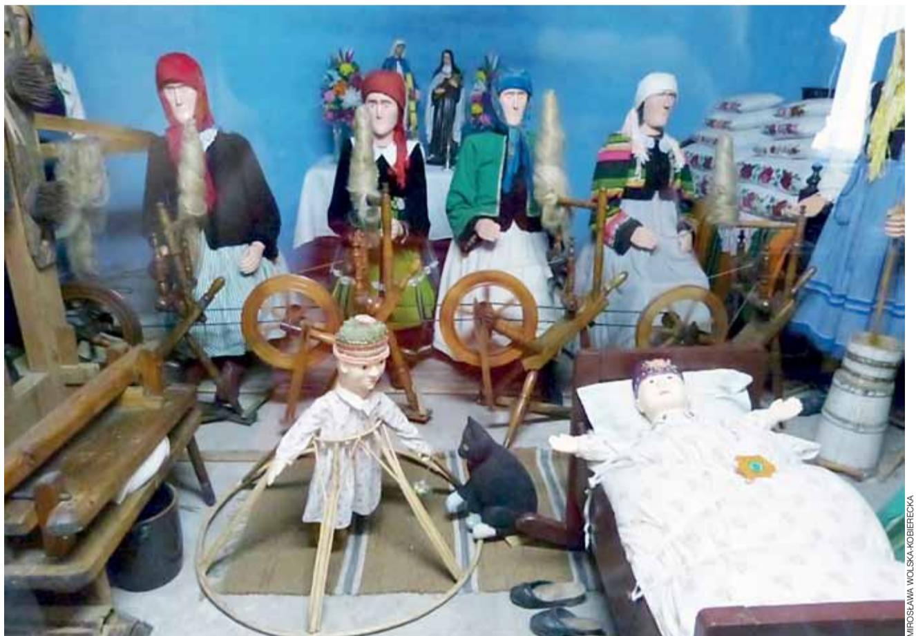
Jedną z ruchomych scen w II pawilonie przedstawia przedzenie lnu w pomieszczeniu z dziećmi w kołysce i chodziku. Na podłodze kot bawi się odpustową piłeczką.

Wykonanie mechanizmów zajęło mu około 10 lat. Był