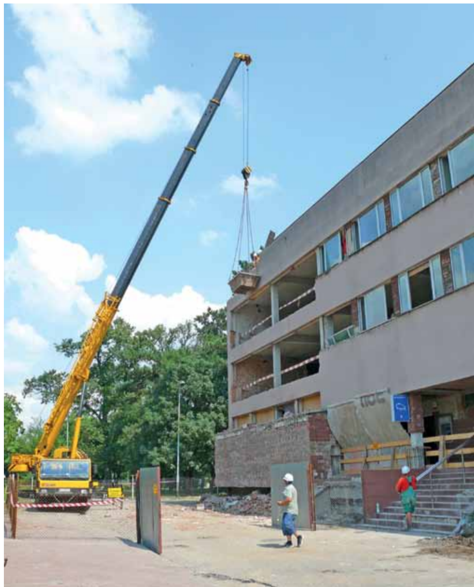
Firma Budowa przystąpiła do wyburzania ścian elewacji budynku przy ul. Nowej od strony parkingu, dlatego pojawiły się utrudnienia w ruchu pieszych.

W budynku nieprzerwanie od zimy prowadzone są prace, w czasie których oczyszczane były przestrzenie pomiędzy ścianami nośnymi budynku, przed ponownym zagospodarowaniem wnętrza. W środku powstaje nowa klatka schodowa, której przebudowę wymusił zamontowany już szyb windy i nowe przeznaczenie budynku.