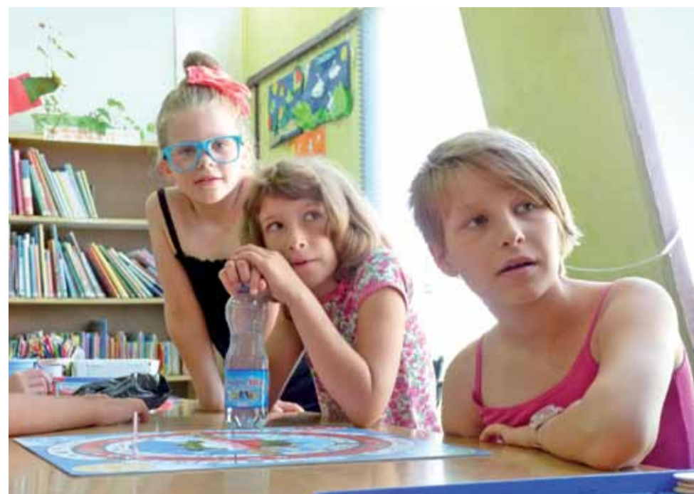
Dziewczynki z zaangażowaniem uczestniczą w zajęciach w bibliotece.

O godz. 10 na boisku przy ul. Bolimowskiej chłopcy ze szkół podstawowych rozegrają turniej koszykówki. am