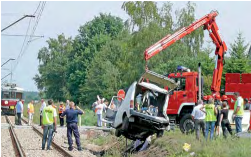
Po około 6 godzinach, gdy zakończyli pracę technicy policyjni i kolejowi, wrak samochodu, którym jechali Ukraińcy, został podniesiony z torowiska.

– Widok był makabryczny. Płatnina ciał z pogiętą karoserią. Część osób została wyjęta z samochodu. Szybko okazało się, że niestety w większości lekarz stwierdzał zgon. Mieliśmy trudności w dotarciu do 3 ofiar pod przewróconym samochodem. Później okazało się, że 2 osoby nie przeżyły, natomiast 1 z nich, która praktycznie znajdowała się na samym dnie, przeży-