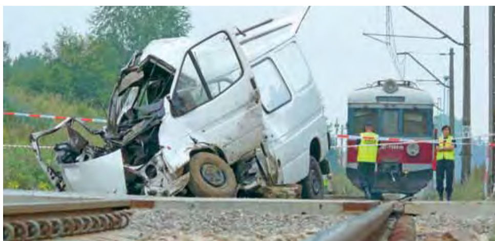
Policjanci i prokuratorzy są zgodni, że zawinił kierowca, który nie zatrzymał się przed znakiem Stop.

Identyfikacja zwłok nie była łatwa. W stosunku do 8 osób udało się tego dokonać w poniedziałek wieczorem. Co do jednego z mężczyzn początkowo sądzono, że konieczne będą badania DNA. Ostatecznie jego tożsamość udało się potwierdzić we wtorek. Ofiary wypadku to 6 kobiet i 3 mężczyzn w wieku od 21 do 30 lat. Najstarsza z ofiar miała 44 lata.