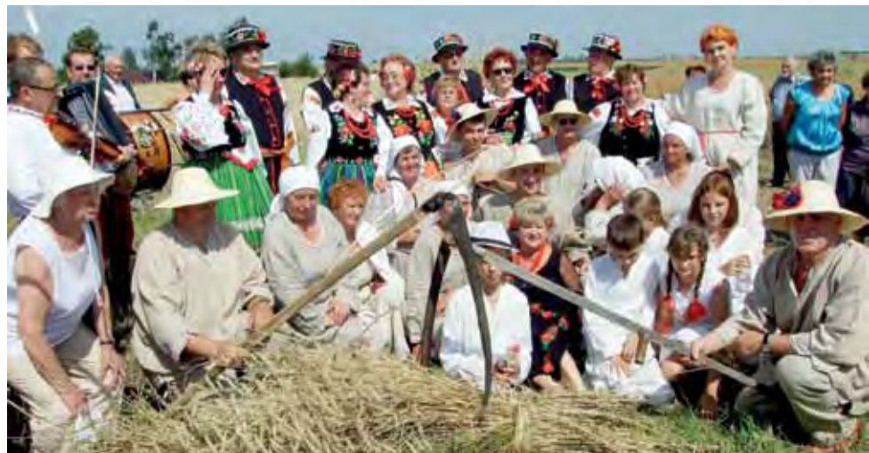
Mieszkańcy Bełchowa i Bobrownik na pamiątkowym zdjęciu po zakończonych żniwach w Zglinnej Dużej.

A o tym, jak kiedyś wyglądały żniwa i jak się je obecnie inscenizuje, by przypomnieć dawne obyczaje – zobacz na zdjęciu obok i przeczytaj na str. 24. td, mak