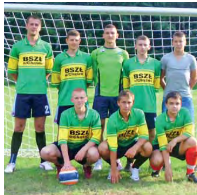
Mistrzami Chaśna 2012 okazali się zawodnicy Marca-OSP Karsznice.

Piłka nożna | Pelikanki przygotowuje się do gry w II lidze