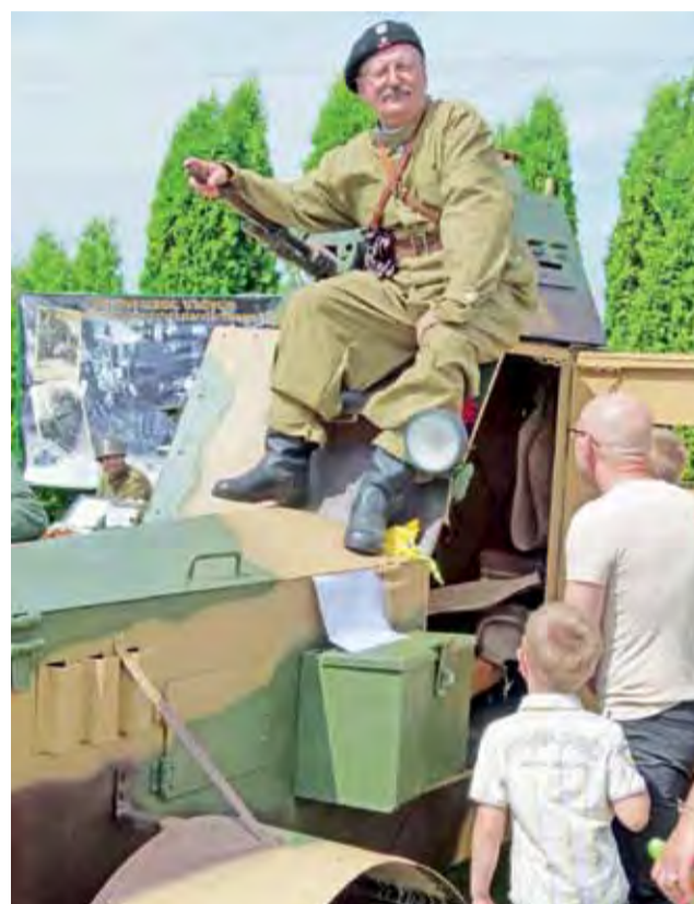
Samochód pancerny wzór 34 został wypożyczony z Fundacji Wojskowości Polskiej.