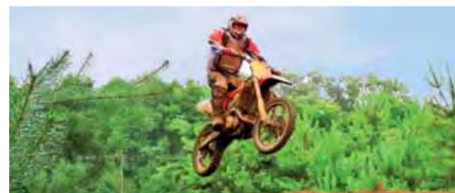
W niedzielę w Nieborowie kolejna gratka dla entuzjastów motocrossu.