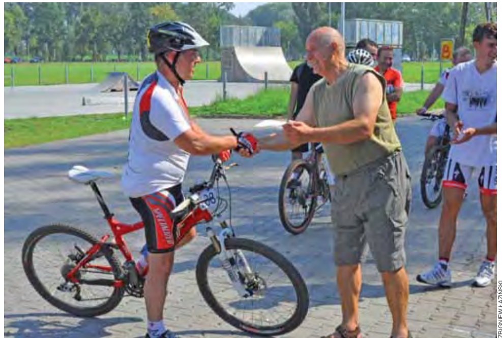
W poprzedniej edycji Crossu Rowerowego wystartowało 59. entuzjastów rowerów.

Zgłoszenia przyjmują do 20 sierpnia, chyba że wcześniej wypełnimy zakładany limit. Można