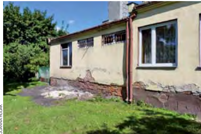
Zniszczona elewacja szkolnego budynku straszny przechodniów na ul. Sobockiej w Kiernozi.

czy planuje w najbliższym czasie przeprowadzić tam remont. – Nie mamy tego w planach – odpowiada wicestarosta Dariusz Kosmatka. Dodaje, że już na przełomie 2010/2011 r. opracowano projekt budowy nowe-