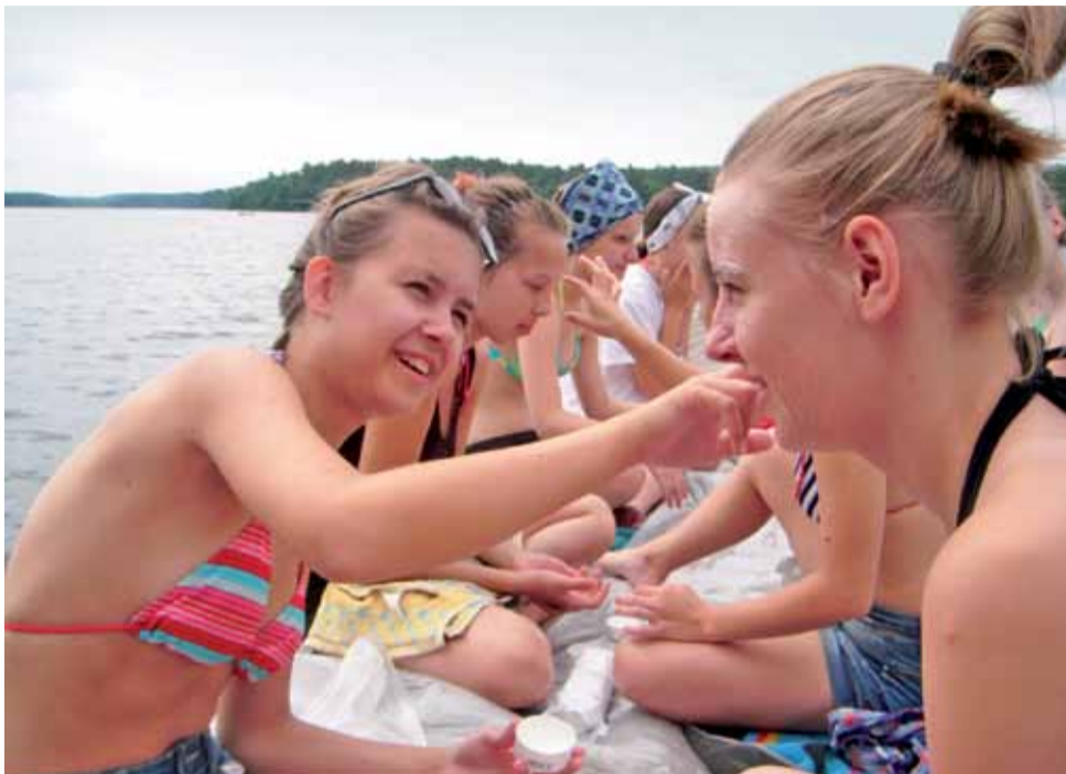
Dziewczęta zabezpieczają twarze swoim koleżankom przed nałożeniem na nie warstwy gipsu. Tak powstały maski, które potem pomalowano i wykorzystano podczas przedstawienia.

Grupę, choć zróżnicowaną wiekowo, udało się pobudzić do twórczego działania. Już na pierwszych zajęciach zachęcono dzieci, aby farbami na dużych arkuszach papieru bez użycia pędzla namalowały swoje lęki. Po tym zrodził się pomysł, aby finałowe przedstawienie miało tytuł „Strachy na Lachy”, bo morał, jaki z niego płynął, był taki, że każdy się