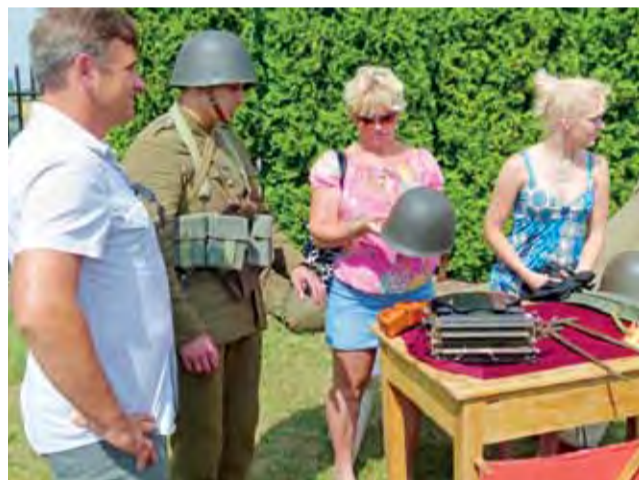
Dziesiątki z Łowicza pokazują historię na żywo. Wszystkiego można dotknąć i obejrzeć.