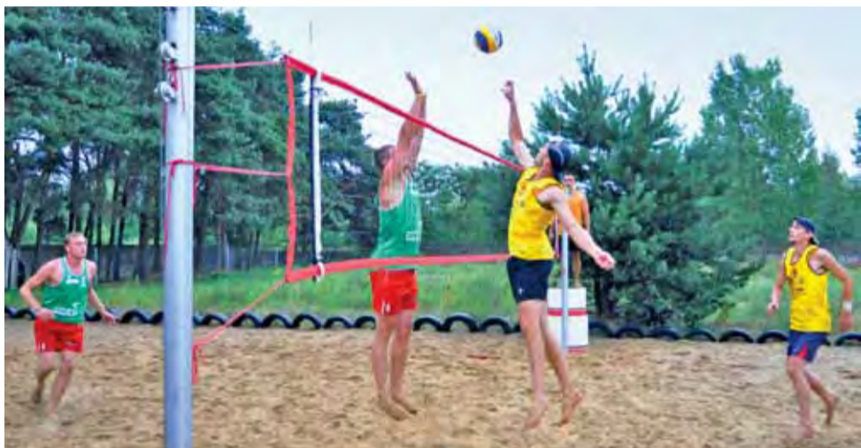
Finał rozgrywany był w deszczu, a ostatecznie minimalnie lepsi okazali się siatkarze z Głowna (z lewej).