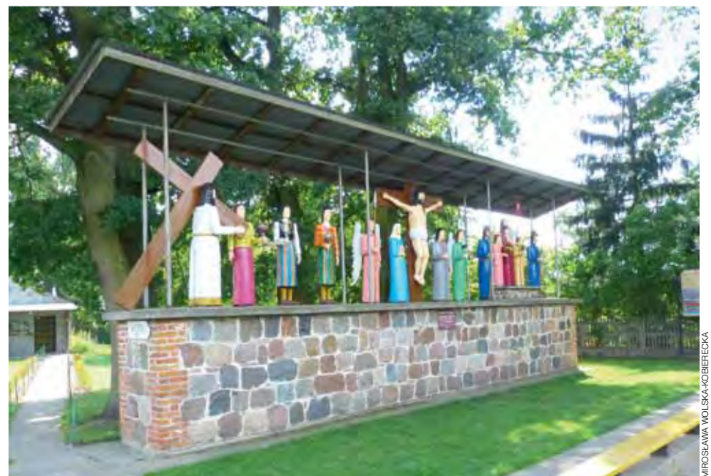
Obok muzeum znajduje się kapliczka z kilkunastoma rzeźbami naturalnej wielkości. Jest ona poświęcona wzywiciu Jana Pawła II w Łowiczu. W tym roku rodzina Brzozowskich odstąpiła wszystkie figury.