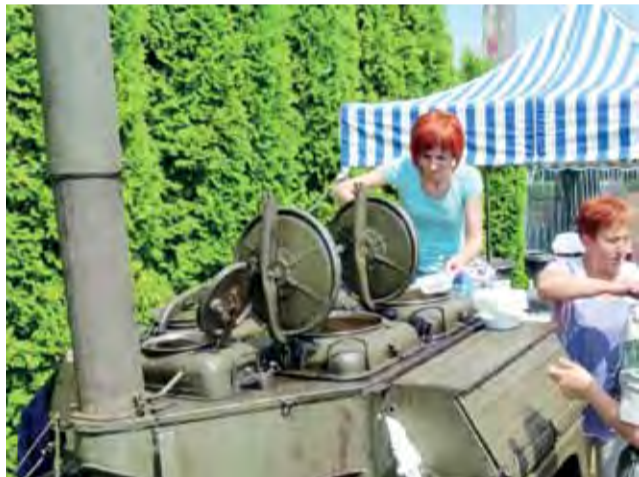
Żołnierska grochówka to ostatnio nieodzowny element większości festynów.