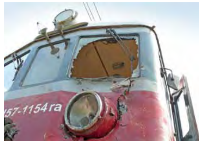
Wybita szyba, zniszczony reflektor. Tak wyglądał po zderzeniu przód składu jadącego do Łodzi.

– Gdyby się zatrzymał przed znakiem Stop, zobaczyłby pociąg, który dojeżdżał do przejazdu. Niestety, ukształtowanie terenu w tym miejscu nie jest dla