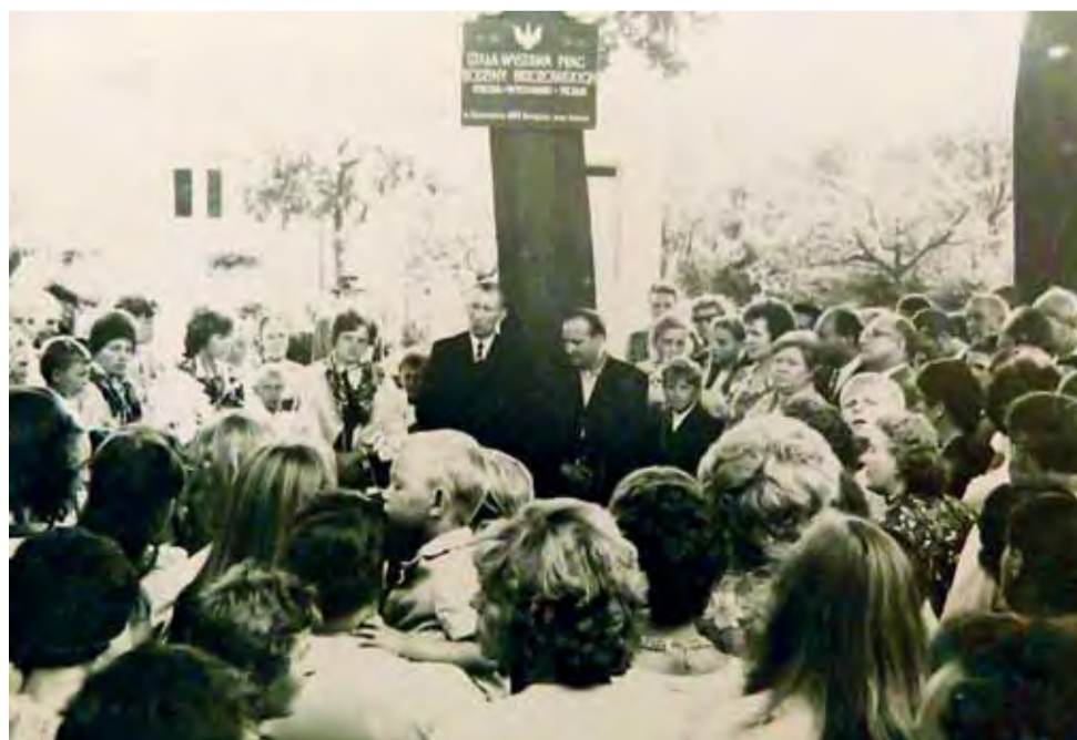
Na otwarciu muzeum w Sromowie w 1972 roku pojawiły się tłumy ludzi. Większość z nich przyciągnęła pogłoska o tym, że na uroczystość został zaproszony biskup.

Hobby męża zajmowało jedynie 2 pokoje w domu, a 5-osobowa rodzina mieszkała w niewielkiej kuchni.