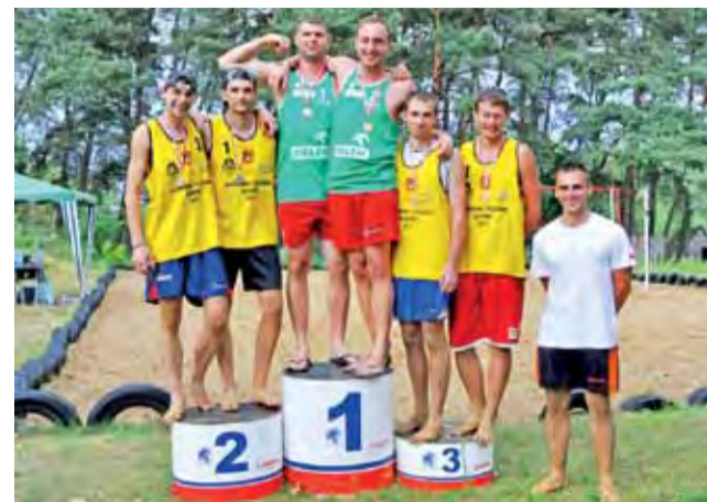
Dwie pary z Głowna na podium w 1. turnieju XI edycji Otwartych Mistrzostw Łowicza w siatkówce plażowej przedzieliła ekipa z Łowicza.