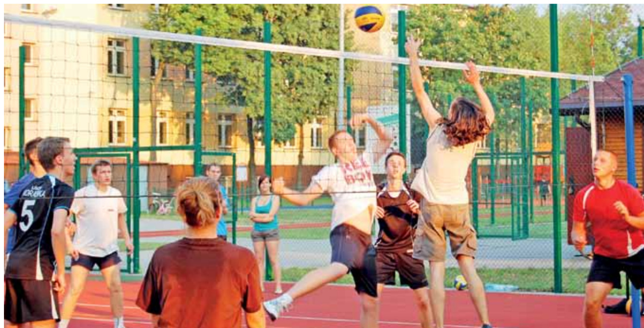
W finałowym pojedynku I edycji Orlikowej Ligi Siatkówki Amatorskiej nie brakowało ciekawych akcji.