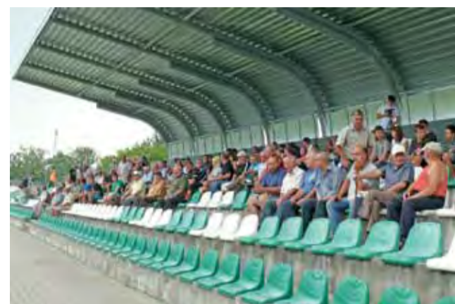
Zadaszenie nad częścią trybun już służy.

Z początkowych informacji wynikało, że zginęło 5 osób, jednak działające na miejscu ekipy ratunkowe szybko stwierdziły zgon 8 osób. Kilka godzin później okazało się, że zmarła dziewczyną ofiarą wypadku – jedna z dwóch kobiet odwiezionych do szpitala. str. 3