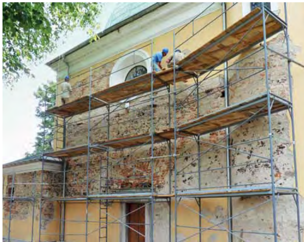
Prace przy sanktuarium pokazały, że jest to budowla z cegły ale i z tzw. rudy darniowej. Jest wiele spękań, które trzeba będzie wzmacniać.

W 2010 roku parafia wystąpiła z wnioskiem o dofinansowanie remontu sanktuarium do Urzędu Marszałkowskiego, nie otrzymała jednak ani złotówki. Proboszcz parafii zdecydował wówczas mimo to nie czekać dłużej z pracami, ponieważ stan kaplicy, zwanej od nazwiska fundatorów kaplicą Celestów, jest z roku na rok coraz gorszy.