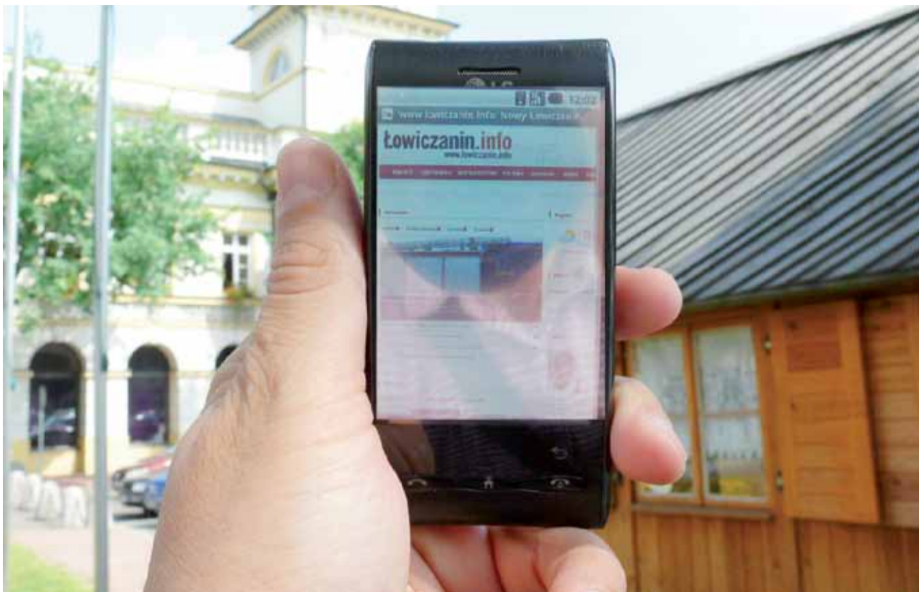
Sprawdziliśmy. Na Starym i Nowym Rynku bezpłatne wifi działa, nasz strona załadowała się na telefon komórkowy w kilka chwil.