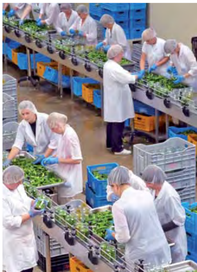
W sezonie przy ogórkach – głównie przy sortowaniu i wkładaniu ogórków do stoików – tymczasową pracę znalazło nawet około 300 osób.

Okolo tysiąca ton ogórków trafia bezpośrednio po umyciu i posortowaniu do kwaszenia. Odbywa się ono w specjalnych skrzyniopaletach, które – w przeciwieństwie do beczek, w których kiedyś odbywało się kwaszenie – przystosowane są do tzw. wysokiego składowania. – Technologia do najtańszych nie należy, ale odbywa się w aseptycznych workach i gwarantuje idealną powtarzalność wyników. Dajemy potem naszym odbiorcom powtarzalność smaku – twierdzi Urbanek. Kwaszone ogórki będą potem stanowiły bazę do całorocznej produkcji sałatek, np. znanej od dawna sałatki Naddunajskiej, Szwedzkiej, Księżackiej, przecieru ogórkowego po łowicku czy krajanki ogórkowej. A na te specjały popyt jest w całym kraju. ■