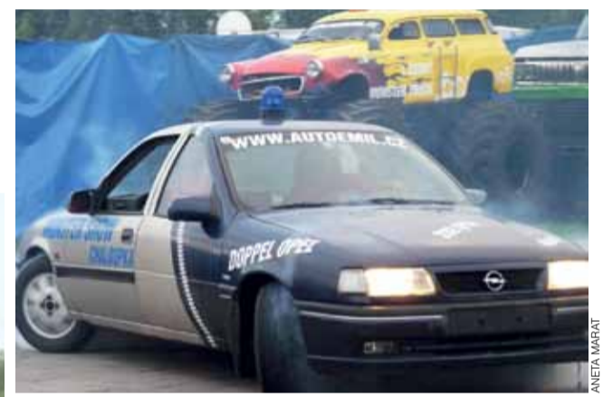
Dzięki dwóm silnikom, dwóm układom kierowniczym i dwóm kierowcom samochodów poruszały się w niecodzienny sposób.

Monster trucki przejechały przez dwa samochody, niszcząc je i zostawiając stertę pogiętych blach.