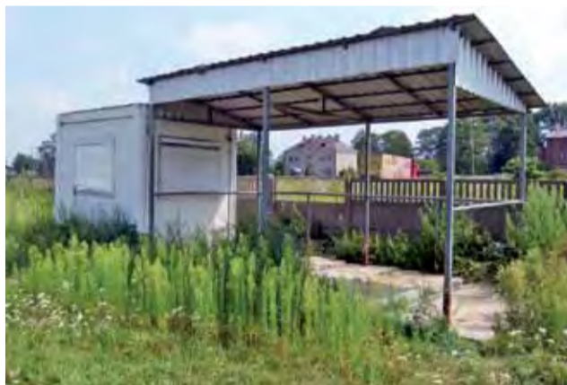
Z targowiska w Łyszkowicach znikną również stare zabudowania i kontener, w którym dyżurował lekarz weterynarii.

Wniosek o dofinansowanie modernizacji targowiska gminnego w Łyszkowicach złożony został w Urzędzie Marszałkowskim w Łodzi w połowie lutego. Miesiąc później wniosek został wstępnie zakwalifikowany do projektu. Ostateczna informacja o dofinansowaniu modernizacji z programu Mój Rynek oraz dokumenty do podpisania dotarły do gminy w czerwcu.