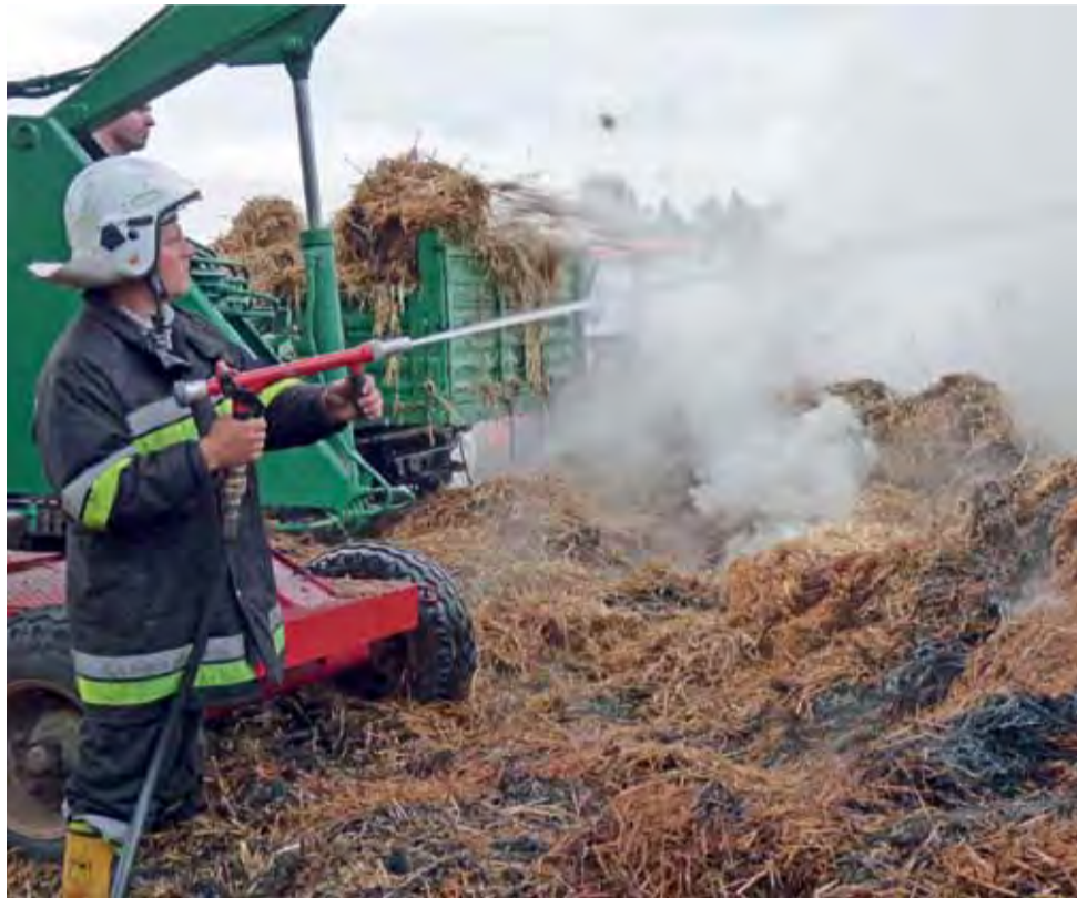
Słoma, która była w stodole, a nie spaliła się, była przelewana wodą kilkakrotnie.

“ Pożar gasiło 37 strażaków z 7 jednostek. Ponadto na miejsce przybiegło wielu mieszkańców wioski, którzy pomagali dogaszać pożar.