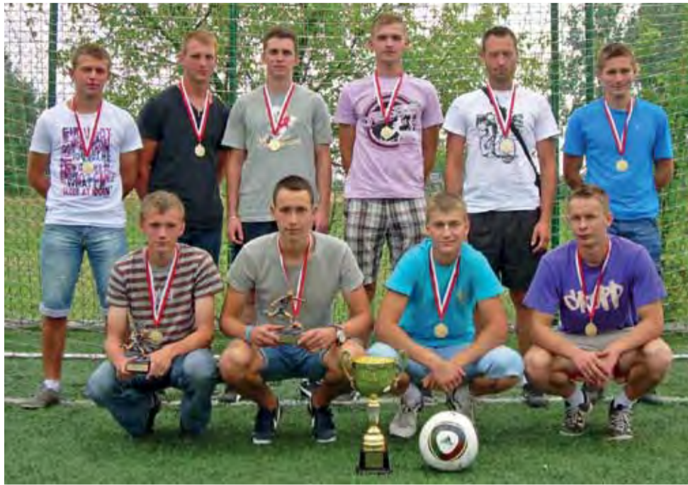
Już wcześniej mistrzostwo Zdun zapewniła sobie ekipa Paździoch Team Wejsce.