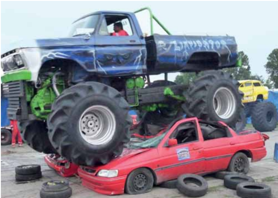
Show zakończył się przejazdem monster trucków po wrakach aut. Większy przejechał po samochodach tylko raz, mniejszy – 3 razy.

Wystawę prac Jacka Sempolińskiego otwarto w Galerii Browarna Wiadomości ze świata kultury na str. 22-24