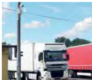
W Głownie na DK nr 14 zamontowano dwie kamery.

2 kamery monitorujące zawisły zatem na słupach sygnalizacji świetlnej w Głownie na skrzyżowaniu ulic Dorzeczej (DK nr 14) i Targowej oraz ulic Łódzkiej (DK nr 14) i Si-