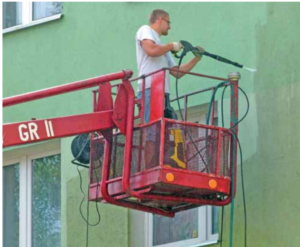
Mycie ścian przy użyciu karchera na budynku nr 6 na osiedlu Bratkowice w Łowiczu.

Polcentrum przesłało już swoje rekomendacje do Urzędu Marszałkowskiego w Łodzi i jeśli ten będzie miał uwag co do poprawności wniosków, umowy na dofinansowanie przedsięwzięć podpisane zostaną w ciągu miesiąca. ljs