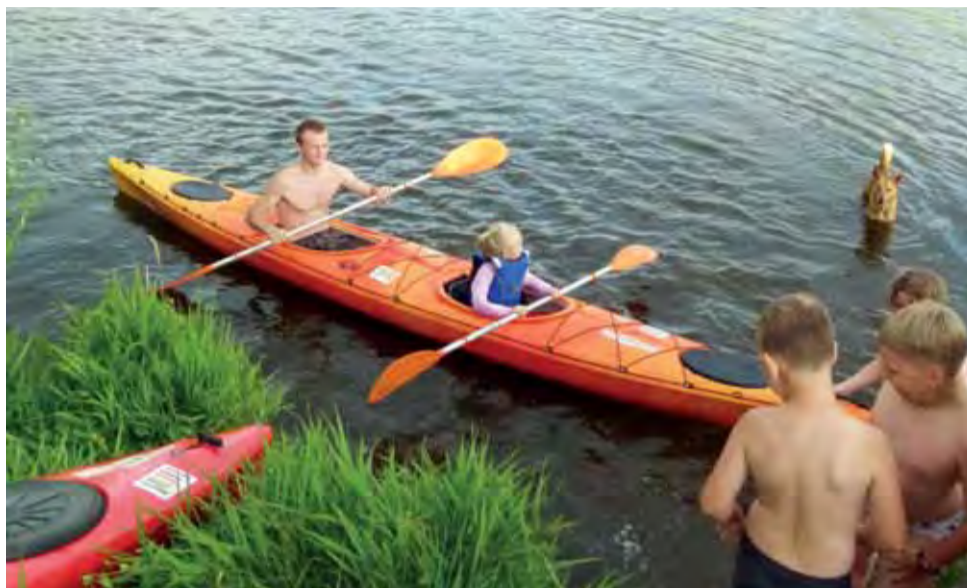
Kajakami na Bzurze już pływają zawodnicy Łowickiej Akademii Sportu. Jak widać na zdjęciu, woda w rzece jak na razie jest tak płytka, że nawet pies może w niej chodzić.