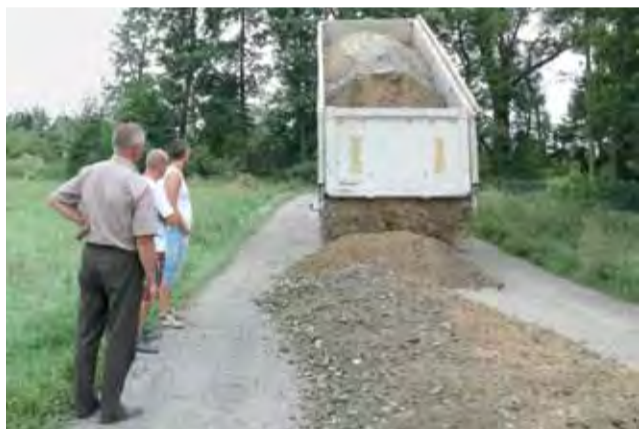
Mieszanka piasku, cementu i tłuczni powinna stworzyć dobrą nawierzchnię.

Rozwożenie materiału odbywa się w promieniu ok. 10 km od bazy, tak by firma Da-Mo mogła to robić szybko. Pierwsze wywrotki zrzucono na najgorsze odcinki dróg w Nieborowie, Bobrownikach i Arkadii oraz Dzierżgówku. Prace przeważają we wtorek, będą one kontynuowane za 2 tygodnie. Gmina przyjmuje obecnie zgłoszenia od mieszkańców, którymi drogami jeszcze się zająć. tb