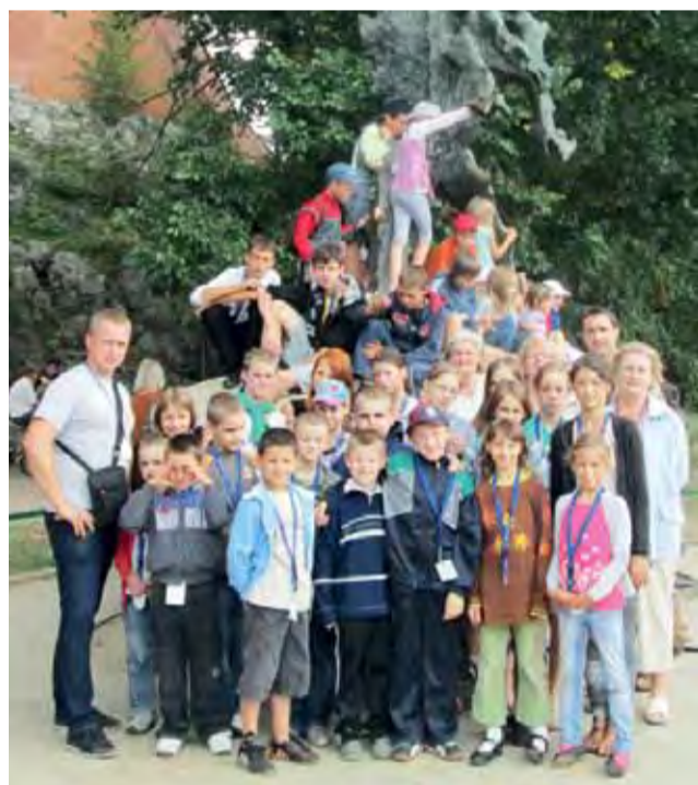
STOWARZYSZENIE CENTRUM WOLONTARIATU NADZIEJA

30 dzieci uczestniczyło 9 i 10 sierpnia w dwudniowej wycieczce zorganizowanej przez Stowarzyszenie Centrum Wolontariatu Nadzieja w Łowiczu. Dzieci zwiedziły Częstochowę, Kraków, Wadowice i Kalwarię Zebrzydowską. Dla większości dzieci był to pierwszy wakacyjny wyjazd. Stowarzyszenie otrzymało 3000 zł dofinansowania z ratusza, pozostałą kwotę, a więc około 2000 zł pokryło z własnego budżetu. Na wycieczkę wyjechały dzieci w wieku od 7 do 14 lat pochodzące z ubogich rodzin w Łowiczu, razem z nimi pojechało 5 opiekunów. am