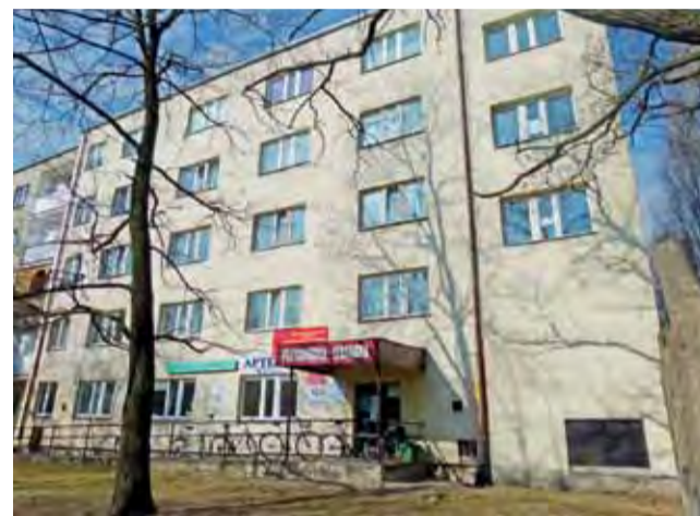
Budynek przy Kaliskiej 6 z zewnątrz nie wygląda źle, choć na elewacji widoczne są pęknięcia tynków.

Umieszczenie w budynku przy ul. Kaliskiej kilku instytucji może być dobrym rozwiązaniem, gdyż budynek samą swoją konstrukcją będzie przyjazny funkcji biurowej. Ma szerokie, szpitalne korytarze, co w połączeniu z windą i gotowym podjazdem sprawi, że może stać się idealnym miejscem właśnie na biurowiec, po którym mogą swobodnie poruszać się także osoby niepełnosprawne na wózkach. Z drugiej strony, w przypadku zagospodarowania na cele mieszkaniowe, szerokie korytarze byłyby problemem, bo duża część budynku stałaby się częścią wspólną, a to nie jest dobrym rozwiązaniem, gdyż przecież wszyscy mieszkańcy muszą płacić za jej ogrzanie i oświetlenie. Budynek w jego obecnej postaci ma też pomieszczenia dość małe jak na lokale mieszkalne. Zainwestowanie w ich adaptację zwróciłoby się dopiero po wielu latach, dlatego lepiej jest wybudować nowy blok.