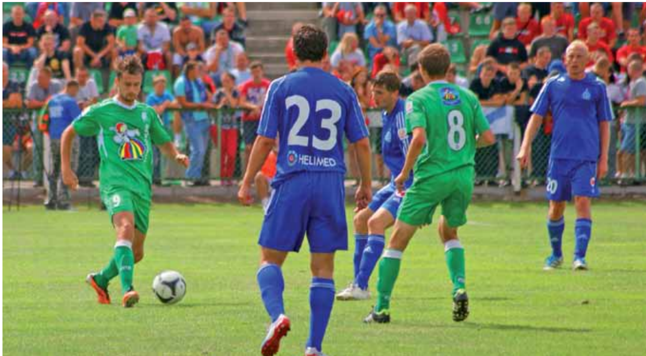
Łowiczanie zaprezentowali się lepiej od swoich rywali, ale to chorzowski Ruch awansował do 1/8 finału Pucharu Polski.