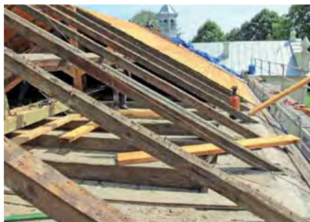
Część elementów konstrukcyjnych dachu, ze względu na zły stan, musiała zostać wymieniona.

wej pomocy departamentu kultury Urzędu Marszałkowskiego w Łodzi. Parafianie musieli zapewnić tylko wkład własny w wysokości 75 tys. zł.