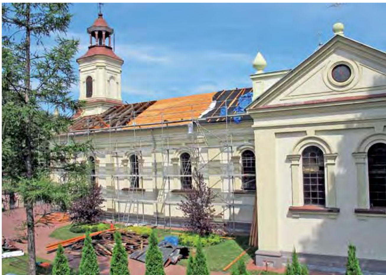
Kościół w Bełchowie ma już wymienione poszycie dachu na tytanowo-cynkowe, wytrzyma ono z powodzeniem kilkadziesiąt lat.

Trwające prace to drugi etap robót związanych z modernizacją dachu. W ubiegłym roku parafia wydała 370 tys. zł na dach nad kaplicą, a to dzięki finanso-