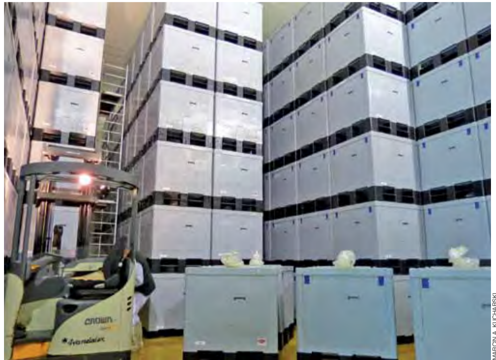
Skrzyniopalety do kwaszenia ogórków są składowane piętrowo.

Skąd są plantatorzy dostarczający ogórki do firmy na Katarzynowie? Rolnicy z powiatu łowickiego wcale w tej grupie nie dominują. – Można powie-