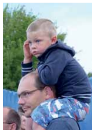
Na widowni pojawili się młodzi chłopcy z ojcami.