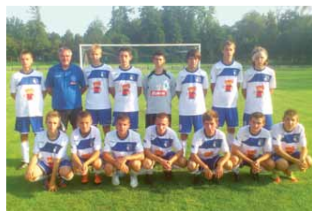
Juniorzy młodzi Laktozy Łyszkowice przygotowują się do nowego sezonu na Opolszczyźnie.

Mecz był ciekawym widowiskiem i dobrym sprawdzianem formy, która okazała się już na tym etapie wysoka.