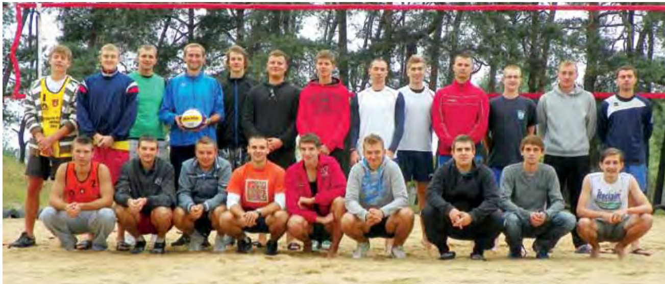
W trzecim turnieju OMŁ zagrało dwanaście par.

Siatkówka plażowa | 3. turniej eliminacyjny XI edycji Otwartych Mistrzostw Łowicza