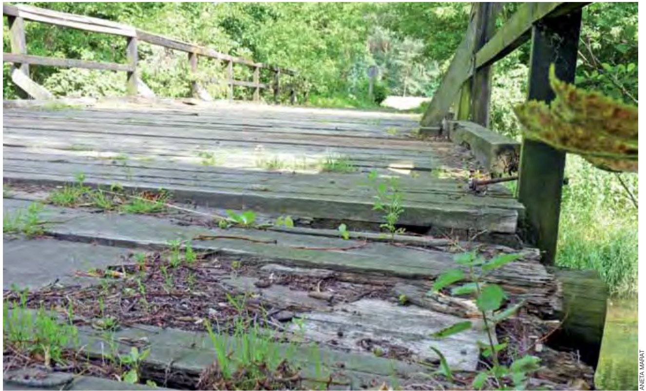
Deski na moście w Sokołowie zniszczone są zwłaszcza od strony wsi.

Pieniądze przeznaczone na remont mostu w kwocie 300 tys. zł nie będą rozdysponowane w tym roku, a zostaną one zachowane w budżecie na kontynuowanie tej inwestycji w kolejnym roku.