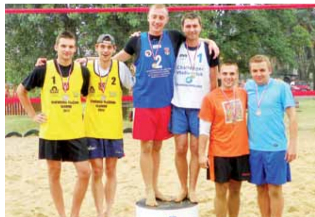
Znowu na wygrali siatkarze z Głowna, ale na podium także łowiczanie.