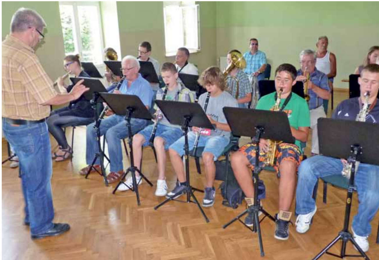
Młodzi muzycy nie chcieli grać w strażnicy OSP. Od kilku tygodni próby orkiestry odbywają się w Łowickim Ośrodku Kultury.

Mimo wykluczenia przez zarząd OSP młodzieńcy wciąż przychodzą jednak na próby. – Orkiestra jest miejsko-stra-