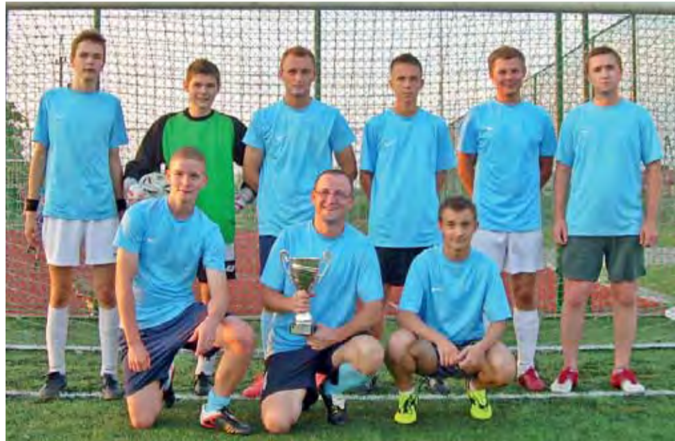
Najlepszą drużyną II ligi okazał się łowicki Fachowiec.