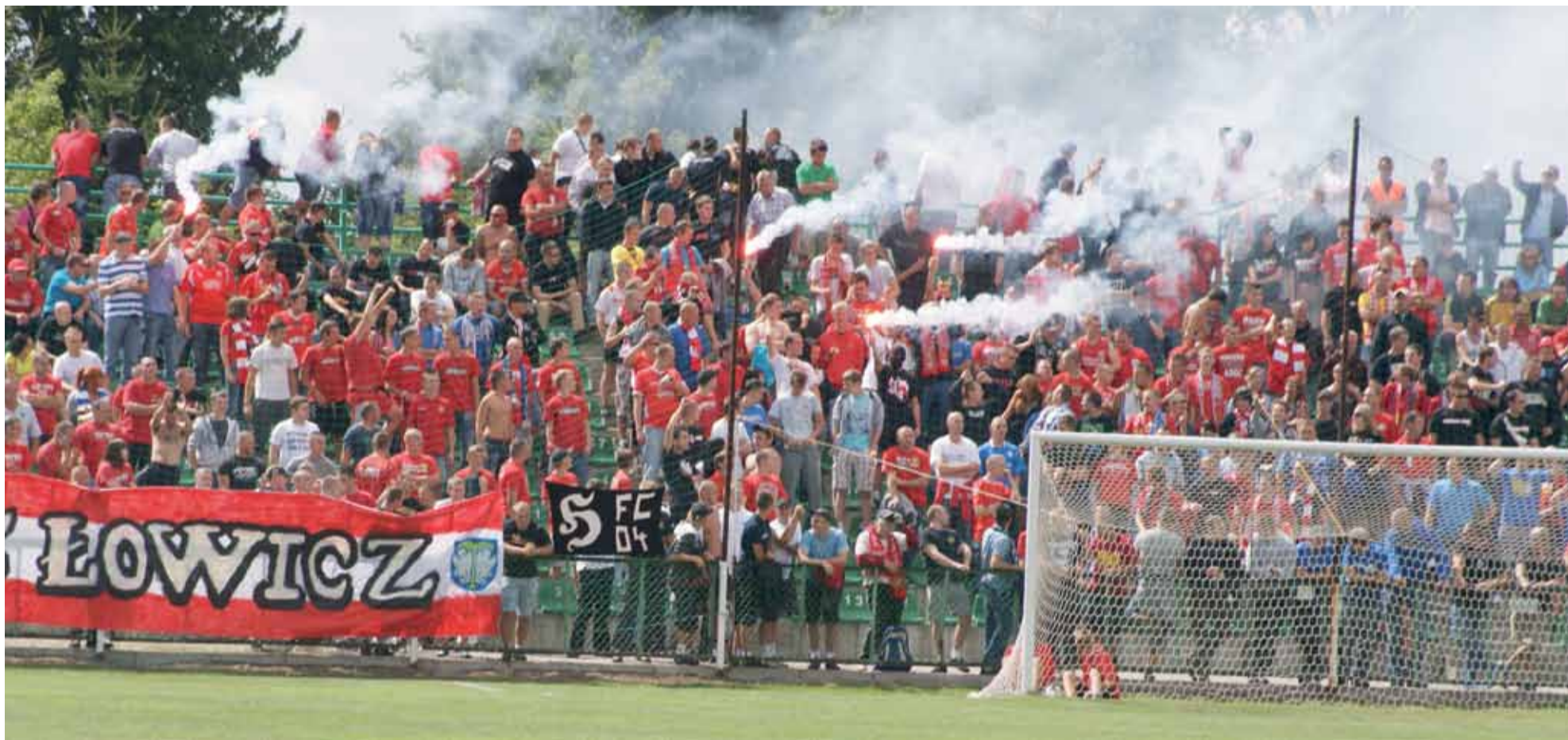
Wydaje się, że Pelikan Łowicz nie uniknie kary, nałożonej przez PZPN za odpalone na trybunie za bramką race...