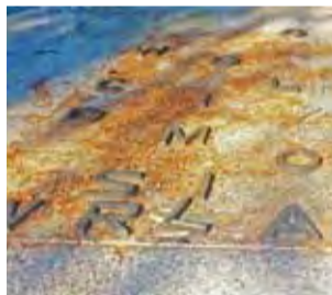
Zniszczony napis na pomniku na cmentarzu w Walewicach.

Dlatego po raz pierwszy wrześniowe uroczystości odbywające się przy pomniku w Walewicach, z okazji rocznicy bitwy nad Bzurą i odbicia miejscowości z rąk niemieckich przez 17. Pułk Ułanów Wielkopolskich, będą odbywały się w cieniu aktu wandalizmu. – Zniszczenie napisów na pomniku