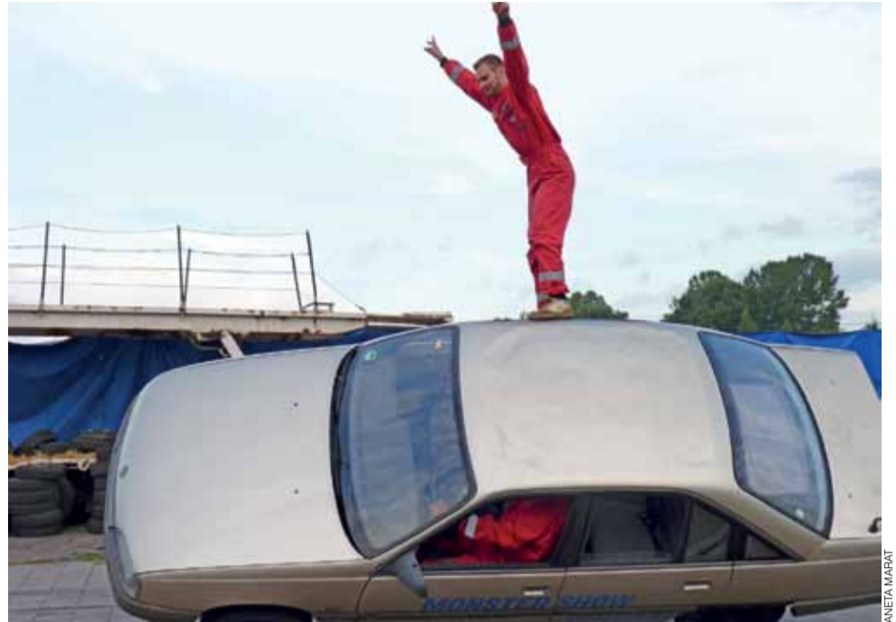
Przejazd auta na dwóch kołach z kaskaderem na dachu należy do jednych z łatwiejszych zadań, które wykonywała grupa.

Łowicz | Południowi sąsiedzi gościli w naszym mieście