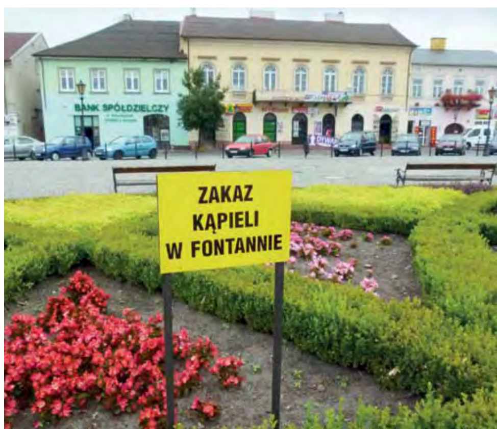
Biorąc pod uwagę, że w te wakacje ma jeszcze zapanować aura zachęcająca do kąpieli, dobrym krokiem wydaje się być zamontowanie trzech tabliczek informujących o zakazie kąpieli w fontannie. Zostały one ustawione w rabatach kwiatowych wokół fontanny na Nowym Rynku w Łowiczu. mak