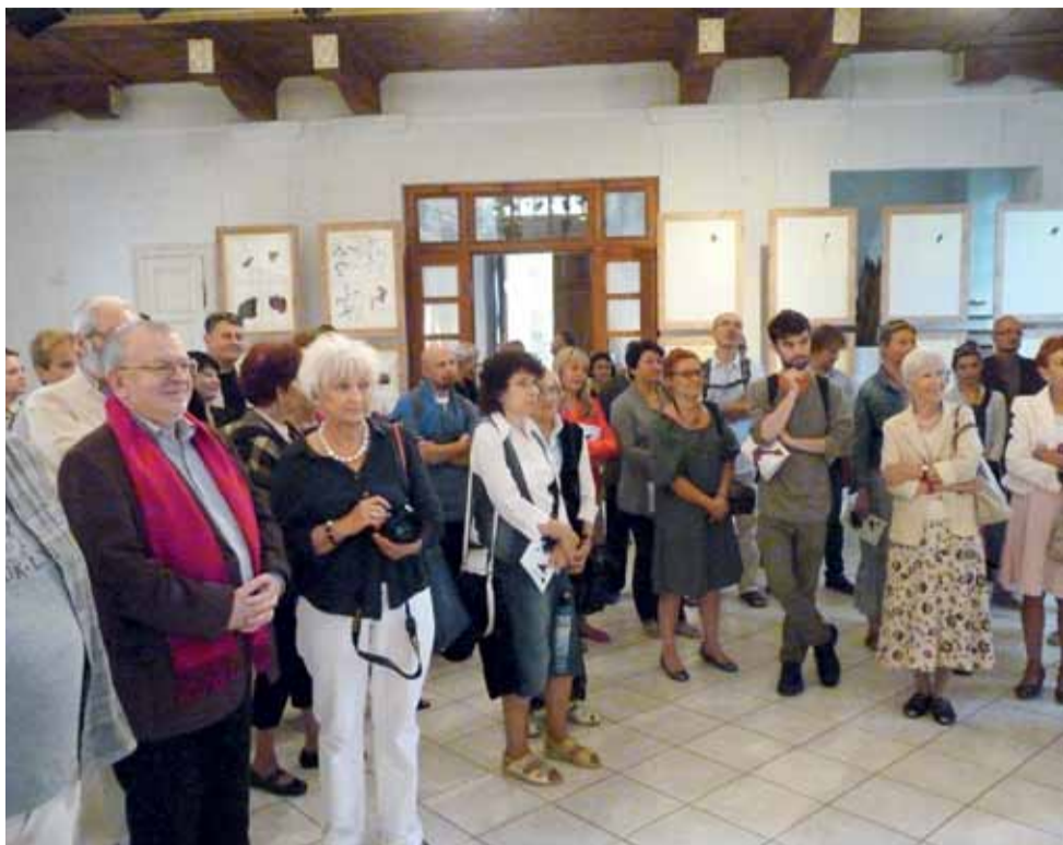
Na otwarciu wystawy w galerii zgromadziło się około 50 osób.