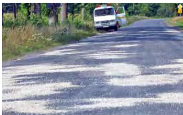
Droga z Łyszkowic w kierunku Skierniewic była łatana na odcinku około 2 kilometrów.

Dziury były zalewane na gorąco masą asfaltową, posypywane grysem i walcowane. Tego dnia przeprowadzono naprawę na około 2-kilometrowym odcinku drogi. mak