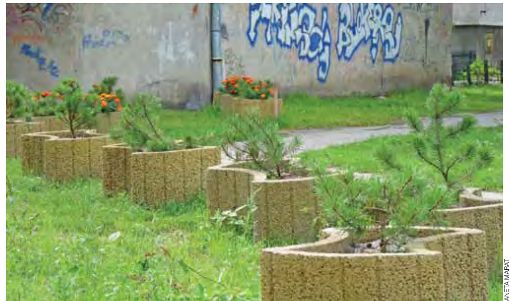
Doniczki mają chronić rośliny przed zwierzętami, by nie zostały zniszczone i by mogły się dobrze ukorzenić.

Łowicz | Osiedle komunalne przy ul. Armii Krajowej