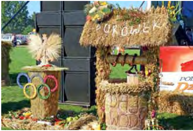
Wieniec ze Starego Waliszewa z polskim orłem i kołami olimpijskim nie spotkał się z uznaniem komisji konkursowej. Jej członkowie zachwycili się natomiast wieniec z Borówka, który wykonano w kształcie studni.