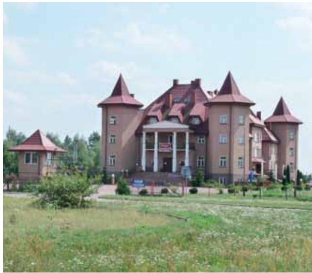
Budynek należy do Mazowieckiej Wyższej Szkoły Humanistyczno-Pedagogicznej. Jeśli znajdzie się dobry kupiec zostanie sprzedany.

Z takim zdaniem nie do końca zgadzają się osoby mieszkające w pobliżu hotelu, choć zdania były tu podzielone. Małżeństwo z Maurzyc uważa, że do hotelu rzadko kto zagląda i tak jest nie od dzisiaj, ale praktycznie od początku istnienia obiektu. – Samochodów mało stoi na parkingu. Jak budowali autostradę, to ludzie się jeszcze kręcili, ale teraz to ten hotel chyba cienko przędzie – powiedział zapytany przez nas mężczyzna. Inny stwierdził, że chyba jednak nie jest tak źle, gdyż ostatnio widział tu nawet autobusy pełne ludzi. – To byli jacyś piłkarze – mówi. td