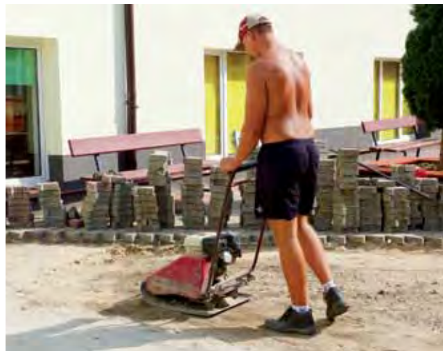
Pracownicy firmy Drotor skończą układać kostkę w tym tygodniu.