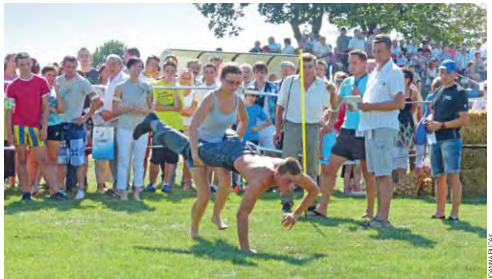
Drużyna ze Starych Piasków zajęła w Turnieju Wsi IV miejsce. W tej konkurencji, żywych taczek, też poszło jej dobrze, choć w drodze powrotnej para przewróciła się na trawę.

W turnieju wsi wzięli udział przedstawiciele 7 miejscowości. Było o co walczyć, ponieważ główna nagroda dla zwycięskiego sołectwa wynosiła 1000 zł. Rozegrano 10 konkurencji, m.in. żywe taczki – dziewczyny trzymały mężczyzn za nogi, więc ci poruszali się tylko na rękach, przenoszenie piątek o różnej wadze i rozmiarze, bieg kelnera,