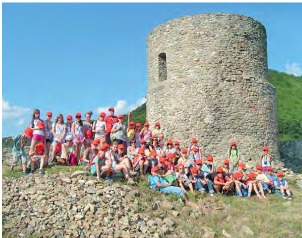
Uczniowie szkoły pijarskiej zwiedziły m.in. ruiny zamku w Rytrze.

Dzieci każdego dnia uczestniczyły we mszy św., która była odprawiana w kościele w Rytrze.