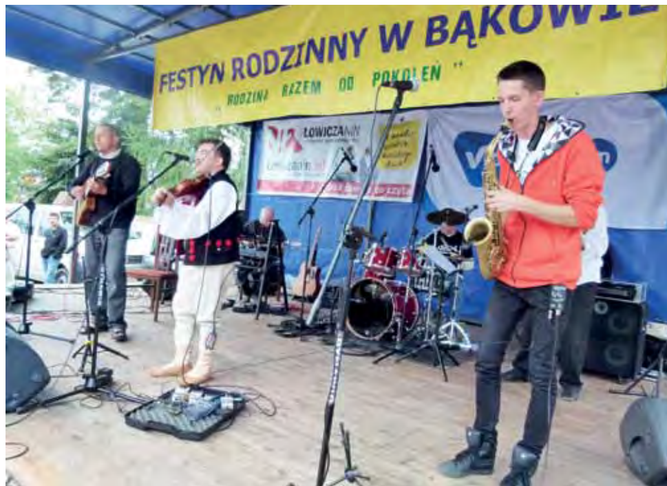
W swoich tekstach muzycy chwalą Boga. Robią to przy dźwiękach góralskiej muzyki.

Odpust po raz 10 połączony był z festynem rodzinnym. Przez cały dzień na placu przed kościołem bawiło się kilkadziesiąt osób, większość z nich uczestniczyła także w 2 mszach świętych odprawionych tego dnia. Do godzin wieczornych odbywały się konkursy dla dzieci, młodzieży i całych rodzin, a na scenie przed kościołem, licznej publiczności zaprezentowali się m.in. orkiestra dęta Ad Astra z Dzierżoniowa pod Łodzią, zespół Bąkowska Barka działający przy kościele w Bąkowie, Reprezentacyjny Zespół Pieśni i Tańca Włóknarzy Poltex z Łodzi, który zaprezentował tańce, pieśni i obrzędy z wielu regionów Polski, wspomniani Siewcy Lednicy oraz teatr ognia Fireproof z Kutna. Uczestnicy festynu brali także udział w loterii fanowej, gdzie nagrody ufundowali sponsorzy. Do wygrania było m.in. kilka rowerów, taczki,