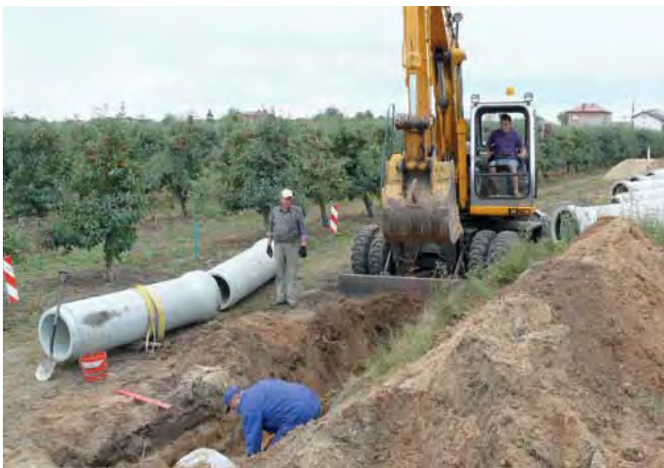
Pracownicy Zakładu Usług Komunalnych rozpoczęli układanie kolektora deszczowego, który odprowadzi wodę z ulicy Sadowej i Nałkowskiej na osiedlu Górki, czyli od ujęcia do kanału melioracyjnego.

Obecnie roboty prowadzi jedna brygada, ale prawdopodobnie jeszcze w tym tygodniu dołączy do nich druga, która zacznie pracę w ul. Sadowej. Budowa kanalizacji ma przygoto-