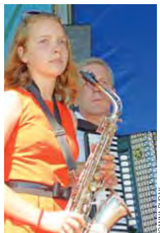
Młoda saksofonistka wystąpiła wraz z członkiniami Kół Gospodyń Wiejskich.