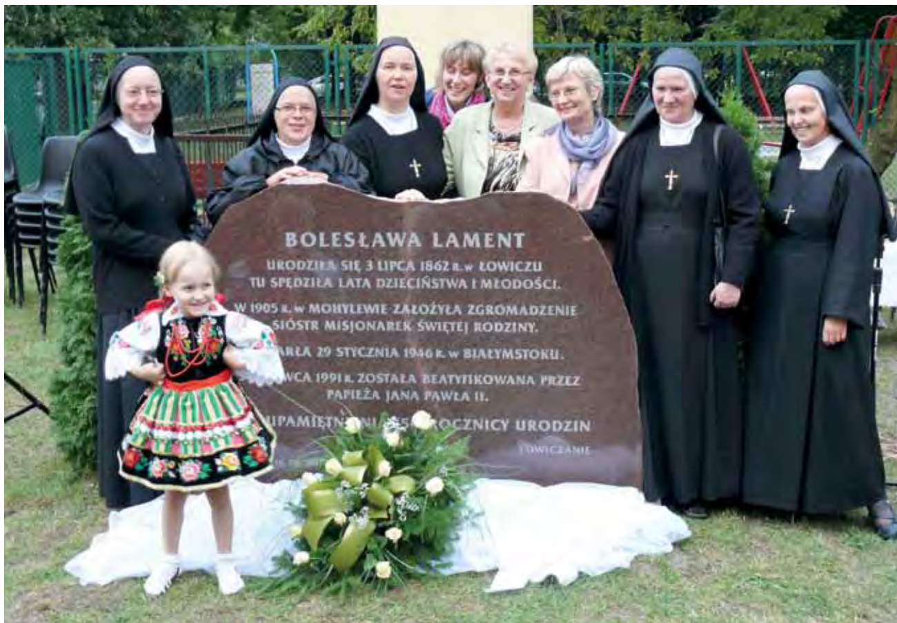
Pamiętkowe zdjęcie Zgromadzenia Sióstr Misjonarek Świętej Rodziny przy głazie odsłoniętym w czasie uroczystości

Łowicz | Na świętego Rocha uczcili błogosławioną łowiczką