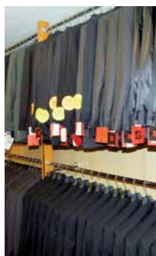
Ze sklepu skradziono kilkanaście garniturów oraz kilkaset złotych. Właściciel sklepu straty oszacował na ok. 7,6 tys. zł. td

Sprawcy, jako cel włamania upatrzyli sobie sklep z garniturami znajdujący się nieopodal skrzyżowania ulicy Zduńskiej z ulicą Browarną. Sklep sąsiaduje z budynkiem, będącym pustoszanym i to stamtąd sprawcy przedostali się na stryżek nad sklepem.