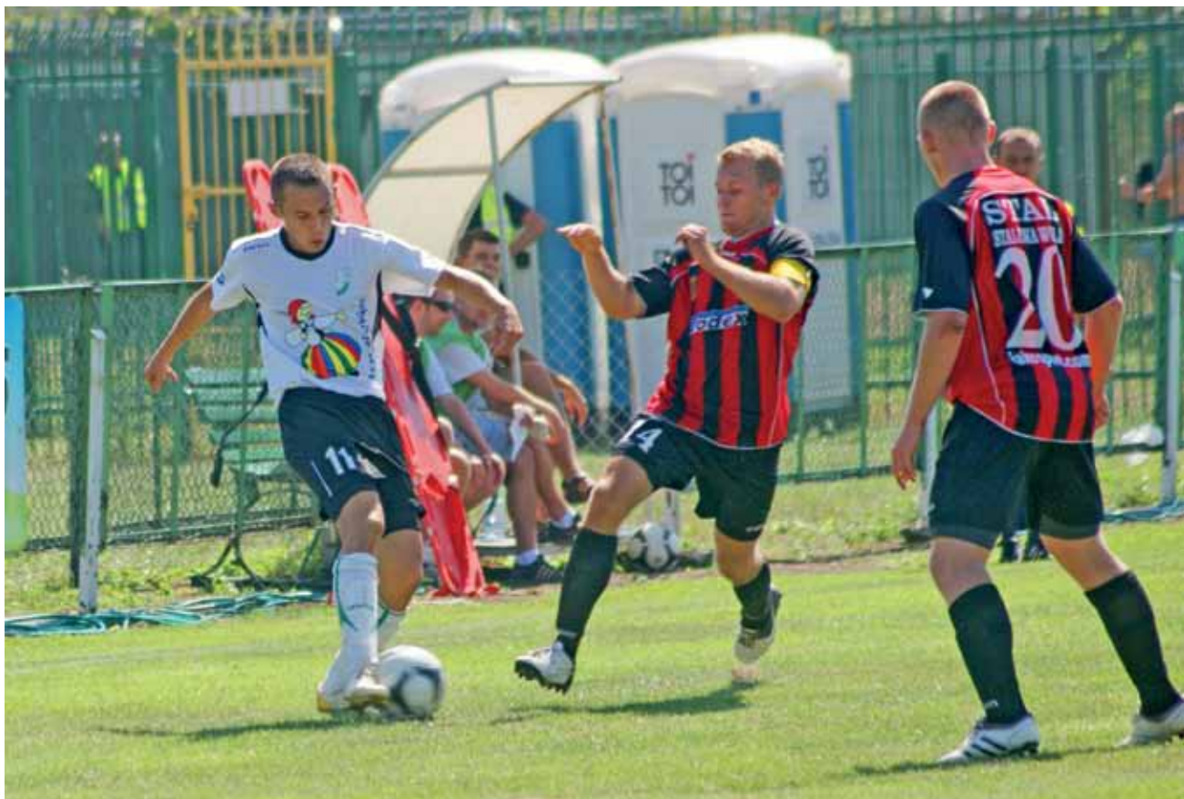
Stal Stalowa Wola przełamala swoją fatalną passę i w końcu wywiozła z Łowicza choć jeden punkt.