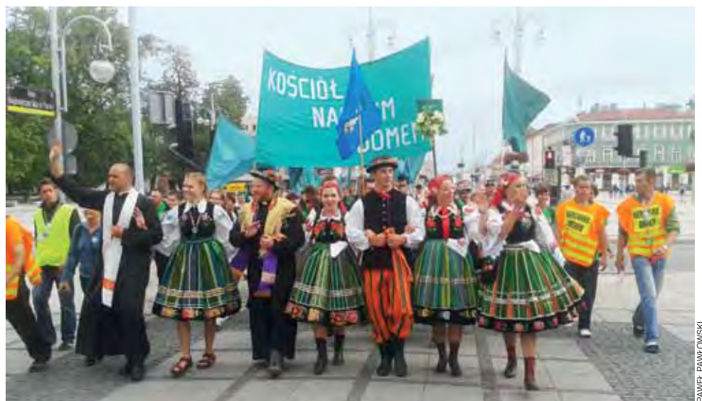
Grupa zielona tuż przed wejściem na Jasną Górę. Część pątników do sanktuarium weszła w łowickich strojach ludowych.

■ O tej samej godzinie, w Łowiczu na ul. Piątkowskiej policjanci zatrzymali pijanego kierowcę. 56-letni mieszkaniec Skierniewic kierował samochodem marki Volkswagen mając 0,91 mg/dm 3 alkoholu w wydychanym powietrzu.