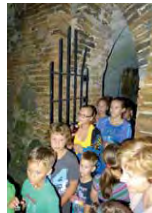
Uczestnicy pierwszej nocnej wycieczki zwiedzili groty pod Domkiem Gotyckim, gdzie ostatnio zdomowiła się zielarka.

Koszt 10 zł od dziecka, ich rodzice i opiekunowie nie płacą. tb