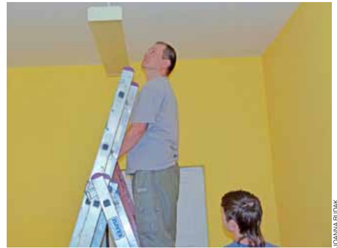
Pracownicy Servcom poza instalacją komputerów, instalują także oświetlenie w salach biblioteki.

Na piętrze powstanie Łowicka Izba Pamięci, poświęcona łowickiej kulturze ludowej i historii Bochenia. Prace nad nią zostaną przeprowadzone do-