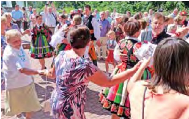
Przed kościołem św. Ducha w Łowiczu tańcowali zarówno gospodarze dożynek jak i pozostali parafianie.

W kościele św. Ducha po mszy św. częstowano dożynkowym chlebem oraz ciastem. Można było także potańczyć przy muzyce granej przez kapelę rodzinną Płachetów.