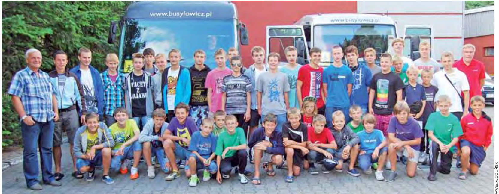
W Niechorzu do nowego sezonu przygotowywały się trzy zespoły Pelikana: juniorzy młodszy z rocznika 1996-97, zespół Michałowicza z rocznika 1998 oraz Górski (rocznik 2000).

Trener naszych juniorów zaplanował sobie dwa mecze kon-