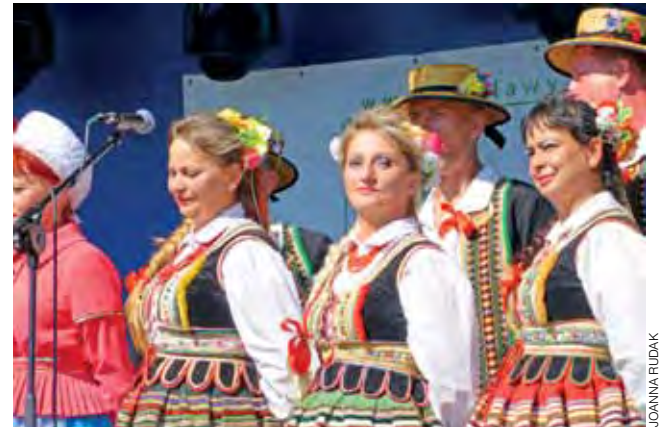
Podczas dożynek w Bielawach Zespół Pieśni i Tańca Ziemi Kutnowskiej przez godzinę bawił publiczność. Nie przeszkadzało im nawet w śpiewie i tańcu piekące słońce, które świeciło im prosto w oczy.

Powiat łowicki | Pierwsze dożynki w tym roku