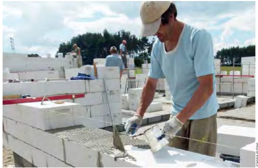
Pracownicy Admaru zapewnijają, że mieszkańcy Dąbkowic Górnych będą mogli bawić się w Sylwestra w swoim Domu Ludowym.