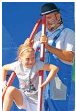
Dzieci nie tylko przyglądały się pokazom cyrkowym, ale także mogły w nich uczestniczyć.

balonik na druciku oraz wykopki. W turnieju I miejsce zdobyły Bielawy ze 109 punktami. II miejsce zajęli przedstawiciele Chruślina z 85 pkt. Ostatnie miejsce na podium zajęli mieszkańcy Sobockiej Wsi zdobywając 77 pkt.