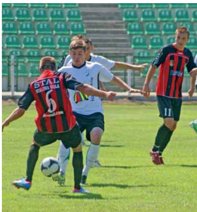
Na tle silnej Stali gracze Pelikana nie wypadli już tak okazale.

Cztery minuty przed przerwą łowiczanie doprowadzili do wy-