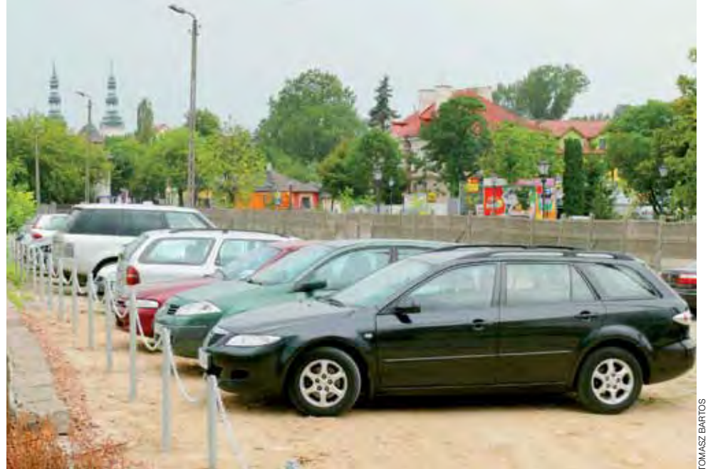
W środę, 22 sierpnia na nowo otwartym parkingu przy ul. 3 Maja stało w ciągu dnia ponad 15 samochodów. Liczba ta od momentu otwarcia wzrosła, tydzień temu stały 2.

Dla poprawy bezpieczeństwa na nowym parkingu wycięto rosnące na rampie krzewy, naprawiono nawierzchnię, wkrótce zaczną działać 2 z 5 latarni tam stojących. Parking można opuścić w 3 miejscach: bramą przy Kasi, przerwą w ogrodzeniu na wysokości budynku poczty i od strony parkingu PKS, gdzie także rozebrano fragment ogrodzenia. Pełka zastrzegł, że teren jest użyczony miastu przez kolej, prace przygotowawcze kosztowały ok. 10 tys. zł. Nie ma planów rozebrania betonowego ogrodzenia od strony 3 Maja, bo nie zgodziła się na to kolej. tb