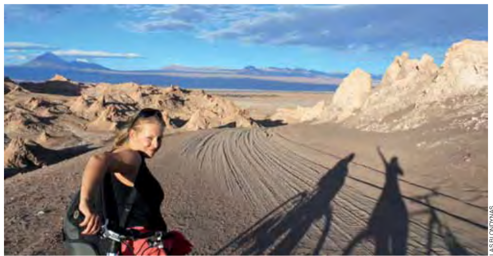
Chile. W tym miejscu mogły mieć wrażenie, że są na dachu świata.

Często przecierałyśmy także oczy ze zdziwienia, nie mogąc uwierzyć w to, co dzieje się dookoła! Począwszy od Wenezueli, kraju największych absurdów, rządzonego przez Chaveza, gdzie woda kosztowała więcej niż paliwo, a Park Narodowy Canaima urzekł nas swoim pięknem. Nikt nie obrabował nas w Caracas, najniebezpieczniejszym mieście świata. W Kolumbii uczyłyśmy się tańczyć merenge, a w Ekwadorze salsa. Peru oczarowało nas swoimi kolorami oraz naturą, tutaj przeszliśmy chorobę wysoko-