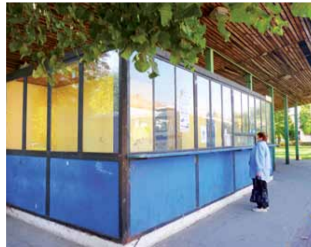
Pusty kiosk szpeci rynek w Kiernozi.

Wójt na pytanie, czy może lepiej byłoby zburzyć ten budy-