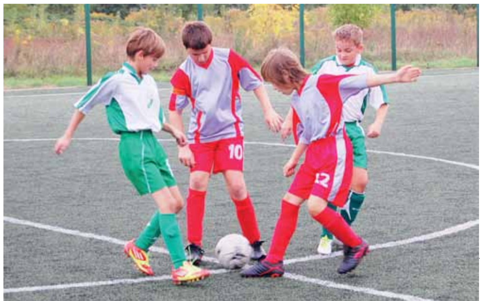
Młodzi piłkarze Pelikana z rocznika 2001 mają na koncie komplet sześciu zwycięstw.