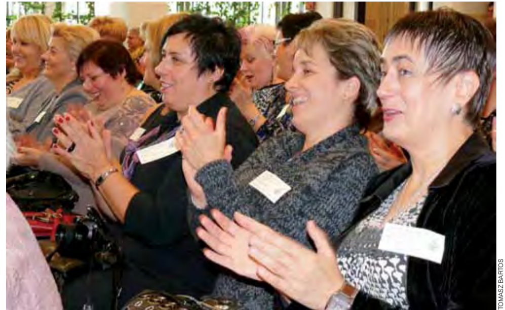
Mimo że pracujące w publicznej służbie zdrowia pielęgniarki narzekają na obecną sytuację w swoich szpitalach, w czasie zjazdu w Łowiczu starały się dobrze bawić.

W zjeździe wzięły udział 54 absolwentki. To niestety zaledwie 1/3 frekwencji ostat-