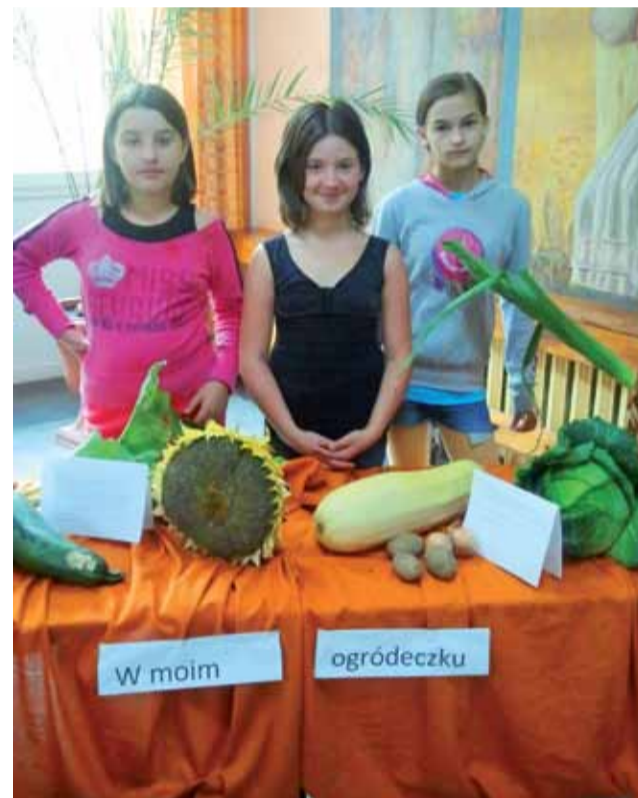
Słoneczniki, kapusta, orzechy, kabaczki – to jedne z eksponatów na wystawie w Czwórcie.