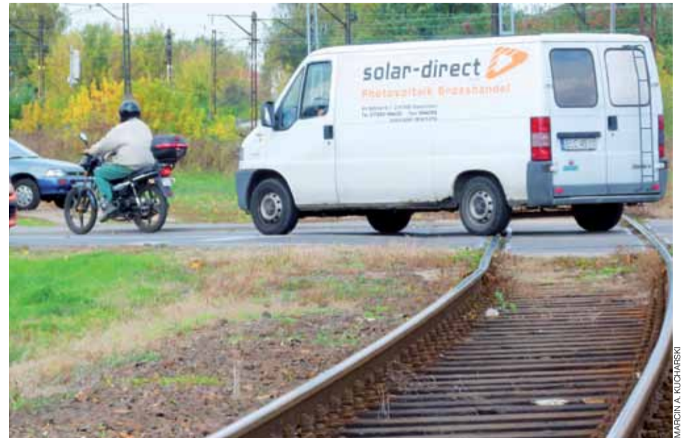
Podczas remontu torowiska pomiędzy Łowiczem Głównym a Łowiczem Przedmieście na kilka godzin będzie wyłączony z ruchu przejazd kolejowy na ul. Kłickiego.

Koleje Mazowieckie również informują o utrudnieniach spowodowanych remontami oraz związanych z tym zmianach. Zmiany w kursowaniu pociągów w tej spółce mają trwać do 8 grudnia. Podobnie jak w przypadku Przewozów Regionalnych jest ich dużo, jednak wiele z nich jest minutowych oraz dotyczą różnych terminów. Np. pociąg Mazovia, który odjeżdżał ostatnio z Łowicza Głównego o godz. 6.23 (wcześniej o 6.38), od 16 października będzie odjeżdżał o 6.40. Warto też zwrócić uwagę, że w związku z zamknięciem warszawskiej