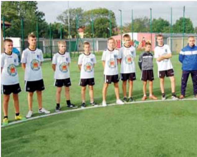
Najlepsza okazała się ekipa z PG Błędów.