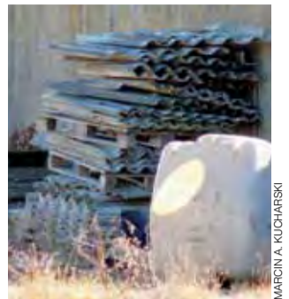
Podrzucony eternit musi zutilizować na własny koszt Urząd Gminy w Sannikach.

Gmina zwracała się do mieszkańców z prośbą o przywiezienie gruzu, a nie eternitu, który teraz na jej koszt należy utylizować. Okazało się, że eternit został podrzucony na plac GS-u już nie po raz pierwszy. Około miesiąc temu ktoś bowiem przywiózł na plac i zostawił niewielką jego ilość. – Wtedy nie zgłaszaliśmy tego na policję, to teraz mamy wykorzystywany na utwardzenie dróg gruntowych. mak