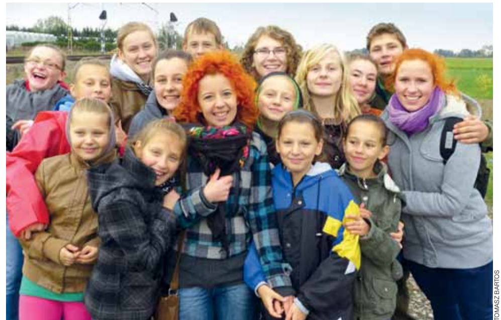
Uczestnicy gry terenowej z 96 Łowickiej Drużyny Wielopoziomowej Bezimienni, działającej przy Szkole Podstawowej w Mysłakowie.

się wziąć udział w grze. Już na ul. Płockiej, gdzie umieszczono pierwszy punkt kontrolny, mogli zobaczyć zaskakującą pamiątkę przeszłości – betonowy fundament, na którym zamontowane było niemieckie działo przeciwlotnicze Flak 88. Po tym było już tylko ciekawiej: w punkcie urządzonym w piwnicach ratusza znaleźli się oni w zaimprovizowanym schronie przeciwlotniczym i przeżyli zaimprovizowany nalot, któremu towarzyszył huk wybuchają-