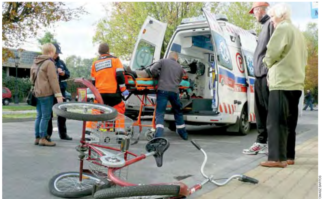
Złamany obojczyk, żebro i wstrząs mózgu to obrażenia rowerzystki, która wjechała na pasy w Alejach Sienkiewicza wprost pod koła Mercedesa.

■ 10 października o godz. 14.30 w Uchaniu Górnym 46-letni mieszkaniec Skierniewic, kierujący Oplem Astrą, zjechał do rowu, unikając zderzenia ze stadem saren, które przebiegały przez drogę. Mężczyzna był trzeźwy, w wyniku kolizji złamał palec.