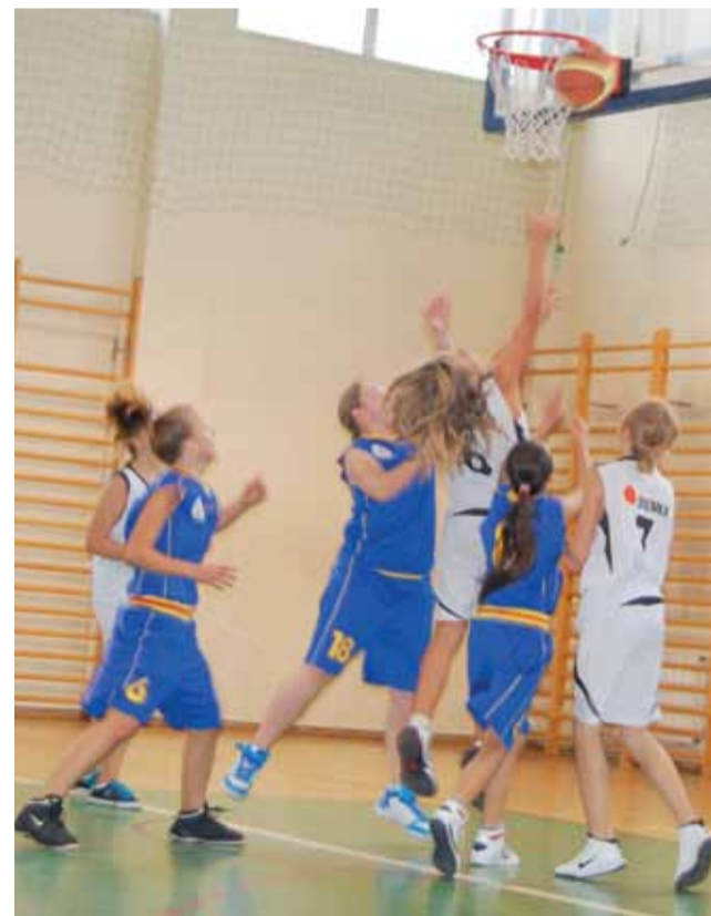
Łowiczankom nie udało się zatrzymać silniejszej zawodniczki Ósemki.