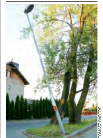
Latarnia pomiędzy ulicą Sobieskiego a parkingiem przy dyskontie Biedronka na Zatorzu jest krzywa niczym wieża w Pizie. Od kilku miesięcy coraz bardziej się pochyla, bo zaczepiają o nią samochody dostawcze manewrujące na placu. tb