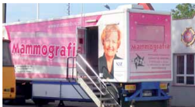
Mammobus zaparkował na placu pomiędzy miejscową remizą strażacką a Urzędem Gminy w Łyszkowicach.