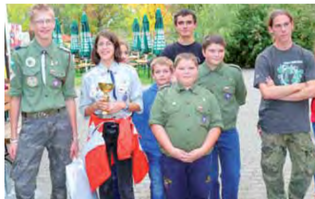
W grze zwyciężył patrol z 27. Łowickiej Drużyny Starszoharcerskiej NIN HIL z Kocierzewa, zdobyli oni zdecydowanie najwięcej punktów.