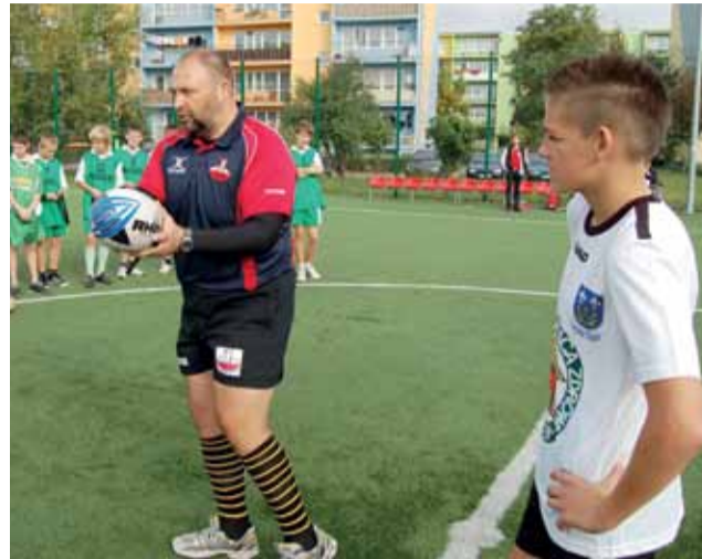
Ostatnie szkolenie przed turniejem.