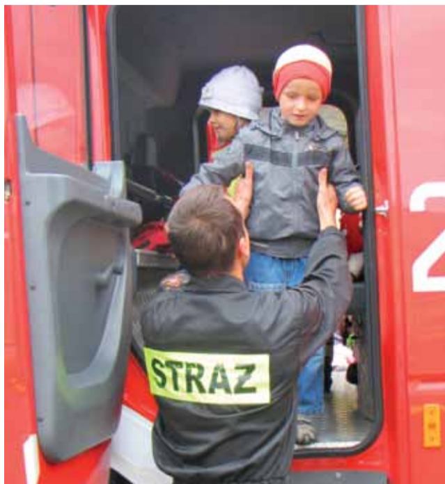
Marzenie każdego przedszkolaka – poczuć się jak prawdziwy strażak, dzieci z Księżackiej miały taką okazję.

Przeprowadzona została niezapowiedziana próbna ewakuacja pracowników i wszystkich przebywających w nim dzieci na wypadek zagrożenia spowodowanego pożarem. Strażacy skontrolowali wyposażenie przedszkola i oznaczenie dróg ewakuacyjnych. Po zakończonej akcji dzieci, które wyprowadzono na zewnątrz budynku, mogły zobaczyć wyposażenie strażackiego wozu bojowego. Jeden z przedszkolaków, ku uciechu kolegów i koleżanek, został przypięty do deski służącej do ewakuacji rannych. Atrakcją dla dzieci była możliwość wejścia do wnętrza kabiny wozu strażackiego. Na zakończenie strażacy przeprowadzili dla dzieci szkolenie dotyczącego tego, jak należy zachować się w przypadku pożaru. tb