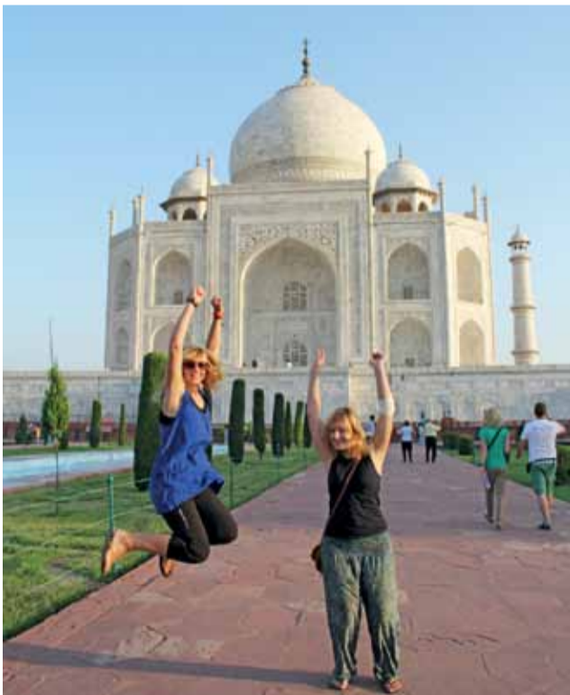
Taj Mahal. Najszlachetniejszy grobowiec świata.