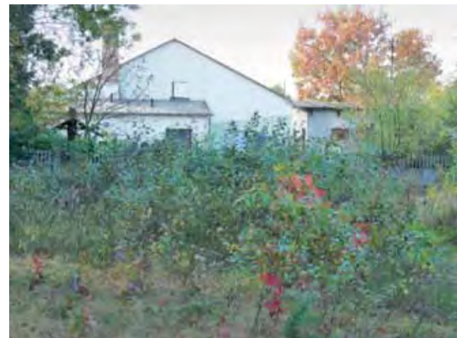
Na razie na działce rosną dziko krzaki, ale już za kilka tygodni ma tu powstać plac zabaw. W tle budynek Warsztatów Terapii Zajęciowej.

przede wszystkim uczniowie z trudnościami, które w przyszłości mogłyby stać się przeszkodą w kontynuowaniu edukacji. Uczniowie będą pracować w grupach od 15 do 25 osób. Każdy uczeń będzie zobowiązany do udziału we wszystkich zajęciach. Ponadto zostanie przeprowadzony konkurs na najciekawsze zajęcia zrealizowane w ramach dofinansowania. Wyróżnione w konkursie grupy otrzymają dodatkowe pieniądze na dofinansowanie wyjazdów wakacyjnych. mak