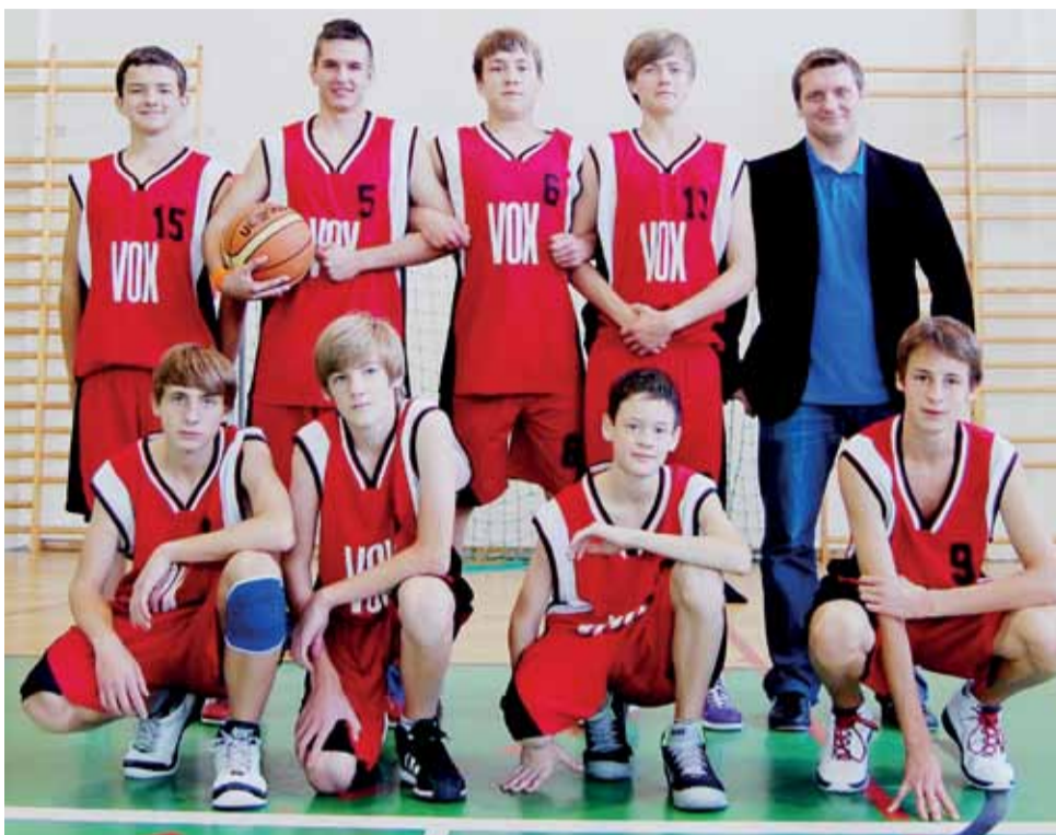
Kadeci Księżaka Łowicz rozpoczęli sezon 2012/13 od wysokiego zwycięstwa w Skierniewicach.

Po I. kolejce łowiczanie zajmują w wojewódzkiej lidze kadetów w grupie B pierwsze miejsce. W niedzielę 14 października