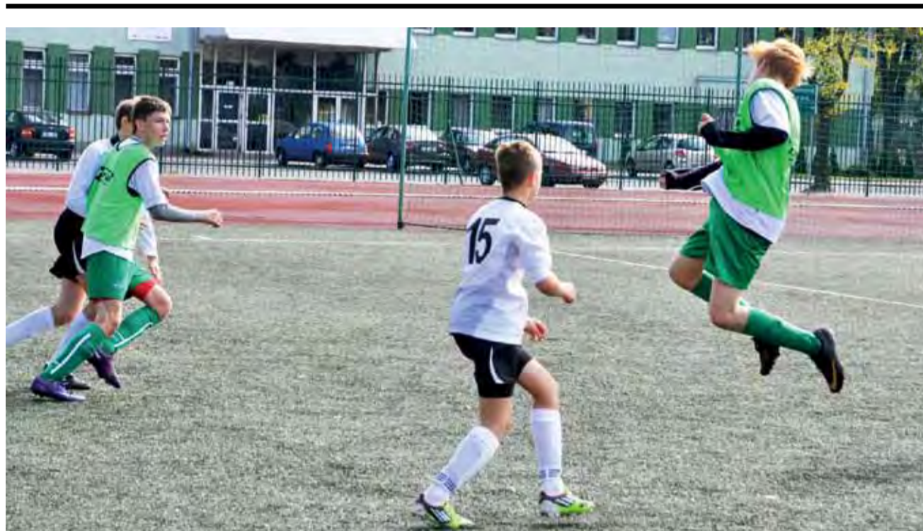
Ekipa Pelikana-98 Łowicz nie zdołała ani razu pokonać rywali z Bełchatowa.