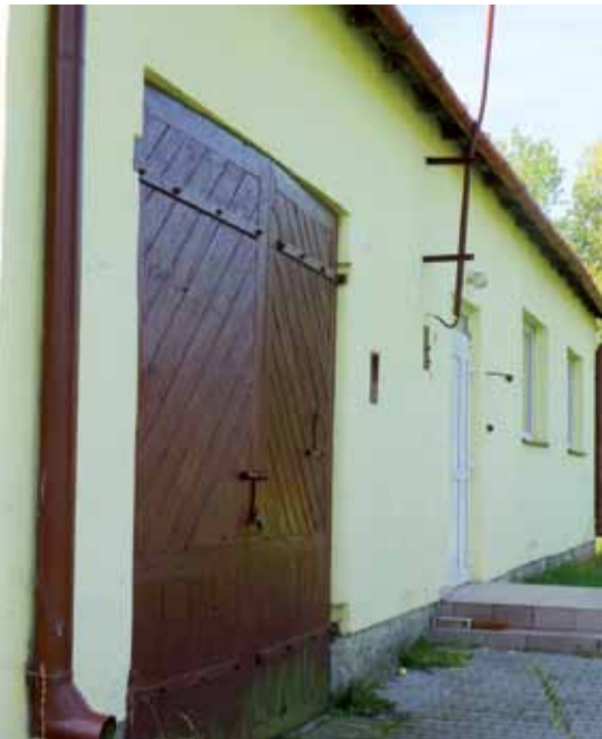
Ze ścian zewnętrznych Domu Ludowego w Mystkowicach farba opada płatami.