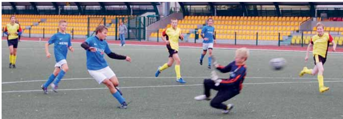
Pomimo wielu okazji, gracze Pelikana-99 Łowicz wygrali z Sierakowianką tylko 2:1.