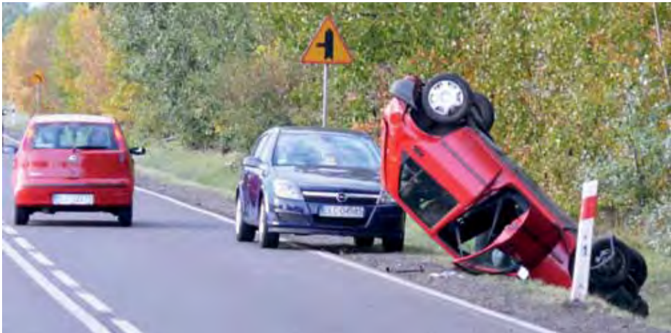
Czerwony Ford Fiesta leżący na poboczu drogi do góry kołami wywierzał na kierowcach duże wrażenie.