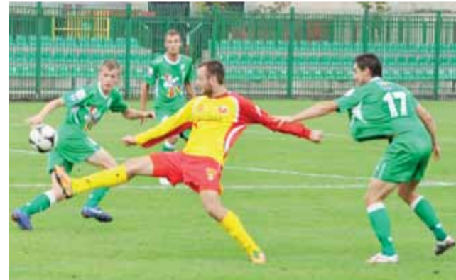
Pelikan ostatnio słabiej prezentuje się u siebie niż na wyjazdach.