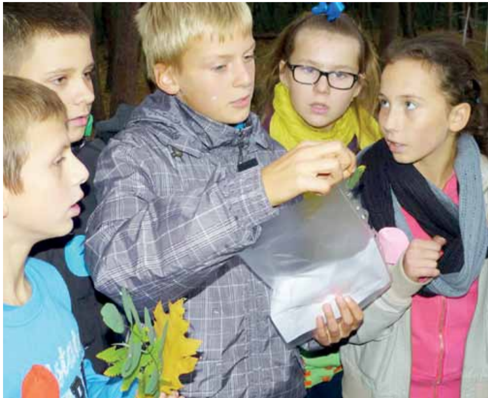
Jednym z elementów gry terenowej w Lesie Miejskim było rozpoznawanie gatunków drzew po liściach.

Cześć Królowi Maciusio- wi, dzisiaj my witamy go, bo mamy dzisiaj biwak no i zapraszamy go – śpiewała jedna z dwóch dziecięcych grup, które w piątek, zaraz po rozpoczęciu biwaku, wzięły udział w grze terenowej na terenie