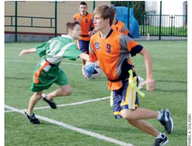
Uproszczone rugby tag to naprawdę fajna gra.