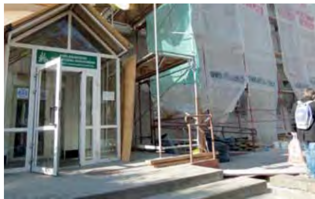
Prace na budynku mają zakończyć się do 20 listopada.