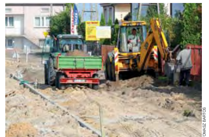
Ul. Sadowa jest obecnie mocno rozkopana, pracownicy ZUK dość szybko jednak posuwają się z pracami.

Będzie ona miała szerokość 5 metrów, dodatkowo po stronie zajętej przez domy zostanie