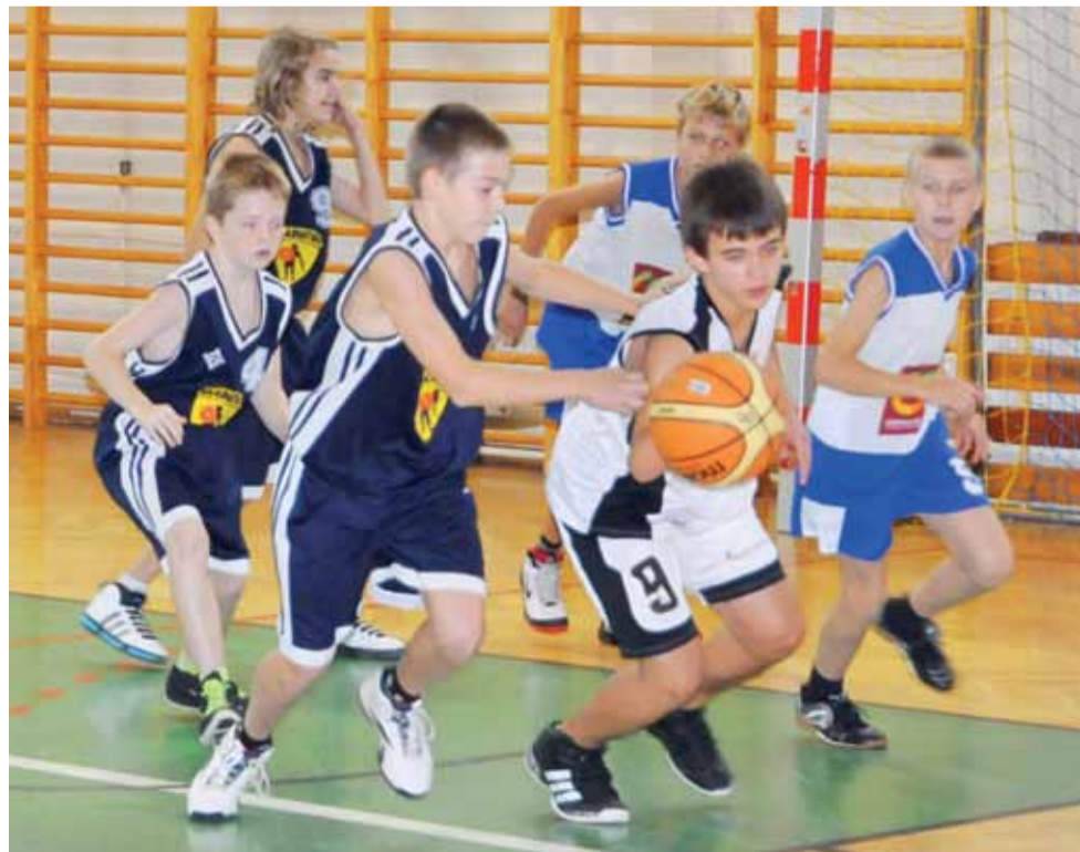
Łowiczanie nie dali większych szans rywalom ze Skierniewic.