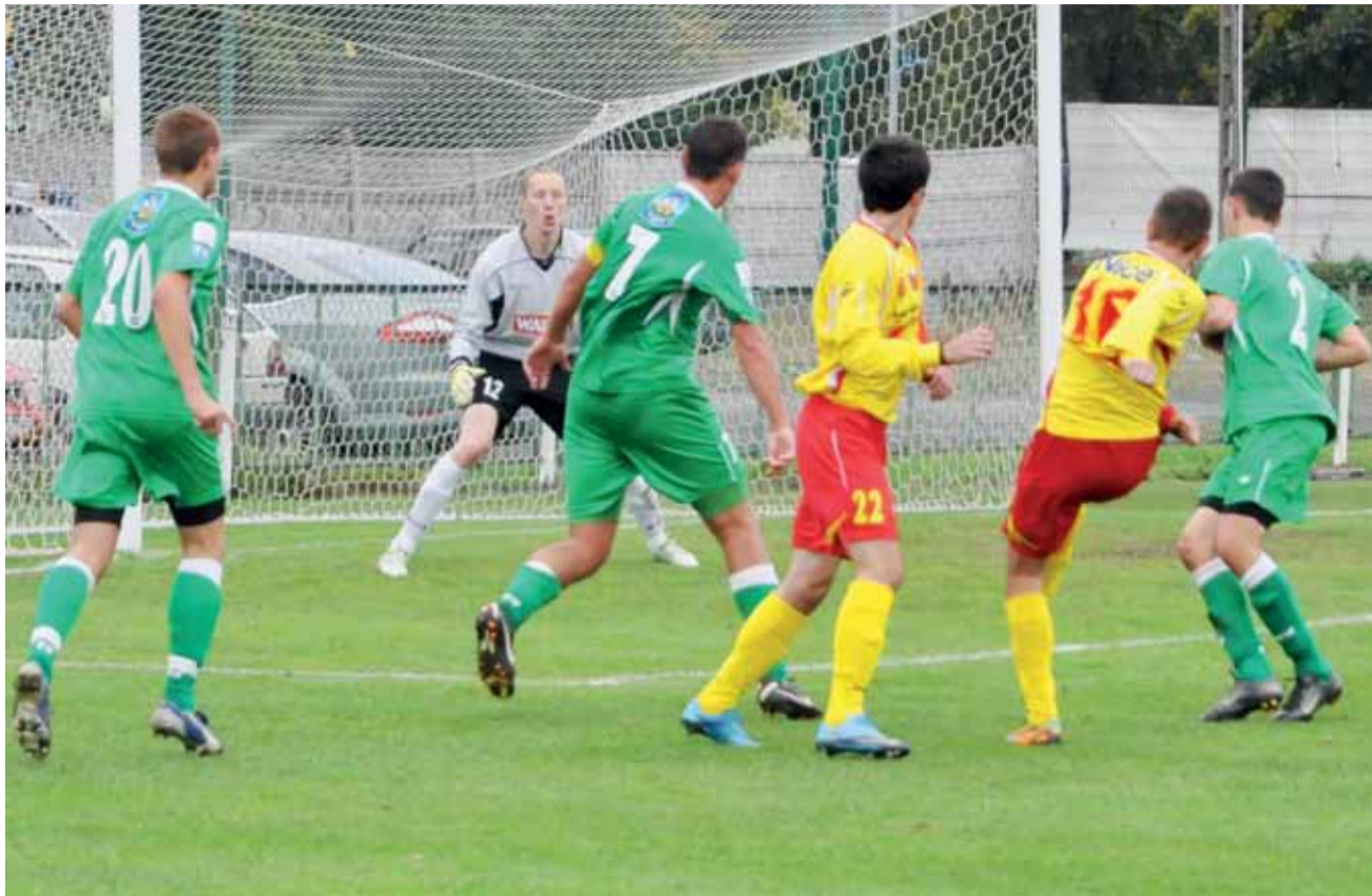
Piłkarze z Pruszkowa częściej dochodzili do sytuacji strzeleckich i stąd zwycięstwo Znicza w Łowiczu 1:0.