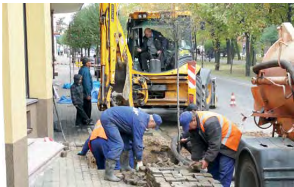
Awarię w Al. Sienkiewicza usuwali pracownicy ZUK.

Początkowo brano pod uwagę sądy, w których pracowało mniej niż 14 sędziów. Wówczas Sąd Rejonowy w Łowiczu podlegałby reorganizacji i działające w nim wydziały stałyby się wydziałami zamiejscowymi Sądu Rejonowego w Skierniewicach. mak