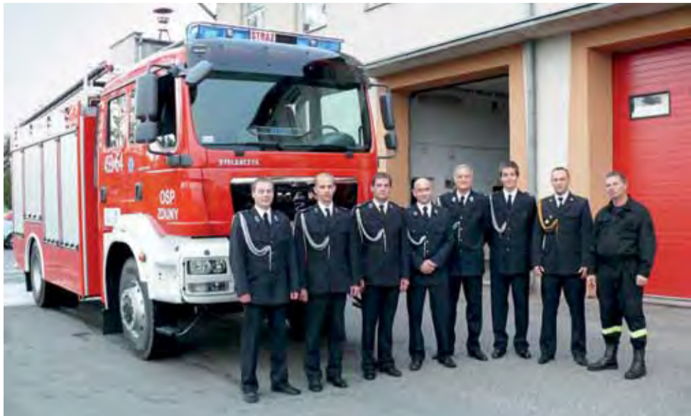
Zduńscy strażacy przed swoim nowym samochodem.