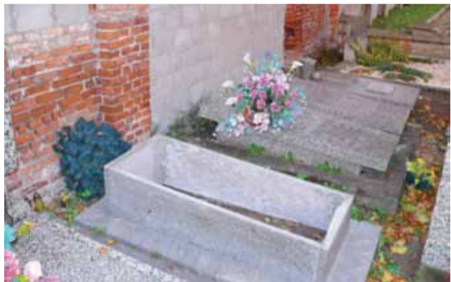
Grobowiec Leona Gołębiowskiego na cmentarzu katedralnym w Łowiczu, czeka na płytę z nowym napisem.

Leon Celestyn Gołębiowski urodził się 6 kwietnia 1866 r. w Lesznie koło Błonia, zmarł 14 kwietnia 1932 r. w Łowiczu. W latach 1908-1911 był prezydentem Łowicza, w latach 1918-1919 i 1923-1927 dwukrotnie burmistrzem. tb