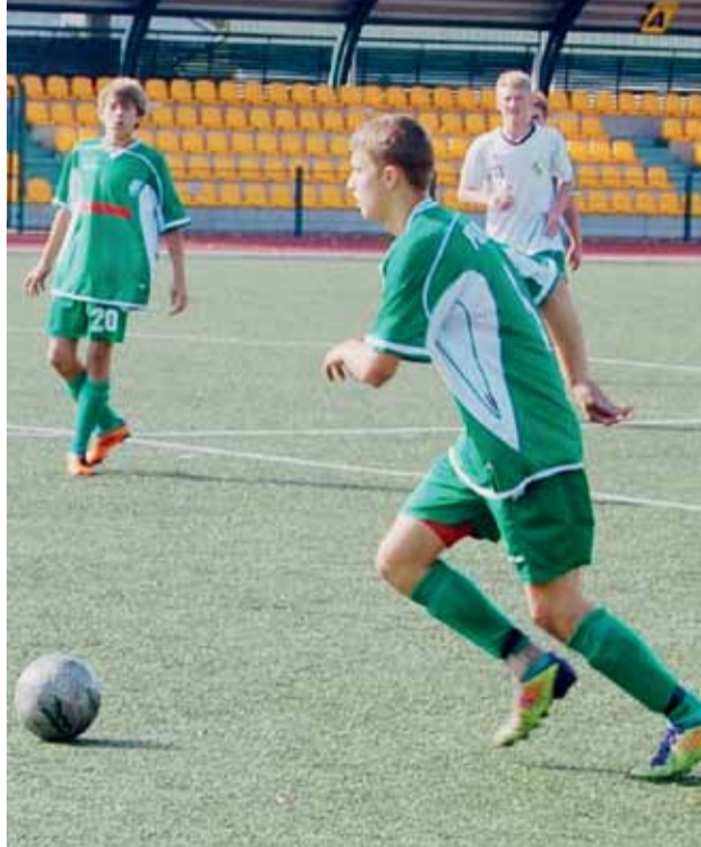
Pelikan-96 Łowicz wywalczył zwycięstwo w wyjazdowym meczu z Włókniarzem Zelów.

Po 9. kolejkach Pelikan awansował w ligowej tabeli na piątą lokatę w stawce siedmiu zespołów, mając na koncie siedem punktów. W 10. kolejce łowiczanin zagrają w sobotę 13 października w Łowiczu na stadionie OSiR z ekipą MKS-PMOS