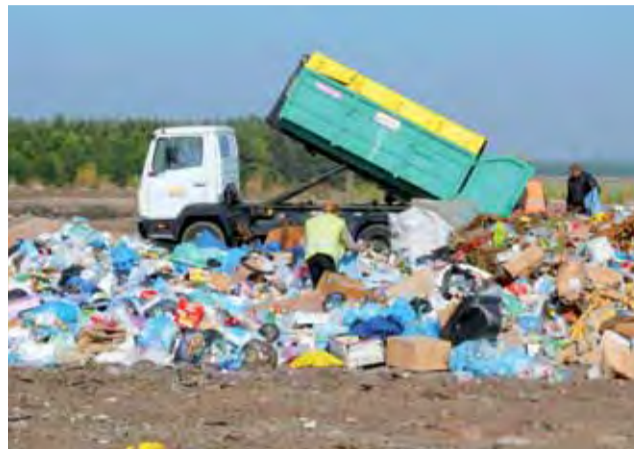
Wyładunek śmieci na wysypisku w Jastrzębi pod Łowiczem.

Ci krytykowali natomiast podejście przedstawicieli miasta. –