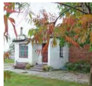
Dom Andrzeja S.

Policja działała szybko. Jeszcze 3 października zatrzymano