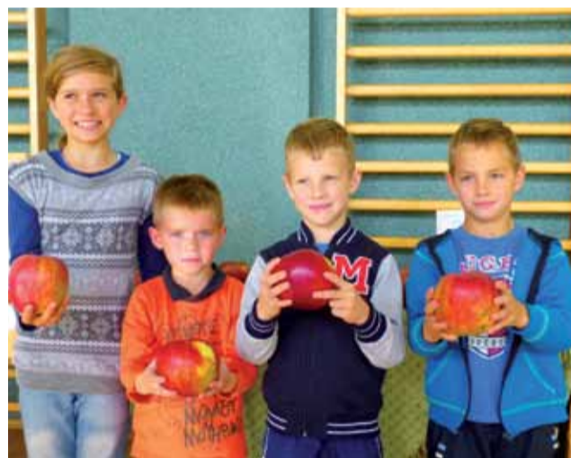
Zwycięzcy konkursu na największe jabłko.

W rywalizacji dotyczącej wiedzy na temat jabłka, jego wpływu na zdrowie, rodzaje i historię uprawy, a także powiązania z mitologią grecką, starły się trzy trzyosobowe drużyny z biorących udział w spotkaniu podstawówek. Wygrali uczniowie ze szkoły w Błędowie, II miejsce zajęli uczniowie z Gagolina, III miejsce uczniowie z Łaguzewa. Wszyscy czekali z niepokojem na rozstrzy-