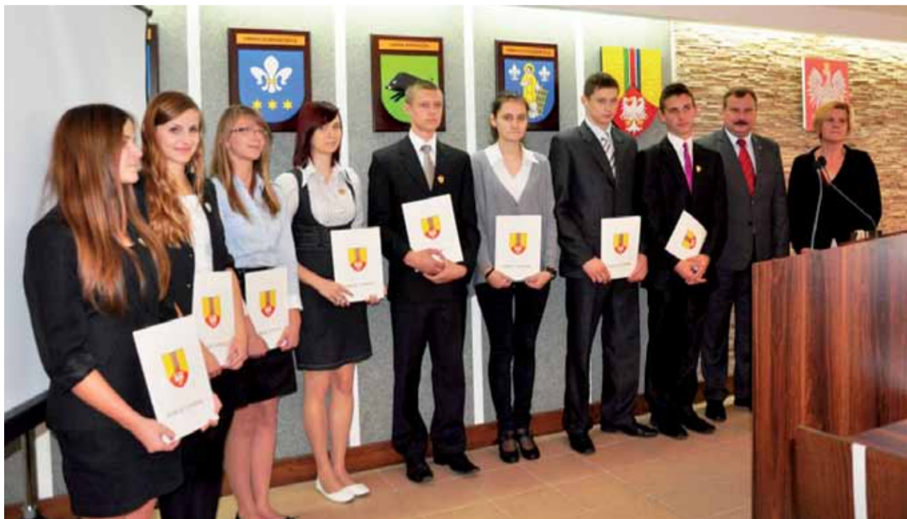
Stypendyści uroczysto odebrali stypendia na sesji Rady Powiatu Łowickiego 26 września.