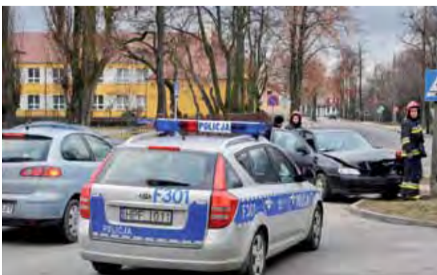
W sobotniej kolizji uczestniczył także Seat Cordoba, który jechał ul. Mickiewicza.