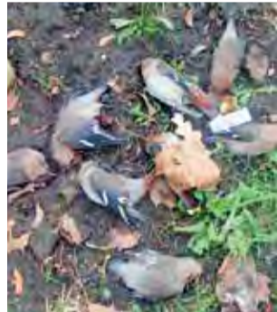
Jemioluszeki, które zabiły się o szklaną powierzchnię ekranu akustycznego przy łowickim Tesco.

Mieszkaniec dobrze rozpoznał martwe ptaki: pod szklaną szybą były tam martwe sikory, drozd, kwiczoł, ale najwięcej było jemioluszek, które zimują w Polsce, przylatując do nas z dalekiej północy. Przemierzają się one z drzewa na drzewo,