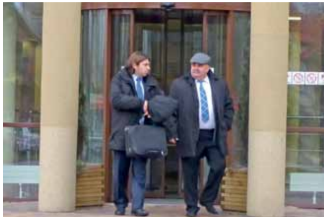
Wójt gminy Łyszkowice wychodzi z Sądu Rejonowego w Łowiczu wraz ze swoim mecenasem.

Inne zarzuty dotyczą wydawania poleceń pracownikom placówek oświatowych. Wójt miał domagać się od nich, aby zatrudniali członków jego rodziny. Domagał się również, żeby placówki oświatowe czyniły zakupy w sklepach, których właścicielami są członkowie rodziny wójta. Miał też wymusić na podległych gminie szkołach, żeby zmieniły ubezpieczyciela na firmę, której przedstawicielem była określona pracownica Urzędu Gminy w Łyszkowicach. Prokuratura postawiła w związku z tym 5 zarzutów, które dotyczą szkół w Kalenicach i Stachlewie. Prokuratura informowała również