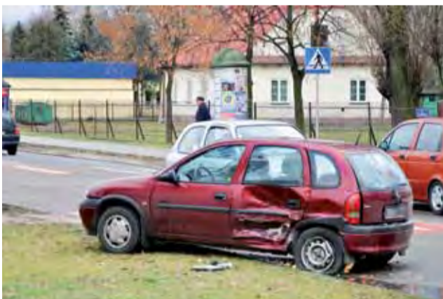
Sprawcą kolizji był kierowca Opla Corsy.

– Będziemy z mecenasem pisać o jak najszybsze wyznaczenie terminu. Im szybciej, tym lepiej – mówi wójt. Według mecenasa Tutiunika sprawa jednak szybko nie znajdzie swojego finału. – Mogą to być i ze dwa lata – uważa obrońca. mak