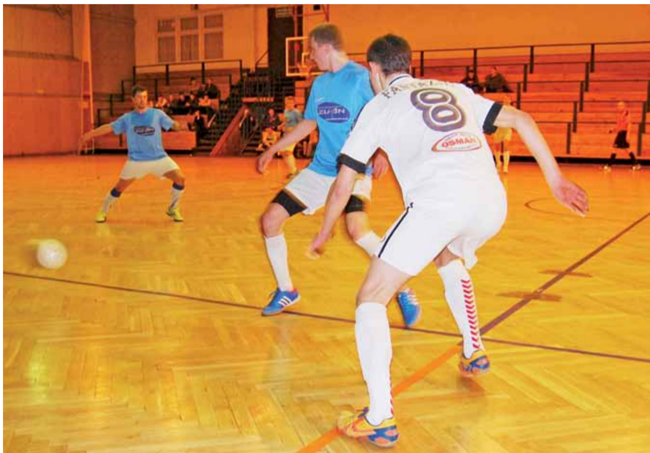
Po sobotnim zwycięstwie z Zatorzem ekipa Fantazji Głowno następnego dnia została boleśnie sprowadzona na ziemię przez Imadła...