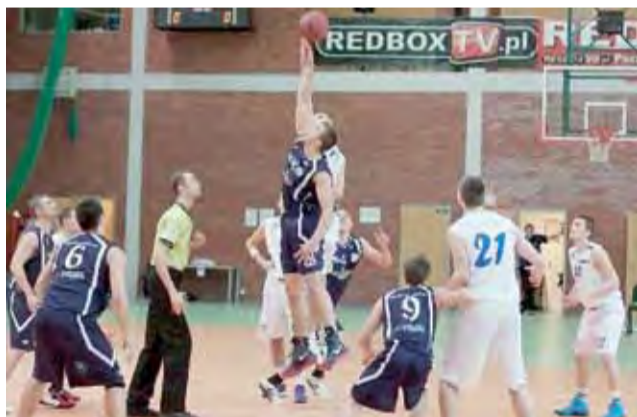
Łowiczanie odnieśli na przedmieściach Poznania szóstą wygraną.