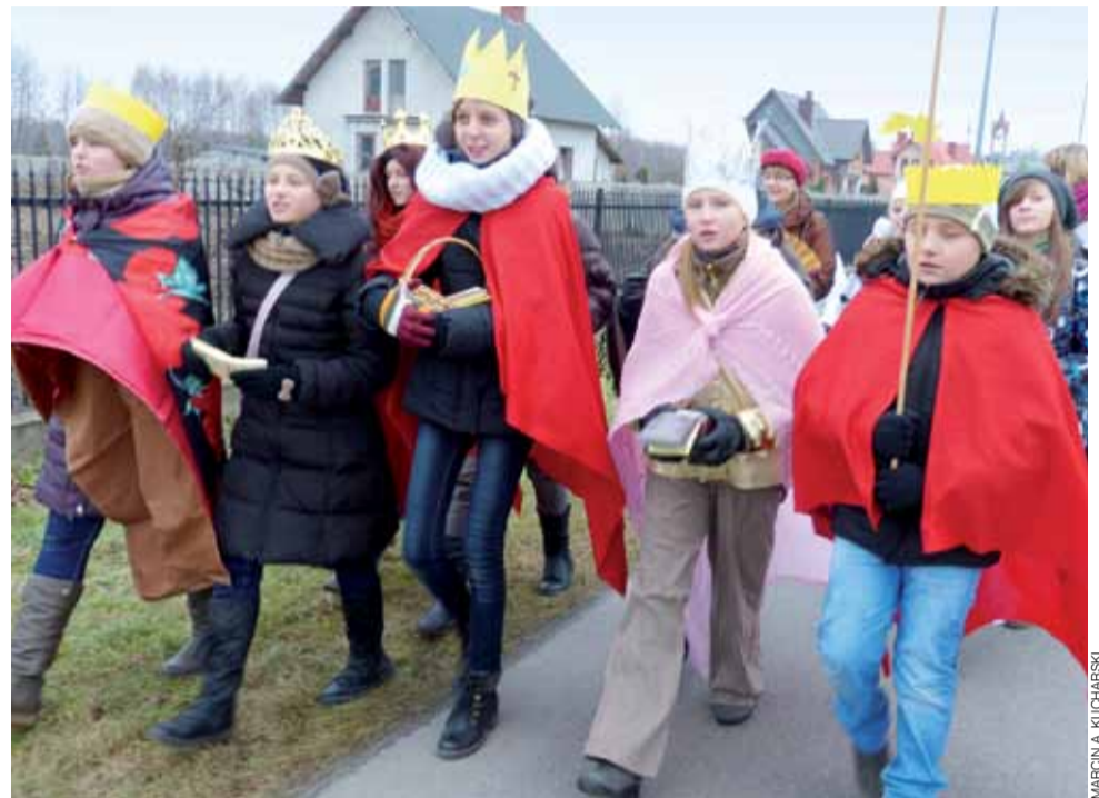
Kolednicy z Koła Misyjnego odwiedzali dom za domem. Wszędzie śpiewali kolędy, w drodze również.

Zanim kolednicy rozpoczęli odwiedzać mieszkańców Parmy, uczestniczyli w mszy świę-