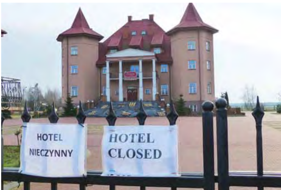
Interrex został zamknięty w listopadzie ubiegłego roku - i nadal nie został sprzedany.

Tymczasem 3 miesiące później – 1 listopada ubiegłego roku – Interrex został zamknięty dla gości, a na bramie wjazdowej pojawiły się dwie białe kartki formatu A4 z napisami „hotel nieczynny” i „hotel closed”. W związku z tym, że brama wjazdowa oddalona jest o kilkadziesiąt metrów od drogi krajowej nr 92, informacja ta jest mało widoczna i zdarza się, że do hotelu nadal zjeżdżają podróżni. – To było do przewidzenia, że w końcu zamkna ten hotel, od kilku lat ruch jest przecież mniejszy. Myślę, że od kie-