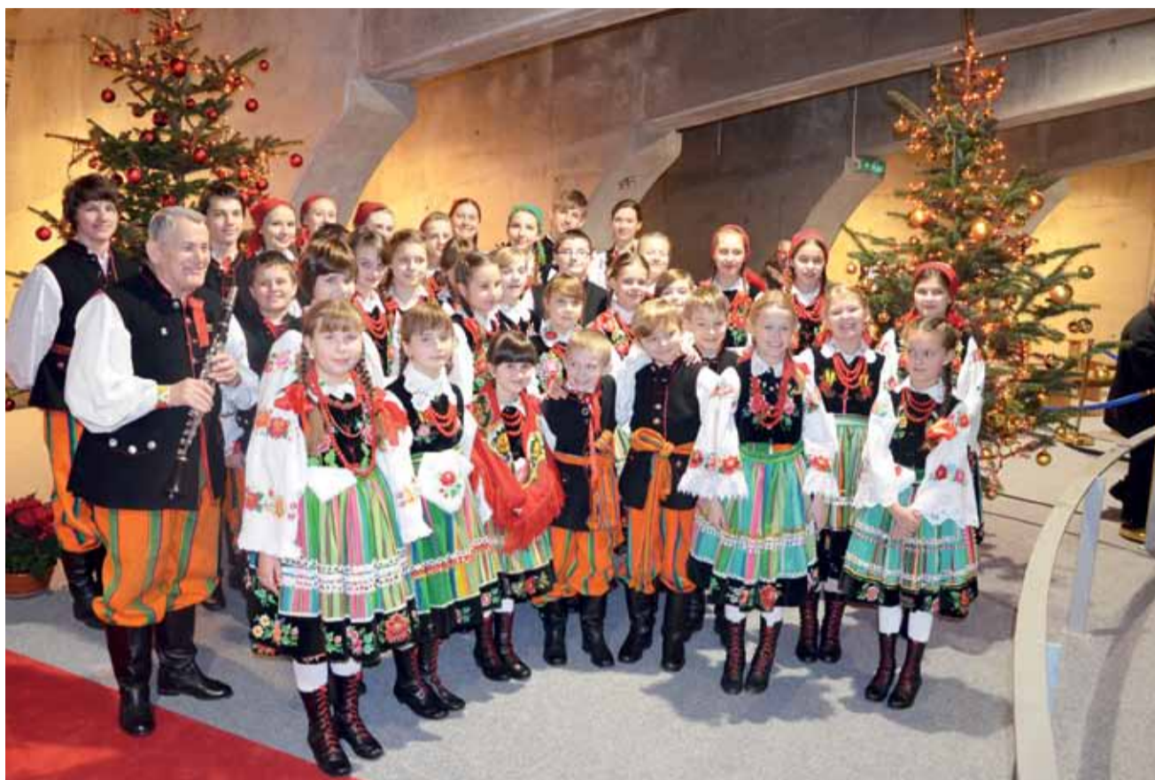
Koderki wystąpiły w regionalnych strojach. Świątynia, dzięki ich muzyce i przekazywanej radości, nabrała w niedzielę nowego blasku.

Większość została do samego końca, a później nagrodzi-