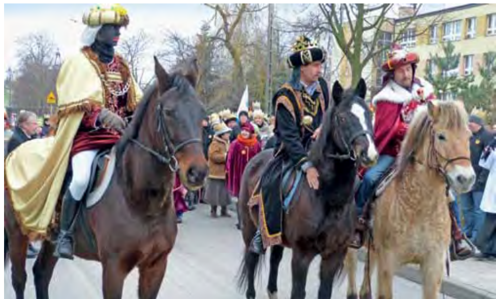
Trzej Królowie przyjechali na Korabkę na koniach, co wzbudziło, szczególnie u dzieci, duże zainteresowanie.

Zapraszamy do obejrzenia galerii zdjęć oraz filmu z wydarzenia w naszym portalu – www.lowiczanie.info