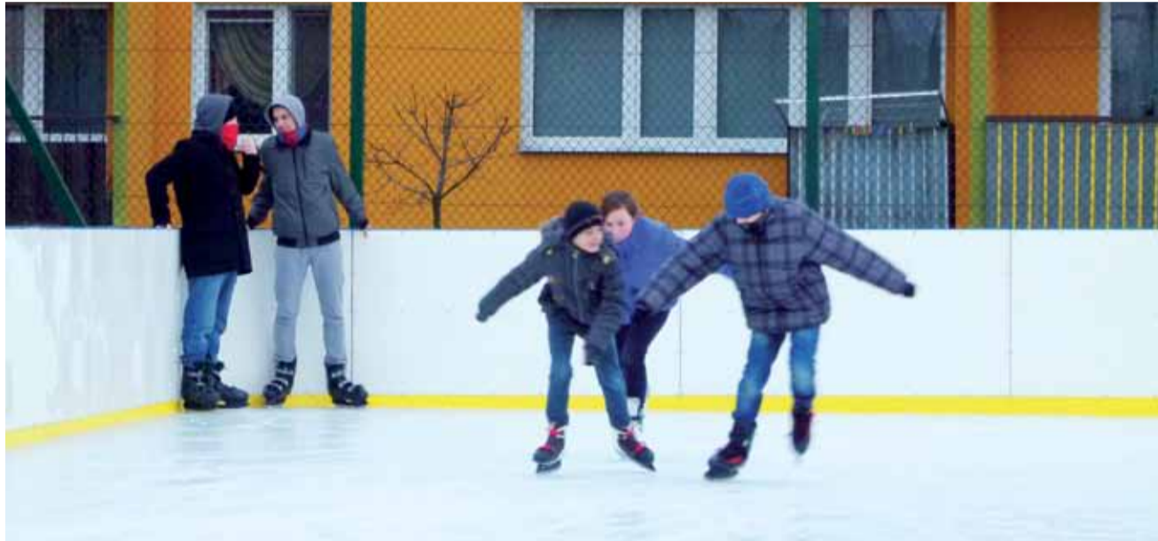
Lodowisko na Orliku usytuowane jest pod oknami czterech bloków os. M. Konopnickiej. Niektórych to sąsiedztwo cieszy, niektórym przeszkadza.