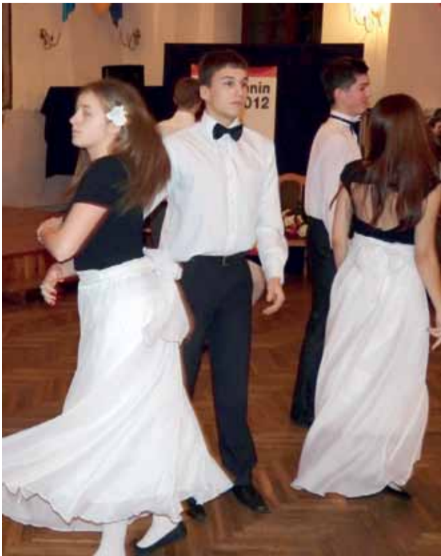
Walca zatańczyły cztery pary z II LO w Łowiczu.