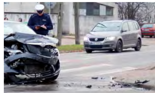
W wyniku wypadku przednia część Skody została mocno zniszczona.

Miasto może liczyć na dofinansowanie aż 1 mln 925 tys. zł z Urzędu Wojewódzkiego w Łodzi w ramach Narodowego Programu Przebudowy Dróg Lokalnych. Dotacja pokryje 50% kosztów całej inwestycji. O tym, że jest ona niezwykle potrzebna, świadczy chociażby ostatnie dni. W sobotę 5 stycznia zdarzyły się tam dwie kolizje, o czym piszemy obok. Z kolei we wtorek 8 stycznia o godz. 14.17 doszło