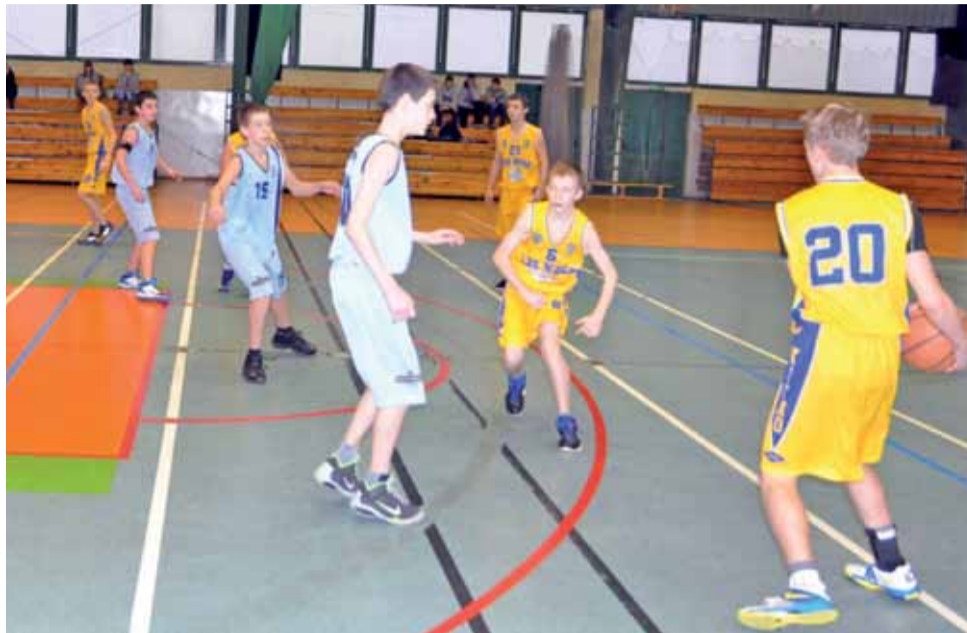
Młodzicy Księżaka-99 co prawda przegrali, ale zaprezentowali się znacznie lepiej niż kilka tygodni wcześniej w zagrani w Kutnie.