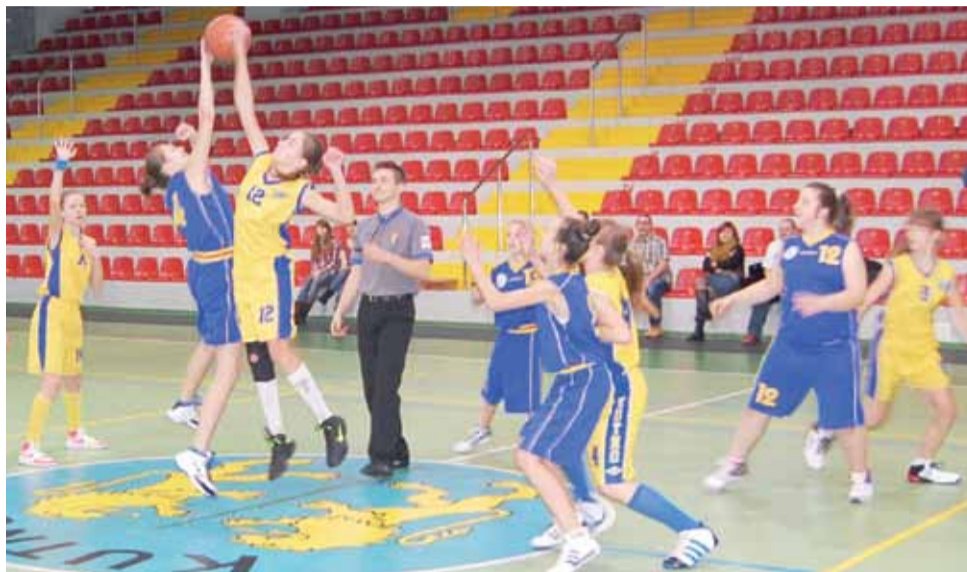
Łowiczanki niezbyt dobrze rozpoczęły rywalizację w 2013 roku.

Kolejny mecz młodziczki rozegrają w piątek 11 stycznia. O godz. 15.30 rozpocznie się wyjazdowy mecz z Liderem Tomaszów Mazowiecki. PALP