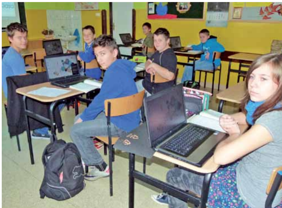
Uczniowie kl. VI Szkoły Podstawowej w Popowie cieszą się, że lekcji matematyki mogą uczyć się na przenośnych komputerach.

tematyce dzieci rozwiązując zadania interaktywne będą mogli od razu sprawdzić, czy odpowiedź, jaką zaznaczyły jest prawidłowa. Tak samo będzie wyglądać weryfikacja zadań z innych przedmiotów. Uczeń po jego rozwiązaniu od razu będzie mógł się dowiedzieć, ile procent prawidłowych odpowiedzi udzielił. Poza tym, obraz z pulpitu laptopa nauczycielskiego może być przesłany na laptopy uczniowskie, dzięki czemu będą mieli bezpośredni dostęp do danego materiału. jr