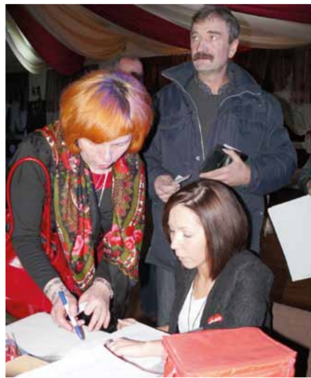
W czasie licytacji zwycięzcy mogli od razu wpłacić pieniądze i odebrać nagrodę.