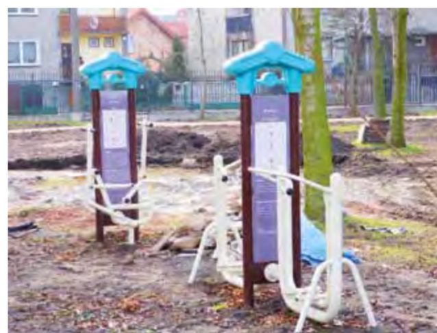
Urządzenia do ćwiczeń fitness stanęły w pobliżu baszty. Dostarczyła je firma Dr Spill.

Wykonawca zakończył już budowę ścieżki znajdującej się bezpośrednio wokół baszty. Została ona zbudowana z kamienia polnego. Pozostałe ścieżki powstającego skweru będą miały na-