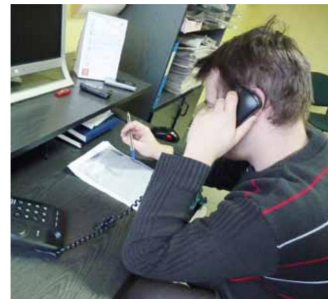
Przeczytaj umowę! Zawsze zanim zdecydujesz się na zmianę operatora telefonii sprawdź, jakie kary umowne grożą z tytułu przedterminowego rozwiązania obecnie obowiązującej umowy.

Pracownicy jej biura w Zgierzu starają się pomóc ludziom, analizując zawarte przez nich umowy, szukając błędów i zakazanych zapisów, stanowiących podstawę albo do ich rozwiązania bez konsekwencji finansowych, albo uznania umów za nieważne. Po poradzie nie trzeba nawet jechać do rzecznika osobiście, bo umowę do skontrolowania można przesłać do biura rzeczniczki faksem. Zdarza się jednak, że klienci nie mogą znaleźć umowy, w której określono wysokość kary umownej za odstąpienie od niej. Warto wiedzieć, że na piśmie żądanie operatora ma obowiązek przesłać do klienta ko-