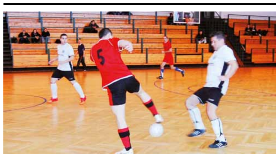
Olimpia Niedźwiada po zwycięstwie z Piorunami-Damagu utrzymała miejsce w czołówce III ligi ŁoLiF.