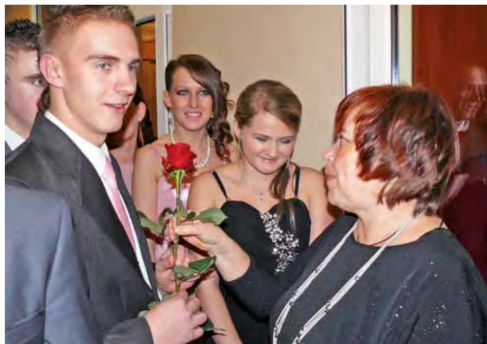
W sobotę poloneza w restauracji Szkiełka zatańczyli maturzyści z Blichu – na zdjęciu ostatnie chwile przed rozpoczęciem tańca.