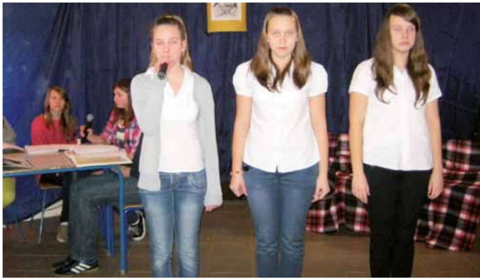
Gimnazjalistki z Bolimowa przypominały postać Janusza Korczaka, jego twórczość i osiągnięcia.

ogrodzeniu parku. Plot miejscami, jak w rosyjskiej bajce o biednym chłopie i złotej rybce. Gdyby nie podpierające go krzewy, pewnie już by się przewrócił. Park w Arkadii to chłuba i duma Ziemi Łowickiej. Co roku odwiedzany przez dziesiątki tysięcy turystów. Ale szanowna komisja z tzw. grupy rybackiej dzieląca unijne pieniądze preferowała boiska w niewielkich wioskach gminy Domaniewice, która – zdaje się dzięki swemu dzielnemu wójtowi – zdominowała podział łupów. A już wypowiedział samego wójta, który zechciał zauważyć, że powinno się pilnować własnych interesów (co miało dotyczyć jego kolegów z sąsiednich gmin), co najmniej nonszalanka i niestosowna. Panie wójcie z Domaniewic, jeśli pan wychodzi z założenia, że nieobecni nie mają racji, to proszę też zważyć, że kij zwykle tak dwa końce. I „Jak Kuba Bogu, tak Bóg Kubie”. Obrazek czwarty. Dwie godziny później. Stacja benzynowa „Orlen” przy Bolimowskiej. Tankuję niewiele, bo benzyna wyjątkowo droga. Podobno to efekt znowy łowickich „benzyniarzy”. W poniedziałek zatankuję „do pełna” w Warszawie, gdzie taniej co najmniej o 30 groszy na litrze. – Macie chyba najdroższą benzynę w Polsce – mówię do sprzedawcy, a w odpowiedzi słyszę: – Nie ma obowiązku tankowania u nas. Oczywiście, proszę pana, że nie ma. Dlatego nieprędko do was skręć.