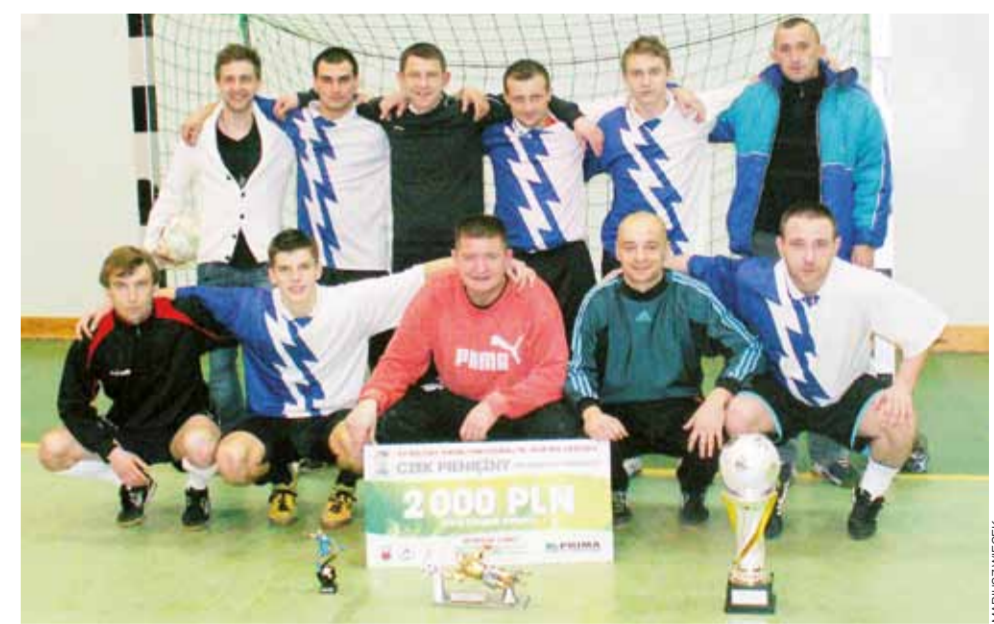
W Sochaczewie łowiczanie w nagrodę otrzymali efektowny puchar oraz czek na 2000 zł.