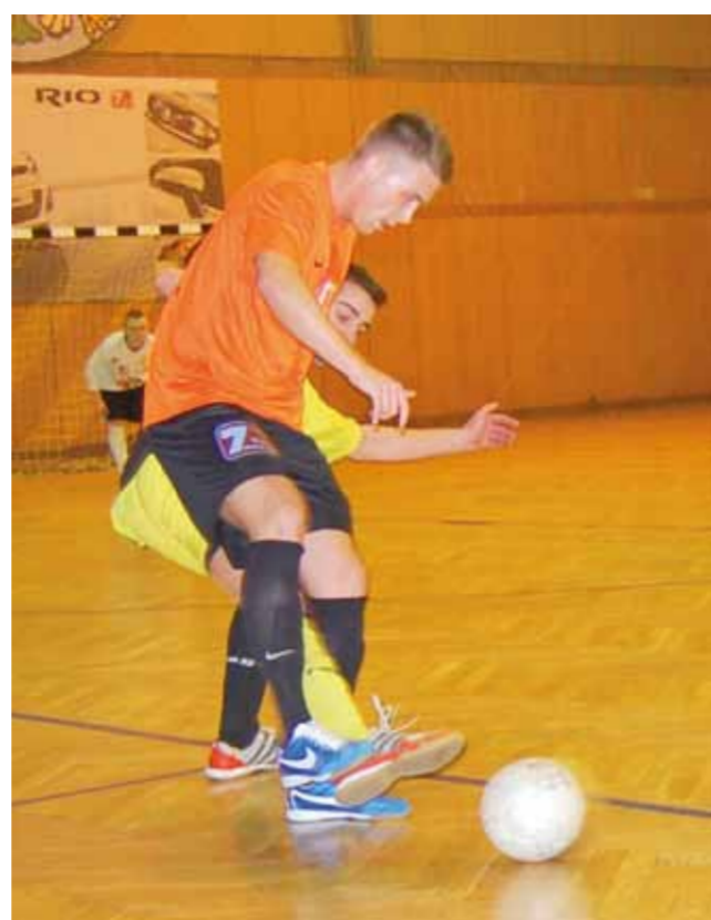
Po ciekawej rywalizacji Drużyna KIA pokonała Błokersów 3:2.

godz. 16.40: Dach-Lux Łowicz – Zatorze Zu-An Łowicz, godz. 17.20: Banasz-Internet ZTR Łowicz – Warriors Bielawy, godz. 18.00: Renix Łowicz – Fantazja-Osman Głowno, godz. 18.40: Chińska-Łowicka Łowicz – PNI Łowicz i godz. 19.20: Pędzące Imadła-Novum Łowicz – Błokersi-Intermarche Łowicz.