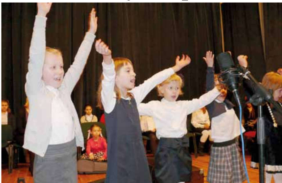
Część zespołu Skrzaty składającego się z przedszkolaków, który utworzył koncert Centrum Edukacji Muzycznej w Kinie Fenix.