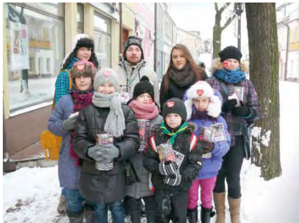
7 Gromada Zuchowa Leśne Ogniki kwestowała pod kościołami i na ul. Zduńskiej w Łowiczu.

Łowicz | Było zimno, ale ogrzała ich Orkiestra