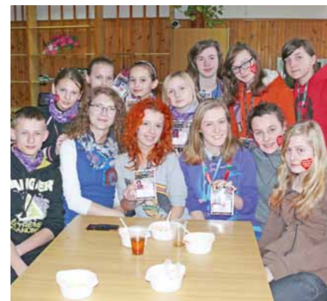
96 Łowicka Drużyna Wielopoziomowa Bezimienni w czasie przerwy w sztabie WOŚP.