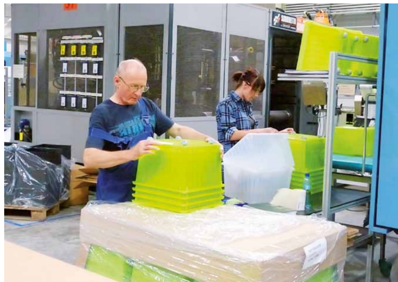
W ubiegłym roku w Lameli uruchomiona została nowa hala produkcyjna, dlatego konieczne było zwiększenie zatrudnienia pracowników produkcji.

Nie wystarczy do oferty szkoły dopisać nowy kierunek. Trzeba go jeszcze wypracować. – Do kreowania struktur szkolnictwa są powołane odpowiednie instytucje. One powinny dbać o to, aby szkoły nie „produkowały” bezrobotnych