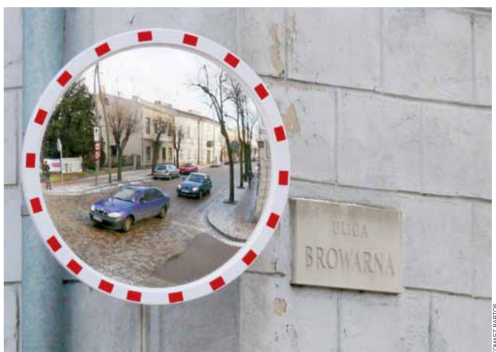
Jedno z lusterek założono na narożniku ul. Browarnej i Podrzecznej. Jak zauważyliśmy, nie wszyscy kierowcy jeszcze korzystają z ich pomocy.

Jak wiadomo, miasto zdecydowane jest realizować wiatrak i most. Co do szpitala, to pomysł nie był dotąd publicznie przedstawiany i omawiany. Jest na razie zbyt wczesny, aby wyrokować, czy projekt będzie miał szansę realizacji, jaki finansowy udział powiatu byłby do niego wymagany oraz jakie szanse będzie miał w przyszłości Samodzielny Publiczny Zakład Opieki Zdrowotnej na kontrakt z Narodowego Funduszu Zdrowia na otwarcie i prowadzenie nowych oddziałów – SOR i opieki długoterminowej. Zdaniem wicestarosty działania takie warto było podjąć, aby nie zaprzepścić szansy na rozwój placówki. Ma on nadzieję, że przebiegające przez nasz powiat drogi krajowe i bliskość autostrady sprawią, że powstanie SOR i ławiska dla śmigłowców będzie miało szansę na dofinansowanie. mwk