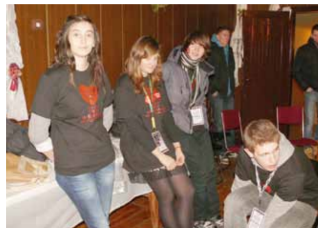
Kwestujący na rzecz WOŚP w Bolimowie. W tym roku było ich 19 i byli to uczniowie miejscowego gimnazjum.

Po ubiegłorocznym zainteresowaniu finałem i uzbierana kwota mieliśmy chrapkę na więcej. Nie udało się. Szkoda, ale i tak jestem zadowolona, bo te prawie 8 tys. zł, które uzbieraliśmy i przekażemy do sztabu Orkiestry w Skiermiewicach, do którego należeliśmy i tak pomocą potrzebującym. I to jest najważniejsze.