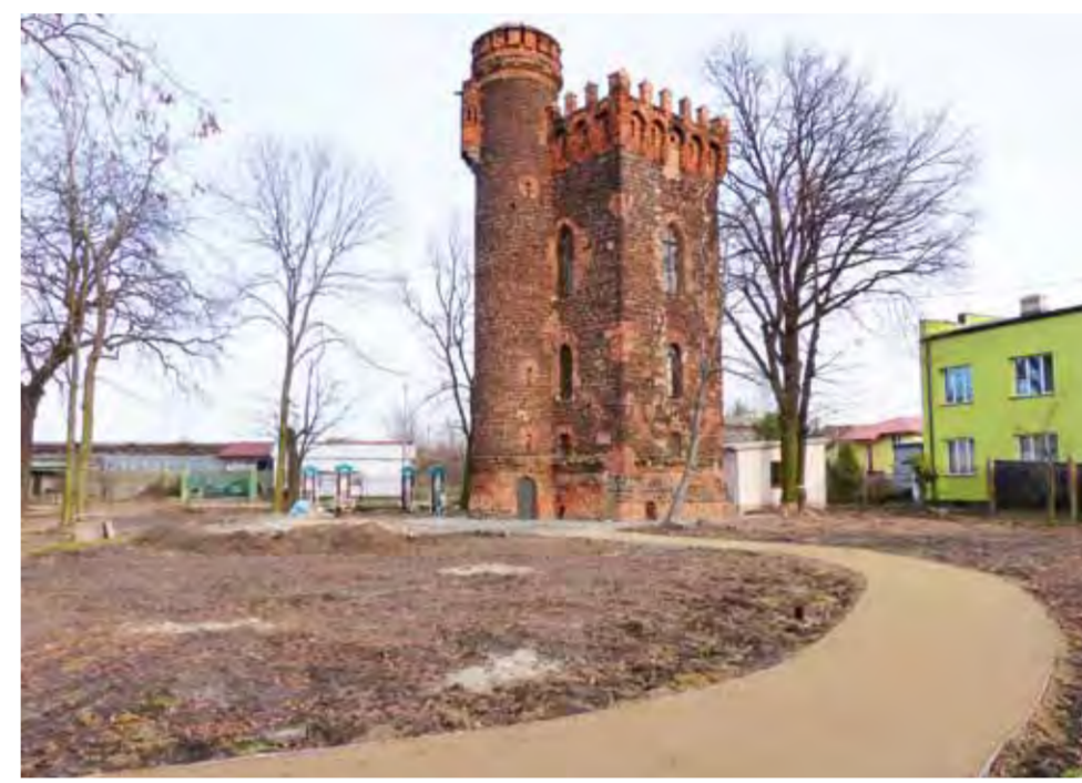
O losach baszty Klickiego zdecyduje spotkanie przedstawicieli miasta, zarządu os. Stare Miasto i ŁOK.

wierchnię piaskowo-żwirową. Obecnie trwa ich budowa.