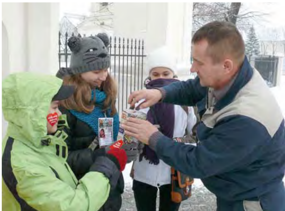
Harcerzom z 3 ŁDH Impessa pieniądze wrzucił pracownik ZUK, który akurat przejeżdżał piaskarką.