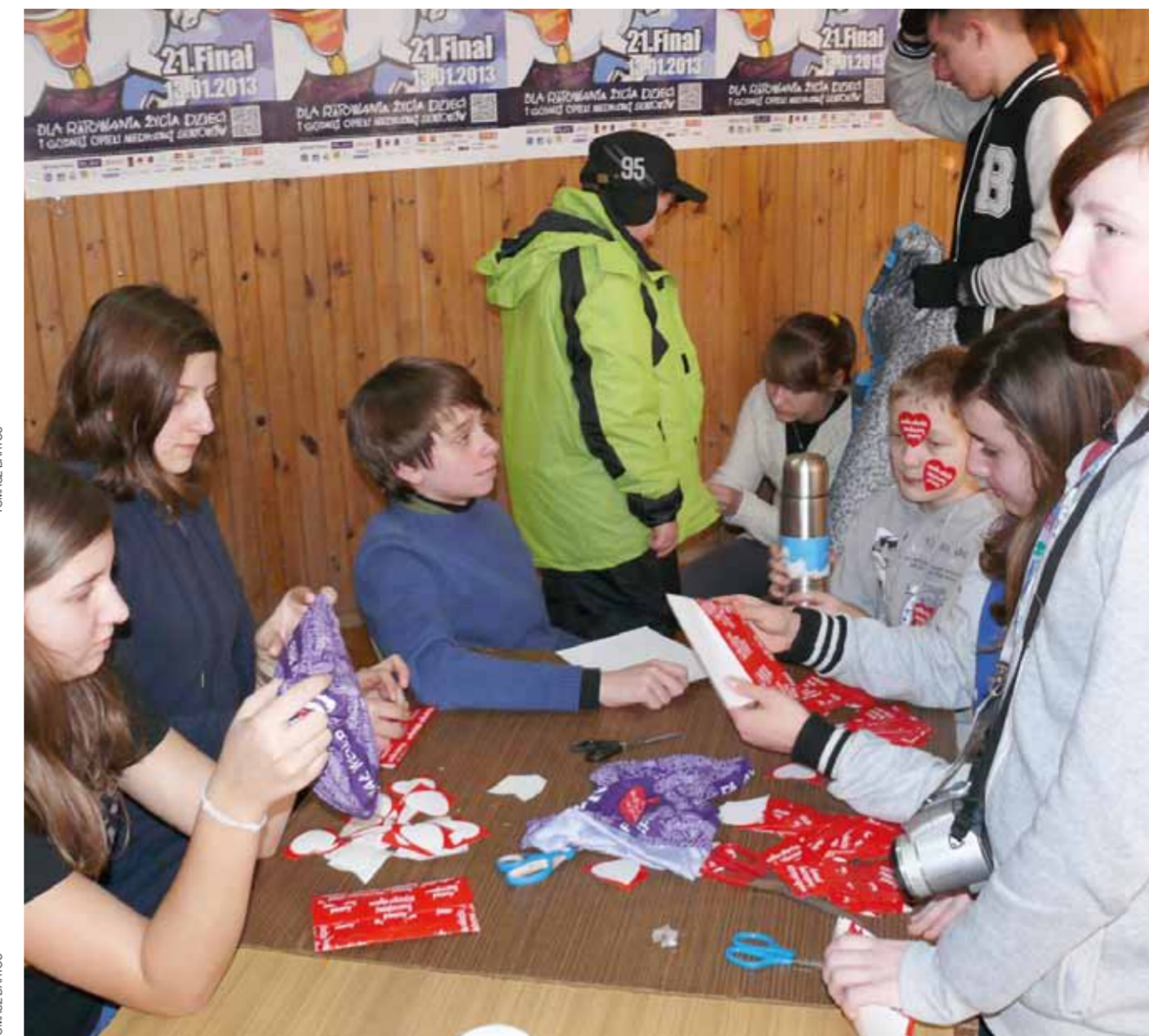
W sztabie WOŚP w Gimnazjum nr 1, wolontariusze, którzy przyszli się ogrzać, zajmowali się wycinaniem naklejanych serc rozdawanych darczyńcom.