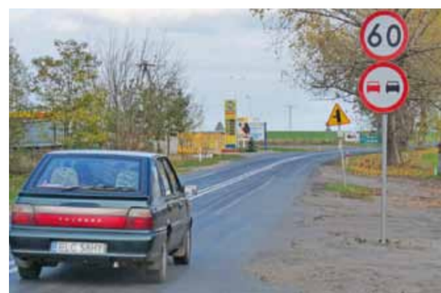
Droga wojewódzka nr 703 w Bielawach wymaga przebudowy. W tym roku Zarząd Dróg Wojewódzkich nie rozpocznie jednak remontu.

Droga nr 703 przecina obszar gminy Bielawy w połowie na długości około 16 km, ale w najgorszym stanie technicznym jest odcinek z Chrusłina do Brzozowa, ponieważ nie był remontowany od lat. Nawierzchnia jezdni jest nierówna, gdyż poruszające się po tej drodze samochody ciężarowe wyjeżdżały liczne koleiny. Szerokość jezdni wynosi nieco ponad 5 metrów. Zmora wszystkich kierowców są przede wszystkim dziury znajdujące się