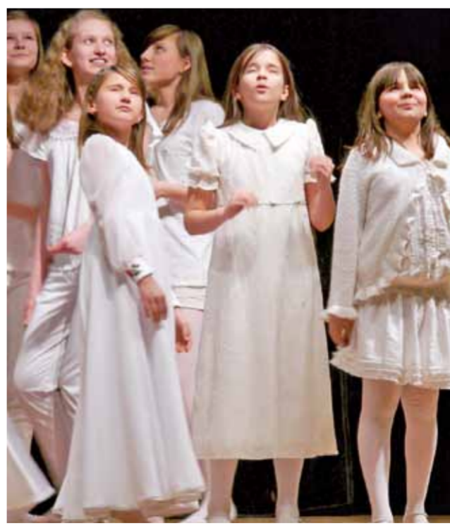
Dziewczyny, które zagrały w przedstawieniu gwiazdki.

Potem rozpoczęło się przedstawienie, na scenie wystąpili aniołowie, pastuszkowie, trzej mędzcy szukający Narodzonego Króla, gwiazdy sprzeczące się, która zabłądziła na niebie, obwieszczając wesołą nowinę. Kończąc scenę z piekła, z szatanem, była tak realistyczna, że wystraszyła co niektórych młodszych wi-