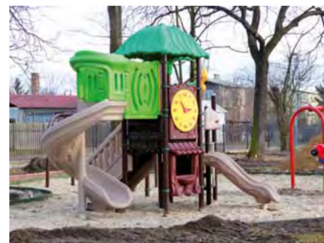
Plac zabaw dla dzieci tworzą zjeżdżalnie, bujawki i karuzele. Sprzęt zabawowy stanął w piaskownicy.

ocieplili styropianem i położyli elewację. Wiadomo, że w jednym z pomieszczeń powstanie publiczna toaleta. Pozostała część budynku gospodarczego o powierzchni 60 m 2 (został on wybudowany w latach '70 ubiegłego wieku dla harcerzy) być może zostanie przekazana zarządowi os. Stare Miasto i powsta-