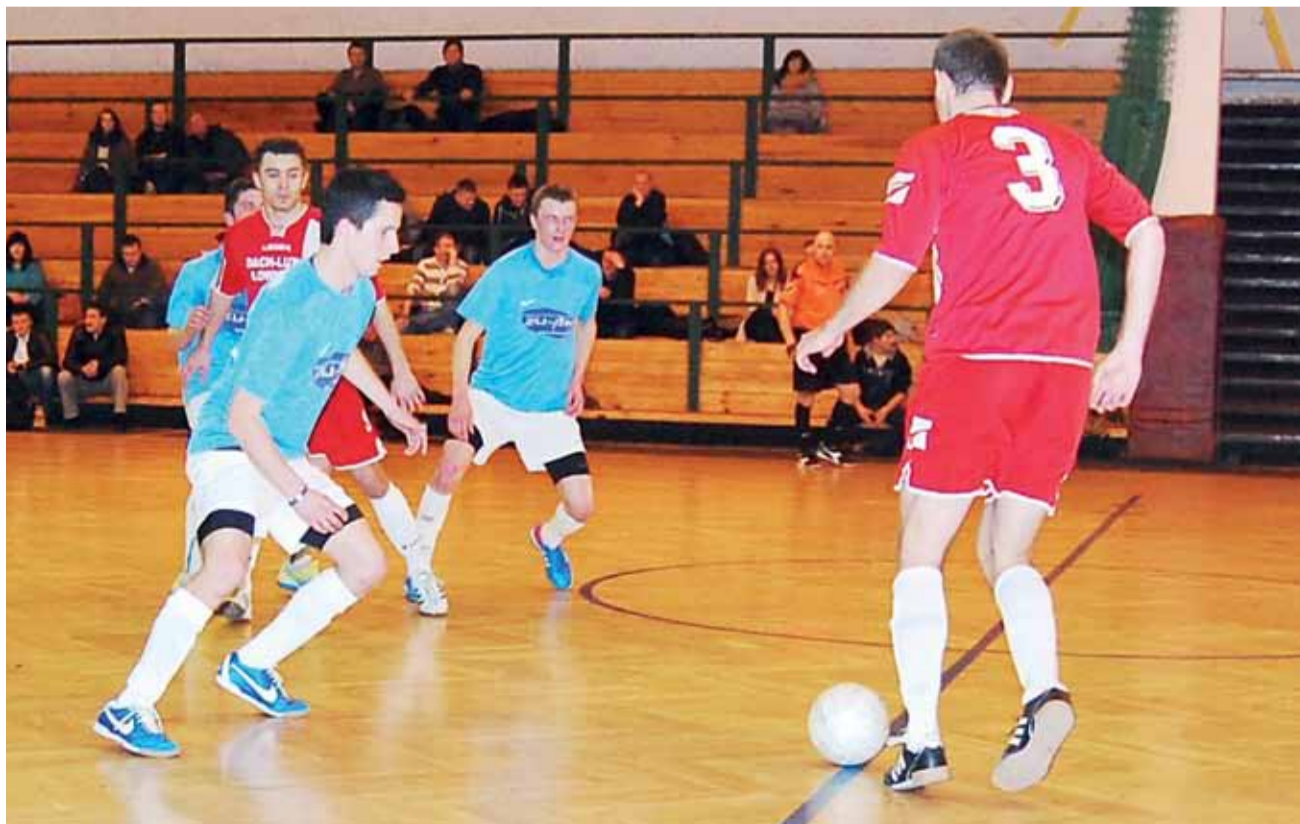
Dach-Lux wygrał już 2:0, ale to gracze Zatorza cieszyli się ze zwycięstwa 2:3.