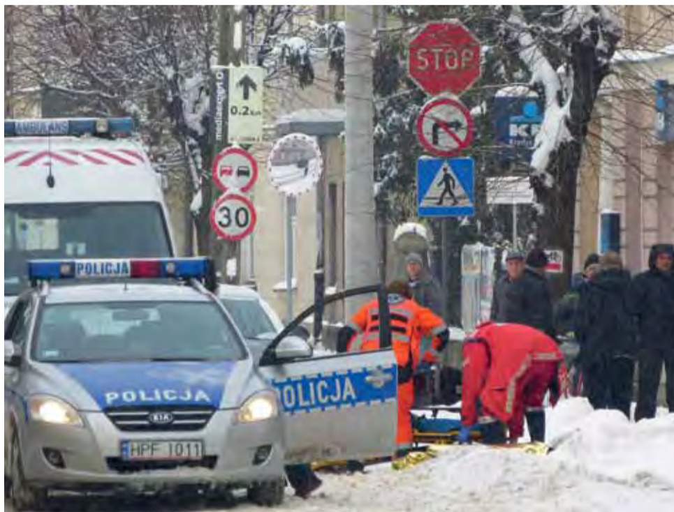
Kobiety nie udało się uratować, choć pogotowie ratunkowe zjawiało się błyskawicznie.