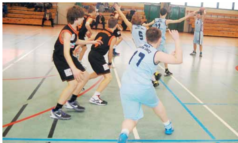
Koszykarze Księżaka-99 w meczu ze znacznie wyższymi rywalami z Pabianic sobie „nie pograli”.