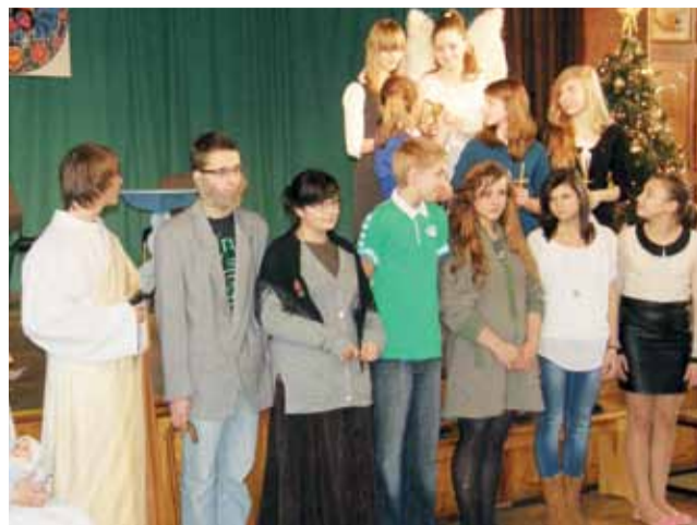
W czasie spotkania Kół Gospodyń Wiejskich młodzież z Gimnazjum Publicznego w Zdunach wystawiła jasełka.