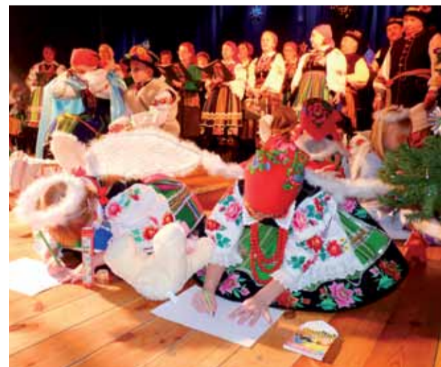
Scenariusz przedstawienie przewidywał m.in. to, że Furkotki będą rysować na scenie.