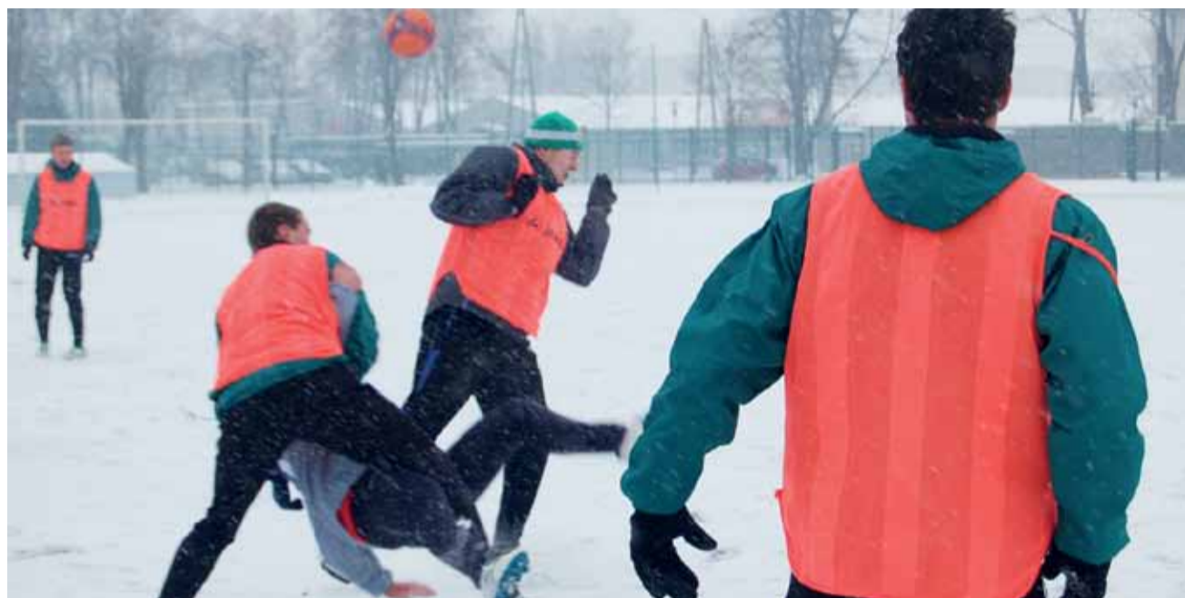
W trudnych warunkach zdecydowanie lepiej poradził sobie gracz Pelikana, którzy w Łowiczu wygrali z piotrkowską Concordią aż 6:0.

– Nie jest to najlepszy moment na rozgrywanie meczów. Ale zawodnicy muszą grać i czuć rywalizację. Myślałem, że będziemy wyglądać gorzej