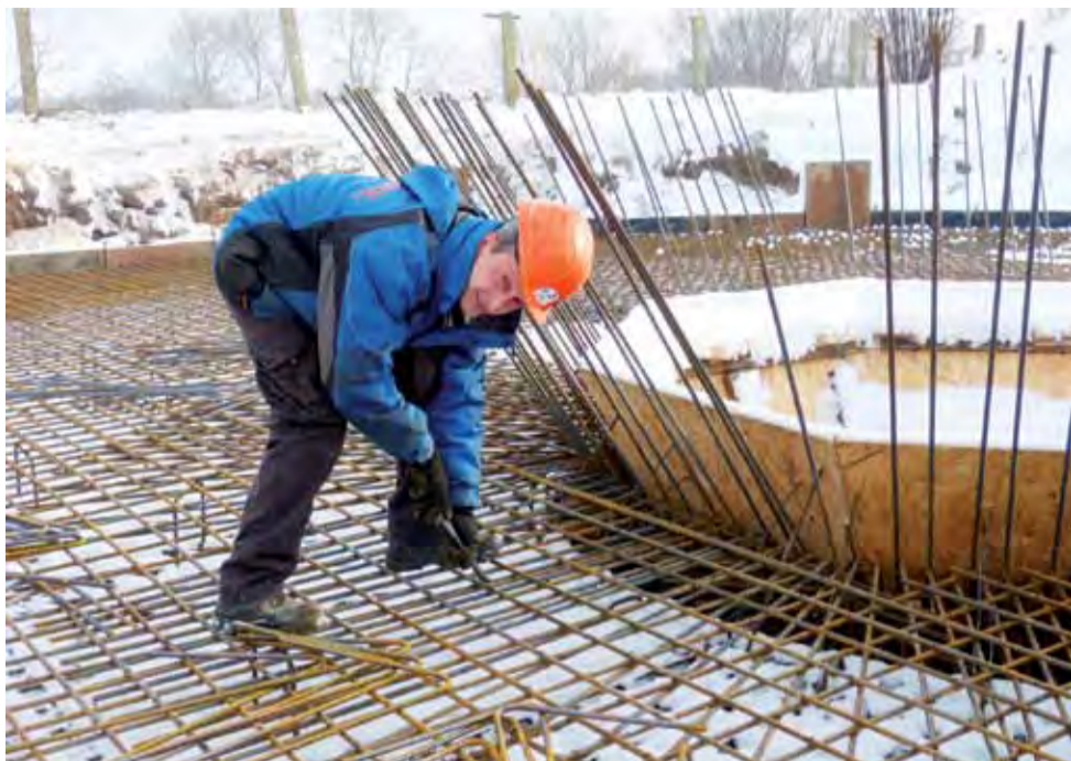
Pracownik firmy Markopol z Włocławka w czasie zbrojenia płyty dolnej reaktora biologicznego.