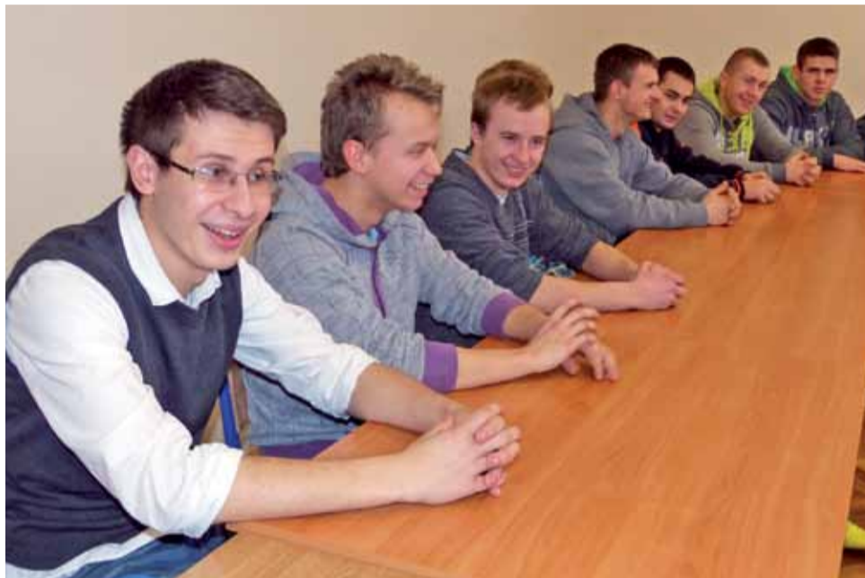
Uczniowie IV klasy technikum w odnowionej sali do nauki języków obcych.

Ze szkolnych finansów wyremontowano także 12 pokoi mieszkalnych w internacie. Prace budowlane rozpoczęły się 26 listopada. Podobnie jak w salach lekcyjnych, w pokojach położono nowe gładzie na ścianach i sufitach. Budowlanci wymienili także przestarzałą instalację elektryczną, oprawy oświetleniowe oraz kąciki sanitarne. Na podłodze znajduje się teraz nowa terakota, którą zamontowano zgodnie z zaleceniami sa-