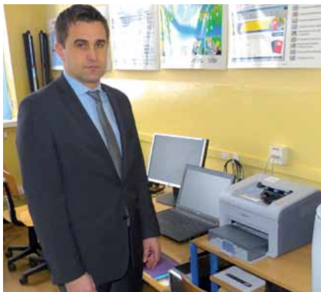
Na sprzęt dla szkoły w Mastkach gmina pozyskała 95 tys. złotych.

Udało się zrobić wszystko, co zaplanowaliśmy, chociaż oczekiwania wciąż rosną.