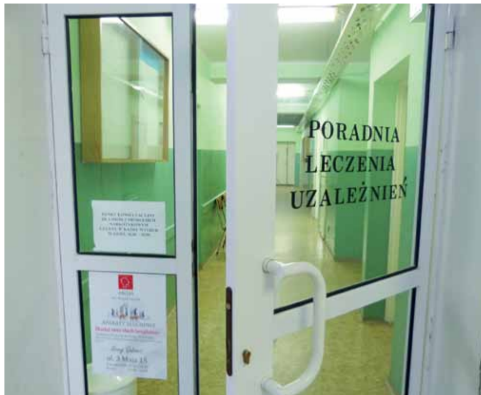
Poradnia Leczenia Uzależnień to jedyna placówka, która obecnie funkcjonuje w budynku przy ul. Kaliskiej 6. Wkrótce zostanie przeniesiona na teren szpitala.

Przypomnijmy, że budynek komunalny przy ul. Kaliskiej przejdzie w tym roku remont. W czerwcu 2012 r. wygasły umowy najmu, w kolejnych miesiącach najemcy, którzy prowadzili różnego rodzaju działalność związaną z lecznictwem, przenieśli się gdzie indziej. W bloku pozostała tylko działająca w strukturach łowickiego ZOZ Poradnia Leczenia Uzależnień. Wkrótce zostanie ona przeniesiona do zaadaptowanego na jej potrzeby dawnego magazynu aptecznego, który znajduje się na terenie szpitala. Nastąpi to prawdopodobnie za miesiąc, ponieważ prace budowlane jeszcze się nie zakończyły. Do budynku przy ul. Kaliskiej władze miasta planują przenieść kilka placówek: Środowiskowy Dom Samopomocy, Miejski Ośrodek Pomocy Społecznej i Zakład Gospodarki Mieszkaniowej. ■