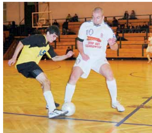
Fantazja wygrała z Reniksem i zapewniła sobie utrzymanie w I lidze.