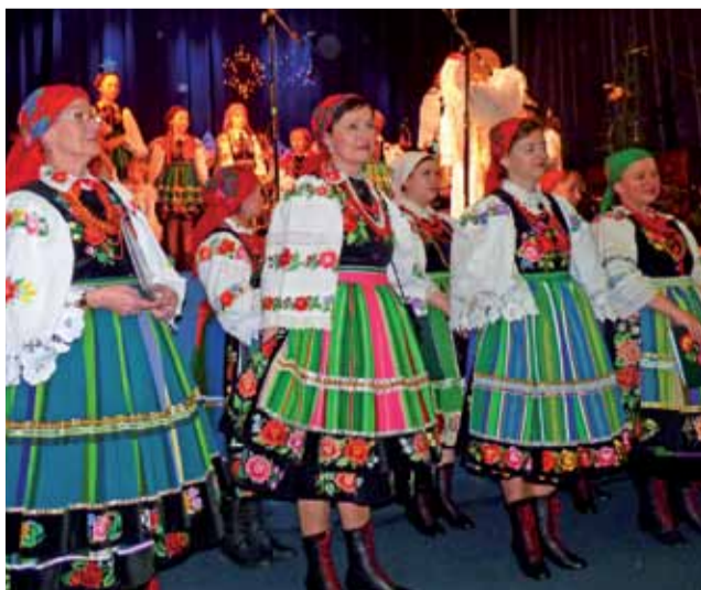
Ksiazki tylko na początku przedstawienia byli na pierwszym planie. Później śpiewali stojąc w głębi sceny.