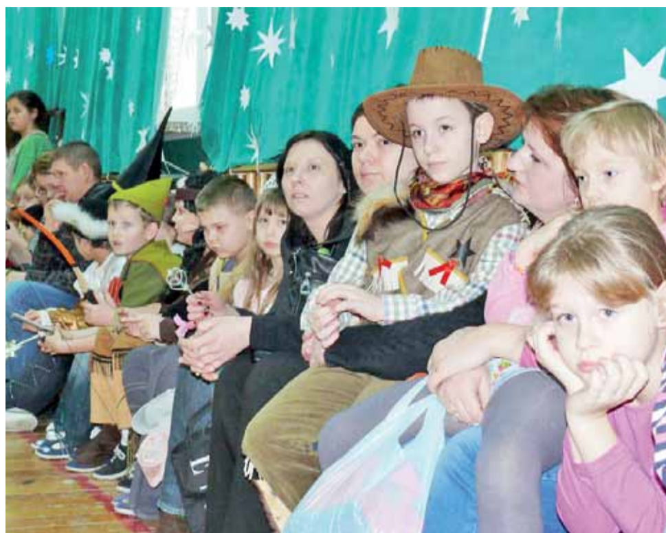
Uczestnicy zabawy choinkowej przyglądają się uczniom klas III-VI, którzy właśnie tańczą poloneza.

dzieci przebrała się za postaci z popularnych filmów i bajek. Oprócz obowiązkowych na takiej imprezie księżniczek, dziewczynki wystąpiły w strojach wiedz i zwierząt. Chłop-