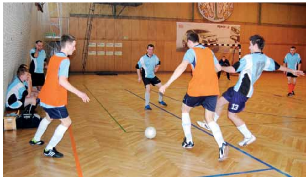
W meczu outsiderów III ligi ŁoLiF druga drużyna z Ostrowca wygrała z Kapelą Wujka Toma 4:2.