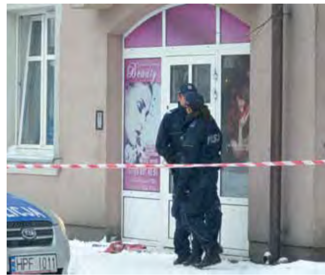
Bezpośrednio po zabójstwie policja zamknęła ruch w okolicach salonu.

Z naszych ustaleń wynika, że mężczyzna, który dokonał zabójstwa, dorabiał jako taksów-