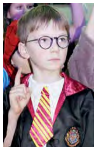
Uczniowie szkoły przebrali się na bal za zwierzęta oraz bohaterów ulubionych filmów m.in. Harry'ego Pottera.

Zabawę choinkową poprowadził, podobnie jak rok wcześniej, Wodzirej Arek. Były wspólnie tańce i zabawy. Większość