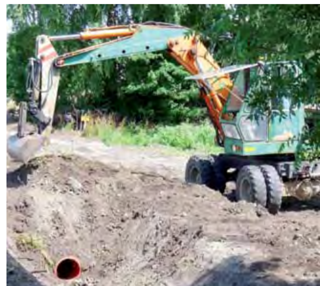
Okopywanie rowów – to była jedna z poważnych inwestycji 2012 roku.

wodociągowej pomiędzy Wyborowem a Mastkami. Wodociąg o długości ok. 1,2 km spinający te dwie miejscowości kosztował ok. 70 tys. zł. Pozwoliło to na połączenie dwóch niezależnych do tej pory sieci wodociągowych zasilanych z hydroforni w Skowrodzie Południowej (doprowadza wodę do 7 wsi) i wspomnianej hydroforni w Wyborowie. Po co wykonywano tę inwestycję? Studnia przy hydroforni w Skowrodzie okazała się w ostatnich latach mało wydajna. – Dawało się odczuć, szczególnie w lecie i wieczorami, spadki ciśnienia wody. Teraz hydrofornia z Wyborowa odciąża tamten wodociąg – uważa wójt.