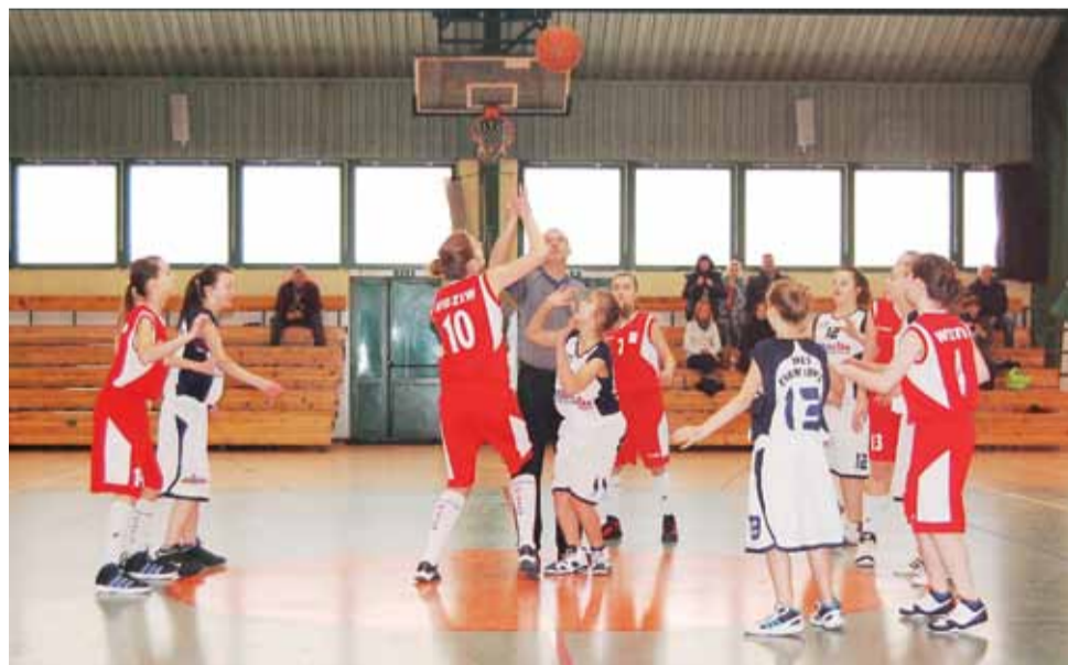
Mecz z Widzewem mógł zakończyć się zwycięstwem łowiczank, ale zabrakło najwyższych zawodniczek.