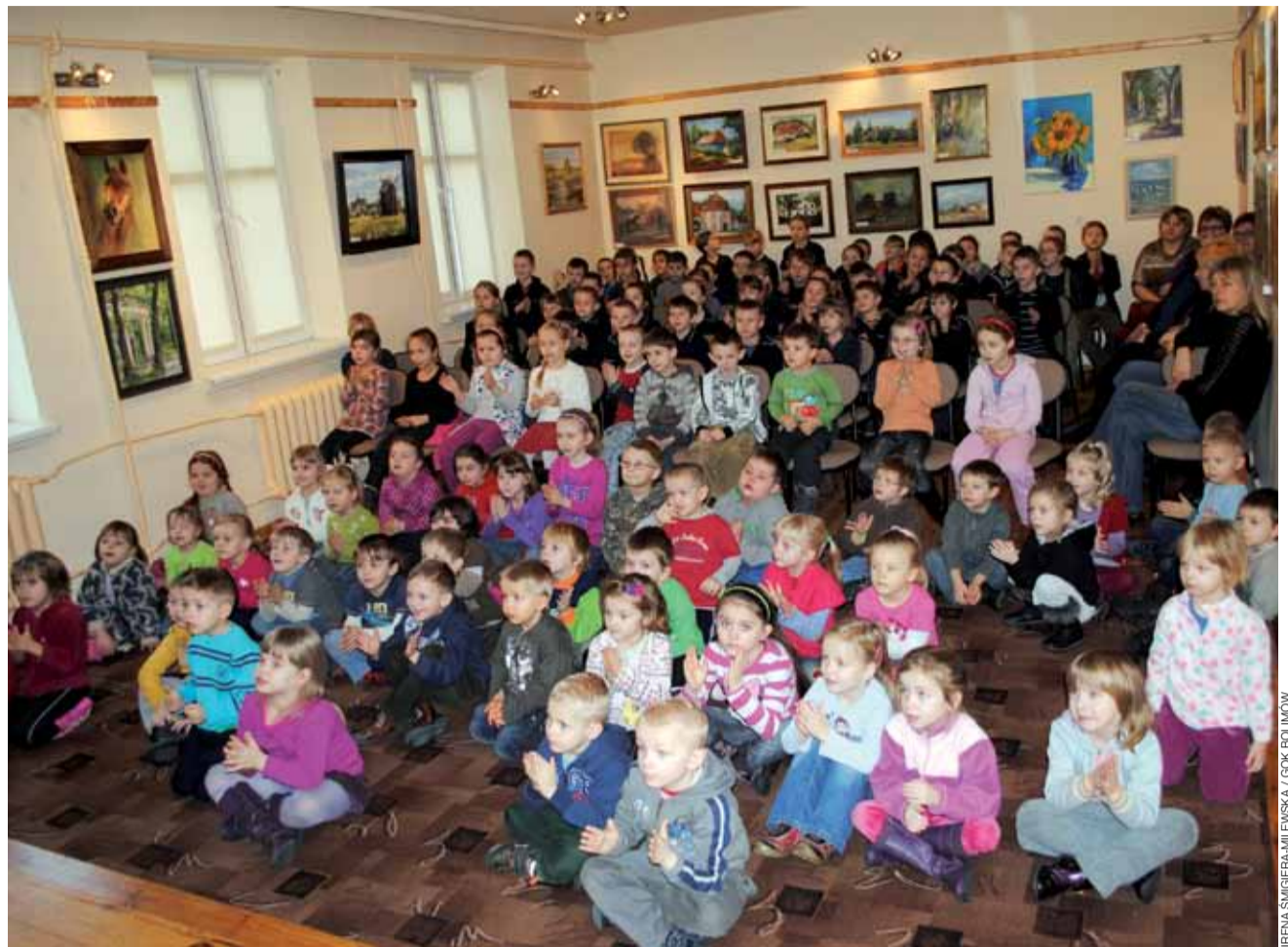
Spektakl teatralny pod tytułem „Dwie Dorotki” obejrzały w czwartek 17 stycznia w Gminnym Ośrodku Kultury w Bolimowie dzieci z przedszkola, zerówki, klas pierwszych i drugich szkoły podstawowej z Bolimowa. Przed dziećmi wystąpili aktorzy z teatru Art-Re z Krakowa. Podczas spektaklu aktorzy zapraszali dzieci na scenę, żeby współtworzyły z nimi przedstawienie. Spektakl obejrzało około 80 osób. mak