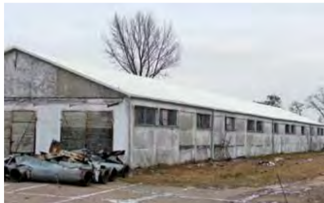
Jedna z obór na terenie pracowni rolniczej ma już nowy dach. Eternit ze starego pokrycia został zutylizowany.

Uczniowie mają czas na wykonanie plakatów do połowy lutego, a szkoła do 22 lutego zgłosi je do placówki terenowej KRUS w Gostyninie. Tam wyłonione zostaną prace, które będą reprezentować placówkę na etapie wojewódzkim. Nagrody rzeczowe otrzyma czterech laureatów obu etapów. Prace laureatów trzech pierwszych miejsc etapu wojewódzkiego z każdej kategorii wiekowej niniejszego konkursu wezmą udział w etapie centralnym konkursu. mak