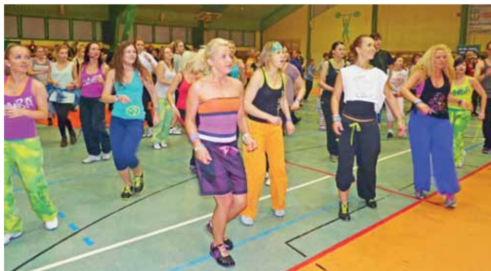
Początek maratonu. Wszyscy w pełni sił tańczą zumbę. Instruktorzy są nie tylko na scenie, ale też w pierwszym rzędzie.