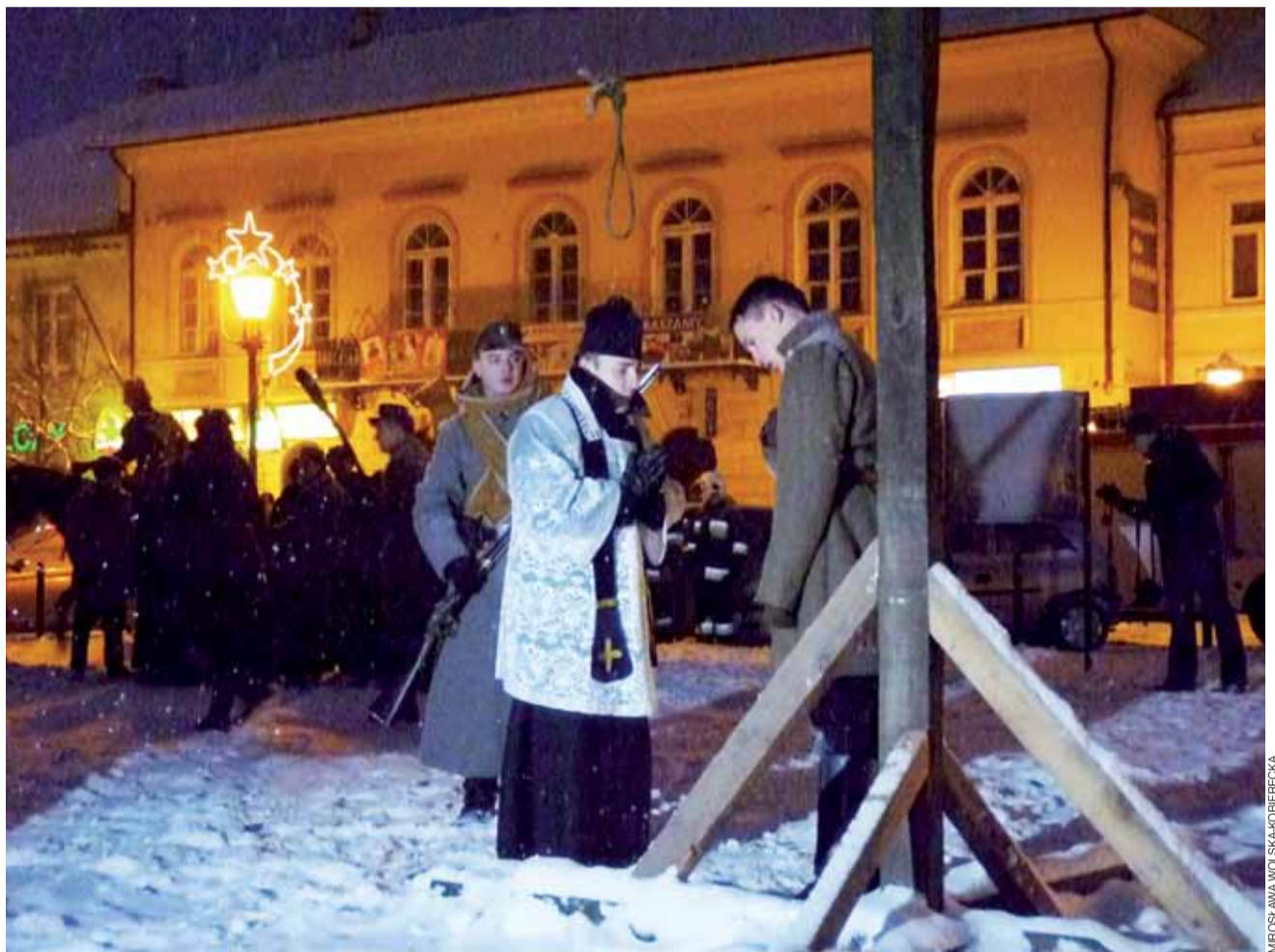
Scena powieszenia powstańca na Nowym Rynku w Łowiczu.