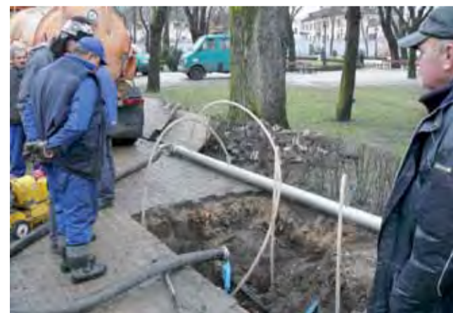
Pracownicy ZUK w Łowiczu zrezygnowali z naprawy przyłącza wodociągowego, które przecinało w szereg Park Sienkiewicza i zasilato posesję naprzeciwko Gimnazjum nr 1. Nie mogli ustalić oni miejsca rozszczelnienia, zdecydowano się więc na zastąpienie starego przyłącza nowym, od strony osiedla Starzyńskiego. tb

RZUT OKIEM | LEPIJ ZROBIĆ NOWE PRZYŁĄCZE