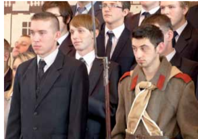
Uczniowie ZSP nr 1 odegrali scenkę z udziałem carskiego żołnierza, w której powstaniec został skazany na śmierć.

Biskup senior zaapelował do młodzieży o to, żeby uczyła się historii, ponieważ ona kształtuje duchowe wnętrza. Zdaniem biskupa naród bez znajomości swej historii i korzeni umiera i trzeba dążyć do zachowania własnych wartości, takich jak kultura, historia, tradycja, religia i język ojczysty, ponieważ one są gwarancją suwerenności kraju. ■