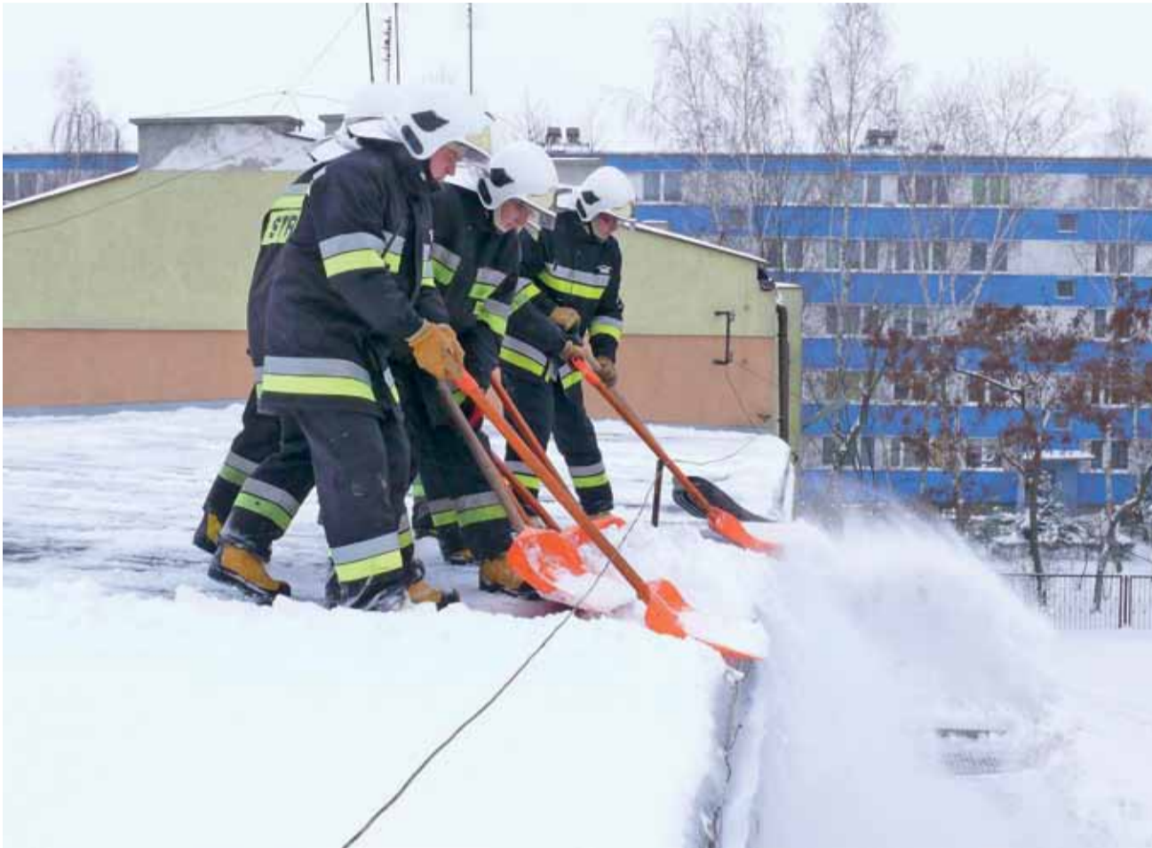
Gdy kilku zgodnie pracuje, odśnieżanie nawet dużego dachu (tu: na SP1) nie jest problemem.

Pacjenci i pracownicy poradni odwykowej narzekali że mają zimno. str. 10