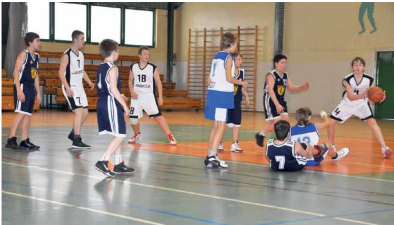
Modzicy Księżaka-2000 po raz drugi w tym sezonie wygrali ze swoimi rówieśnikami ze Skierniewic.

Koszykówka | 9. kolejka wojewódzkiej ligi młodzików młodszych U-13