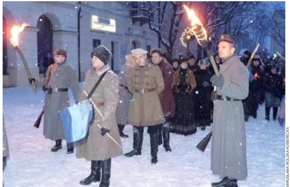
Carckie wojsko przed ratuszem ustawiło Polaków przed wyruszeniem na Nowy Rynek na egzekucję.

Kościół Chrystusa Dobrego Pasterza zaprasza na kolejny koncert koleđ. W niedzielę 27 stycznia, po mszy św. o godz. 12.30, w kościele wystąpi Zespół Pieśni i Tańca Blichowiacy. mwk