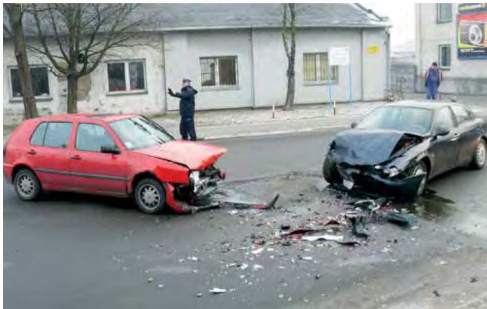
Nie będzie szybko bezpieczniej na odcinku ul. Armii Krajowej, od przejazdu kolejowego do skrzyżowania z ul. Chełmońskiego. Ruch nadal będą spowalniać korki, szczególnie dlatego warto tam zachować szczególną ostrożność, aby uniknąć takiej kolizji jak na zdjęciu z grudnia 2011 roku.

Pomysły te do chwili obecnej nie doczekały się nawet przekształcenia w koncepcję, która dałaby zielone światło dla wykonania projektu. Pojawiły się bowiem trudności, których wcześniej burmistrz nie wziął pod uwagę. Już kilka tygodni po pierwszym naszym tekście na ten temat, Kaliński mówił z nami o możliwej przebudowie z dużo mniejszym entuzjazmem. Stwierdził, że poprawa bezpie-