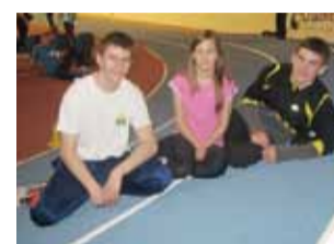
Trójka lekkoatletów z Łowicza pobiła swoje życiówki na 200 m.