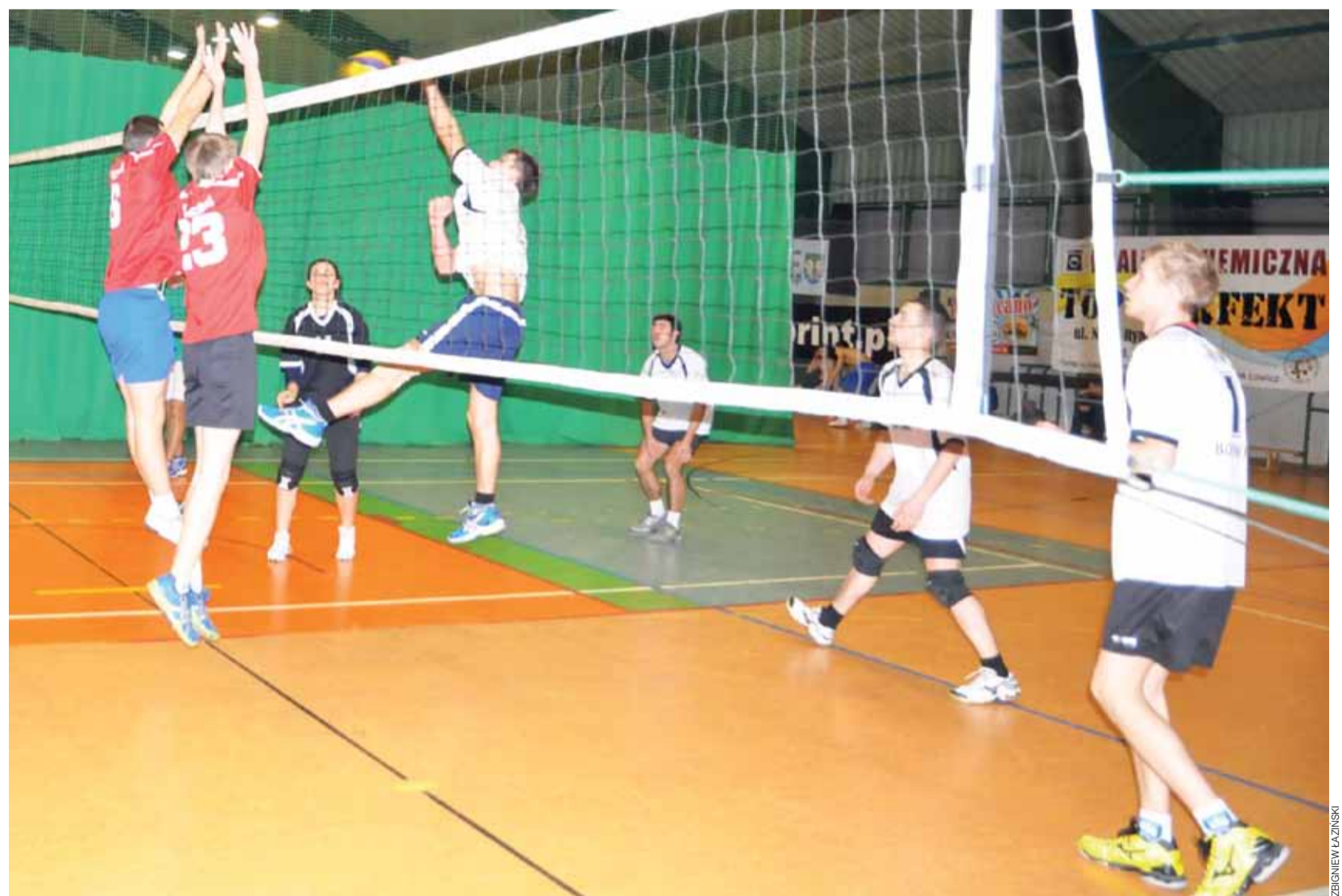
Siatkarze Rawki Bolimów w trzech setach ograli rywali z domaniewickiego Gromu.