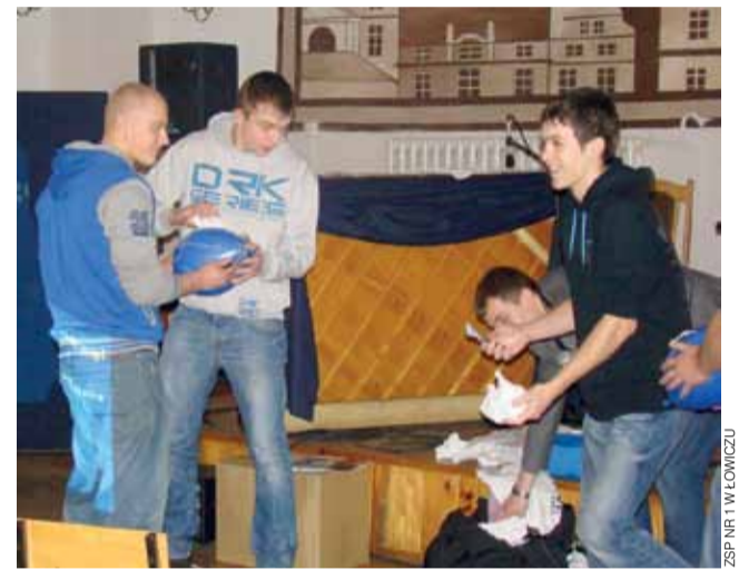
Uczniowie ZSP nr 1 poprzez zabawę ćwiczyli, w jaki sposób prawidłowo się golić.