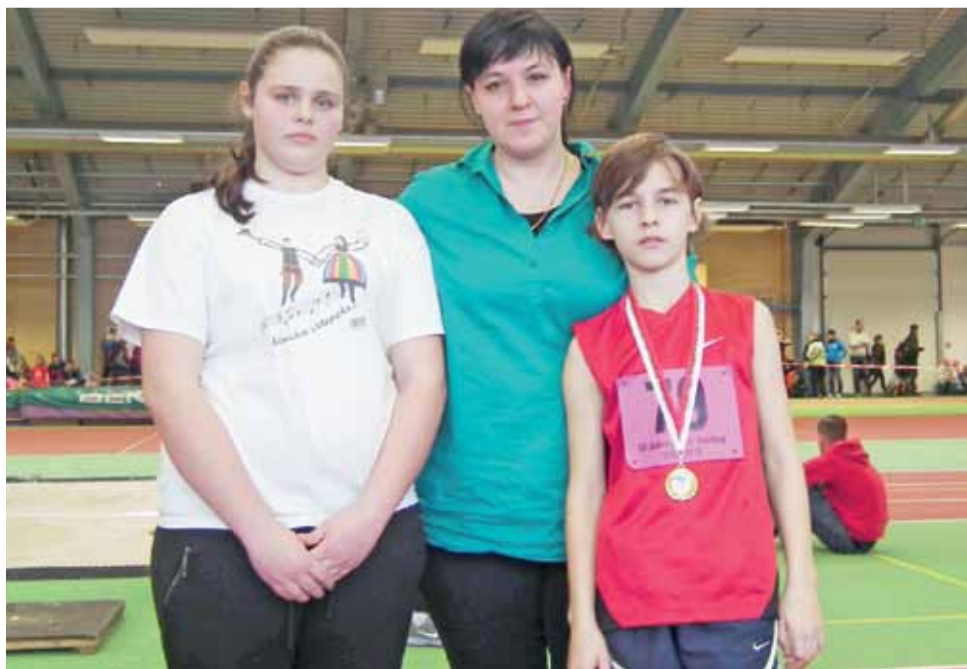
Wyprawa do Cottbus była dla ekipy UKS Błyskawica bardzo udana.