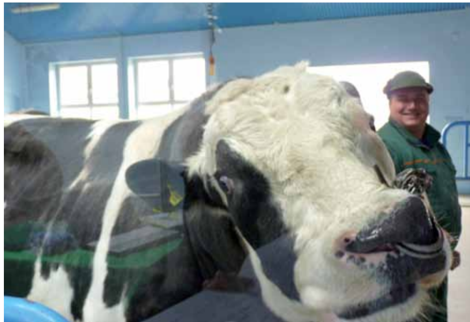
Jeden z buhajów będących w posiadaniu Centrum w czasie pokazu.

Mazowieckie Centrum Hodowli i Rozrodu Zwierząt funkcjonuje na terenie Łowicza od 1956 roku, do roku 2000 był to zakład budżetowy, potem został przekształcony w spółkę z o.o ze 100-procentowym udziałem Skarbu Państwa. Centrum skupia hodowców bydła, trzody