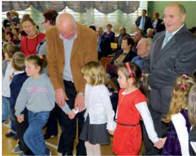
Do Szkoły Podstawowej w Mastkach przyszło ponad 70 seniorów.

Punkt kulminacyjny spotkania, podczas którego dzieci wybiegły w stronę seniorów z drobnymi prezentami, niejednemu