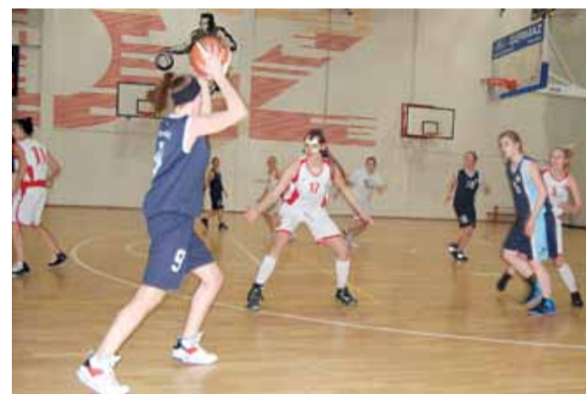
Juniorki Księżaka w Łodzi nie sprostały rywalkom z Widzewa.