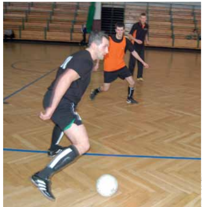
Studio Mody, po zwycięstwie z OSP, awansowało na dziewiąte miejsce.