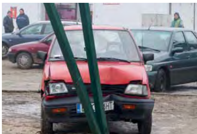
Samochód, który uderzył w ogrodzenie, zwracał uwagę przechodniów. Wielu z nich zastanawiało się, w jaki sposób doszło do zdarzenia.

Nie było to pierwsze posiedzenie łowickiego sądu w tej sprawie. 7 stycznia sąd utrzymał bowiem w mocy postanowienie Prokuratury Rejonowej w Łowiczu w sprawie tymczasowego zawieszono wójta w czynnościach służbowych oraz poręczenia majątkowego. Wójt nie może więc wrócić do pracy w urzędzie. mak