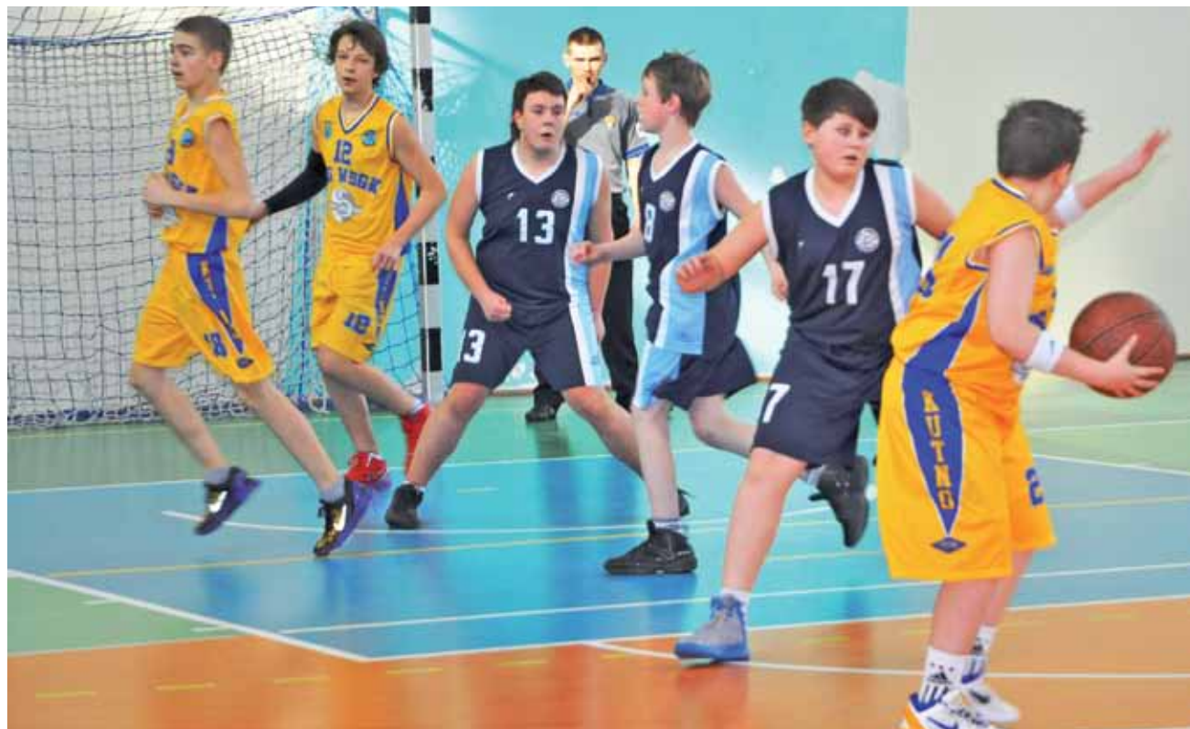
W pierwszej połowie jeszcze nie było najgorzej, ale po przerwie łowiczanie zdobyli w Kutnie tylko trzynaście punktów.

Kolejny ligowy pojedynek drużyna młodzików starszych Księżaka zagra w Łowiczu w sobotę 2 marca z Trójką Sieradz. W tym meczu będzie szansa powalczyć o drugie zwycięstwo w tym sezonie. z