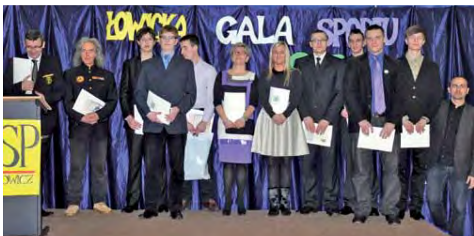
Podczas tegorocznej Gali Sportu nagrodzono dziewiętnastkę zawodników i ich trenerów.

W klasyfikacji gimnazjalistów pierwsze miejsce zajęła łowicka Dwójka, drugie miejsce przypadło Gimnazjum nr 1 w Łowiczu, a trzecie Pijarskie Gimnazjum Królowej Pokoju.