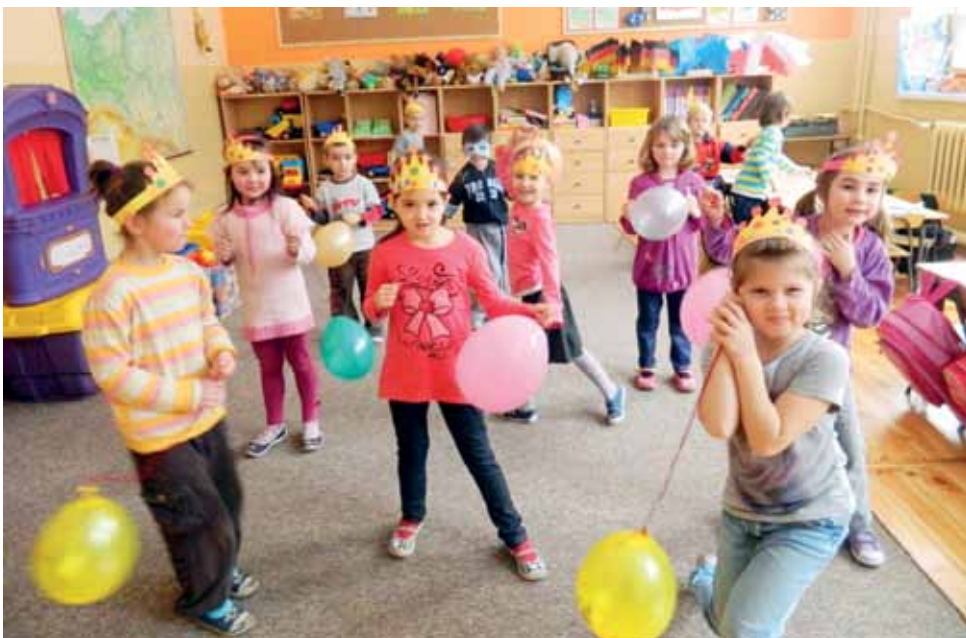
Dzieci nie tylko tańczyły z balonami, ale również je malowały oraz odgrywały scenki z nimi związane.