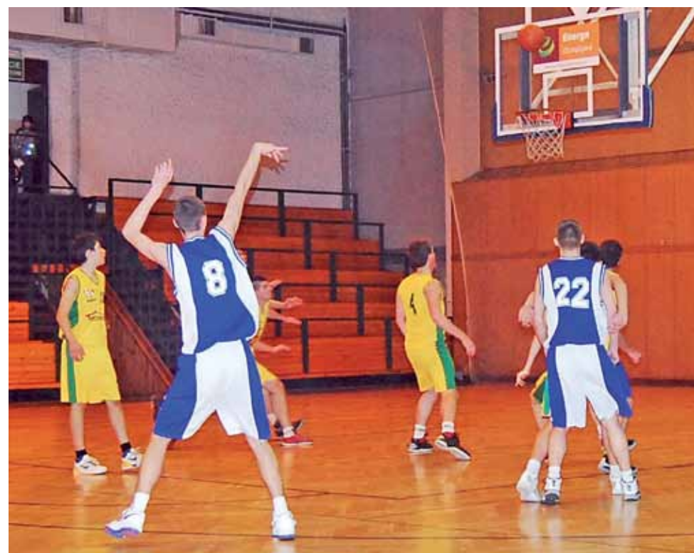
Rok starsi rywale ze Skierniewic byli rośniejsi, lepiej rzucali i bronili. Stąd wysoka porażka...