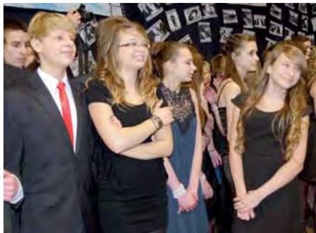
Dobry humor nie opuszczał gimnazjalistów tuż przed pierwszym w życiu polonezem.