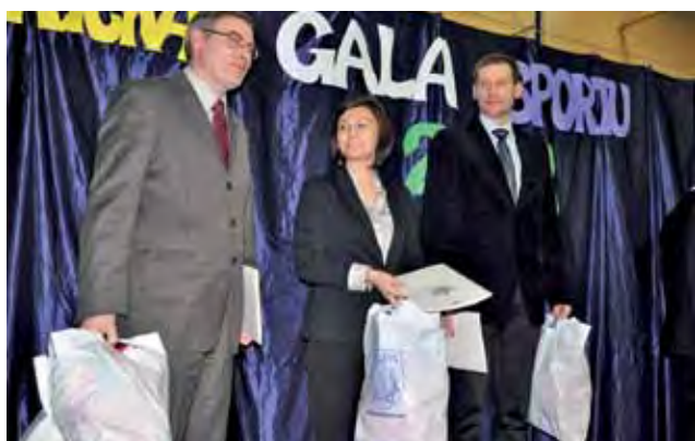
Po raz dziewiętnasty z rzędu we współzawodnictwie szkół najlepszą okazała się Czwórka, drugie miejsce zajęła SP 1, a trzecie SP 2 Łowicz.