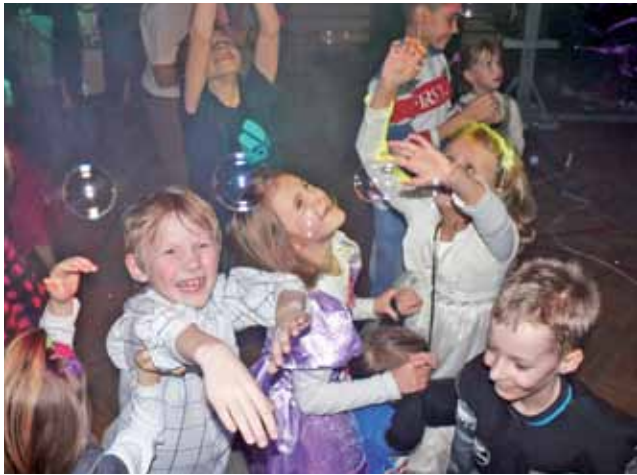
Dym oraz bańki mydlane sprawiły dzieciom dużo radości.