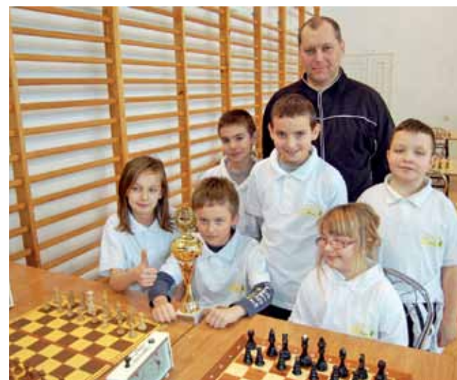
Szachiści z Nieborowa po raz kolejny awansowali do finału WIMS.