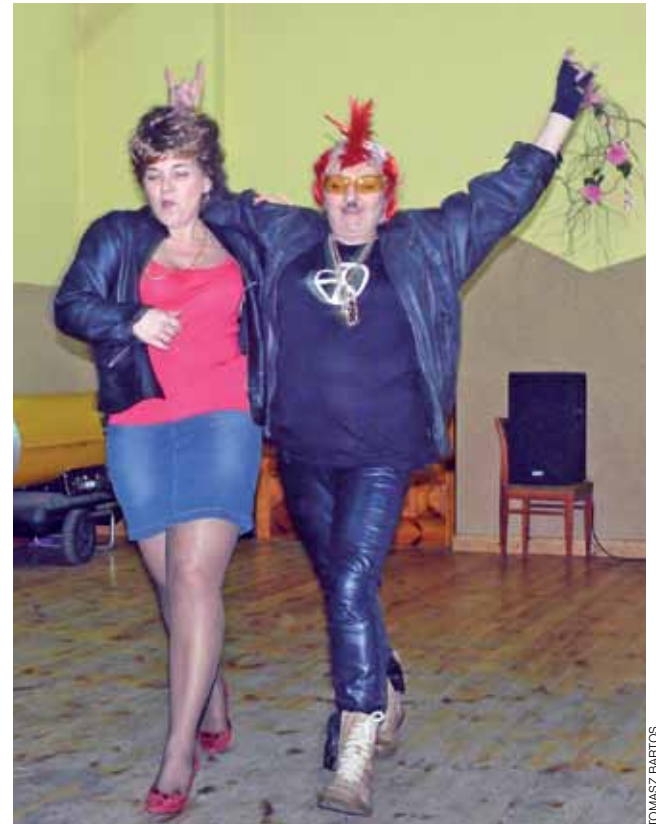
Rewia mody, w tym wypadku dyskotekowej, w wykonaniu pań z Zielkowic zaskoczyła i rozbawiła zebranych w Domu Ludowym.