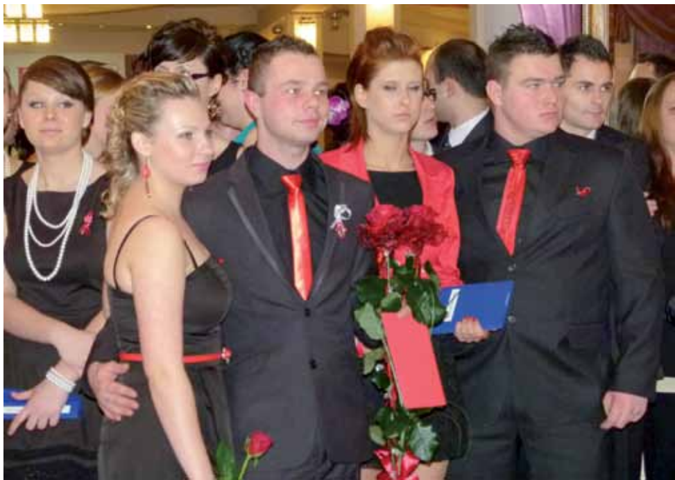
Maturzyści z ZSP Nr 3 w Łowiczu przed całonocną zabawą w sali weselnej Telimena.