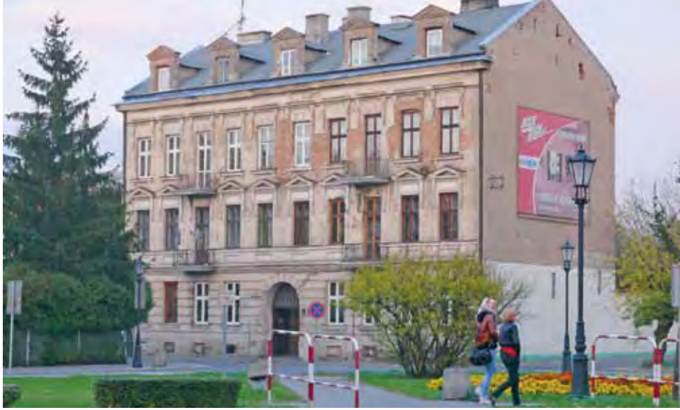
Kamienica Tkaczew nr 13 z odnowioną elewacją mogłaby być ozdobą Końskiego Targu, na którym jest zieleniec obsadzony kolorowymi kwiatami, ławki i drzewa.