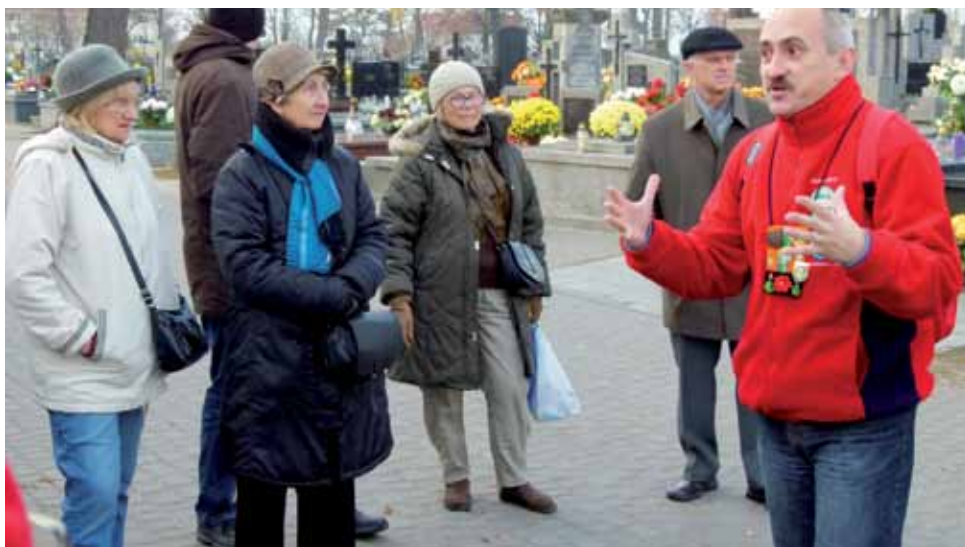
Spacery po łowickich nekropoliach od kilku lat cieszą się dużym zainteresowaniem. Od czerwca do września tego roku łowiczanie i turyści indywidualnie będą mieli możliwość zwiedzania miasta z przewodnikiem PTTK.

Całkiem nowym zadaniem w tym konkursie są dyżury licencjonowanych przewodników PTTK w drewnianej chatce, ustawionej na czas sezonu turystycznego na Starym Rynku. Będą one odbywać się w nie-