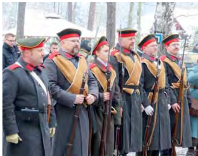
9 rota 25 Smoleńskiego Pułku Piechoty z Kielc. Rekonstruktorzy, którzy odtwarzają jednostkę, pochodzą z całej Polski: Krakowa, Gdańska, Tomaszowa Mazowieckiego. Do Bolimowa przyjechali, bo zostali zaproszeni.