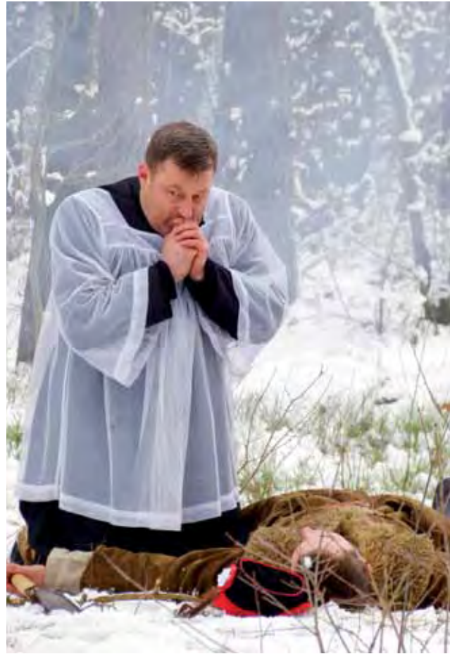
Już po walce. Ksiądz towarzyszący powstańcemu oddziałowi, pochyla się w modlitwie nad konającym powstańcem.