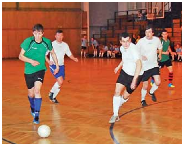
Start-94 przegrał z Ha-Ha-Ha! 0:2 i stracił miejsce na podium.