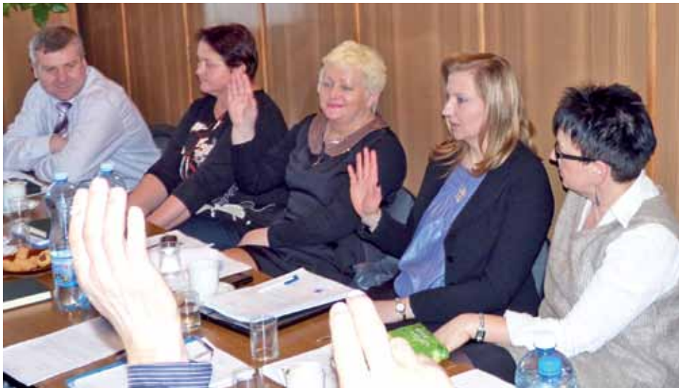
Jedno z głosowań w czasie sesji Rady gminy Bielawy na której uchwalono budżet na 2013 r.

Wiceprzewodniczący Rady Gminy Bielawy i jednocześnie