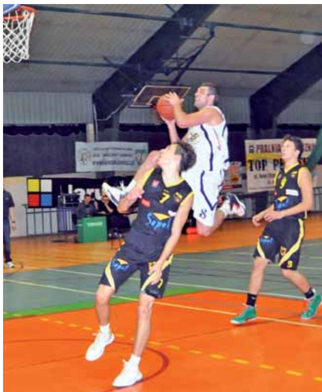
Na mecz rewanżowy z Treflem II trzeba poczekać dwa tygodnie.