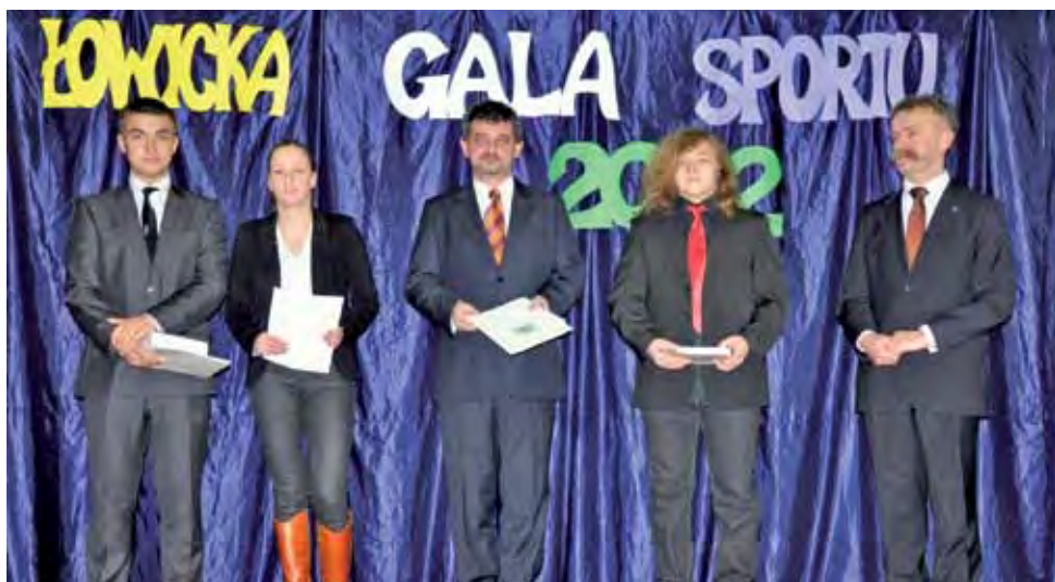
Sporą grupę wśród nagrodzonych stanowili wychowankowie łowickiej Czwórki.