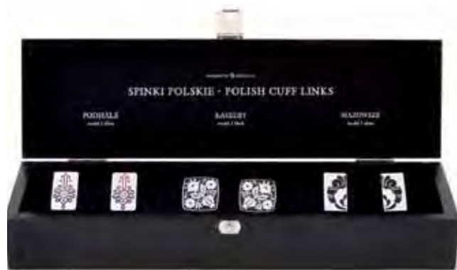
Które spinki najpiękniejsze?

19 lutego o godz. 17. w biurze PiS przy ul. 3 Maja 6a w Łowiczu odbędzie się z posłem z Tomaszowa Mazowieckiego, Marcinem Witko. Zaledwie kilkanaście dni wcześniej z łowiczananami spotkał się inny polityk PiS, poseł Grzegorz Schreiber. Wówczas tematem spotkania było prawo spółdzielcze, teraz - ustawa śmieciowa. Wstęp jest wolny. jr