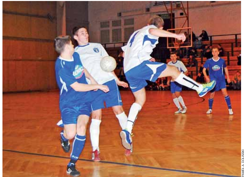
W meczu Korona - Agros-Nova padł wynik remisowy 2:2, który zapewnił ekipie z Wejścia awans do I ligi.

■ Bo-Dach Grudze – Start Złaków Borowy 4:3 (2:2) ; br.: Da-