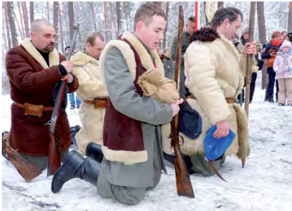
Mężczyźni z oddziału powstańczego w czasie inscenizacji przyjęli błogosławieństwo przed wyruszeniem do lasu. Wcześniej każdy z nich pożegnał się z rodziną i otrzymał zawiniętą w materiał żywność.

kompanię honorową, członkowie stowarzyszeń historycznych: łowickiego im. 10 Pułku Piechoty i skierniewickiego – Tradycji 26 Dywizji Piechoty. Otaczało ich ponad 200 osób.