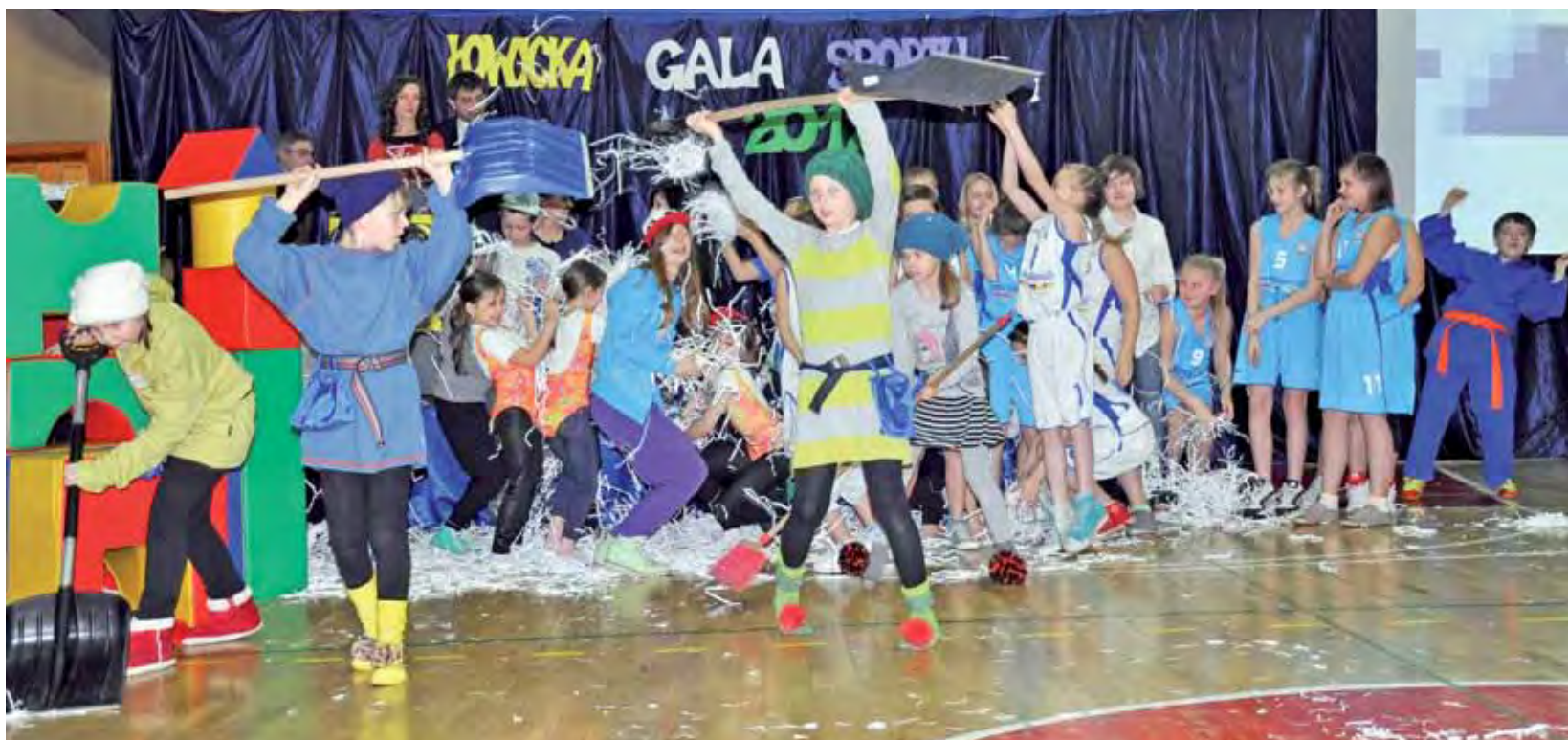
Łowicka Gala Sportu na pewno nikomu się nie dłużyła... Krasnale kolorowo i dynamicznie znalazły swoje miejsce w sporcie i rekreacji.

Łowicka Gala Sportu | Podsumowanie sportowego roku 2012