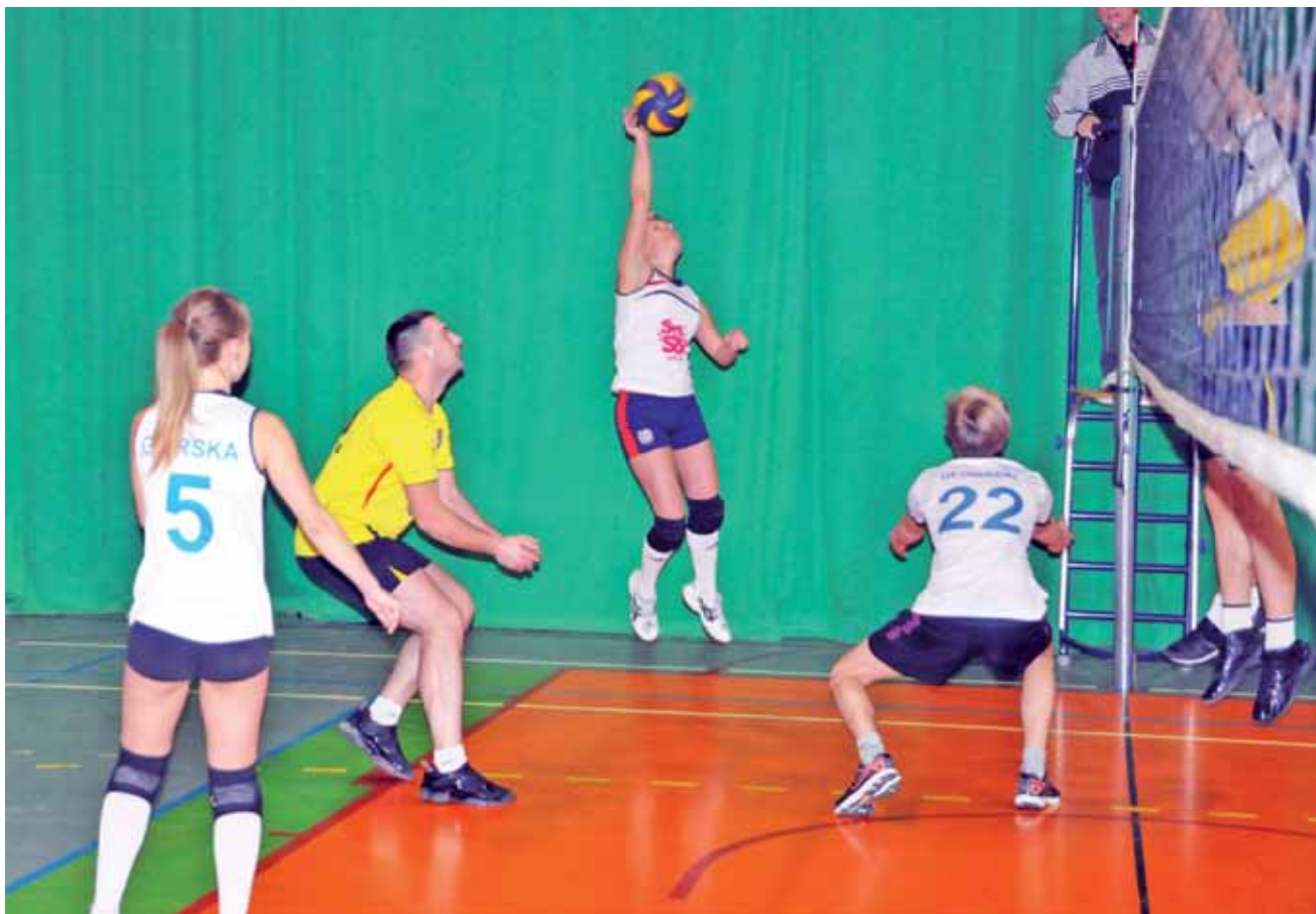
W drużynie AKS Skok Na Sok Skierniewice systematycznie występowały trzy dziewczęta, które niejednokrotnie nawet punktowały...

Piłka siatkowa | 14. kolejka Siatkarskich Amatorskich Mistrzostw Łowicza