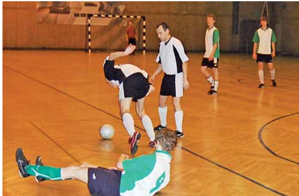
Gracze KS Stefan mieli z rywalami z Dabro sporo kłopotów, ale ostatecznie wygrali i awansowali do III rundy.

Cztery kolejne mecze III rundy odbędą się w sobotę 23 lutego 2013 roku w godz. 16.00-18.00. Także w sobotę 23 lutego w godz. 18.00-20.00 rozgrywane będą mecze ćwierćfinałowe, a na niedzielę 3 marca zaplanowano półfinały (godz. 17.00-18.00) i wielki finał Pucharu Ligi ŁoLiF o godz. 18.30. Tego dnia, przed finałem, zostaną także wręczone puchary i nagrody za rozgrywkę I, II, III i IV ligi ŁoLiF. P