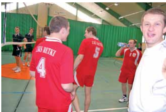
Niekrywana radość siatkarki LKS Retki po tym jak pierwszego seta Korabce II urwali gracze Rawki Bolimów.

Zakończenie rozgrywek XIV edycji SAM zaplanowane zostało na sobotę 23 lutego 2013 roku.