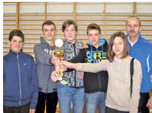
Uczniowie Pijarskiego Gimnazjum Królowej Pokoju w Łowiczu odnieśli sukces w Rejonowej Gimnazjadzie Szkolnej w szachach