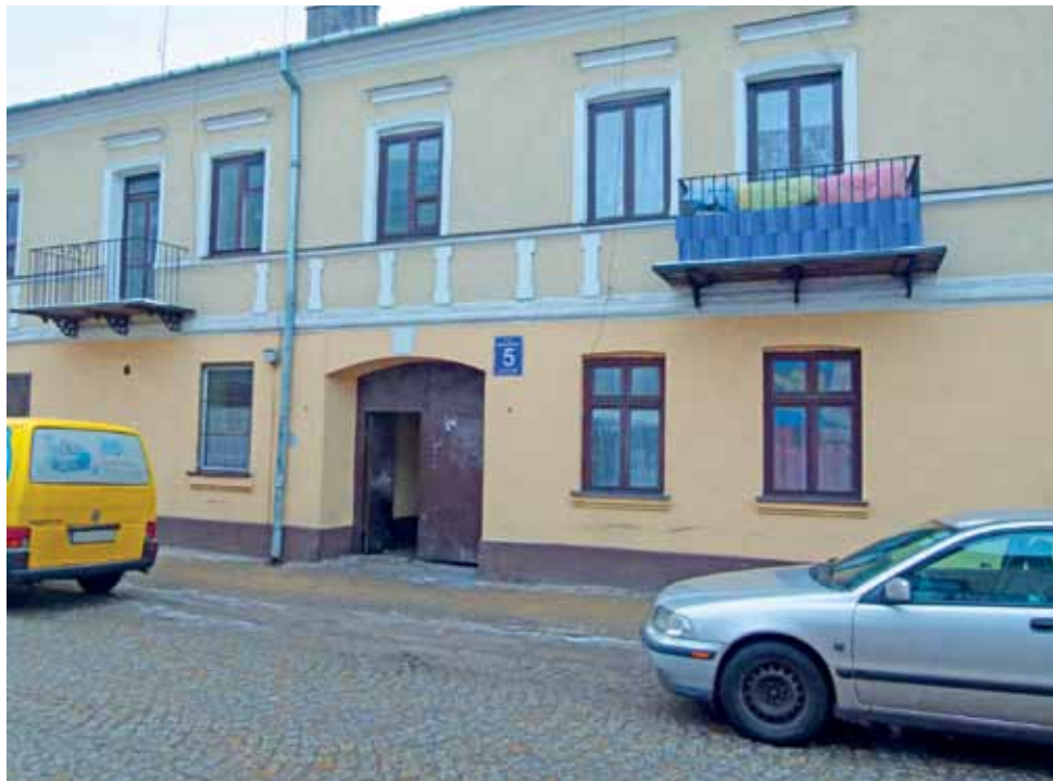
To w tej kamienicy rozegrały się 7 lutego tragiczne wydarzenia.

– Do tragicznych wydarzeń doszło w kuchni. Na parapiecie w kuchni został znaleziony nóż, który był prawdopodobnie narzędziem zbrodni – informuje Krzysztof Kopania, rzecznik Prokuratury Okręgowej w Łodzi. Czynności, które podejmowała na miejscu policja i prokuratura 7 lutego, były utrudnione, ponieważ w mieszkaniu komunalnym,