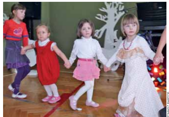
Na balu w szkole w Mastkach wszyscy doskonale się bawili, najlepiej jednak najmłodszy.