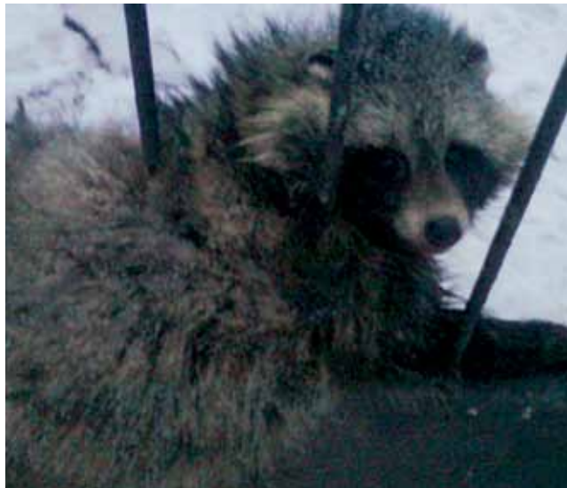
Zwierzę znalezione w furtce przy jednej z posesji przy ul. Armii Krajowej zostało uwolnione przez strażaków.

Strażacy z Państwowej Straży Pożarnej w Łowiczu przyjechali na miejsce zdarzenia kilka minut po godz. 7 i szybko (w rękawicach ochronnych) uwolnili uwięzione zwierzę. Ponieważ było ono osłabione i wychłodzone, straż przewiozła je do przychodni weterynaryjnej Popławscy w Łowiczu. Jeden z pracowników przychodni powiedział nam, że zwierzę, które 11 lutego przywieźli strażacy, to jenot – drapieżny ssak należący do rodziny psowatych. Co ciekawe jenot jako jedyny psowaty zapada