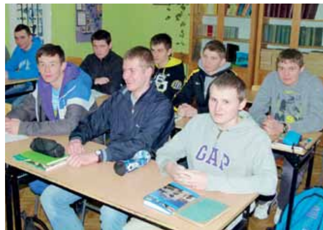
Uczniowie I klasy LO w Zdunach o profilu obronnym podczas lekcji języka polskiego. Po lekcjach licealiści chętnie angażują się w promocję szkoły, np. rozwieszając plakaty zapraszające na dni otwarte.

Fundamentem, w oparciu o który szkoła ma szansę przetrwać, jest jednak trzeci z proponowanych przez liceum profili: profil obronno-pożarniczy z elementami bezpieczeństwa