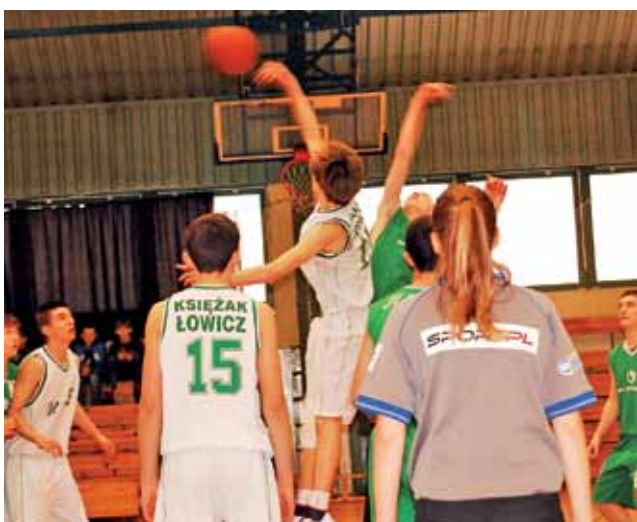
Od początku meczu kadeci Księżaka mieli przewagę nad Junakami.

Do przerwy Księżacy prowadzili już 58:26. Przy takim wysokim prowadzeniu trener Rutkowski mógł sobie pozwolić na „hokejowe” zmiany, zatem