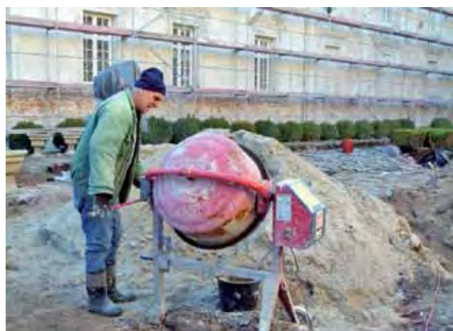
Jeżeli sprzyja temperatura , to budowlanicy z Zielonki kontynuują remont dziedzińca. Jeden z pracowników przygotowuje zaprawę tynkarską.

Podnośnik hydrauliczny o udźwigu 400 kg będzie mógł się wznieść na wysokość 8 metrów. Na panelu sterującym windą znajdują się oznaczenia Braila, które ułatwiają obsługę niewidomym. – Podnośnik hydrauliczny i szyb zostanie umiejscowiony na klatce schodowej, tuż obok schodów – mówi kierownik administracyjny muzeum Wiktor Bieńnik. Wejście do windy znajduje się tuż obok pierwszego schodka. Budowlanicy ze Spółdzielni Rzemieślniczej przygotowali już fundament pod montaż podnośnika: wycięli otwór