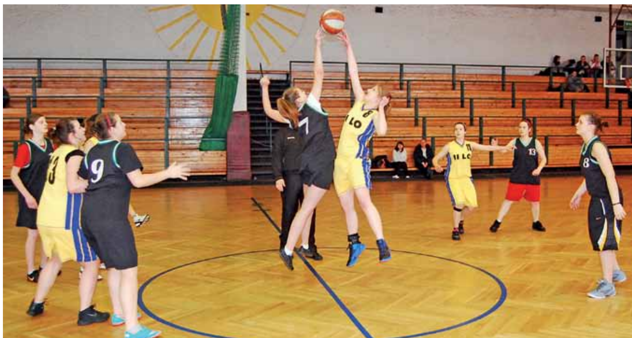
W finale koszykarki z ZSP 4 Łowicz pokonały rywalki z II LO Łowicz i po dwóch latach znowu okazały się najlepsze na Ziemi Łowickiej.

Łowiccy koszykarze wygrali po dogrywce, a wkrótce już faza play-off. str. 46