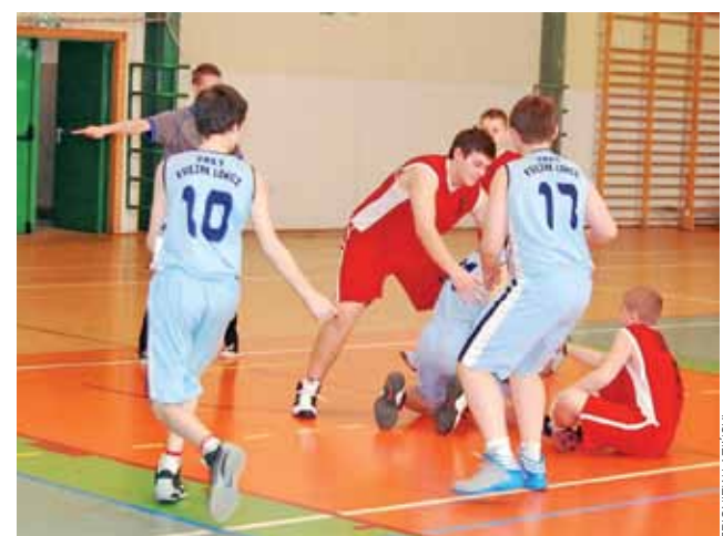
Młodzicy Księżaka-99 odnieśli zwycięstwo w meczu z Trójką Sieradz.