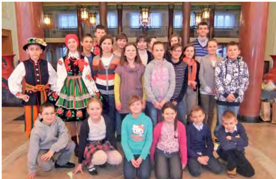
Grupa dzieci i młodzieży z filii Gminnego Ośrodka Kultury w Bełchowie, we wnętrzu ambasady CHRL w Warszawie.

Na początek dzieci obejrzały film dokumentalny „Droga do szkoły”, opowiadający o uczniach prowincjonalnej szkoły położonej w górach, którzy, aby dotrzeć na lekcje, muszą przejść pieszo kilkanaście kilometrów, a napotkaną po drodze rzekę pokonują przejeżdżając nad jej nurtem na linie.