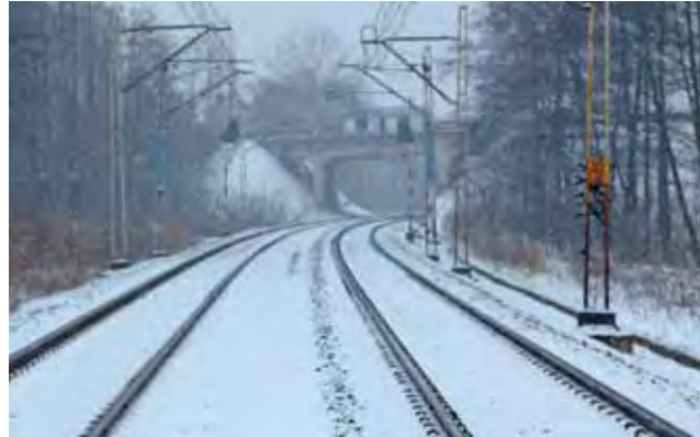
Tak wygląda tunel sfotografowany z przejazdu kolejowego na ul. Seminarijnej. Do tragedii doszło właśnie tam.

W letnich miesiącach pod wiaduktem spotykają się młodzi ludzie. Nieraz zachowują się głośno, spożywają alkohol albo nawet zamawiają pizzę z dowozem pod wiadukt. Pozostawiają po sobie stosy śmieci. – Nie wiem, czemu wybrali sobie to miejsce. Tam jest tak nie-