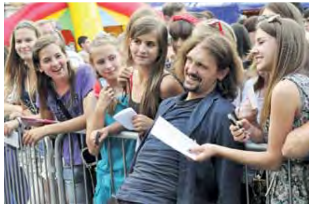
Dni Łowicza 2012 r. Gienek Loska chętnie fotografował się z fankami, rozdawał autografy, rozmawiał i wymieniał uśmiechy.

Drugiego dnia wystąpi Maciej Maleńczuk, polski wokalista i gitarzysta rockowy, poeta, a także osobowość telewizyjna. W latach 1986-2005 był wokalistą i frontmanem zespołu Püdüls, z którym nagrał szereg płyt. Pierwszą solową płytę