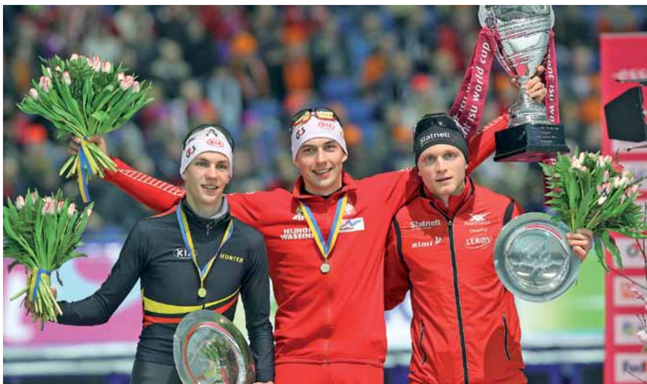
Polak zdobył Puchar Świata w łyżwiarstwie szybkim? To nie sen... Zbyszek Bródka wygrał z reprezentantami krajów, które wykładają znacznie większe fundusze na rozwój panczenów.

■ Klasyfikacja końcowa Pucharu Świata kobiet: 1. Holandia 400 pkt, 2. Kanada 370, 3. Polska 295, 4. Niemcy 280, 5. Korea Południowa 160, 6. Japonia 135, 7. Norwegia 130, 8. Rosja 95.