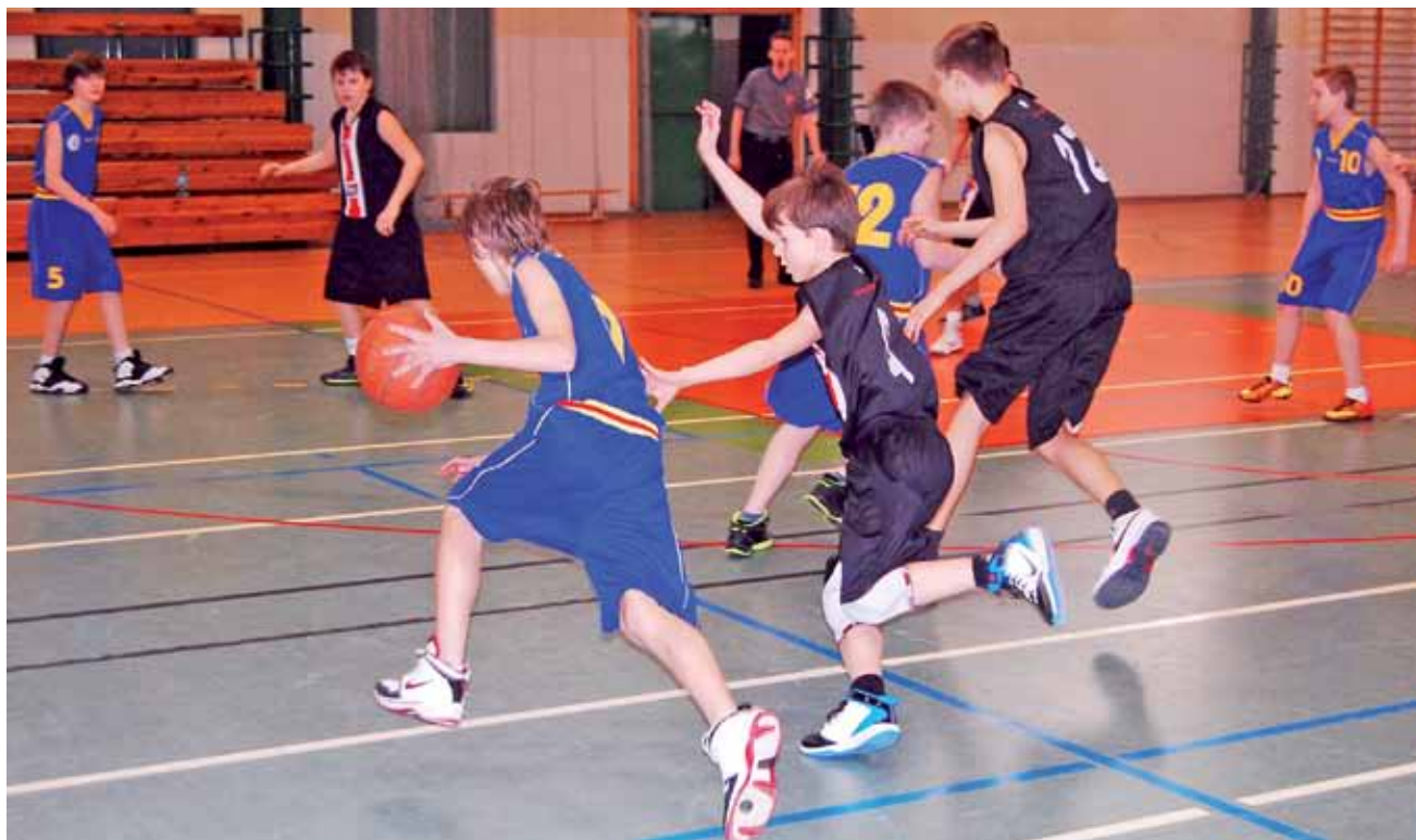
W niedzielnym meczu z ŁKS w zespole Księżaka-2000 zadebiutowało czterech żaków.

Koszykówka | Wojewódzka liga młodzików U-13