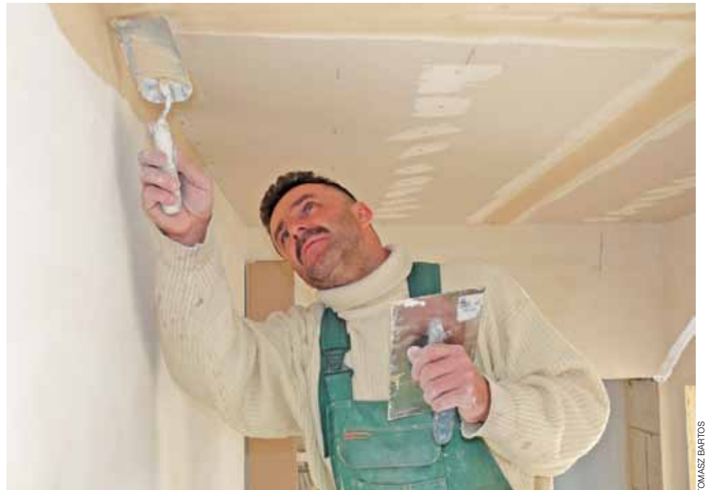
W budynku trwają prace wykończeniowe m.in. przy wykonywaniu podwieszanych sufitów.

Łowicz | Mieszkania na Nowej – nie ma już wolnych