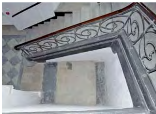
W tym miejscu zostanie zamontowana winda , która osobom starszym i niepełnosprawnym znacznie ułatwi dostęp do eksponatów.

Renowację przejdą także drewniane parapety i drzwi oraz podłogi: parkiety zostaną wycyklinowane, natomiast lastrykowa posadzka przejdzie szlifowanie. Zerwane zostaną tylko