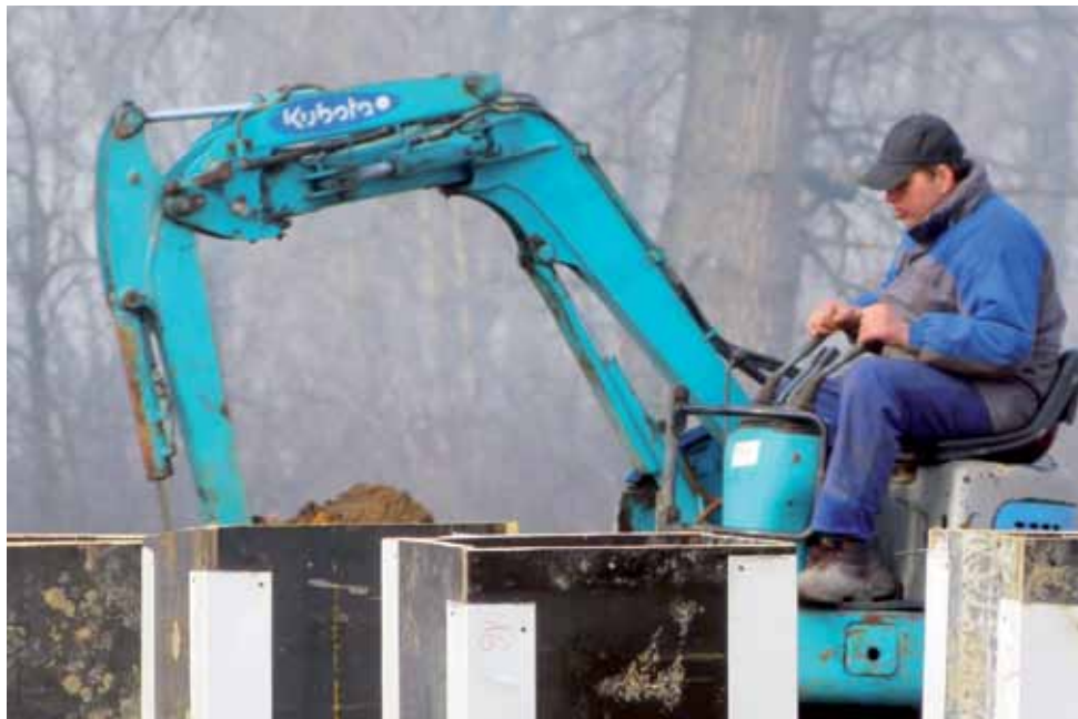
Pierwsze roboty ziemne związane z budową fundamentów pod halę odbyły się w ubiegłym tygodniu.

Przebudowa obejmuje wykonanie dwóch zadaszonych wiat na 64 stanowiska handlowe, budynku kontenerowego z WC, utwardzenia, oświetlenia i odwodnienia terenu rozpoczętą się wczesną wiosną. Modernizacja targowiska jest dofinansowana z programu Mój Rynek. Gmina pozyskała na ten cel milion złotych od Urzędu Marszałkowskiego w Łodzi. Jest to 75% wartości całej inwestycji, reszta pieniędzy będzie pochodziła z budżetu gminy. Roboty mają kosztować 1.627.203,05 złotych. mak