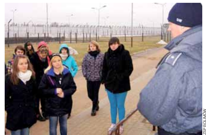
Uczniowie z dużym zainteresowaniem słuchali funkcjonariuszy Służby Więziennej, którzy opowiadali im o swojej pracy.

Najciekawsze okazało się dla młodzieży jednak spotkanie z grupą osadzonych z oddziału terapeutycznego dla uzależnionych od środków odurzających lub psychotropowych. Skazani więźniowie opowiadali młodzieży o błędach, które popełnili w przeszłości. Byli to zarówno