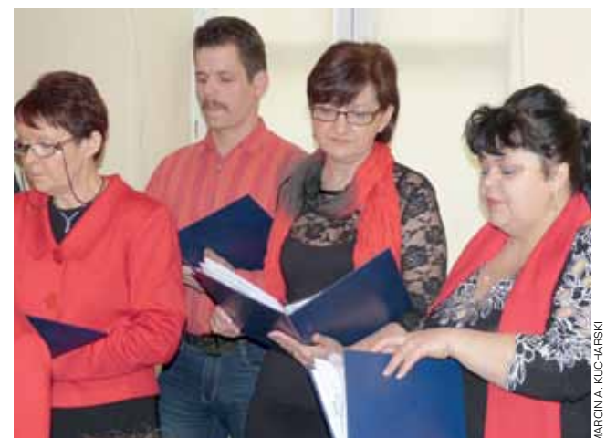
W bolimowskim chórze śpiewają też panowie, ale są w zdecydowanej mniejszości. Występ na Dzień Kobiet był mocno oklaskiwany.