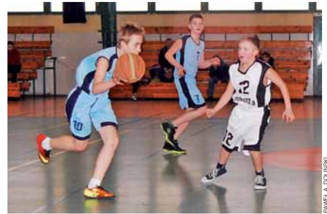
Żacy Księżaka nie dali większych szans swoim rywalom ze Skierniewic.