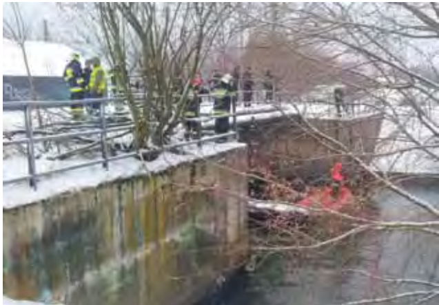
Poszukiwanie topielca przy tamie na Rawce nie mogło się zakończyć znalezieniem go, bo utonięcia nie było.

Do zdarzenia miało dojść kilka minut przed godz. 16 w rejonie tamy przy elektrowni wodnej w Bolimowie. Rzeka o tej porze