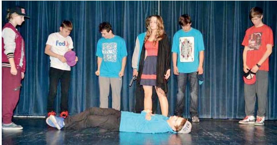
Scena ze spektaklu „Spod znaku graffiti”. W musicalu występuje 29 uczniów oraz absolwentów Gimnazjum nr 2 w Łowiczu.

Widzą w teatrze świetny pomysł na spędzanie wolnego czasu i uważają, że uczestnicząc w próbach, robią coś pożytecznego.