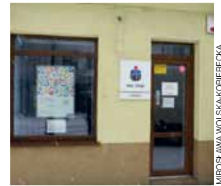
Na drzwiach agencji po napadzie pozostały ślady zdejmowania odcisków palców.

Gdy krótko po napadzie rozmawialiśmy z osobami, które prowadzą działalność lub pracują na Zduńskiej, niewiele uda-