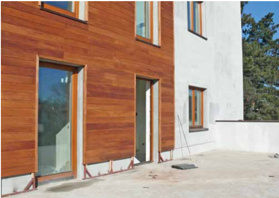
Mieszkania na pierwszym piętrze od strony wschodniej mają wyjścia na obszerny teras.