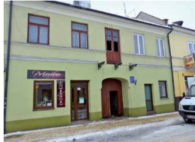
Pożar wybuchł w budynku ZGM przy ul. Zduńskiej na I piętrze, z charakterystycznym zdemontowanym balkonom.

Komendant PSP w Łowiczu bryg. Jacek Szeligowski powiedział nam, że na miejsce dyżurny wysłał od razu 3 zastępy PSP, pojechał tam zastępca komendanta mł. bryg. Jan Gładys, potem do akcji zdecydowano się włączyć jeszcze 2 zastępy z OSP Łowicz. – Całe szczęście, że zgła-