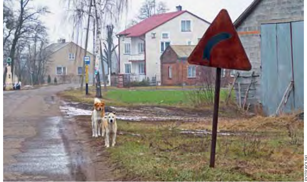
Mieszkańcy uważają, że droga w tej wsi niszczy się, ponieważ przez wysokie pobocza nie spływa z niej woda. Przy gminnej drodze stoją także znaki, które pokryły się korozją i są mało czytelne.