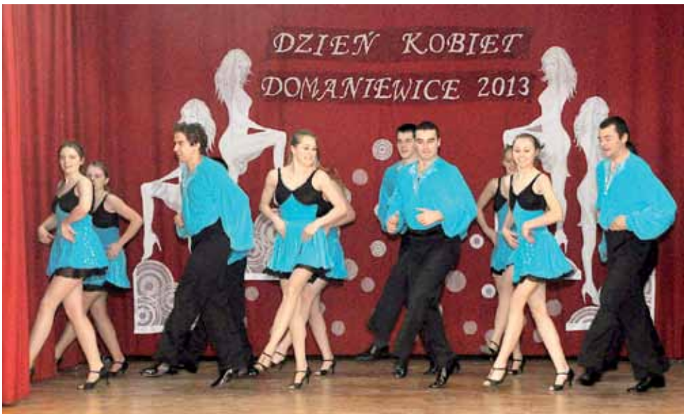
Zespół ludowy Kalina z Domaniewic tym razem nie zatańczył tańców regionalnych, tylko nowoczesne.

Rower daje poczucie wolności. O czym opowiadali podróżnicy zaproszeni do Łowicza. str. 27