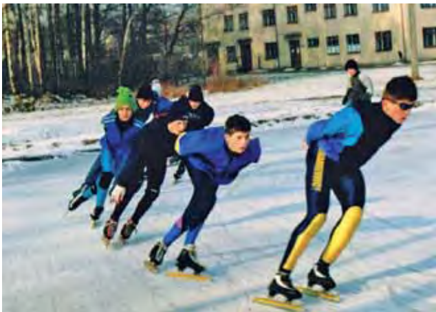
Tak ćwiczyła grupa, w której trenował w Domaniewiczach Zbigniew Bródka (na zdjęciu niewidoczny). Fotografia pochodzi z roku 2001.