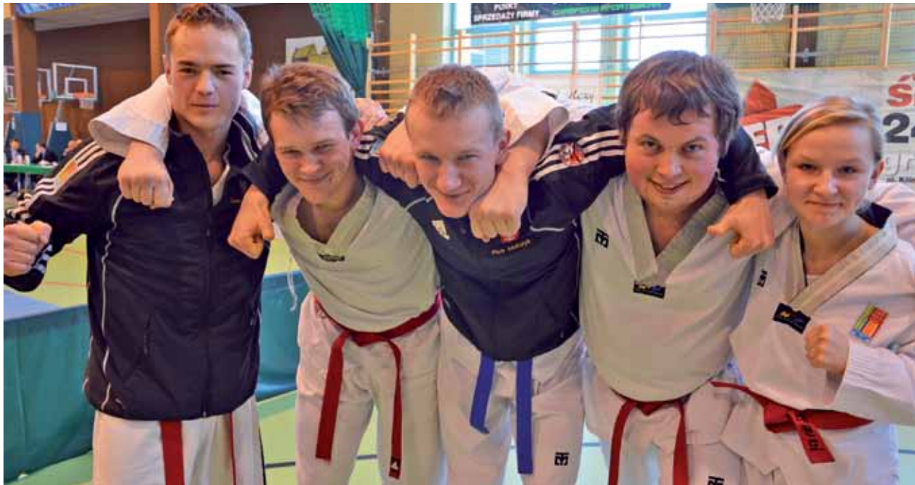
Grupa taekwondoków reprezentujących ŁAS wywalczyła w Nidzicy w Pucharze Polski sześć medali.

Taekwondo | I edycja Pucharu Polski Poomsae