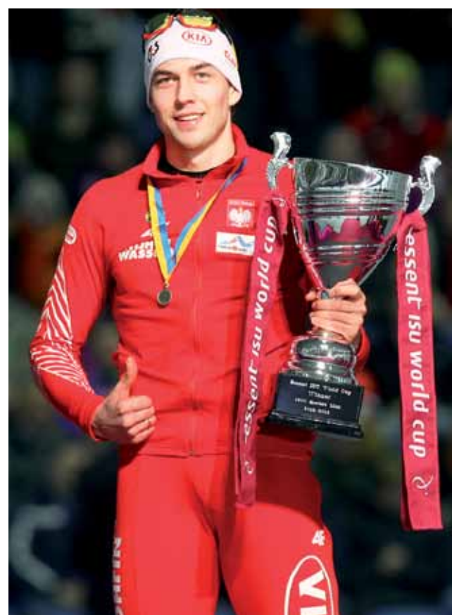
Zbigniew Bródka zdobył Puchar Świata i tym samym przeszedł do historii polskiego sportu.

■ 1500 m: 1. Bart Swins (Belgia) 1:45,50 min, 2. Zbigniew Bródka (Polska) 1:45,96 min, 3. Shani Davis (USA) 1:46,13 min, 4. Kjeld Nuis (Holandia) 1:46,34 min, 5. Denis Yuskow (Rosja) 1:46,48 min, 7.