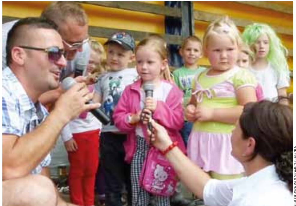
Zespół Magic Dance zaprosił dzieci do konkursu. Tym razem zadanie polegało na recytacji krótkiego wiersza, a wygrać można było maskotki.

Na późniejszym pikniku strażackim uwagę zwracało duże stoisko miejscowego Koła Gospodyń Wiejskich. Pracujące w nim panie nie ukrywały, że zależy im, aby na imprezie nikt nie był głodny. A przygotowanego jadła było niemało: upiekły 15 blach ciast, miały obrane i pokrojone na frytki 15 kg ziemniaków, które można było zamówić.