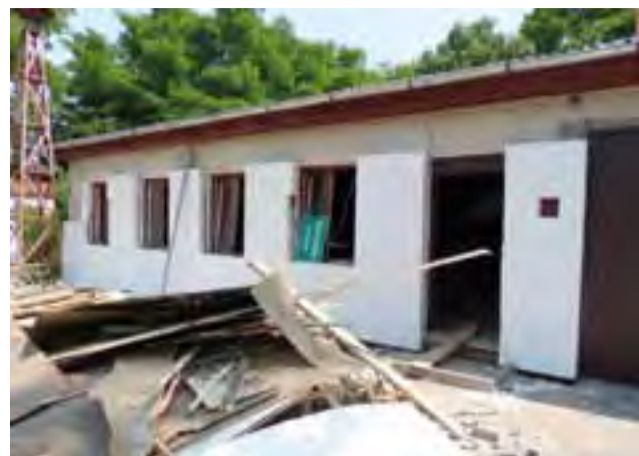
Budynek Domu Ludowego w Wygodzie w trakcie remontu. Ostatecznego efektu możemy spodziewać się w końcu sierpnia.

Więcej o zwyciężkach ogrodach i ich właścicielach – za tydzień.