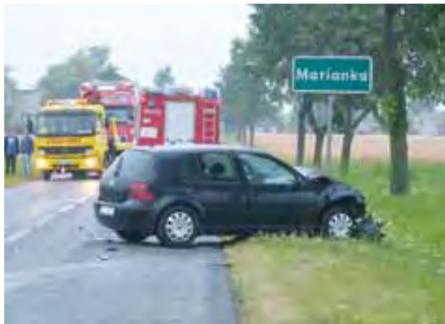
Wstępne ustalenia wskazują na to, że ten VW wyprzedzał Fiata CC.

Na naszej stronie www.lowiczanie.info szybko pojawiły się komentarze na temat przebie-