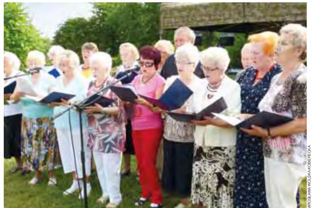
Nad zalewem w Belchowie wystąpił chór łowickiego Klubu Seniora.

To, czy Boże Ciało zostanie umieszczone na liście, okaże się dopiero za jakiś czas. Ma ono jednak szansę być pierwszym z wydarzeń z Polski na międzynarodowej liście UNESCO. Utworzenie krajowej listy – co leży w gestii ministra kultury i dziedzictwa narodowego – stworzy bowiem podstawę do umieszczenia przejawów niematerialnego dziedzictwa kulturowego z terenu naszego kraju na międzynarodowych listach, prowadzonych przez UNESCO. ■