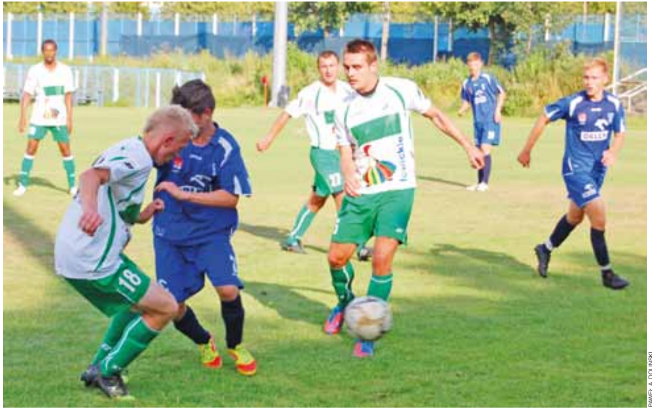
Drugoligowy Pelikan zaaplikował ekipie rezerw Wisły Płock aż dwanaście goli...

Tydzień temu pisaliśmy o piłkarzach, którzy byli bliscy zawarcia umów z Pelikanem. Teraz możemy napisać o tych, którzy kontrakty podpisali. Mowa między innymi o 20-letnim bramkarzu ŁKS Łódź, który