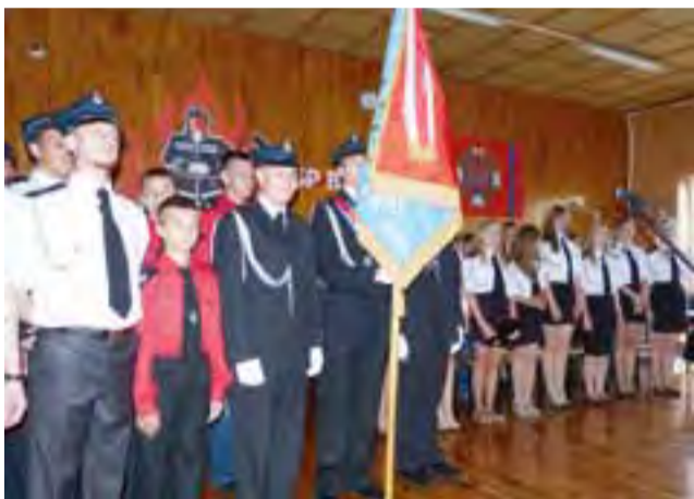
Bocheńska młodzież z OSP przygotowała program artystyczny i stała w poczcie sztandarowym.