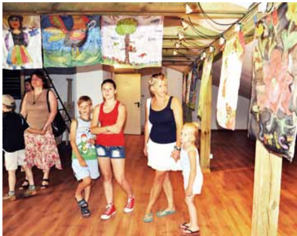
Twórcy prac wspólnie z rodzicami oglądają chusty, które powstały podczas warsztatów.

Uczestnicy zajęć wykonali chusty z motywami róż występujących często w haftach łowickich kiecek czy gorsetów. Dzieci chętnie malowały również kolorowe koguciki inspirowane wycinankami czy też łowickanki w barwnych pasiakach. Przez tydzień efekty ich prac można było oglądać w galerii na strychu ŁOK. Później dzieci zabrały swoje prace do domu. am