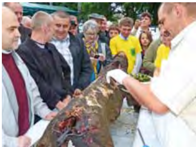
Chętnych do degustacji mięsa z dzika – jak zawsze – nie brakowało.

W Kiernozi można spotkać dzika, ale na naszym terenie nie ma jego ostoi. Dzik sporadycznie występuje w niewielkim kompleksie leśnym w Czerniewie, a najbliższa jego ostoja jest w Luszyńcu. Nie przeszkadza nam to jednak w obchodzeniu Dnia Kiernozijskiego Dzika, który z roku na rok cieszy się coraz większym powodzeniem, co nas, myśliwych, cieszy.