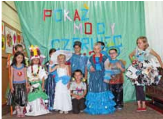
Dzieci w wymyślonych przez siebie ekologicznych strojach.

Dzięki podjętym działaniom zakupiono sprzęt nagłaśniający i materiały plastyczne do szko-