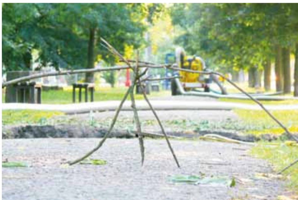
Do wykopu, w którym odsłonięto pękniętą rurę kanalizacyjną, nie można było wpaść, drogę zastawiała taka ciekawa konstrukcja. Wcześniej były też tabliczki z napisem informującym o braku przejścia.

W poniedziałek zastąpiono pęknięty odcinek rury z kamionki rurą z PCV, którą dodatkowo obetonowano dla zachowania szczelności. Aby móc to wykonać, pracownicy ZUK musieli wyłączyć uszkodzony odcinek kolektora z użycia, przepompowując motopompą ścieki pomiędzy dwoma najbliższymi studniami. Oprócz tego kolektor został oczyszczony z piachu, który dostał się do niego przez pęknięcie. tb