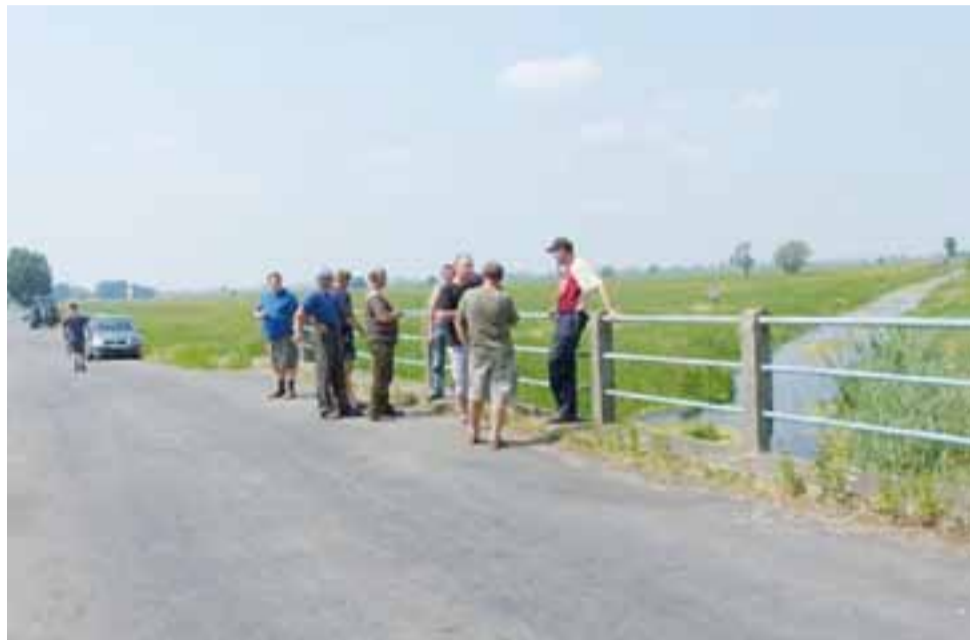
Most nad Słudwią w Łażnikach. Oględziny kilku specjalistów nieoczekiwanie przekształciły się w gminne spotkanie. Rolnicy po dwóch godzinach zaczęli się rozchodzić, ale zapewniają, że broni nie złożyli.

że po oczyszczeniu koryta woda zawsze płynie szybciej, przez co mocniej napiera na brzeg i wylewa. Jeśli kogoś nie przekonają podstawowe prawa fizyki, to niech zwróci uwagę, że odmulanie było zrobione w 2009 roku,