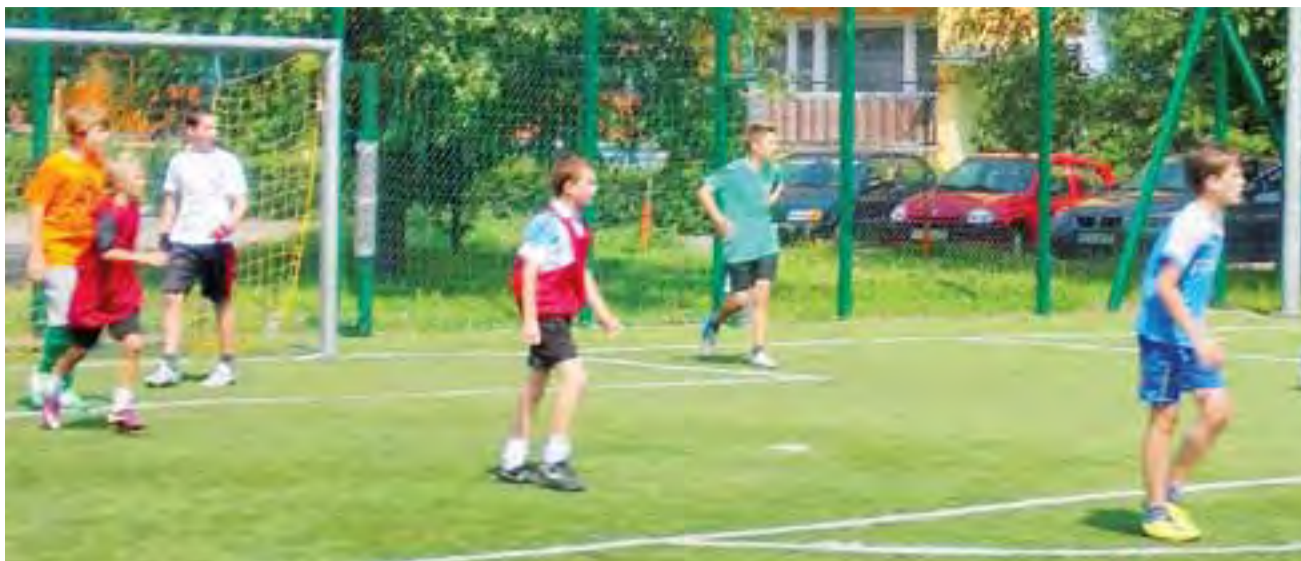
Komplet zwycięstw odniosła drużyna WKS, czyli Wybrzeża Klatki Schodowej.