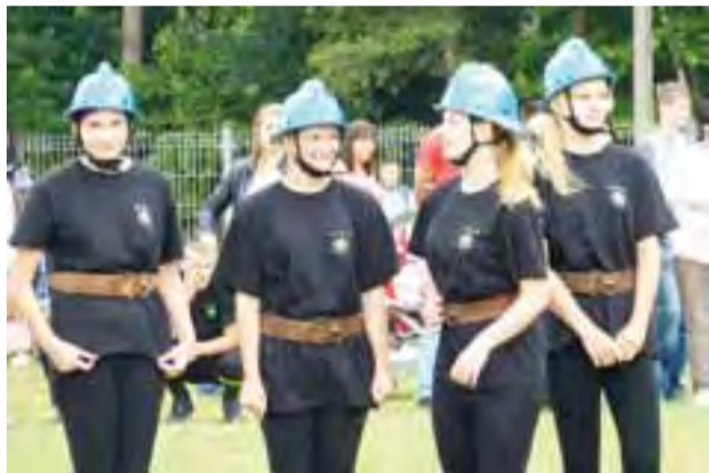
Ekipa żeńska z OSP Mysłaków na chwilę przed startem. Dziewczęta zajęły II miejsce.

Wartość nagrody dla zwycięzcy wyniosła 1000 zł, za miejsce II – 800 zł, za III – 600 zł, pozostałe drużyny za udział otrzymały po 300 zł.