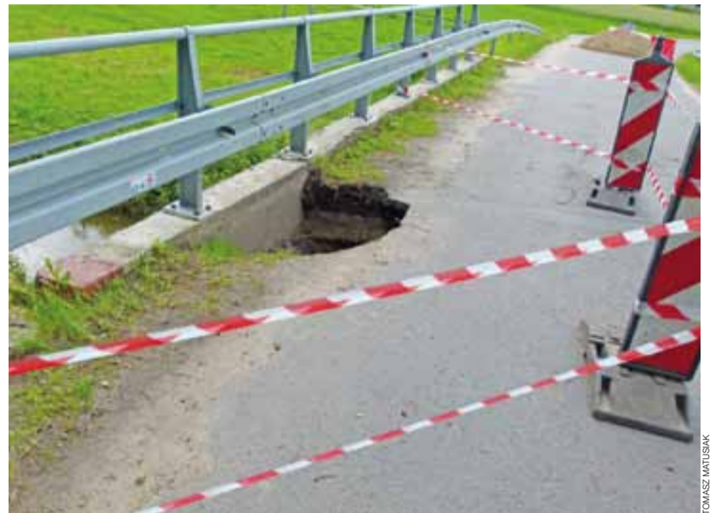
Most przy drodze powiatowej w Skaratkach zarwany na początku czerwca.

– Myslę, że przetarg pokaże, że most będzie dużo tańszy niż teraz się szacuje. Chcemy go wybudować od podstaw, miałyby mieć konstrukcję podobną do wiaduktu, który znajduje się przy ulicy Seminarnej w Łowiczu – powiedział nam Kosmatka. Jest on przekonany, że jeśli uda się przygotować wszystkie dokumenty i ogłosić przetarg, to inwestycja może trwać maksymalnie miesiąc i jeszcze w tym roku most stanie. tb