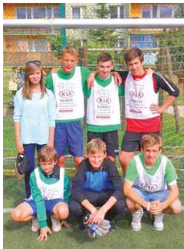
Drużyna Born To Win okazała się najlepszą w rywalizacji gimnazjalistów.