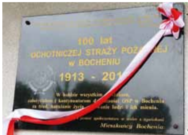
Tablica upamiętniająca 100-lecie została już zamontowana na elewacji remizy.

z inicjatywy Jerzego Kurczaka rozpoczęto prace remontowe Domu Ludowego. Wyremontowano elewację i wymieniono drzwi do garażu. W 1993 roku, na 80-lecie, społeczeństwo Bochenia ufundowało jednostce sztandar. W tym też czasie w garażach zainstalowano ogrzewanie, co pozwoliło szybciej uruchamiać pojazdy w czasie zimy. W tym czasie gmina Łowicz zakupiła dla jednostki Stara 660. W 2001 roku OSP Bocheń weszła do Krajowego Systemu Ratowniczo-Gaśniczego. Po kilku latach udało się dokończyć budowę dodatkowego garażu, do którego trafił nowy samochód bojowy marki Jelcz. W 2006 roku straż otrzymała też Forda Transita.