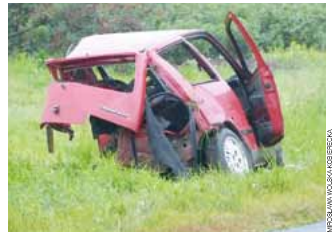
Tym Fiatem Cinqcento podróżowało małżeństwo W. z Łowicza.

Po wypadku czerwony Fiat CC, nieprawdopodobnie zniekształcony, znajdował się po lewej stronie drogi wojewódzkiej, zaś czarny VW Golf po prawej.