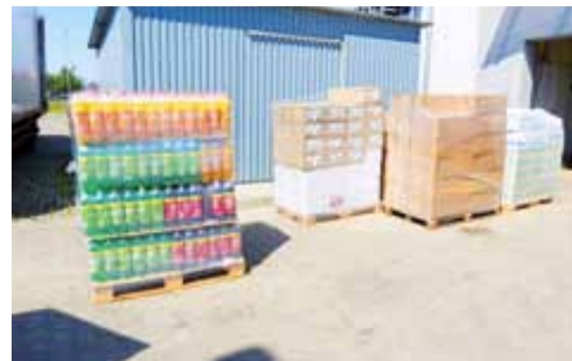
Z półek MarcPolu zniknęły wszystkie towary. Te o dłuższym terminie ważności zostały wywiezione do innych sklepów sieci. Zdjęcie wykonano w dniu zamknięcia marketu przy ulicy Łęczyckiej.