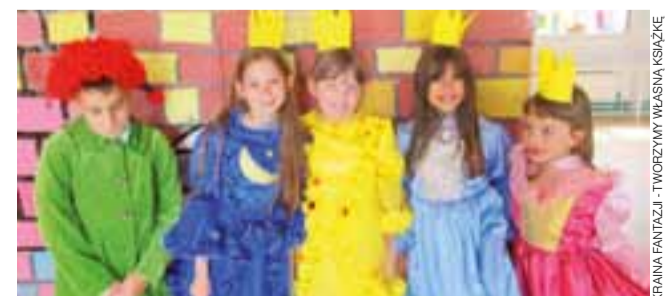
Uczestnicy zajęć w bajkowych strojach podczas warsztatów Kraina Fantazji. Podobne warsztaty odbędą się jeszcze w sierpniu – są na nie wolne miejsca.

Od 22 lipca rozpoczyna się też nabór chętnych do uczestnictwa w turnieju FIFA na dużym ekranie w kinie. ŁOK będzie przyjmował zgłoszenia do 28 lipca. Nie ma żadnych ograniczeń wiekowych. Turniej ma odbyć się 2 sierpnia, jeżeli będzie dużo chętnych zostanie wyznaczony dodatkowy termin. Od 25 lipca rusza także projekt wymyślony przez ŁOK – Filmowe Przygody Willy Łoka. Co tydzień w czwartek dzieci będą mogły spotkać się z Willy Łokiem, za którego przebrze się jeden z pracowników tej instytucji oraz obejrzą film. Wstęp do kina jest bezpłatny i nie obowiązują żadne wejściówki. Dodajmy, że za tydzień, 25 lipca o godz. 13, zostanie wyświetlony Ralp Demolka. am