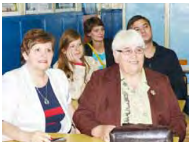
Maturzyści z lat 1972-1973 usiedli w szkolnych ławkach. Na spotkaniu było też kilka znacznie młodszych osób, które usiadły na końcu.