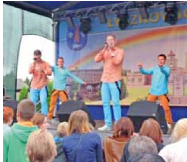
Na scenie zespół Maxel.