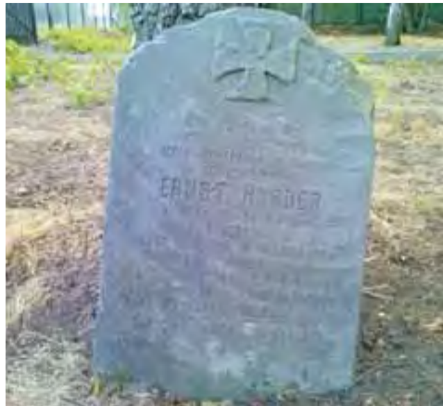
Jedyna zachowana stela nagrobną na cmentarzu z I wojny światowej w Wólce Łasieckiej.