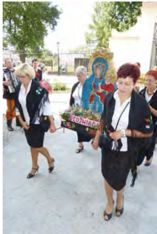
Wieniec dożynkowy z Niedźwiady był w tym roku misternie wykonanym z kłosów zbóż obrazem Matki Bożej.