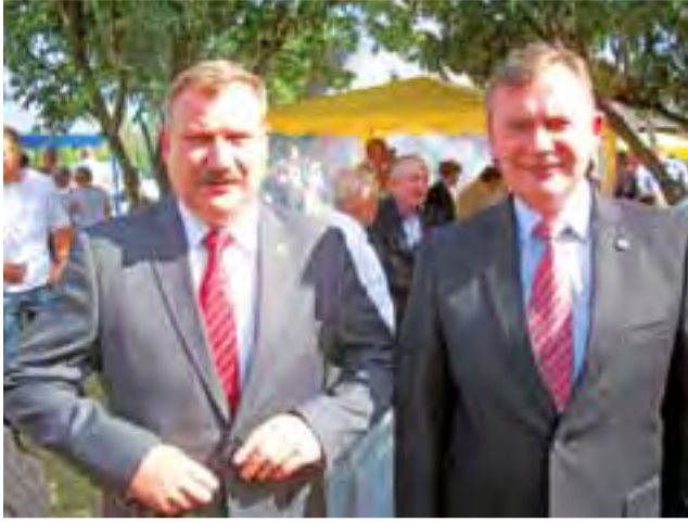
Na festynie zawitali m.in. starosta Krzysztof Figat i wicewojewoda Paweł Bejda.