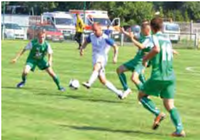
W Łowiczu Stal Rzeszów pokonała miejscowego Pelikana.

Dzięki zwycięstwu w Łowiczu Stal Rzeszów stała się samodzielny liderem rozgrywek grupy wschodniej II ligi. Nadszpiewanie dobrze spisują się również gracze Wigier Suwałki, którzy plasują się na drugiej pozycji i mają na koncie tyle samo punktów co Olimpia Elbląg. Jedynym zespołem, który w tym sezonie nie zdobył żadnych punktów pozostaje Garbarnia Kraków.