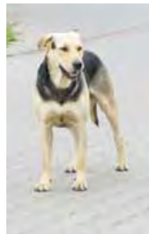
Miśka na środku ul. Granicznej.

Za wyłapywanie bezpańskich psów na terenie miasta odpowiada Wydział Spraw Komunalnych i Reagowania Kryzysowego