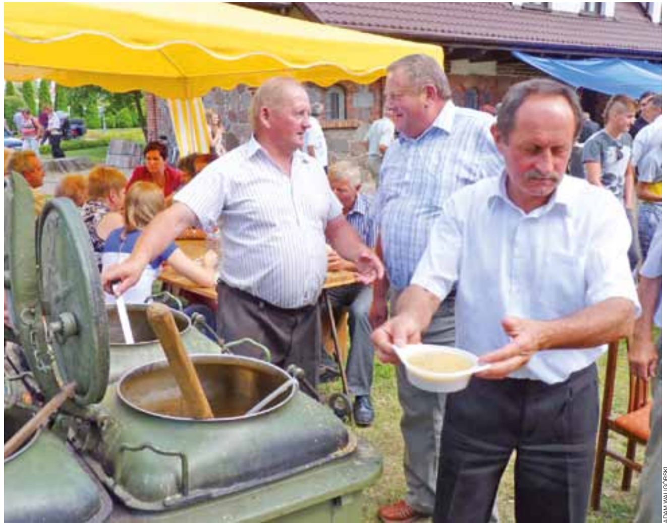
Grochówka cieszyła się dużym powodzeniem, zresztą nie tylko wśród panów. Wydano jej sporo ponad 1000 porcji, skończyła się już około 16.

Przygotowania do odpustu ruszyły już na kilka miesięcy przed datą samego festynu i choć dokładny plan organizacyjny powstał na przełomie maja i czerwca, a ostatnie 4 tygodnie wymagały intensywnej pracy, to pomysły zbierano przez cały rok. Odpowiedzialny za sponsoring Łukasz Świątkowski pracował nad pozyskaniem dobroczyńców od połowy czerwca. Jak powiedziała nam Aleksan-