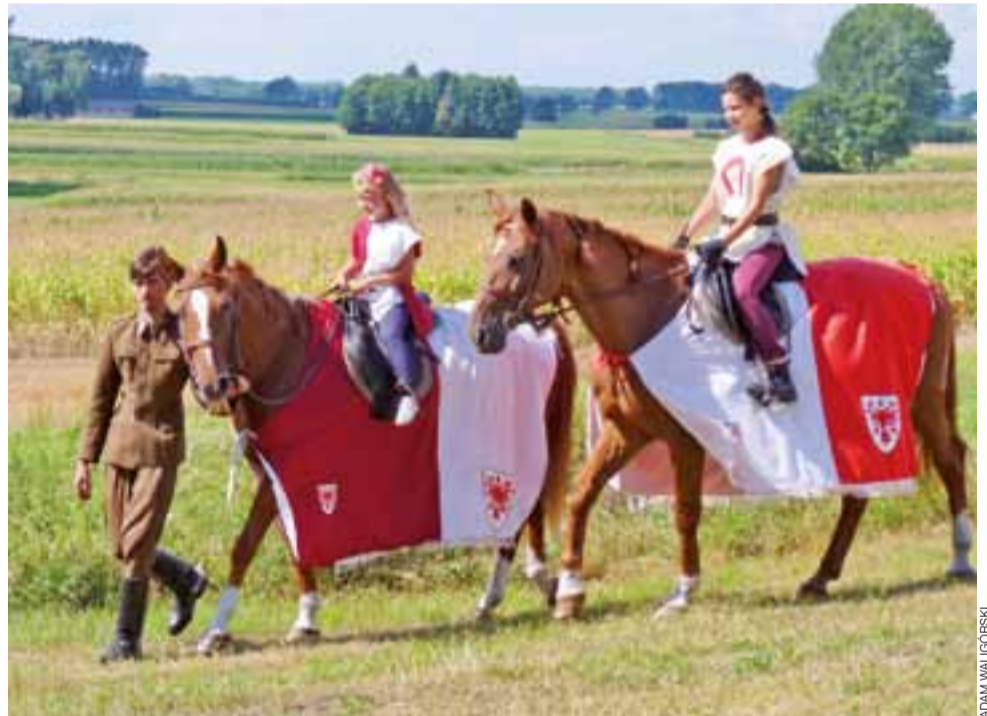
Przejażdżka na koniu była atrakcją także dla dziewcząt.