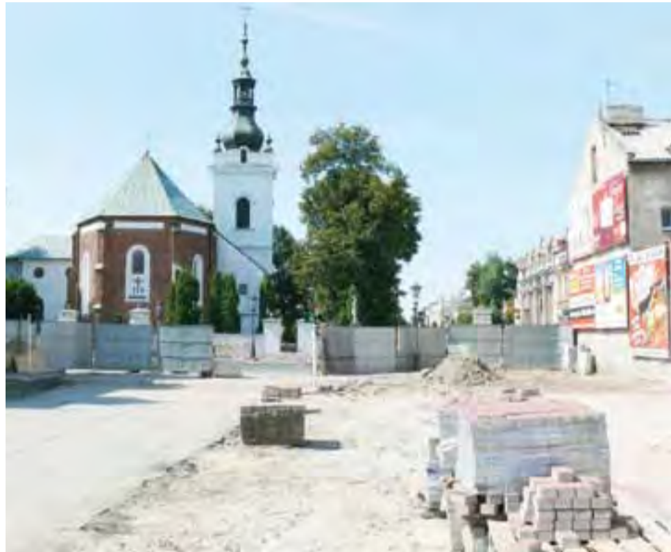
Prace już wykonane na ul. Kurkowej pokazują jak zmieni się ta ulica po ich zakończeniu.