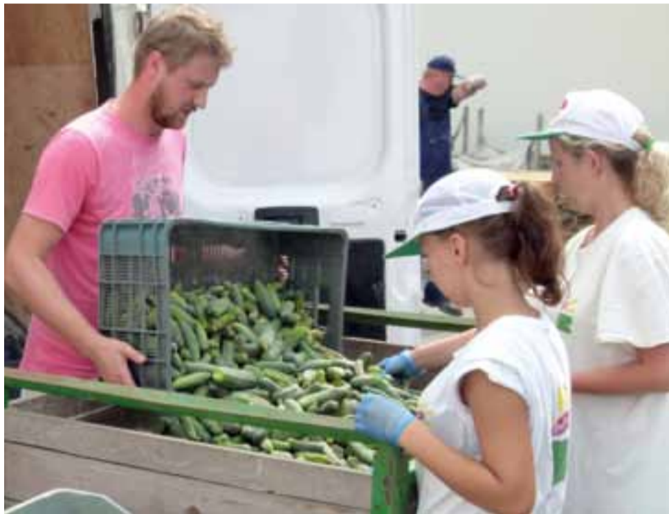
Pracownicy zakładu Bracia Urbanek prowadzą pierwszą selekcję ogórków już na etapie wyładunku z samochodu na palety.

Z tygodnia na tydzień ogórków jest coraz mniej, dlatego surowiec jest w tym roku drogi.