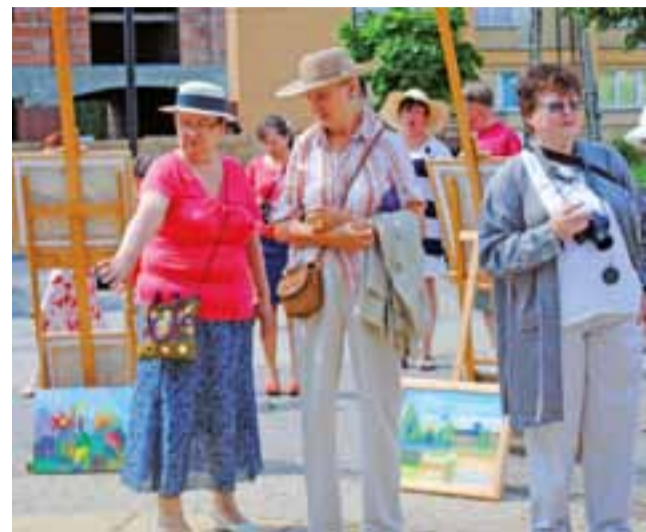
Wystawę artystów oglądało wielu mieszkańców Wiskitek. Część z nich była zaskoczona takim przedsięwzięciem w ich miejscowości.