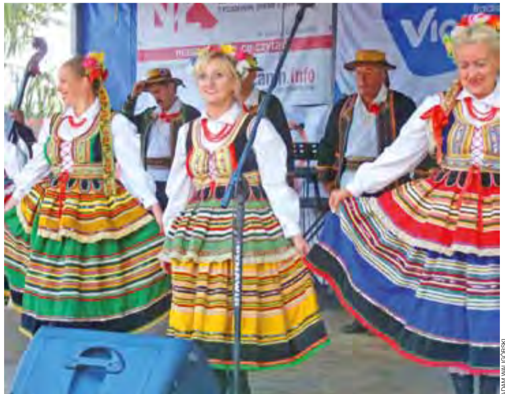
Na tym festynie nie napatrziliśmy się na stroje łowicze – bo występował zespół z Kutna. Różnica była wyraźna.