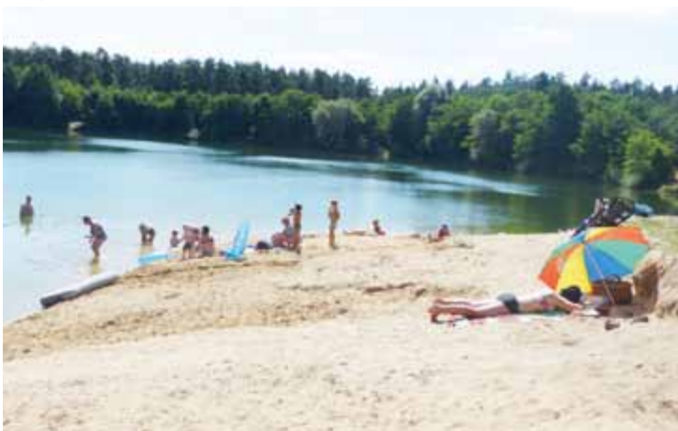
Czysta woda i lasy wokół przyciągają ludzi nad Rydwan. Większość z nich przyznaje, że brakuje podobnych miejsc w okolicy.

Być może błędem było nieprzyznanie temu miejscu od razu kierunku rekreacyjnego.