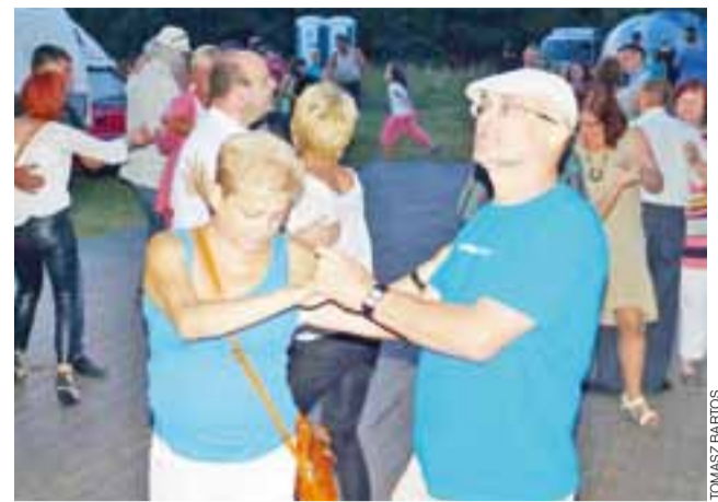
Imieniny św. Rocha są co roku okazją do dobrej zabawy na parkiecie przy muzyce granej na żywo ze sceny. W tym roku przygrywał Rezonans.