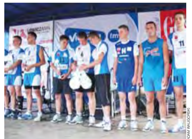
Obie drużyny z Soboty razem podczas rozdania nagród.

■ Grupa A: Sobota I – Przewiska 2:0 (15:9, 15:11), Zduny – Sobota II 0:2 (13:15, 11:15), Sobota I – Zduny 2:1 (15:10, 13:15, 15:10), Przewiska – Sobota II 0:2 (15:17, 9:15), Sobota I