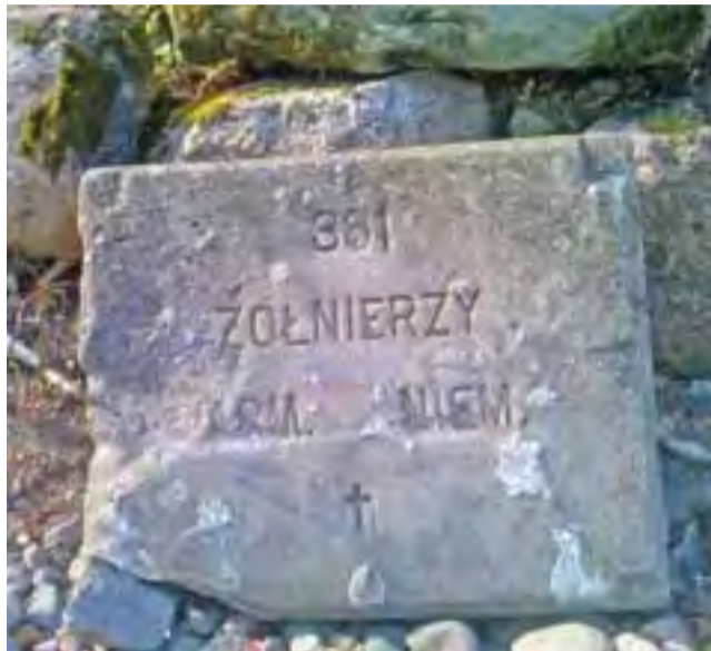
Tuż przed pomnikiem umieszczona została tablica, która upamiętnia pochowanych żołnierzy.

Cmentarz przez lata porastały drzewa i krzewy, które utrudniały do niego dostęp. Nie był on często odwiedzany, w porównaniu do cmentarza wojennego w Joachimowie-Mogiłach czy chociażby w Huminie. Trudno jest wskazać też właściciela cmentarza, ponieważ w dokumentach pojawia się zapis,