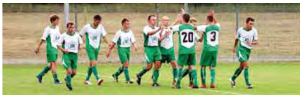
Radość piłkarzy Orła po strzeleniu czwartego gola.