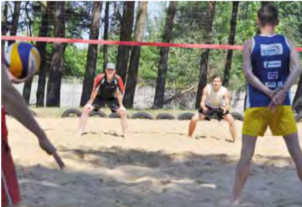
Po trzecim turnieju eliminacyjnym wiadomo kto zagra w sobotnim finale Otwartych Mistrzostw Łowicza.

Oczywiście drobne zmiany personalne mogą zaistnieć, ale wszystko wskazuje na to, że aby zagrać w finale trzeba mieć w sumie ponad 400 punktów. zł