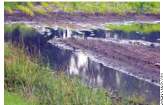
Lato w pełni, więc trudno sobie przypomnieć, że na wiosnę pola pod Łowiczem wyglądały tak. Straty po zalaniach były spore.

Zgodnie z programem produkcji rolni, którzy ponieśli szkody powyżej 30% średniej rocznej produkcji z 3 lat poprzedzających rok, w którym wystąpiły szkody albo 3 lat w okresie pięcioletnim, będą mogli ubiegać się m.in. o wspomniane już kredyty preferencyjne na wznowienie produkcji w gospodarstwach rolnych lub działach specjalnych produkcji rolnej oraz ze środków Agencji Restrukturyzacji i Modernizacji Rolnictwa o poręczenia lub gwarancje spłaty tych kredytów. Ponadto możliwe będzie odroczenie terminu płatności składek na ubezpieczenie społeczne i rozłożenie ich na dogodne raty przez KRUS. Możliwe będzie także umarzenie w całości lub części bieżących składek na indywidualny wniosek rolnika, w którego gospodarstwie rolnym lub działale specjalnym produkcji rolnej powstały szkody spowodowane