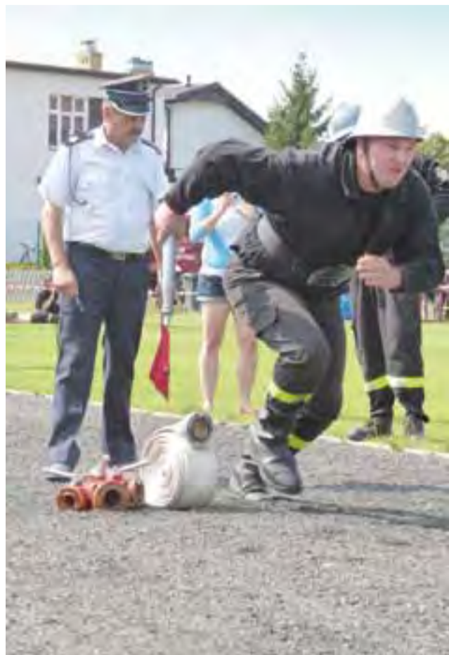
W czasie zawodów strażackich drużyny rywalizowały w sztafecie (na zdjęciu) i w „bojówce”.