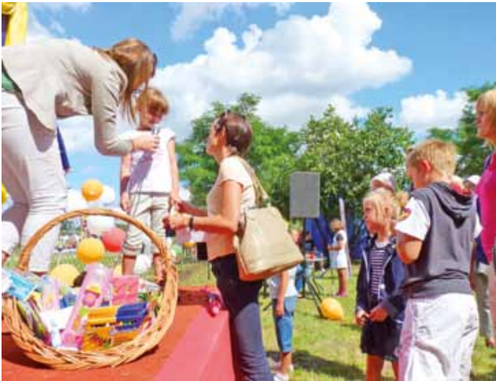
Po zaśpiewaniu dowolnej piosenki, każde dziecko dostawało nagrodę.