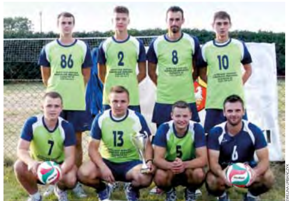
Farbis Łowicz wygrał Turniej Siatkówki w Bąkowie.