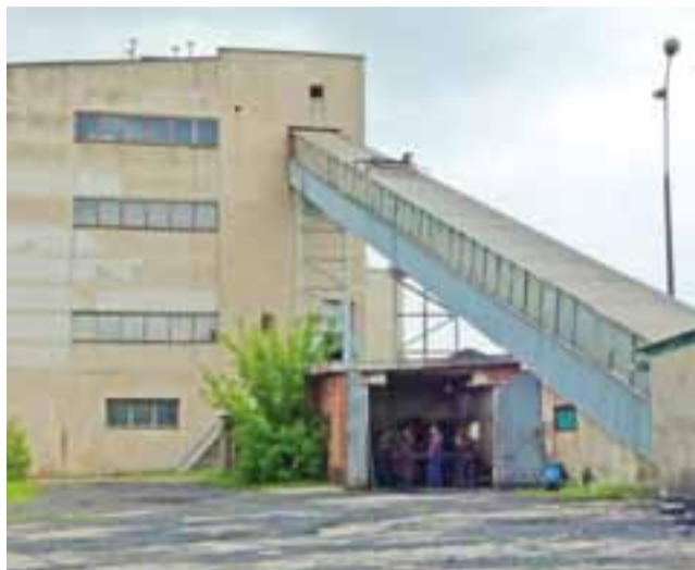
Taryfy za ciepło mogą być obniżone również z tego względu, że ZEC kupił taniej opał do największej w Łowiczu kotłowni mieszczącej się za Syntexem.

Obniżka taryf ZEC wiąże się przede wszystkim z cenami węgla i miału węglowego, jakie udało się uzyskać spółce w ostatnich przetargach. Są one w przypadku miału niższe nawet o około 100 zł za tonę w porównaniu z wcześniejszym przetargiem.