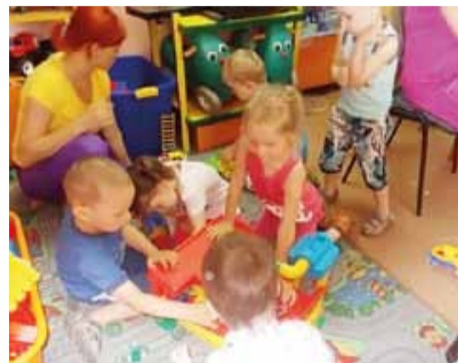
W poprzednim dniu adaptacyjnym uczestniczyło kilkanaście osób.

– Spotkanie organizowane w wakacje ma ułatwić dzieciom zaakceptowanie nowej sytuacji, w której się znajdują już na początku września. Będą czuły się pewniej, bo będą wiedziały, dokąd idą – dowiedzieliśmy się w przedszkolu. Poprzedni taki dzień otwarty przedszkola dla nowo przyjętych dzieci i rodziców odbył się 22 czerwca. Uczestniczyło w nim kilkanaście osób. mak