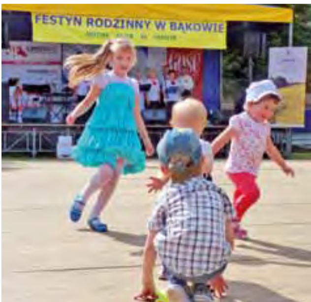
Dzieci bawiły się świetnie, także na deskach pod sceną.

li i tańczyli do tradycyjnych lokalnych melodii, a huk uderzeń ich obcasów o drewnianą scenę słycałoby wyraźnie wiele metrów dalej. Swoją program zaprezentował również seniorski Zespół Śpiewaczy Finezja z Kutna.