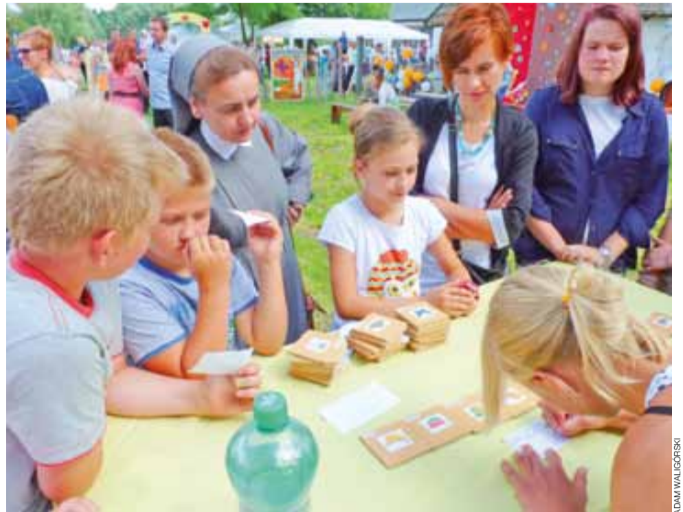
Gry pamięciowe gromadziły przy stoliku wielu chętnych.

Bąków Górny | Wysiętek wielu ludzi zaowocował kolejnym udanym festynem