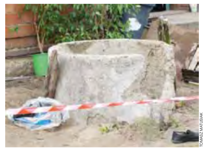
Nieużywana studnia, w której utonęła kobieta, była w fatalnym stanie i źle zabezpieczona.