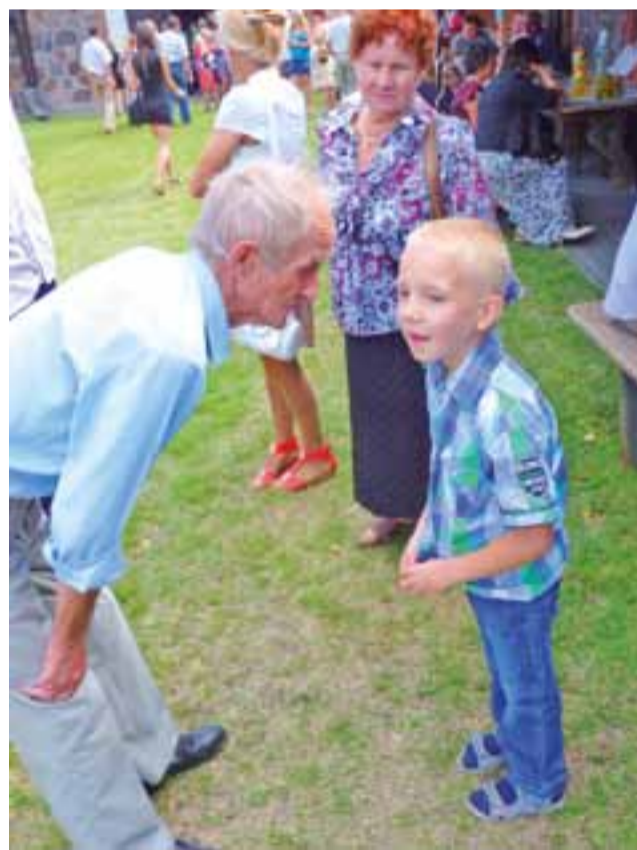
Festyn odbywał się pod hasłem „Rodzina razem od pokoleń” – i rzeczywiście miał rodzinny charakter.

W międzyczasie nieopodal sceny trwała sprzedaż tzw. „cegiełek św. Mikołaja”, jak nazwano losy pozwalające na udział w loterii fantowej. Pokażnych rozmiarów kolejka do stanowiska z cegiełkami nie zmniejszała się przez wiele godzin, a samych losów sprzedano ponad trzy tysiące. Na świętujących czekały trzy rodzaje mięs z grilla, 400 litrów grochówki, której smak doceniono na tyle, że zabrakło jej już około godziny 16, lody, napoje bezalkoholowe i ciasta. Szczególnie te ostatnie, przygotowane przez przedstawicielki każdej