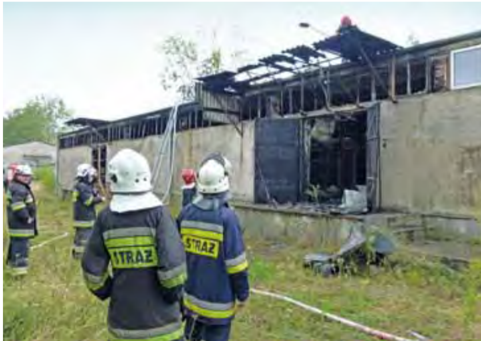
Do gaszenia pożaru zmobilizowano kilka jednostek straży z gminy Nieborów i z PSP Łowicz.

Właścicielem budynków i terenu, na którym wybuchł pożar, jest Gminna Spółdzielnia Samopomoc Chłopska w Nieborowie. Od kilku lat wydzierzawia ona najemcom ten teren wraz z budynkami. Magazyn, w którym wybuchł pożar, w tym roku był nieużytkowany, w poprzednich latach mieściła się tam zaś pieczarkarnia, którą prowadził łowiczanie. Właściciel zrezygnował jednak z prowadzenia tej działalności 1,5 roku temu, a wczoraj rozpoczął prace rozbiórkowe wewnątrz. Miał wywozić wyposażenie, które pozostało po nieistniejącej już pieczarkarni. Nie zdążył jednak, ponieważ to, co zostało, strawił pożar. – Zrobiło się zwarcie i ogień w ciągu kilku sekund objął pierwsze regały. Zdążyliśmy uciec, ale nie by-