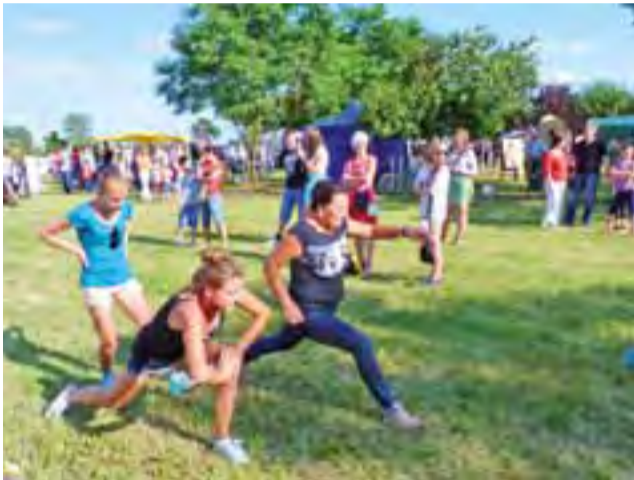
Przebieg wyznaczony dystans jak najmniejszą ilością kroków. Tylko pozornie łatwe.