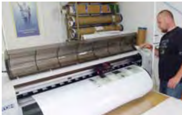
Drukarnia wykorzystuje nowoczesne maszyny, np. tę, która drukuje na papierze fotograficznym. Wydruk może mieć nawet kilka metrów długości.

też zbiór kompletów czcionek metalowych i drewnianych, monochromatyczne maszyny off-