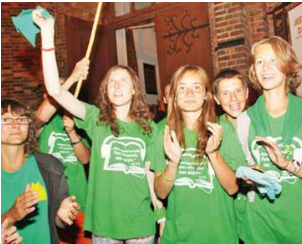
Pątniczki z grupy zielonej podczas wieczornego apelu.

Przy takiej pogodzie na brak pracy nie narzekały służby medyczne. Oprócz tradycyjnych już bąbli, z którymi przychodziły też inne dolegliwości. W czasie upałów, które towarzyszyły zwłaszcza przez pierwsze dni, pątnicy zmagali się z odparzeniami stóp i tzw. „asfaltówką” – wysypką, uczuleniem na kurz i składniki asfaltu. Na szczęście mało było zaslaniać z powodu wysokiej temperatury, choć trzeciego dnia pielgrzymowania jedna z pątniczek została zabrana do szpitala.