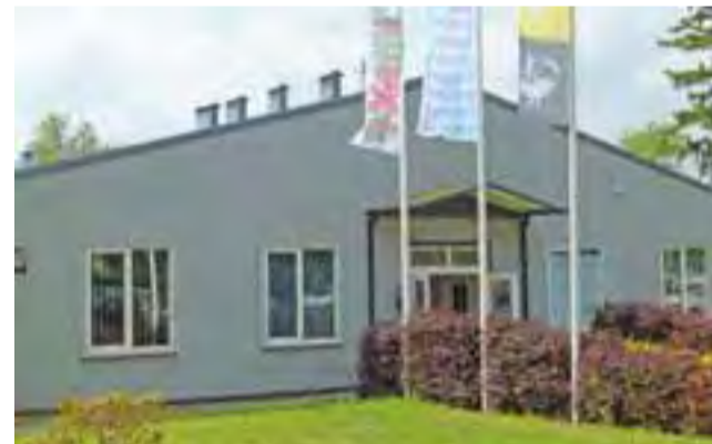
Właściwa, współczesna drukarnia mieści się teraz w części pomieszczeń po firmach odzieżowych Beetex i Kodan.