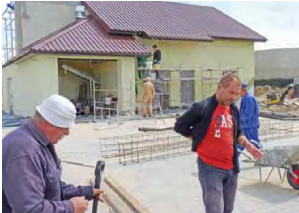
Prace przy budowie oczyszczalni trwały kilka miesięcy. Osoby, które przejeżdżają drogą w kierunku Bochenia, widzą już ich efekty.

Obecnie w oczyszczalni trwają ostatnie montaże urządzeń. Od jutra, 23 sierpnia, mają ruszyć wszelkie próby, które sprawdzą działanie oczyszczalni. Początkowo przepustowość oczyszczalni