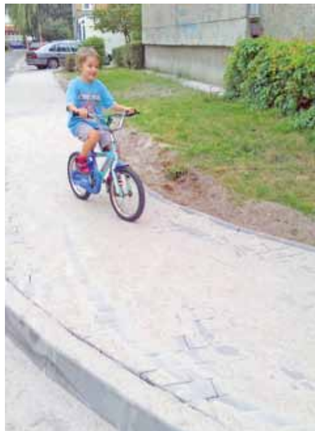
Można już korzystać z chodników w szczycie bloku 19 i 18. W najbliższych tygodniach wybudowany zostanie pieszy ciąg w stronę szkoły.