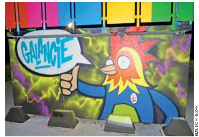
Odmalowany skatepark wreszcie może zapraszać swym wyglądem.

nie miał zatem racji twierdząc, że zakład w Piaskach nie spełnia wszystkich wymogów, jakie spełniać powinien. mst