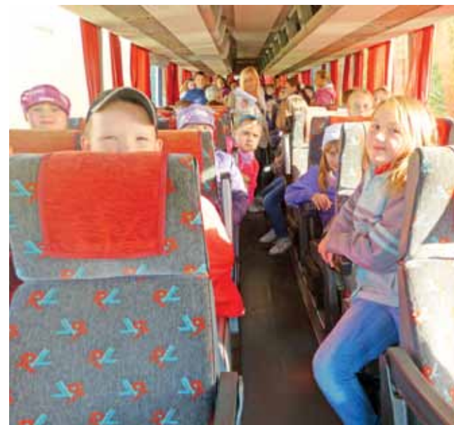
Uczniowie z Kocierzewa i z „Czwórki” w autokarze, przed wyjazdem do skansenu w Sromowie.

Szkoła Podstawowa w Kocierzewie Południowym zaprosiła uczniów Szkoły Podstawowej nr 4 w Łowiczu na wspólne biwakowanie. Dwudniowe spotkanie 4 i 5 października związane było z obchodami roku Juliana Tuwima, ale oprócz zapoznawania się z twórczością poety znalazł się też czas na zabawę oraz na zwiedzanie skansenu w Sromowie.