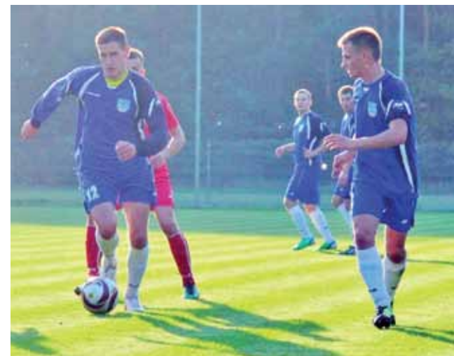
Po akcji tej dwójki padł wyrównujący gol dla Orła.