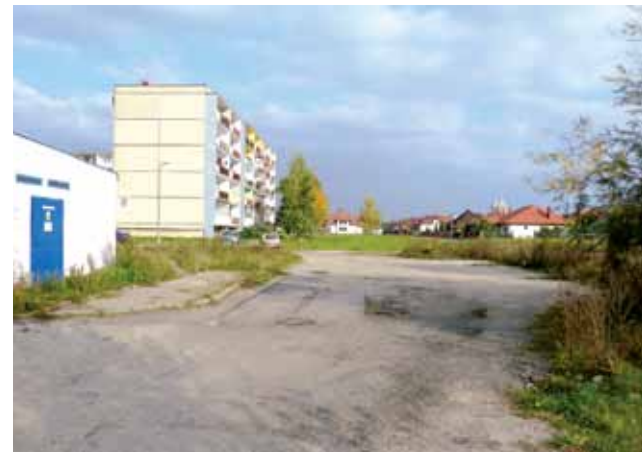
To jedno z miejsc, o którym dyskutowano na spotkaniu: skraj osiedla, po lewej blok nr 45, po prawej osiedle domków jednorodzinnych.

ale w odpowiedzi na pytanie powiedział, że spośród 92 km dróg miejskich gruntówką mają długość około 17 km.