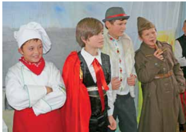
Włochy – kucharz, Hiszpania – toreador, Słowacja – Janosik, Czechy – Wojak Szwejk, a w ich rolach uczniowie SP 1.

Dzięki udziałowi naszej szkoły w programie Comenius to, co zobaczę tu w Polsce, przekażę moim uczniom. Polacy w Hiszpani uchodzą za ludzi bardzo chłodnych emocjonalnie, a ja już dziś wiem, że to nieprawda. Jesteście narodem otwartym, gościnnym, bardzo pozytywnie nastawionym do odwiedzających was turystów. To, co zauważyłam, zwłaszcza po wizycie w szkole i obejrzeniu przedstawienia, jakie dla nas przygotowano, to, że jesteście bardzo przywiązani do swojej kultury, tradycji i jesteście w tym bardzo naturalni – i to jest wspaniałe. Moi uczniowie są bardzo ciekawi tego, jak wygląda życie w miastach, w których są szkoły, z którymi realizujemy projekt. Gdy wracam do nich z kolejnego wyjazdu, na lekcjach pokazuję zdjęcia, filmy i muszą odpowiadać na mnóstwo pytań. Dzięki udziałowi w programie udaje nam się zbliżyć i lepiej poznać.