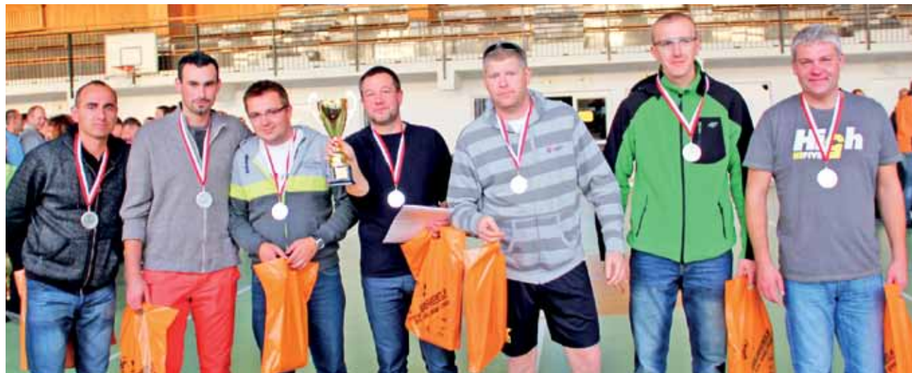
Nauczyciele z powiatu łowickiego znów pokazali się z dobrej strony na turnieju siatkówki