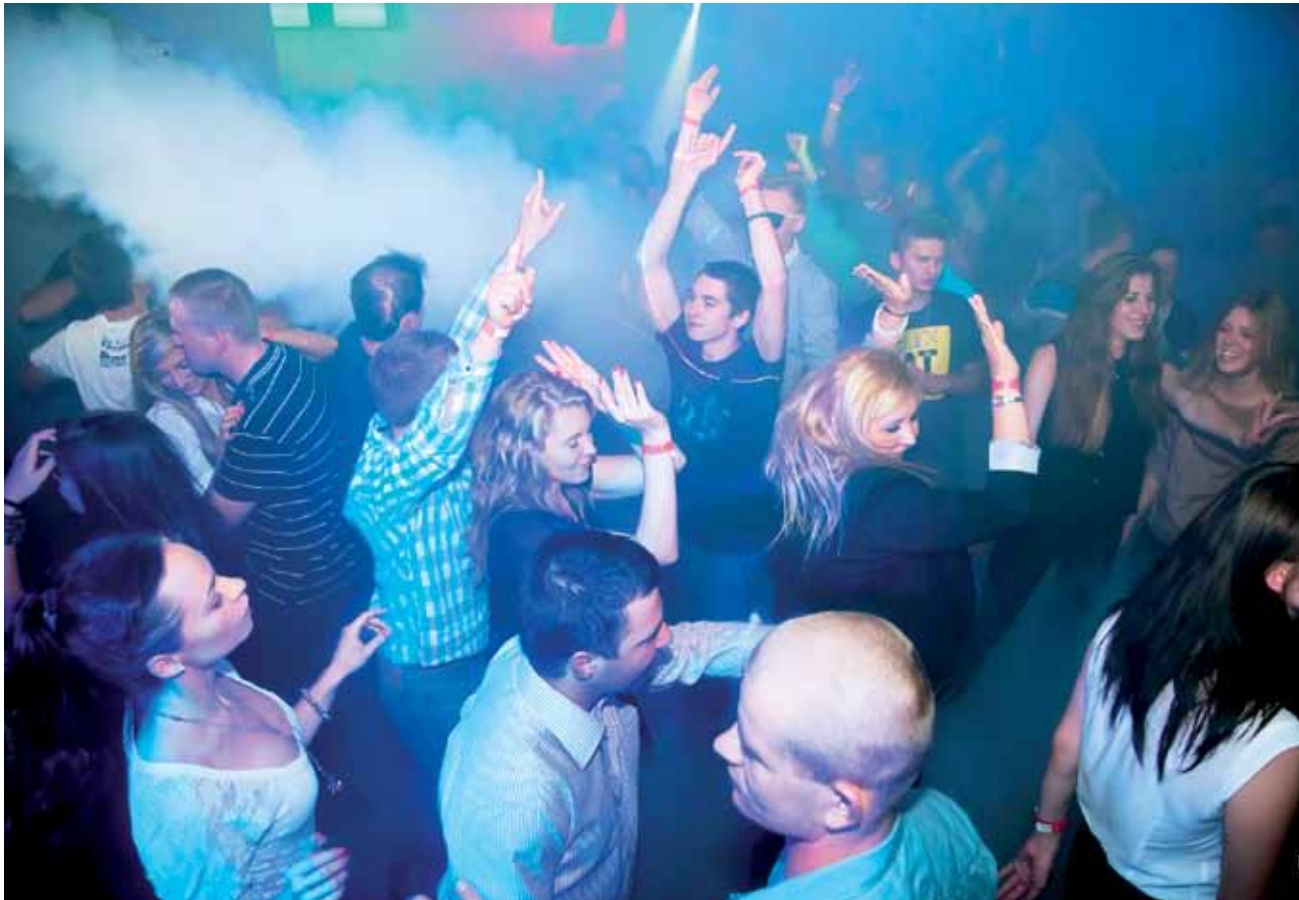
Impreza z okazji otwarcia klubu.

Łowicz | Otwarcie klubu w centrum miasta