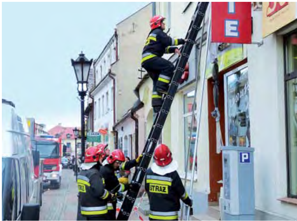
Strażacy z JRG Łowicz wchodzą do mieszkania przy Zduńskiej.