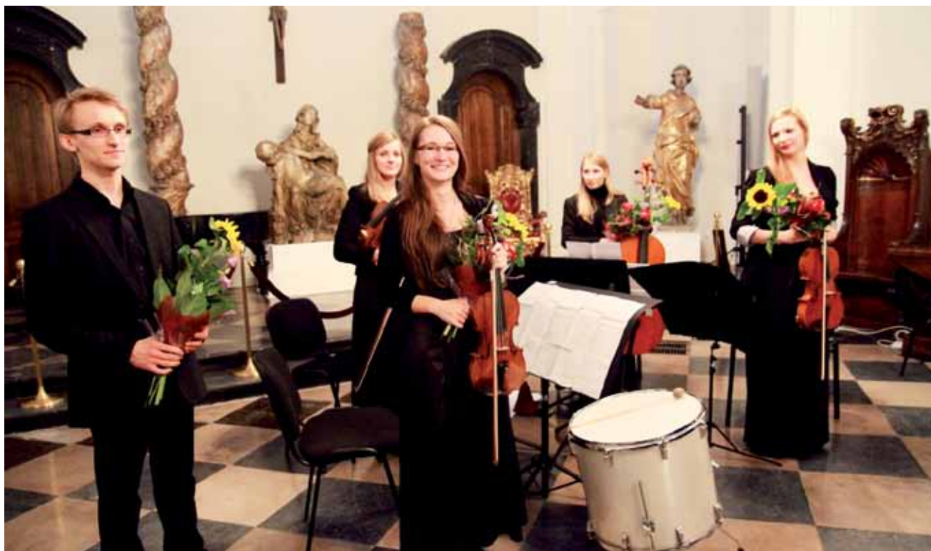
Na zakończenie koncertu Kwartetu Smyczkowego publiczność podziękowała muzykom owacją na stojąco.