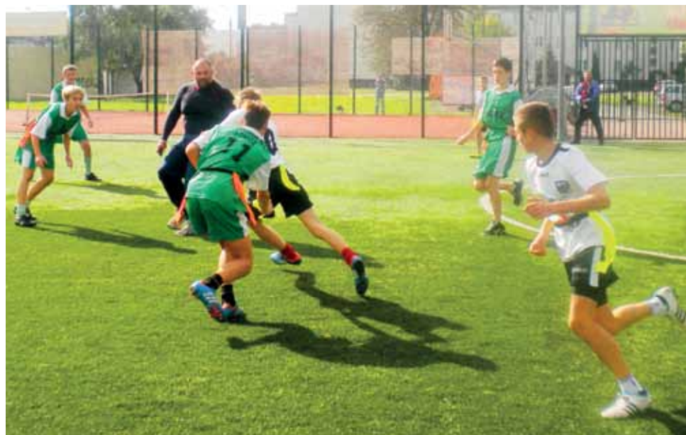
Celem rywalizacji są tagi (szarfy przytoczone do paska), a nie piłka. Punkty zdobywa się przez przytoczenie piłki w polu rywalizacji.

Drużyna Gimnazjum nr 4 awansowała do finału wojewódzkiego, który odbędzie się w Sieradzu 19 października.