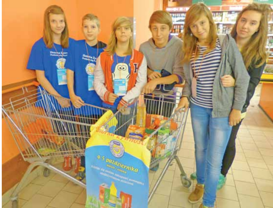
Wolontariusze akcji „Podziel się posiłkiem!” w POLOmarkecie przy Placu Koński Targ.