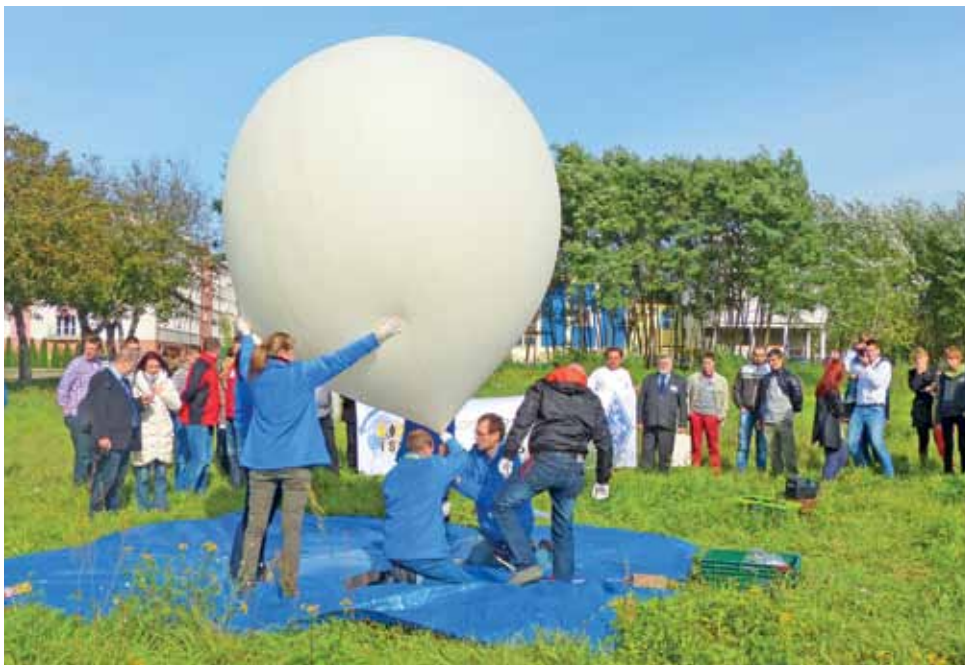
Start balonu stratosferycznego był jedną z atrakcji konferencji w „Zaciszu”.

Balony tego typu wznoszą się na wysokość od 20 do 40 km, unosząc się w stratosferze, czyli drugiej od dołu warstwie atmosfery ziemskiej (znajduje się w niej warstwa ozonowa, chroniąca przed promieniowaniem ultrafioletowym). Na co dzień balony tego typu wykorzystywane są głównie do badań meteorologicznych. Wypełniane są wodorem, w odróżnieniu od