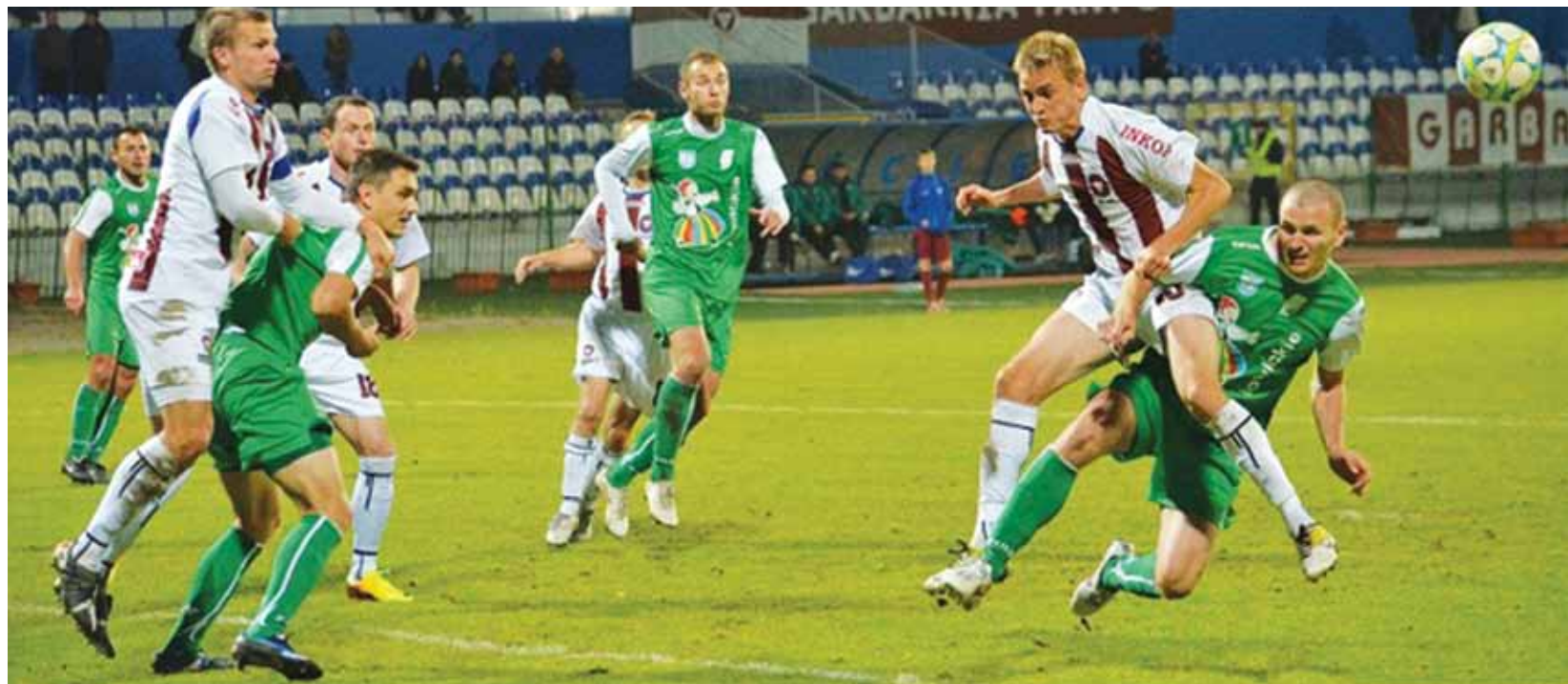
W pierwszej połowie meczu zespoły walczyły jak równy z równym, ale po zmianie stron to biało-zieloni zdominowali boiskowe wydarzenia.