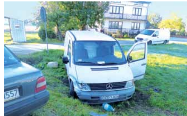
Skutki wyprzedzania na skrzyżowaniu przy złych warunkach – Mercedes w rowie, kierowca zabrany przez pogotowie i ukarany mandatem.

– Najważniejsze, że tu stoimy i nawet się śmiejemy, a nie leżymy połamani – mówił kierowca Nissana, a wtórowali mu dwaj jadący z nim koledzy. – Pewnie, że blachy szkoda, ale to jest coś, co można wymienić. A zdrowie? Tego nie kupisz za żadne pieniądze! Niespełna kwadrans po zdarzeniu w Czatolinie, o 7.58, do jeszcze groźniej wyglądającej sytuacji doszło w Jamnie, na skrzyżowaniu dro-