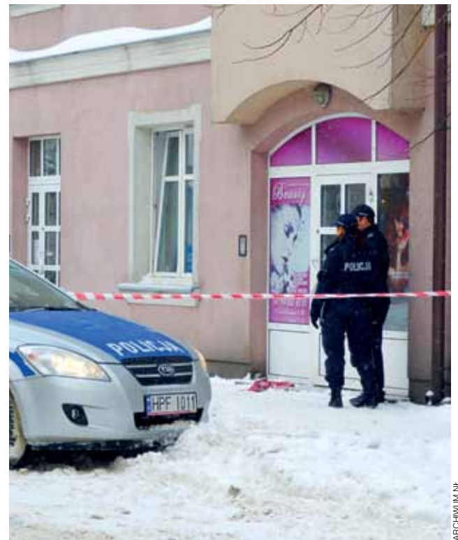
Tak wyglądało miejsce zbrodni kilkadziesiąt minut po jej popełnieniu.