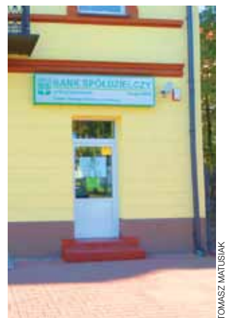
Celem napadu była ta placówka przy ul. 1 Maja.

gi krajowej nr 14 z drogą wojewódzką 703. Jeden z kierowców zahamował po wbiegnięciu na jezdnię psa. Stańko za nim kilka samochodów, ale trzeci z kolei – Opel Astra, został od tyłu uderzony przez nadjeżdżającego Nissana Micrę. Nissan w wyniku uderzenia dachował i wypadł poza pas jezdni, natomiast Opel znalazł się częściowo na jezdni, częściowo na poboczu. Jego kierowca i świadkowie zdarzenia pomogli wydostać się z Nissana prowadzącej go kobiecie. Okazało się, że nie doznała ona poważnych obrażeń. W tym przypadku również wszyscy byli trzeźwi. Strażacy z JRG Łowicz zjawili się na miejscu zdarzenia niemal natychmiast, ponieważ... jechali właśnie z interwencją do Czatolina. Zostali jednak na miejscu, aby je zabezpieczyć i udzielić pierwszej pomocy oraz wsparcia psychicznego. Decyzję o pozostaniu podjął dowódca akcji, skontaktowawszy się wcześniej z zastępem OSP Łyszkowice, będącym już w Czatolinie. Dowódca zastępu ocenił, że siły zgromadzone na miejscu są wystarczające. Kierowca Opla miał podobne refleksje, jak ten prowadzący Nissana w Czatolinie. – Jędzę już samochodem na tyle długo, by wiedzieć, że takich sytuacji się niestety nie uniknie – mówił. – Dopóki tłuką się tylko blachy, to nie jest jeszcze najgorzej... tm