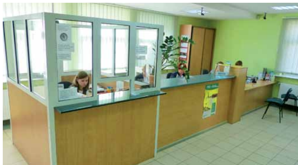
Pomieszczenie obsługi klienta po generalnym remoncie.

W tej sprawie rozmawiał już z wójtem gminy Łowicz. Miejscowość ta zaczyna się coraz bardziej rozrastać. W ostatnim czasie wzdłuż drogi powiatowej prowadzącej do Błędowa wybudowano kilkanaście nowych domów. Nowa sieć miałaby ok. 1 kilometra długości, a koszt jej budowy wraz z przepompownią ścieków może zamknąć się w kwocie ok. 400 tys. zł. Budowa planowana jest na rok 2014. tb