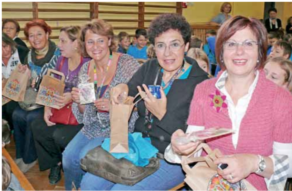
Goszczący w „Jedynce” nauczyciele zostali obdarowani na zakończenie przedstawienia regionalnymi upominkami.

Nauczyciele po powrocie do własnych szkół pracują z uczniami nad przygotowaniem przewodnika po swoim