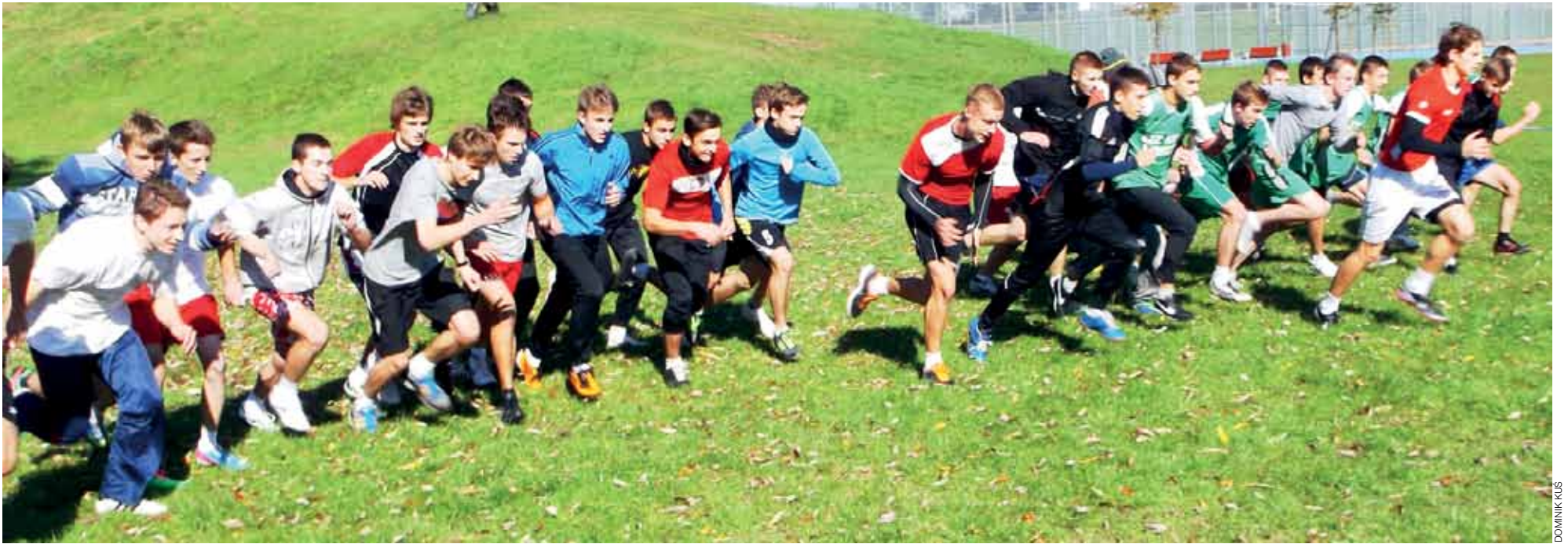
W biegach przełajowych na łowickich Błoniach rywalizowało blisko 200 uczniów w sześciu kategoriach

Lekka atletyka | Powiatowe Indywidualne Mistrzostwa w Biegach Przełajowych