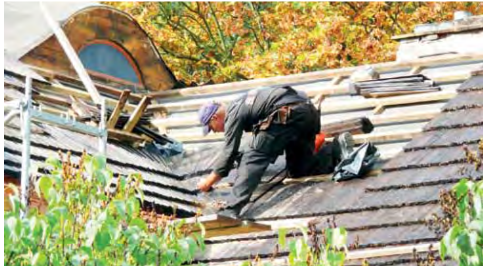
Gonty na budynkach w parku nieborowskim układane są przez górali spod Zakopanego, zatrudnionych przez głównego wykonawcę robót.

Nowe dachy zostaną założone na Starej Oranżerii oraz północnym i południowym Domku Oficjalistów w Nieborowie, na w Domku Murgrabiego w Arkadii. Na tym ostatnim zostanie