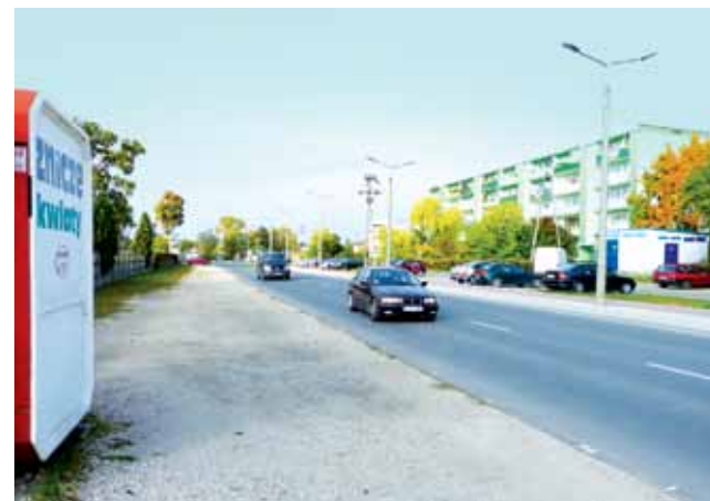
Mieszkańcy Bratkowic zwrócili uwagę, że wzdłuż cmentarza nie ma ani jednego przejścia dla pieszych. Pasy są dopiero przy ul. Topolowej.

Nie obiecał nic w sprawie ulic gruntowych na Bratkowicach,