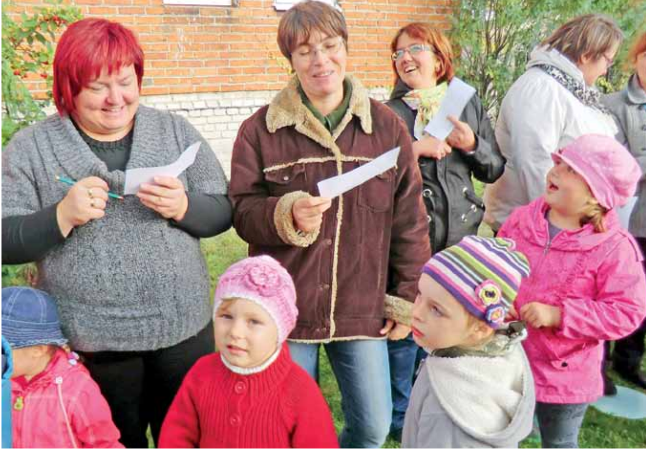
Wspólna zabawa przy ognisku na zapleczu bolimowskiego przedszkola przyniosła wiele radości zarówno dzieciom, jak i rodzicom.

Bolimów | Przedszkole bawiło się przy ognisku