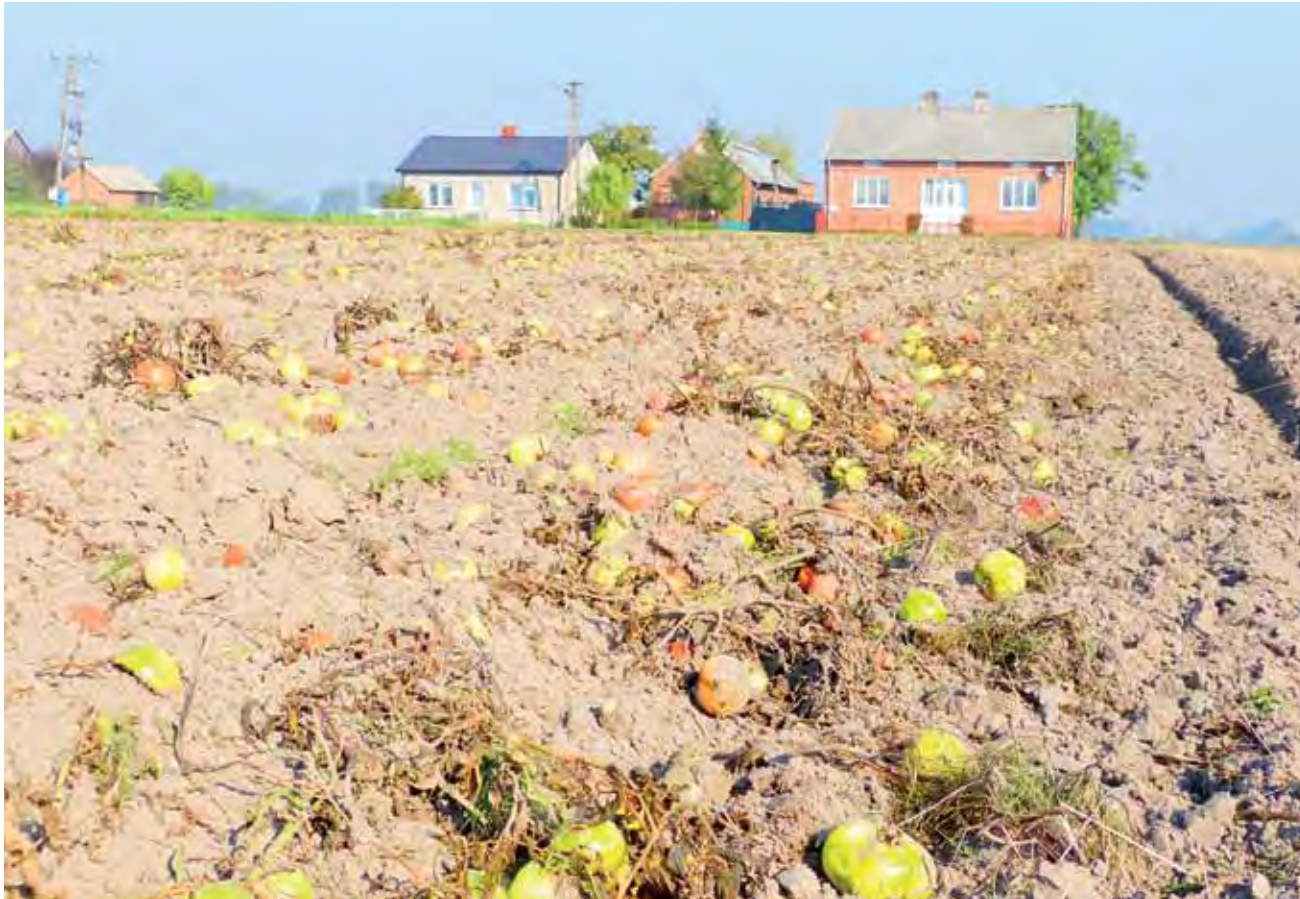
To pole pomidorów sfotografowaliśmy wczoraj przed południem w Zduńcu Wsi. Właściciel plantacji już je stalerzował, ale nadal widać na częściowo dojrzałe oraz zielone pomidory. Wczoraj po południu pole miało być zaorane.

Zarobić na pomidorach mogli jedynie ci, którzy sprzedawali je na giełdach owocowo-warzyw-