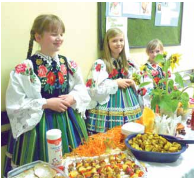
Piękne łowiczanki przy uroczym i suto zastawionym stole - pysznie i pięknie.

Obok placków ziemniaczanych i frytek pojawiły się zapiekanki i tarty ziemniaczane, krokiety, knedle i kopytka.