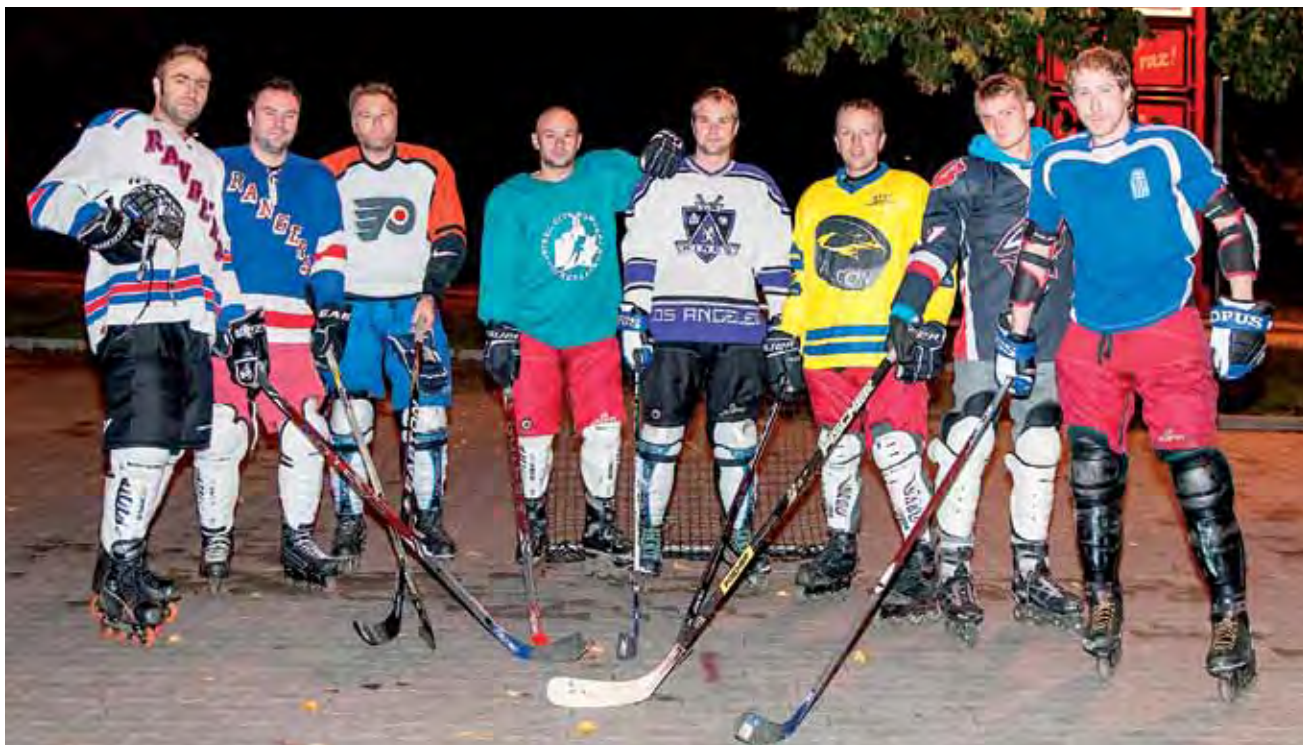
Zespół Roosters, grający w hokeja na parkingu przy Kauflandzie, prawie w pełnym składzie.

Łowicz | Hokeiści na rolkach nie mają gdzie grać