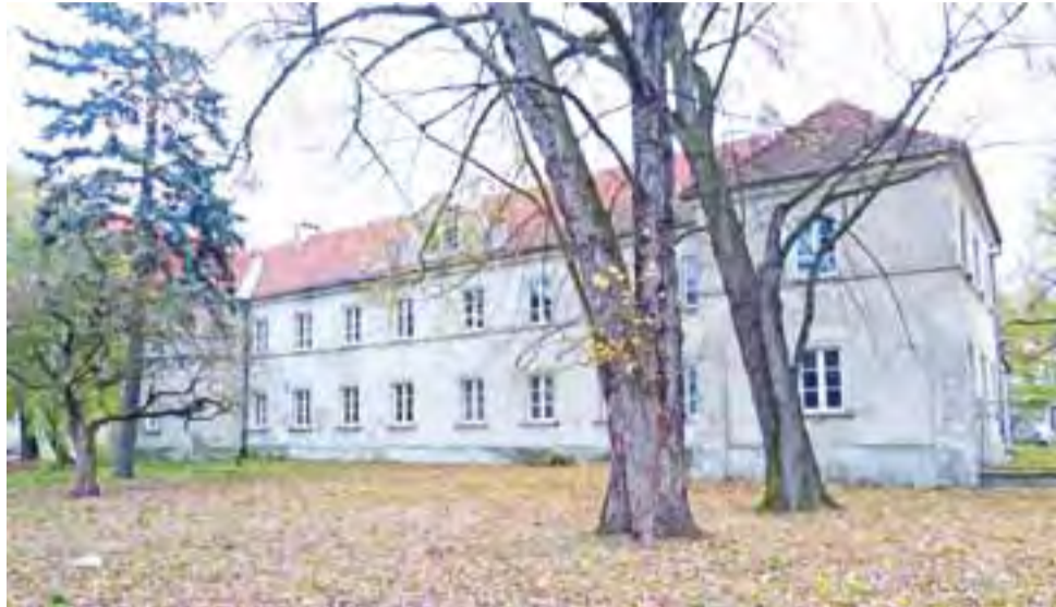
Gdyby starostwu udało się sprzedać tę nieruchomość przy ul. Stanisławskiego, to w budżecie powiatu byłby to widoczny dochód.

Druga nieruchomość to dawna baza Powiatowego Zarządu Dróg i Transportu w Krepie, która 12 grudnia zostanie po raz piąty wystawiona na sprzedaż. Tym razem cena wywoławcza za 1,6