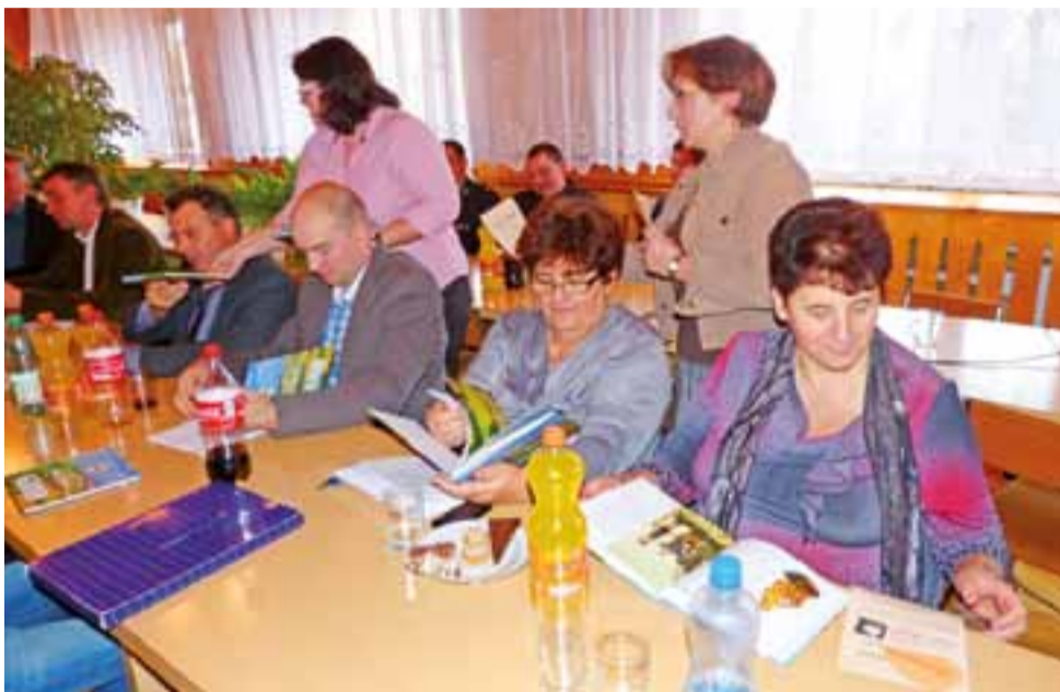
Radni gminy Zduny oglądali z zainteresowaniem publikację o swojej gminie.

W dalszej części znajdują się: opis geograficzny gminy, historia jej terenów od średniowiecza, historia szkolnictwa, tradycje ludowe, sylwetki znanych twórców ludowych pochodzących z gminy Zduny, działania w zakresie kultury wraz z historią Domu Ludowego, informacją o skansenie w Maurzycach i trzech parafiach: w Zdunach, Złakowie Kościelnym i Bąkowie Górnym, o cmentarzach i innych