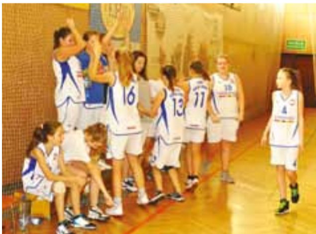
Młodziczki Księżaka przegrały w Łowiczu z UKS Teofilów.

Po czterech kolejkach łowiczanki zajmują w grupie B ligi wojewódzkiej 4. lokatę. W grupie A liderem po trzech kolejkach jest zespół Widzewa Łódź, który wyprzedza TK Alles Głowno i UKS Orlik Ujazd. zł