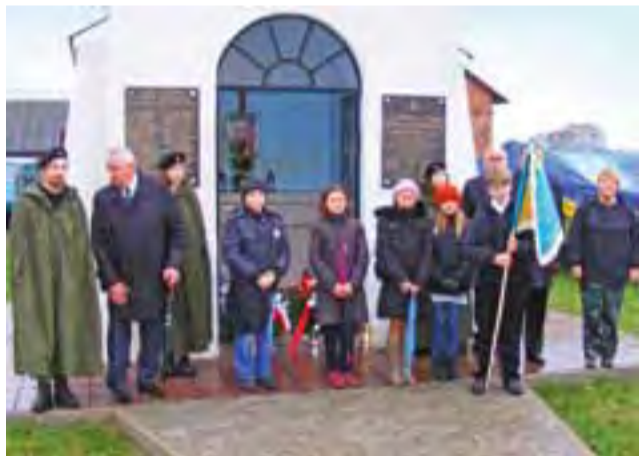
Pod kapliczką w Julianowie uroczystość Święta Niepodległości zgromadziła przedstawicieli różnych środowisk.