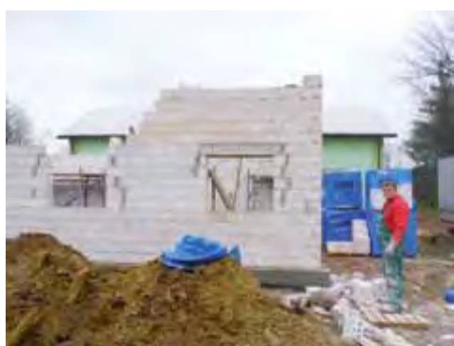
Prace przy rozbudowie świetlicy w Strzemieszowie postępują w dobrym tempie.

Pieniądże, które ratusz miał wydać z budżetu jako wkład własny, pozostaną więc w nim, jest to 2,4 mln zł. Pieniądże te – jak powiedział nam burmistrz – zostaną przeznaczone na modernizację dróg miejskich w 2014 roku. Nie chciał powiedzieć jednak, jakich konkretnie. – Myślę, że dużo robiliśmy w centrum Łowicza i czas się zająć przedmieściami – stwierdził. ■