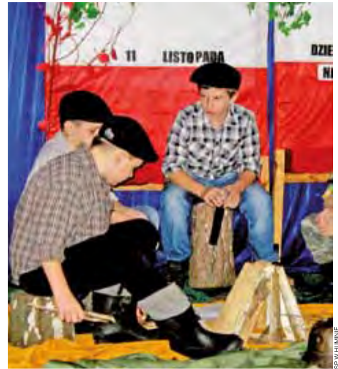
Uczniowie Szkoły Podstawowej w Huminie 8 listopada obejrżeli przedstawienie z okazji 95-rocznicy odzyskania przez Polskę niepodległości. Wystąpili ich koledzy z klas IV, V i VI. Przedstawili oni losy Polski od I rozbioru Polski aż po dzień 11 listopada 1918. Na koniec wszyscy wspólnie odśpiewali hymn. tb