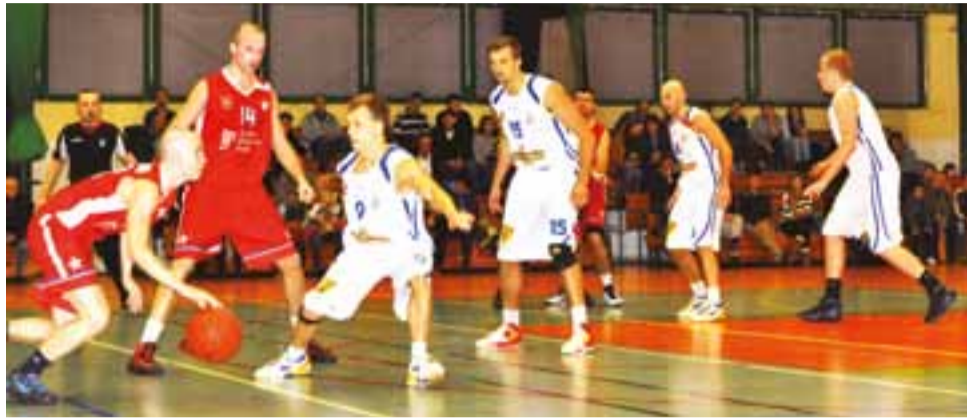
Łowiczanie przebudzili się dopiero po przerwie w meczu z Wisłą Kraków.