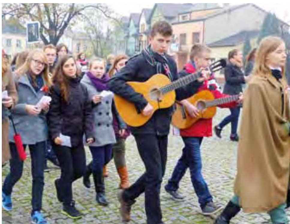
Na wiele sposobów świętowano w poniedziałek i dniach poprzedzających w Łowiczu i okolicach Narodowe Święto Niepodległości. Przegląd niektórych wydarzeń przedstawiamy na str. 21. Na zdjęciu młodzież z pijarskiego LO w marszu przez miasto.