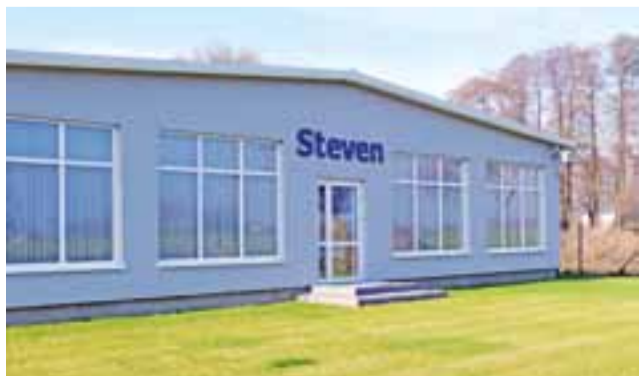
Zakład firmy Steven widziany z zewnątrz.

Właściciel chwali współpracę z władzami gm. Łowicz. Dobrze czuje się też wśród społeczności Jamna. W rozmowie z nami przyznał, że wybranie tej lokalizacji na biznes było „strzałem w dziesiątkę”. ■