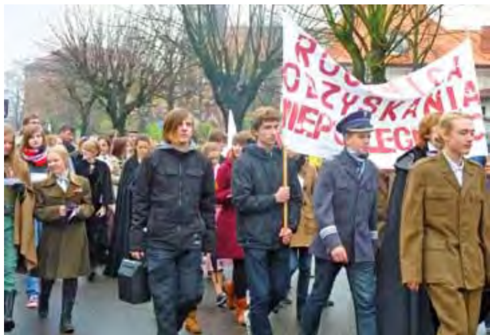
Specjalnie na marsz patriotyczny uczniowie szkoły pijarskiej starają się ubierać w stroje z dawnych epok.