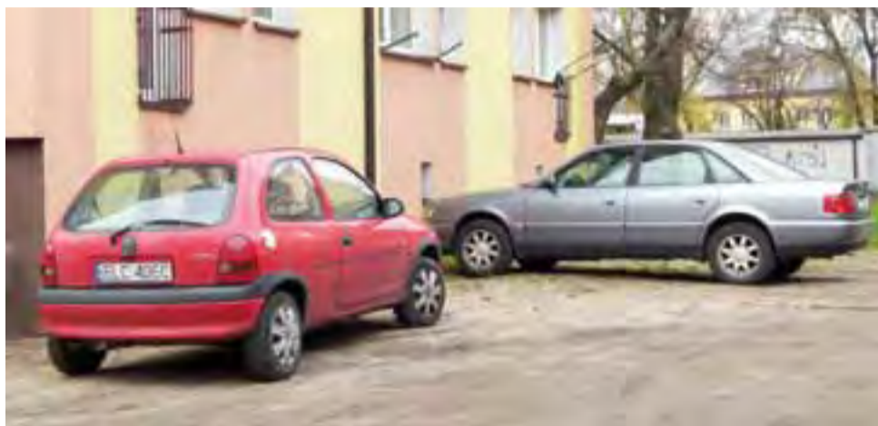
Parkujące bezpośrednio przed blokami samochody mieszkańcom nie przeszkadzają, ale parking i tak formalnie powstać w tym miejscu nie może.

– Jest tam zbyt mało miejsca na parking z prawdziwego zdarzenia. Teren jest zbyt blisko okien w blokach i nikt nie podejmie