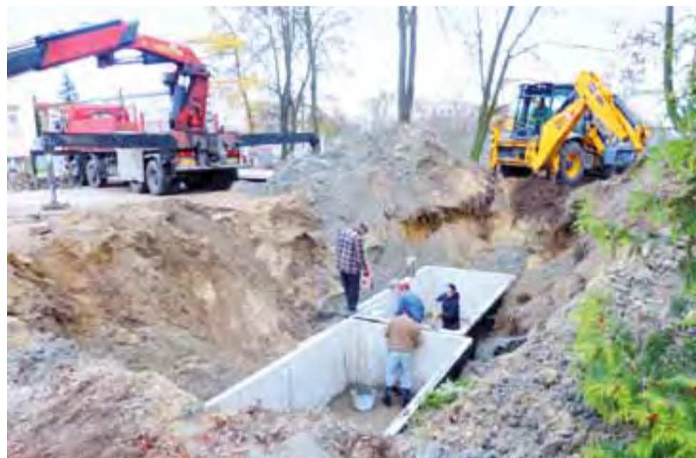
Tak wygląda wykop przy budynku szpitala, w którym montowane są zbiorniki retencyjne.

Trudno powiedzieć, jak długo dane złoże filtrujące wodę jest w stanie spełniać właściwie swoją funkcję, jest to uzależnione od wielu czynników. Średnio wymienia się je co kilkanaście lat. mst