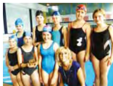
Uczennice SP 1 Łowicz okazały się najlepsze w sztafetach pływackich.