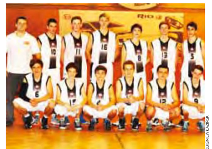
Juniorzy UMKS Księżak odnieśli czwarte zwycięstwo w tym sezonie.

Kolejny mecz łowiczanie zagrają w sobotę 16 listopada w Łodzi ze miejscowym Star-