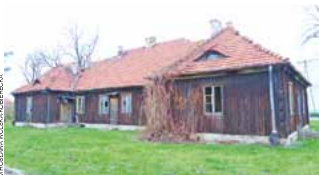
Alkierzówka popada z ruinę z miesiąca na miesiąc. Uratowanie tego zabytku będzie jednek "stono" kosztować.