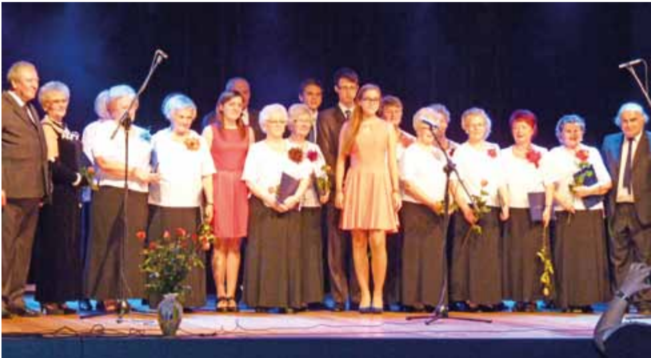
Koncert Chóru Klubu Seniora "Radość" i gości na wyremontowanej scenie w sali kina Feniks wypadł znakomicie.