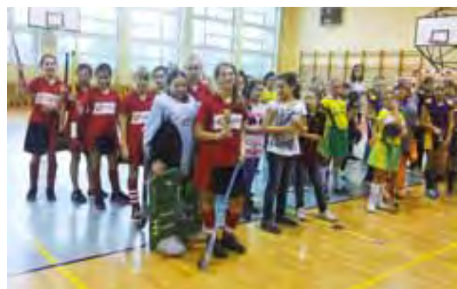
Reprezentantki gminy Nieborów wyjechały z Gliwic z pucharem.