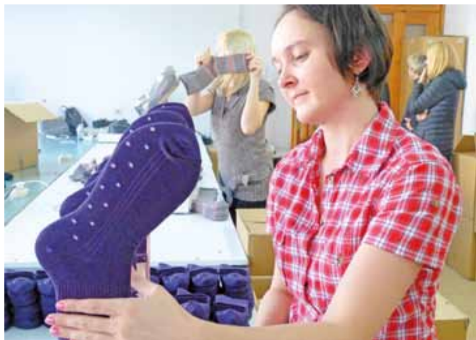
Nawet nowoczesne maszyny nie zastąpią we wszystkim ludzkich rąk.

Gospodarka | Dwie firmy z okolic Łowicza: Steven i SOX, zaprezentowano w telewizji Polsat