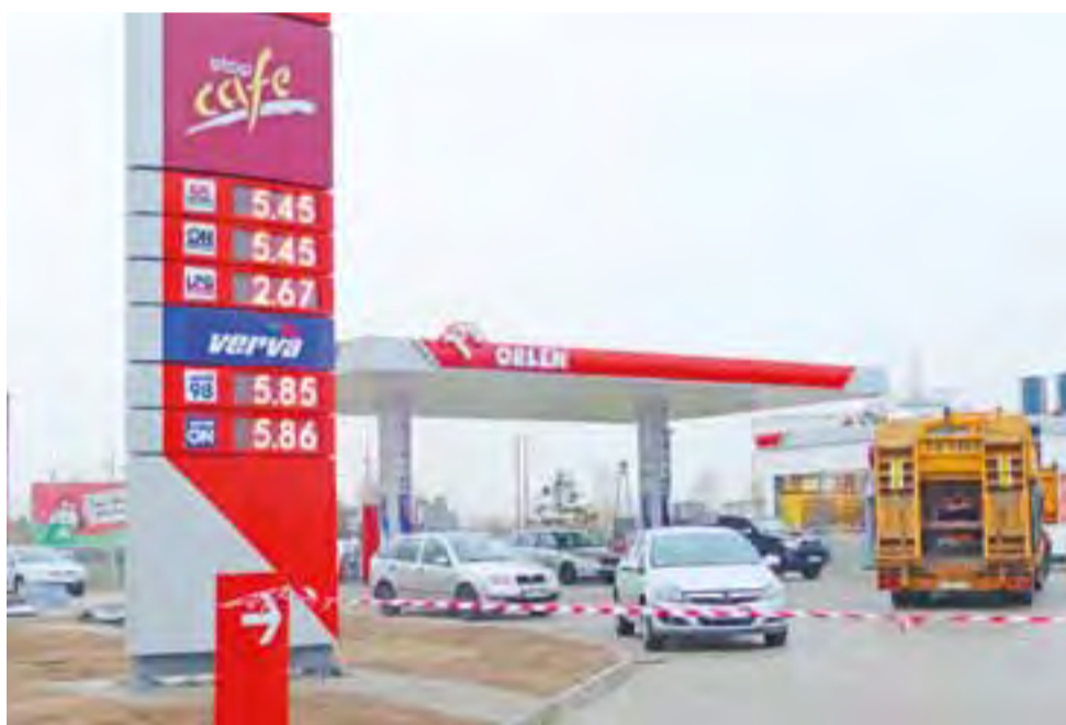
Nową stację już widać i wiadomo, ile będzie kosztować paliwo, ale nie wiadomo, od kiedy można będzie je zatankować.

Lada dzień zostanie oddana do użytku nowa stacja paliw Orlen przy ul. Prymasowskiej. Wczoraj, 13 listopada, w południe, podświetlana reklama z cenami paliw już działała, ale wjazd na stację zagradzała jeszcze białoczerwona taśma, zaś na samej stacji pracowało jeszcze kilka ekip technicznych. - Przymierzaliśmy się do otwarcia dzisiaj, ale na pewno się to nie uda. Czy jutro będzie już działać? - tego też na razie nie wiemy - tyle dowiedzieliśmy się na stacji. Do połowy lipca br. w tym miejscu działała stacja Bliska, tego samego Polskiego Koncernu Naftowego Orlen. Jej zabudowa została rozebrana, urządzenie i wyposażenie zdemontowane. Budynek stacji, dyspozytory wraz z wiatą, a także zbiorniki na paliwo - wszystko jest nowe. Obecna stacja jest w standardzie Premium, adresowanej do bardziej zamożnych klientów. mwk