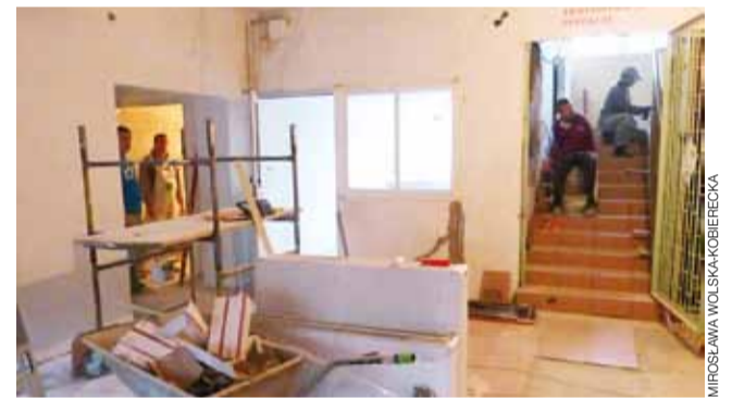
Prace w budynku administracyjnym spowodowały konieczność czasowego przeniesienia poradni chirurgicznej i ortopedycznej.

W pomieszczeniach obu poradni specjalistycznych wymieniona zostanie instalacja elektryczna, położone zostaną nowe tynki na ścianach, a na podłodze posadzki. Nowe płytki zostaną też położone na schodach we-