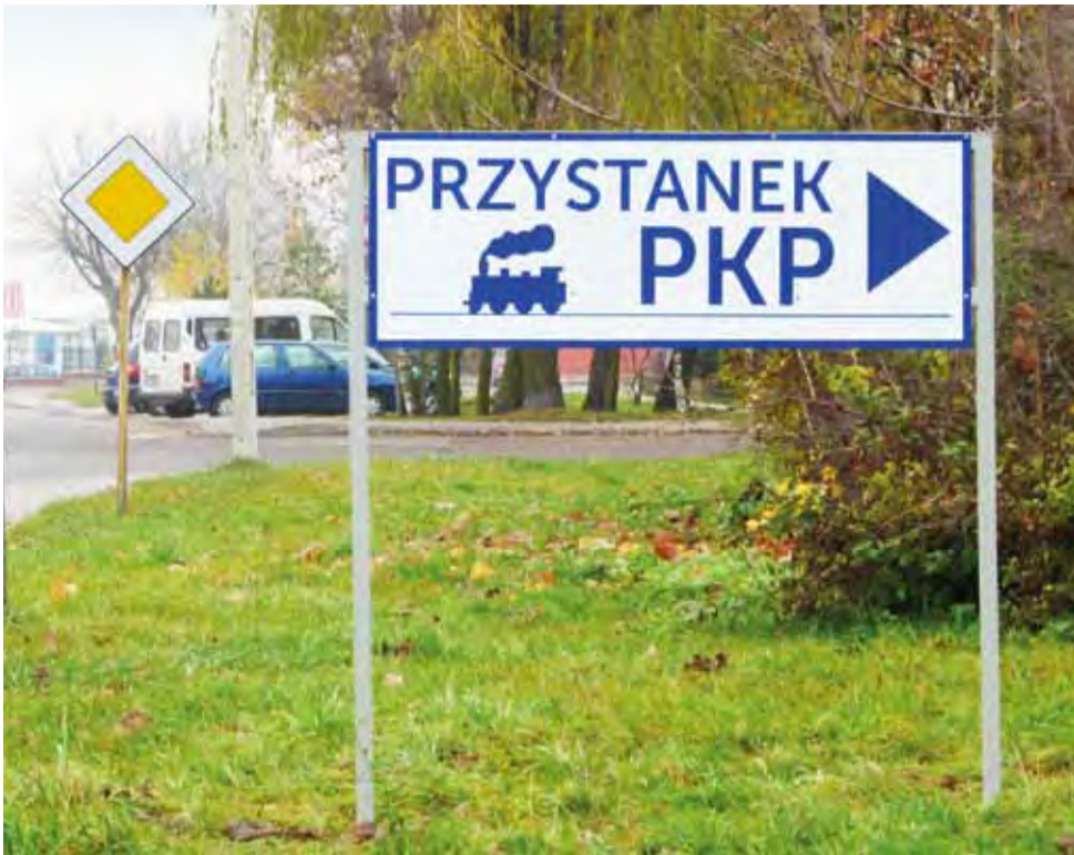
Tablicę wskazującą, gdzie jest przystanek PKP, widać z daleka.

Łowicz Przedmieście | W czyjej gestii było oznakowanie