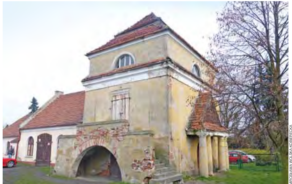
Spichlerz ma urokliwą architekturę, ale do przywrócenia mu blasku potrzebnych będzie kilkaset tys. złotych.

W spichlerzu miały powstać z pomocą dotacji: pracownia agroturystyki i kultury ludowej dla młodzieży i twórców