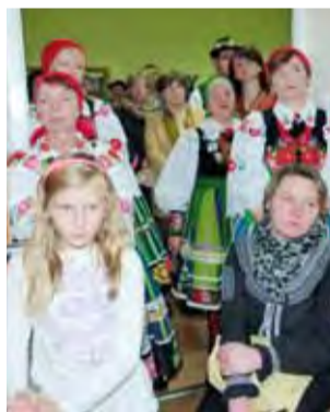
Tegoroczny Dzień Seniora zgromadził tak dużo osób, że niektórzy stali w przejściu i w korytarzu.