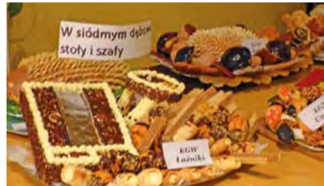
Wierszyki Tuwima mogą być inspiracją także w kuchni. Udowodniły to panie z Kół Gospodyń Wiejskich przygotowujące "Słodką lokomotywę".