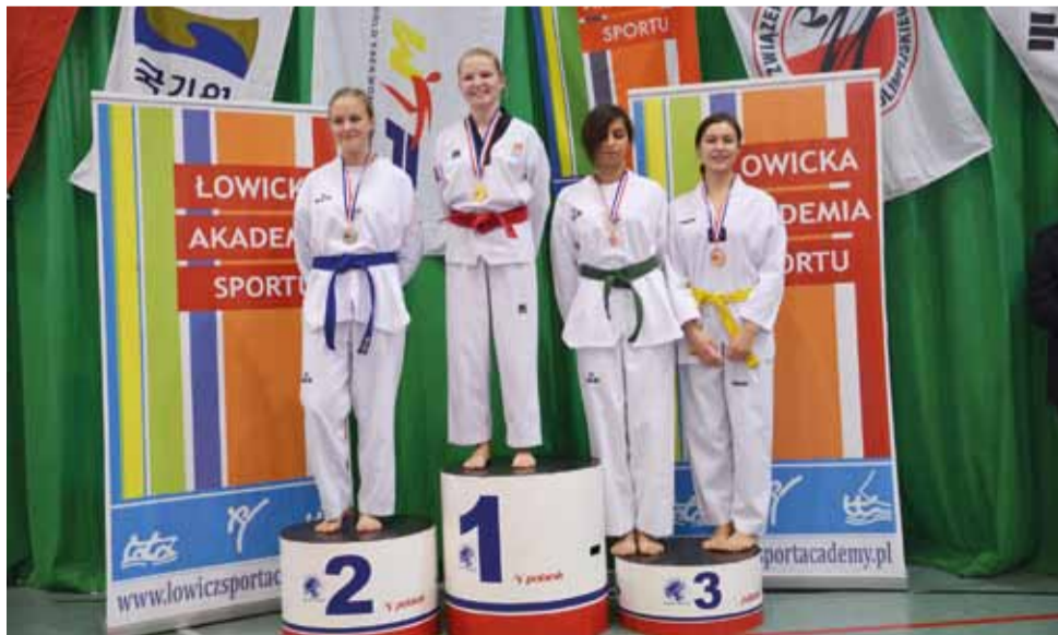
Podium w rywalizacji dziewcząt 9-11 lat w tradycyjnym poomsae.