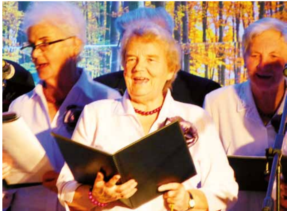
Zespół wokalny "Wrzos" w czasie występu.