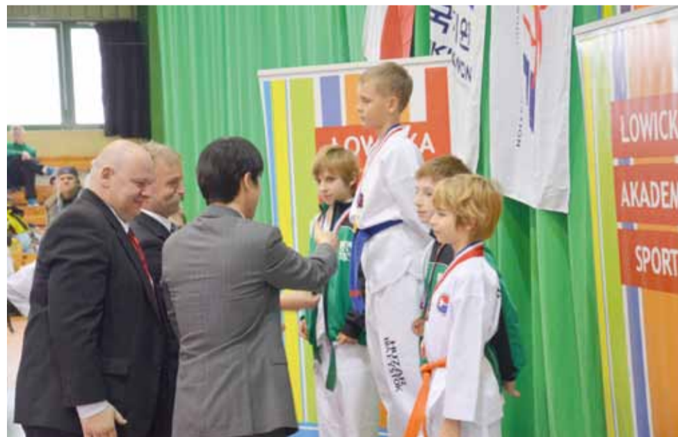
Dekoracja zwycięzców w jednej z młodszych kategorii wiekowych.

Ciekawostką był też pokaz taekwondo w... stroju łowickim. W każdej z trzech konkurencji przeprowadzono zawody w siedmiu kategoriach, z podziałem na wiek i płeć. W rywalizacji klubowej Łowicka Akademia Sportu zajęła pierwsze miejsce, wyprzedzając na podium warszawski Taekwondo Cheolin i AZS Poznań.