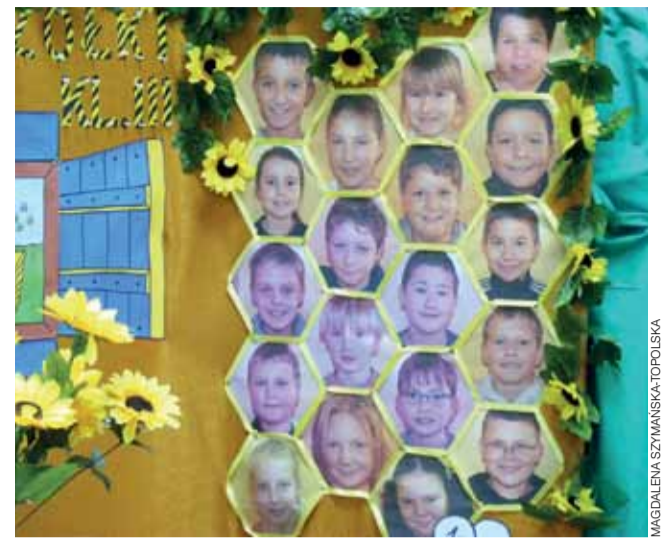
Plaster miodu z twarzami dzieci, wykonany przez przedstawicieli klasy III, był jedną z wielu pomysłowych dekoracji spotkania "Pracowici jak pszczółki".

Średnia cena sprzedaży drewna potrzebna do obliczania podatku leśnego została ustalona w wysokości 171,05 zł/m 3 drewna – jest to maksymalna stawka dopuszczalna przez ministerstwo. Oznacza to, że podatek leśny będzie wynosił 37,63 zł za hektar lasu. Około połowa lasów na terenie gminy ma status tzw. lasów ochronnych i z mocy prawa podatek ten jest zmniejszany o połowę. mak