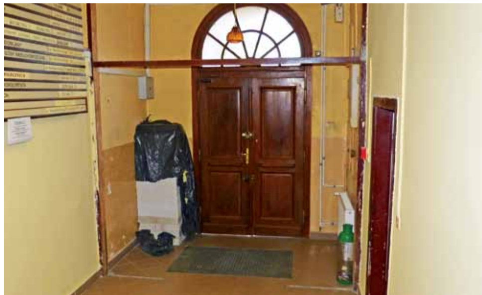
Przy głównym wejściu do budynku zamontowane zostaną nowe drzwi tzw. wiatrołapu.

W wyniku przetargu Spółdzielnia Rzemieślnicza „Budowlana” zaproponowała prawie