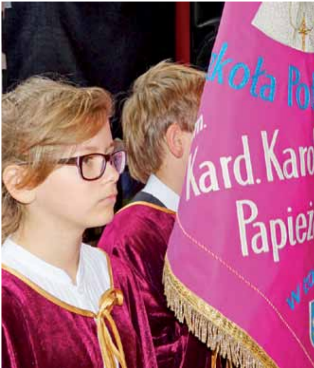
Od 1999 roku szkoła nosi imię Kard. Karola Wojtyły – Papieża Polaka.