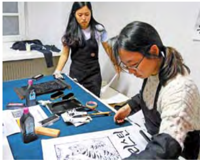
Warsztaty z koreańskiej kaligrafii cieszyły się sporym zainteresowaniem zarówno dzieci, jak i dorosłych.

50-minutowy występ zespołu „Ty i ja”, złożonego z czterech młodych artystek grających na starzych, tradycyjnych koreańskich instrumentach, jeden z ostatnich podczas ich tournée po Polsce – dzień później grupa powróciła do Korei. W koncercie „Ty i Ja” nie zabrakło jednak łączenia kultur – Koreanki najpierw zrobiły niespodziankę, grając melodię „Sza dziewczeczka do laseczka”, po czym zaskoczyły jeszcze bardziej