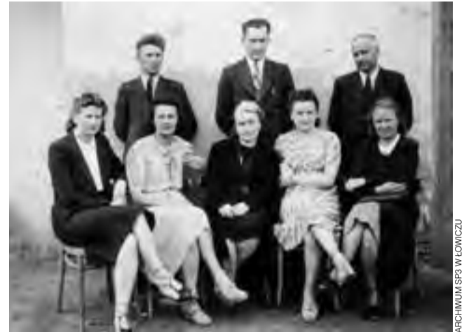
Zespół nauczycieli tajnego nauczania, rok 1943-44.