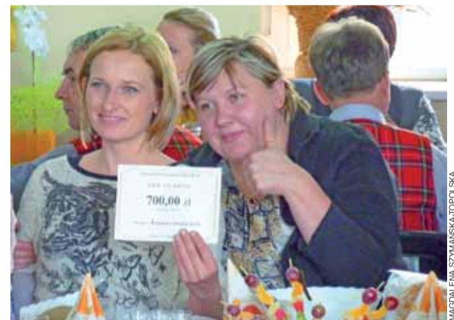
Panie z KGW Łażniki na wieść o wygranej zareagowały wybuchem radości.

Następnie zagrał i zaśpiewał zespół Krośniewiaczy, grający –