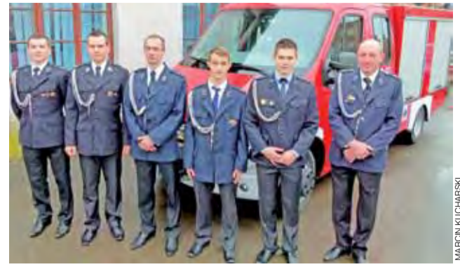
Strażacy z Wiskienicy Dolnej są dumni z nowego samochodu, który zastąpi w tej jednostce wysłużonego Żuka.

Ponieważ na obsługę każdego z tych kredytów, na powiększenie których Rada Gminy uchwaliła akty prawne na ostatniej sesji, potrzebna jest kwota niższa niż 14 tys. euro, gmina nie musi organizować przetargu na wybór najkorzystniejszej oferty, ale wybrała ją po zapoznaniu się z odpowiedzią banków na zapytanie, które wysłała do nich w tej sprawie. ■