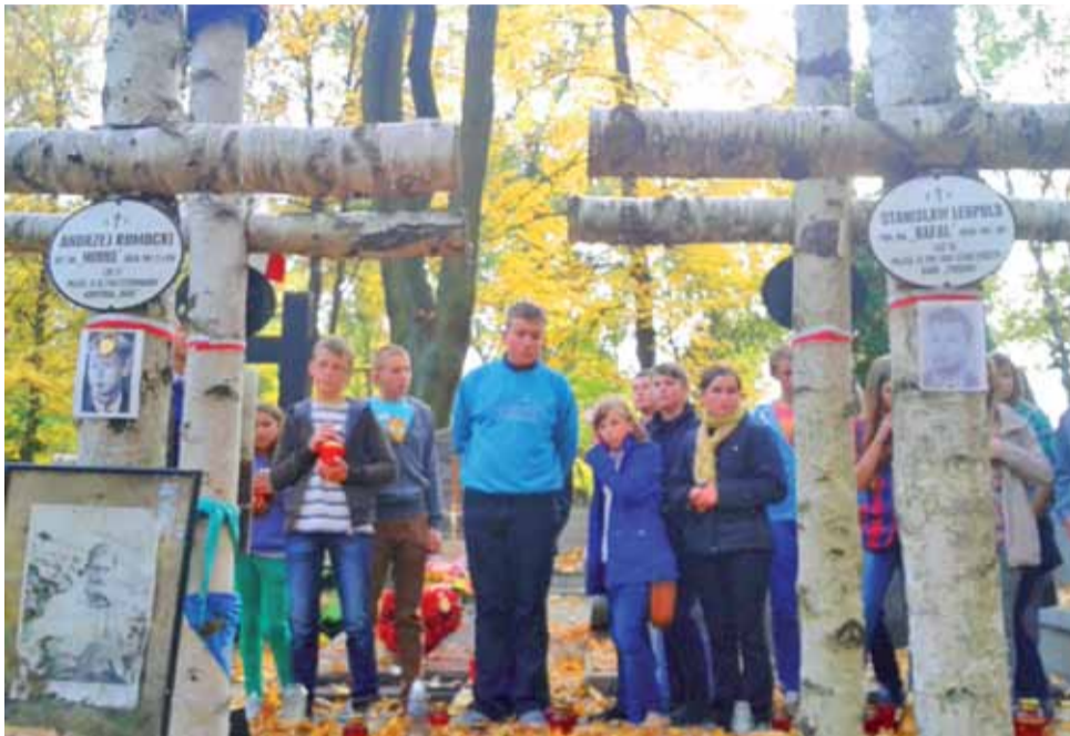
Chłopcy i dziewczęta, modlący się nad mogiłami bohaterów poległych podczas II wojny światowej, mają niewiele mniej lat niż ci, za których się modlili.

Pierwszym celem podróży było Gimnazjum i Liceum im. Stefan Batory przy ul. My-