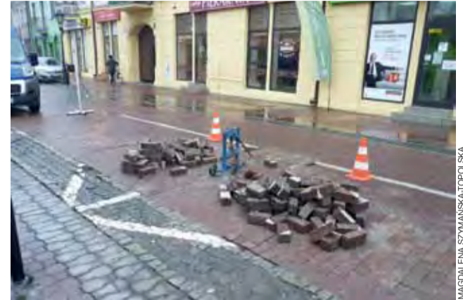
Tak wyglądała ul. Zduńska podczas likwidowania koperty, oznaczającej miejsce parkingowe dla niepełnosprawnych.

Jednego dnia wymieniono elementy kostki, a drugiego spono je zaprawą na stałe. Farby użytej do oznaczenia miejsca postojowego dla pojazdów, którymi poruszają się osoby niepełnosprawne, nie można po prostu z kostki zmyć, dlatego należało wymienić te jej elementy, które zostały nią pomalowane. Pracownicy ZUK zajęli się tym w środę 20 listopada przed południem. Wymieniali elementy czerwonej kostki na inne, natomiast kostkę granitową, w miarę możliwości układali stroną, na której nie było