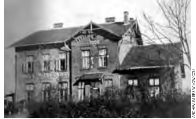
Budynek przy ul. Chemicznej 6 (obecna A. Krajowej). Tutaj mieściła się szkoła w latach 1908-1963, z przerwami w okresach wojennych.