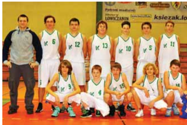
Kadeci Księżaka Łowicz zajmują w lidze wojewódzkiej 5. miejsce.