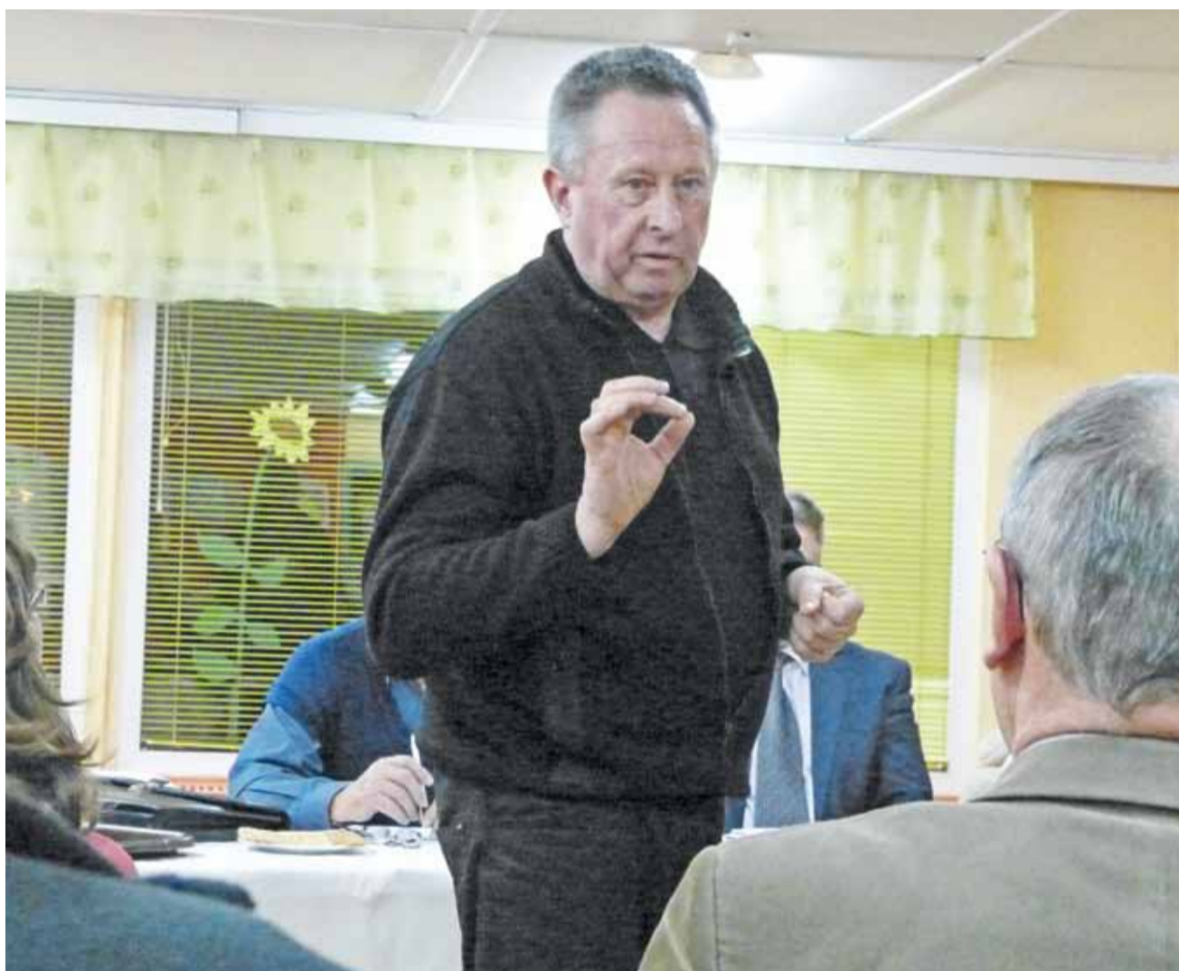
Dobre decyzje kształtują się w debacie. Na zdjęciu dyskusja podczas jednego z tegorocznych spotkań z burmistrzem.

– Liczę, że możliwość wyboru zadania do realizacji w bezpośrednim miejscu zamieszkania wpłynie pozytywnie na aktywność mieszkańców, którzy poczują, że mogą mieć wpływ na realizowane inwestycje. Dodatkowo sprawi też, że mieszkańcy przekonają się, że warto przychodzić na spotkania i poruszać ważne dla miasta