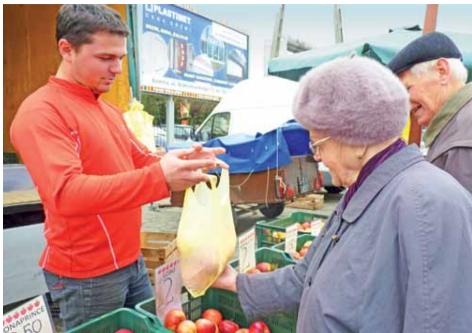
Jabłka są zdrowe w każdej postaci - na surowo i po przetworzeniu, dla ludzi w każdym wieku, dlatego to właśnie one są najczęściej kupowanymi owocami.

Motyle można zwalczać w inny sposób. Ich liczbę trzeba monitorować od 15 kwietnia do