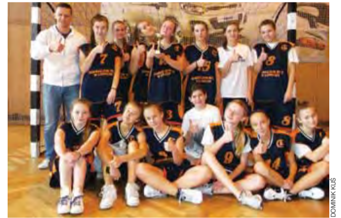
Dziewczyny z Gimnazjum nr 2 okazały się najlepsze w powiecie w szczypiorniaku.