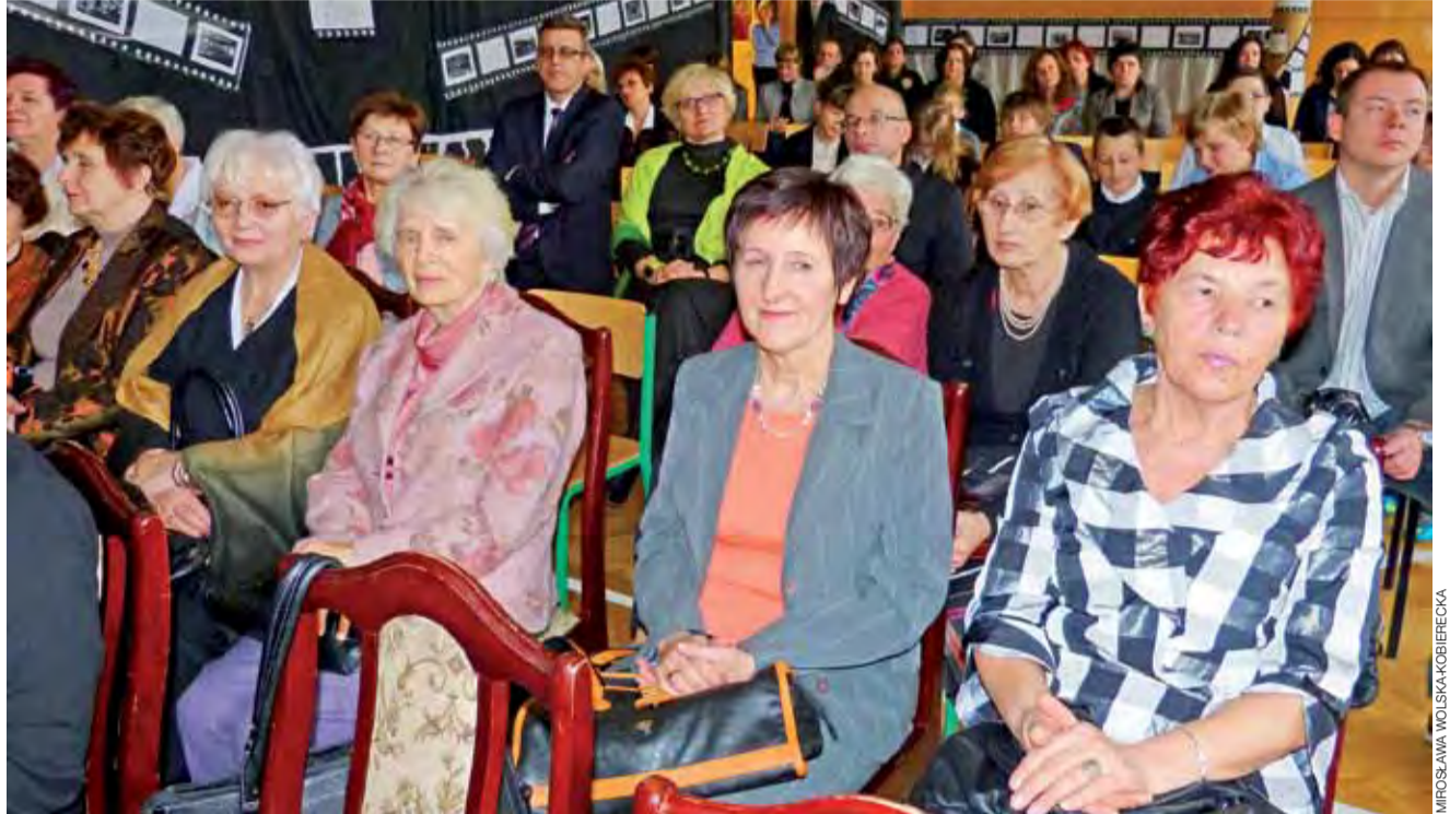
Na widowni emerytowani pracownicy szkoły, za nimi pozostali zaproszeni goście oraz obecni nauczyciele.

Łowicz | Szkoła Podstawowa nr 3 świętowała swój jubileusz