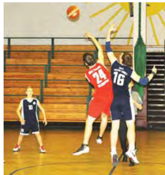
Młodzicy UMKS Księżak pokonali w derbowym meczu Ósemkę Skierniewice

Nasi młodzicy nadal zajmują w lidze wojewódzkiej w grupie A 7. lokatę. W grupie B liderem jest Piotrcovia Piotrków Trybunalski,