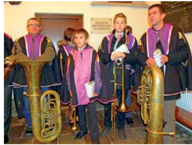
Specjalnie dla biskupa przyjechała orkiestra ze Żdżar – parafii, z której pochodzi biskup.