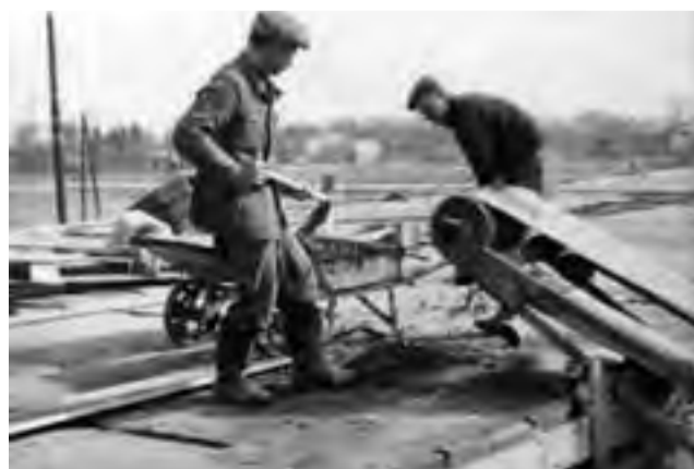
Zalanie stropów obecnego budynku szkoły.

Wspomnień było oczywiście więcej. Galerię zdjęć z uroczystości oraz film można obejrzeć na naszym portalu www.lowiczanie.info w zakładce Edukacja/Wydarzenia. ■