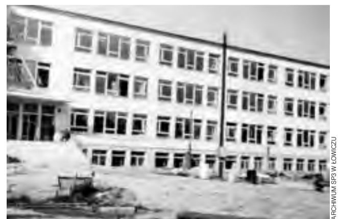
Budynek szkoły wiosną 1963.