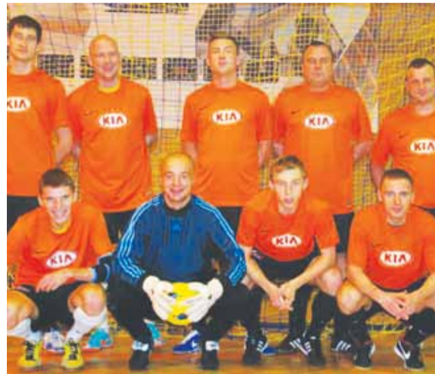
Drużyna KIA w ostatnich latach zawsze walczy o najwyższe cele. Po pierwszej kolejce jest liderem KIA Open I ligi.

Najsukuteczniejsi strzelcy KIA OPEN I ligi: 2 gole – Burzykow-