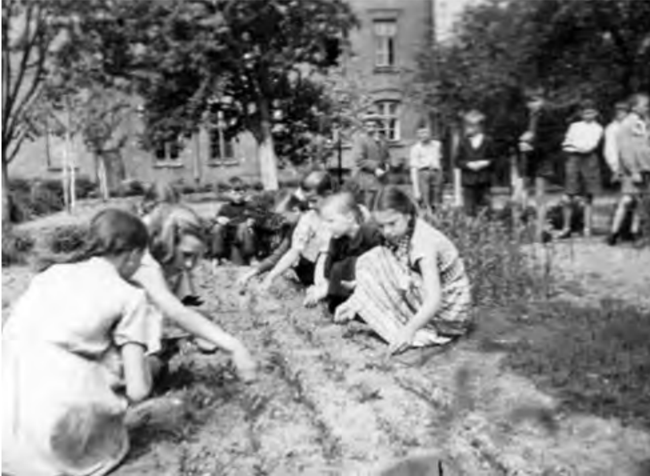
Pielenie grządek w przyszkolnym ogródku, rok szkolny 1953/54.