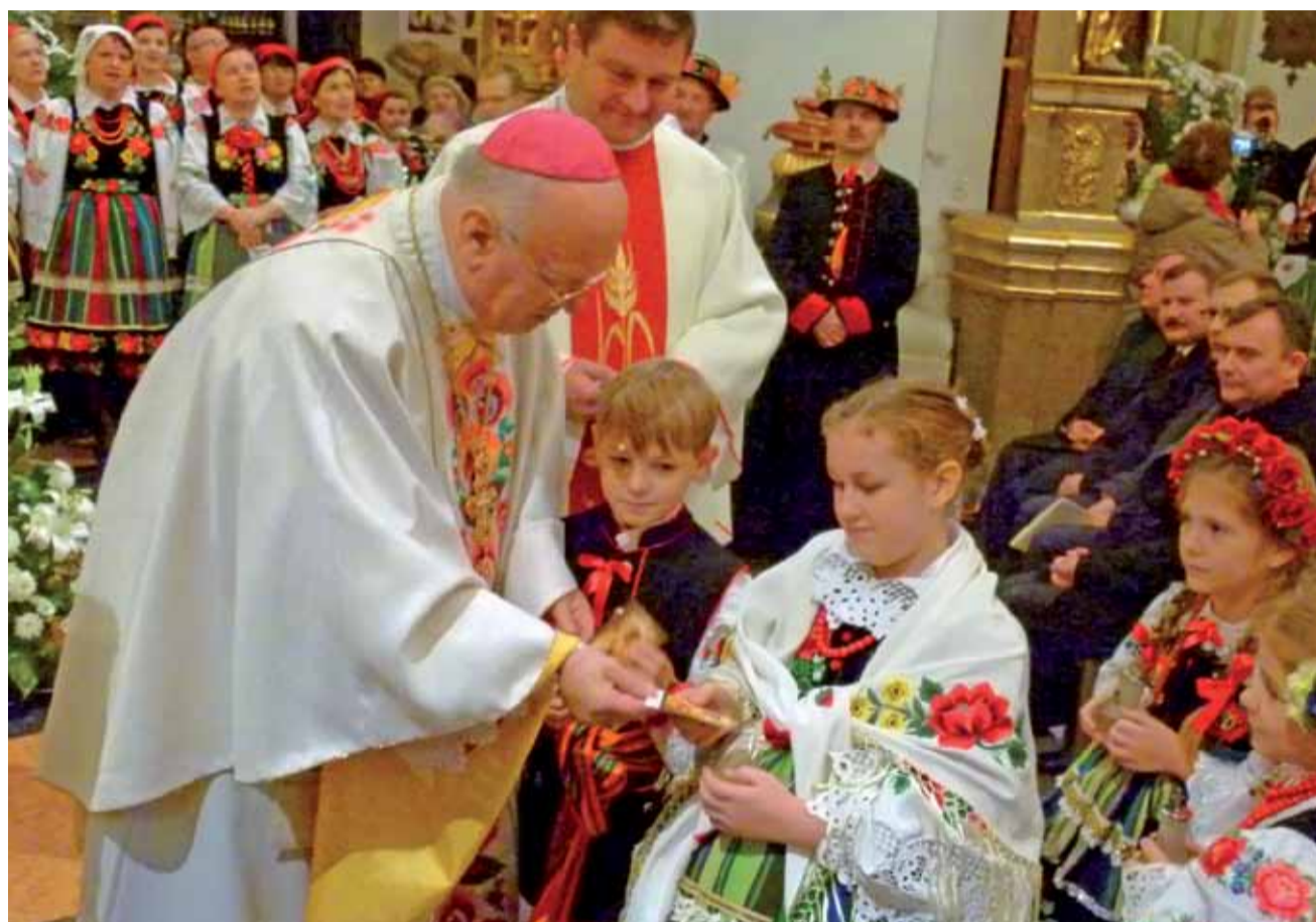
– Moje kochane Łowiczaki – zwykł mawiać o dzieciach w strojach ludowych biskup Józef Zawitkowski. W sobotę te dzieci też mu dziękowały.

– Już od przeszło pół wieku jest Ekscelencja prawdziwym oraczem, siewcą i żniwiarzem Słowa Bożego w ludzkich duszach. Ileż pięknych, poruszających treści wypowiedział ksiądz biskup o człowieczeństwie, patriotyzmie, o szacunku do ojczyźnych dziejów, literatury, polskiej przyrody. Te słowa naj-