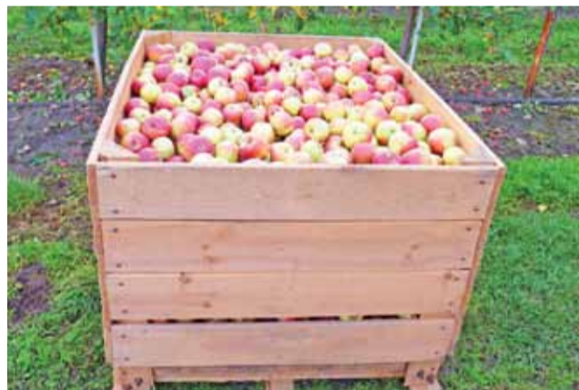
W takich skrzyniopaletach umieszcza się jabłka zerwane w sadzie. Mieści się w nich do 300 kg owoców.