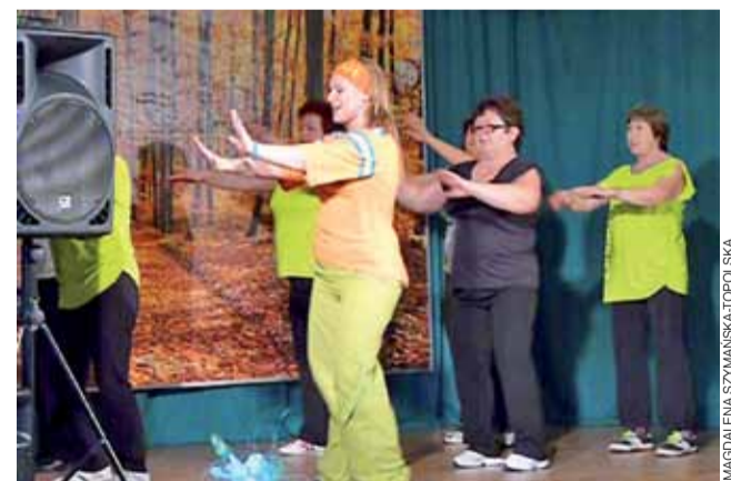
Członkowie zespołu Zumba Gold z Bełchowa pokazali, że zumba, to taniec dający dużo radości.

jak jego członkowie to określają – „miejską muzykę podwórkową” z „elementami folkloru miejskiego”. Zespół ten działa od 2005 roku przy Gminnym Centrum Kultury, Sportu i Rekreacji w Krośniewicach. Występuje na festynach, dożynkach, imprezach lokalnych. Zdobył nagrody na Przeglądzie Kapel Folklorystycznych w Sieradzu w 2009 i 2011 roku. W marcu tego roku muzycy z Krośniewic zagraли na Regionalnej Otwartej