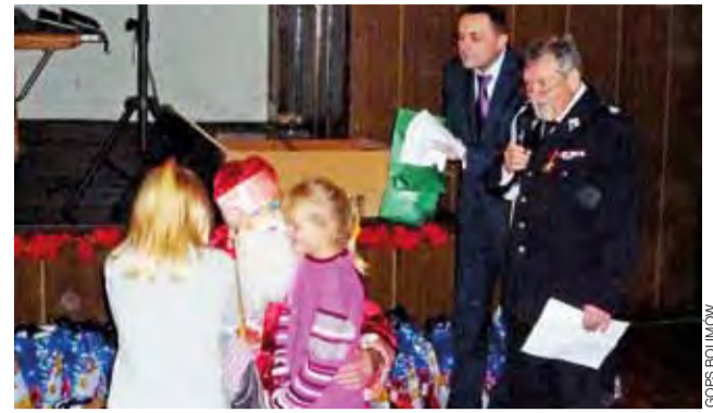
Strażacy z zarządu OSP gminy Bolimów pokazali po raz kolejny wielkie serce, angażując się w przygotowanie paczek dla dzieci.

Myślę, że to dobrze, zwłaszcza dla dzieci, ale dla dorosłych też, coś słodkiego pod choinką to zawsze przyjemny akcent. tm