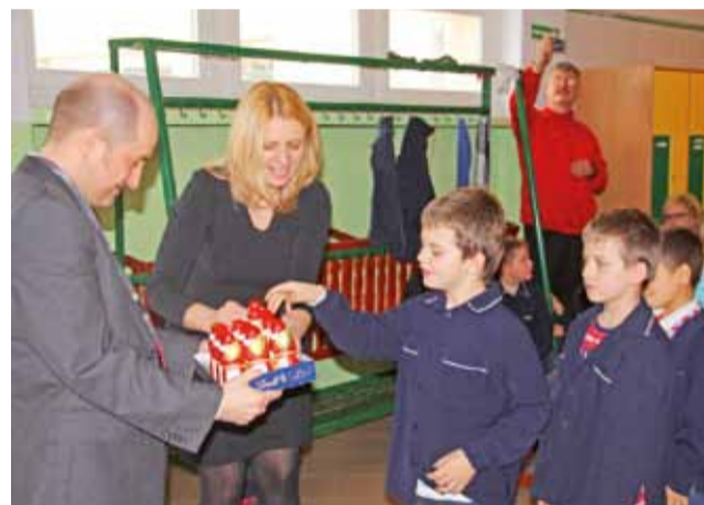
Każdy uczeń od gości z Jaktorowa otrzymał czekoladowego mikołaja.