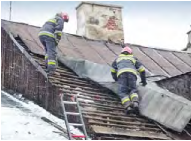
Strażacy rozwinęli na dachu blachę, którą próbował porwać silny wiatr.

Blaszone pokrycie dachowe z prywatnej posesji przy ulicy Zduńskiej w Łowiczu, w której mieści się m.in. sklep z angielską odzieżą używaną, zostało naderwane w piątek 6 grudnia ok. godz. 13 przez silne podmuchy wiatru. Sytuacja wyglądała groźnie, a na miejscu interweniowały dwa zastępy straży pożarnej z Łowicza. Z uwagi na wzmagający się w tym czasie wiatr niemożliwe było zadysponowanie na miejsce podnośnika strażackiego, gdyż niemożliwe byłoby go rozstawienie. Strażacy skorzystali więc z drabiny, po której dostali się na dach.