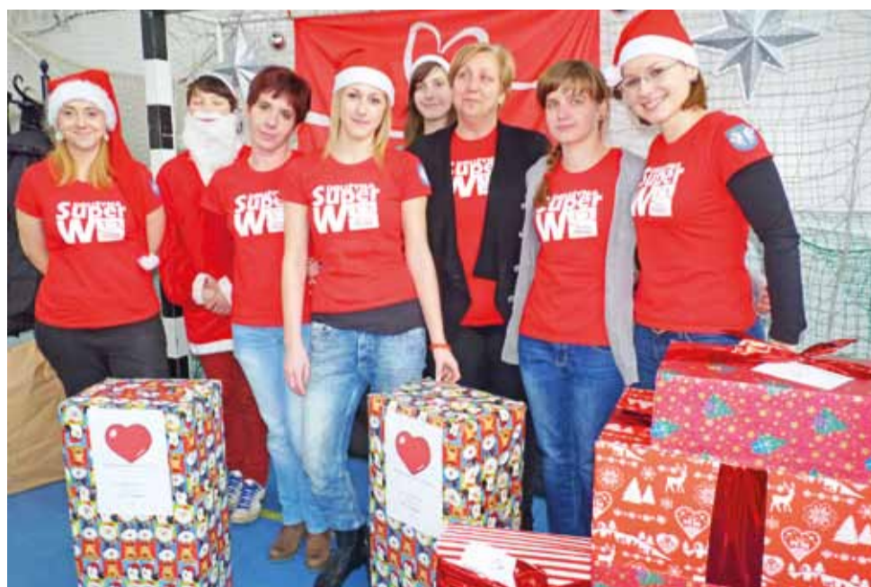
Łowicka baza Szlachetnej Paczki i jej załoga z prezentami, które dostarczali tutaj w sobotę darczyńcy.

Rejon Szlachetnej Paczki utworzono w Łowiczu po raz pierwszy, ale nie po raz pierwszy brali w niej udział łowiczanie. Już w ubiegłym roku zaangażowali się w nią uczniowie Zespołu Szkół z Oddziałami Integracyjnymi na osiedlu Bratkowice. Tym razem w „Siódemce” zorganizowana została baza, z której