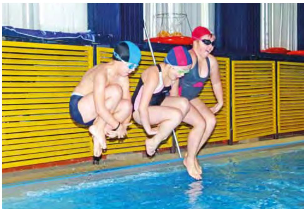
Skok do wody. Nauka pływania na basenie w Łowiczu – jak widać dostarcza dzieciom wiele emocji.