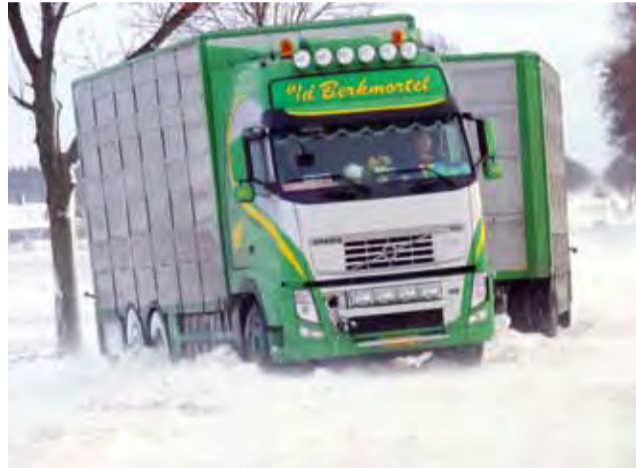
TIR-y i samochody z przyczepami nie były w stanie utrzymać się przy silnym wietrze na śliskiej drodze.

W piątek i w sobotę duże problemy z przejezdnością były również na drogach wojewódzkich. – Na drogach na terenie powiatu łowickiego tradycyjnie największe problemy mieliśmy na drodze 584 w okolicach Czerniewa i Kiernozi – przyznaje Grażyna Kaczor, szefowa łowickiego oddziału Zarządu Dróg Wojewódzkich w Łodzi. Droga ta na niemal całej swej długości jest odśnieżona, a wiatr wieje zwykle prostopadle do niej. W piątkowe popołudnie przejazd nią został całkowicie zablokowany przez TIR-a, który nie był w stanie po-