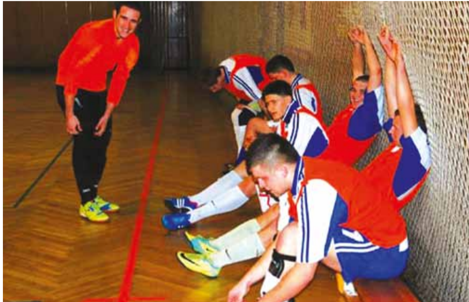
Zawodnicy Zatorza III mieli wiele powodów do zadowolenia. Pokonali Górki Łowicz aż 5:0!