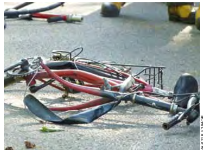
21 lipca 2013 r. Zniszczony rower w czasie trwania akcji ratunkowej ciągle leżał na drodze. Opis jego stanu po wypadku jest jednym z dowodów w sprawie.