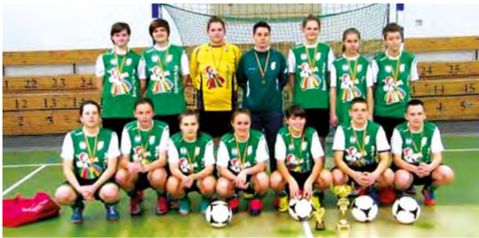
Piłkarki Pelikana Łowicz okazały się najlepsze w turnieju halowym.