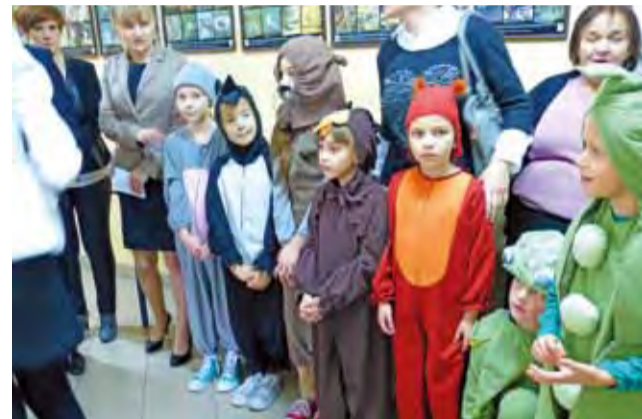
Uczniowie, w przebraniach inspirowanych przyrodą, także złożyli gościom podziękowania za otwarcie eko-pracowni i za odwiedzenie szkoły.

co stwierdził automatycznie sam program. Tablica daje też możliwość podłączenia do niej innych urządzeń, na przykład laptopów (wójt gminy Dariusz Reczulski zamierza dokupić dodatkowe w przyszłym roku, tak, aby każdy uczeń na lekcji mógł dysponować jednym) czy mikroskopów.