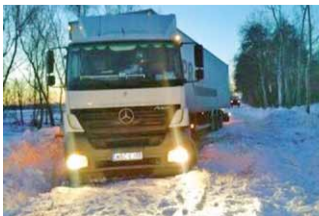
TIR, który ugrzązł w okolicach Błędowa , na drodze spędził ok. 10 godzin.