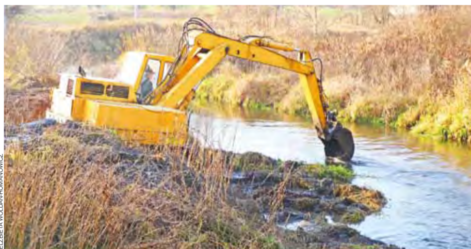
Porządki w rzece. Trwają prace konserwacyjne w korycie rzeki Mrogi na terenie gminy Bielawy od granic z gminą Głowno. Oczyszczanie brzegów z zakrzaczeń i konserwacja koryta odbywa się na zlecenie Wojewódzkiego Zarządu Melioracji i Urządzeń Wodnych w Łodzi. 27 listopada koparka dotarła do już Bielawy i prace były prowadzone w pobliżu mostu za Urzędem Gminy. ewr