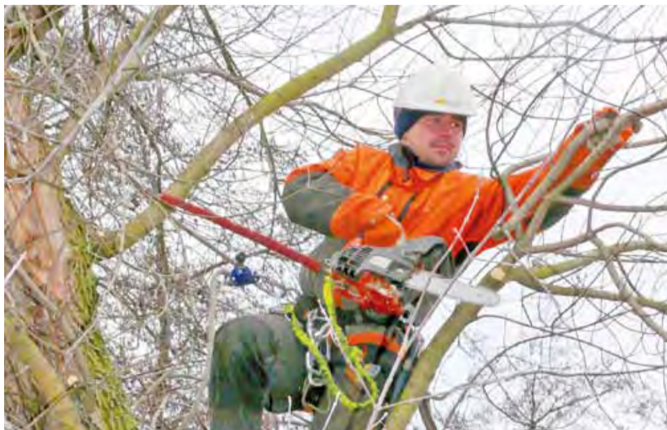
Jeden z pracowników firmy Makro Flora w czasie prac na ul. Blich. Na zlecenie ratusza firma ma przyciąć korony 233 drzew.