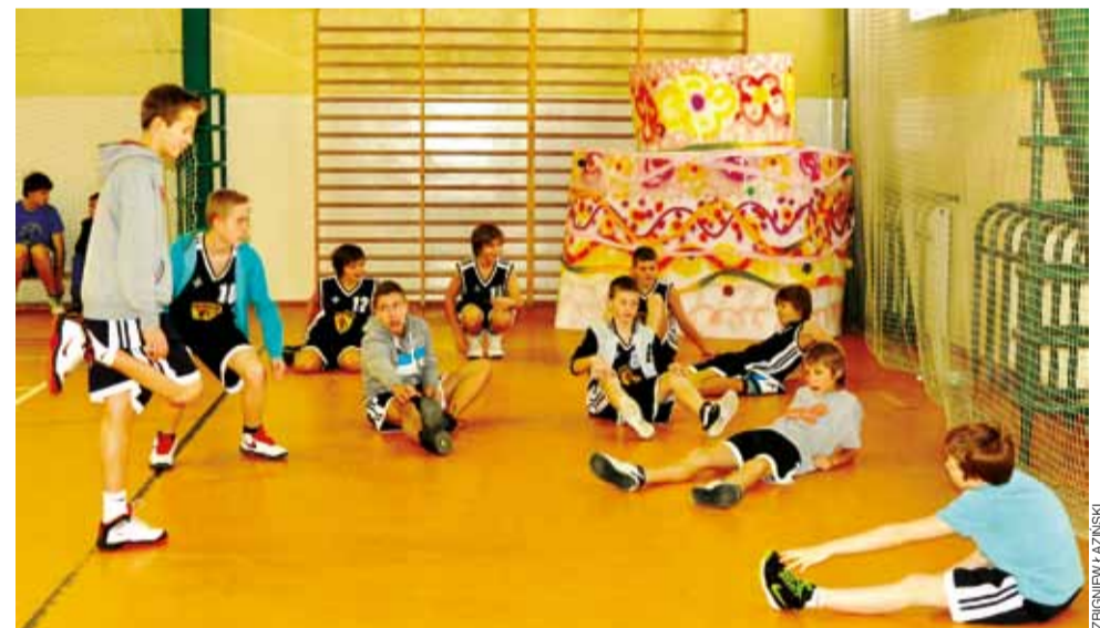
Młodzi zawodnicy Księżaka z rocznika 2001 będą groźni w lidze za rok.

Koszykówka | 9. kolejka Wojewódzkiej Ligi Młodzików U-14