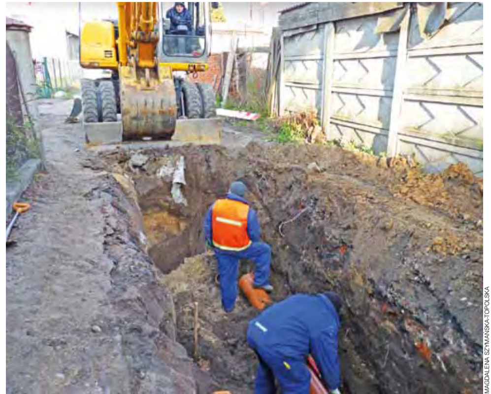
Prace na ul. Wegnera i Rotstada związane z zakładaniem kanalizacji deszczowej i sanitarnej powinny zakończyć się tuż przed świętami Bożego Narodzenia.

Stawka zaproponowana przez ZOM w przetargu to 6,5 zł brutto miesięcznie na mieszkańca za odbiór odpadów posegregowanych. Igielski twierdzi, że to bardzo rozsądna kwota, o 50 groszy niższa od stawki, którą płać mieszkańcy do ratusza. Pozostała kwota powinna więc jego zdaniem pozwolić sfinansować obsługę systemu odbioru w ratuszu. ■