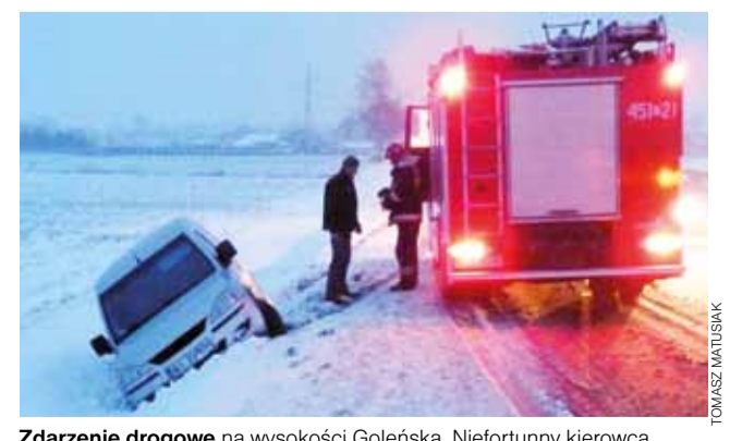
Zdarzenie drogowe na wysokości Goleńska. Niefortunny kierowca rozmawia ze strażakami.

Najgroźniej wyglądała sytuacja w Chaśnie, gdzie bus marki VW uderzył w drzewo. Jego kierowca, 57-letni mieszkaniec powiatu łowickiego, nie ucierpiał jednak poważnie. Dostał natomiast mandat za niedostosowanie prędkości do panujących warunków. tm