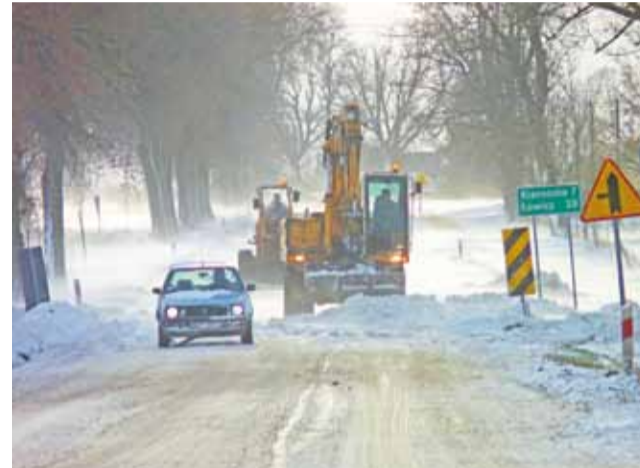
Droga z Sannik przez Kiernozię do Łowicza była czasowo nieprzejezdna, choć pracowali na niej ciężki sprzęt.

Generalnie najwięcej problemów mieli właśnie kierowcy TIR-ów. W piątek największą przeszkodą dla kierowców był śnieg i silny wiatr, a od soboty oraz częściowo w niedzielę, śliskość na drodze. Wiatr powodował, że naczepy miały trudności z utrzymaniem się na śliskiej nawierzchni przez co niejednokrotnie były spychane na pobo-