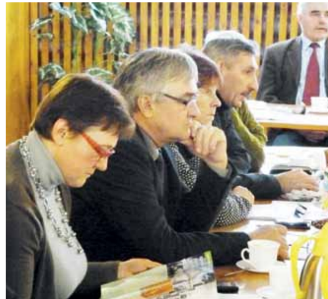
Radni chcą, aby szkoła w Mastkach dalej podlegała gminie.

Wójt chce, aby Stowarzyszenie Wspierania Inicjatyw Lokalnych w Chaśnie, choć nie dostanie pod opiekę szkoły, działało dalej. Zaznacza, że może ono być bardzo pomocne w pozyskiwaniu środków zewnętrznych na projekty oświatowe. ■