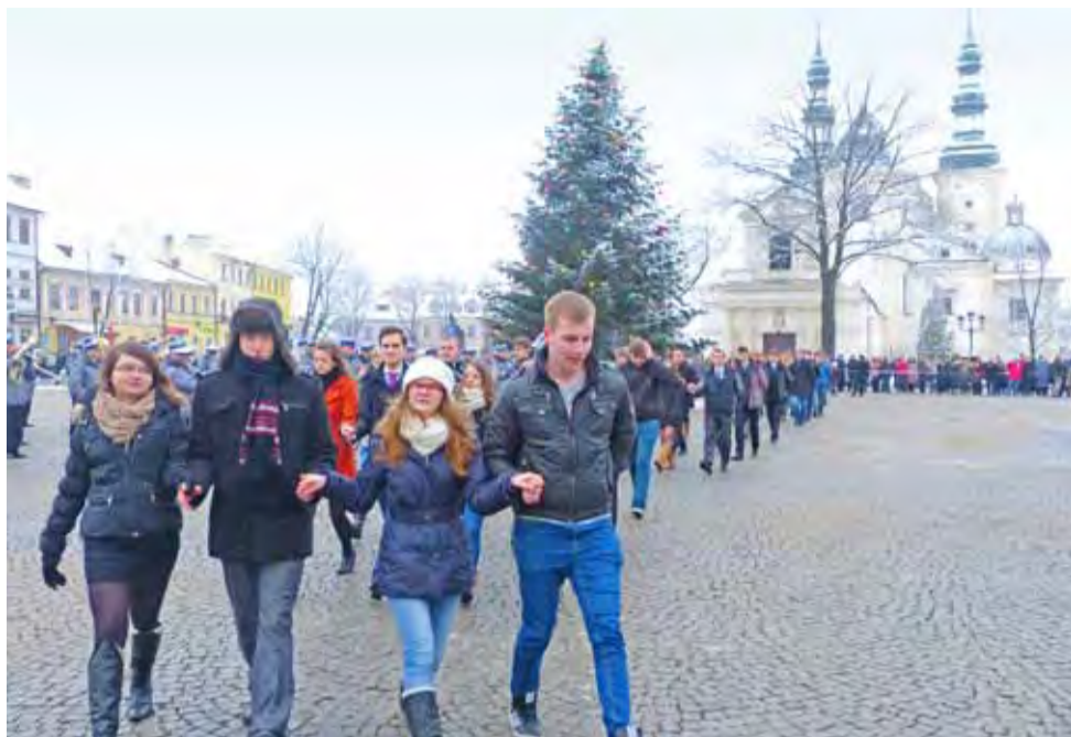
Poloneza zatańczyło 200 maturzystów ze wszystkich szkół średnich podległych łowickiemu starostwu.