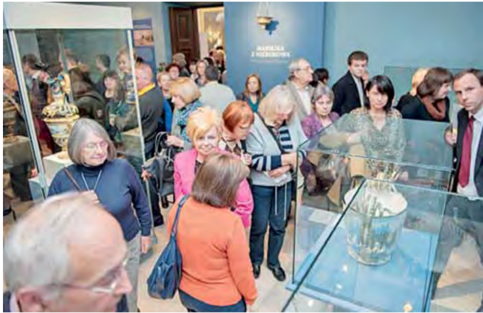
Otwarcie wystawy nieborowskiej majoliki w krakowskich sukiennicach.

– Dziś uważamy jednak majolikę z Nieborowa nie tylko za zjawisko absolutnie wyjątkowe w historii polskiej ceramiki, lecz zarazem zaliczamy ją do najciekawszych i najcenniejszych przykładów ilustrujących tendencje