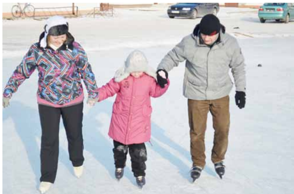
Łyżwy to dobra zabawa dla całej rodziny. Dla niej warto przyjechać do Domaniewic.