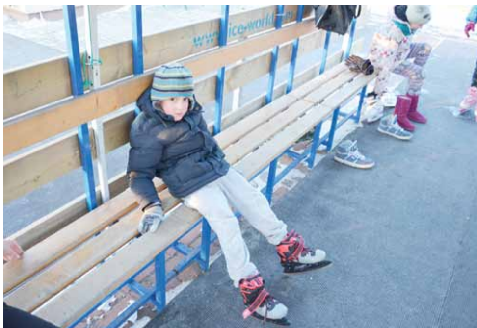
Chwila odpoczynku także jest potrzebna...