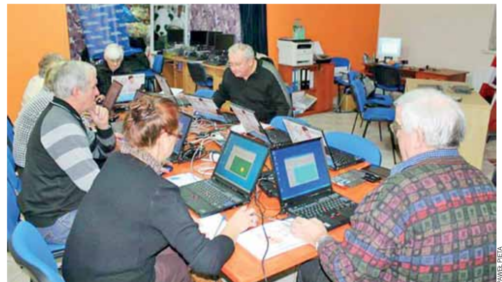
Ta grupa rozpoczęła zajęcia 20 stycznia. Jak zapewnia prowadzący zajęcia, kursanci są zdyscyplinowani i wiedzą, czego chcą się nauczyć.

– Są to głównie osoby w przedziale wiekowym 50-65 lat, chociaż mieliśmy też kursanta 82-letniego, który radził sobie już z komputerem, ponie-