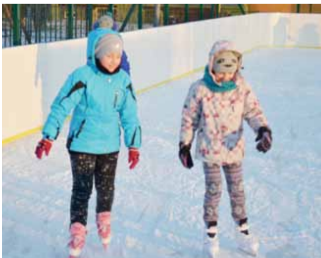
Dzieci na „Białym Orliku” przy Bolimowskiej.