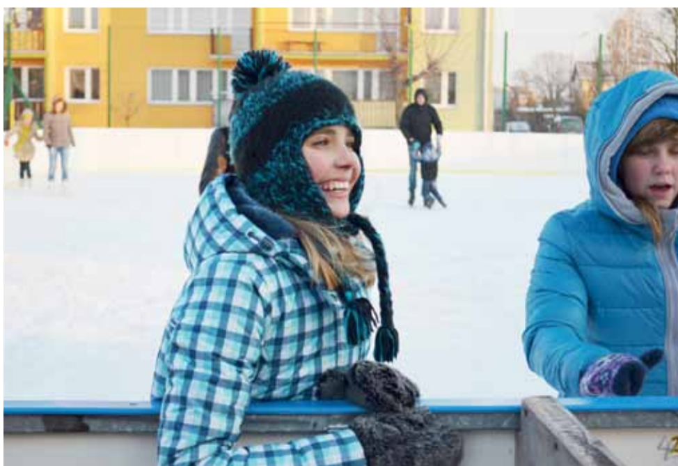
Zmęczone, ale zadowolone. Uśmiechy praktycznie nie znikają z twarzy gości Białego Orlika.