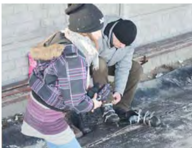
Wiązanie łyżew – dla komfortu jazdy i bezpieczeństwa.

Miłośnicy jazdy na łyżwach doczekali się w końcu możliwości poślizgnięcia się na powietrzu. W sobotę 25 stycznia odwiedziliśmy „Białego Orlika” przy ulicy Bolimowskiej oraz lodowisko przy szkole w Domaniewicach – rodzinnej miejscowości Zbigniewa Bródki. Duży mróz sprawił, że tego akurat dnia chętnych było przy Bolimowskiej mniej, niż można było się tego spodziewać. Tuż po godzinie 10 nie było jeszcze nikogo, „Orlik” zaczynał żyć dopiero od południa. W Domaniewicach też przybyli na lód najwytrwalsi – ci, którzy podkreślali, że mróz albo nie ma znaczenia, albo że wręcz nadaje zabawie klimatu. Nie było ich jednak tak wielu jak w pozostałe dni. Teraz mróz zelżał, warunki do jeżdżenia są idealne. Oba lodowiska mają być otwarte tak długo, jak pozwoli na to pogoda.