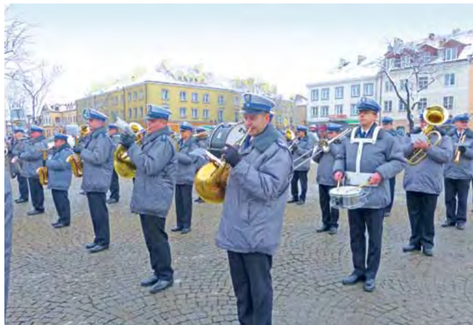
Orkiestra Reprezentacyjna Policji zagrała najpierw na Starym Rynku, potem w sali barkowej muzeum.