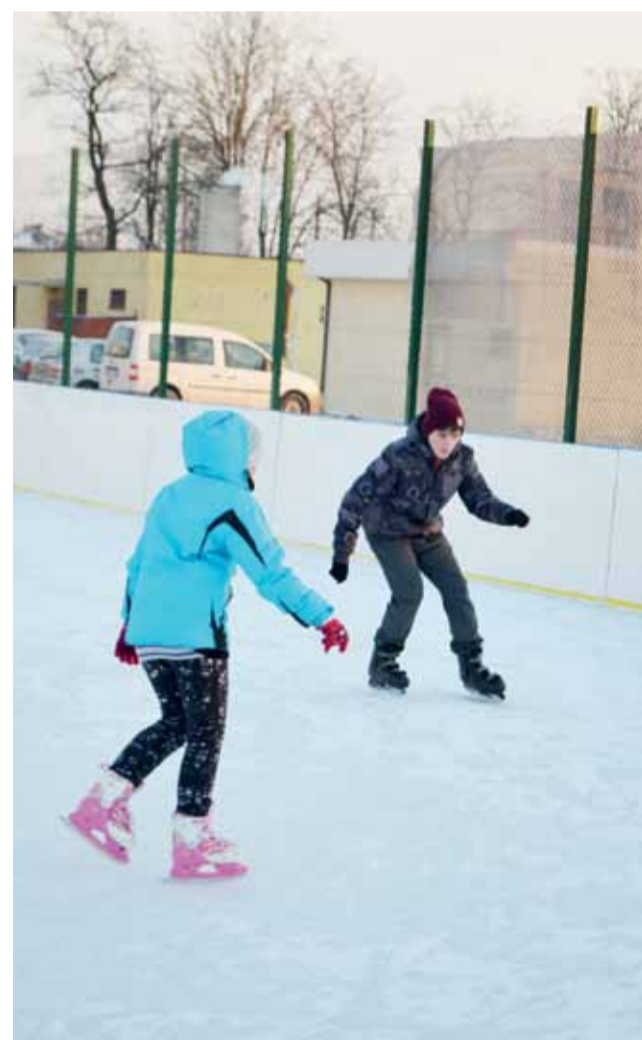
Mróz nie odstraszył najwytrwalszych adeptów łyżwiarstwa.