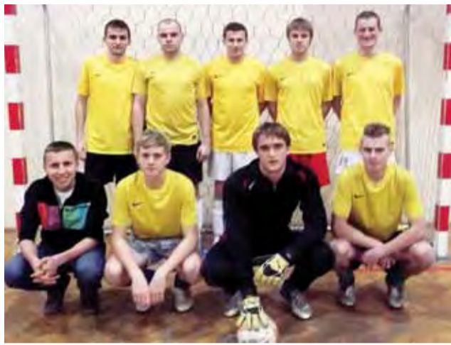
Kapela Wuja Toma będzie walczyła o mistrzostwo z Pieczarką Waliszew.

■ Pieczarka Waliszew – Brooklyn Walewice 9:3 (5:1); br.: Radosław