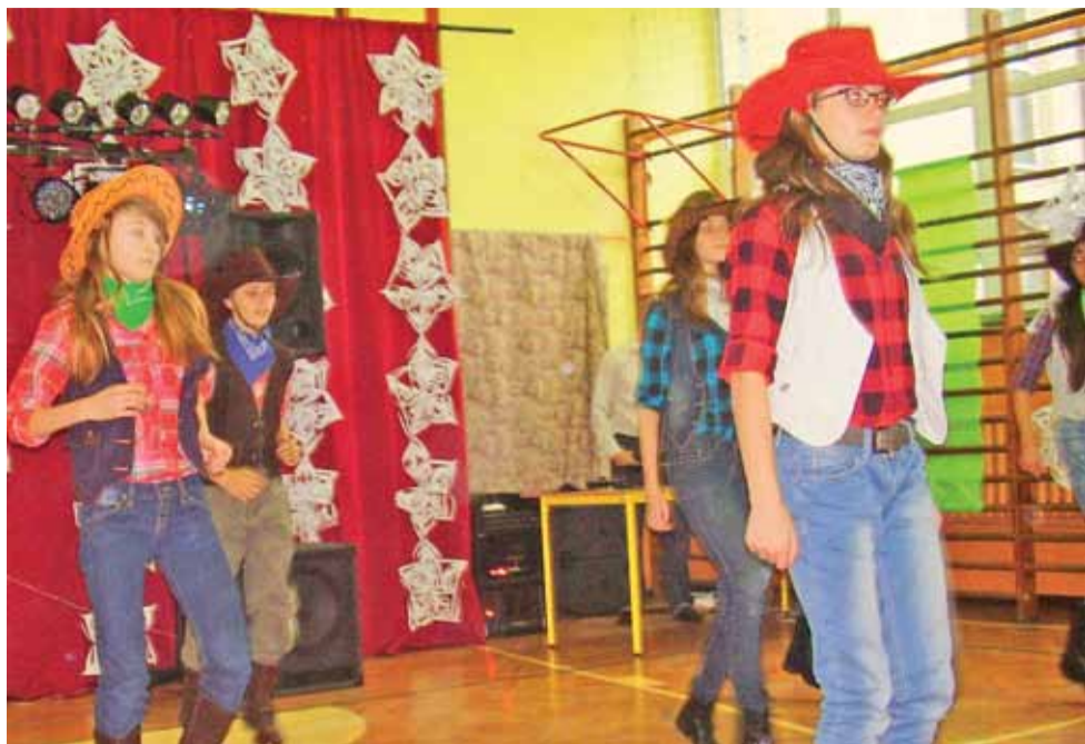
Uczniowie klasy VI w czasie zabawy karnawałowej zaśpiewali i zatańczyli do kowbojskiej piosenki pt. Rednex-Cotton Eye Joe