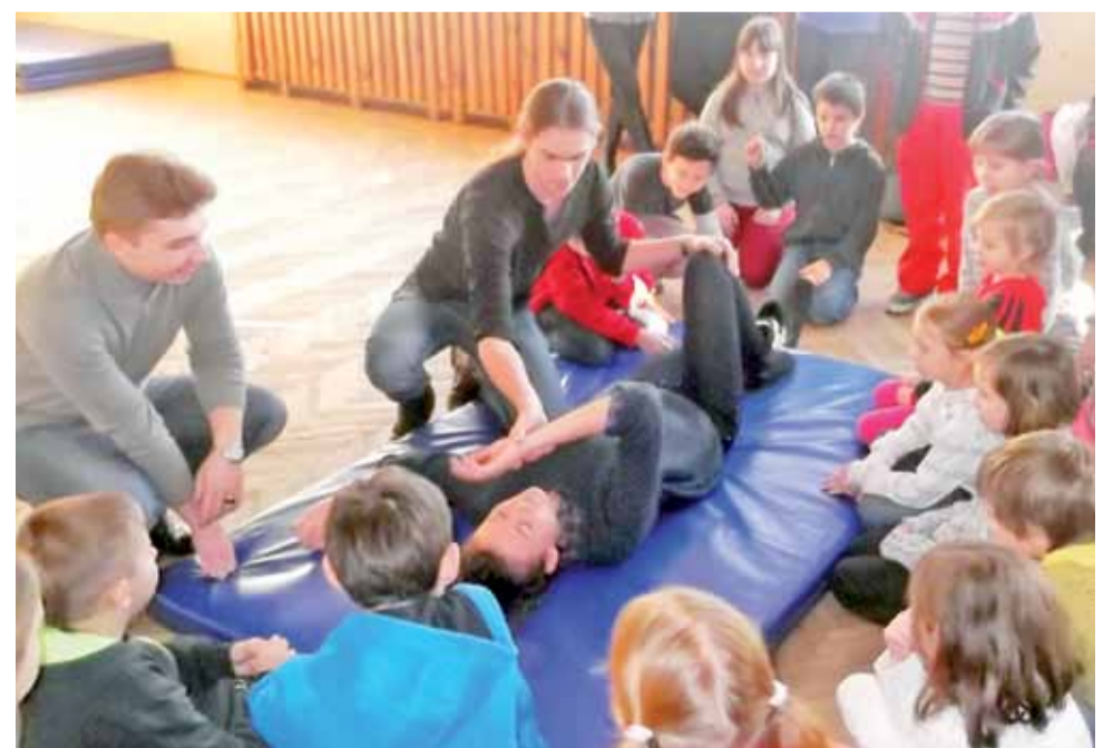
Starsi pokazywali, dzieci były zainteresowane.