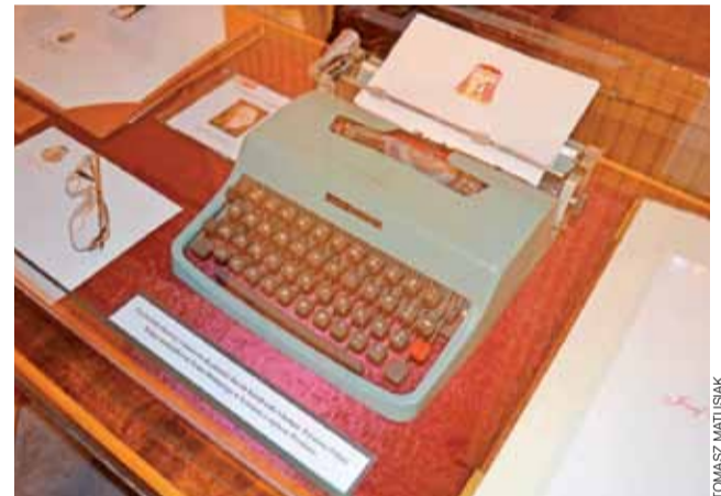
Jedne z eksponatów. Okulary i maszyna do pisania kardynała Glempa.

Muzeum w Łowiczu | Ekspozycje ze skarbca diecezjalnego i domu biskupa