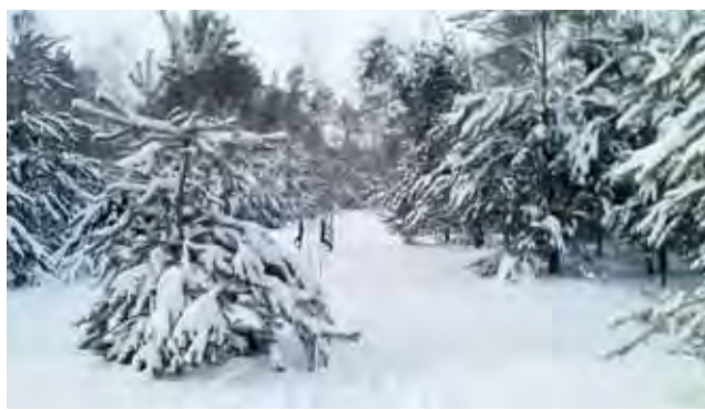
Spacer na nartach wśród iglaków. Początkujący chodzący mają do dyspozycji specjalnie wytyczony ślad, bardziej zaawansowani mogą spacerować na nartach na przelaj.

Mariusz Pietrzak, jeden z członków TN uważa, że chodzenie na nartach to bardzo do-