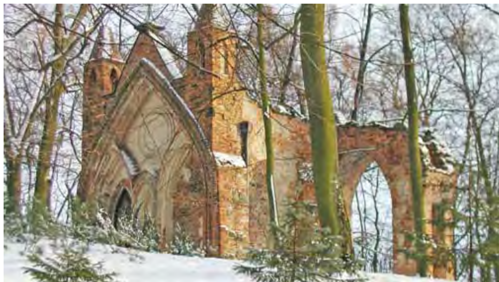
MUZEUM W NIEBOROWIE I ARKADII