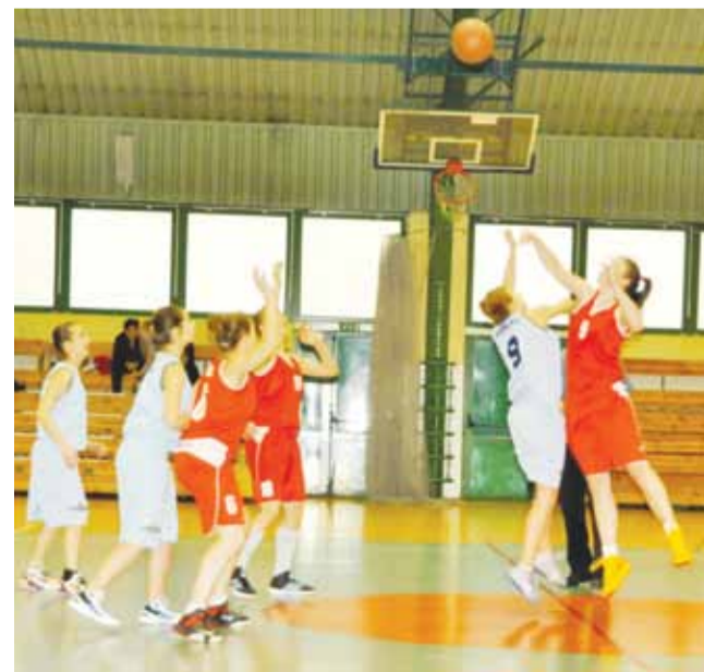
Łowiczanki nie poradziły sobie z wyższymi rywalkami z Łodzi.