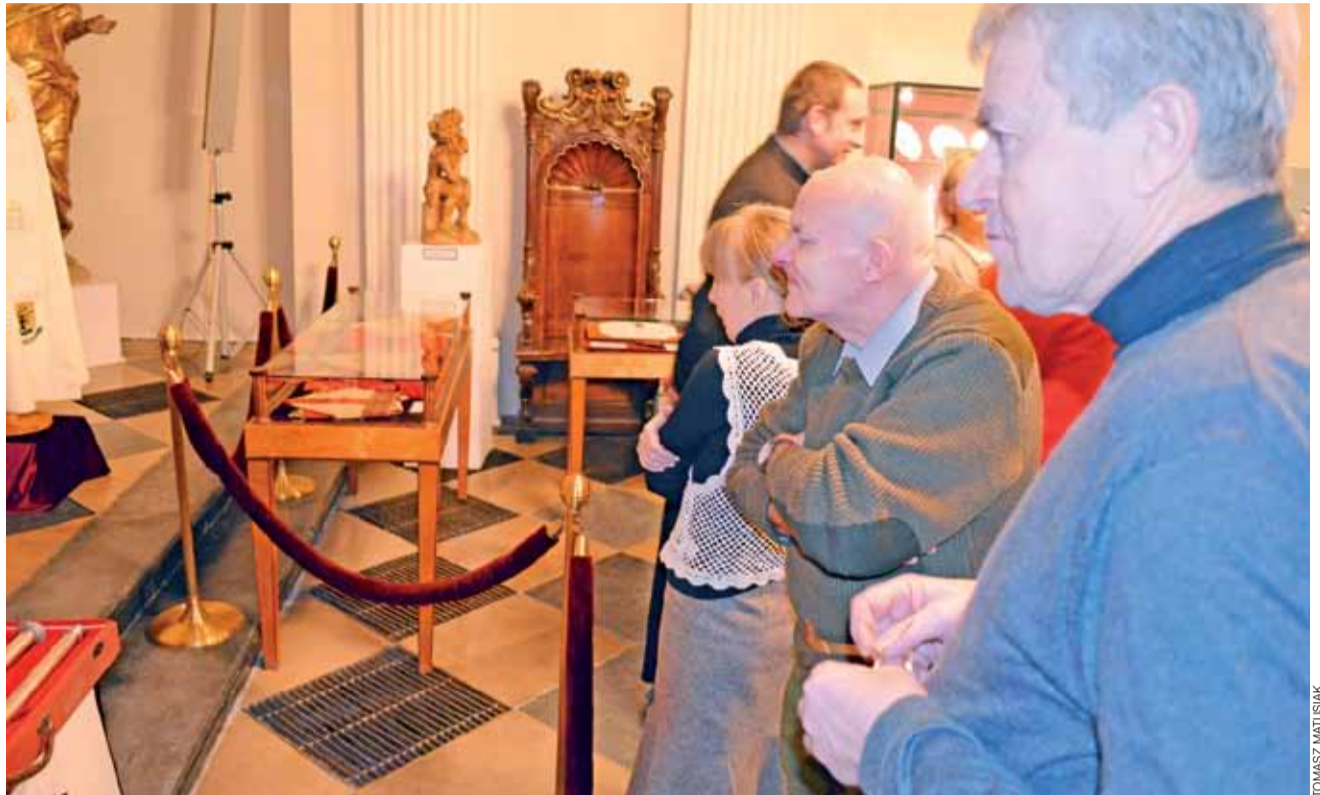
Na otwarciu wystawy nie było tłumów. Wszyscy oglądali eksponaty z dużym zainteresowaniem.