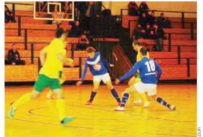
Project GT (niebieskie stroje) tym razem przegrał z ZSCKR 2:4.