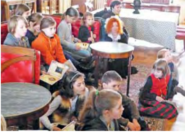
Dzieci zdobywają wiedzę w pałacowej bibliotece.