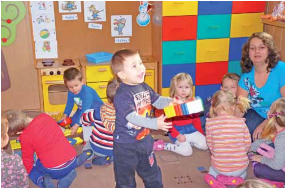
Dzięki dniom otwartym w przedszkolu łatwiej przekonać dziecko, że jest to fantastyczne miejsce, gdzie może się ono doskonale bawić i czuć się bezpiecznie.