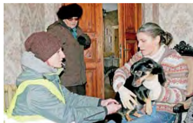
Dzięki współpracy Łowickiego Stowarzyszenia Przyjaciół Zwierząt oraz Patrołu As z Łodzi zaszczepiono na terenie miasta ponad 30 zwierząt.

Z kolei za konserwację i eksploatację sieci i stacji wodociągowych odpowiada firma Cewokan z Małszyc, jedyna która przystąpiła do przetargu ogłoszonego przez wójta. Cena wynosi nieco ponad 400 tys. tm