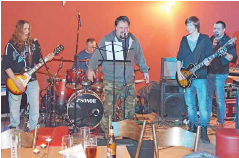
Mocny akcent na zakończenie koncertu – zespół bez nazwy (czyli de facto The Thrill ze zmienionym wokalistą) śpiewa piosenkę Proletaryatu.