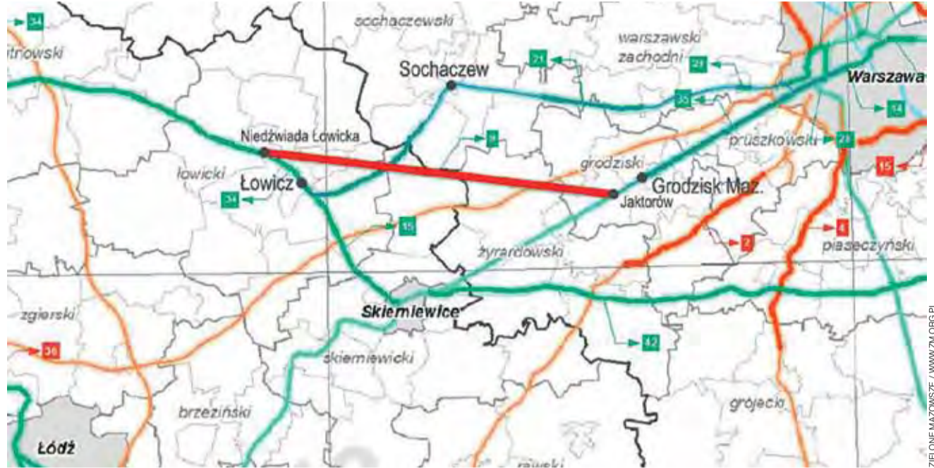
planowana linia kolejowa; inne projekty kolejowe; inne projekty drogowe

Linia kursuje dużo pociągów dalekobieżnych, bo jest ona wspólna dla pociągów wielu relacji: do Poznania, Berlina, Szczecina i Zielonej Góry, a także dla tych odbijających w Kutnie na Toruń i Bydgoszcz. I jeszcze pociąg KM Mazovia do Płocka. Do tego, w czasie remontu linii Warszawa - Skierniewice dochodzą pociągi w kierunku Łodzi i Wrocławia wyrzucone z tamtej linii - choć to sytuacja tymczasowa,