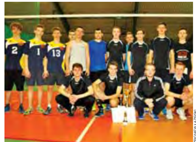
Mistrzowie z UKS Korabka I Łowicz i młodsi koledzy z UKS Korabka II Łowicz.

Lekka atletyka | Ostatnia odsłona GP Łódź