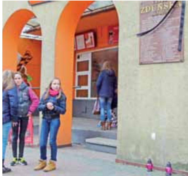
Czarna szarfa na tablicy i zapalone znicze zwracały uwagę przechodniów.

Łowicki fotografik nie po raz pierwszy komentuje obrazem i słowami to, co dzieje się w mieście. W 2012 roku w oknie wystawowym swojego zakładu fotograficznego zamieścił informację, dotyczącą podwyż-