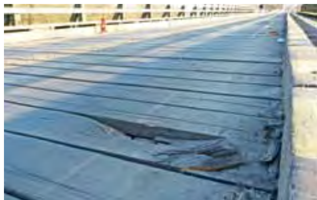
Widoczna na pierwszym planie uszkodzona deska poszycia mostu nie jest jedyna w tak złym stanie. Takich dziur w moście jest coraz więcej.

Gmina Bielawy | Przed przeprowadzką przedszkola