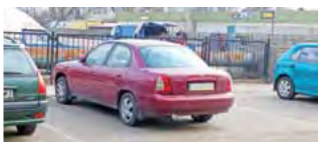
Widoczne na zdjęciu Daewoo dłuższy czas parkowało niewłaściwie. Po interwencji policji samochód został ustawiony na jednym stanowisku.

Nasz rozmówca był zirytowany, ponieważ przez kilka tygodni obserwował, zwłaszcza w dni targowe, jak inni kierowcy próbują parkować obok Daewoo swojego pojazdu. Ale na miejscu, jakie pozostało po prawej stronie auta, nie mieści się żaden pojazd dwusładowy. Jak wiadomo, w tym rejonie zaparkowanie w dogodnym miejscu graniczy niekiedy z cudem. Jak twierdzi, zgłaszał problem na policję, która przyjecha-