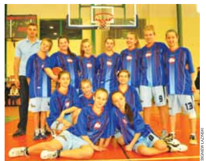
Kadetki Księżaka plasują się na 6. miejscu w lidze wojewódzkiej.

Miejmy nadzieję, że w Łowiczu nasze zawodniczki będą lepsze i na zakończenie ligi wygrają mecz. zt