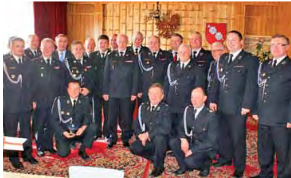
Wspólne zdjęcie strażaków z gminy Bolimów z komendantem głównym PSP gen. brygadierem Wiesławem Leśniakiewiczem (stoi w środku zdjęcia).

Komendant główny PSP w czasie spotkania w swoim wystąpieniu podjął temat zasad organizacji ratownictwa w krajowym systemie ratowniczo-gaśniczym, a także dokonał oceny przygotowania jednostek OSP gminy Bolimów do działań ratowniczych i ochrony ludności. Duże wrażenie zrobiła na nim ilość wyjazdów, do których angażowana jest jednostka OSP w Bolimowie – w 2013 roku było ich przeszło 100. Przed-