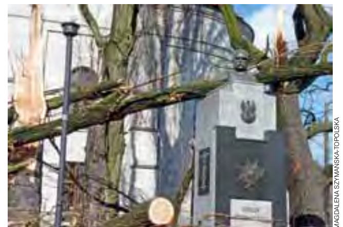
Można powiedzieć, że pomnik Marszałka Józefa Piłsudskiego ocalał cudem wśród pni i konarów drzew, które na niego spadły.

Na miejsce przybyły dwa zastępy JRG Łowicz. Drzewa zniszczyły ogrodzenie przy pomniku oraz zerwały linię energetyczną na odcinku 150 m. Jeden z konarów tarasował jezdnię, ale był przejezdny jeden jej pas. Jego usuwaniem strażacy zajęli się w pierwszej kolejności. Roz-