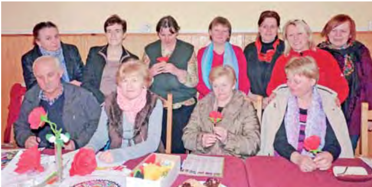
Członkowie Stowarzyszenia „Dolina Bobrówki” mają mnóstwo pomysłów i chęci do działania. Jako formalna organizacja, będą starali się o pozyskanie funduszy, by realizować swoje zamierzenia.