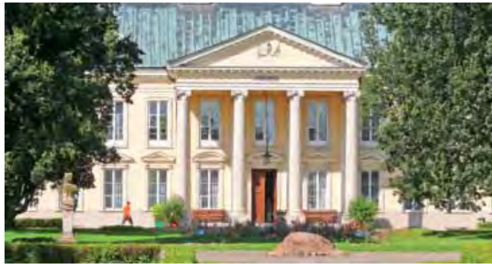
Pałac w Walewicach jest jednym z najciekawszych zabytków w powiecie łowickim.