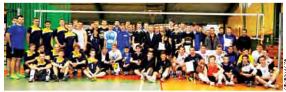
Pamiętkowe zdjęcie uczestników Siatkarskich Amatorskich Mistrzostw Łowicza.