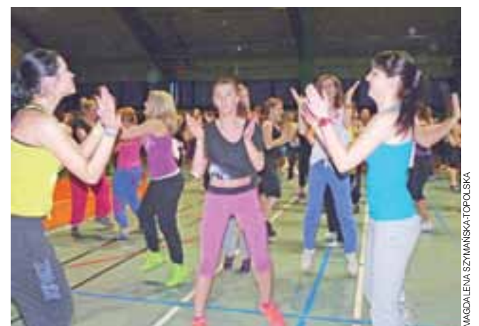
Udział w maratonie był okazją do świetnej zabawy w gronie przyjaciół i znajomych.

Pierwszą częścią akcji „Wyścig chęci” był turniej siatkówki rozgrywany w hali OSiR II między godz. 9.00 a 14.00,