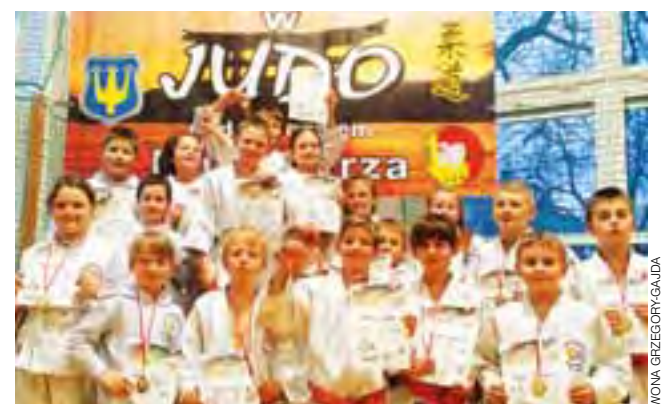
Młodzi judocy z MKS Zryw Łowicz wrócili z Błonia z "workiem" medali.

■ Rocznik 2006-2007 kategoria wagowa 36kg: