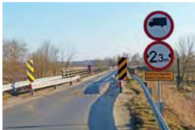
Na moście obowiązuje zakaz wjazdu ciężarówek. Niestety jego stan wskazuje na to, że jest on często łamany.