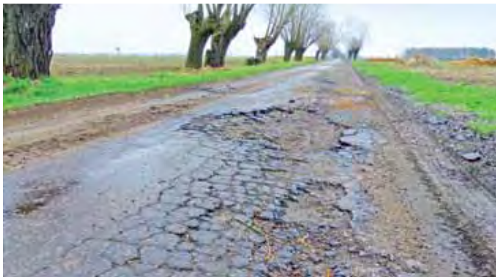
Nowa nakładka zostanie położona m.in. na drodze Wejsce-Konstantynów w gminie Kocierzew Płd., która od kilku lat jest w stanie katastrofalnym.

W gminie Bielawy wykonane zostaną: nakładka na drodze Marywil-Borówek, na długości