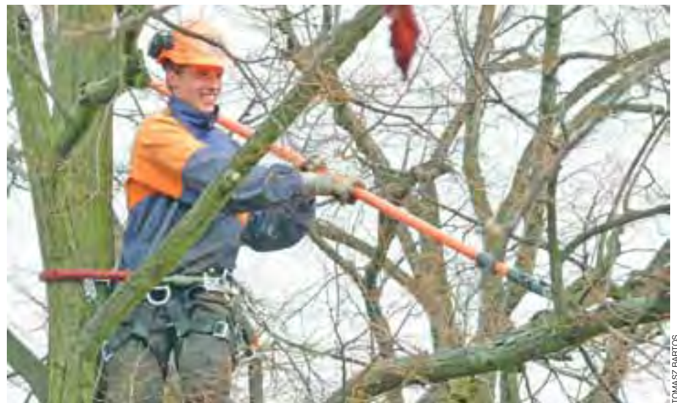
Firma Makro-Flora z Łowicza, do końca marca przycięła korony blisko 250 drzew na terenie Łowicza.

punkty widzenia i konfrontują swoje zdanie ze zdaniem swych kolegów. Tak uczą się dialogu i argumentowania swego stanowiska.