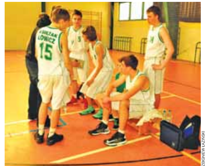
Kadeci Księżaka z rocznika 1999 zakończyli już tegoroczne zmagania w lidze.