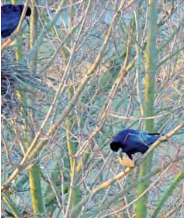
Gawrony są uciążliwymi ptakami, ale walka z nimi jest trudna, bo są chronione.