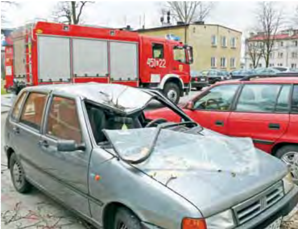
Oderwany konar uszkodził najbardziej Fiata Uno, wgniatając mu dach i wybijając przednią szybę.