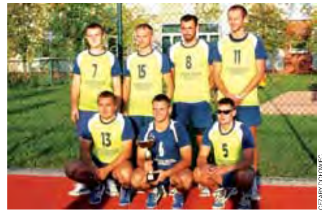
Ekipa Farbis Łowicz w mocnej lidze w Kutnie zajęła ostatecznie 3. miejsce.