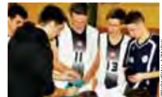
Juniorzy Księżaka Łowicz mają za sobą całkiem udany sezon.

Księżacy trzymali się na równi z rywalem przez trzy kwarty. Po 30 minutach przegrywali tylko 49:53, jednak w ostatniej odsłonie zdecydowanie lepiej kondy-