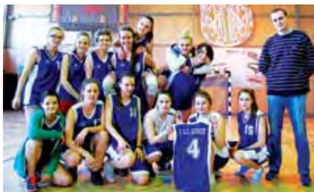
Po nerwowym finale mistrzami powiatu łowickiego zostały dziewczyny z I LO Łowicz.

Okazało się, że do finału dotarło I LO Łowicz i ZSP nr 4 Łowicz. Mecz decydujący o pierwszym miejscu i awansie na zawody rejonowe był bardzo nerwowy i wyrównany. Ostatecznie po dogrywce i emocjonującej końcówce minimalnie lepsze okazały się koszykarki z Chełmońskiego, które pokona-