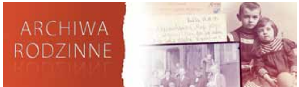
Baner akcji „Archiwa rodzinne”

Po drugie, kontaktujemy się z członkami rodziny mogącymi posiadać cenne informacje dotyczące przodków oraz pamiątek rodzinnych. Posiadane dane prze-