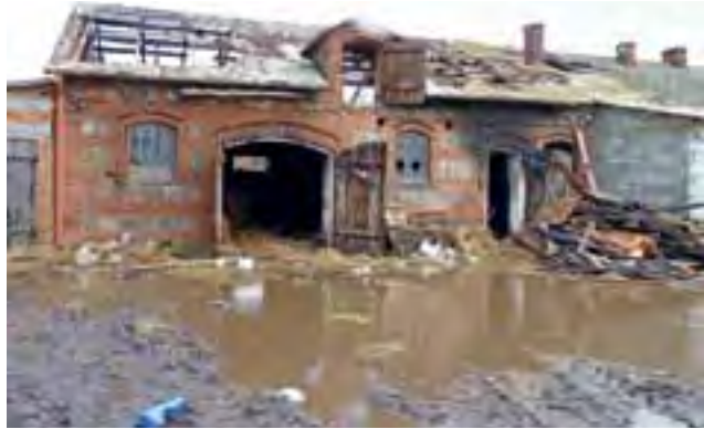
Dzięki szybkiej reakcji sąsiadów, dom udało się uratować.