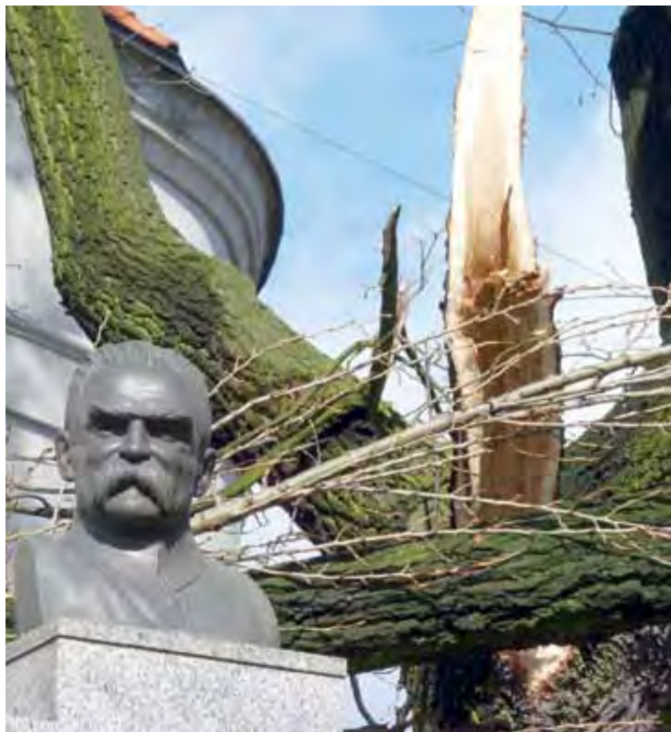
Popiersie Józefa Piłsudskiego ocalało niemal cudem, gdy podczas wichury, w minioną sobotę runęła na niego jedna z topól rosnących przy pomniku. Więcej – str. 2.