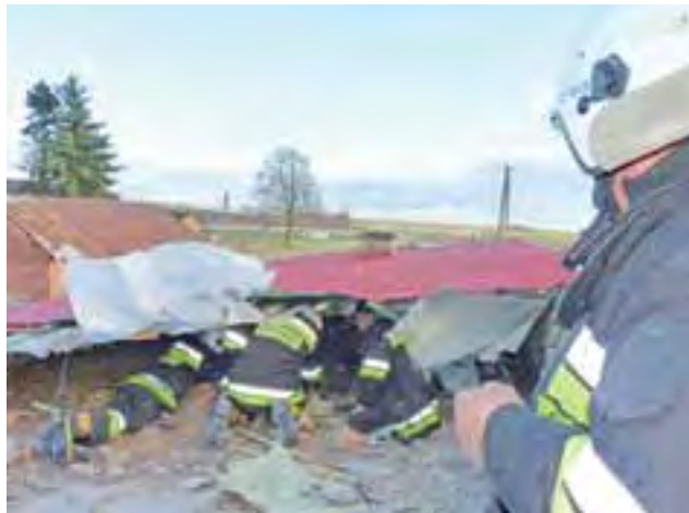
Strażacy zabezpieczyli tę część dachu, która pozostała na budynku, mocując drutem jego konstrukcję do sklepienia. W tym celu musieli wczłapać się pod nią.

Gdy strażacy przybyli na miejsce, oderwana połać dachu zwiślała z budynku, opierając się jedną częścią na ziemi. Działania druhów polegały na odcięciu tego elementu i ułożeniu go na podłożu. Następnie weszli na dach, by zabezpieczyć pozostałą część konstrukcji dachowej przed działaniem wiatru. Po zerwaniu jednej części dachu powstał korytarz pod częścią, która pozostała. Podmuch wiatru od tej strony mógł ją poderwać. Strażacy przymocowali krokwie drutem do podłoża, by ustabilizować konstrukcję.