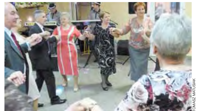
Jeden z wielu wspólnych tańców podczas gminnego dnia seniora.

– Takie przeżycia jak dzisiejszy koncert wpływają na moje samopoczucie lepiej niż dwa lata brania leków – mówił on w rozmowie z nami. – Mam wielkie słowa uznania dla artystki, która dla nas śpiewała, bo choć na co dzień nie słucham oper ani operetek, to mnie urzekła, a przy tym, choć jest bardzo młoda, potrafiła do nas dotrzeć, zachowywała się z wielką klasą. Do samego klubu się przywiązałem, bo jest tu świetna atmosfera, wszyscy są bardzo życzliwi, nikt się nie wynosi, nie wywyższa. tm