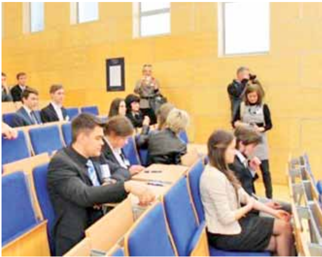
Pisemna część finału IV Ogólnopolskiego Konkursu Wiedzy o Podatkach.