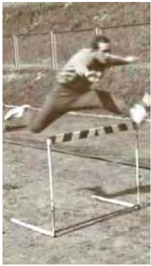
Na treningu. Podczas biegu przez płotki.