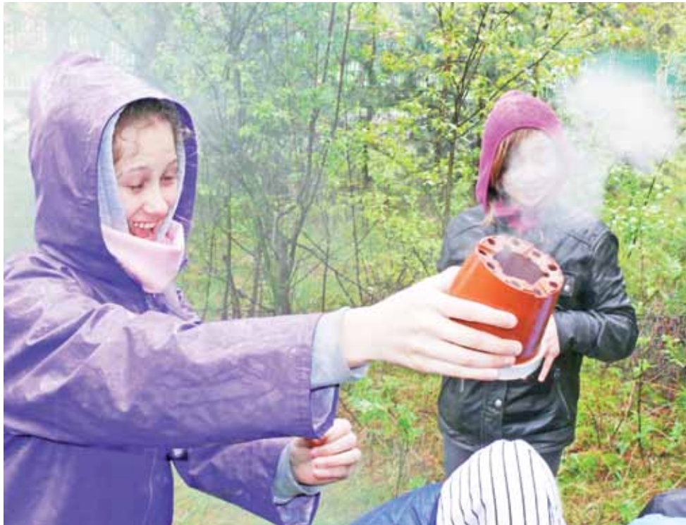
Strzelanie z armaty dymnej (w roli armaty plastikowa doniczka) okazało się w sobotę dość trudne, cały dzień padał deszcz, zmoczył on harcerzy i dawał ogień w ognisku.