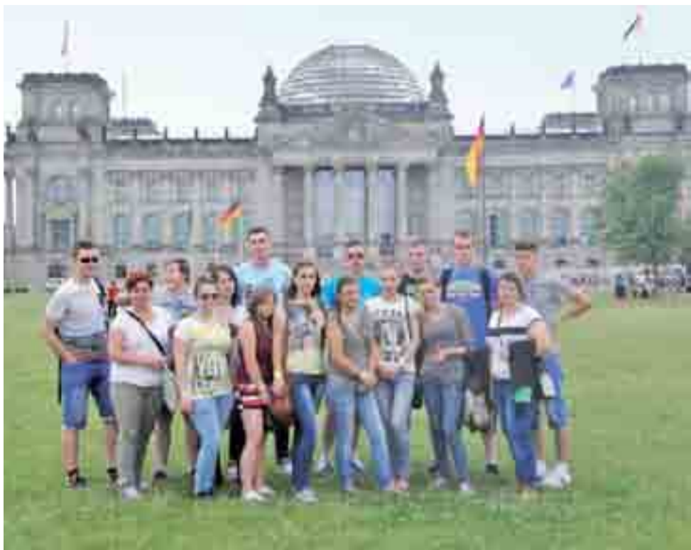
Stażyści i ich opiekunowie przed budynkiem Bundestagu.