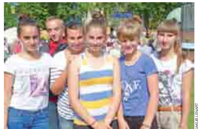
Młodzi pielgrzymi z Dmosina na placu przed sanktuarium.