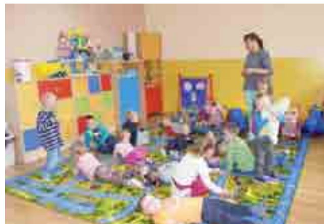
Po pysznym obiedzie grupa 3 i 4-latków odbywała sjęstę na nowej wykładzinie.