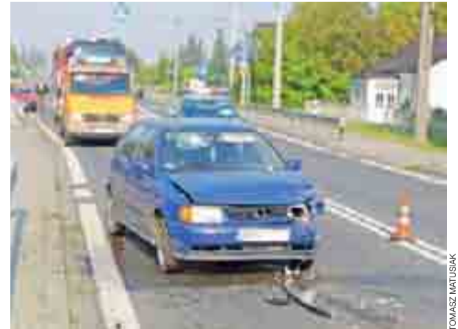
Uszkodzony Volkswagen Polo na miejscu kolizji.

Opuściła ona samochód o własnych siłach, ale uskarża-