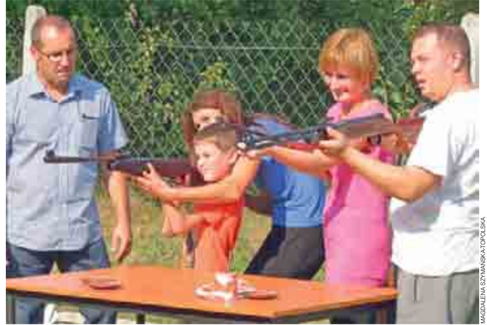
Strzelanie z wiatrówek było konkurencją zespołową, wiek uczestników nie miał znaczenia.

Gmina Bolimów | Zawody Turnieju Wsi w plenerze