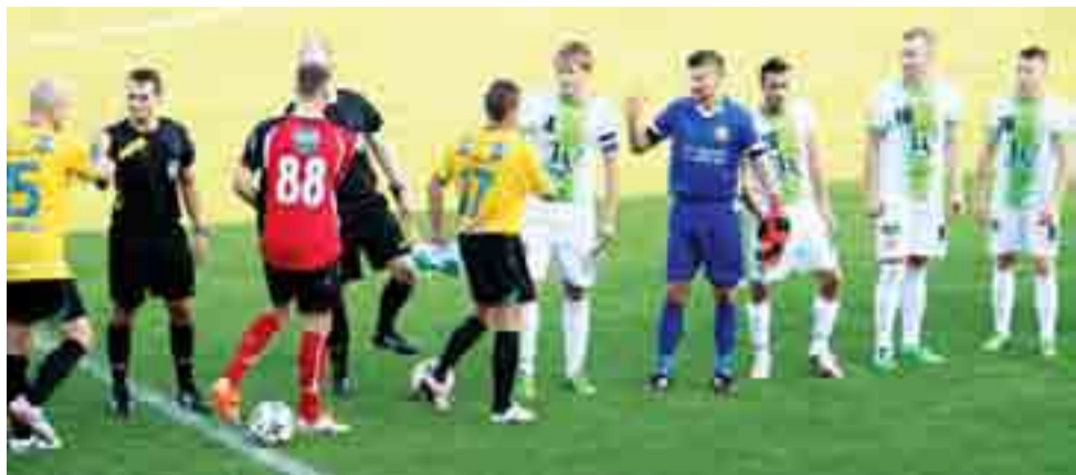
Łowiczanie po raz drugi w tym sezonie mierzyli się z Lechią Tomaszów Mazowiecki.