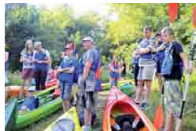
Uczestnicy spływu przygotowują się do wodowania.