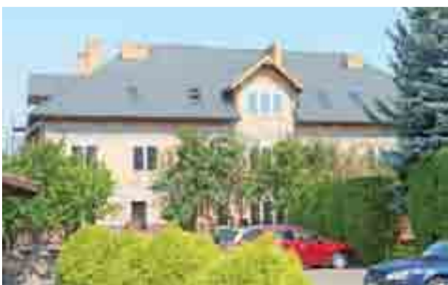
Blaszany dach widać już na poprzecznej części Domu Pogodnej Starości.