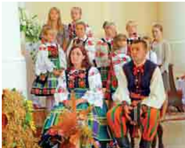
Na mszę św. w Bąkowie wiele osób przyszło w łowickich strojach.