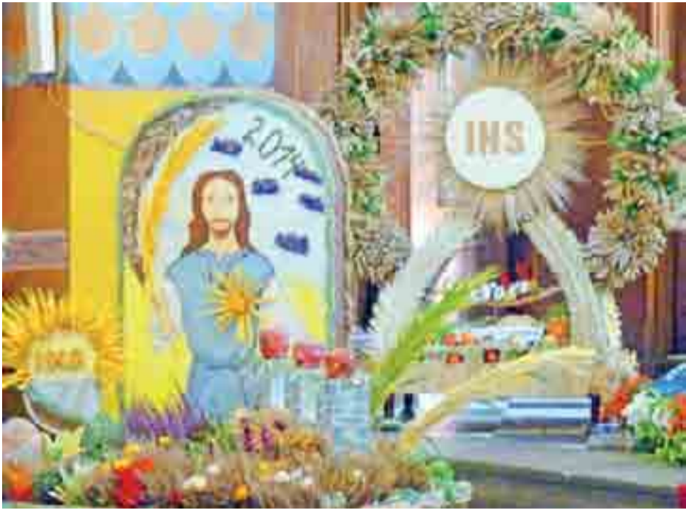
Wieńce dożynkowe wymagają od ich twórców pomysłowości, czasu i cierpliwości. Są one wyrazem wdzięczności rolników za zebrane plony. Na zdjęciu wieńce z Przemysłowa, a za nim – ze Złakowa Borowego.