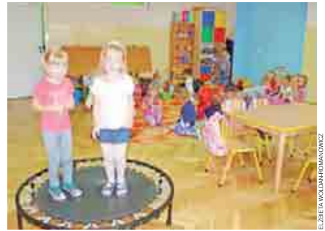
Przedszkole po przeprowadzce. W zerówce pięcioletków zmieściła się nawet trampolina.

W nowej lokalizacji każda z czterech grup zyskała własną przestronną salę, wyposażoną w meble, zabawki i pomoce dydaktyczne. W sali „zerówki” dla pięcioletków znalazło się nawet miejsce na małą trampolinę. Z korytarza wchodzi się do komfortowych łazienek i toalet, które chwała zwłaszcza rodzice maluchów. Przedszkole ma też własną szatnię na parterze, a na piętrze, oprócz sal, znajduje się kuchnia