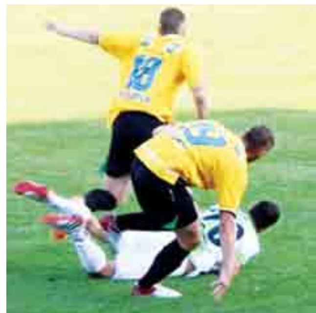
W środkowy mecz łowiczanie włożyli wiele serca i na każdym metrze kwadratowym twardo walczyli o piłkę.