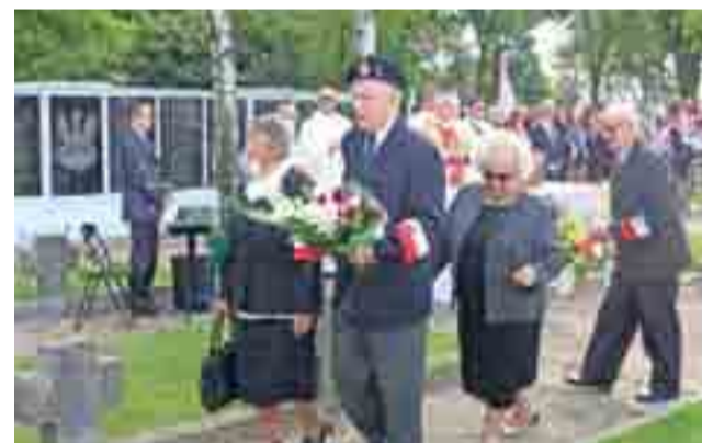
W uroczystościach brali udział przedstawiciele Światowego Związku Żołnierzy Armii Krajowej w Łowiczu.

Po mszy św. na grobach żołnierzy oraz pod tablicami z ich nazwiskami zostały złożone kwiaty oraz ustawione znicze. Natomiast Miejsko-Strażacka Orkiestra Dęta, która grała podczas liturgii, zagrała utwór „Serce w plecaku”. mwk