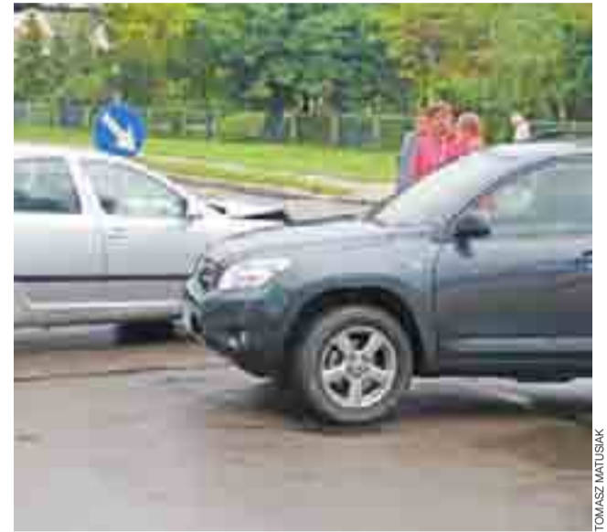
Uszkodzone pojazdy na skrzyżowaniu.

Sprawczyni została ukarana mandatem karnym. – Całe szczęście, że nie jechałyśmy z dziećmi – mówiła nam jedna z uczestniczek kolizji. – Moje jest akurat chore, jechałam je odwiedzić, a druga pani odwiozła swoje wcześniej do szkoły. – Dobrze,