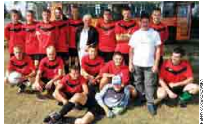
Płomień Piotrowice zaczął ligę od zwycięstwa.

Jak na razie Zarząd Klubu nie przewiduje tu zmian. Może będziemy się starali kogoś pozyskać, aby pomagał, ale na dzień dzisiejszy większość środków będzie przeznaczona na pozyskanie nowych zawodników, aby podnieść poziom sportowy drużyny, która będzie rywalizowała, mam nadzieję, o awans do I ligi. ■