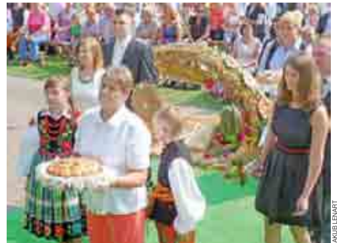
Dary do ołtarza niosą przedstawiciele Strzebieszewa.

na pójście w pielgrzymce, żeby odwiedzić to sanktuarium – powiedział nam pątnik. – Ta wyprawa daje mi naładowanie na następny rok. Jest to takie duchowe wsparcie dla siebie samego i mojej rodziny.