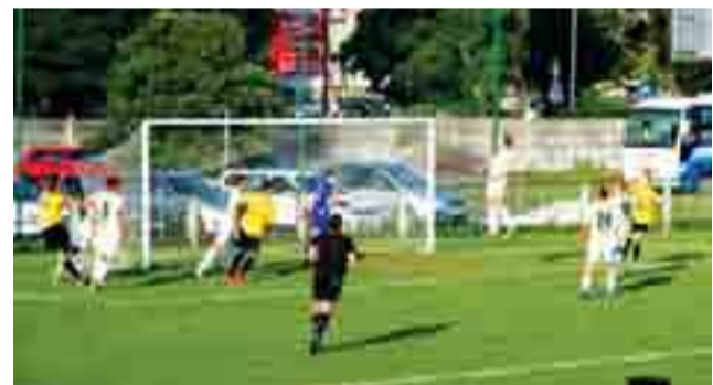
Łowiczanie przeciwko Lechii wykonywali sporo rzutów różnych i wolnych, ale nie przyniosły one żadnej bramki.