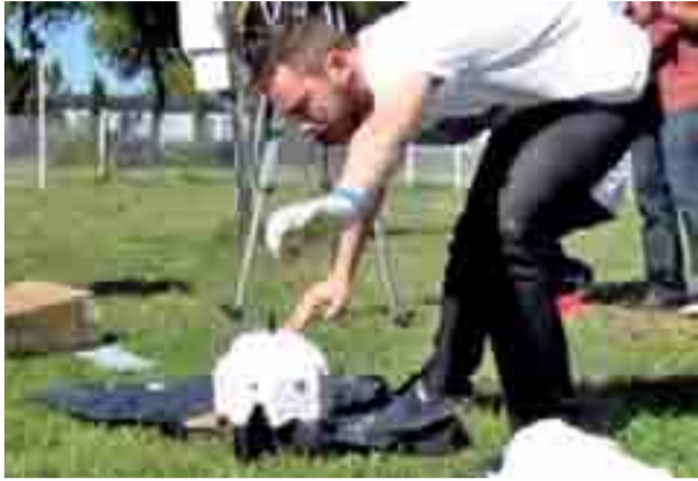
Ten mały kulisty przedmiot na murawie to właśnie sonda Inter Galileo. Na zdjęciu tuż przed startem.