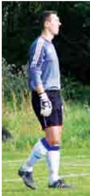
Bramkarz Zrywu tylko raz skapitułował w Bolimowie.