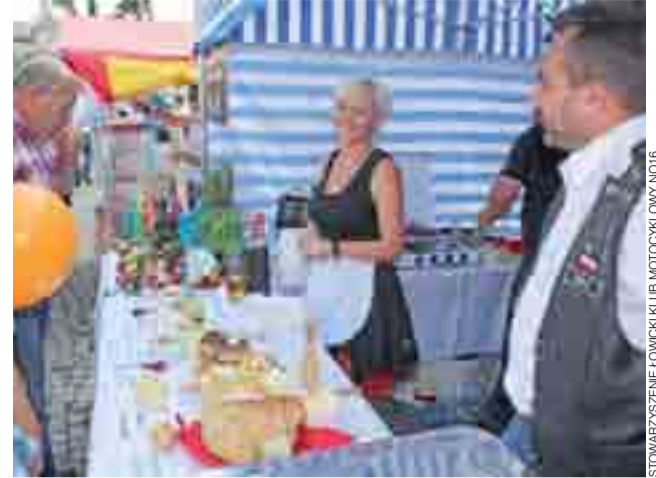
Stoisko motocyklistów cieszyło się bardzo dużym zainteresowaniem.

W tej rubryce zamieszczamy fotografie noworodków, które w dniach poprzedzających wydanie tego numeru naszego tygodnika urodziły się w szpitalu w Łowiczu, wraz z datą i godziną tej szczęśliwej dla rodziców chwili. Dziękujemy rodzicom, którzy zgodzili się na publikację zdjęcia, życzymy dużo radości z powiększenia rodziny. Każde nowo narodzone dziecko witamy serdecznie w naszej lokalnej społeczności. Jeśli Wasze dziecko urodziło się w tych dniach w jakimś innym szpitalu – prosimy, podzielcie się z nami fotografią i dane – także z chęcią je zamieścimy. Redakcja