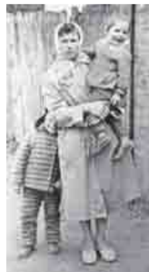
Młodość w Poznaniu.