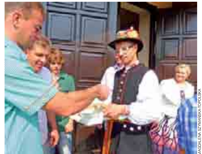
Na Korabce parafianie częstowani byli chlebem i miodem.