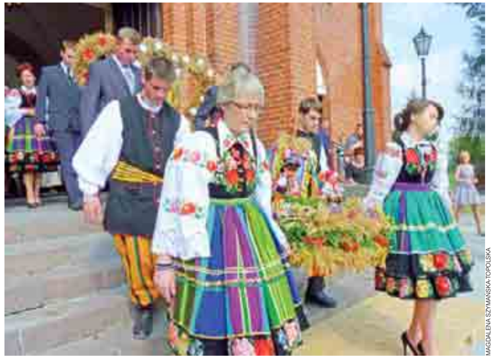
Barwne procesje dożynkowe są wyrazem wiary w obecność Jezusa w Najświętszym Sakramencie. Na zdjęciu procesja dożynkowa po mszy św. w kościele parafialnym w Bąkowie.

Zwyczaj i obrzędy | W podziękowaniu za udane żniwa