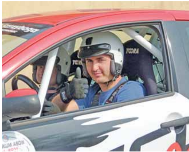
Warszawska załoga łyszkowickiego rajdu na starcie trzeciej rundy.