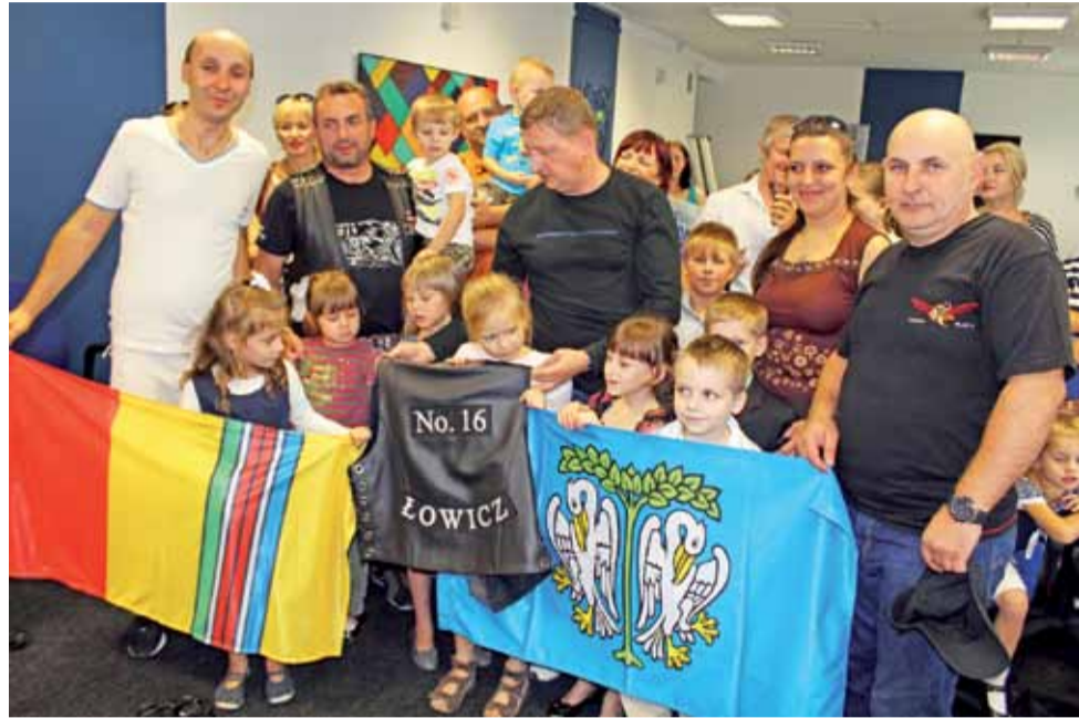
Członkowie łowickiego klubu motocyklowego (ubrani na czarno) na pamiątkowej fotografii, wspólnie z dziećmi, ich rodzicami i opiekunami na spotkaniu w Kijowie.