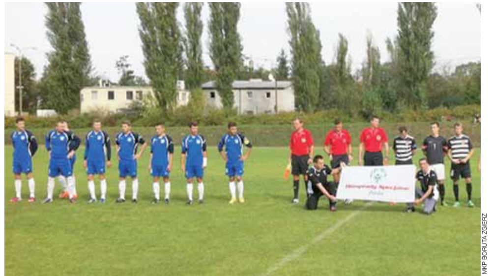
Orzeł (niebieskie stroje) nie zdołał zdobyć choćby punktu w starciu z Borutą.

W 6. kolejce okręgowki, 20-21 września zagrają: sobota: Laktoza – Czarni (16:00), Korona – Mazovia (16:00), niedziela: Vagat – Jezów (11:00), Pogoń – Orleńta (15:00), Juvenia – Jutrzenka (15:00), Chaśno – Macovia (16:00), Pelikan II – Stupia (16:00)