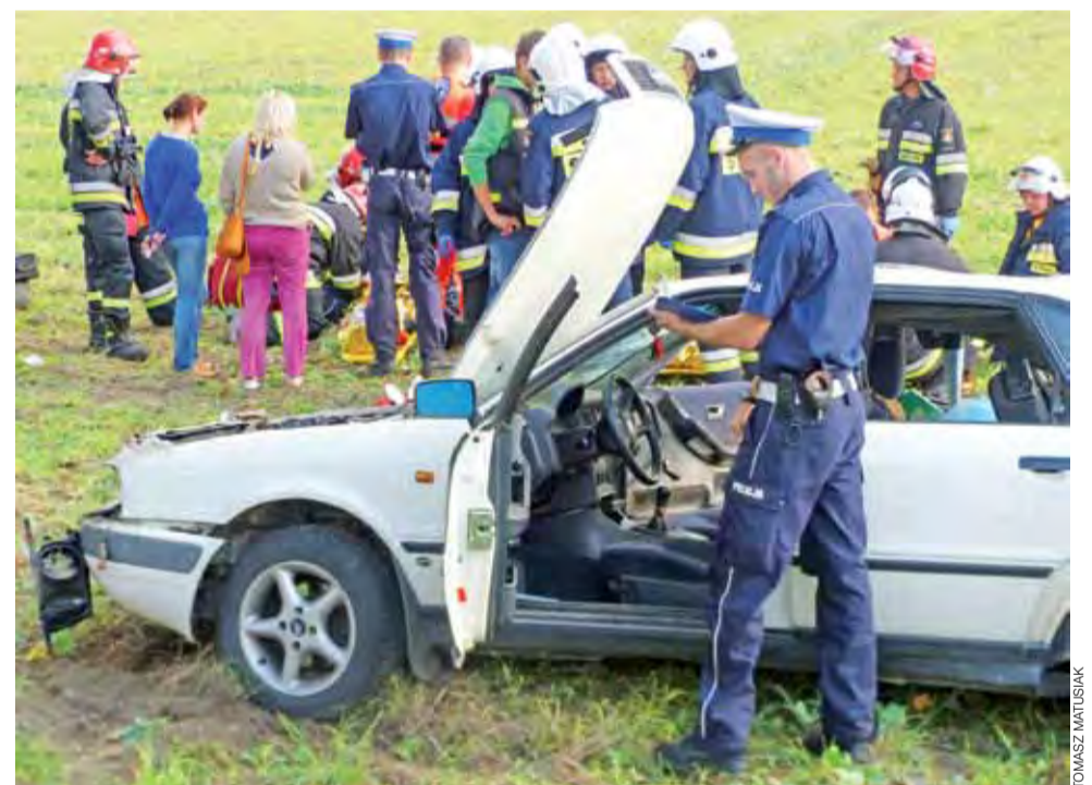
Policjant wykonuje czynności służbowe przy zniszczonym samochodzie. Na dalszym planie – ratownicy medyczni udzielają pomocy poszkodowanym.

Niedługo później kobieta została znaleziona na łące niedaleko Kauflandu, niestety była martwa. Policja prowadzi w tej sprawie postępowanie pod nadzorem Prokuratury Rejonowej w Łowiczu. mak