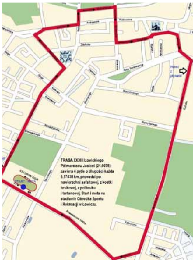
Nowa trasa łowickiego półmaratonu.

To ogromne urozmaicenie, bo do tej pory trasa omijała najładniejsze miejsca naszego miasta.