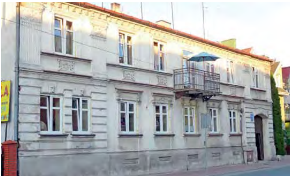
Kamienica przy ul. Długiej posiada jedną w swoim rodzaju sztukaterię na ścianie frontowej, w trakcie remontu nie tylko dach ale i one zostaną odremontowane.