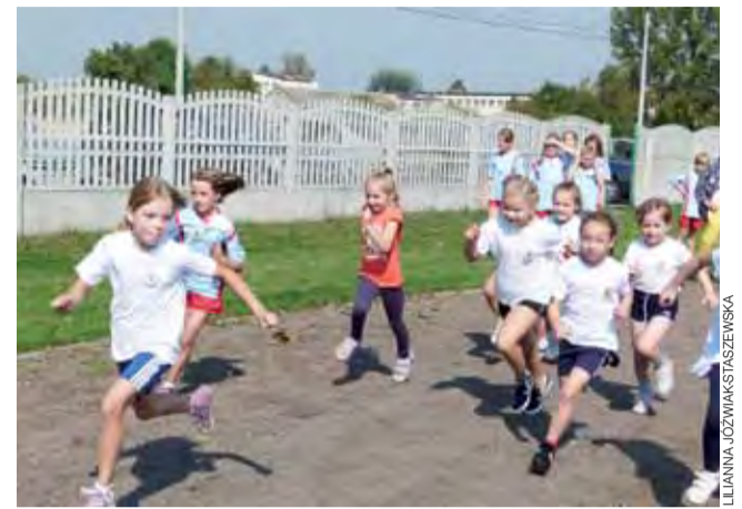
Dziewczeta z najmłodszej grupy wiekowej biegną na dystansie 100 m.

W tegorocznym X Ułańskim Biegu Szkół Podstawowych wystartowali uczniowie pięciu szkół z: Rydzyny, Oszkovic,