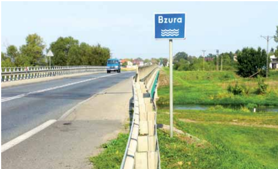
Do tego miejsca na moście, które wygląda jak chodnik, ale faktycznie jest tylko poboczem, z parku Błonie nie da się dojść bezpiecznie i legalnie.