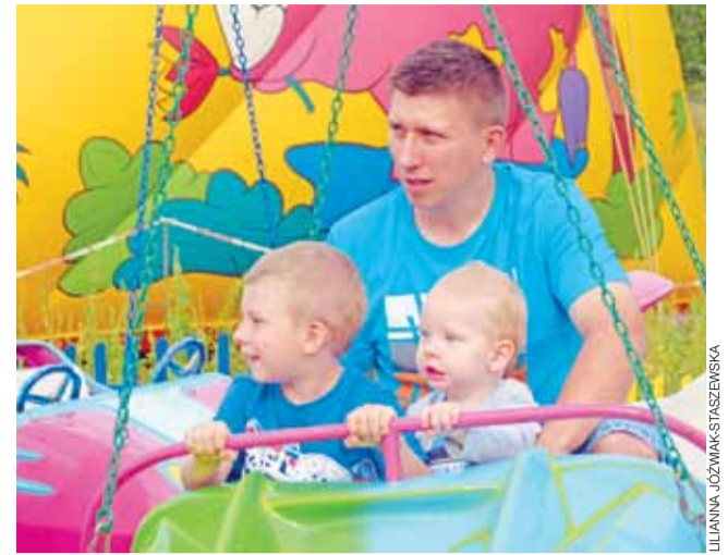
Impreza była okazją do spędzenia bezstreskich chwil z pociechami.

Tegoroczny rallysprint składał się z 4 przejazdów, na których kierowcy m.in. pokonywali ustawioną z opon szykanę, robili rundę między hangarami, wirażowali na autostradowej drodze serwisowej. Nie obyło się bez awarii, błędów i punktów karnych. 3 załogi nie ukończyły zawodów zaliczonych na trasie awarii. Błędy przytrafiły się nawet najbardziej doświadczonym rajdowcom. – Jesteśmy na razie na półmetku. Niestety na pierwszym przejeździe uderzyliśmy w szykanę, ściągnęło samochód na jedną stronę, zablokowało nam koło. Drugi przejazd z był już w miarę czysty, udało nam się poprawić czas o 21 sekund – mówił zawodowy kierowca