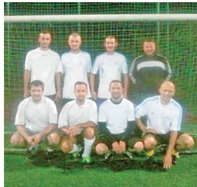
Puchar Wójta zdobyła ekipa Husqvarny.