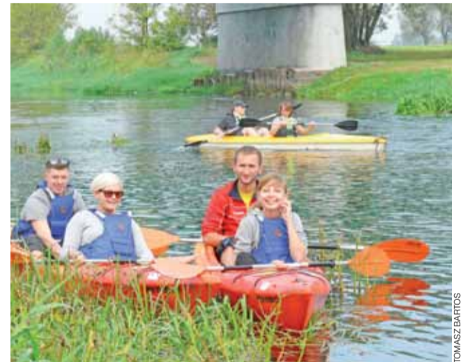
W tym roku po raz pierwszy oprócz w ramach rajdu śladem walk Dziesiątki, do Kompiny spłynęła z Łowicza 51 osobowa grupa kajakarzy.