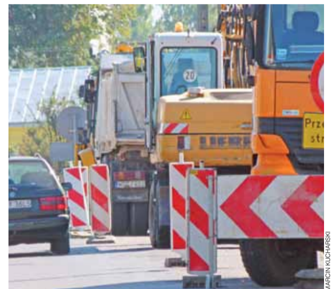
Ruch na ul. Sokołowskiej w Bolimowie odbywa się z utrudnieniami.

Remont ulicy był odkładany z uwagi na znaczny koszt przez kilka lat. Była ona wielokrotnie łataną, ale po deszczach i tak zale-