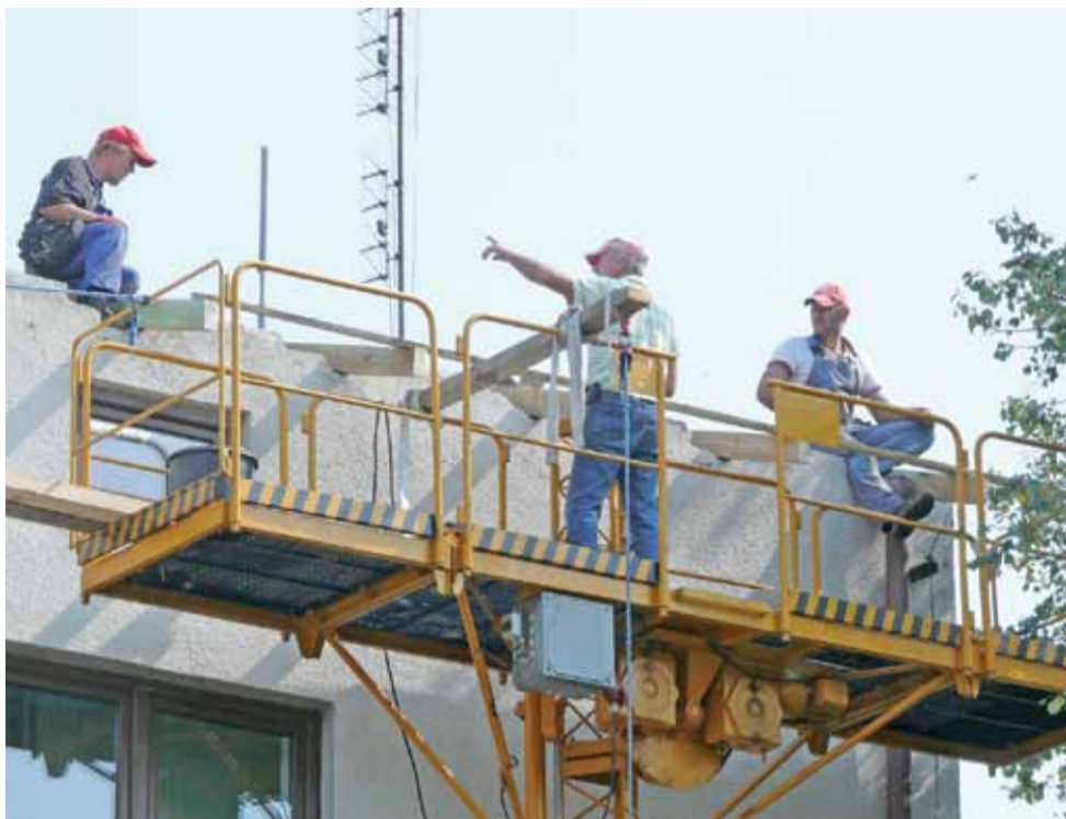
Pracownicy firmy wykonującej remont dachu mieli m.in. za zadanie wydłużyć jego długość po za krawędź muru.