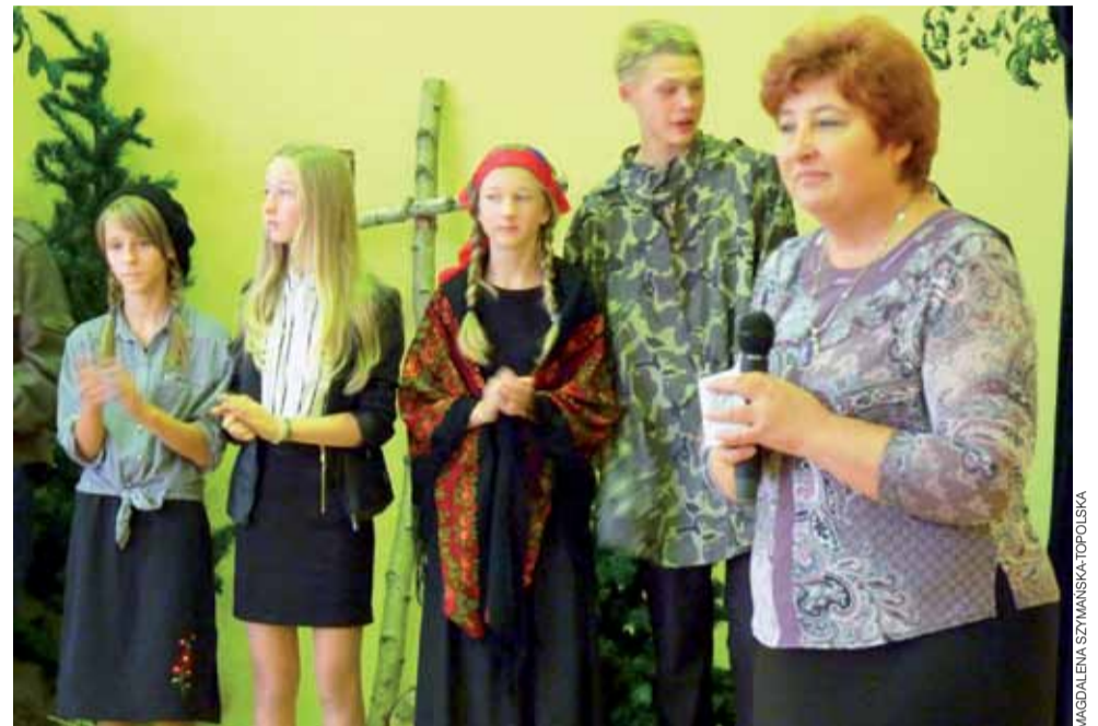
Uczniowie w sali gimnastycznej zaprezentowali inscenizację, w której fabułę wplecione zostały autentyczne losy bohaterów września 1939 roku.