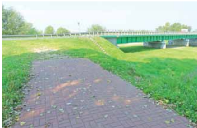
Ścieżka pieszo-rowerowa kończy się przed mostem na drodze krajowej nr 14. Jednak przed barierkami i na wale widać, że dużo osób chce iść dalej.

Pytanie to zadaliśmy Maciejowi Zalewskiemu, rzecznikowi GDDKiA w Łodzi. Ten odpo-