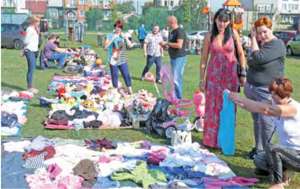
W sobotę 13 września od godz. 10 do godz. 14. na os. Górki trwała wyprzedaż garażowa - około 20 osób skorzystało, aby odsprzedać używane rzeczy.