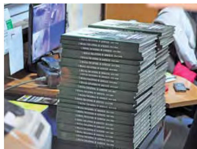
Po spotkaniu sprzedanych zostało w ciągu kilkunastu minut aż 161 książek.