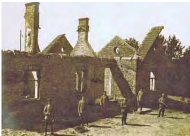
Zniszczony dworzec Łowicz Kaliski (dziś: Przedmieście).