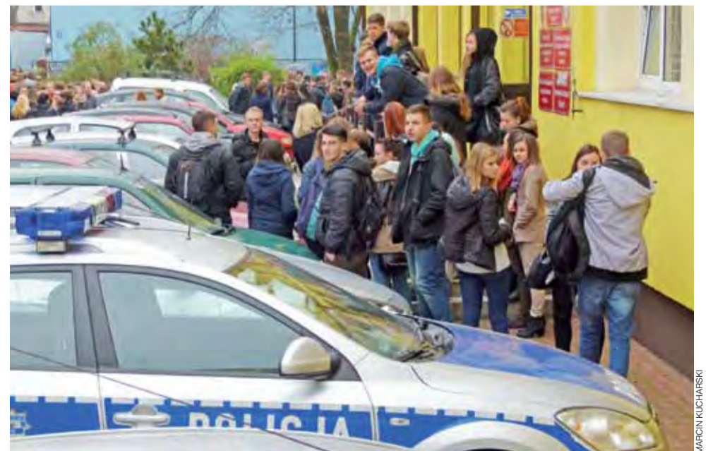
Ewakuacja II LO została przeprowadzona tak sprawnie, że niektórzy uczniowie zorientowali się, że nie są to ćwiczenia dopiero po jakimś czasie.

– Ogólnie paniki nie ma, może przez moment po ewaku-