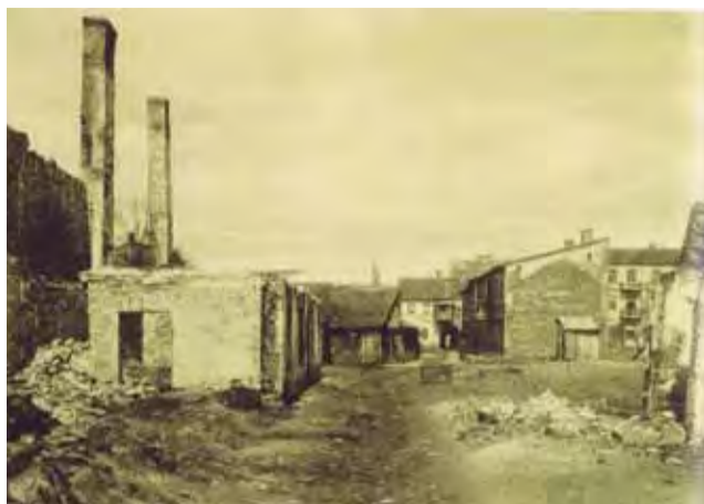
Ruiny zabudowań między Zduńską a Podrzeczną, okres I wojny światowej.