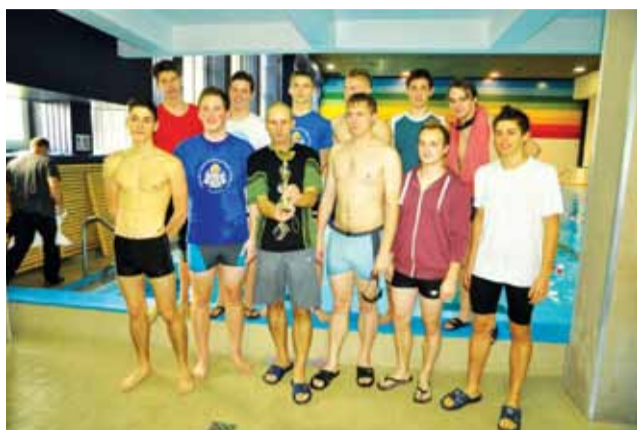
Sztafeta Pijarskiej z pucharem z pierwszego miejsca.

Trampkarze efektownie zakończyli jesień. str. 37