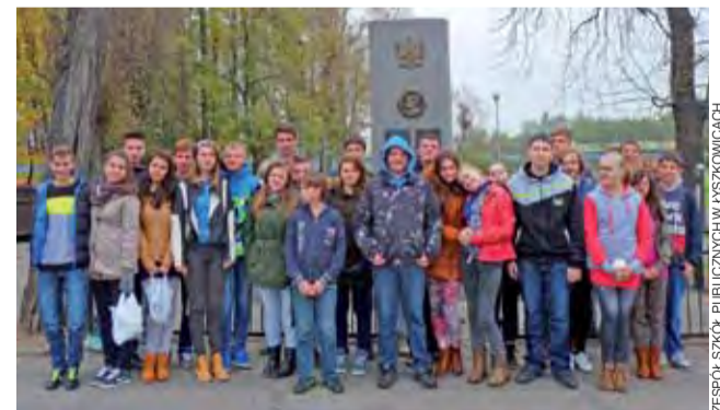
Grupa uczniów pod pomnikiem poległych w czasie wojny o granice II RP – bohaterów gminy.