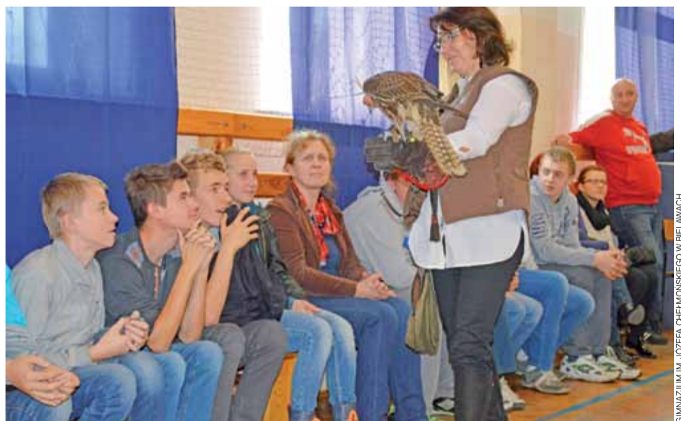
Poznajcie jastrzębia – pokaz drapieżnych ptaków w Gimnazjum w Bielawach.

Spotkanie to było ciekawą lekcją interdyscyplinarną, podczas której poruszono zagadnienia z różnych przedmiotów: historii, języka polskiego, biologii i fizyki. oprac. ewr