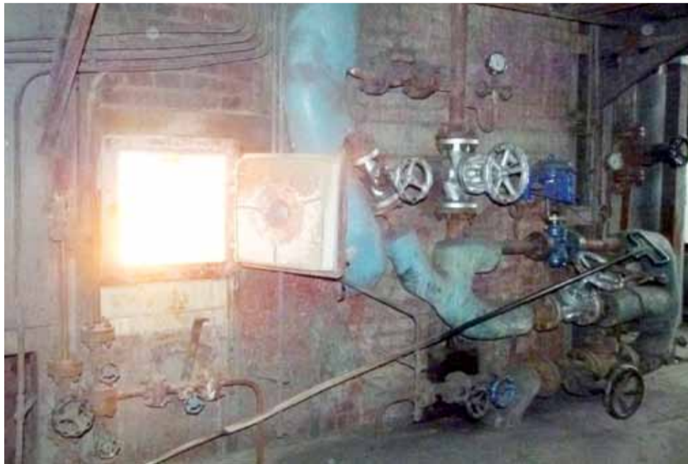
Palenisko jednego z kilkunastometrowej wysokości kotłów w kotłowni S1 przy Syntexie.

Jak poważny ma być to remont? Otóż bardzo. System kotłów w tej kotłowni jest wysokości około 3-piętrowego budynku i... trzeba go prawie w całości rozebrać, zmodernizować i uruchomić na nowo. Wymiany wymaga cały tzw. pokład rusztowy – czyli, obrazowo mówiąc, miejsce z gąsienicą, po której podawany jest miał węglowy i jest spalany. Remontu wymagają też tzw. strefy nadmuchu, dzięki którym do miału węglowego jest nadmuchiwane powietrze, by ten mógł się spalać. Co najmniej do częściowej wymiany zakwalifikowany jest tzw. „walczak”, w którym podgrzewana jest woda. – To miejsce, w którym jest blacha o nawet kilkumilimetrowej grubości. Po rozebraniu części kotła będziemy dopiero mogli sprawdzić, czy potrzebny jest remont,