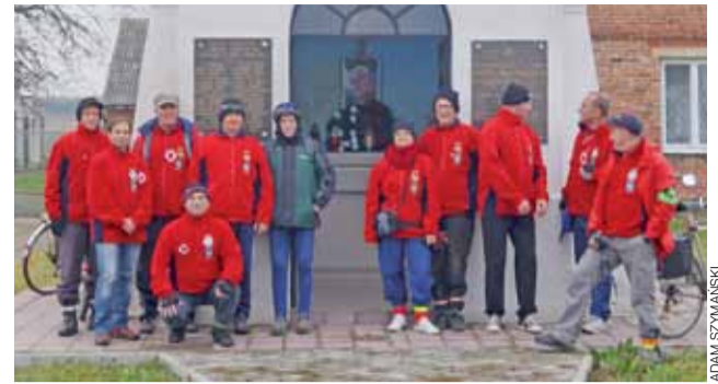
Turyści z łowickiego oddziału PTTK, pod kapliczką w Julianowie.