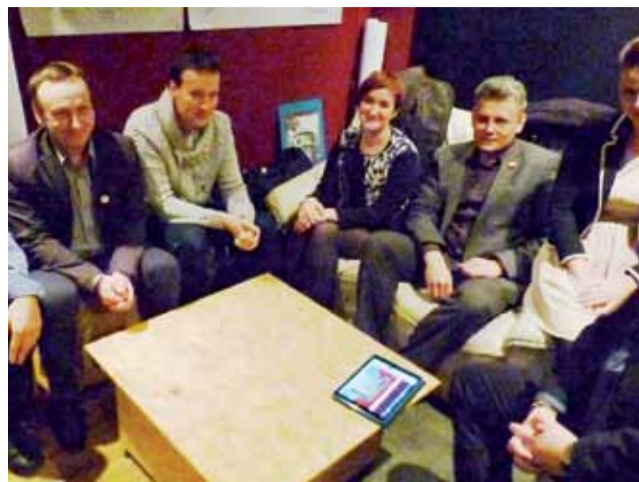
Wieczór wyborczy w Projekcie Łowicz przebiegał spokojnie.