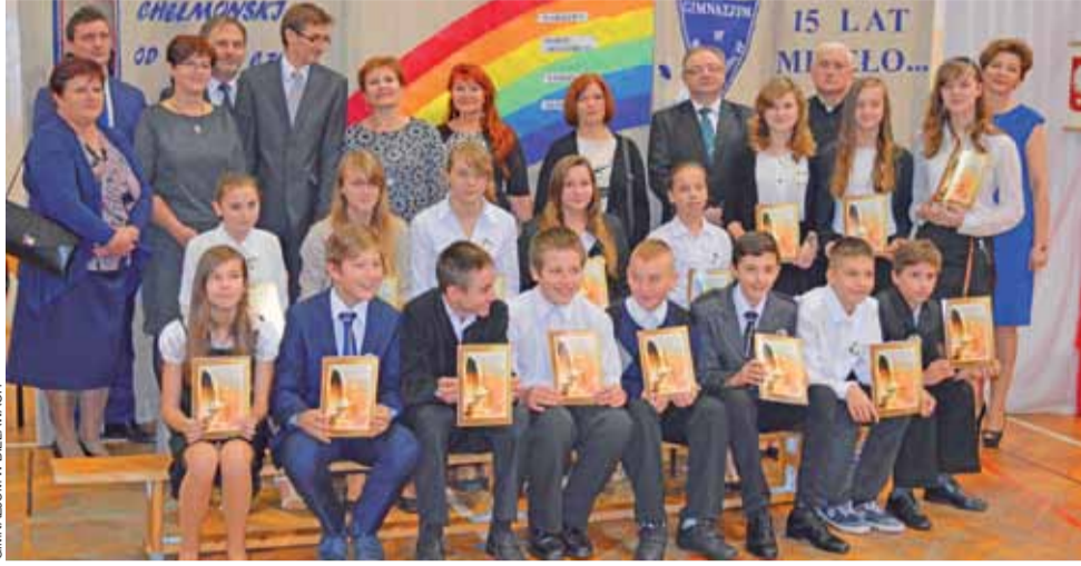
Pierwszaki po ślubowaniu. Wspólne zdjęcie w finale uroczystości w Gimnazjum w Bielawach.