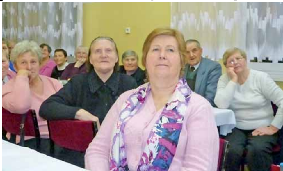
W domaniewickim Dniu Seniora udział wzięło około 230 osób – na widowni i na scenie. Występy Kaliny i młodzieży z gimnazjum zostały bardzo ciepło przyjęte przez gości.

Najpierw było patriotycznie – na scenie wystąpiła młodzież z gimnazjum, która przedstawiała pokaz multimedialny na temat Dnia Niepodległości. Potem było wesoło – młodzież gimnazjalna wystąpiła bowiem w kabaretowej scenie pt. „W poczekalni u lekarza”. Na koniec było na ludowo – przed seniorami wystąpiła „Kalina”, która w tym roku obchodzi 25-lecie swojej działalności. Zespół prezentował swoje umiejętności w strojach z kilku rejonów Polski, poza łowickim był więc folklor opoczyński, rzeszowski i Lachów Sąddeckich z okolic Podgrodzia.