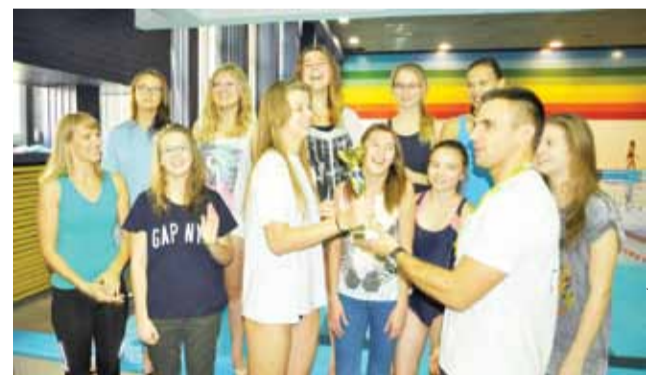
Dziewczyny z Pijarskiej popłynęły najszybciej wśród gimnazjalistek.