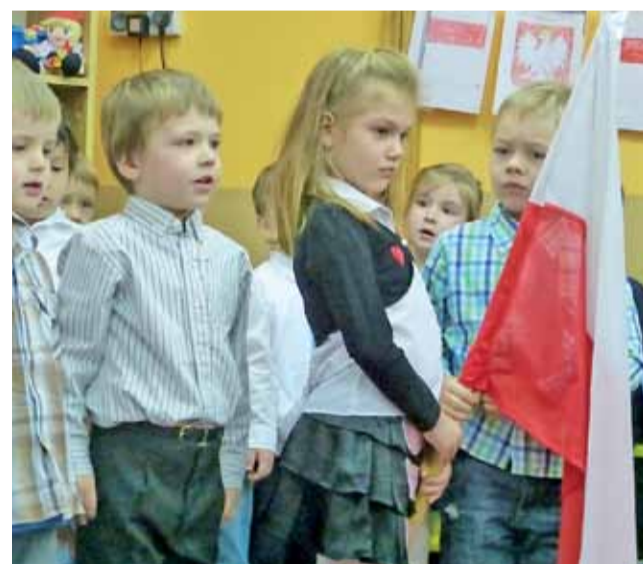
W przedszkolu przy ul. Ułańskiej dzieci od małego uczą się szacunku dla flagi państwowej.