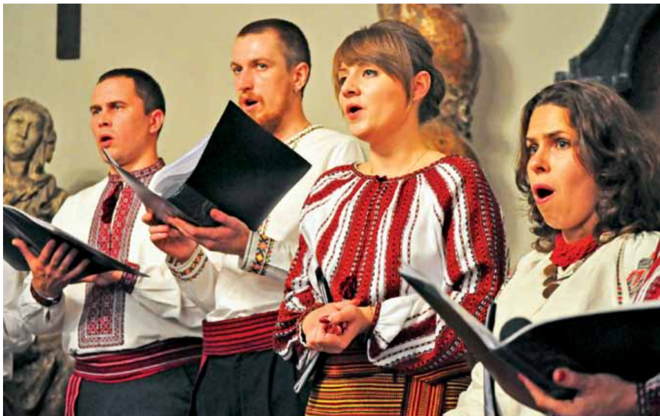
Łwowscy artyści to klasyczni amatorzy, lubiący śpiewać i z chęcią, także strojem, opowiadający o urodzie swego kraju.