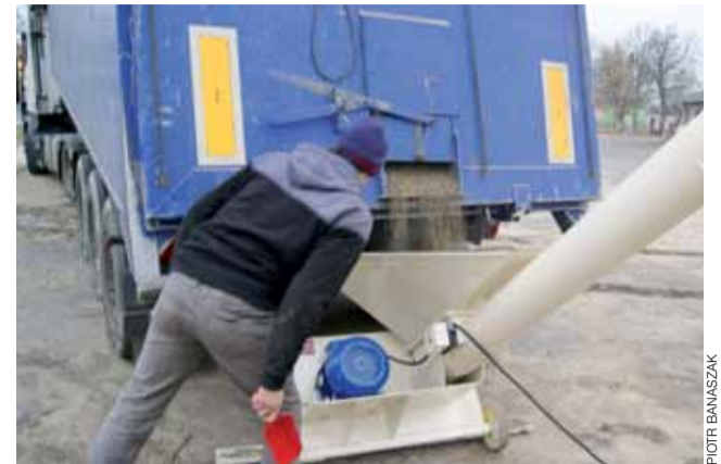
Pobieranie surowców z samochodu transportowego.