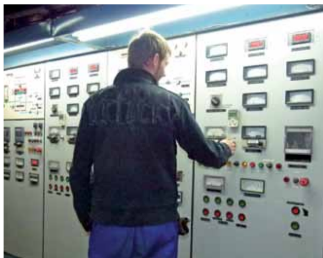
Automatyka kotłowni również zostanie całkowicie wymieniona.

Urządzenie wodociągowe z ujęciem wody w Bobrownikach zaopatruje następujące miejscowości: Bobrowniki, Arkadia, Bobrowniki Osiedle, Dzierżgów, Chyleniec, Michałówek i część wsi Belchów. W sumie korzystają z niej 2692 osoby. tb