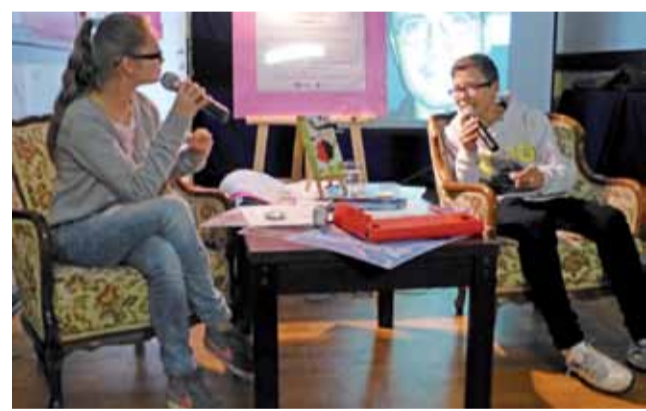
Czy nie lepiej skupić się na tym co tu i teraz? Uczniowie kulturalnie debatują nad sensem poznawania historii.