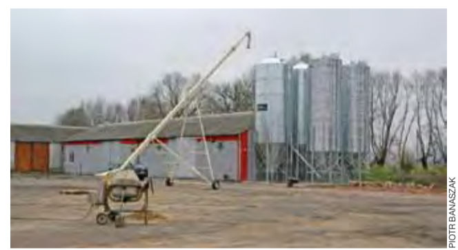
Podajnik ślimakowy umożliwia łatwe pobieranie surowców z silosów.

Głównym założeniem firmy jest sprzedaż, po jak najniższej cenie, surowców paszowych, takich jak np. śruty, wysłodki, DGGs, susze, wywary suszone, a także surowców do żywienia na mokro. Sposobem na niskie ceny jest obniżenie do minimum kosztów transpor-