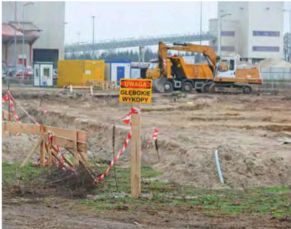
W miejscu gdzie powstanie hala produkcyjna i biura firmy Kapella obecnie widać już wykopy i częściowo wykonane fundamenty.

Sobczak wyjaśnia, że spółka Kapella jest firmą produkcyjną, nastawioną na innowacje w dziedzinie stosowanego oświetlenia. – Opracowane przez nasz dział badawczo-rozwojowy rozwiązania stanowią końcowy efekt synergii pomiędzy ekspertami