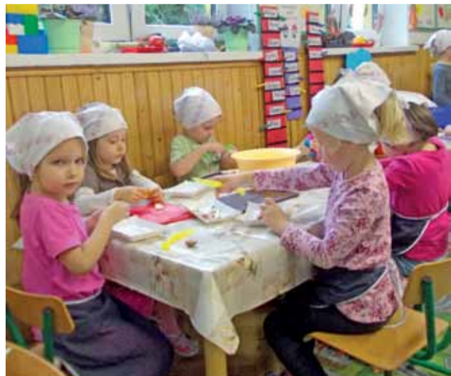
Własnoręcznie wykonane kanapki smakują najlepiej.

Wiosenka jest certyfikowanym przedszkolem promującym zdrowie, w którym dzieci w ramach zorganizowanych zajęć wykonują sałatki, surówki, kanapki, koktajle itp. mak