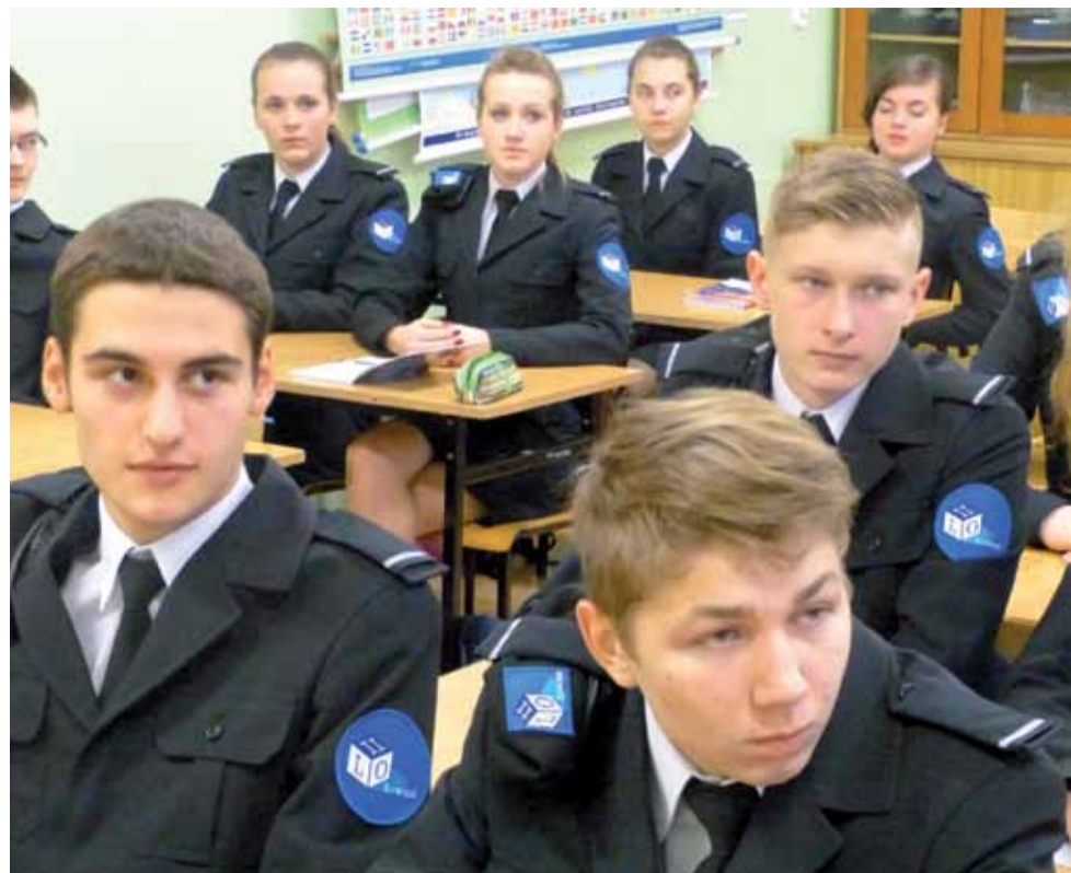
Uczniowie na zajęciach z BHP w pracy strażaka.

Pytaliśmy też uczniów, czy bycie w takiej klasie mobilizuje do trzymania wojskowej dyscypliny także na zwykłych lekcjach. – Może nie jest tak, że