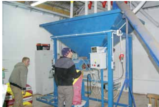
Maszyny nie zrobią wszystkiego same. Potrzebni są też ludzie.

Wszelkie szczegóły wzajemnej współpracy w tej dziedzinie mają być określone w porozumieniu, które w niedługim czasie powinni zawrzeć władze obu gmin. kl