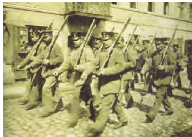
Oddział niemiecki na ul. Zduńskiej, około 1914 r.

Łowicz | Bardzo duże zainteresowanie książką o I wojnie światowej