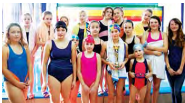
Dziewczyny z SP 1 Łowicz miały powody do zadowolenia.

Sport Szkolny | Powiatowe Mistrzostwa w Sztafetach Pływackich