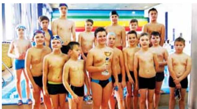
Chłopcy z SP 1 wygrali sztafety pływackie.