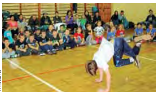
Odbyło się łącznie 10 zajęć, na których dzieci i młodzież uczyły się tańca breakdance.