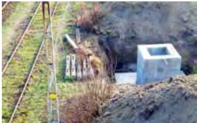
Fundament ma kilka metrów głębokości, ale nie jest to inwestycja bezpośrednio związana z budową wiaduktu.

– Nowy system cyfrowej komunikacji radiowej zastąpi dotychczasową tradycyjną komunikację, do której wykorzystywane są odbiorniki i nadajniki krótkofalowe. Trasa kolejowa przebiegająca przez Łowicz jest jedną z najważniejszych w Polsce i m.in. dlatego jest ona wyposażana w pierwszej kolejności przez PKP Polskie Linie Kolejowe S.A. w nowy system łączności – wyjaśnia Maciej Dutkiewicz z Wydziału Prasowego Biura Komunikacji i Promocji PKP Polskich