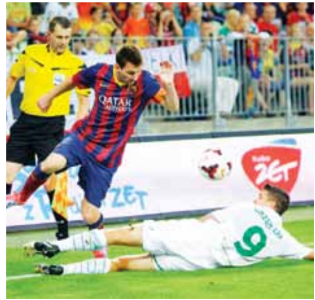
Piotr Grzelczak na zdjęciu w starciu z Leo Messim. W piątek jednego z tych panów będzie można oglądać w Łowiczu!