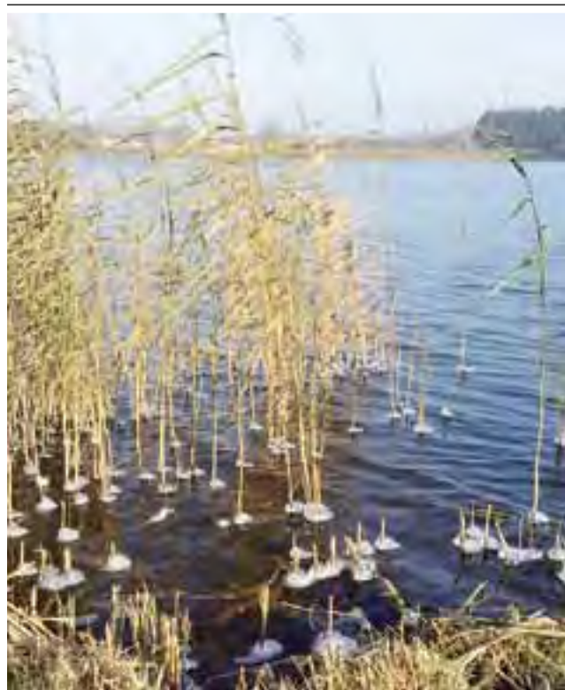
Małe, cylindryczne, z wolną rozszerzające się kawałki lodu, budujące się wokół łodygi trzciny – taki znak zaczynającej się zimy zauważyliśmy w mroźny niedzielny poranek, 30 listopada, na sztucznych zalewiskach pod Ziemiarami w gminie Bolimów. wal