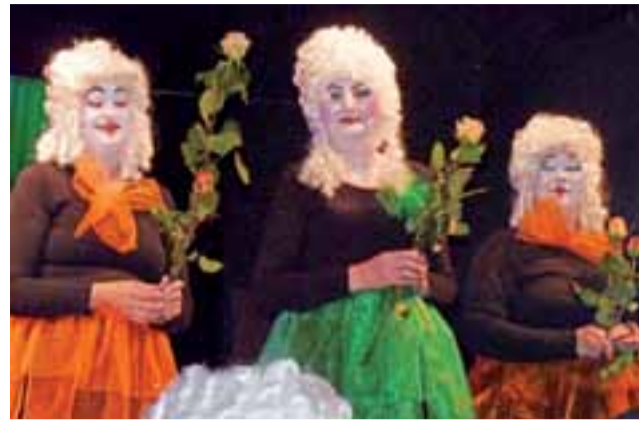
Mocna charakterystyka – jak maska, której się nie zdejmuję. Nawet na koniec przedstawienia.

DLaczego akurat Kopciuszek? Bo chciałam stworzyć klasyczną bajkę, a nie coś inspirowanego bajką, jakich to inscenizacji tworzy się obecnie dużo. Bajka to bajka – powiedziałam sobie. Po drugie: chcieliśmy ofiarować wnukom prezent od babć na mikołajki – a bajka jest dobrym prezentem. Po trzecie: w Kopciuszku jest wiele myśli ważnych dla dorosłych. Wreszcie: Kopciuszek jest bajką, w której większość ról jest kobiecych, a o takie mi chodziło. Nie chciałam, by kobiety musiały grać męskie role. Bardzo chcielibyśmy wystawić tego Kopciuszka jeszcze kilka razy, bo dopiero spektakl zagranym po raz trzeci spełnia oczekiwania wszystkich, w tym aktorów.