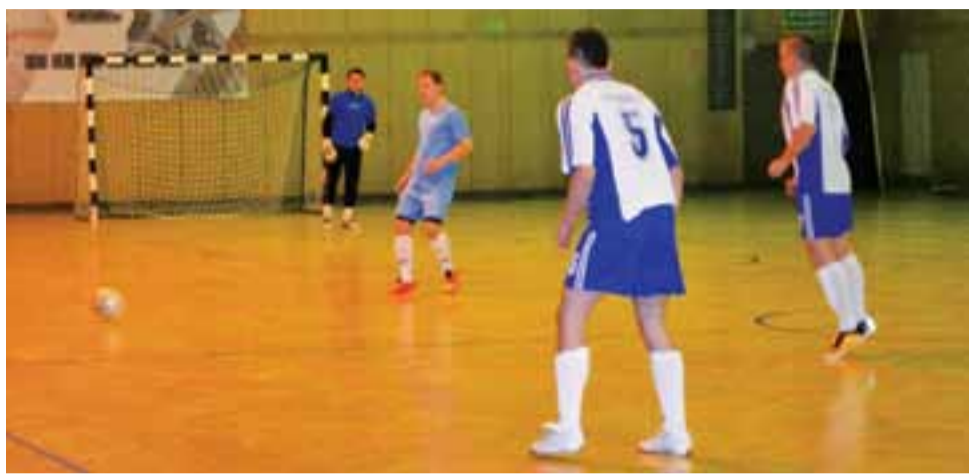
Dotychczasowy lider II ligi SMS Dąbkowice zaskakująco przegrał z MERC-OSP aż 7:4.

Także wysoką wygraną zakończyło się spotkanie Strażaków z Victorią Bielawy. Lepsi w tym meczu okazali się Strażacy, którzy wygrali 5:1. Co ciekawe Victoria po dobrym początku sezonu po raz drugi z rzędu przegrywa