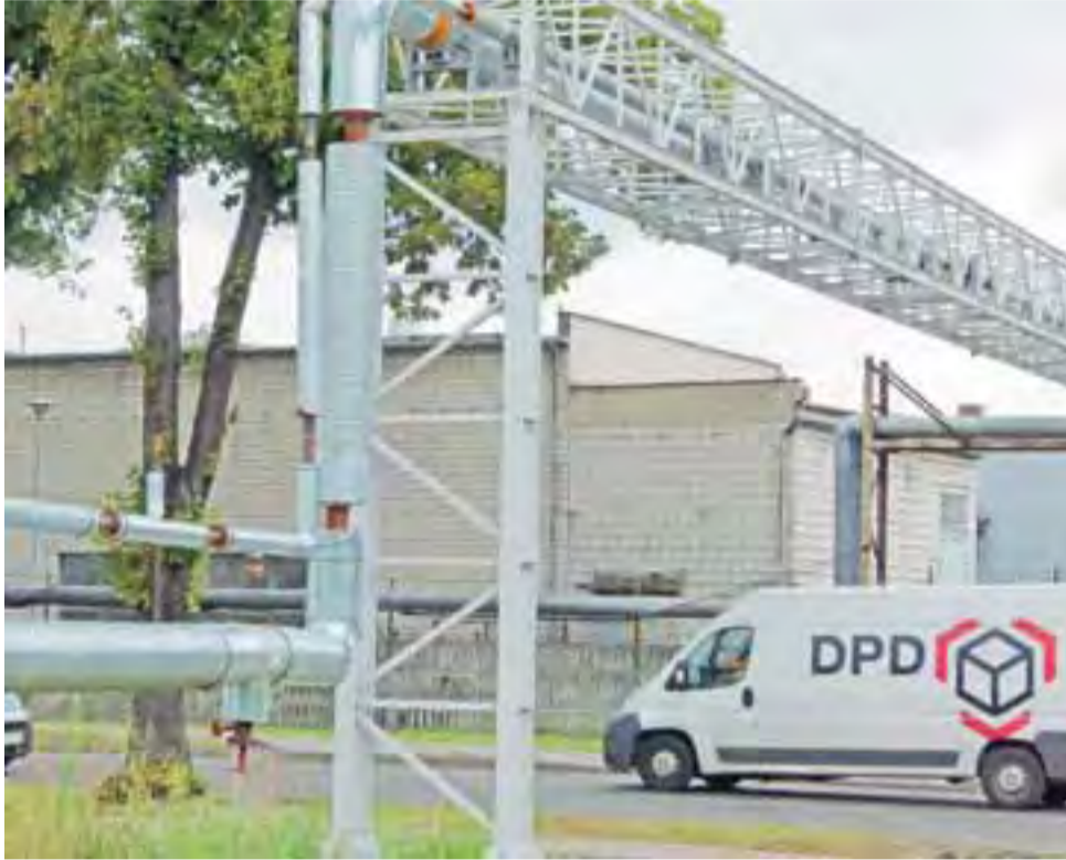
Magistrala ciepłownicza z kotłowni S1 do zakładu Agros Nova w Łowiczu została wybudowana w ubiegłym roku.

Kotłownia S1 przy Syntexie zasilą w energię ciepłą znaczną część miasta, choć tak naprawdę do takich celów nie była projektowana i budowana. Powstała przed ponad 40 laty i miała zaopatrzać w tzw. parę technologiczną przede wszystkim zakład Syntex. Czasy jednak się zmieniły, zakład nie potrzebował aż tyle pary, przy Powstańców powstała stacja wymienników ciepła, w której wyprodukowana w kotłowni S1 para technologiczna podgrzewała wodę, tłoczona ciepłociągami do bloków Łowickiej Spółdzielni Mieszkaniowej. Jeszcze przed kilkoma laty można było zobaczyć charakterystyczny ciepłociąg m.in. wzdłuż ulicy Powstańców – za plotem Ośrodka Sportu i Rekreacji. Cały czas można go też obejrzeć wzdłuż ul. Sikorskie-