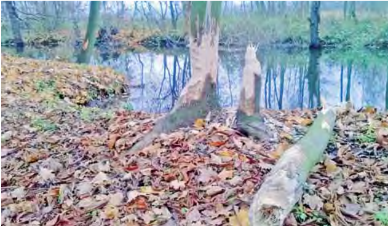
Ślady pracy bobrów są widoczne gołym okiem.

Nie ograniczają się do bytowania i żerowania w najbliższym otoczeniu rzeki. Jak mówi Zatorska, w nocy przechodzą przez groble, dochodzą do stawu, wpływają do niego i penetrują nawet wyspę na nim, położoną naprzeciw świątyni Diany. – Rano znajdujemy ślady przez nie wydeptane, nie je-