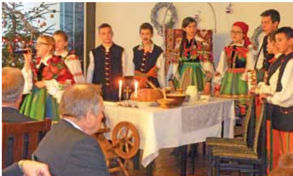
Wszystkie występujące dzieci były ubrane w stroje ludowe.