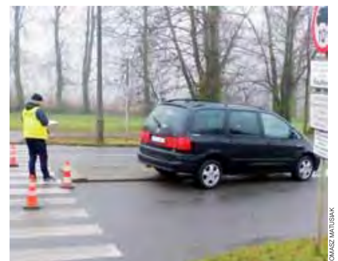
Samochód na miejscu zdarzenia. Potrącony został już wcześniej zabrany do szpitala.

W wyniku uderzenia mężczyzna doznał obrażeń ciała. Przez cały czas pozostawał jednak przytomny. Chciał nawet wstać z jezdni o własnych siłach, ale sprawczyńi kolizji i inne osoby,