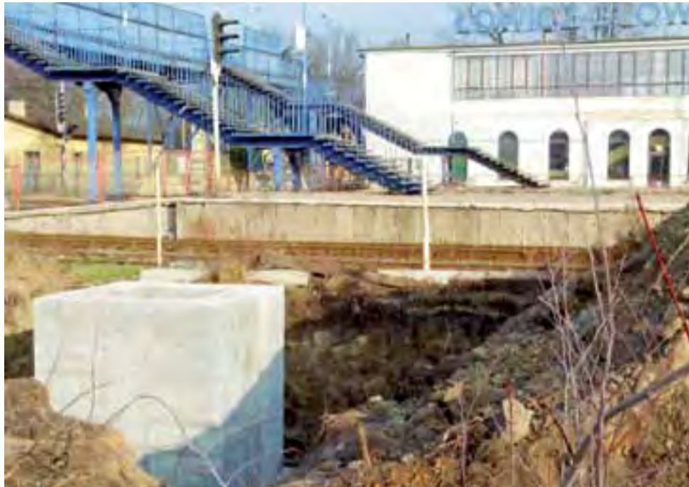
Jeden z masztów systemu GSM-R stanie nieopodal kładki – przejścia dla pasażerów nad torami przy dworcu Łowicz Główny.