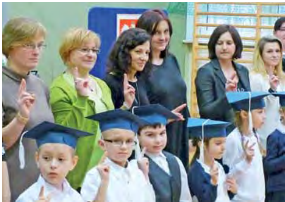
Ślubowanie złożyło 14 pierwszaków wraz z rodzicami.

Mastki | Dzień patrona w szkole podstawowej