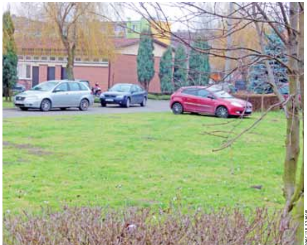
Plac zabaw i siłownia plenerowa powstaną na wolnym pasie zieleni wzdłuż budynków szkoły na Bratkowicach.

Na Korabce przebudowana będzie nawierzchnia na ul. Dolnej (119+96), która wygrała z budową nawierzchni na drodze osiedlowej pomiędzy blokami 43F i 43H oraz wspomnianą budową ul. Blich – fragmentu za ul. Zamkową. Na tę ostatnią inwestycję oddanych zostało ponad 380 głosów z wykorzystania