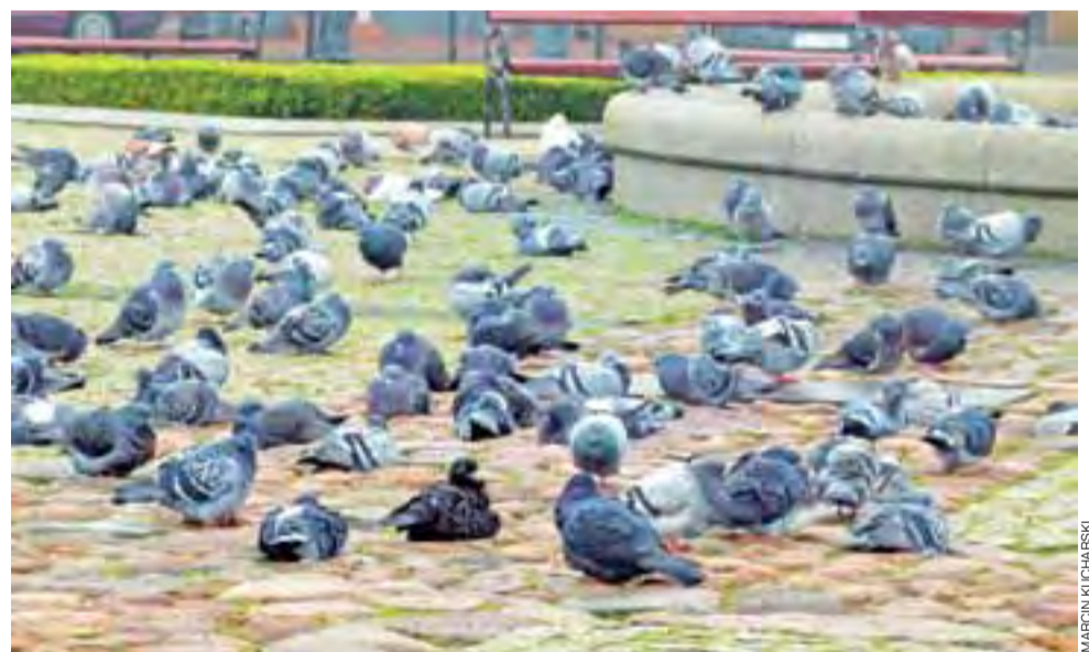
Nawet kilkaset gołębi można zobaczyć w pobliżu nieczynnej w sezonie jesiennym i zimowym fontanny na Nowym Rynku w Łowiczu. Gołębie można zaobserwować głównie w godzinach porannych, kiedy do ruchu pieszych jest mniejszy niż zazwyczaj. mak

RZUT OKIEM | MNÓSTWO GOŁĘBI NA NOWYM RYNKU