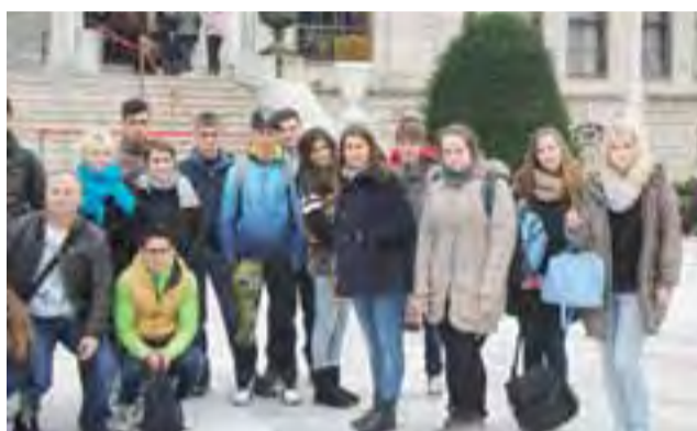
Opiekunki i uczniowie Pijarskich Szkół Pokoju razem ze znajomymi z innych krajów, biorących udział w projekcie.

Uczniowie zwiedzili m.in. Stambuł, wraz z Hagią Sophią, Błękitnym Meczetem i kościołem św. Antoniego. Przepłynęli Cieśniną Bosfor i mogli obejrzeć całe miasto z Wieży Galata.