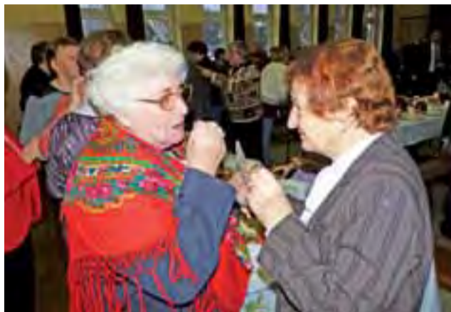
Parafialna Wigilia była okazją do złożenia świątecznych życzeń, przy oplatku.