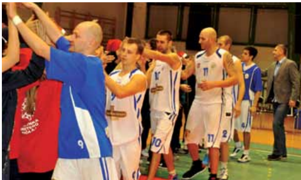
Czy w tę sobotę kibice też będą mogli gratulować zwycięstwa Księżakom?

Ostatnia część meczu świetnie zaczął Włuczynski i dzięki jego punktom Księżak wygrywał 60:56. W 35. minucie miejscowi wyszli na prowadzenie 66:65 i zrobiło się niebezpiecznie. Na szczęście „za trzy” szybko odpowiedział Fąfara, który dobrze