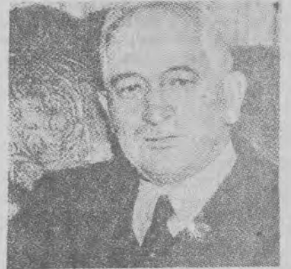
DR. EDWARD BENES prezydent Republiki Czechosłowackiej.

Poseł komunistyczny Gallacher, w wywiadzie udzielonym współpracownikom greckiej agencji demokratycznej, podkreślił, że rząd faszystowski w Grecji mógł dojść do władzy dzięki obecności w Grecji wojsk brytyjskich. Grecka agencja demokratyczna podała do wiadomości, że rząd grecki nie tylko nie zwrócił się z żadnymi propozycjami do kierownictwa EAM, lecz stale odmawiał wszelkich pertraktacji ugodowych z obojczyca.