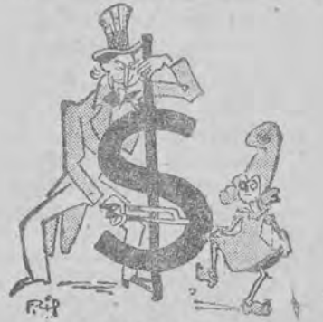
„Kuszenie Marianny” („France Nouvelles”)