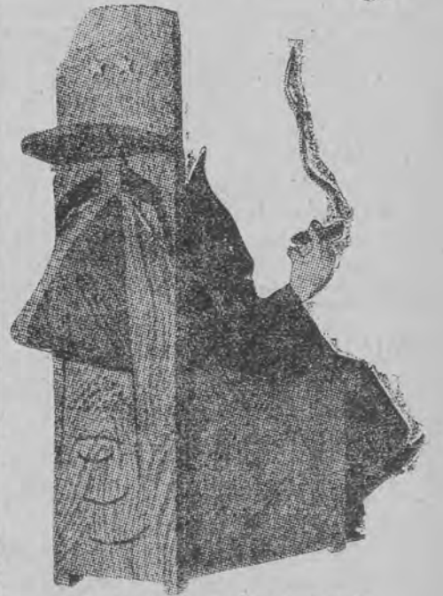
Co kryje się za de Gaulle'm? Najczarniejsza reakcja — laszym „Action”

Komunikatu o przebiegu posiedzenia nie ogłoszono. W Londynie podkreślają, że konferencja nie zakończy się — jak przypuszczano — w połowie bież. tygodnia, lecz potrwa przypuszczalnie znacznie dłużej, co wskazuje na istnienie rozbieżności i poważne trudności w uzgodnieniu stanowiska jej uczestników.