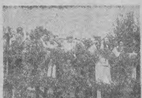
Przedstawiciele władz podczas uroczystości w związku z załadowaniem 100.000 tony węgla na nabrzeżu „Huk” Polskiej Żeglugi na Odrze w Szczecinie

ne dwa dźwigi o sile — jeden 7 i pół tony, drugi zaś — 4 tony. Jednocześnie eksploatowane są dźwigi na wybrzeżach „Odra” i „Wulkan”. Również znajduje się w eksploatacji nabrzeże „Arsenal”, gdzie obecnie są remontowane dźwigi. Pragnąc podwyższyć przeładunek węgla, już od 1 sierpnia br. uruchomiono również przeładunek ręczny.