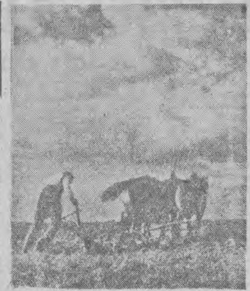
Po żniwach — rolnik zabiera się do nowej pracy

Według tymczasowych wyników nadeszłych z Węgier, jednolity front skupiający w swych szeregach cztery partie demokratyczne Węgier, odniósł zwycięstwo nad partiami pravicowymi, na które stawali legalni opozycjoniści oraz ukrywający się jeszcze zdradcy reakcji. W zwycięskim bloku demokra-