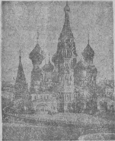
MOSKWA PAP. — Dzień 6 września w Moskwie i na terenie całego Związku

Radzieckiego upływa pod znakiem obchodu 800-lecia stolicy.