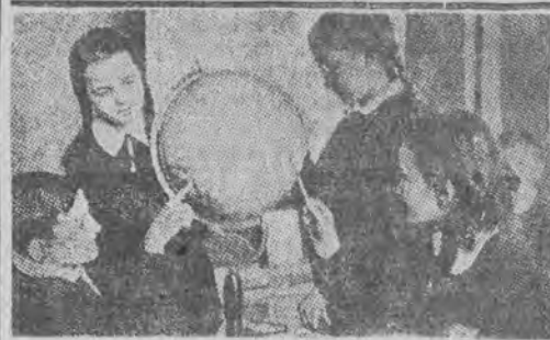
Nauka przy globusie