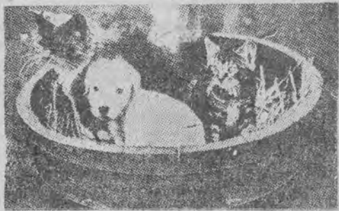
Zgoda wśród nieprzyjaciół

— I powiedzieć na razie nie mogę... — Cóż to za tajemnica! — obraziła się Oleńka.