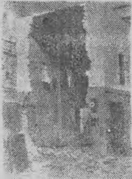
Gruzy wykończalni w 1945 r.

Wyliczając obiekty sztandarowe na Ziemiach Odzyskanych, które rząd postanowił odbudować, powiedział min. Minc, że: