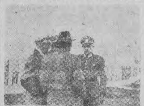
Pelzhausen składa meldunek na dzień więzienia „dostojnikom” z Rzeszy.

Wstrząsający akt oskarżenia a odsłania potworny obraz katuszy, zgrozy i mordów