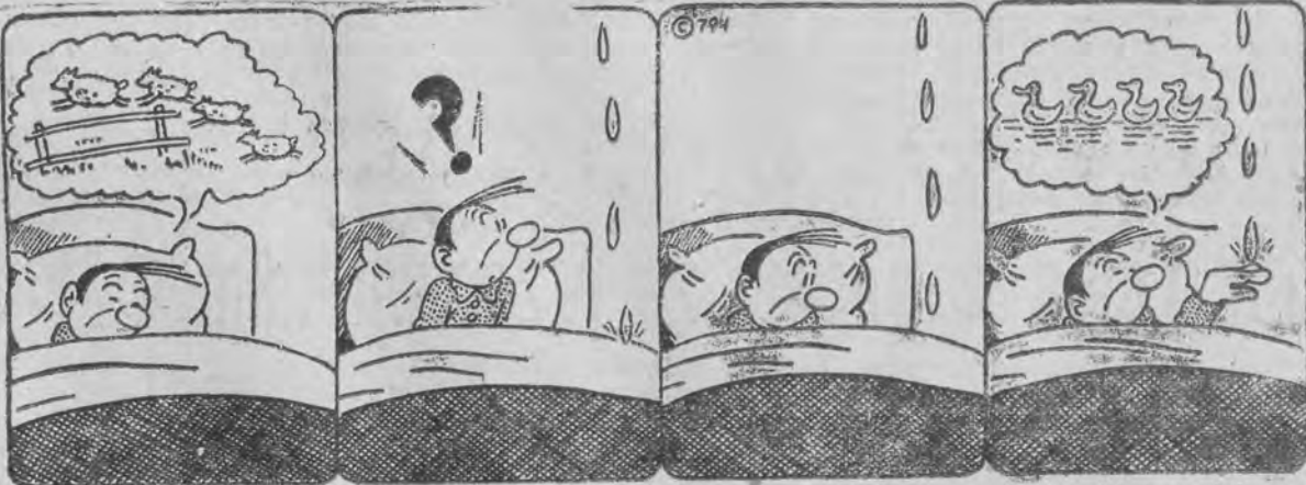
Myszy spać nie dają!