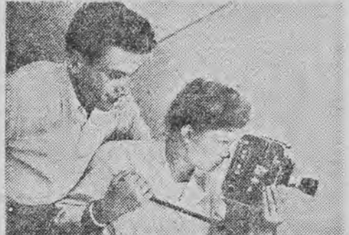
Młode siły filmu polskiego. — Operatorka przy kamerze filmowej.

Klub produkuje filmy krótkometrażowe, jak również i pełnoprogramowe. Wkrótce na ekranach wąskotaśmowych zobaczymy pełnometrażowy film produkcji polskiej „Zbrodnia i kara” (1350 metrów taśmy). W realizacji — wielki film o Polsce współczesnej. Z filmów doświadczalnych zobaczymy „50 lat filmu”. Niektóre filmy ukazały się już na ekranie za-