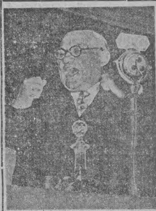
Bevin się gniewa — że dolary amerykańskie nie chcą napływać do Anglii.

Dziennik partii centrum „Elefteria” podaje, że Turcy proponują wspólne rządy grecko-tureckie w Zachodniej Macedonii pod pretekstem „obrony mniejszości tureckiej”. „Elefteria” podkreśla, że o ile Zgromadzenie Generalne ONZ poweźmie uchwałę o „działaniach jednostronnych”, to układ grecko-turecki umożliwi użycie wojsk tureckich po stronie greckich wojsk rządowych przeciwko armii partyzanckiej.