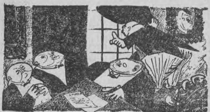
Panowie! Robić „wygłodzone mioty”, bo nadchodzi nowa komisja żywnościowa z USA.