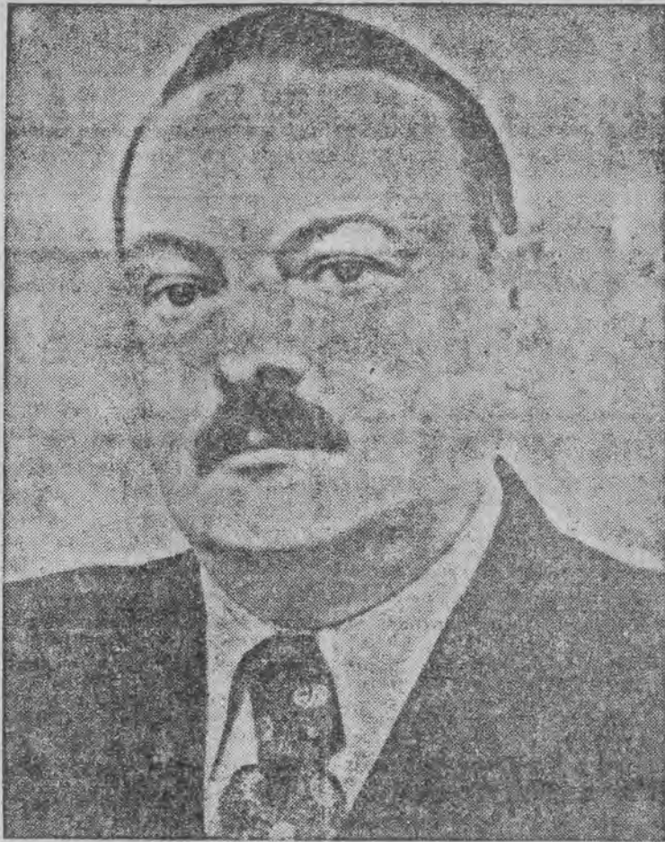
A. Żdanow — sekretarz Komitetu Centralnego Wszechzwiązkowej Partii Komunistycznej (bolszewików).

W toku tej walki elementy profaszystowskie, które współpracowały z Hitlerem, kolaboranci spośród wielkich kapitalistów, obszarników, wysokich urzędników, monarchistycznych kół oficerskich, zostali zdemaskowani jako zdajcy interesów narodowych. W krajach naddunajskich jednocześnie z wyzwoleniem od faszystowskiego jarzma niemieckiego nastąpiło usunięcie od władzy kliki burżuazyjno-obszarniczej, skompromitowanej współpracą z niemieckim fa-