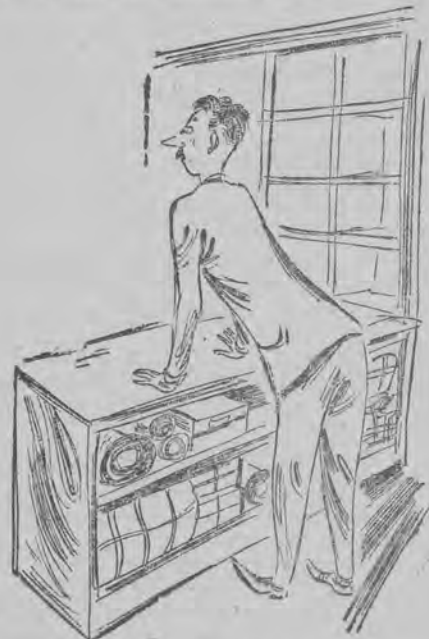
37. A w tym sklepie nie na ladzie, Towar się pod ladą kładzie.