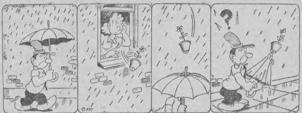
Deszcz leje! Ojoj! Leci doniczka! Całe szczęście!