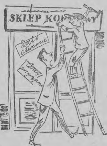
36. Chociaż p... si to nie nowy, Sklep otwarł komisowy.