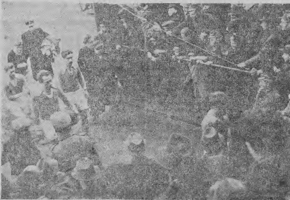
ŁKS w drodze do szatni. W środku Batan — zdobywca dwóch bramek.