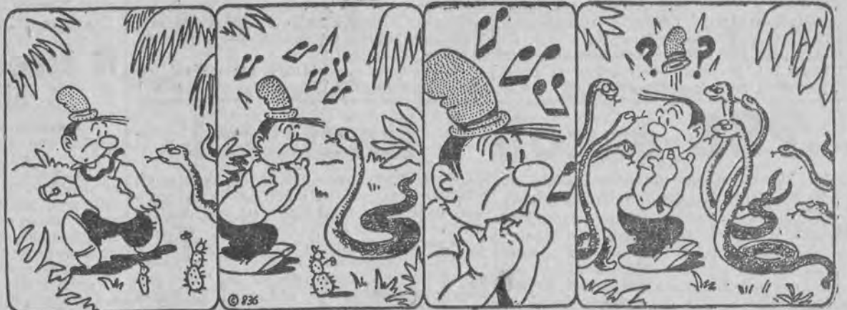
Ach, ta Afryka