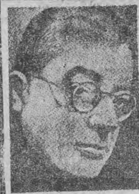
Palmiro Togliatti konferuje z Wallace'm

Nasz felietonista nie pomylił się. Londyn jest rzeczywiście pierwszym etapem podróży Mikołajczyka i jego kompanów z pośród płatnych jurgielników anglosaskich w wiadów. Należy się spodziewać, że następnym etapem wojażów niedawnego bohatera „chłopów” z Piotrkowskiej, będzie współczesna Mekka bankrutów politycznych reakcji, szpiegów i sprzedawczyków swojej ojczyzny — stolica spekulantów i handlarzy krwi — Wall - Street. Towarzystwo może podławe, ale odpowiednie. Jak to mówi angielskie przysłowie: świnia świnii nie oświini.