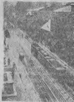
Szron pokrył ulice i dachy Łodzi.