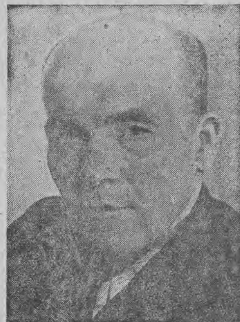
— powiedział na Kongresie Sekretarz Generalny KC PPR, tow. W. Gomułka-Wiesław