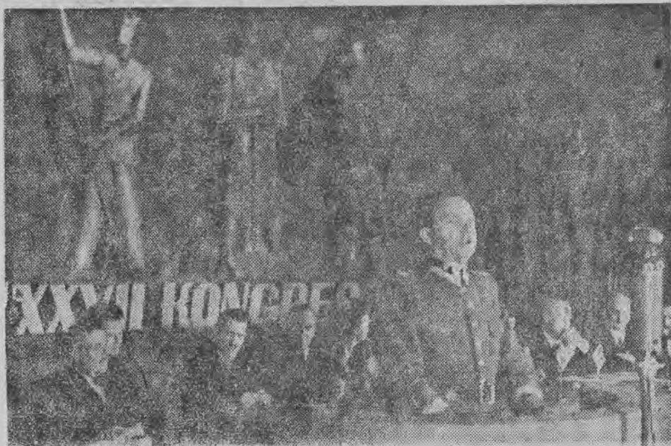
W dniach 14 — 17 br. obradował we Wrocławiu XXVII Kongres PPS. W imieniu rządu i Wojska Polskiego powitał Kongres Naczelny Dowódca W. P., marszałek M. Rola-Żymierski (na zdjęciu). Kongres zakończył się potężną manifestacją jednolitofrontową.