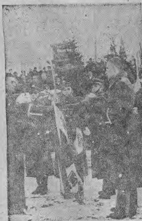
zaprzyjętlenie nowego rocznika