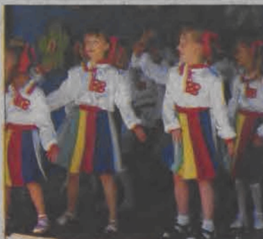
Bąkowska Barka śpiewała popularne piosenki.