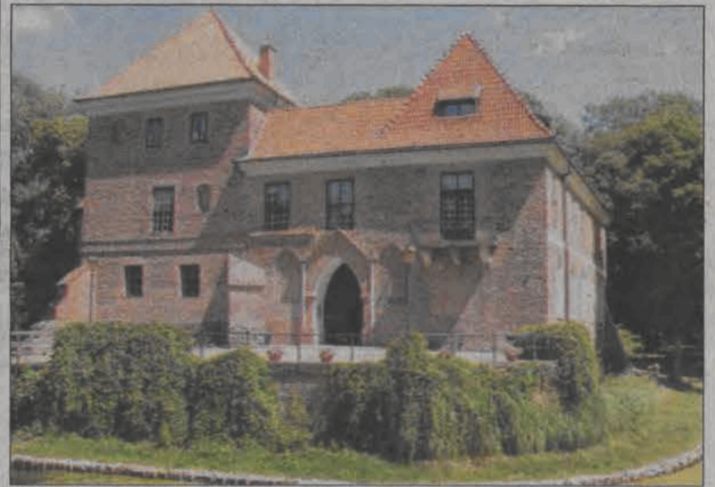
Zamek w Oporowie to propozycja dla łowiczczan na weekendowy, ciekawy wyjazd za miasto.