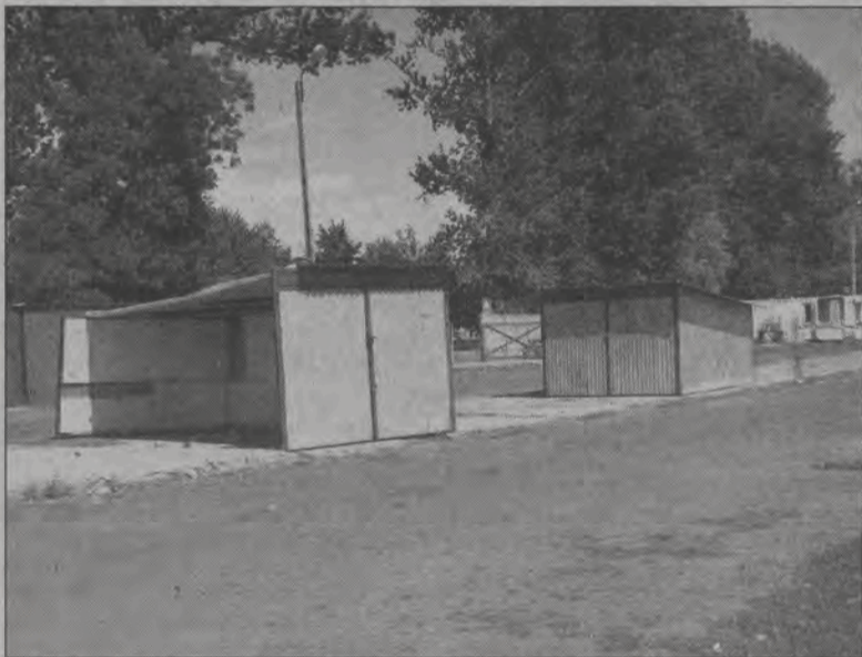
Właściciele tych garaży powinni liczyć się z koniecznością ich usunięcia.