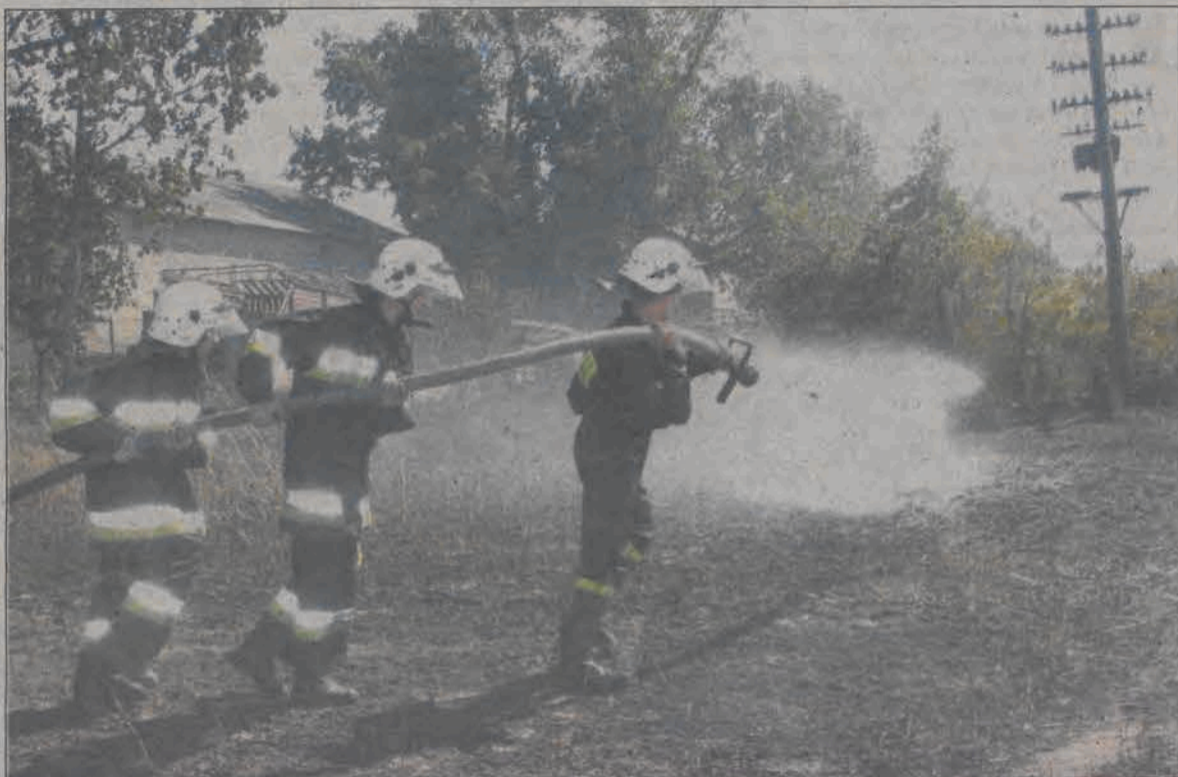
Susza poczyniła wielkie spustoszenia. Łowicka straż coraz częściej wyjeżdża do zdarzeń takich jak to w Jamnie.

- W obecnym czasie nasze interwencje to obok likwidacji gniazd os i szerszeni głównie wyjazdy do płonących traw, ściółki