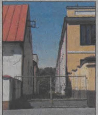
Brama zamyka wjazd w ul. Dominikańską już od 15 lat.

Pierwszym krokiem ku otwarciu ulicy powinno być przygotowanie dokumentacji wykonania przepustu przez kanał Malinówka i zbudowanie kładki. Ponadto miasto powinno zabezpieczyć sąsied-