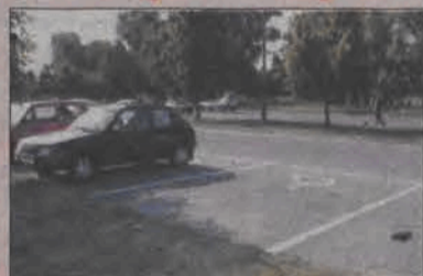
Takich miejsc do parkowania brakuje w wielu miejscach Łowicza, ale już nie przy Starzyńskiego.

Na dwóch parkingach dla samochodów na osiedlu Starzyńskie pojawiły się wydzielone miejsca do parkowania dla osób niepełnosprawnych.