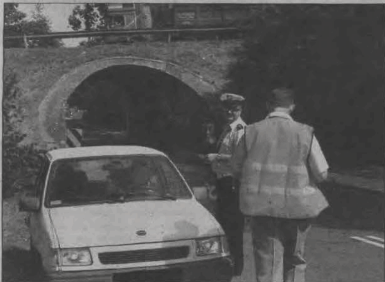
Policjanci, dwóch funkcjonariuszy SOK i przedstawiciele PKP ustawili się za wiaduktem i stamtąd obserwowali przejazd kolejowy.

Zorganizowany 12 lipca przetarg nie został rozstrzygnięty, gdyż żadna firma nie stanęła do niego. - Widocznie latem firmy mają dużo zleceń - powiedziano nam w wydziale promocji łowickiego starostwa. Kolejny przetarg zorganizowany zostanie 28 lipca, powiat ma nadzieję, że wtedy oferenci się jednak zgłoszą, gdyż koniec prac planowany jest już na 30 września. (wcz)