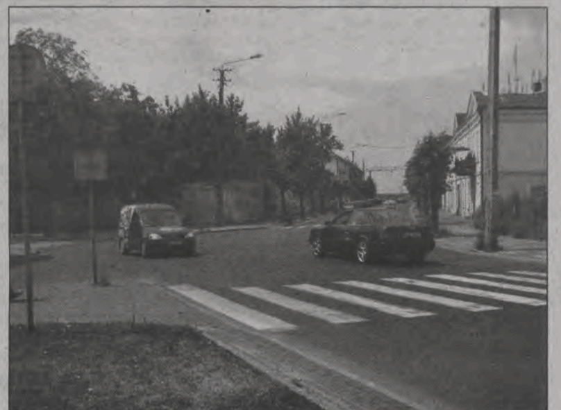
Skrzyżowanie u zbiegu Przyryńku z ulicami Bonifaterską i Świętojańską przebudowane zostanie jeszcze w tym roku.

Zmiany w organizacji ruchu wprowadzane są też na ul. Starzyńskiego, gdzie zwiększono ilość miejsc parkingowych oraz oznakowanie miejsc parkingowych dla niepełnosprawnych. Nowe miejsca parkingowe nie są na razie podzielone liniami poziomymi