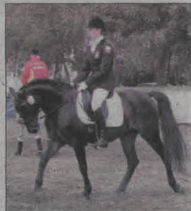
Konkurs w ujeżdżaniu koni na czworoboku.

wikiem. Na czas zawodów konie przebywały w boksach wynajętych przez stadnię. Boksy to rodzaj końskiego „mieszkania”, w którym zwierzę trzymane jest luzem. Boksy musiały mieć takie wymiary, aby koń mógł się w nim swobodnie poruszać i położyć. Zanim konie i ich jeźdźcy wyjeżdżali na czworobok czy na próbę terenową, najpierw spotykali się w boksach. Dla osób postronnych wstęp był tam ograniczony, żeby nie denerwować zwierząt, które musiały mieć czas na odpoczynek