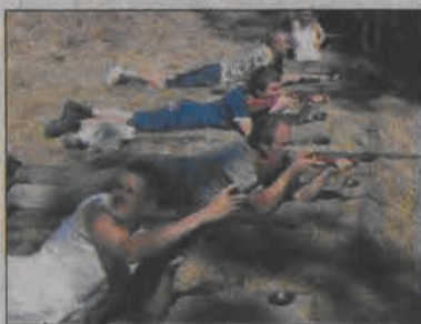
Z konkurencji sportowych na festynie było strzelanie z wiatrówek i szachy. Chętnych nie brakowało.

Po magicznym rozpoczęciu festynu wystąpiła dziecięca grupa wokalo-taneczna działająca przy Stowarzyszeniu Rodzin Katolickich przy parafii w Bąkowie - „Bąkowska Barka”. Dzieci śpiewają piosenki o Bogu z repertuaru między innymi Arki Noego. Piosenkami udało się „rozbujać” również starszą publiczność. Po występie „Bąkowskiej Barki” nadszedł czas na kolejne cyrkowe atrakcje. Na scenę wkroczyła kuso ubrana, wysportowana dziewczyna i zaczęła kręcić... hula-hop. Kręcić jednym hula-hop to (przez chwilę) żądna sztuka, ale gdy kolejne okręgi są obracane nie tylko na tułowiu, ale również na rękach, w okolicach szyi i nad kolanami, to już sztuka cyrkowa wymagająca długich treningów. W pewnym momencie w użyciu było kilkanaście obręczy. Na scenę artystka zaprosiła dzieci i młodzież,