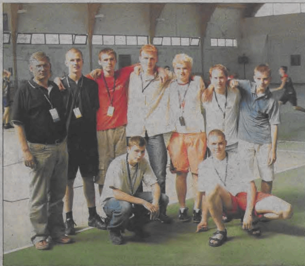
Drużyna szczypiornistów z pijarskiego liceum podczas Parafiady w Warszawie.

Jak się ma ta lokalna działalność do współpracy z fundacją Parafiada? Otóż w organizacji tych imprez, także na szczeblu lokalnym, fundacja wspiera szkołę finansowo i rze-