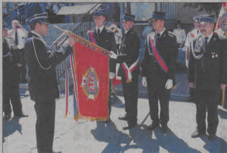
Jednostka OSP Bielawy została odznaczona medalem za zasługi dla pożarnictwa.

Aktualnie jednostka OSP Bielawy liczy 144 członków czynnych, honorowych i wspierających oraz 44 druhów w drużynach młodzieżowych. Do pożarów i wypadków wyjeżdża średnio 30-40 razy w roku. W 2000 roku straż stała się prawnym właścicielem budynku, przejęła także pomieszczenia po byłym ośrodku kultury. (mak)