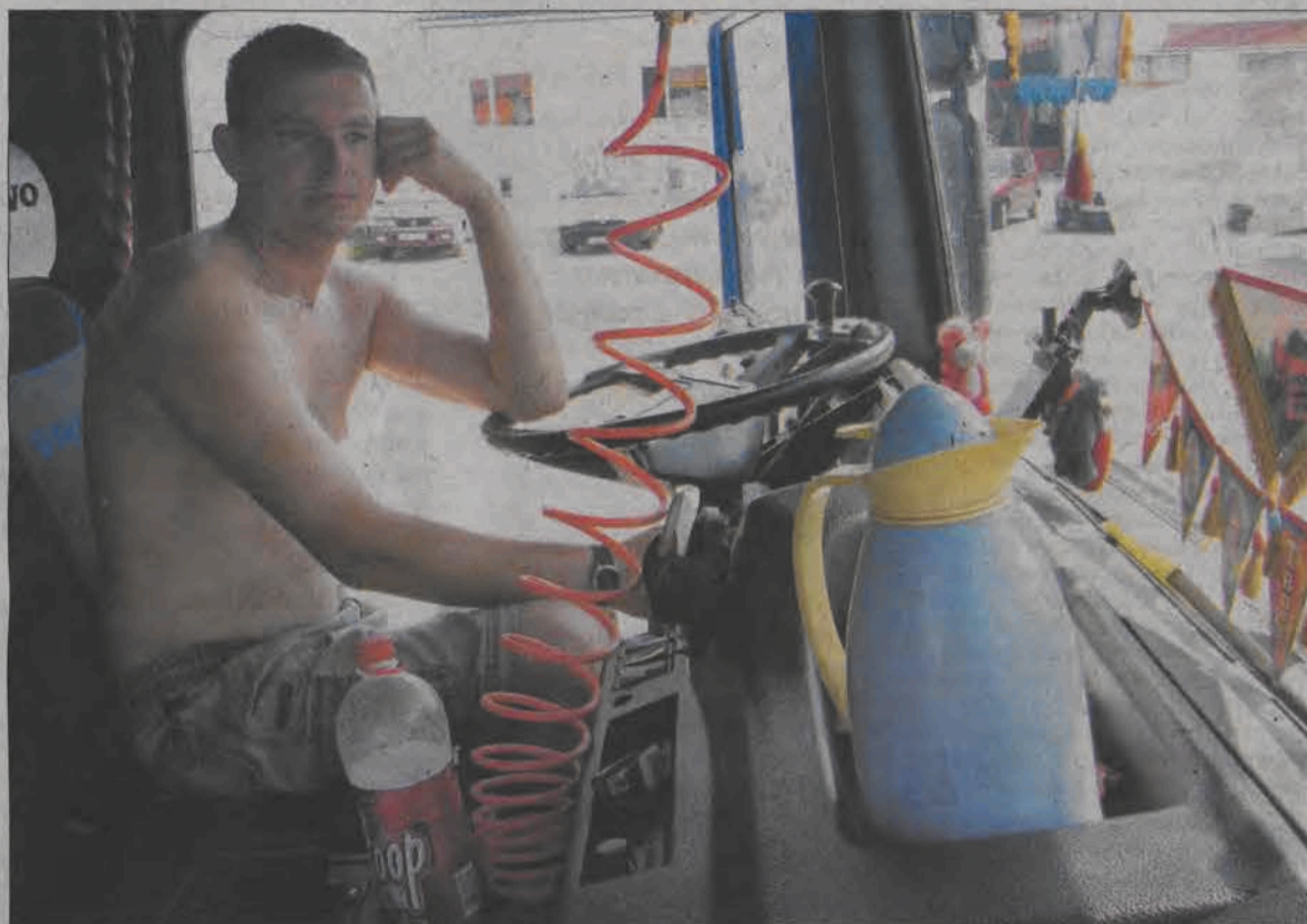
W samochodach stojących na parkingach klimatyzacja nie działa...

Co kierowcy robią na parkingach? Część z nich chowa się w przystajnych barach, inni po prostu siedzą w kabinach ciężarówek. - Jak już nie chce się siedzieć w barze, to siedzę w kabinie - powiedział nam kierowca z Grodziska Mazowieckiego. Żaden z kierowców nie wypuszcza się na wycieczki w stronę miasta, ponieważ czekać na parkingu są odpowiedzialni za stan ciężarówki. Niechętnie to mówią, ale obawiają się też innych kierowców. Przecież paliwo łatwo jest spuścić... - Gada się z mudów przez radio z innymi kierowcami. Trzeba przeczekać do wieczora, można się też zdrzemnąć -