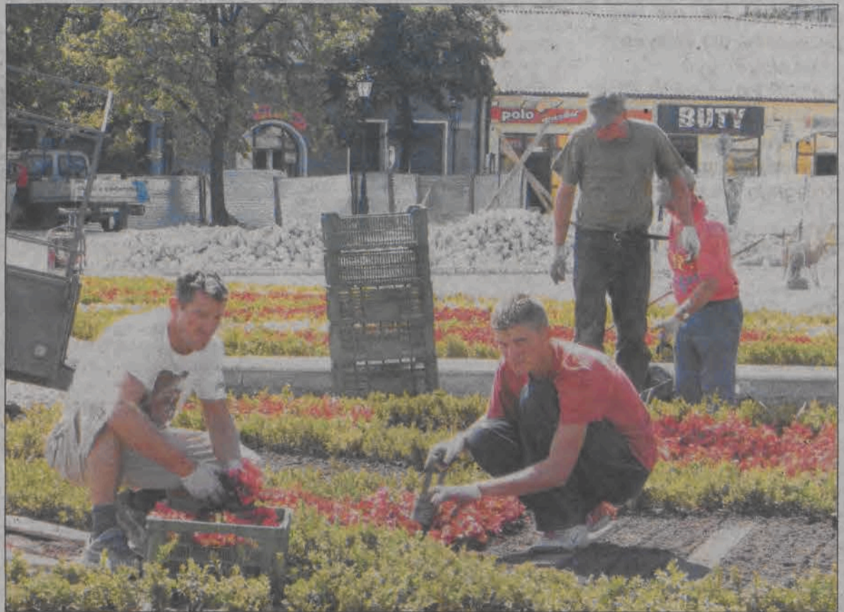
Dwie spośród trzech rabat na Nowym Ryнку zostały obsadzone już kwiatami.

Nowy Rynek w Łowiczu powoli zmienia swój wygląd. Ostatnio wzrok przykuwają wykonane już i obsadzone kolorowymi kwiatami dwie rabaty. W tych dniach rozpoczęły się także prace przygotowawcze do budowy fontanny.