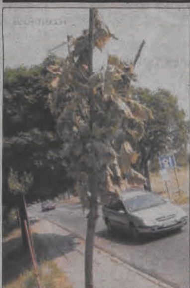
Uschnięte drzewa przy ul. Kaliskiej (na jednym zdjęciu) i podlewający je pracownik Git Polu (na drugim). Czy działanie to przyniesie skutek, wobec obecnych temperatur wątpliwe.

Dużym powodzeniem cieszą się wycieczki turystyczne dla dzieci i młodzieży z terenu gminy Zduny, które w tym roku zaoferowała w okresie wakacji Biblioteka Publiczna i Dom Kultury w Zdunach. W pierwszej z nich, która odbyła się 5 lipca, wzięło udział 45 dzieci, w autokarze były zajęte wszystkie wolne miejsca. Dzieci ze szkół podstawowych pojechały do Torunia i Ciechocinka. Już teraz przyjmowane są zgłoszenia od młodzieży gimnazjalnej na kolejną wycieczkę, tym razem do Biskupina, Gniezna i Kruszwicy. Kolejne odbędą się 2 sierpnia do Kazimierza Dolnego i Puław (uczniowie szkół podstawowych) i 9 sierpnia do Torunia i Ciechocinka (uczniowie gimnazjum). Koszt wycieczki to 7 zł (plus 10 zł na drobne wydatki) od osoby. Wpłaty i zapisy przyjmowane będą w BPiDK w Zdunach, zamknięcie listy uczestników na tydzień przed wyjazdem. Wyjazd o 7.00, powrót ok. 21.00. (tb)