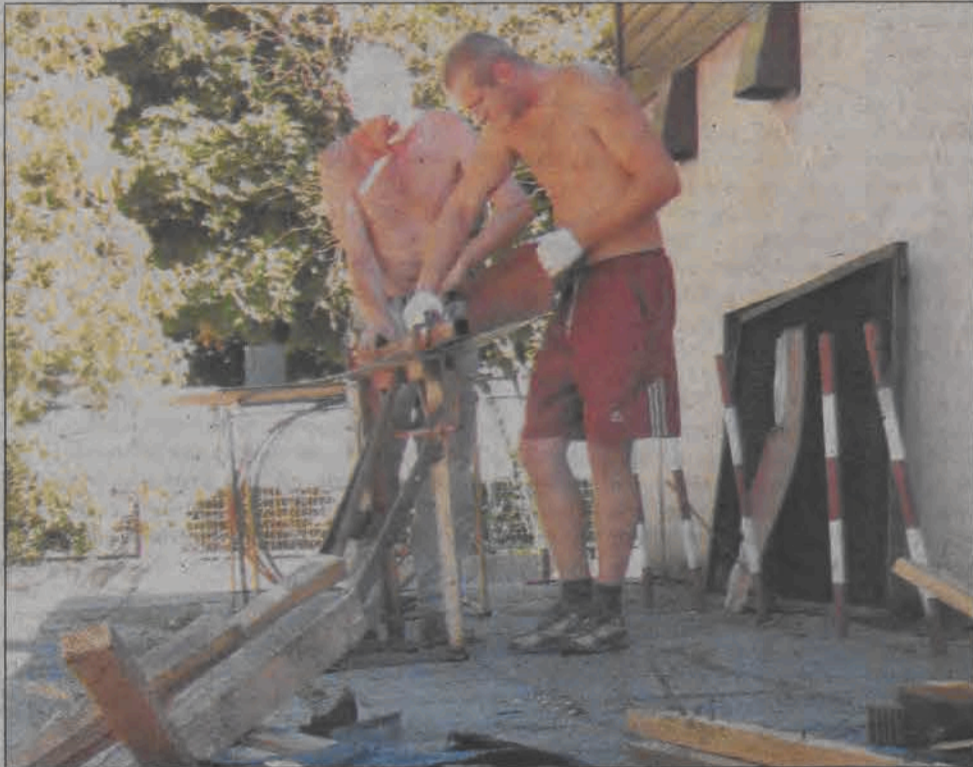
Trwa remont dachu na Przedszkolu przy ul. Sikorskiego.

Na ukończeniu jest modernizacja kuchni oraz łazienki dla personelu w Przedszkolu nr 7 przy ul. Łęczycyckiej. Prace obejmują wymianę instalacji wodno - kanalizacyjnej, położenie glazury i terakoty, co kosztowało będzie około 16 tys. zł.