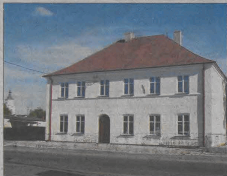
Budynek GOK świeci dziś nowym blaskiem.