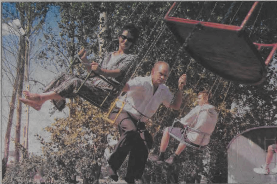
Na karuzelach kręcili się nie tylko najmłodszy...