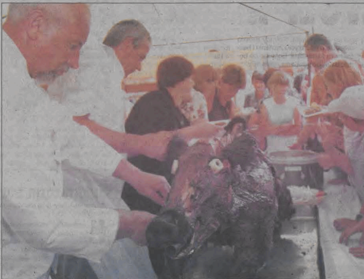
Kilkumetrowa kolejka ustawiała się po dzicyźnie podczas kiernożkiego święta.

Dla młodzieży przygotowano konkurs wiedzy o gminie, ale cieszył się on mniejszym zainteresowaniem, młodsze dzieci układały legendy o dziku. Bardzo widowiskowy był konkurs polowania na dzika,