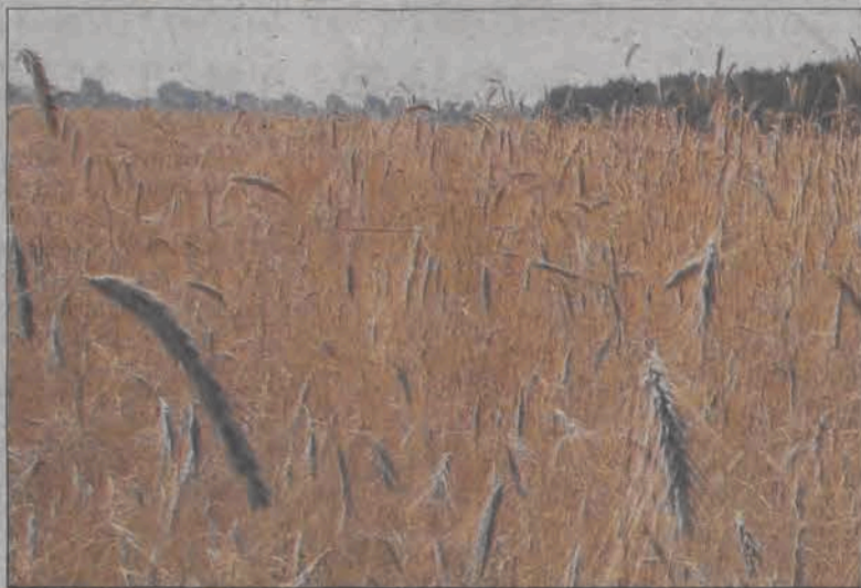
Upały skrócą znacznie okres wegetacji zbóż, które wcześniej dojrzeją.

Od początku lipca rolnicy z utęsknieniem wyczekują nie gwałtownych, lecz jednostajnych i kilkudniowych co najmniej opadów. Wyschnięta ziemia może nie obrodzić. Nalożyły się na siebie dwa zjawiska: pojawienie się pleśni śniegowej, po zbyt długim zaleganiu śniegu (około 100 dni) i wyparzenie (duszenie się roślin pod śniegiem) oraz obecnie brak opadów. Plony słabsze od ubiegłorocznych będą na pewno na ziemiach lekkich, na których rośnie głównie żyto i jare mieszańki zbożowe. Ziano będzie niewyrosnięte i niewykształcone. Zboża jare będą miały znacznie krótszy okres wegetacji, więc nie wyrosną. Ze względu na długą zimę zostały późno wysiane, a susza spowoduje szybsze ich wypalenie. Do żniw jeszcze dwa tygodnie, ale synoptycy niestety nie przewidują deszczu. Dlatego takie zboże w skupie może nadawać się tylko na paszę.