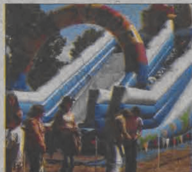
Dmuczone namioty cieszyły się dużym powodzeniem.