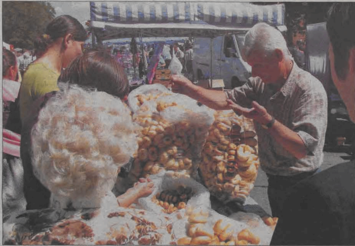
Po sumie i procesji wokół kościoła parafianie oblegali stragany.