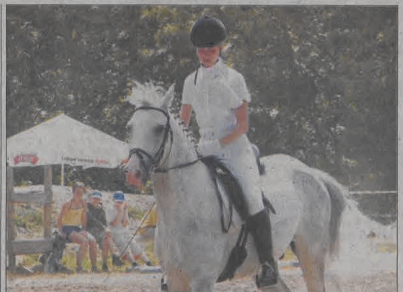
Sympatyczna młodzież na pięknych wierzchowcach opanowała na kilka dni Walewice. O Ogólnopolskiej Olimpiadzie Młodzieży, której część jeździecka odbywała się na terenie stadniny - czytaj na stronie 14.

Pogrzeb odbył się w środę 19 lipca. Uroczystość rozpoczęła się mszą św. o godzinie 15.30 w kościele Świętego Ducha, następnie kondukt przeszedł na cmentarz Emaus. (wcz)