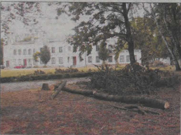
Prace w parku w Sannikach są coraz bardziej widoczne, bo usunięto zbędne drzewa.