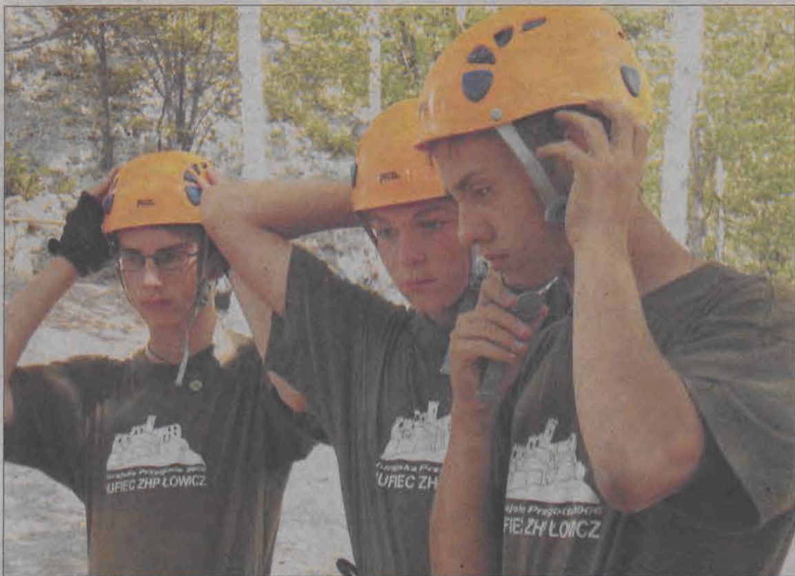
Przygotowania obozowiczów do próby wspinaczki na wapiennych skałkach.

Harcerze zaoferowali uczestnikom „Jurajskiej Przygody” wiele konkursów i atrakcyjnych nagród. Od mp3-player'ów przez instrumenty muzyczne (np. gitary), sprzęt turystyczno-biwakowy, lornetki, książki, gry komputerowe, po harcerskie i ekologiczne gadzety. Każdy z uczestników dostał jakąś nagrodę, a wartość najmniejszej z nich wynosiła około 30 zł. Ciekawie wypadł festiwal piosenki ekologicznej, w którym zwy-