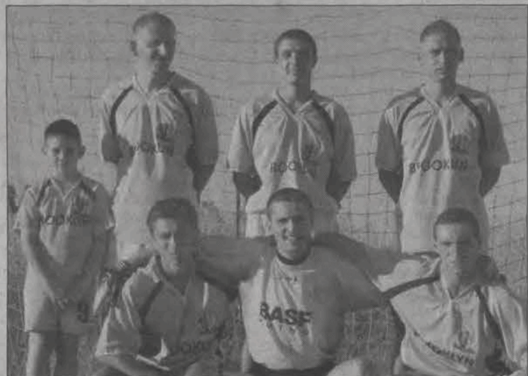
Zespół Brooklyn Walewice, po półfinałowym „derbowym” zwycięstwie z Brooklynem Kutno, w finale musieli uznać wyższość „Warriorsów”.

dzie zasadniczej po trzecim meczu oddanym walkowerem.