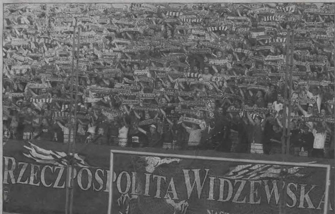
Już jutro - w piątek 11 sierpnia w Łodzi zostaną rozegrane pierwsze po kilku latach derby w I lidze Widzewa i ŁKS. Tradycyjnie do Łodzi wybiera się spora grupa fanów obu zespołów z całej Ziemi Łowickiej.