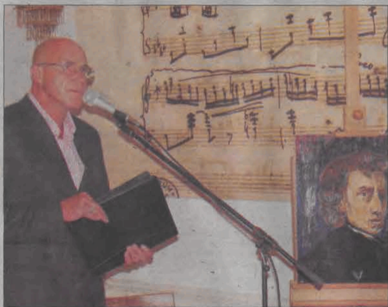
Tym razem gościem sannickiego pałacu był Piotr Machalica.