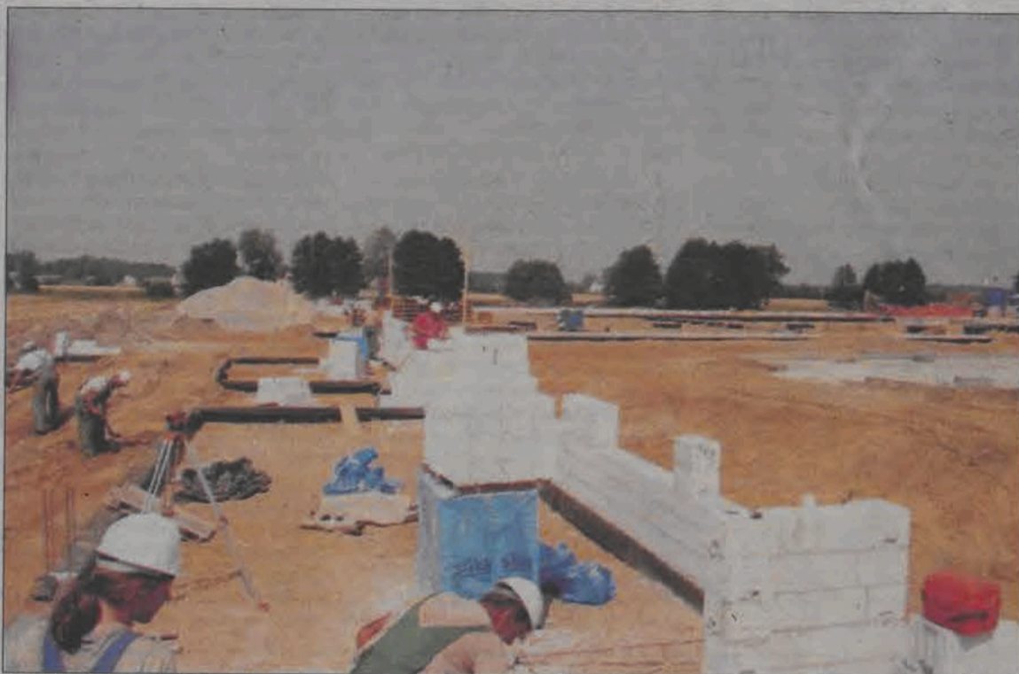
Fabrykę Baumit buduje firma Budowa z Łowicza.

Także zbiorniki technologiczne zostały już wykonane na poziomie 5,5 metra poniżej docelowej posadzki hali produkcyjnej czyli około 4 metrów poniżej wód gruntowych - powiedział nam Janusz Mostowski z Zakładu Projektowo-Wykonawczego Budowa w Łowiczu, który buduje Baumit. Do tej pory największe problemy stwarzał wysoki poziom wód gruntowych na placu budowy, więc teren został odwodniony. Wszystkie prace przy budowie fabryki postępują zgodnie z harmonogramem. Uruchomienie