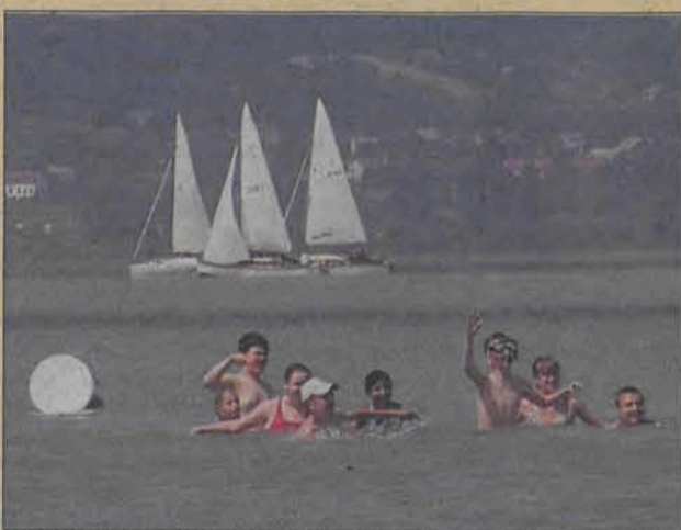
Atrakcją była kąpiel w Balatonie.

Obok nauki były też inne atrakcje jak chociażby mecz koszykówki wodnej. Jak mówi Janocha, nikt ze startujących nie przypuszczał, iż tak trudno jest trafić z wody do nisko zawieszono-