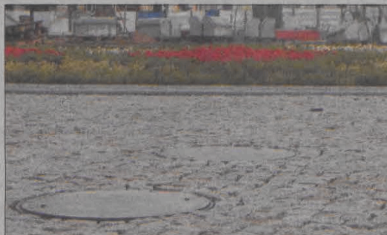
Pod tymi studzienkami kryją się podłączenia do kanalizacji, wodociągu i energii, w przyszłości będzie mógł stanąć tu punkt gastronomiczny.

duszu PKO/CREDIT Zrównoważony na kwotę około 60 tys. zł. Posiadał we współwłasności dom o powierzchni 210 m 2 i wartości około 160 tys. zł. Inne nieruchomości: działka 454 m 2 o wartości około 14 tys. zł - działka ta jest zabudowana domem, o którym mowa powyżej. Z tytułu zasiadania w komisji rewizyjnej spółki ZEC w Łowiczu Sp. z o.o. (jako reprezentant miasta) osiągnął dochód w wysokości 5.289,68 zł brutto. Z tytułu wynagrodzenia za pracę osiągnął w ubiegłym roku dochód w wysokości 87.338,69 zł brutto. Świadczenie emerytalne małżonki: 12.100,80 zł brutto. Posiadał samochód osobowy marki Fiat Marea z 1999 roku o wartości około 15 tysięcy złotych. Nie posiadał zobowiązań finansowych o wartości powyżej 10 tysięcy złotych. (mak)