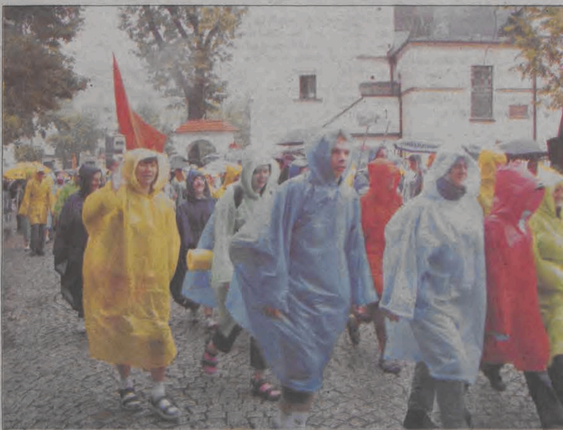
Pielgrzymi wychodzili z Łowicza w strugach deszczu.

Nawet jeśli początek pielgrzymki jest w deszczu, z czasem, kiedy wszyscy się zaaklimatyzują, dotrą, rodzi się prawdziwa wspólnota pielgrzymujących i potrafi być naprawdę sympatycznie. - Poza