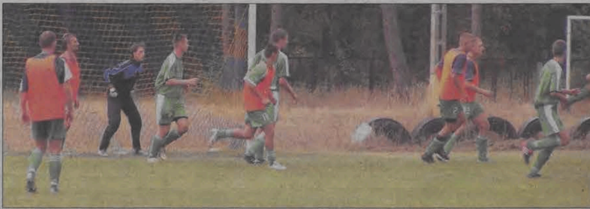
Po sobotniej porażce łowiccy kibice zastanawiali się, czy porażka z Włókniarzem to by tylko wypadek przy pracy...