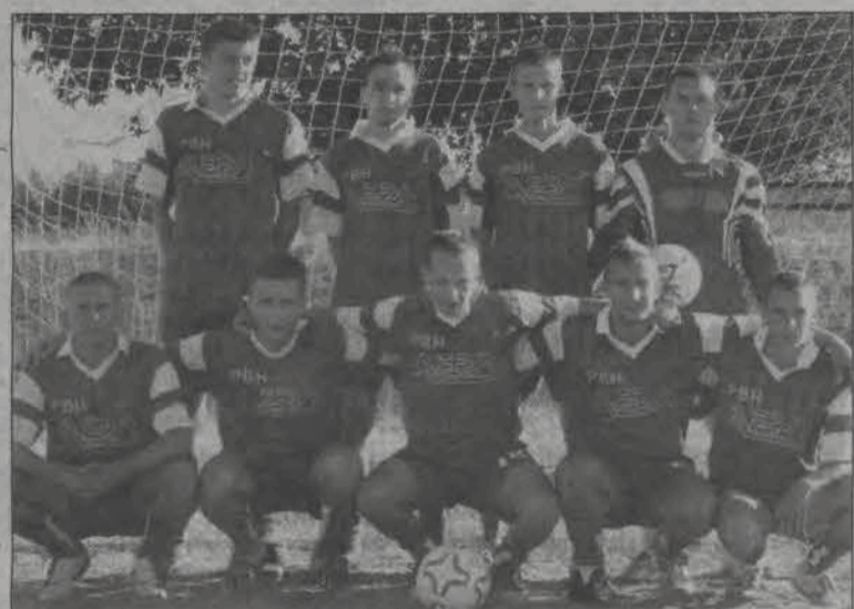
Mistrzami Bielaw Anno Domini 2006 zostali gracze zespołu Warriors.