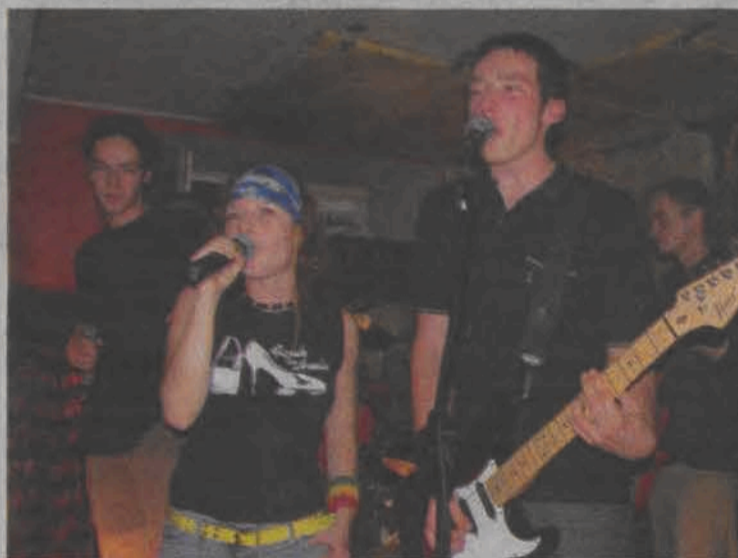
Dziańina zagrała zarówno w piątek jak i w sobotę. Wypadli świetnie.

Już rano organizatorzy zabrali się za sprzątanie placu. Uczestniczyła w tym społecznie łyszkowicka młodzież, której dyrektor GOK chce za to, jak i za wcześniejsze rozwieszanie plakatów serdecznie podziękować. (wcz)