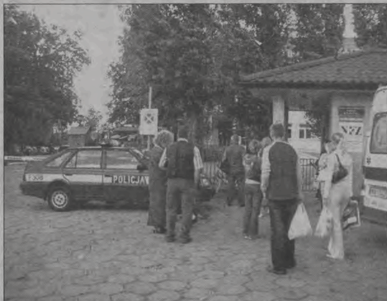
Podczas alarmu bombowego do szpitala nie wpuszczano odwiedzających.