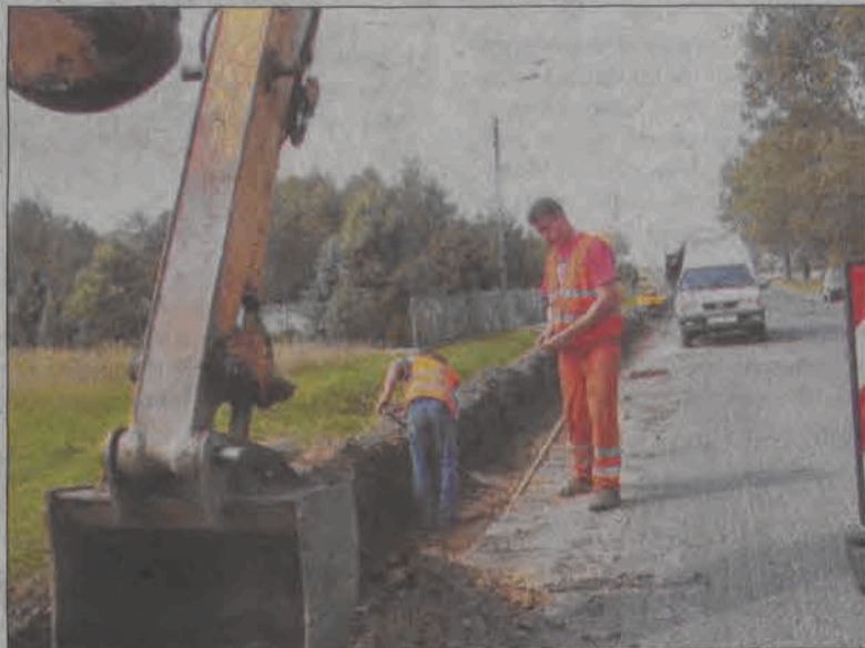
Pracownicy firmy Erbedim poszerzają podbudowę drogi.