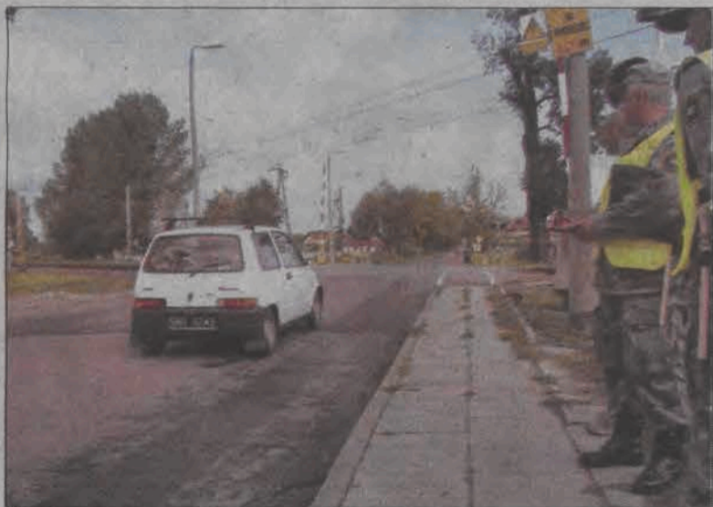
W ostatni czwartek kontrolowany był przejazd kolejowy przy ulicy Seminaryjnej.

„Kiedy widzę samochód, który wtargnął na przejazd, mogę tylko włączyć hamulec i patrzeć jak ginie człowiek” - takie wyznanie maszynisty pociągu znaleźć możemy w ulotce, wydanej przez Polskie Koleje Państwowe w ramach akcji „Bezpieczny przejazd zależy także od Ciebie”.