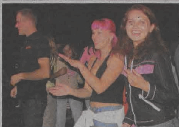
Młodzież bawiła się przy muzyce prezentowanej przez DJ-ów.