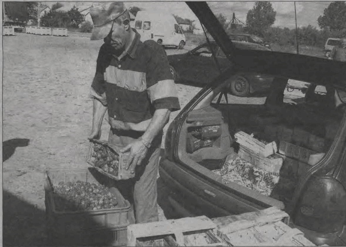
Na giełdzie truskawkowej w Sannikach handlujących i sprzedających było wielu, zarówno w tym tygodniu, jak i w ubiegłym.

Polska otworzyła swoje granice dla Ukraińców, którzy pragnęliby podjąć u nas legalnie pracę, choć nie dla wszystkich i nie we wszystkich profesjach. Jak donoszą ogólnopolskie media już wcześniej Ukraińcy pracowali u nas legalnie jako nauczyciele języka angielskiego w szkołach i byli spawaczami w naszych stoczniach. Co roku zezwolenia na pracę otrzymywało jednak około 3 tys. osób, reszta - nawet kilkadziesiąt tys. osób - pracowała na czarno, na budowach bądź właśnie w rolnictwie. Na łowickich wsiach w ostatnich latach nie było ich jednak zbyt wielu. A przecież jeszcze kilka lat temu ukraińscy pracownicy sezonowi byli bardzo widoczni. Przeciwnie przy zbiorze truskawek czy ogórków w jednej tylko gminie powiatu łowickiego pracowało od 750 do 1000 osób zza wschodniej granicy. W każdym gospodarstwie posiadającym plantacje warzyw czy owoców było od 8 do 15 Ukraińców zatrudnianych przy pracach sezonowych. Dziś takie przypadki są sporadyczne. - W okolicy są cztery osoby - słyszymy od rolnika, który jeszcze w minionym roku zatrudniał Ukraińców do zbioru truskawek i ogórków.