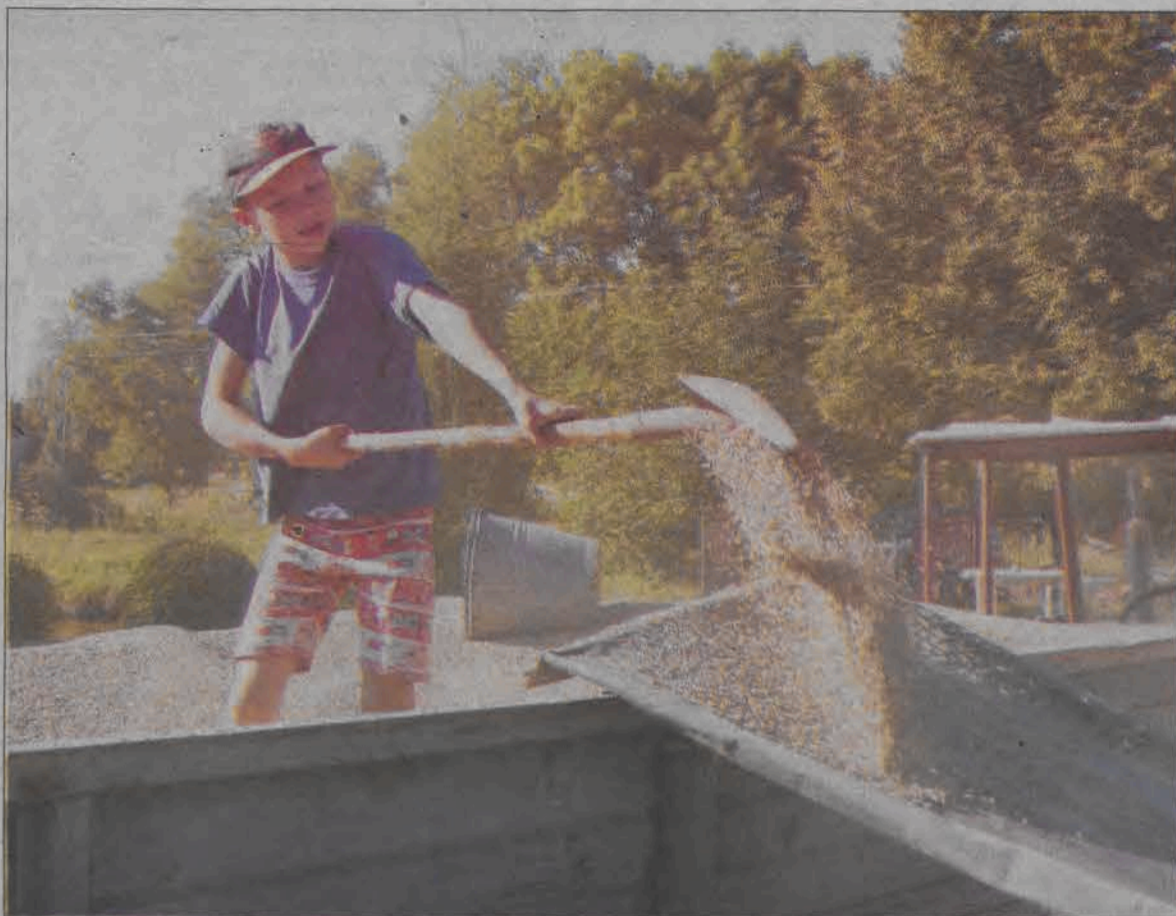
W gospodarstwach w Łowickim dzieci uczą się pracowitości od małego.

Oglądając w muzeum hafsy, narzędzia, sprzęty domowe, widzimy, że tego nie mogła zrobić ręka niezdolna. Także dziś otwierane są sklepy, każdy czynny na terenie tego miasta się zajmuje. Podobnie na wsi, rolnicy potrafią dokonywać zmian. Nie ma sytuacji, że ktoś trzyma się przez kilkanaście lat dziedziny, która nie przynosi mu zysków. Rolnicy potrafią dostosować się do tego, co niesie im życie.