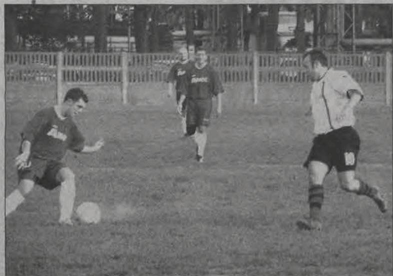
Laktoza znowu nie zdołała zainkasować punktów.

■ WIDOK Skierniewice - GKS Głuchów 8:1 (3:1) ; br.: Piotr Muras (13), Słowajski (21), Adamiec 5 (30, 65, 67, 72 i 85) i Budek (80) - Bursztynowicz (25).