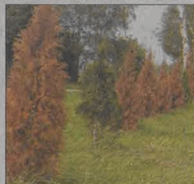
Susza spowodowała straty na polach, w sadach i ogrodach. Strat w roślinach ozdobnych nie szacowano.

Szacowanie strat suszowych, do których doszło w pierwszej połowie lata przeprowadzono na poziomie województwa, wcześniej szacowano je w gminach na podstawie wniosków składanych przez rolników. We wnioskach tych rolnicy informowali, że w wyniku długotrwałej suszy w gospodarstwach nastąpiły straty w uprawach i sami wpisywali powierzchnię dotkniętą suszą