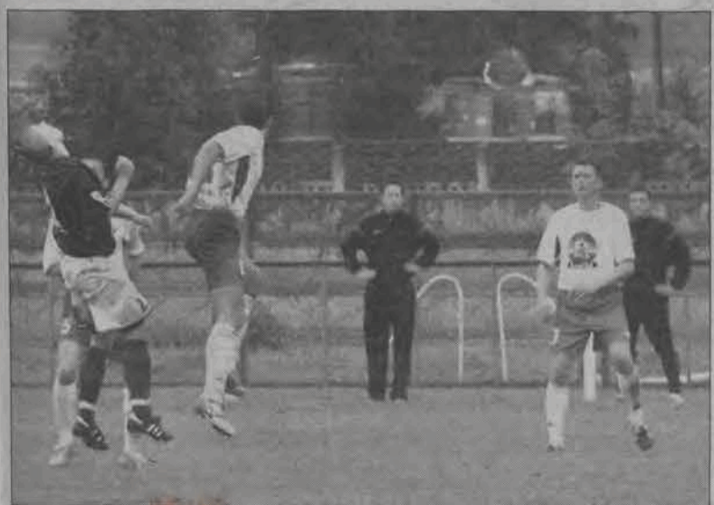
Po meczu stojącym na wysokim poziomie Pelikan wygrał ze Zniczem 1:0.