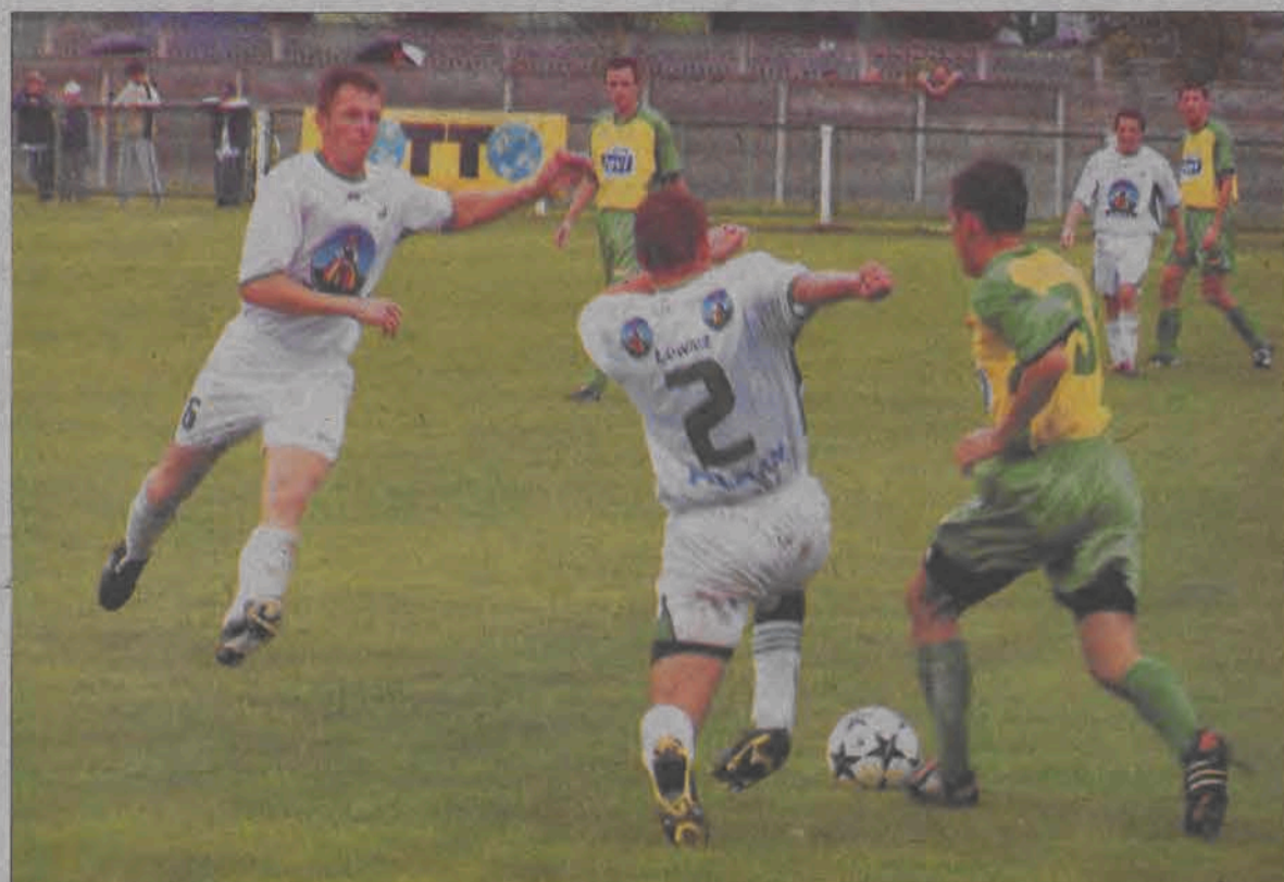
W drugiej połowie łowicka defensywa nie ustrzegła się błędów. Łowiczanie jednak wygrali 3:2.