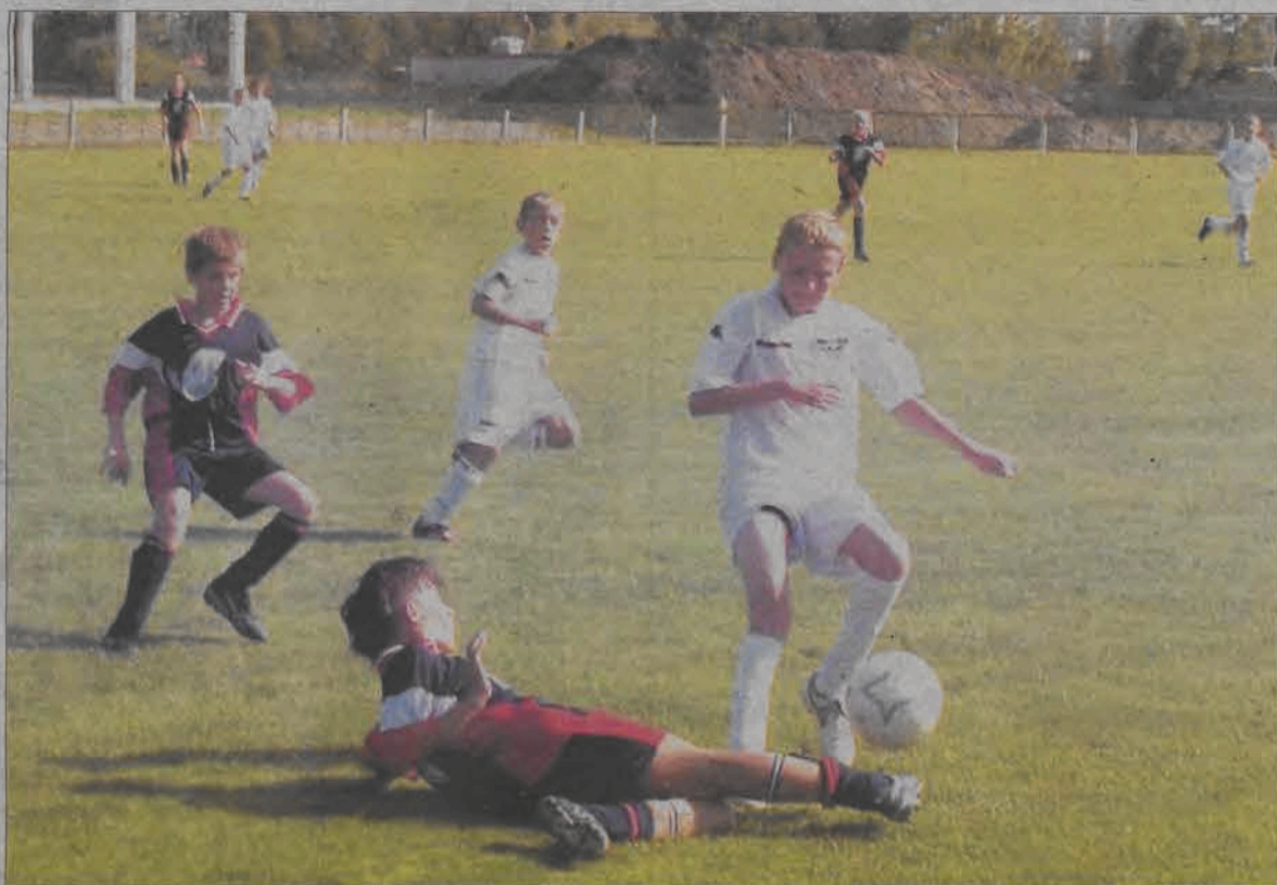
W pierwszym meczu ligi wojewódzkiej Pelikan-93 przegrał MUKS Łask 1:2. Więcej o tym meczu w następnym numerze NL.

7. GKS Głuchów 1 0 1-4 8. Olimpia Niedźwiada 1 0 0-7