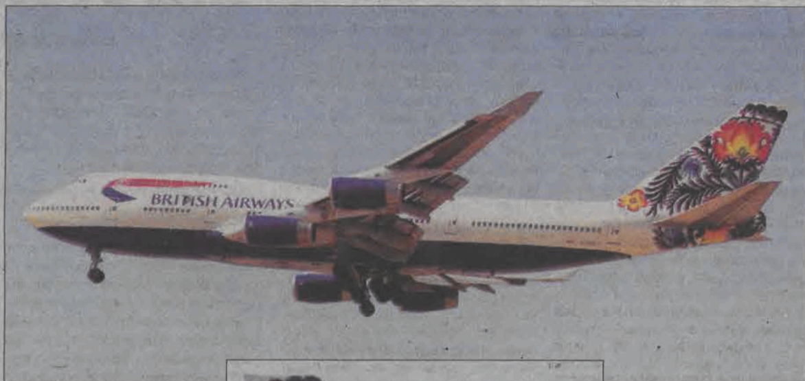
Łowicki kogucik British Airways w locie.

Barwne ogony mogły się podobać, ale przysparzały kłopotów kontrolerom ruchu lotniczego, którzy nie byli w stanie,