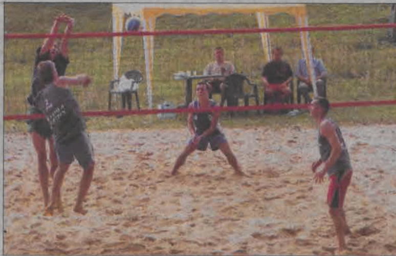
Finał tegorocznej plażówki został zdominowany przez zespoły z Głowna.

Kolejna edycja mistrzostw zatem za nami. Teraz rok przerwy, który siatkarze z Łowicza mogą wykorzystać na ciężką pracę