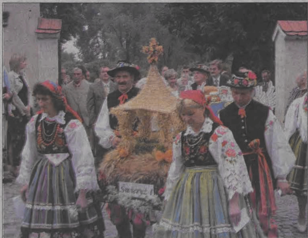
Poświęcone wieńce, w barwnej procesji zanieśono do kościoła katedralnego