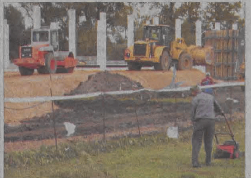
Na budowie marketu Kaufland widać ciężki sprzęt budowlany i stojące już filary, które będą podierać dach.

Market Kaufland będzie miał powierzchnię 3,5 tys. m 2 , w tym powierzchnię sprzedaży wynoszącą 2 tys. m 2 . Będzie obok Inremarche drugim tak dużym obiektem handlowym w Łowiczu. Oprócz powierzchni sklepowej powstanie w nim pasaż handlowy, w którym planuje się umieszczenie m.in. piekarni, salonu prasowego, jubilera, punktu sprzedaży telefonii komórkowej oraz apteki. (tb)