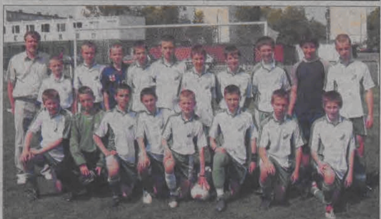
Ekipa Pelikana 1992 przyjechała z Balucza ze zwycięstwem 5:0.

Piłka nożna - wojewódzka liga „Michałowicza”