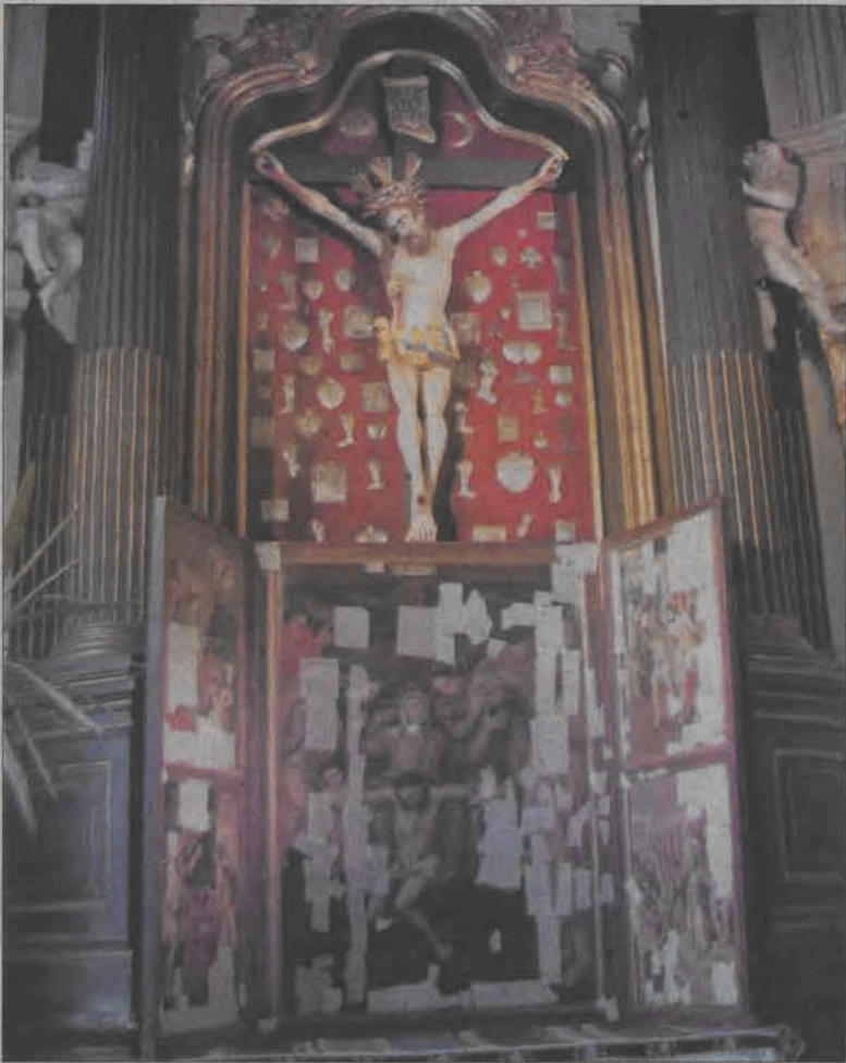
Choć tryptyk zabezpieczony jest taśmami konserwatorskimi, to duża część malowideł jest dobrze widoczna dla zwiedzających łowicką katedrę.