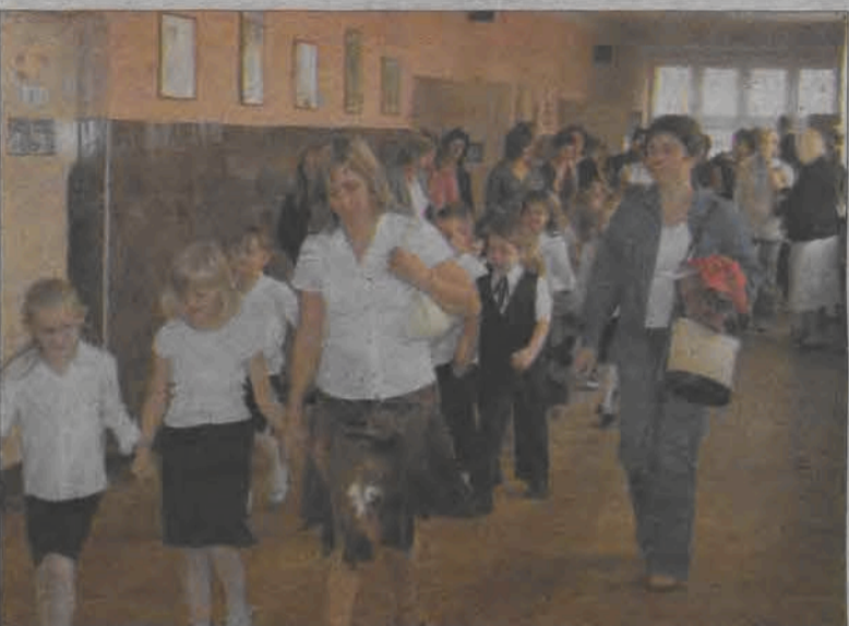
Uczniowie klas I Szkoły Podstawowej nr 4 w Łowiczu, bardzo przejęci, ale i szczęśliwi, maszerują na uroczystość rozpoczęcia roku szkolnego połączoną ze ślubowaniem i pasowaniem na ucznia.