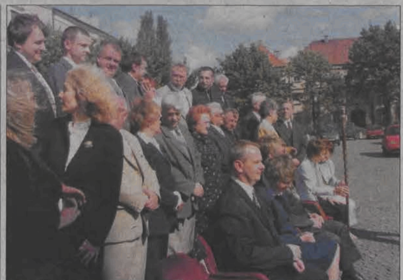
WSPÓLNE ZDJĘCIE NA KONIEC KADENCJI. Tradycją stały się już wspólne fotografie wszystkich członków Rady Miejskiej w Łowiczu wykonywane pod koniec kadencji. Właśnie wspólne zdjęcie łowickich rajców i najważniejszych urzędników, z burmistrzami włącznie, było powodem wyłączenia z ruchu sporej części Starego Rynku w czwartek, 31 sierpnia. Kierowcy nie szczydziли ostrych słów, szukając miejsca do zaparkowania samochodu. Radni wyszli przed ratusz około godziny 15, w przerwie obrad sesji. Na fotografii uwiecznił ich pracownik Urzędu Miejskiego Jacek Foks.