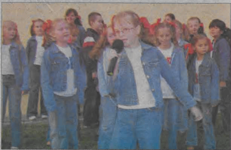
Atrakcją wieczoru był występ Bąkowskiej Barki .

Wycieczki organizowane będą zresztą także w przyszłości. Dla bezpieczeństwa uczestników, którzy przechodzą muszą często na drugą stronę ulicy, organizatorzy chcą w przyszłości oznaczyć maszerującą grupę proporcem. Byłby to proporzec osiedla Starzyńskiego. Jego projekt zostanie jednak dopiero opracowany. (wcz)