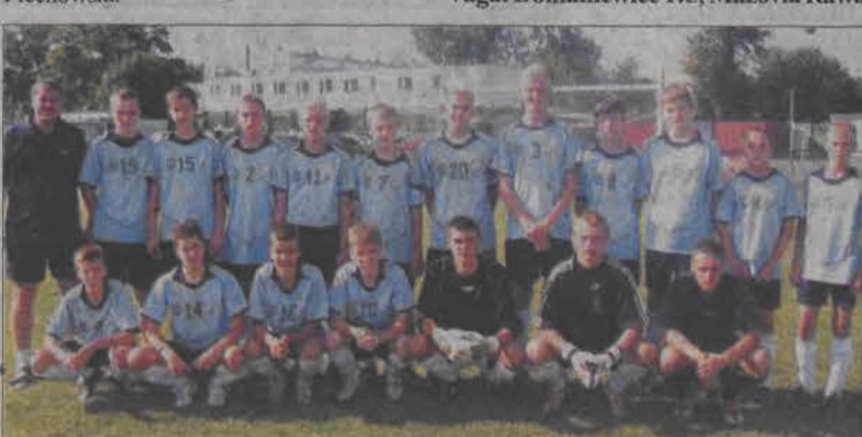
Ekipa Pelikana z rocznika 1991 wygrał aż 12:0.