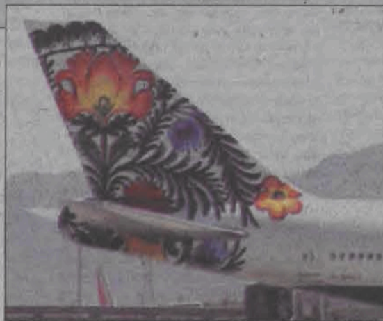
Pionowy statecznik samolotu wymalowany w tak bliskie nam wzory.

jak dawniej, powiedzieć pilotowi przez radio, by np. kierował się w ślad za samolotem British Airways, bo te wyglądały co rusz to inaczej. Swoją dezaprobatę dla malowideł z całego świata na ogonach brytyjskich samolotów dała wyraz podczas konferencji Partii Konserwatywnej w 1997 roku była premier Margaret Thatcher, zakrywając ogon modelu takiego samolotu własną chusteczką do nosa. Twierdziła ona, że samoloty w takich barwach wyglądają