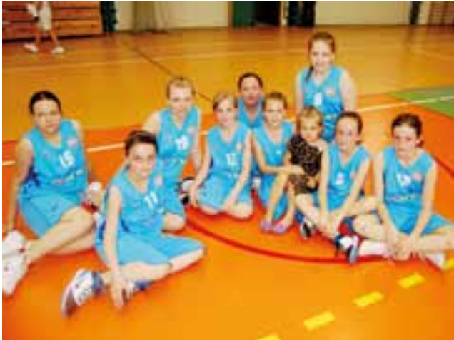
Skrzatki Księżaka Łowicz awansowały do czołowej czwórki.

W pierwszym meczu gospodynie zmierzyły się z nieobliczalną drużyną Orlika Ujazd. Rywalki wygrały dotąd tylko jeden mecz w sezonie, ale miały w swoim składzie dwie niezwykle groźne zawodniczki. W tym bardzo wyrównanym pojedynku o zwycięstwie rozstrzygała dogrywka, w której minimalnie lepsze okazały się koszykarki z Łowicza.