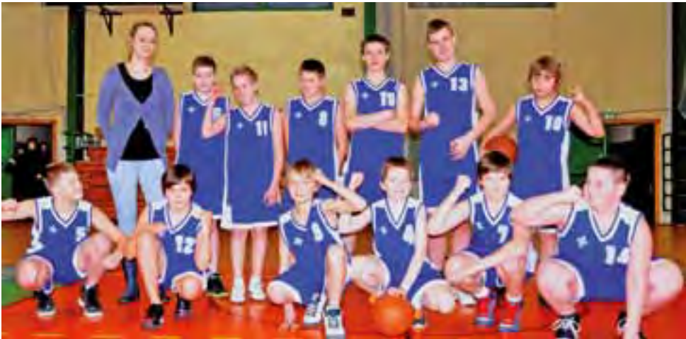
Jest „siła”, ale czy zespół Księżaka Łowicz z rocznika 2000 przetrwa?