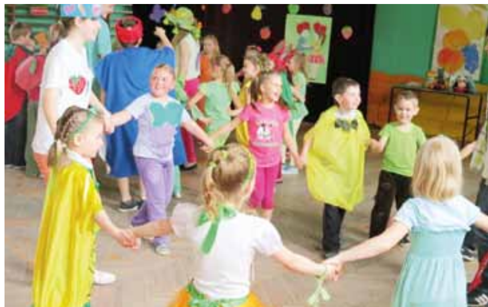
Zabawę dla najmłodszych poprowadzili gimnazjaliści z Błędowa.

Oprócz tańców kierowanych w poszczególnych klasach przez parę gimnazjalistów odbyły się również konkursy. W pierwszym