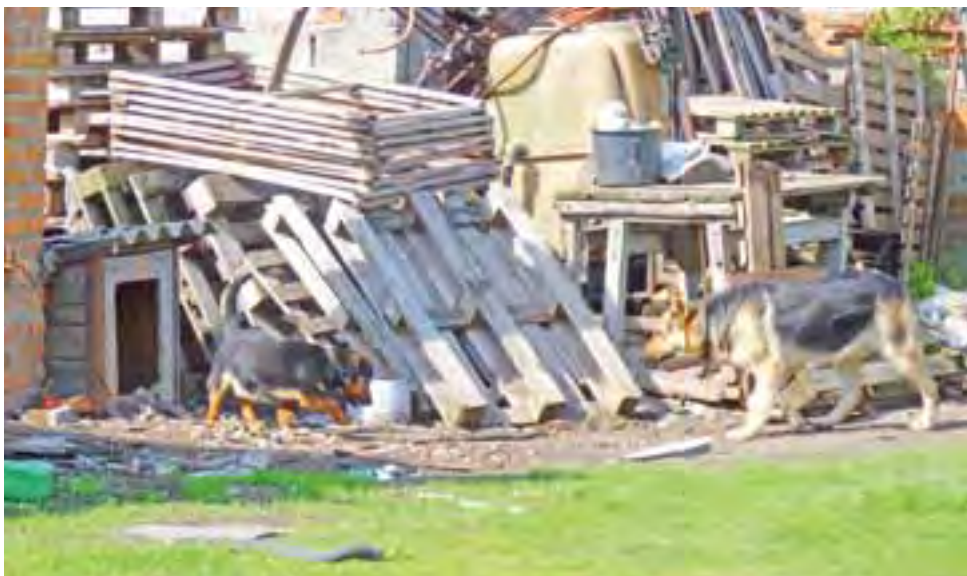
Mały kundelek uwiązany w budzie pogryzł 1,5-letniego chłopczyka.

Dwa lata temu w gminie Dąbrowice też został pogryziony