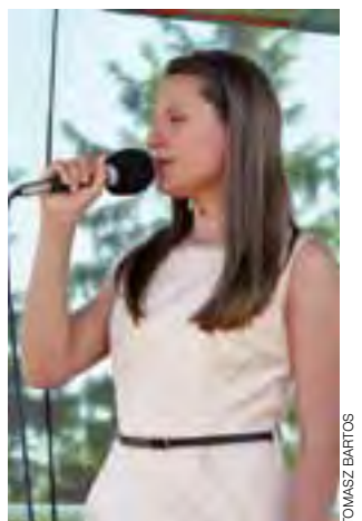
W czasie festynu wokalnie zaprezentowali się także uczniowie szkół żychlińskich.

Osoby, które chciały wesprzeć sfinansowanie turnusu, mogą to zrobić, wpłacając pieniądze na