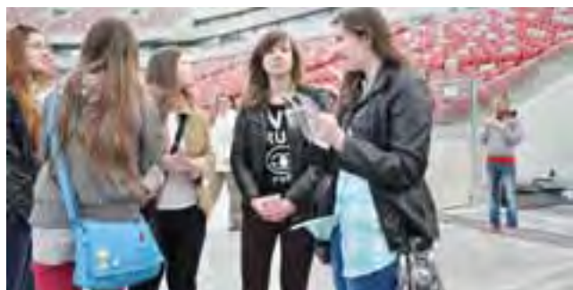
Gimnazjaliści na Stadionie Narodowym rozczerwieni byli brakiem murawy. Gdyby jednak była ona na płycie boiska, na pewno nie mogliby na nią wejść.