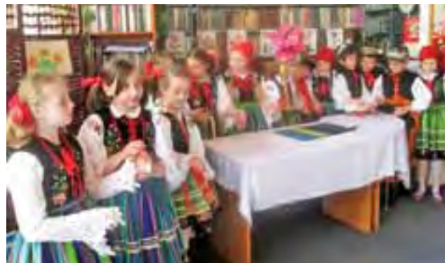
Zespół Tęcza wystąpił w bibliotece na Bratkowicach.

W zespole Tęcza występują dzieci z klas I-III, grupa liczy 20 osób. W przedstawieniu w Miejskiej Bibliotece w Łowiczu wzięli udział uczniowie z klasy IIIa. Wesele zostało bardzo radośnie przyjęte przez przedszkolaków. Dzieci wspólnie śpiewały łowickie przyśpiewki i klaskaly do ludowej