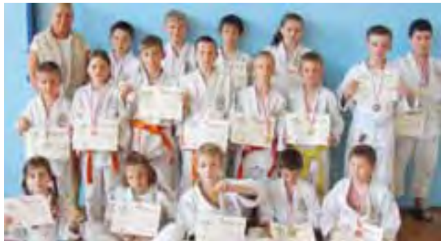
Judocy z Łowicza wywalczyli w Justynowie aż czternaście medali.