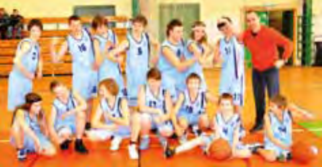
Młodzicy U-14 Księżaka Łowicz z rocznika 1999.

Zakończony już sezon juniorzy Księżaka Łowicz mieli przeznaczony na zdobywanie doświadczenia i ogrywanie się ze starszymi rywalami.