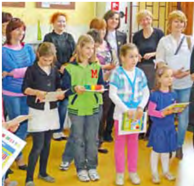
W konkursie nagrodzonych zostało 15 osób w 3 grupach wiekowych, a kolejnych 19 otrzymało wyróżnienia.