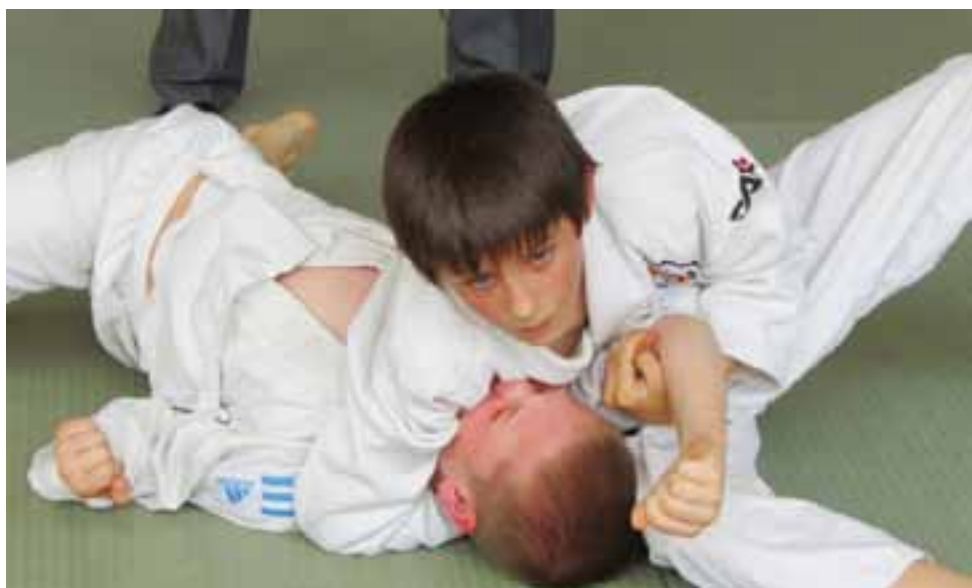
Łowiczanie mają za sobą bardzo udane zawody...

Skrzatki Księżaka awansowały do finału ligi wojewódzkiej U-11. str. 36