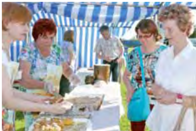
Ciasta na stoisku pracowni gospodarstwa domowego WTZ rozchodziły się w ekspresowym tempie.

Pod sceną zrobiło się ciasno jednak w momencie, gdy weszli na nią artyści Teatru Piccolo, którzy pokazali spektakl Urodziny Baby-Jagi, w którym wymieszały epizody z różnych bajek, okraszając całość humorem, który rozbawił dzieci. O godz. 19 rozpoczął się trwający do 21 koncert zespołu muzycznego EQRI,