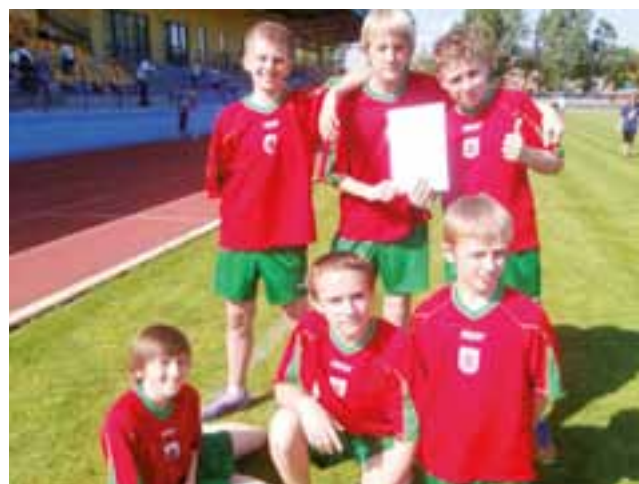
Lekkoatleci z SP Nr 2 Żychlin awansowali do dalszej rywalizacji w Czwórboju.