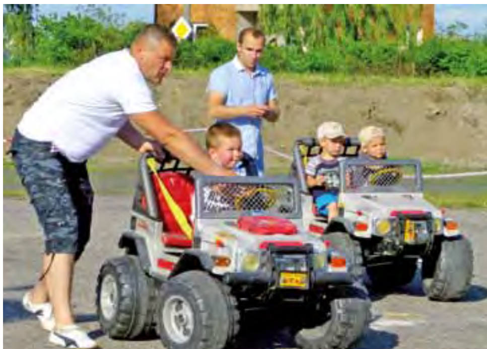
Obok samochodów dla najmłodszych nie przeszedł obojętnie żaden chłopiec.

który zagrał znane przeboje muzyki rockowej i pop, sprawiając, że przez dwie godziny pod sceną trwała doskonała zabawa.