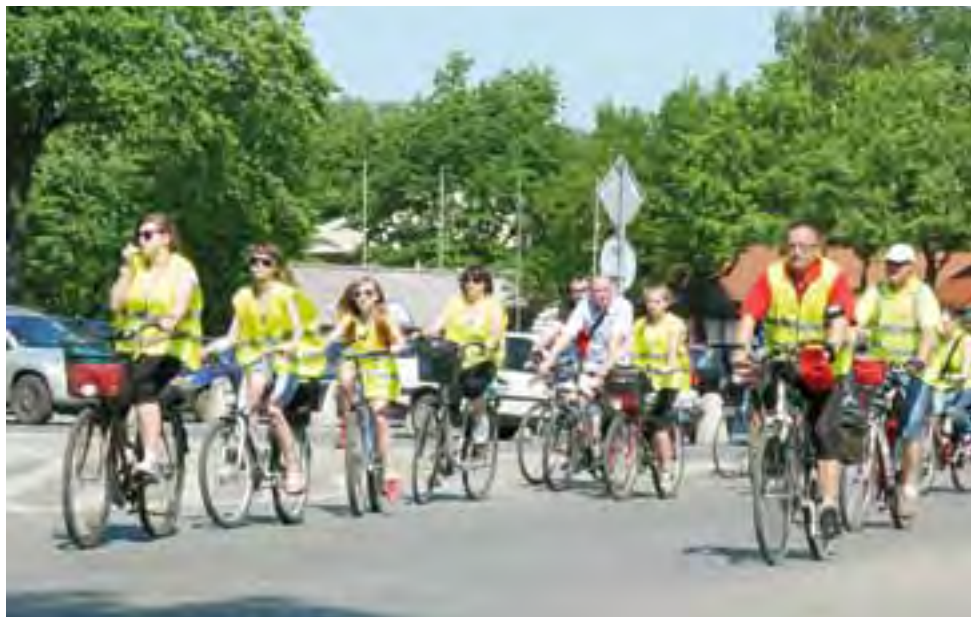
Turyści wystartowali w Łowiczu spod gmachu muzeum, aby po przejechaniu kilkunastu kilometrów dotrzeć do Nieborowa.

Tegoroczny rajd był jednak inny od poprzednich trzech. Łowiccy cykliści spotkali się na polanie Siwica w Puszczy Bolimowskiej z liczącą 140 osób grupą ze Skierniewic, po czym wrócili do Nieborowa, aby przez