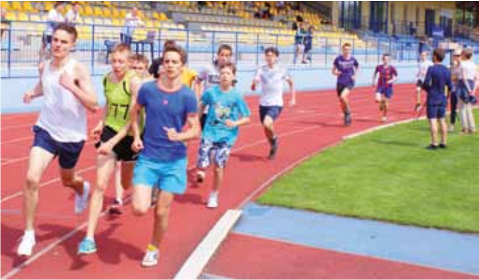
Zawodnicy z Gimnazjum Żychlin w biegu na 1000 m.