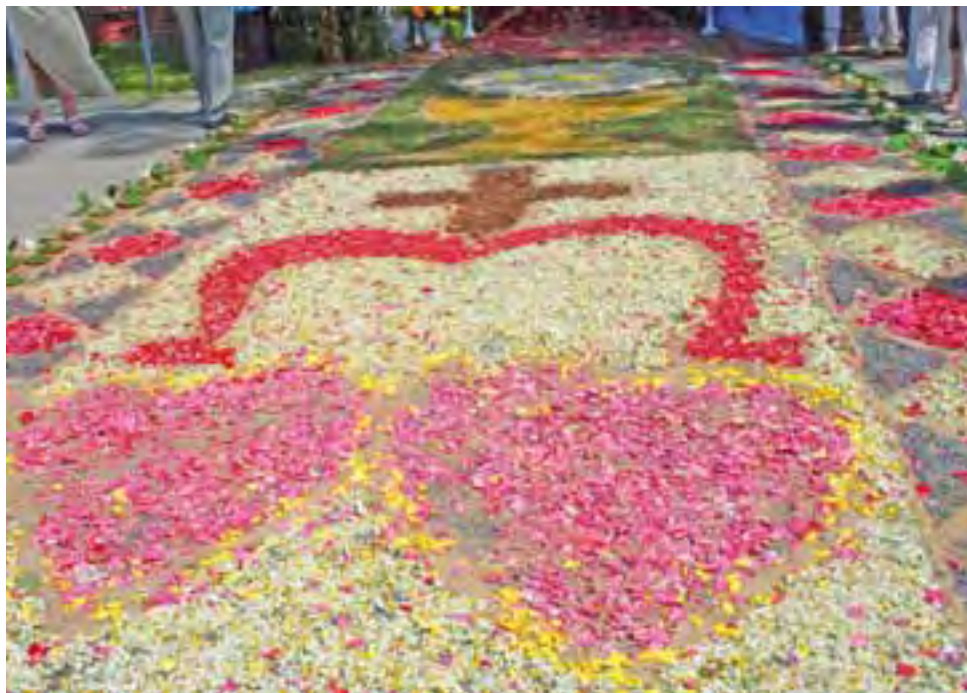
Kwiatowy dywan przed ołtarzem koło zamku w 2011 roku.