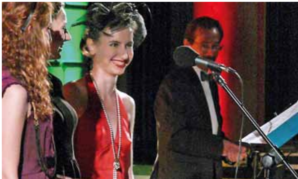
Noc Muzeów w Nieborowie rozpoczęła się od koncertu skierniewickiej grupy Banana Perwers.

Krzysztofa Zanussiego Memento mori w kinie Fenix. str. 23