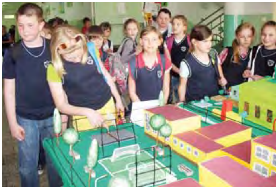
Makieta budynku szkoły dała zwycięstwo klasie VIb w konkursie międzyklasowym „Mój świat w figurach”.

Wcześniej bowiem uczniowie klas od IV do VI przygotowali makiety z figur przestrzennych przedstawiające charakterystyczne miejsca Łyszkowic.