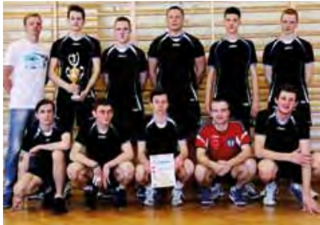
Za ekipą UKS Korabka Łowicz bardzo udany sezon, a teraz czas już na sezon plażowy...

Jednak największy sukces młodzi siatkarze osiągnęli podczas rozgrywek Skierniewickiej Ligi Siatkówki. Dla przypomnie-