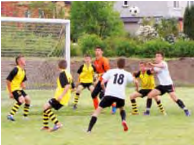
MKS Żychlin w sytuacji pod bramką drużyny GLKS Dąbrowianka Dąbrowice.