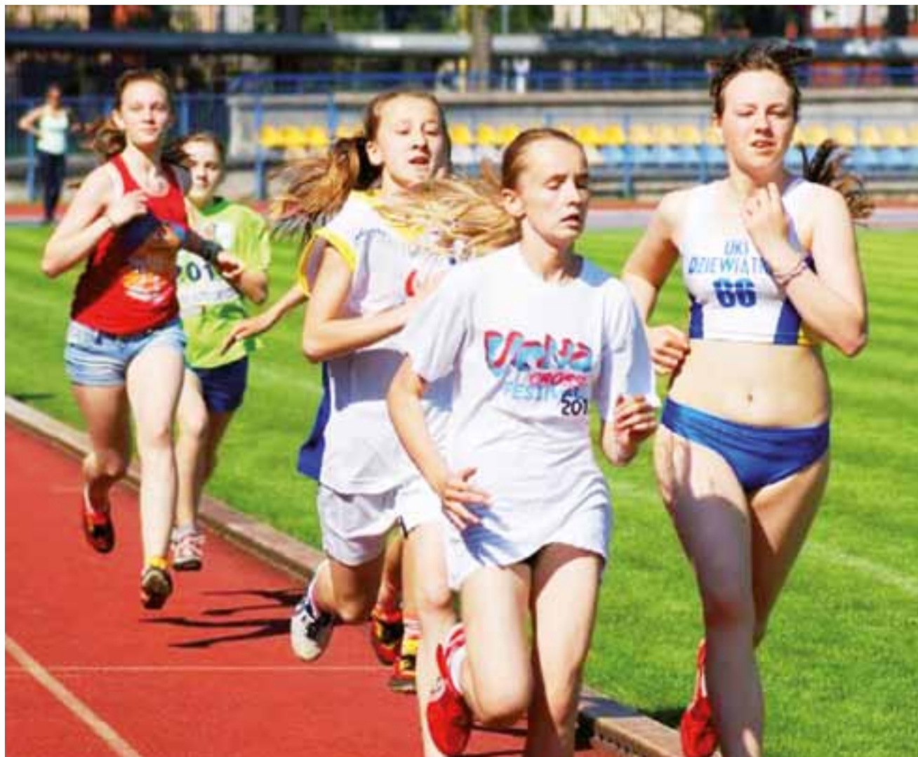
Reprezentantki SP Nr 2 Żychlin w biegu na 600 metrów.