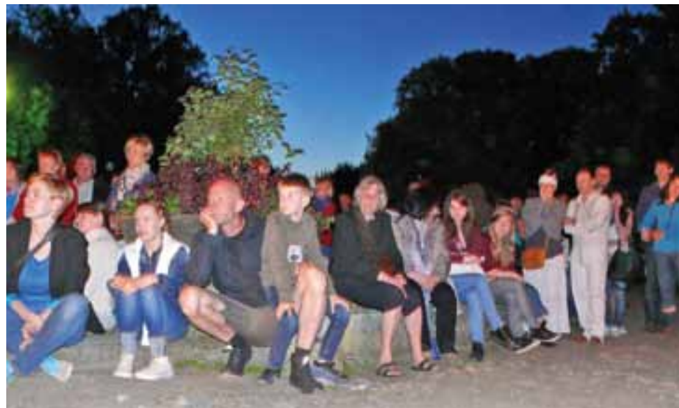
Widownia słuchająca koncertu, który odbył się przed ścianą frontową pałacu.

Noc Muzeów | Działo się głównie w Nieborowie