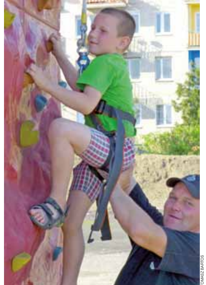
Ścianka wspinaczkowa dla jednych była łatwa, a dla innych prawdziwym wyzwaniem, ale na miejscu zawsze byli strażacy, którzy chętnie pomagali.