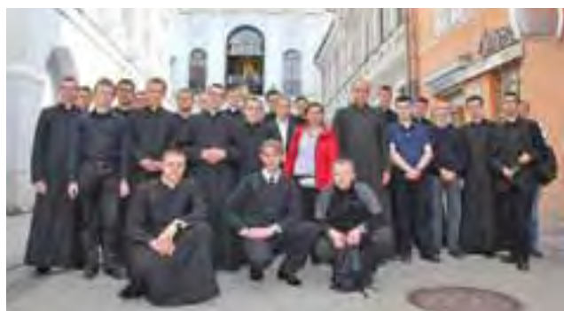
WYŻSZE SEMINARIUM DUCHOWNE W ŁOWICZU

Sanktuarium maryjne w Studzienicznej, pokamedulski klasztor w Wigrach i cmentarz na Rossie – to tylko część miejsc, które odwiedzili klerycy z łowickiego seminarium podczas 4-dniowego wyjazdu majówkowego. Na pielgrzymkę na Suwalszczyznę i na Litwę wyjechali 1 maja, do seminarium wrócili 4 maja. Jak sami mówią, majówka jest dla wielu z nich okresem regeneracji własnych sił przed zbliżającą się sesją egzaminacyjną. - Wyjazd przyniósł nam wiele nowych wrażeń, przeżyć, doświadczeń i atrakcji - podsumowuje jeden z kleryków. am