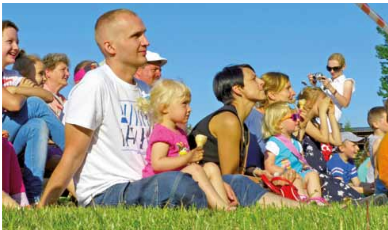
Publiczność pod sceną festynu integracyjnego, który odbył się w niedzielę 19 maja, oglądająca przedstawienie teatru Piccolo z Łodzi.

Żychlin | Zbierali pieniądze, aby pojechać na turnus rehabilitacyjny