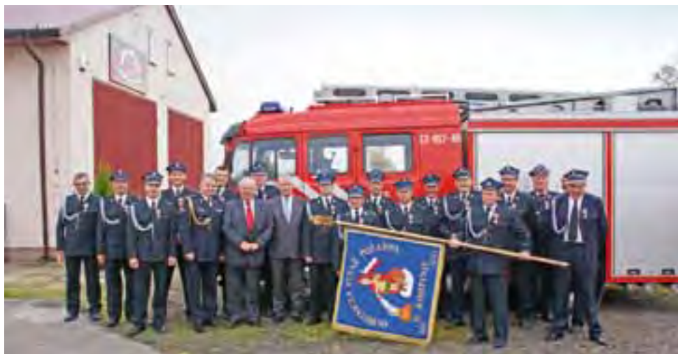
Strażacy OSP Kompina jeszcze z poprzednim sztandarem.