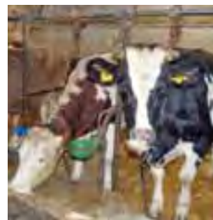
W szkole uczniowie poznają różne metody hodowli.

W pobliżu nowej obory (w miejscu, gdzie obecnie znajduje się okólnik) wkrótce mają stanąć także 4 silosy zbożowe – po 35 ton pojemności każdy. ZSCKR przeznaczył na ich zakup własne środki finansowe w wysokości około 90 tys. zł. W końcu kwietnia wylano posadzkę pod nowe silosy. W po-