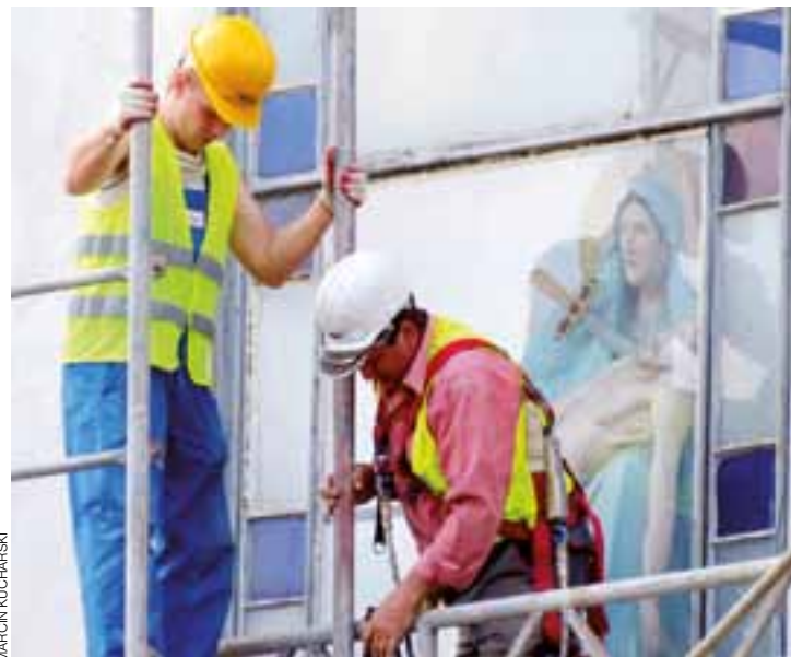
Remont zabytkowego kościoła pod wezwaniem św. Marcina biskupa w Oporowie w dekanacie żychlińskim rozpoczęło Przedsiębiorstwo Produkcyjno-Budowlano-Handlowe Król z Kłodawy. W ubiegłym tygodniu firma ustawiała rusztowania wokół kościoła oraz mieszczącego się tam klasztoru zakonu paulinów. mak