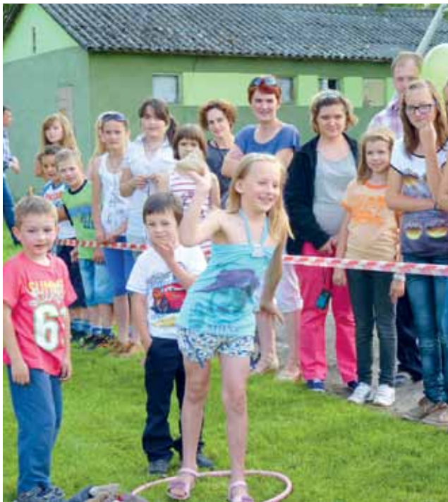
Jedną z atrakcji dla dzieci był rzut woreczkiem w hula hop. Zmagania najmłodszych oglądali ich starsi koledzy i rodzice.

W tym roku festyn przypadł w dzień odpustu parafii, która jest pw. Świętych Apostołów Piotra