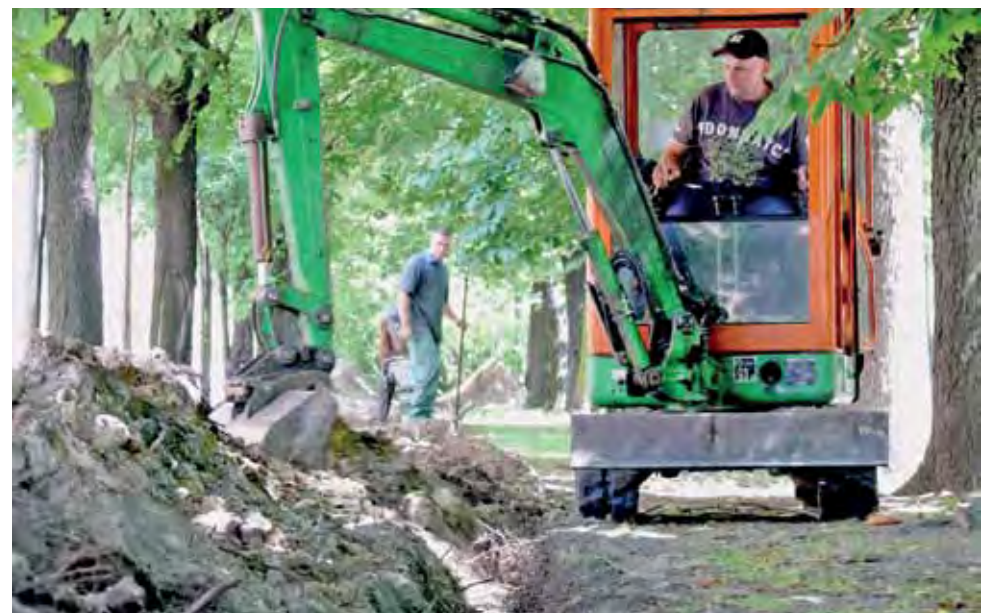
Łowicka firma Buding układa sieć gazowniczą w Alejach Sienkiewicza i na ul. Browarnej.

Deficyt w momencie oddawania budżetu za rok 2012 wynosił 363 896 zł, znacznie mniej niż rok wcześniej – 1.496.794 zł. tm