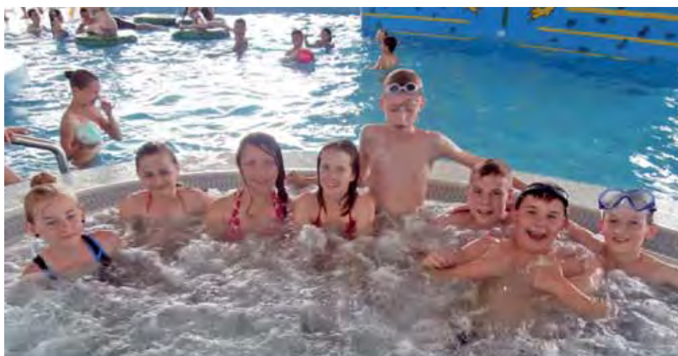
Uczniowie SP Nr 2 w Żychlinie relaksujący się w jacuzzi.