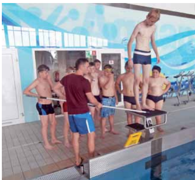
Instruowanie przez ratownika Aquaparku bezpiecznego skoku do wody.