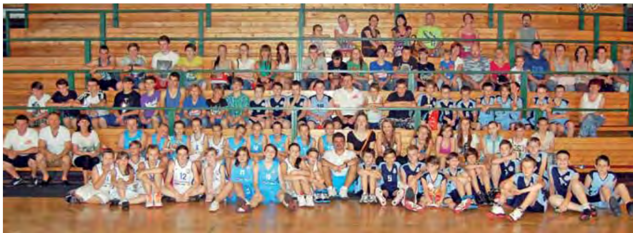
Koszykarki i koszykarze UMKS Książek Łowicz podsumowali zakończony sezon 2012/13.

Koszykówka | Zakończenie sezonu w UMKS Książek Łowicz