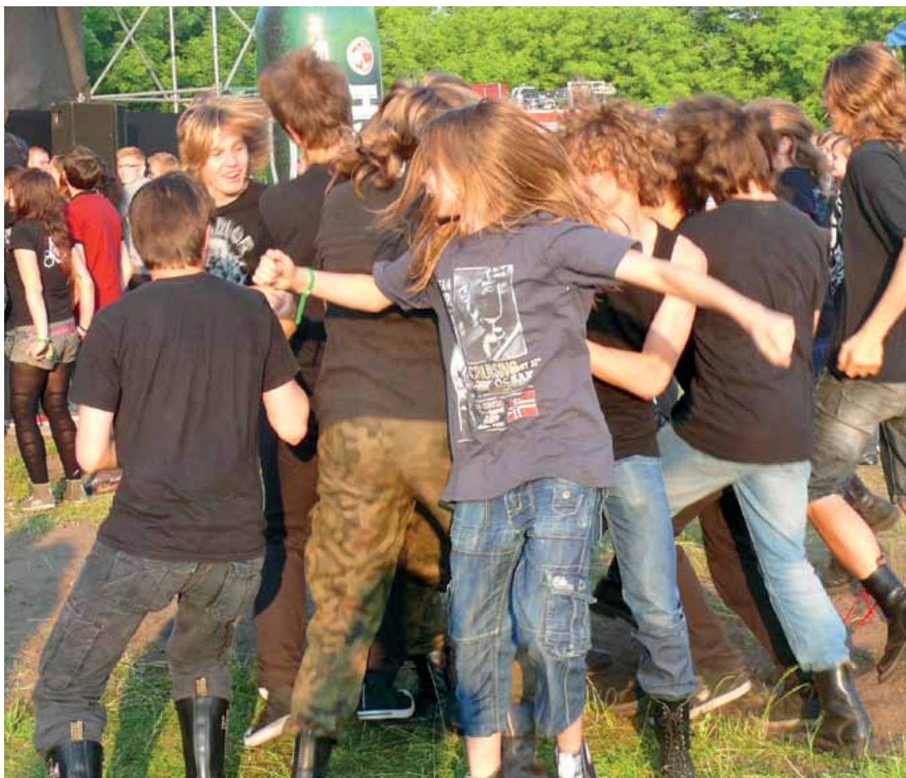
Ciemne koszulki i glany – to charakterystyczny ubiór młodzieży uczestniczącej w festiwalu. Na zdjęciu podczas zabawy na koncercie Chemii.

szemy o zespole w jednym z kolejnych numerów NŁ).