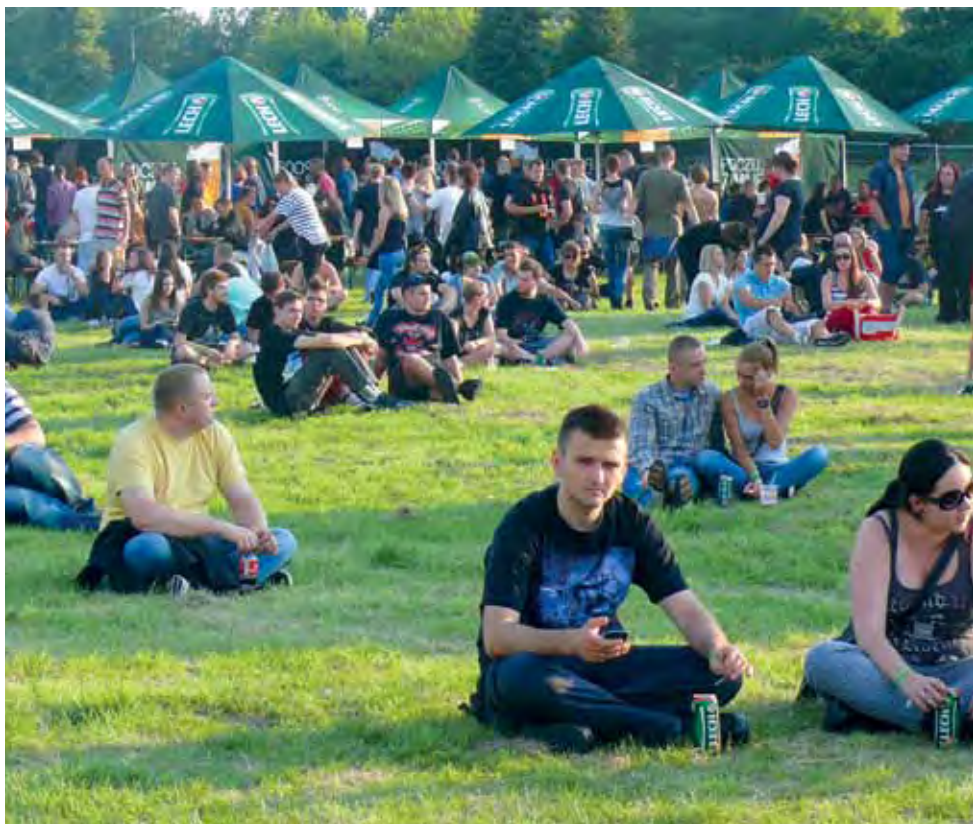
Lemon Festival to też wielki piknik, podczas którego można było napić się piwa i odpocząć.