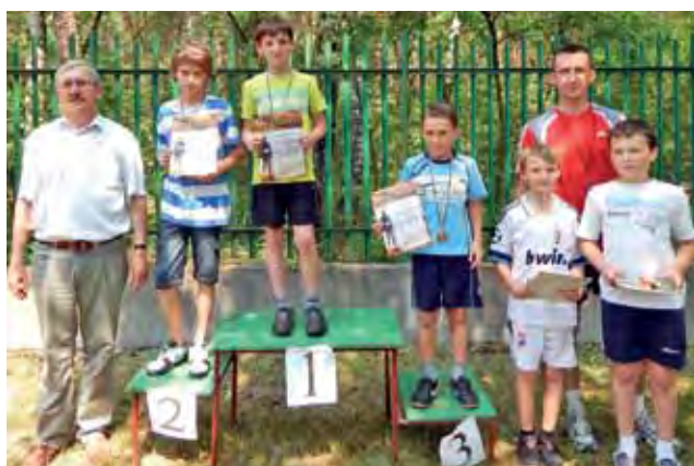
Najsztybsi trzecio- i czwartoklasiści na podium.