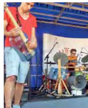
Recykling Bang zagrał na instrumentach zrobionych z odpadów.

Atrakcją pikniku był koncert zespołu Recykling Bang, którego muzycy grali na instrumentach zrobionych z butelek plastikowych, puszek po powidłach, ogórkach, dużej butli po wodzie itp. Mieszkańcy z zainteresowaniem patrzyli, jak z niczego można zrobić instrumenty i wydobyć z nich dźwięki, które tworzą muzykę. Nie dało się jednak ukryć, że ciężkie to brzmienie i nie wszystkim przypadło do gustu. dag