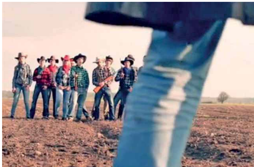
Screen z filmu „Dotyk wspomnień”.

Film nosi tytuł. „Dotyk wspomnień” i trwa nieco ponad minutę. Jego konkurencja była duża, w konkursie wzięły udział szkoły z pięciu województw – śląskiego, świętokrzyskiego, małopolskiego, opolskiego i łódzkiego. Do konkursu zgłoszono 250 minutowych filmów w konwencji westernu, spośród których 7 czerwca wybrano 50 najlepszych. Opieku-