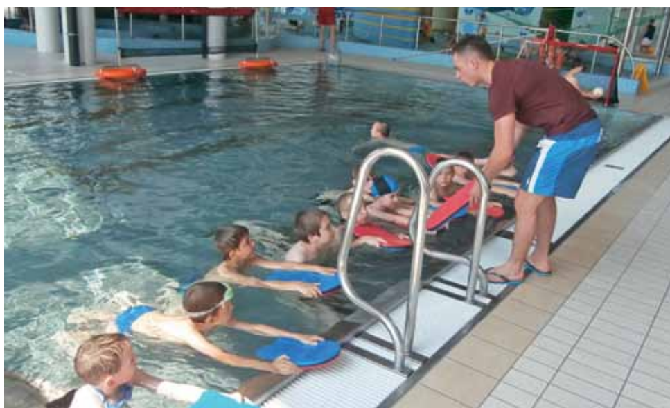
Nauka pływania z użyciem sprzętu pływackiego podczas pobytu w kutnowskim Aquaparku.