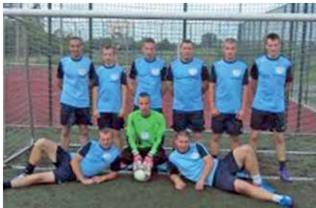
Drużyna z Żychlina BS Skład podczas Zduńskiej Amatorskiej Ligi Piłkarskiej Szóstek Seniorów.

Łącznie w I lidze jest 6 drużyn, które zagrają mecz – rewanż. W II lidze jest podobnie z tą różnicą, że rywalizuje na obecą chwilę 5 ekip. Nie-