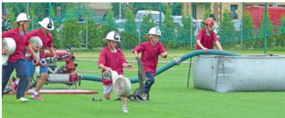
Ćwiczenie bojowe wymagało zaangażowania wszystkich członków drużyny.

Zmagania rozpoczęły się od zawodów dla grup młodzieżowych. Emocji nie brakowało, uczestnicy dawali z siebie wszystko, a nawet więcej. W ferworze walki zdarzało się niektórym wracać po zapomniany kask czy też łapać się za głowę, gdy nie chciała zadziałać motopompa.