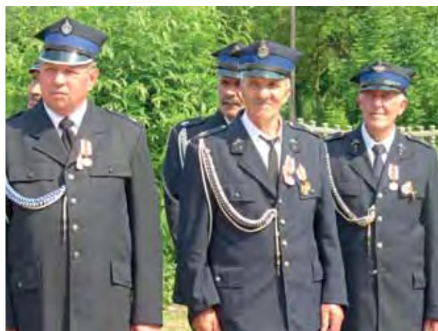
Odznaczeni druhowie z Soboty podczas uroczystości 100-lecia ich jednostki.

Wytrwałości w dalszej pracy, zaangażowania i sił życzyli druhom zaproszeni goście. Na zakończenie strażacy spotkali się na wspólnym obiedzie. am