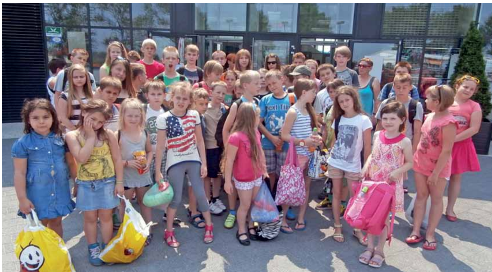
Uczniowie Szkoły Podstawowej Nr 2 w Żychlinie korzystający z wyjazdu do kutnowskiego Aquaparku, zorganizowanego przez Stowarzyszenie Przyjaciół Dwójki.

Sport szkolny | Wyjazd do Aquaparku w Kutnie