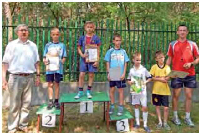
Nagrody otrzymali także chłopcy z klas 1-2.