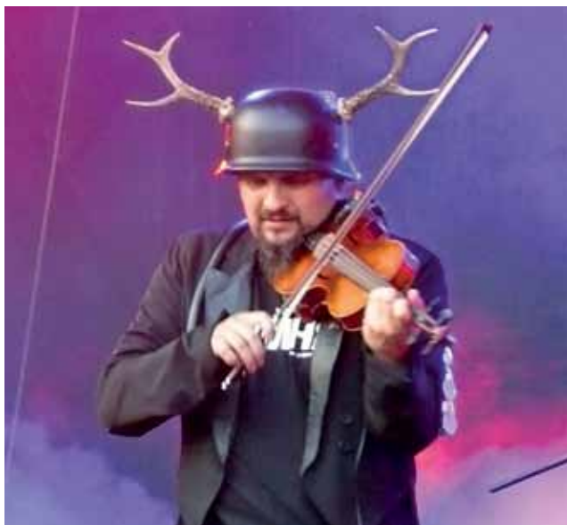
Jelonek w hełmie z rogami bawił publiczność przez kilkadziesiąt minut, a kiedy zszedł ze sceny publiczność domagała się bisu.