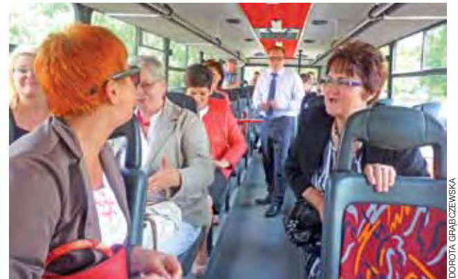
Radni jako pierwsi udali się na krótką przejażdżkę ulicami miasta nowym autobusem.

Kolejna biesiada już za rok, a patrząc na tegoroczną, nie wiadomo, czy ksiądz proboszcz nie będzie musiał powiększyć terytorium parafialnego podwórka. ag