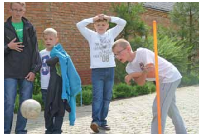
Jedną z atrakcji dla najmłodszych były zawody sportowe.

O 18 parafianie zgromadzili się na mszy świętej odprawionej w intencji ofiarodawców, a później znów powrócili na plac za