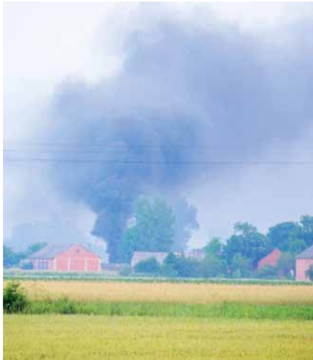
Na wysokości Załusina w gminie Bedlno, w niedzielę, 23 czerwca unosiła się czarna chmura dymu. To nie pożar, a skutek spalania opon.

– Dość takiego zachowania i smrodu w okolicy, który dech zapiera – mówili nam ludzie z okolicy, których poprosiliśmy o opinię na temat takiego zachowania. – Proceder trwa od kilku lat, a władza udaje, że nic nie widzi.