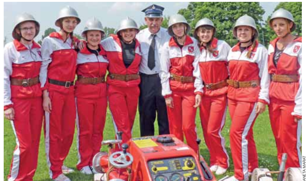
Dziewczęta z Bolimowa były jedynymi, które zdecydowały się wystąpić w zawodach sportowo-pożarniczych.

Nie licząc kilkusetmetrowego odcinka ul. Bolimowskiej, gdzie parę lat temu nowy chodnik połączono ze ścieżką dla rowerów, do której jednak wiele osób ma jakąś awersję i nadal woli przemieszczać się po jezdni, w Łowiczu i powiecie o rowerowych ścieżkach władza jakoś nie myśli i nic w tej mierze nie robi, choć w przedwyborczych deklaracjach takie obietnice się pojawiały. Rowerzysta bowiem w nowobogackim społeczeństwie to ciągle członek drugiego gatunku. Choć też przecież z prawem głosu. ■