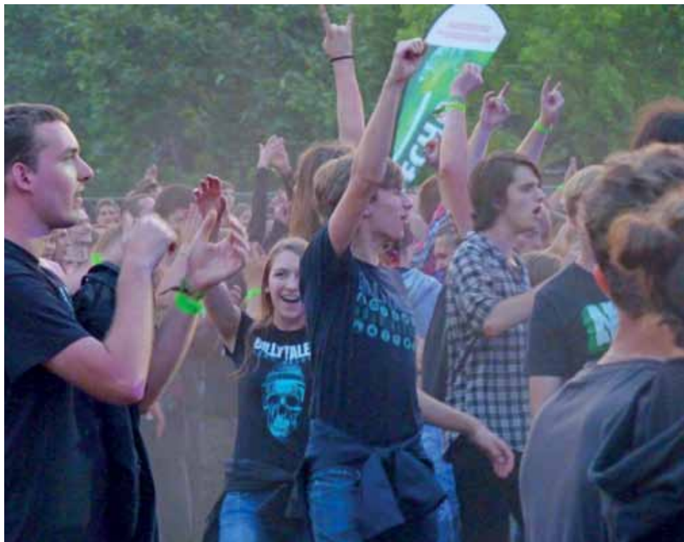
Festival był dla młodzieży doskonałą okazją, by się wyszaleć i dobrze bawić.