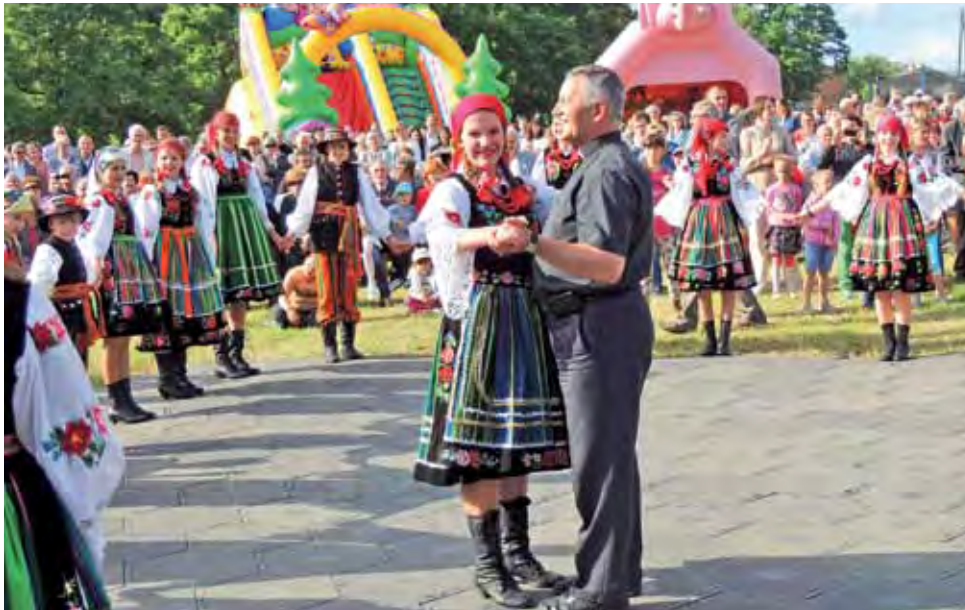
Takim tancerkom się nie odmawia – proboszcz w tańcu.

Przedstawiciele strażaków z Żychlina i ze Śleszyna wzięli udział w przeciąganiu liny: służby mundurowe kontra mieszkańcy Żychlina. Dopingowano obie drużyny, ale silniejsi okazali się strażacy. Zainteresowanym mieszkańcom pracownicy Urzędu Gminy Żychlin wyjaśniali na jednym ze stoisk zasady segregacji odpadów w związku z tzw.