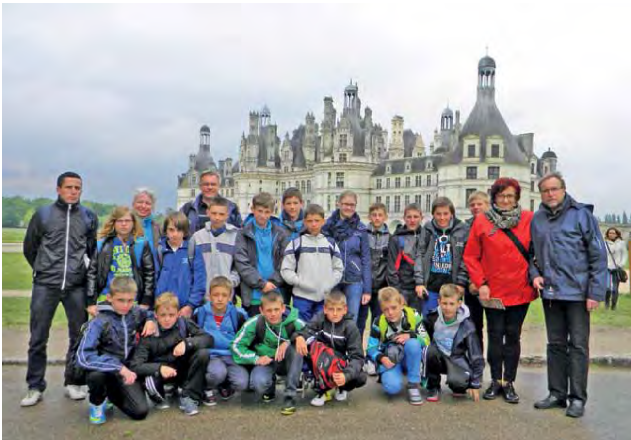
Delegacja z Łowicza miała okazję zwiedzić jeden z najpiękniejszych zamków nad Loarą - Chambord.

Piłka nożna | Międzynarodowy Turniej U-13 w Montoire sur le Loir