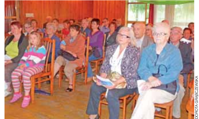
W walnym zebraniu spółdzielni Wspólny Dom uczestniczyły tylko 54 osoby.

nie ustalono. Azbest jest przyczyną pylicy azbestowej. Najbardziej są szkodliwe włókna krótkie, które przenikają do dolnych dróg oddechowych, wbijają się w płuca. Drażnią komórki, wywołują nowotwory. Największe ryzyko wchłaniania włókien azbestowych istnieje podczas prac rozbiórkowych. W 1997 r. na terenie Polski zakazano używania azbestu jako materiału budowlanego. Jednak w poprzednich dziesięcioleciach był to popularny materiał do produkcji eternitu na dachy czy wyrobu wodociągowych rur azbestowych. dag