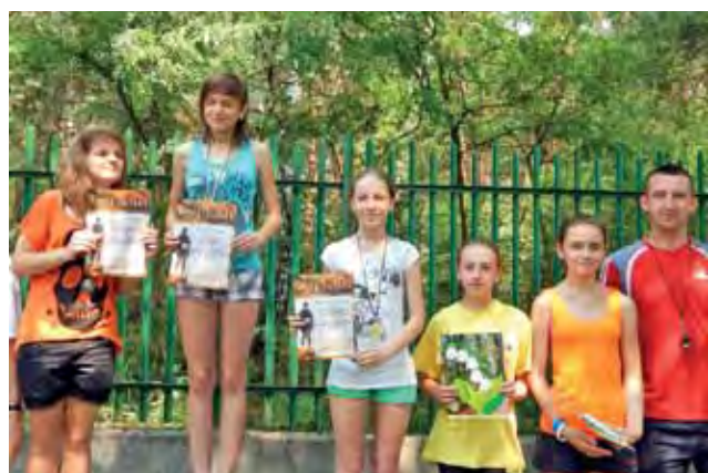
Zwycięzynie biegu na dystansie 1000 m dziewcząt z klas 5-6.