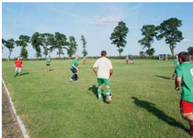
Mimo meczu sparingowego było widać zaangażowanie piłkarzy jak w meczu o punkty.

Piłka nożna | Rozgrywki Klasy B Grupy Łódź III