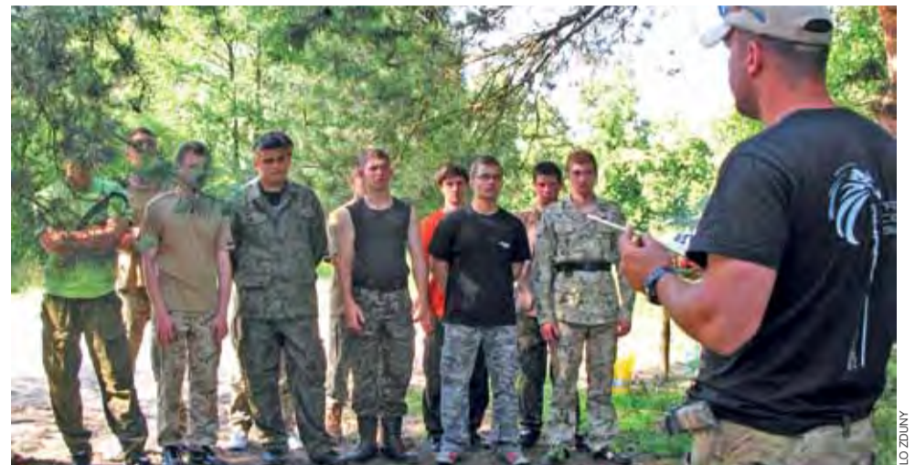
Tegoroczny biwak uczniowie mają już za sobą. Teraz czekają na kolejny.

Z bezinteresowną zawiścią, przepojoną jadem i zakamuflowaną na ogół wrogością w stosunku do bliźnich, spotykamy się niestety dość często. Zarówno w małych, jak i dużych środowiskach. Opowiadają mi czasem łowicki biznesmeni, którym – przynajmniej finansowo – w życiu się powiodło, że z takimi postawami mają do czynienia niemal na co dzień. Jakoś nie chciała się w wielu z nas wykształcić postawa podziwu dla tych, którym się udało. Przeważnie dzięki wiedzy i wielkiej pracowitości i jeśli oczywiście działali zgodnie z obowiązującymi prawem, dobrymi obyczajami, zwykłą przyzwoitością, za to np. wyczuwając rynkową koniunkturę. Do mentalności amerykańskiej nie dorosiliśmy i pewnie długo jeszcze nie dorosniemy.