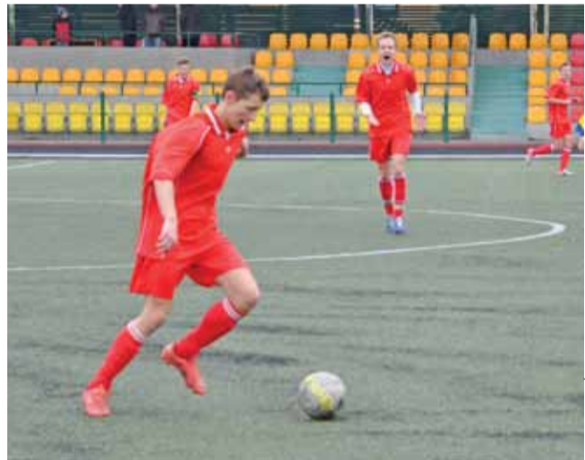
Pelikan-96 chyba za rzadko grał w optymalnym składzie.

Zespół Pelikana Łowicz z rocznika 1996-997 w sezonie 2012/2013 rywalizował w wojewódzkiej lidze juniorów młodszych. Łowiczanie, razem z Laktozą Łyszkowice, znaleźli się w grupie B, gdzie walczyli jeszcze z GKS Bełchatów, LUKS Bałucz, Widzewem Łódź, MKS Zduńska Wola i Włókniarzem Żelów. Jesienią podopieczni trenera Leszka Sowińskiego nie spisywali się w tej rywalizacji najlepiej. Łowiczanie cały czas mieli kłopoty kadrowe, a brak przede wszystkim rasowych następców skutkowało słabą skutecznością. Choć poprawa była widoczna, bo udało się zdobyć dwadzieścia bramek. W tabeli rundę jesienią Pelikan zakończył na szóstej lokacie w gronie siedmiu ekip i zdołał wyprzedzić