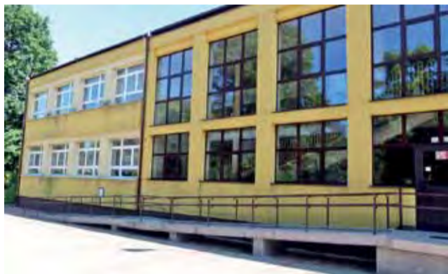
Szkoła Policealna Samorządu Województwa Łódzkiego (przy II LO) ma już bursę dla własnych uczniów, która będzie działać niezależnie od sąsiedniej bursy powiatowej.

Dodaje jednak, że już przy 30 lokatorach prowadzenie bursy będzie opłacalne i tę liczbę uważa za próg niezbędny do jej utworzenia. Wstępne rozeznanie pokazują, że można liczyć na więcej chętnych. - Z przeprowadzonych przez starostwo rozmów z zainteresowanymi, czyli ze szkołami, rodzicami i samymi uczniami, wiemy, że możemy liczyć na 35 osób - mówi Krzysz-