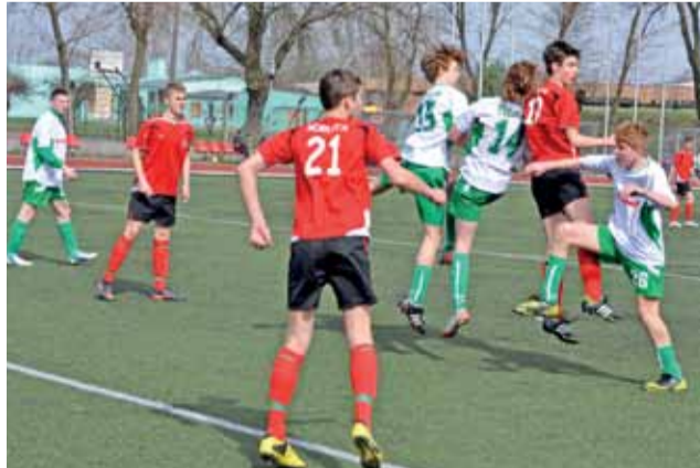
Pelikan Łowicz utrzymał się w lidze wojewódzkiej rocznika 1998.