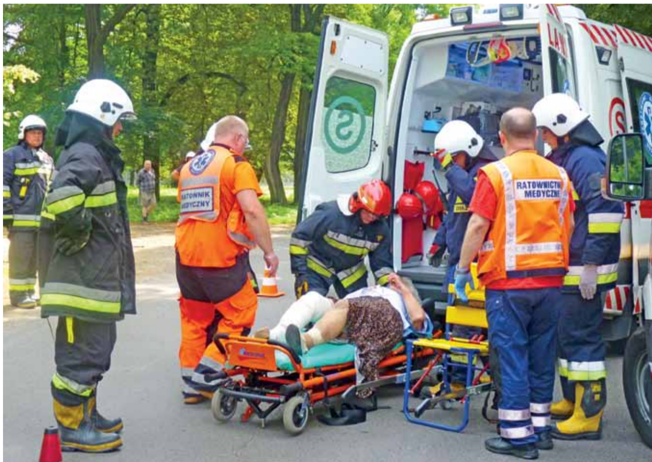
77-letnią pasażerkę autobusu komunikacji miejskiej, ze złamaną prawą nogą zabrało pogotowie Falcka.