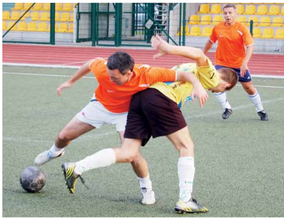
W meczu na szczycie broniący tytułu nauczyciele z ZNP ulegli Diagramowi Plast aż 0:3.