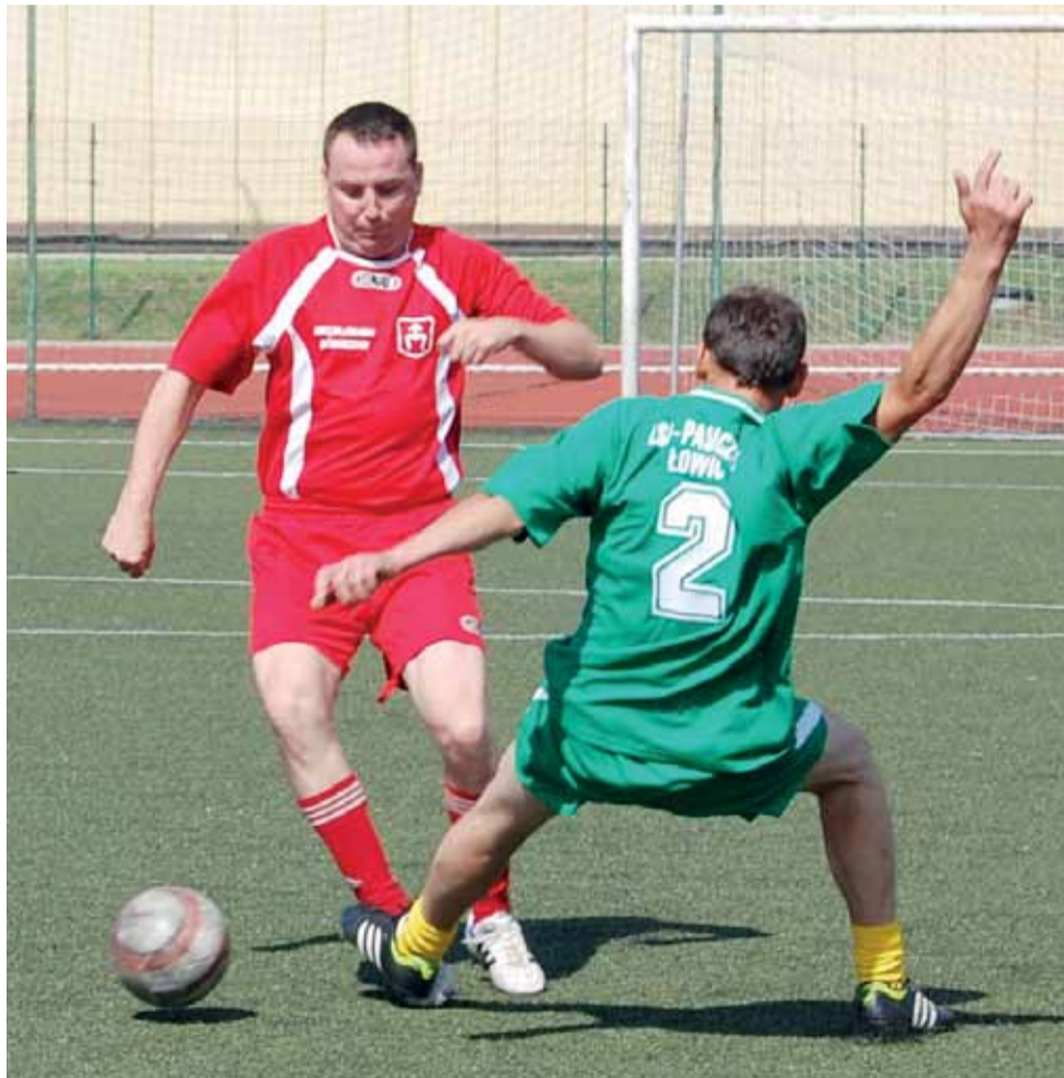
Drużyna łowickiego Pasiaczka wygrała i przegrała po dwa mecze, ale zajęła dopiero czwarte miejsce.