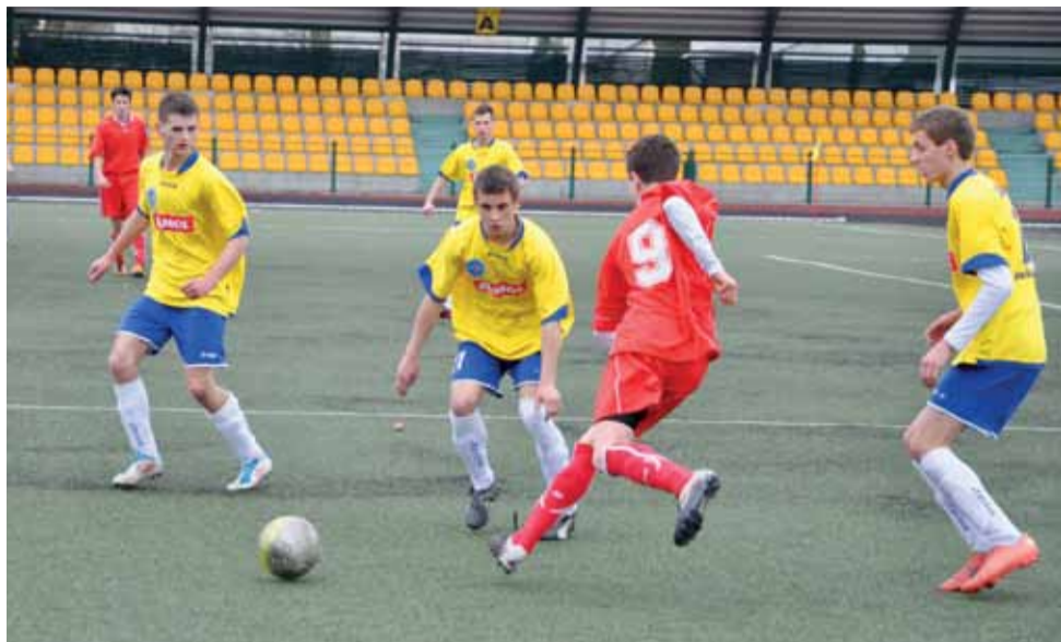
Zawodnicy Laktozy-96 udowodnili, że drzemie w nich naprawdę spory potencjał.

W 2013 roku w lidze zagrały połączone zespoły z grup A i B. W stawce jedenastu ekip Laktoza ponownie grała dobrze i pokazała, że jest mocna ekipa. Wprawdzie nie udało się pokonać żadnej piłkarskiej potęgi, ale Laktoza pokazała, że rządzi w regionie. Ograła Pelikana Łowicz, MKS Kutno, Widok Skierniewice, a także zespoły ze Zduńskiej Woli, Tuszyńska i Żelowa. Mówiło się, że z zespołu odejdą podstawo-