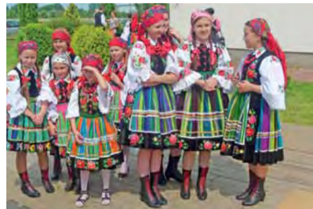
Dziecięcy Zespół Ludowy „Kocierzewiaczy” przed występem w Gągolinie Południowym.

rego prezentowany jest wybrany kraj Unii Europejskiej. W tym roku uczniowie klas IV-VI przybliżyli koleżankom i kolegom kulturę Irlandii. Innymi atrakcjami dnia były: gry i zabawy ruchowe, badminton, piłkarzyki, malowanie, rysowanie i poczęstunek. tm