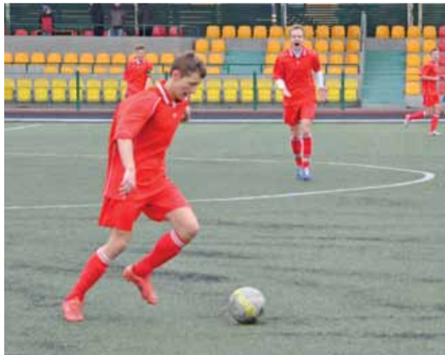
Pelikan-96 chyba za rzadko grał w optymalnym składzie.