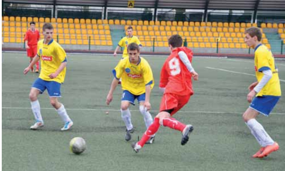
Zawodnicy Laktozy-96 udowodnili, że drzemie w nich naprawdę spory potencjał.

W 2013 roku w lidze zagrały połączone zespoły z grup A i B. W stawce jedenastu ekip Laktoza ponownie grała dobrze i pokazała, że jest mocna ekipa. Wprawdzie nie udało się pokonać żadnej piłkarskiej potęgi, ale Laktoza pokazała, że rządzi w regionie. Ograła Pelikana Łowicz, MKS Kutno, Widok Skierniewice, a także zespoły ze Zduńskiej Woli, Tuszyńska i Żelowa. Mówiło się, że z zespołu odejdą podstawo-