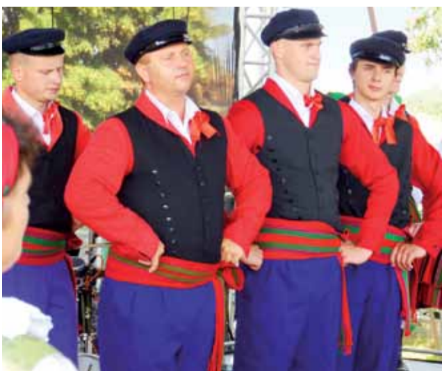
Męska część zespołu Sanniki w charakterystycznych czapkach, tzw. maciejówkach