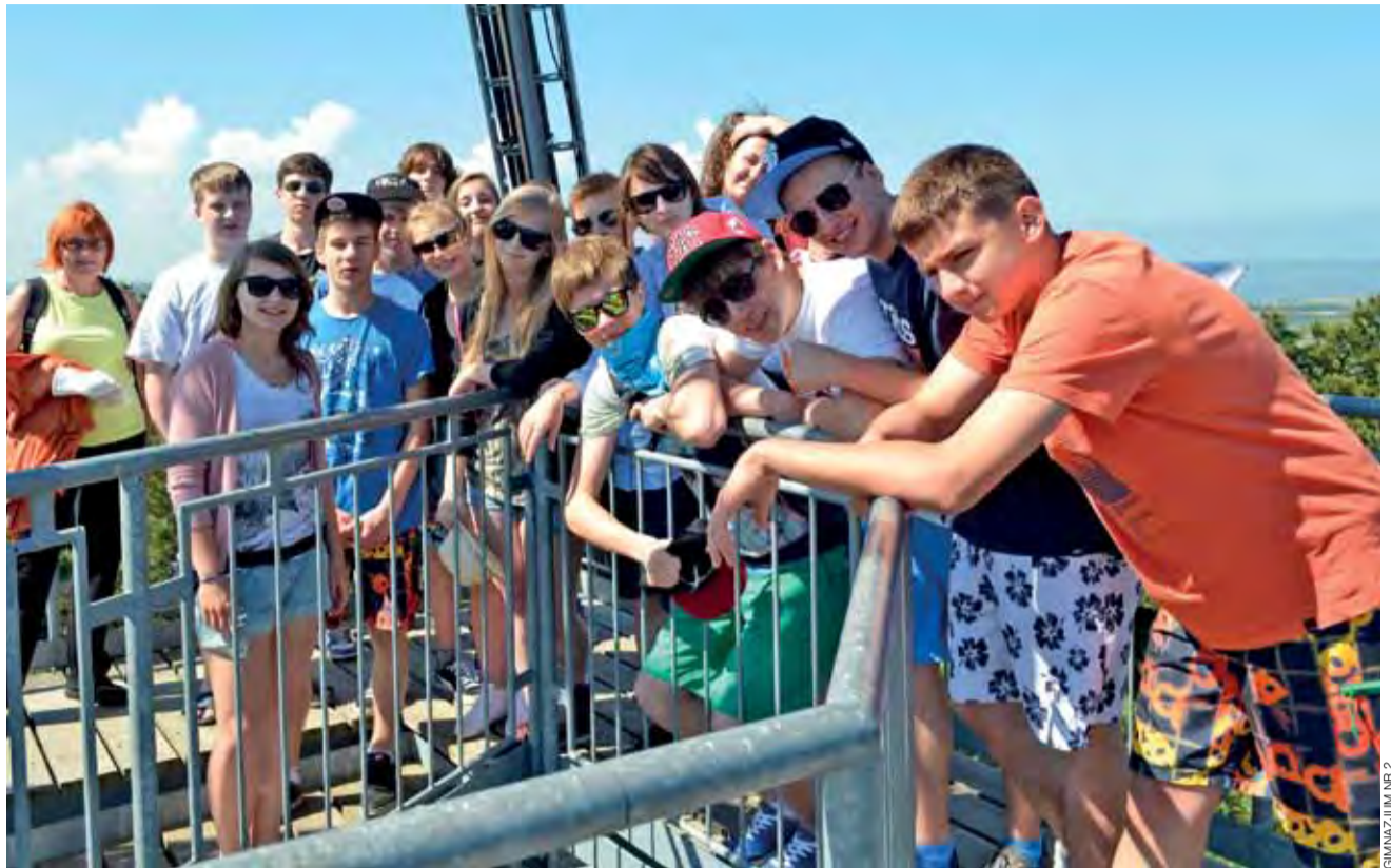
Uczniowie gimnazjum wspólnie z dyrektorem szkoły na szczycie latarni.