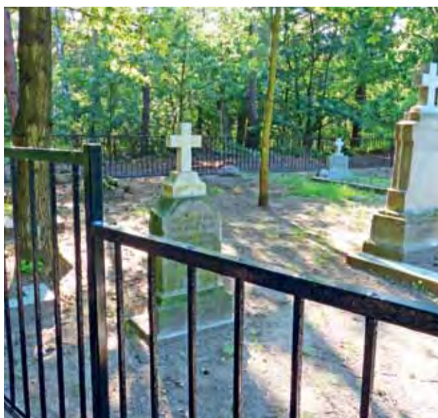
Cmentarz w Karolewie – wkład pracy mieszkańców jest już dobrze widoczny.