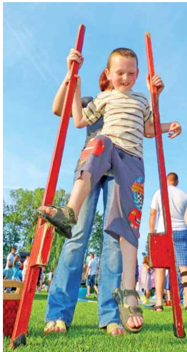
Kto w dzieciństwie nie marzył, aby spróbować chodzić na szczydłach. W Chaśnię marzenie to można było spełnić.