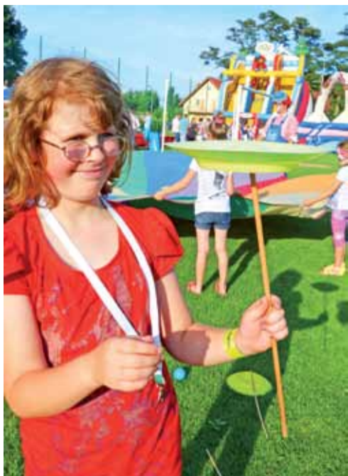
Dzięki cyrkowcom można było nauczyć się np. kręcenia talerzem na kiju.