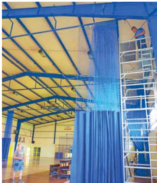
Pracownicy firmy Pesmenpol z Myślenic 2 lipca montowali kotary dzielące salę gimnastyczną na trzy części.