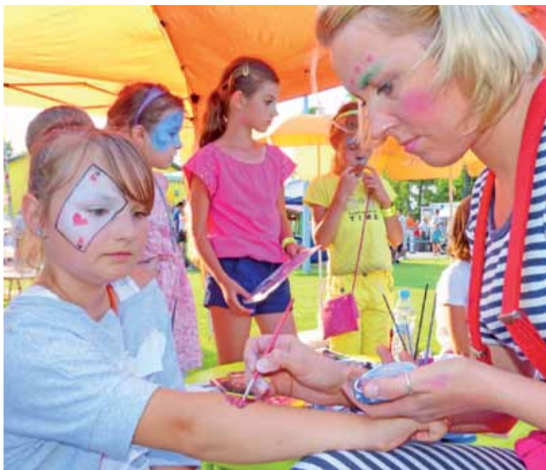
Chętnych do pomalowania twarzy i rąk było wielu, ale o godz. 20 wizażystki definitywnie skończyły pracę.