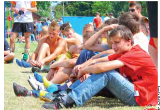
Gdy tatusiowie grali, ich poczynaniom przyglądali się synowie startujący w grupie seniorów.

Już słyszę śmiech żony i dzieci, że ojcu zachciało się sportu a teraz leży i nie może się ruszyć