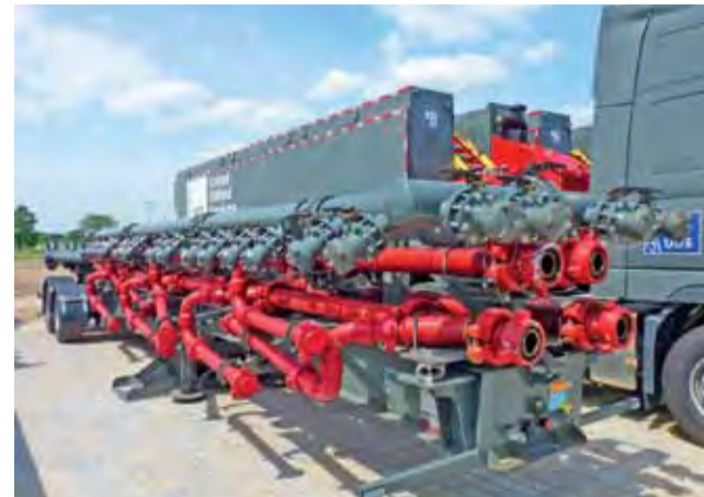
Mani-fold – urządzenie do rozdzielania płuczki na kilka pomp.

Sierpień, kiedy to planowane jest przeniesienie bazy z Torunia do Łowicza, będzie też miesiącem, w którym dotychczasowi pracownicy spółki zaczną