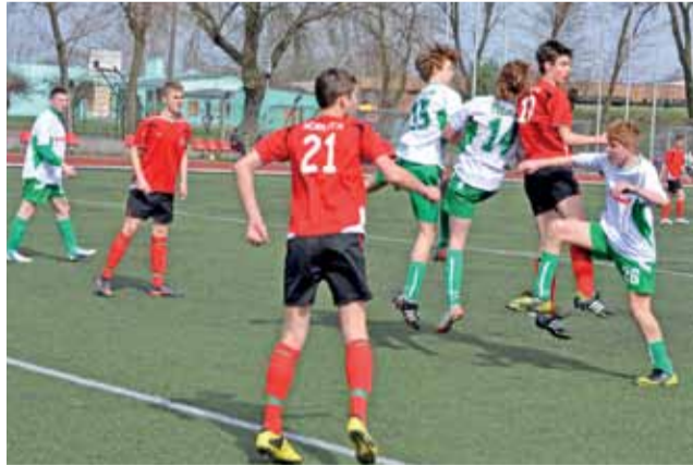
Pelikan Łowicz utrzymał się w lidze wojewódzkiej rocznika 1998.