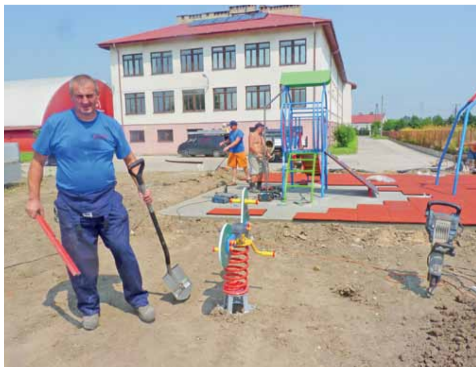
Plac zabaw koło szkoły w Grabowie firma Comes z Szydłowca urządziła w dwa dni.

Na wszystkie urządzenia oraz syntetyczne podłoże są certyfikaty. Plac jest tak urządony, że w przyszłości będzie można go rozbudowywać. Znajduje się za szkołą, obok boiska. Korzystać z niego będą wszystkie dzieci z podstawówki.