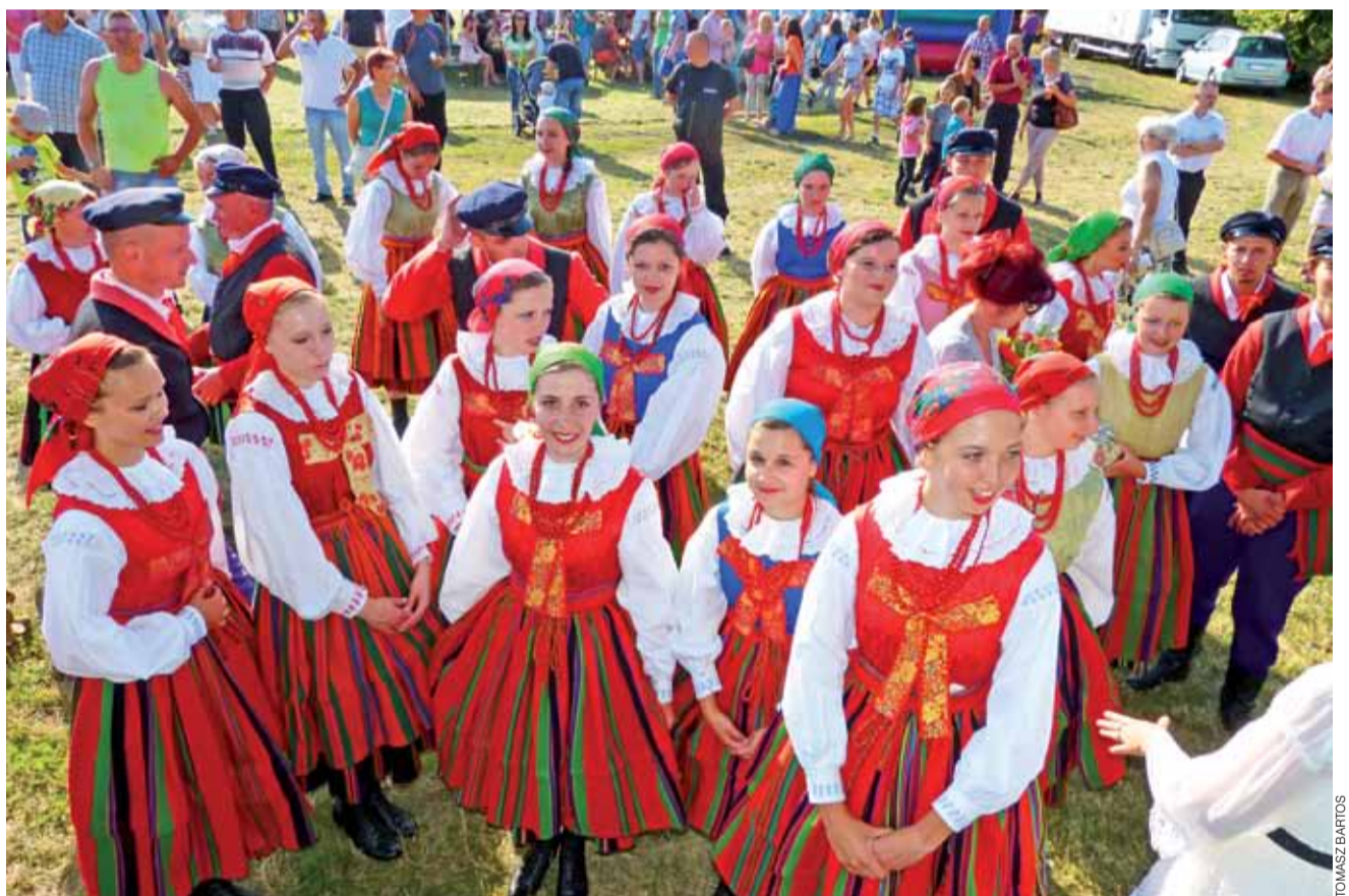
Damska część zespołu Sanniki tuż po zakończonym występie.