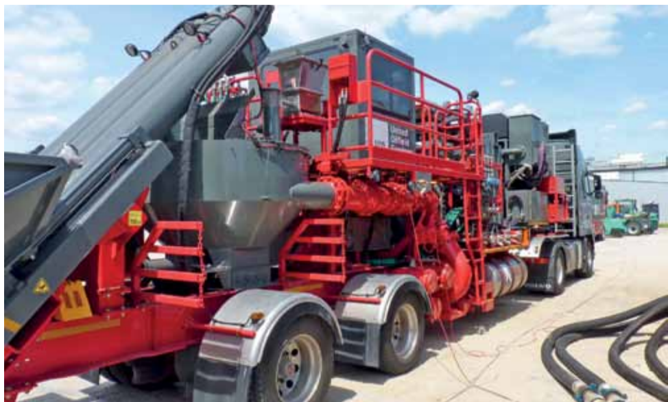
Blender – w nim powstanie mieszanina wody z piaskiem, która będzie wtłaczana w szczeliny w skale.