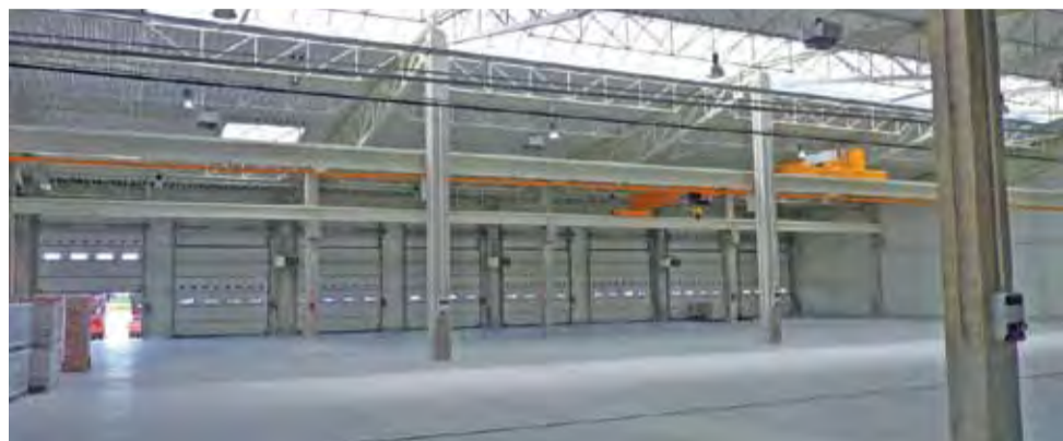
Hala serwisowa – na razie stoi pusta.

Szczelinowanie to niebezpieczna operacja: wykorzystywane ciśnienia rzędu kilkuset atmosfer sprawiają, że na placu, z którego dokonuje się odwiertu – a potrzeba na to od 1 do ponad 3 ha miejsca, wszystko musi być dokładnie oznaczone: gdzie