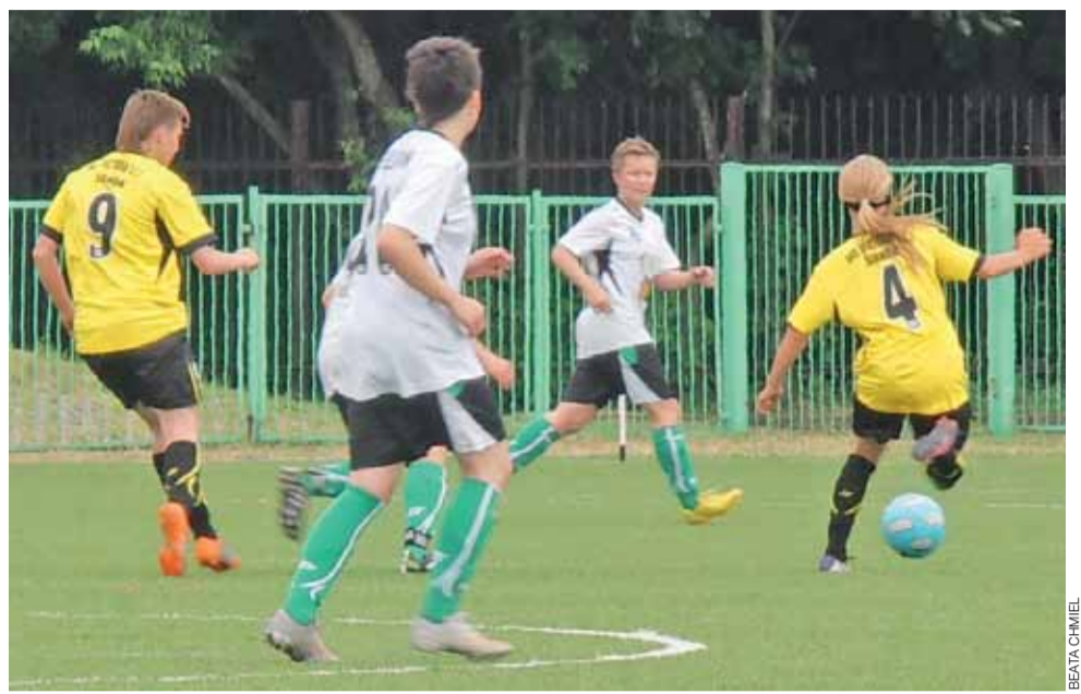
Pelikanki w rundzie wiosennej ani razu nie zostały pokonane na boisku. Na koniec ukarano je walkowerem.

Tydzień później nasza drużyna nie doczekała się na przyjazd do Łowicza Naprzodu Sobolów, w weekend 15-16 czerwca Pelikan co prawda pauzował, ale Zielonka grała (wygrała ze Szreniawą Nowy Wiśnicz 10:0 i znowu nie można była odrobić zaległości). W kolejny weekend Zielonka rozegrała zaległy mecz 17. kolejki z Morawią Morawica wygrywając 4:0, ale w tym czasie Pelikanki wygrały już w półfinale baraży o awans do I ligi z UKS Victoria SP 2 Sianów 4:1. – Następnego dnia odezwał się do mnie trener Zielonki, który zaproponował termin 29 czerwca – mówi tre-