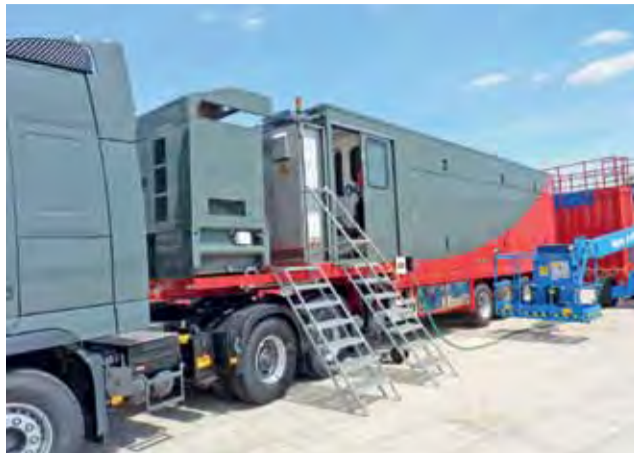
Samobieżne laboratorium umożliwi kontrolę procesu szczelinowania.

Z ustalonej głębokości pobiera się tzw. rdzeń, czyli próbkę skały. Jest ona własnością firmy mającej koncesję – i jest wysyłana do laboratorium w Houston w Teksasie. Ciekawostką jest, iż do tego samego, bardzo wyspecjalizowanego laboratorium wysyłane są próbki od wszystkich koncesjonariuszy, z najróżniejszych odwiertów. Badanie zawartości gazu w próbce trwa wiele miesięcy. Jeżeli specjaliści z Houston orzekną, że złożo jest perspektywiczne, przystępuje się do właściwego szczelinowania. Do pionowego otworu wprowadza się tzw. perforator, czyli rurę z wieloma otworami dookoła, z zawartym w niej ładunkiem wybuchowym – i odpala. Siła wybuchu tworzy rozchodzące się promienie od otworu spękania w skałę. Wyciąga się wtedy perforator, wprowadza do otworu głowicę i za jej pomocą wtłacza w powstałe szczeliny mieszaninę wodno-piaskową. Woda, wtłaczana pod ogromnym ciśnieniem, rozszerza spękania, a drobiny piasku