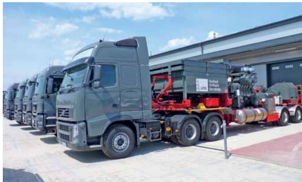
Łowicz będzie bazą dla 30 takich samochodów z pompami do szczelinowania.

Łowicz | Baza poszukiwaczy gazu bliska otwarcia