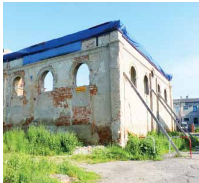
Mury synagogi są zabezpieczone , choć część drewnianych podpór została skradziona. Zamiast sześciu podpór, zostały trzy.

– Wstępnie posegregowane przez mieszkańców odpady trafią na linię sortowniczą, na początku zostaną odseparowane szklane butelki, puszki, później będzie odzyskana makulatura, która zostanie sprasowana, reszta odpadów trafi do rozdrabniacza – opowiada Marek Materka. – Dodatkowo chcemy zamontować wentylator, aby uzyskiwać już suchy produkt. Z produkcją ruszymy, jak tylko podpiszemy umowę z cementownią. ■