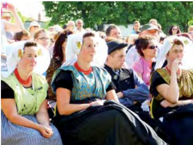
Występ Zespołu Sanniki z zaciekawieniem oglądali członkowie holenderskiego zespołu Scaldis z Hansweert.