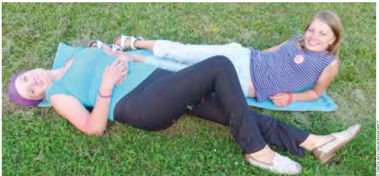
Tak się bawią pielgrzymi! Nawet osoby bardzo zmęczone i stojące z boku w końcu dały się wciągnąć do wspólnej zabawy.