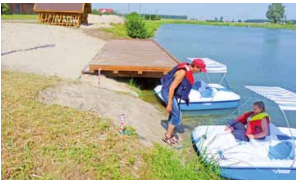
Od 1 sierpnia ruszyła wypożyczalnia rowerów wodnych nad stawem w Oporowie. Jest czynna od godz. 11 do 19 każdego dnia.

Pogotowie powiadomiło o zajściu policjantów z Żychlina. – Gdy policjanci wylegitymowali 50-letniego mężczyznę, który był kompletnie pijany, usłyszeli ku swemu zdziwieniu, że nic się nie stało, nie wnosi żadnych pretensji, że ktoś go pobił. Mało tego, zaczął tak szybko uciekać przed policjantami, że aż pogubił klapki. Interwenujący policjanci po raz pierwszy widzieli takie dziwne zachowanie. dag