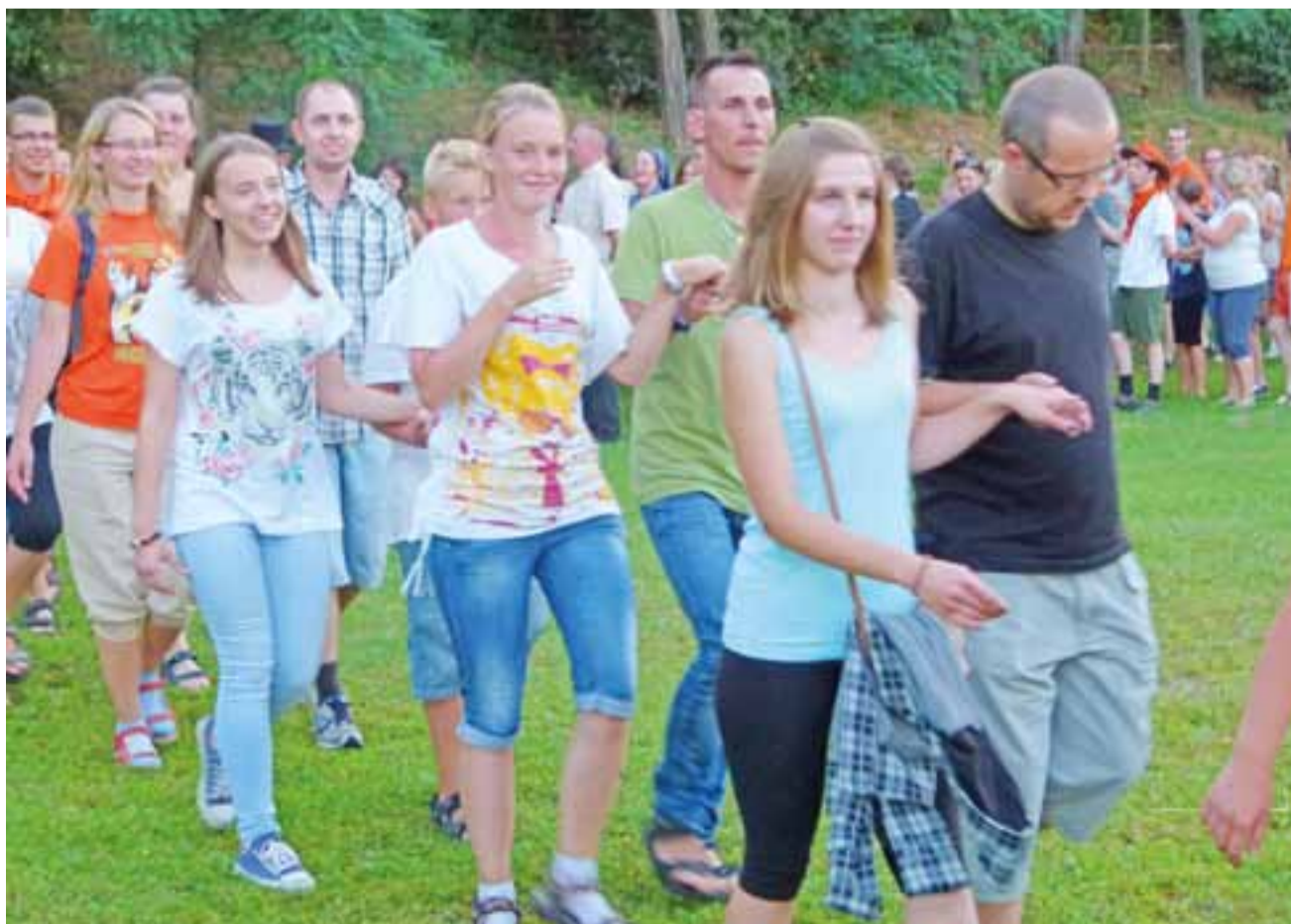
Jest zabawa, jest impreza – wszyscy tańczą poloneza... Osiemnastkową zabawę rozpoczęto tradycyjnym polskim tańcem. Po pielgrzymach nie było widać zmęczenia.

W błędzie jest ten, kto myśli, że piesza pielgrzymka to trud całodniowej wędrówki, po której zmęczenie jest tak wielkie, że na postoju po prostu pada się z nóg. Uczestnicy Łowickiej Pieszej Pielgrzymki Młodzieżowej na Jasną Górę udowodnili, że chcieć to móc i we wtorek, po przejściu z Łowicza do Makowa pod Skierniewicami, długo bawili się na pielgrzymkowej „osiemnastce” – bowiem w tym roku pielgrzymka ta ruszyła po raz 18.