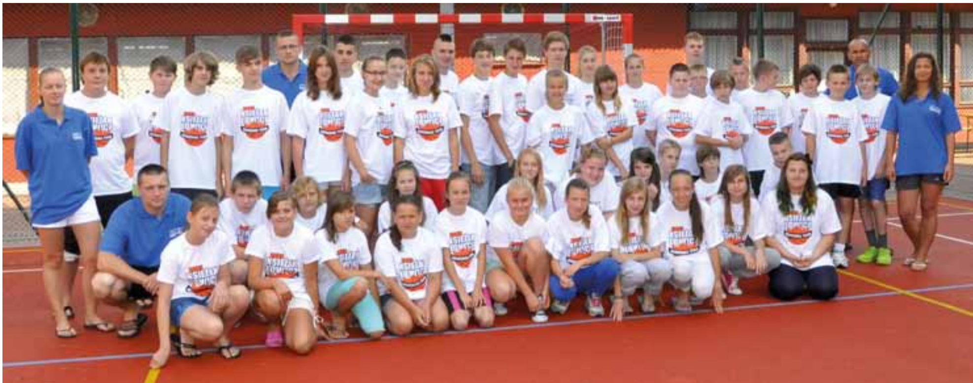
Księżacy budują formę na nowy sezon nad morzem.

Koszykówka | Przygotowania UMKS Książak do sezonu 2013/2014