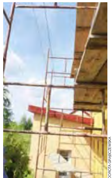
Przewody były przyczyną porażenia człowieka prądem.

równowagi, utratą przytomności, migotaniem komór sercowych – bardzo groźnym dla życia człowieka, gdyż zazwyczaj prowadzi ono do zejścia śmiertelnego, oparzeniami skóry i wewnętrznych części ciała, do zwęglenia włócznie. dag