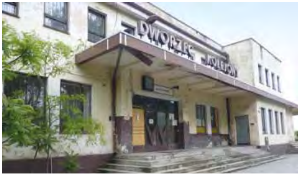
Remontu dworca PKP w Żychlinie nie będzie. Teraz właściciele chcą wyprowadzić lokatorów z budynku.

– Dostaliśmy propozycję innych mieszkań kolejowych w Kutnie, ale nikt z nas się nie godzi na taką zamianę – mówi 67-letni lokator dworca w Żychlinie. – Oglądaliśmy mieszkania, są w fatalnym stanie. Wprawdzie kolej deklaruje, że zwróci połowę kosztów remontu, ale my się nie godzimy. Poza tym nie ma tam centralnego ogrzewania, które tutaj lokatorzy sobie sami pozakładali. W Żychlinie znam wiele osób, które w razie potrzeby mi pomogą, a jestem schorowa-