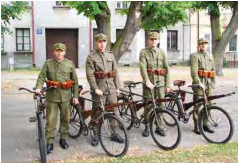
Członkowie Stowarzyszenia Historycznego im. 10 PP pozujący do zdjęcia na rynku w Bolimowie.

Idea wyjazdu było dotarcie do Bolimowa w celu wykonania fotografii, które będą odzwierciedlać identyczne sylwetki żołnierzy uwiecznionych na rowerach na dwóch przedwojennych fotografiach wykonanych w Bolimowie, które kilka lat temu pojawiły się w internecie: przy kościele Św. Trójcy oraz przy kamienicy