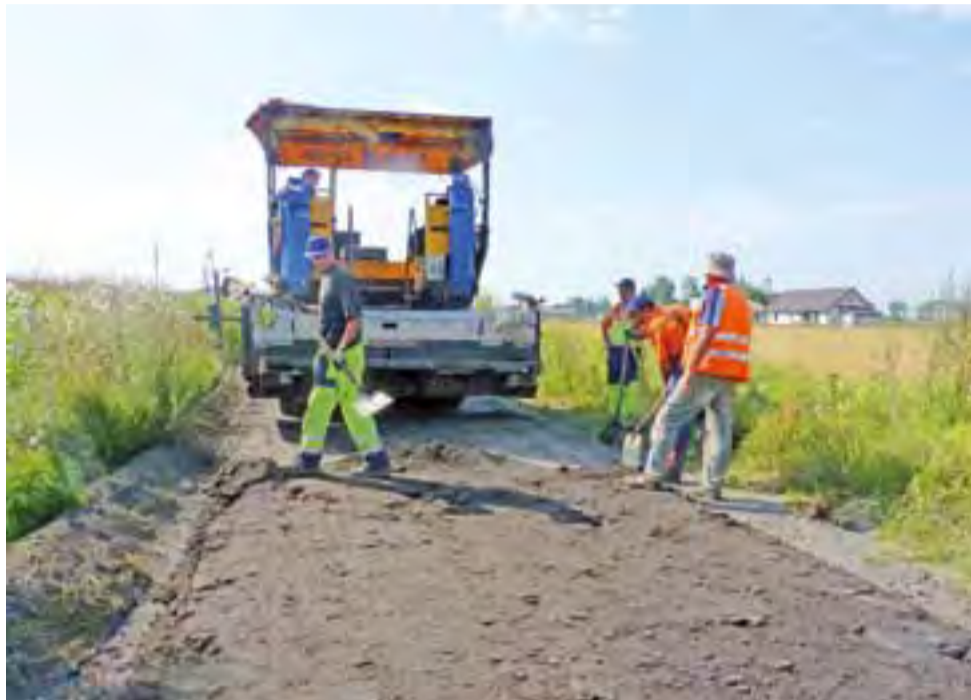
Przedsiębiorstwo Robót Drogowych w Kutnie rozpoczęło budowę trzech odcinków dróg w gminie Oporów. Na zdjęciu prace na odcinku oddalonym od drogi powiatowej Kutno-Oporów.

– Dodatkowo na drogi wewnętrzne kładziemy warstwę podbudowy z tzw. rumoszu asfaltowego (destruktu – sfrezo-