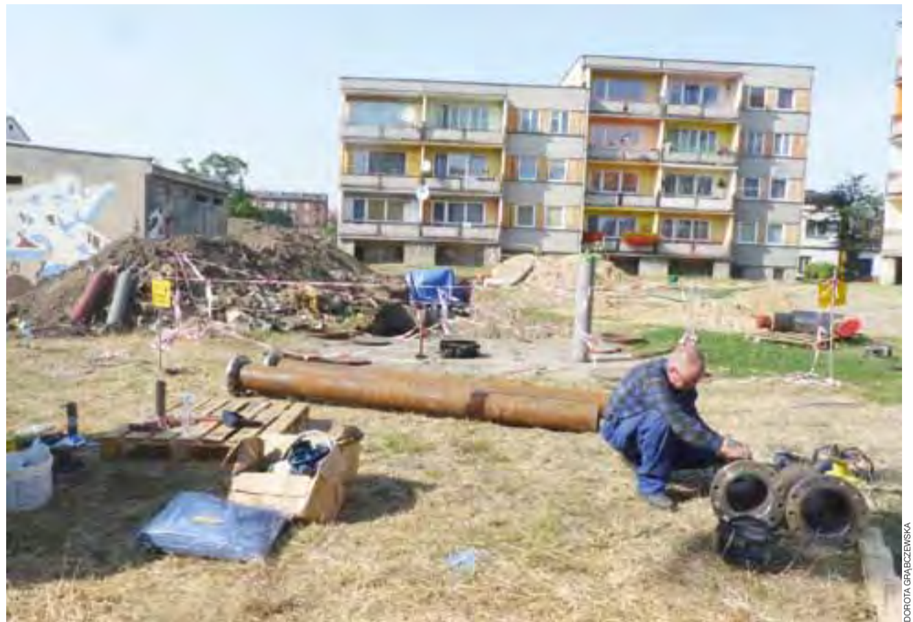
Trwają prace przy wymianie rur ciepłowniczych. Są głębokie wykopy. Teren jest ogrodzony taśmami, oznakowany tabliczkami, ale czy to wystarczy?

3 sierpnia o 20.20 strażacy z OSP Żychlin usuwali gniazdo os na budynku gospodarczym przy ulicy Łukaszyńskiego. Akcja trwała godzinę. W niedzielę po południu gasili płonący śmietnik przy ulicy Cmentarnej. Akcja trwała od godz. 16 do 17.20. dag