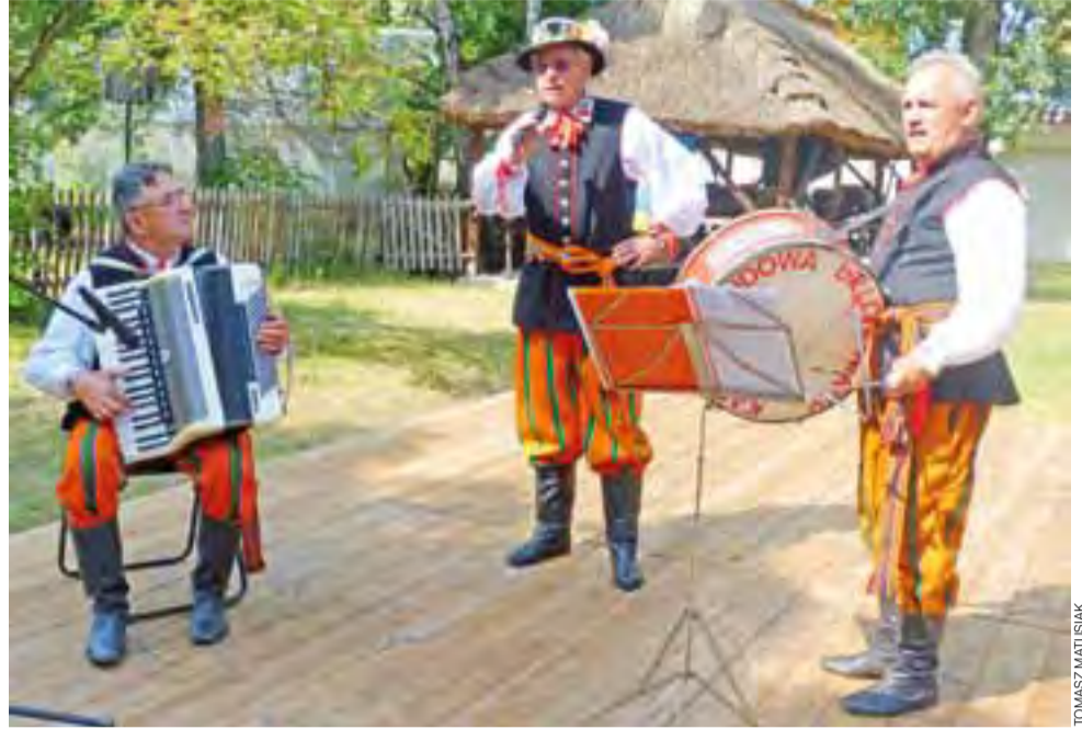
Występ kapeli ludowej „Belchowiacy” podczas prezentacji walorów gminy Nieborów w mini skansenie przy muzeum w Łowiczu.