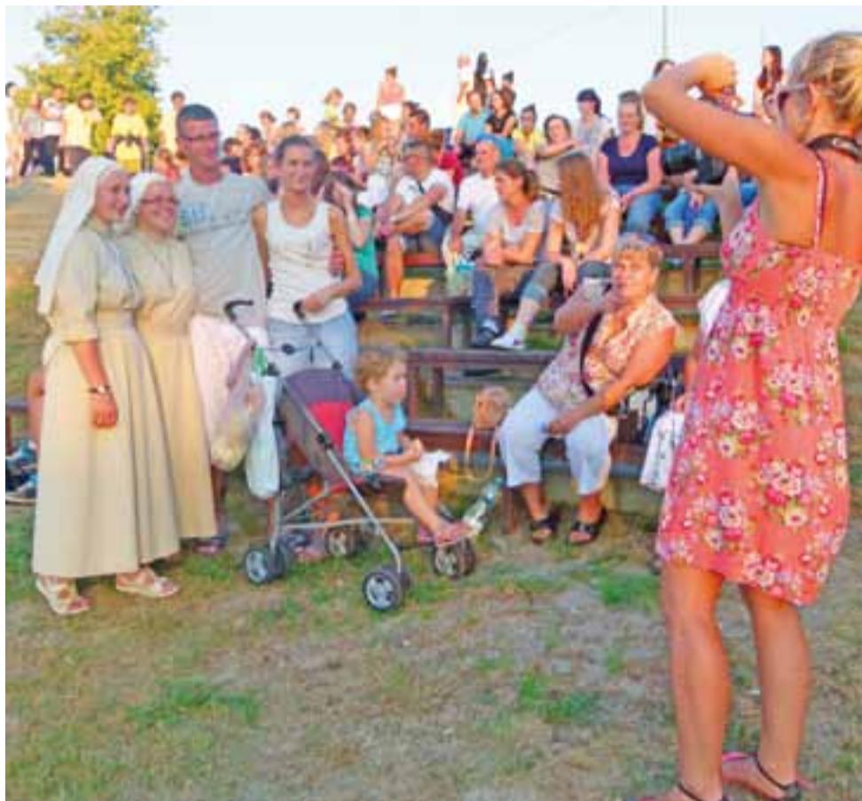
Pamiątkowa fotka. Doświadczone w pielgrzymowaniu misjonarki z Łowicza pozują do zdjęcia ze znajomymi. Wspólne wędrowanie to czas nawiązywania wielu nowych znajomości i przyjaźni. Już na wstępie wiadomo, że tych ludzi łączą wspólne wartości, a na szlaku czasu na rozmowy nie brakuje.