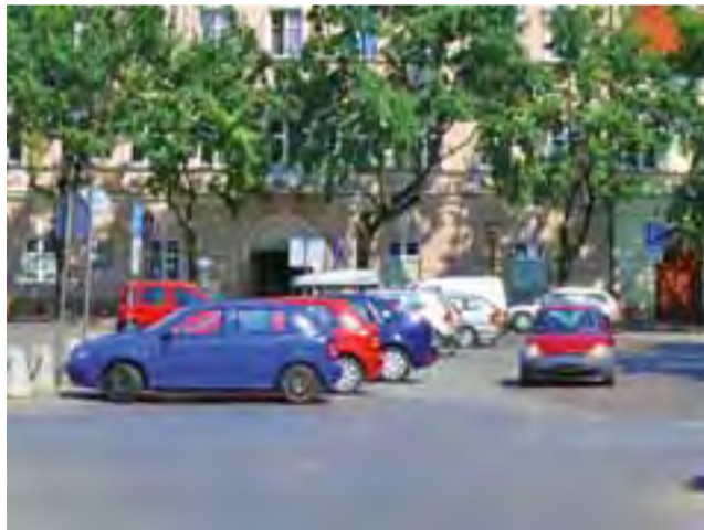
Na Starym Rynku w ciągu kilku godzin po wyjściu pielgrzymki samochody ciągle blokowały jeden z pasów ruchu przed muzeum.

nia”. Ograniczają one ruch do 20 km/h i oznaczają, że piesi mają pierwszeństwo przed pojazdami. mwk