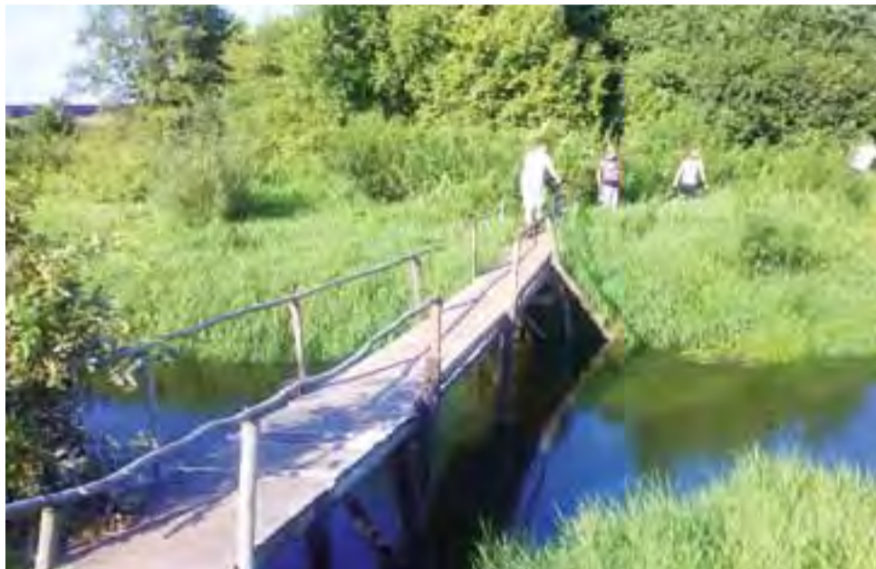
W niedzielne popołudnie przez kładkę w ciągu zaledwie 10 minut przeszło około 10 osób. To pokazuje, jak wiele osób z niej korzysta każdego dnia.

Powiatowy nadzór do rozebrania kładki zobowiązał Wojewódzki Zarząd Melioracji i Urządzeń Wodnych, ponieważ on jest właścicielem rzeki, na której kładka się znajduje. Pismo w tej