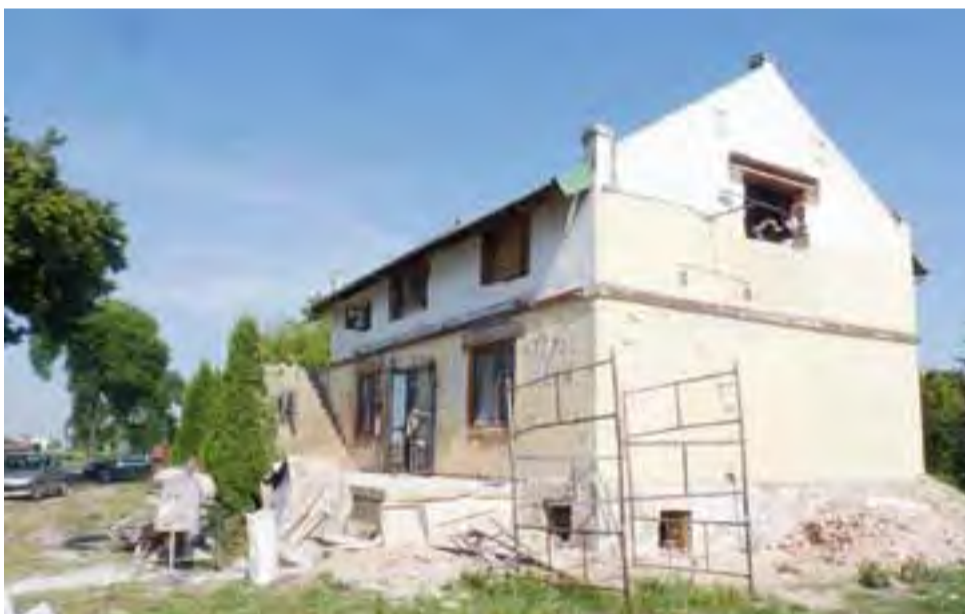
Trwa remont budynku młyna, w którym ma powstać centrum kempingowe.