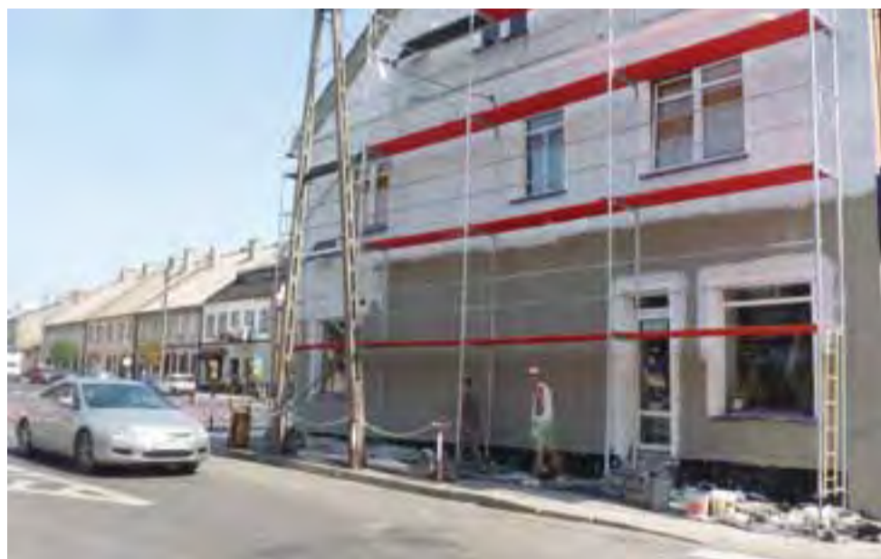
Pracownicy firmy Elvis robią remont elewacji budynku, który w części należy do ich szefa, a w części do Samorządowego Zakładu Budżetowego

W ubiegłym roku poprawiono elewację kilku połączonych budynków komunalnych przy 29 Listopada, od strony fontanny. Na poprawę estetyki w centrum miasta czekają następne komunalne kamienice. dag