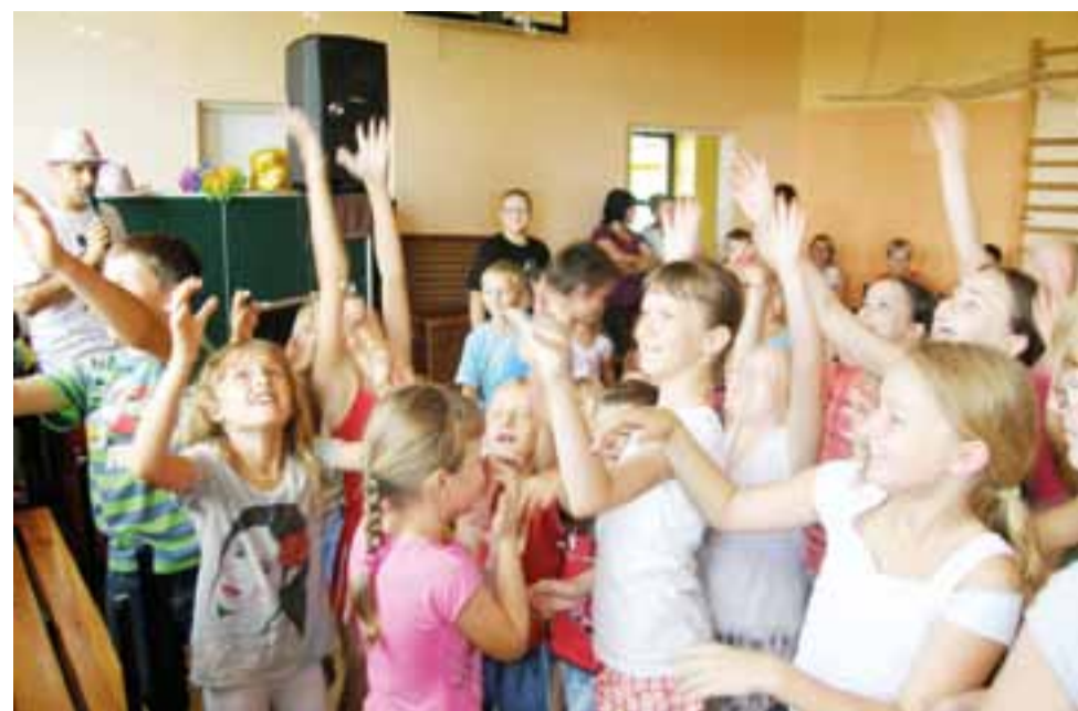
W zajęciach w szkole podstawowej w Bąkowie uczestniczyło kilkadziesiąt dzieci. Spotkanie było dla nich nie lada atrakcją.

Centrum Usług Medycznych. Z informacji przekazanych nam przez firmę wynika, że w Łowiczu do tej pory zgłosiło się 51% pań, którym przysługuje bezpłatne badanie mammograficzne. – Nadal około 2.400 pań nie wykonało przysługującego im w ramach NFZ badania – powiedziała. Na te chwile firma nie ma zaplanowanego kolejnego pobytu mammobusu w Łowiczu, ale nie wyklucza, że taka wizyta będzie i to jeszcze niejedna. mak