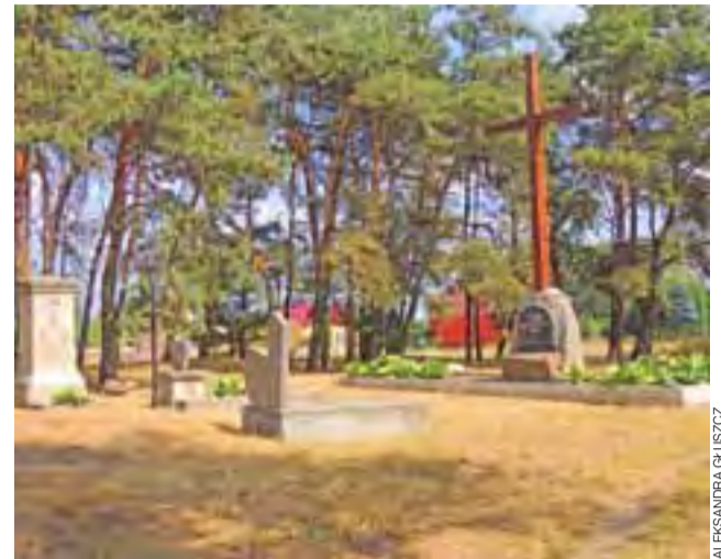
Jedna mogiła zbiorowa, 4 nagrobki betonowe oraz kopce usypane z ziemi – cmentarz choleryczny z 1852 przy ulicy Polnej w Żychlinie.

– Z każdym dniem zainteresowanie wypożyczeniem rowerów jest coraz większe – przyznaje Elżbieta Grabska, zatrudniona przez gminę w ramach robot publicznych. – Turyści z zamku chętnie przychodzą nad staw. Któregoś dnia zdjęcia nad stawem, na moło i w rowerach wodnych robiła sobie para nowożeńców. Inni turyści z Warszawy najpierw zwiedzali zamek, później długo grillowali koło domku. str. 5