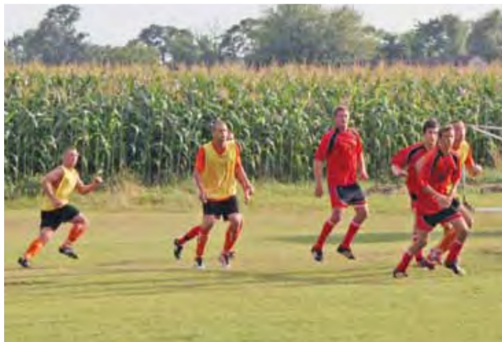
Drużyna GKS Bedno (czerwone stroje) w meczu sparingowym z zespołem Unia Czerwno.

“Słaba gra w obronie i na środku boiska drużyny Smoke Story Group przyniosła kolejne stracone bramki.”