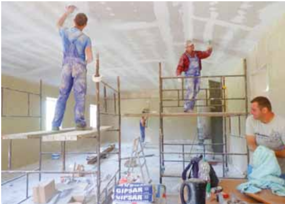
W poniedziałek pracownicy Bud-Rem z Gołębiewa docierali sufit. Zapewniali, że do śródownego popołudnia, przed świętem 15 sierpnia, prace zostaną zakończone.

Wymieniono dach, zrobiono nowe orynnowanie budynku oraz ułożono nową instalację odgromową. Wymieniono okna i drzwi. Teraz trwają ostatnie prace wewnątrz świetlicy. Nad całą salą zrobiono podwieszany sufit, który został docieplony wełną mineralną. Stare tynki zostały skute i maszynowo ułożono tynk gipsowy. W poniedziałek pracownicy kończyli docieranie gładzi gipsowej, zostało malowanie pomieszczenia i wyłożenie płytkami fragmentu ściany, gdzie stoi piec – wielka „koza”. Pracownicy robili podwieszany