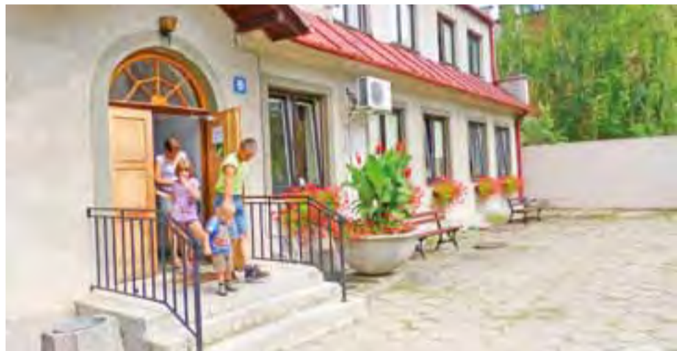
Dla kilkuletnich dzieci pokonanie 3 schodów nie jest żadnym problemem. Gdyby były mniejsze, rodzice na pewno woleliby podjazd.

Druga droga, na którą ogłaszano przetarg, to droga dojazdowa do gruntów rolnych w Wólce Łasieckiej. Inwestycja ta objęta jest dofinansowaniem wojewody łódzkiego w ramach Funduszu Ochrony Gruntów Rolnych (80 tys. zł). Droga ma długość 490 m i przebiega głównie po terenach niezabudowanych. Jest ona wysypana tłuczniem kamiennym. am