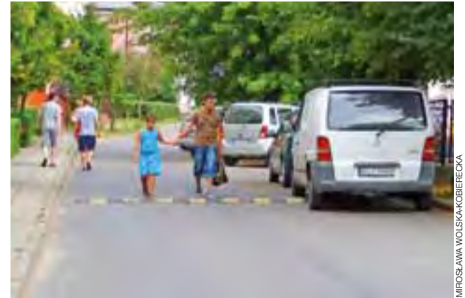
Próg zwalniający na wysokości bloku nr 11 został już zamontowany. Oby spełnił oczekiwania mieszkańców osiedla.

Ponadto obecnie rozpoczęto już demontaż znaków ograni-