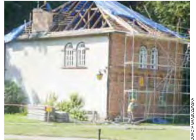
Trwa remont dachu. Kominy są rozbierane, zdjęta zostanie też stara więźba dachowa i wymieniona na nową.

Przewidziano też darmową grochówkę dla 800 osób. Będzie też tradycyjna ludowa zabawa. Na razie jeszcze nie ustalono zespołu, który będzie przygrywać do tańca. dag