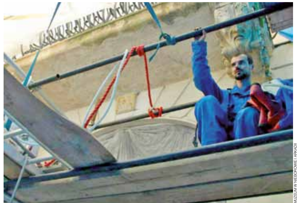
Widok od dołu na miejsce prowadzonych prac , na balkonie zauważalne są zacieki, które spowodowała woda deszczowa.

W ramach prac zamontowano na balkonie specjalne listwy, które mają ukierunkować spły-