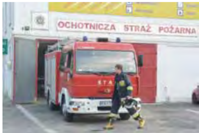
5 sierpnia po południu strażacy po raz kolejny szykowali się do wyjazdu do Pawłowic.

Pięć minut po północy, z poniedziałku na wtorek, w Bedlnie funkcjonariusze udaremnili dalszą jazdę 36-letniemu mężczyźnie, mieszkańcowi powiatu kutnowskiego, który w stanie nietrzeźwości kierował samochodem marki Opel Astra. Miał on 1,64 promila. Półtorej godziny później, o godz. 1.30, również w Bedlnie zatrzymano 61-letniego rowerzystę. Miał 1,28 promila. dag