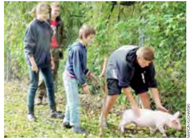
Niektórzy spośród harcerzy pierwszy raz dotykali żywego prosiaka.

Kocierzew | II Harcerski Turniej na Wesoło „Drużynada”