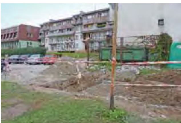
Przyczyną utrudnień na osiedlu Traugutta była awaria ciepłociągu pod przejazdem na osiedlowy parking.