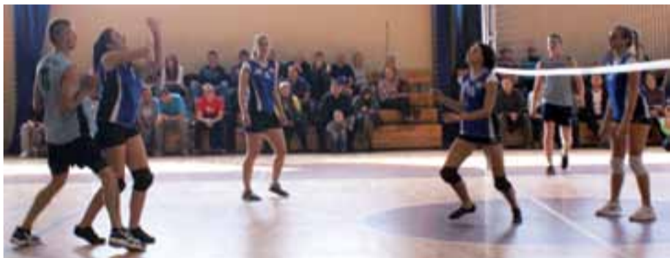
Mecz piłki siatkowej pomiędzy Volley Team Żychlin a reprezentacją siatkarek z Zespołu Szkół w Żychlinie.