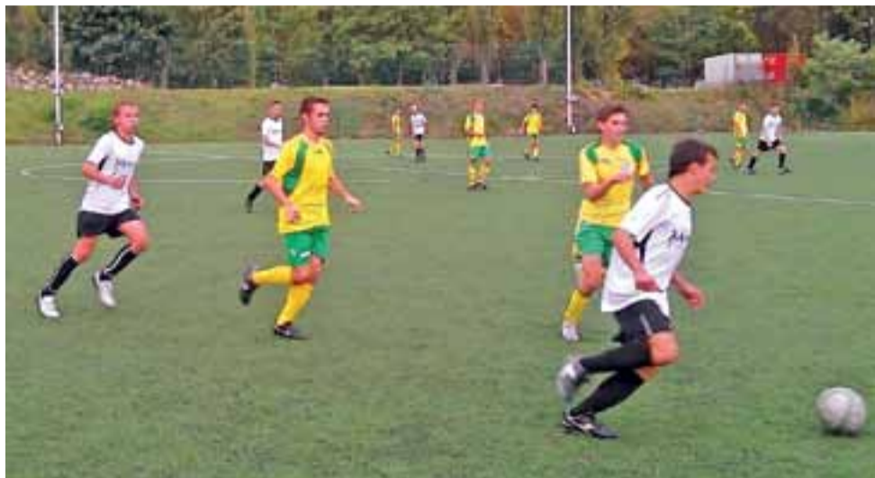
W meczu w Łodzi drużyna z Bielaw nie zdołała zdobyć bramki.

Kadetki Księzaka przygotowują się do rywalizacji w lidze. str. 37