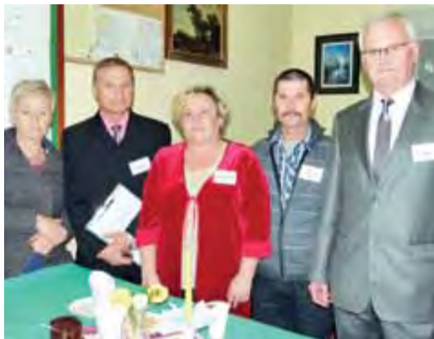
Członkowie Łowickiego Stowarzyszenia Abstynenckiego Pasiaczek spotykają się codziennie w godzinach popołudniowych w siedzibie przy muszli koncertowej na Błoniach.

– Zanim rozpoczęto tańce przy muzyce granej przez zespół Fenix, przedstawiona została hi-