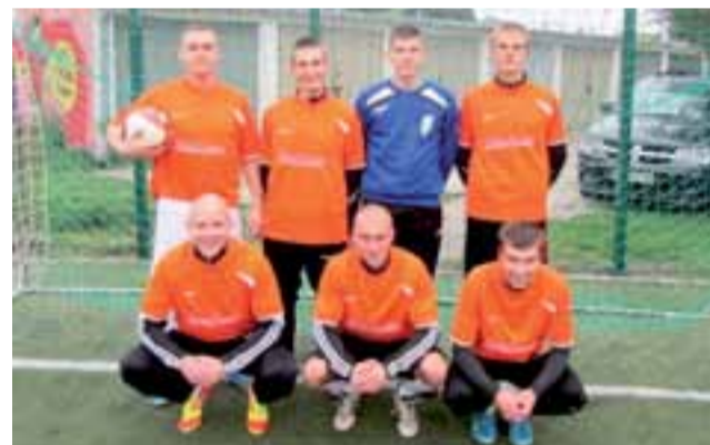
Lider rozgrywek Eko-Plast Renix Łowicz.

■ BTW Pizzeria Filip Łowicz – EKO-PLAST Renix Łowicz 1:8 (4:1); br: Maciej Grzegory (5) – Przemysław Pomianowski (9, 21 i 26), Radosław Kuciński (14 i 25), Tomasz Gajda (11), Jakub Czerbniak (15) i Patryk Krzeszewski (16). Żółta kartka: Przemysław Pomianowski (EKO-PLAST Renix Łowicz).