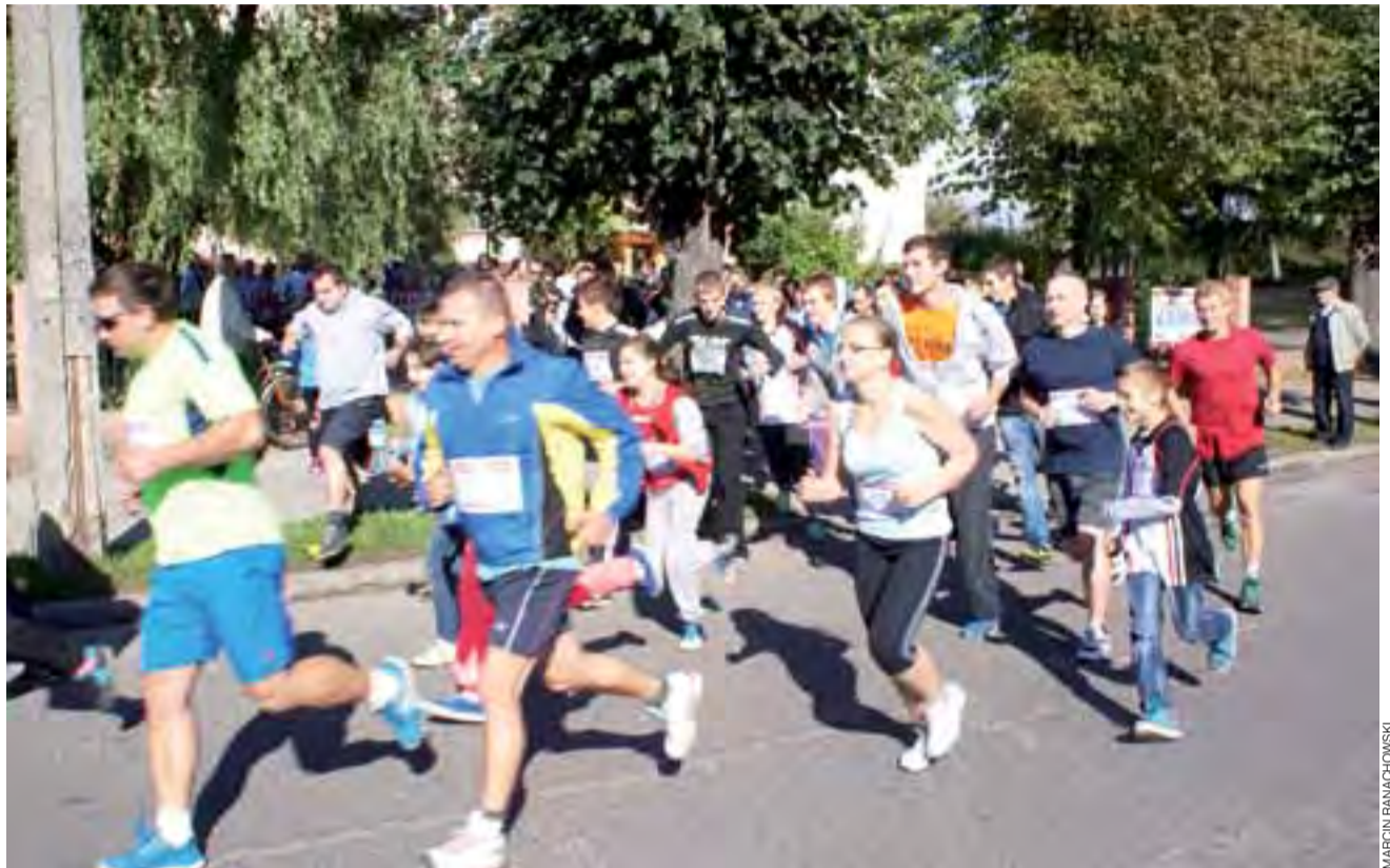
Aż 152 osoby wzięły udział w drugiej edycji Biegu Rodzinnego.

Podobnie jak w roku ubiegłym reprezentacja cukrowni rozgromiła swojego przeciwnika. Mimo iż wóldarze Żychlina zapowiadali wielki rewanż – nie udało im się. str. 39