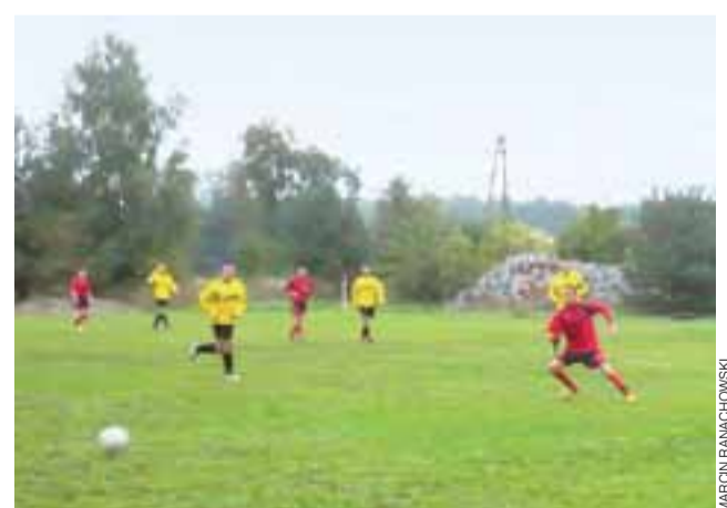
Drużyna GKS Bedno w meczu wyjazdowym z drużyną Magnat Sierpów.

Nowy Łowiczanie Tygodnik Ziemi Łowickiej członek Stowarzyszenia Gazet Lokalnych