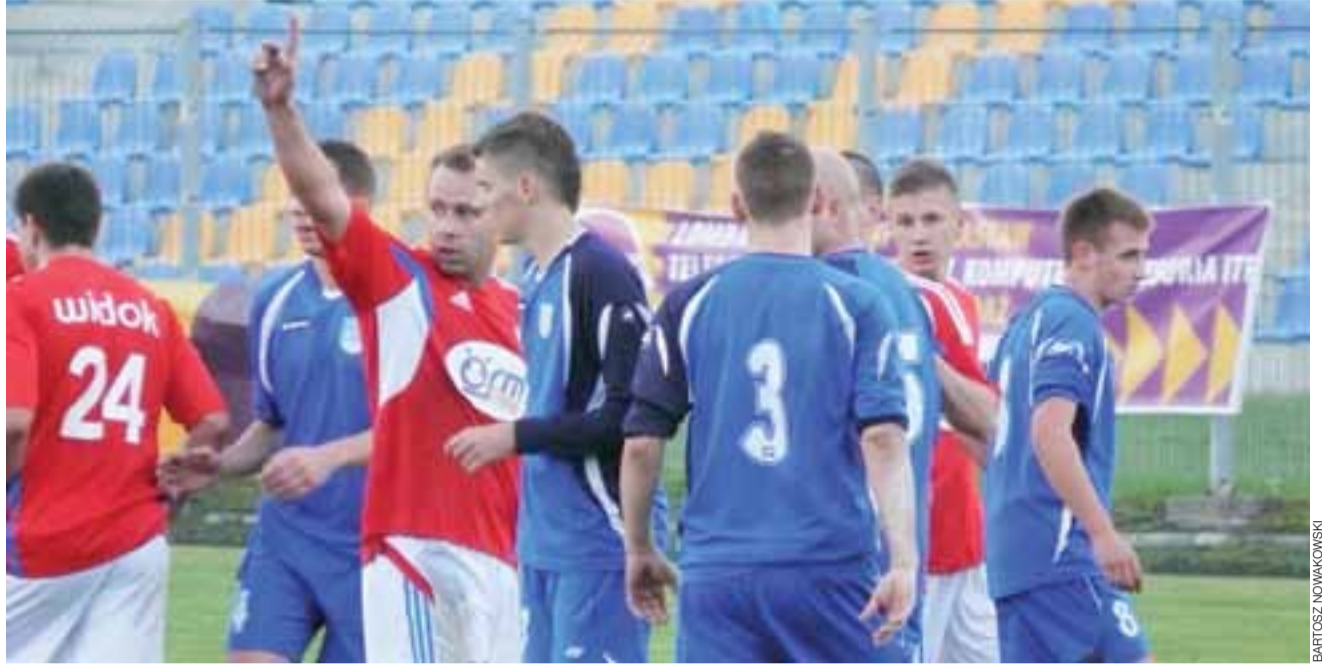
W meczu Widoku z Orłem emocji nie zabrakło.

W 8. kolejce A klasy 5-6 października zagrają: Muscador – Miedniewiczanka, Sobpol – Sierakowianka, Sorento – Pogoń, Manhatan – Macovia, Zjednoczenie – GLKS, Sokół – Dar i Wulkan – Zryw. divad