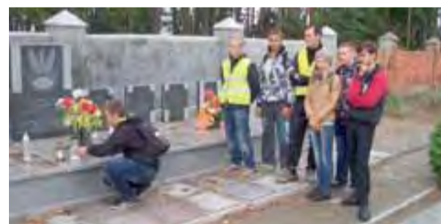
Przy mogile w Kaszewach Kościelnych

Mogiła żołnierzy września 1939 roku w Kaszewach Kościelnych znajduje się na cmentarzu parafialnym. Uczestnicy rajdu oddali hołd poległym żołnierzom, a ich pamięć uczcili minutą ciszy. Zapalili znicze. dag