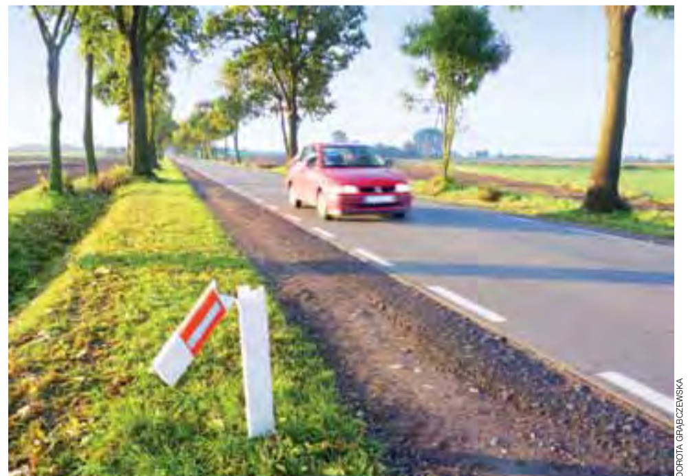
Zdaniem kierownika Zarządu Dróg Wojewódzkich w Łowiczu, wandalowie szczególnie upodobali sobie drogę wojewódzką 573 z Żychlina do granicy z woj. mazowieckim.

a postępowania są umarzone. Służby Zarządu Dróg Wojewódzkich dwa razy w tygodniu robią objazd tych dróg i na bieżąco uzupełniają znaki – bo te też są nagminnie niszczone. Grażyna Kaczor deklaruje, że odblaskowe słupki przed zimą też zostaną uzupełnione, a pod koniec jesieni jej ludzie będą też poprawiać pobocza. Wszak kampania cukrownicza się zaczyna, a po każdej pobocza są rozjeżdżone. dag