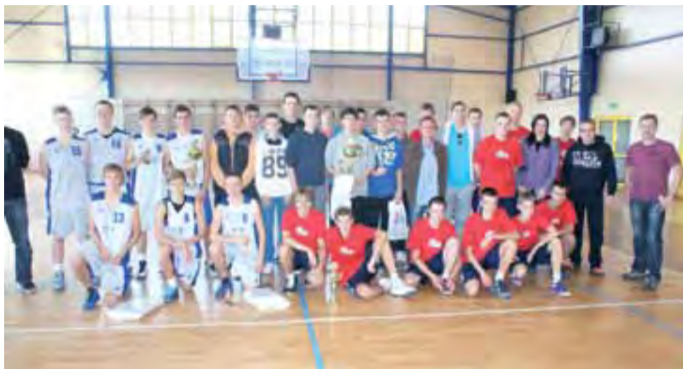
Uczestnicy turnieju piłki koszykowej o Puchar Burmistrza Gminy Żychlin.