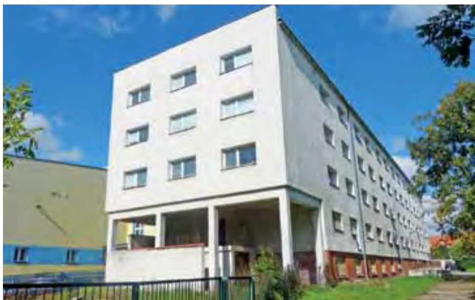
Tutaj budynek MOS może być: Łowicz, przy ul. Kaliskiej...