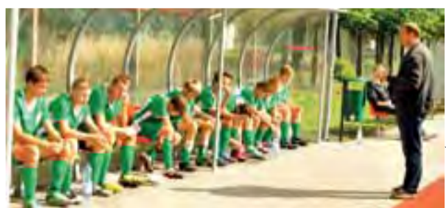
Ekipa Pelikana z rocznika 1999 odniosła w Lidze Wojewódzkiej swoje pierwsze zwycięstwo.

Piłka nożna | 5. kolejka Wojewódzkiej Ligi Kuchara