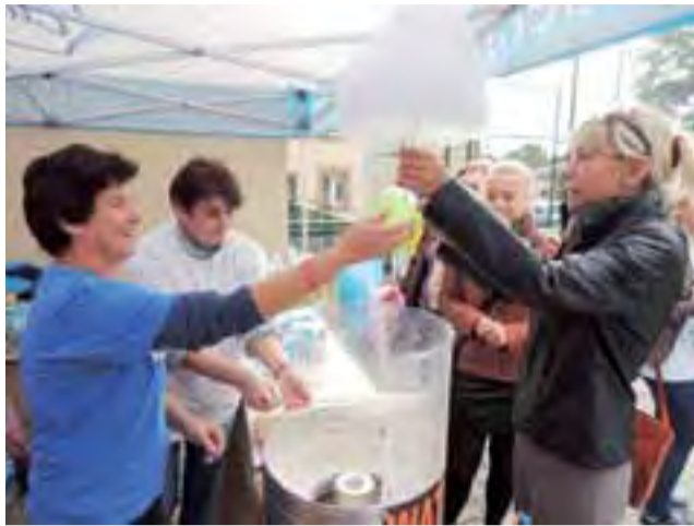
Cukier krzepi – nie tylko najmłodszy lubią wata cukrową