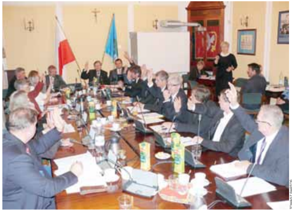
Radni miejscy w czasie głosowania nad uchwałą dotyczącą opuszczenia Związku Międzygminnego Bzura byli jednomyślni.

Dlaczego jednak przeważały argumenty za opuszczeniem Związku – i jakie one były? Burmistrz ocenił, że delegaci miasta na Walnych Zgromadzeniach członków Związku nie mieli wpływu na kierunek jego działania. Łowicz miał tylko 3 głosy na 27. str. 13