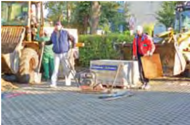
Trwa modernizacja parkingu koło Zespołu Szkolno-Przedszkolnego. Parking jest utwardzany ażurowymi betonowymi płytami. Prace wykonują pracownicy Mig-My

– Parking będzie mieć powierzchnię ok. 260 mkw. – informuje wiceburmistrz Zbigniew Gałązka. – Koszt przedsięwzięcia to ok. 30 tys. złotych. Prace wykonuje spółka Mig-Ma, a nie pracownicy robót publicznych, gdyż chodzi o fachowe jego wy-