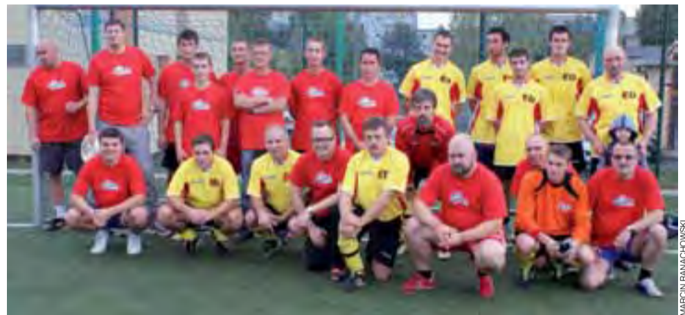
Reprezentacje: Urzędu Gminy Żychlin oraz Cukrowni Dobrzelin - grające w meczu „Wielki rewanż”.