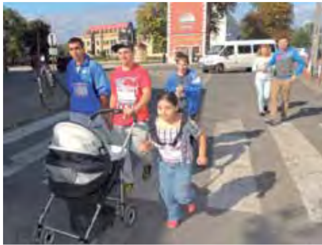
W trakcie biegu nieliczni mogli smacznie drzeć w wózkach.