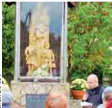
Mieszkańcy Korabki modlili się przy kapliczce.

go. Spotkania z ludźmi w podobnym wieku i podobnej sytuacji życiowej rodzi poczucie wspólnoty i otwiera nowe perspektywy spędzania wolnego czasu, rozwijania swych zainteresowań, poszukiwania nowych dróg rozwoju. A jak już mawiali starożytni: Non progređi est regredi – kto się nie rozwija, ten się cofa. mst