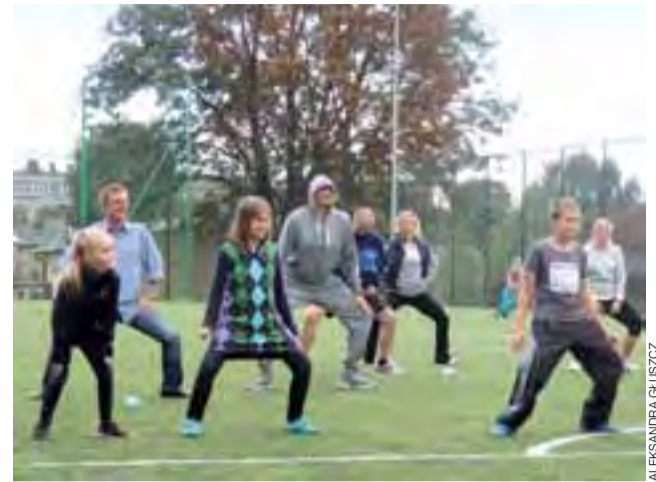
Aerobik z przedstawicielami Sejmu i mistrzem olimpijskim.

Żychlin | Sportowa niedziela pod patronatem Nowego Łowiczana