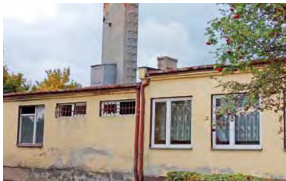
- a tutaj jest obecnie: Kiernozi.

Powiat łowicki | Młodzieżowy Ośrodek Socjoterapii: gdzie docelowo będzie?