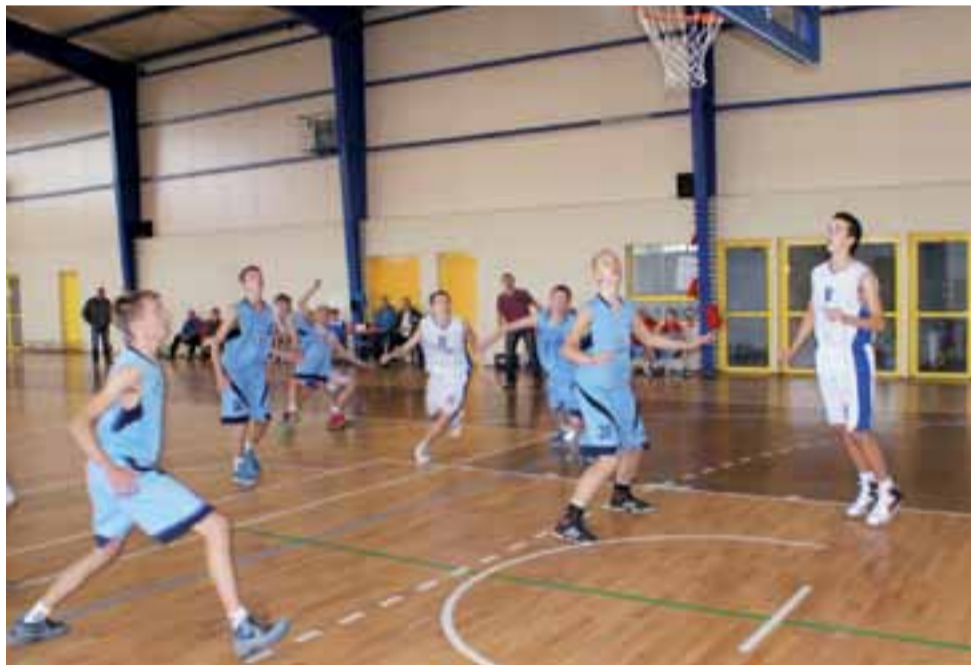
Mecz pomiędzy UKS M-G SZS Żychlin a AZS PWZS Skierniewice. Rzut za trzy punkty w ostatniej sekundzie meczu, dający zwycięstwo gościom.