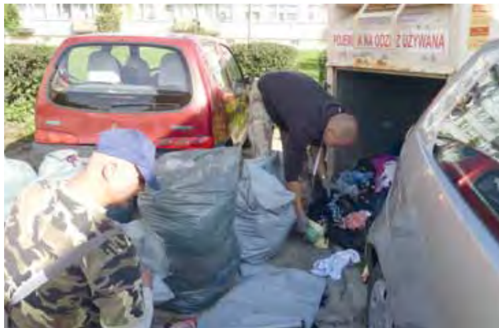
Odzież z pojemników zabiera firma Wtórpol ze Skarżyska Kamiennej, która wreszcie odbiera telefony podane na pojemnikach. Przyczyną milczenia telefonów były problemy ze zmianą numerów telefonów i zamieszczeniem prawidłowej informacji.

Czy firmy w krótszym czasie zechcą zrobić stadion za niższe kwoty od podanych w pierwszym przetargu? Jeśli nie – miasto stanie przed trudną decyzją, co dalej. dag