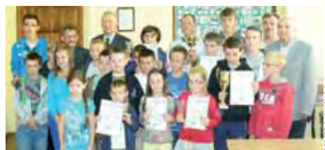
Wszyscy szachiści po turnieju pozowali do zdjęcia z organizatorami.