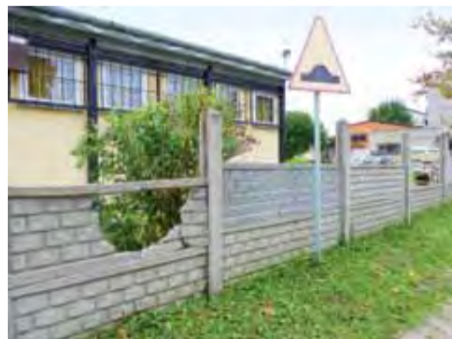
Wandale dwa razy wyżywali się na betonowych przesłach ogrodzenia świetlicy Spółdzielni Mieszkaniowej.

W niedzielę 29 września, o godz. 13.50, w Oporowie zatrzymano 56-letniego kierowcę samochodu Seat Cordoba, który miał 1,8 promila alkoholu. dag