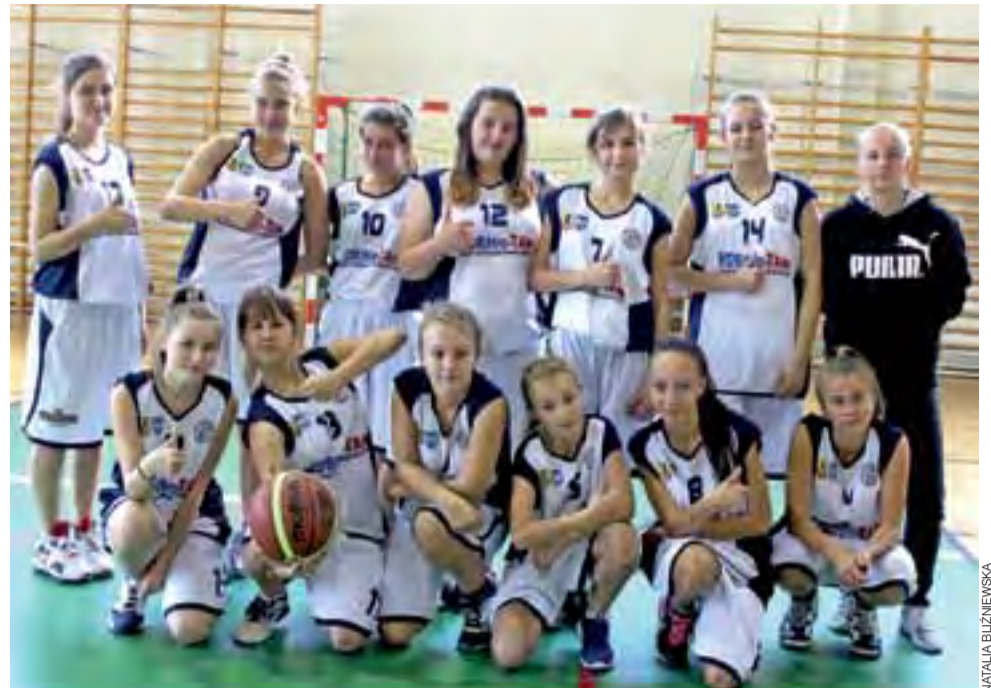
Kadetki UMKS Książek Łowicz przygotowują się do nadchodzącego sezonu.

W 8. kolejce zagrają: Chąšno – Korona, Pogoń – Pelikan II, Rawka – Orleń, Jeżów – Juvenia, Jutrzenka – Laktoza, Vagat – Czarni i Olympic – Astra. divad