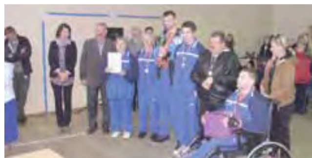
Reprezentacja Warsztatu Terapii Zajęciowej PSOUU w Żychlinie z Pucharem Prezydenta Miasta Kutna za zajęcie I Miejsca w Wojewódzkiej Spartakiadzie Osób z Niepełnosprawnością Intelektualną w Kutnie.

Zawodnicy zmagali się w takich konkurencjach jak: tor przeszkód, rzut woreczkami do celu, skoki przez skakankę, bieg na 50 metrów, wyścig na wózkach bez pomocy terapeuty na dystansie 50 metrów, rzut woreczkami do celu z wózka. Organizatorem zawodów było Polskie Stowarzyszenie na Rzecz Osób z Upośledzeniem Umysłowym Koło Nr 1 w Kutnie. Patronat nad zawodami objęli: Starosta Kutnowski oraz Prezydent Miasta Kutna.