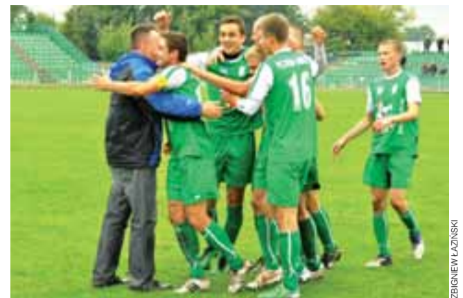
Dzięki ostatnim dobrym występom Pelikan przesunął się w środkową strefę tabeli. Trener Wesołowski i piłkarze mogą na razie spać spokojnie.